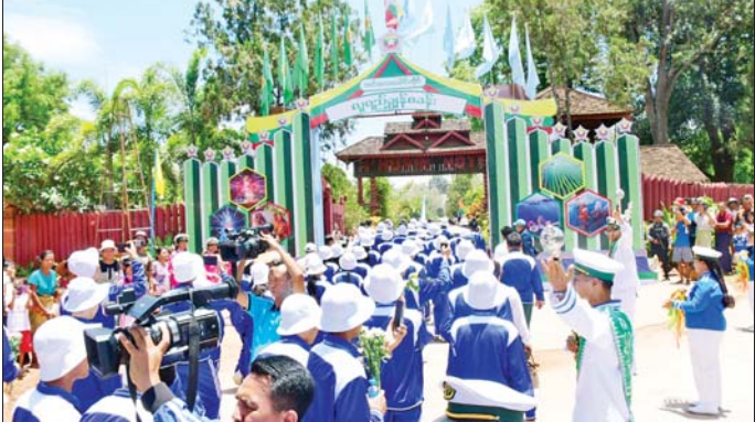
အင်းလေးခေါင်တိုင်လူရည်ချွန်စခန်းသို့ ရောက်ရှိလာသည့် လူရည်ချွန်မောင်မယ်များအား တာဝန်ရှိသူများ၊ ကျောင်းသား ကျောင်းသူများနှင့် ဒေသခံတိုင်းရင်းသားများက ကြိုဆိုနှုတ်ဆက်စဉ်။