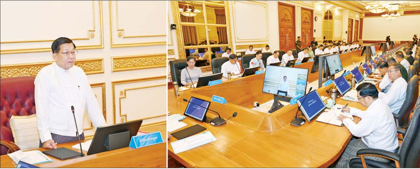
ပြည်ထောင်စုသမ္မတမြန်မာနိုင်ငံတော် နိုင်ငံတော်သမ္မတ ဦးမင်းအောင်လှိုင် ပြည်ထောင်စုအစိုးရအဖွဲ့အစည်းအဝေးတွင် အမှာစကားပြောကြားစဉ်။

ကောင်းမှုကို ပြုလုပ်ဆည်းပူး အနည်းငယ်သောကောင်းမှုသည် ငါ့အား အကျိုး ရောက်လိမ့်မည်မဟုတ်ဟု မထီမဲ့မြင် မအောက်မေ့ရာ။ မိုးရေပေါက်သည် ကျဖန်များလတ်သော် ရေအိုးသည် ပြည့်ဘိသကဲ့သို့ ပညာရှိသည် အနည်းငယ်၊ အနည်းငယ်မျှသော ကောင်းမှုကို ပြုလုပ်ဆည်းပူးဖန်များ လတ်သော် ကောင်းမှုဖြင့် ပြည့်၏။ ပါပဝဂ်(ဓမ္မပဒ-၁၂၂)