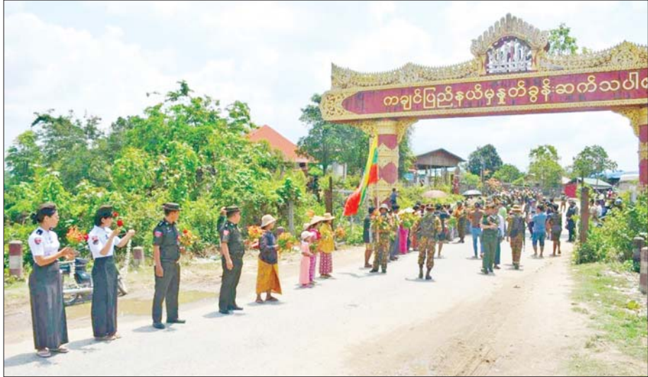
အောင်ပွဲရတပ်မတော်သားများအား ဒေသခံပြည်သူများက သောင်းသောင်းဖြူကြိုဆိုကြစဉ်။

နေပြည်တော် မေ ၆ တပ်မတော်အနေဖြင့် နိုင်ငံတော်ဖွံ့ဖြိုးတိုးတက်ရေးအတွက် အခြေခံအုတ်မြစ်ဖြစ်သည့် နိုင်ငံတော်တည်ငြိမ်အေးချမ်းစေရန် နိုင်ငံတော် ကာကွယ်ရေးနှင့် လုံခြုံရေးတာဝန်များကို ထမ်းဆောင်လျက်ရှိပြီး အကြမ်းဖက်သောင်းကျန်းသူများ ယာယီစိုးမိုး၍ အကြမ်းဖက်လုပ်ရပ်များ လုပ်ဆောင်လျက်ရှိသည့်ဒေသများ၌လည်း အကြမ်းဖက်ချေမှုန်းရေးစစ်ဆင်ရေး (Counter-Terrorism Operation) ဖြင့် မြို့၊ ရွာများအား အဆင့်ဆင့်ပြန်လည်သိမ်းပိုက်၍ ပြည်သူအတွက် အရေးပါသည့် ဆက်သွယ်ရေးလမ်းကြောင်းများကို အပိုင်းလိုက် ပြန်လည်ဖွင့်လှစ်ပေးလျက်ရှိရာ ယနေ့တွင် မန္တလေး- မတ္တရာ- သပိတ်ကျင်း- တကောင်း- ထီးချိုင့်- ကသာ- အင်းတော်- မော်လူး- နန်စီးအောင်- မိုးညှင်း- မိုးကောင်း- မြစ်ကြီးနား ဆက်သွယ်ရေးလမ်းကြောင်းတစ်လျှောက်အား အပြည့်အဝ ထိန်းချုပ်၍ ပြန်လည်ဖွင့်လှစ်ပေးနိုင်ခဲ့သည့်အတွက် ဒေသခံတိုင်းရင်းသား ပြည်သူများ၏ လူမှုစီးပွားဘဝများ ပြန်လည်ဖွံ့ဖြိုးတိုးတက်လာတော့မည်ဖြစ်ကြောင်း သိရသည်။ အဆိုပါ မန္တလေးမှ မြစ်ကြီးနားသို့ ဆက်သွယ်ထားသည့် ဆက်သွယ်ရေးလမ်းကြောင်းသည် မြန်မာနိုင်ငံ၏ မြောက်ဘက်ဒေသဖွံ့ဖြိုးတိုးတက်ရေးအတွက် အခြေခံကျသော အခြေခံအဆောက်အအုံတစ်ခုဖြစ်ပြီး အဆိုပါလမ်းကြောင်းအား အသုံးပြု၍ ခရီးသွားပြည်သူများနှင့် ဒေသခံပြည်သူများ၏ သွားလာနေထိုင်မှု၊ ကုန်စည်စီးဆင်းမှုများကို လွယ်ကူမြန်ဆန်စေကာ စာမျက်နှာ ၁၅ ကော်လံ ၁ သို့ ၀