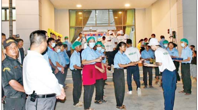
ငွေဆောင်လူရည်ချွန်စခန်းသို့ ရောက်ရှိလာသည့် လူရည်ချွန်မောင်မယ်များအား တာဝန်ရှိသူများက ကြိုဆိုနှုတ်ဆက်စဉ်။