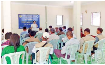
ကွင်းဆင်းဆောင်ရွက် မြို့နယ်မွေးမြူရေးနှင့် ကုသရေး ဦးစီးဌာနမှ လက်ထောက် ညွှန်ကြားရေးမှူး ဒေါက်တာနန်းနှင့် ဝန်ထမ်းများက ရက်(၁၀၀)စီမံချက်ဖြင့် အင်းယား ကျေးရွာအုပ်စု၊ ကုန်းသာကြီး

ပြင်ဦးလွင် မေ ၆ မန္တလေးတိုင်း ဒေသကြီး ပြင်ဦးလွင်မြို့နယ်တွင် မွေးမြူရေးနှင့် ကုသရေးဦးစီးဌာနက ရက်(၁၀၀)စီမံချက်ဖြင့် ကျွဲ၊ နွားများ လည်ချောင်းကွဲရောဂါကာကွယ်ဆေးထိုးခြင်းနှင့် အသိပညာပေးဟောပြောခြင်းကို မေ ၂၈ ရက်မှစ၍ ဆောင်ရွက်လျက်ရှိပြီး မွေးမြူရေး ပညာပေးသင်တန်းကို မေ ၆ ရက်မှ ၈ ရက်အထိ တောင်သူ ၂၀ အား မွေးမြူရေးနှင့် ကုသရေးဦးစီးဌာန အစည်းအဝေးခန်းမတွင် ဖွင့်လှစ်သင်ကြားပေး