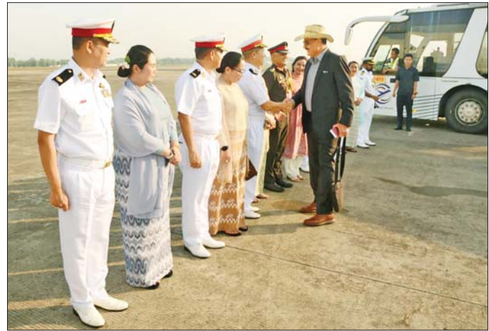
ထို့နောက် အဆိုပါရေတပ်လေ့ကျင့်ရေးဌာနချုပ်ရှိ Small Arm Simulator အား အိန္ဒိယရေတပ်ဦးစီးချုပ် က ဖွင့်လှစ်ပေးပြီး သပိင်ဝင်စစ်ရေယာဉ် (မေယု)သို့ သွားရောက် ကြည့်ရှုလေ့လာကြကာ အမှတ်တရ သစ်ပင်စိုက်ပျိုးသည်။ အိန္ဒိယရေတပ်ဦးစီးချုပ် ဦးဆောင်သည့်

နေပြည်တော် မေ ၆ ပြည်ထောင်စုသမ္မတ မြန်မာနိုင်ငံတော်၌ ချစ်ကြည်ရေးခရီးရောက်ရှိနေသည့် အိန္ဒိယရေတပ် ဦးစီးချုပ် Admiral Dinesh Kumar Tripathi, PVSM, AVSM, NM ဦးဆောင်သော ကိုယ်စားလှယ်အဖွဲ့သည် ယနေ့နံနက်ပိုင်းတွင် ရန်ကုန်မြို့မှ လေကြောင်းခရီးဖြင့် ပြန်လည်ထွက်ခွာရာ တပ်မတော်(ရေ)မှ အရာရှိကြီးများ၊ မြန်မာနိုင်ငံဆိုင်ရာ အိန္ဒိယရေတပ် စစ်သံမှူးနှင့် တာဝန်ရှိသူများက ရန်ကုန်အပြည်ပြည်ဆိုင်ရာ လေဆိပ်၌ ပို့ဆောင်နှုတ်ဆက်ကြသည်။ အဆိုပါ အိန္ဒိယရေတပ်ဦးစီးချုပ် ဦးဆောင်သည့် ချစ်ကြည်ရေးကိုယ်စားလှယ်အဖွဲ့သည် မြန်မာနိုင်ငံသို့ ရောက်ရှိစဉ်အတွင်း မေ ၂ ရက်တွင် သန်လျင်တပ်နယ်ရှိ နယ်မြေခံရေတပ်ကွပ်ကဲမှုဌာနချုပ်သို့ ရောက်ရှိရာ ဂုဏ်ပြုတံပွဲ၏ အလေးပြုခြင်းကိုခံယူပြီး နယ်မြေခံ ရေတပ်ကွပ်ကဲမှု ဌာနချုပ်မှူးနှင့် တွေ့ဆုံဆွေးနွေးခြင်း များဆောင်ရွက်သည်။ ဆက်လက်ပြီး ချစ်ကြည်ရေး ကိုယ်စားလှယ်အဖွဲ့သည် သန်လျင်တပ်နယ်ရှိ နယ်မြေခံ ရေတပ်လေ့ကျင့်ရေးဌာနချုပ်သို့ ရောက်ရှိကြရာ တာဝန်ရှိသူများက ကြိုဆိုနှုတ်ဆက်ကြသည်။