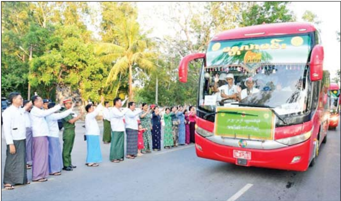
ဧရာဝတီတိုင်းဒေသကြီးဝန်ကြီးချုပ် ဦးအေးကျော်နှင့် တာဝန်ရှိသူများ ငွေဆောင်နှင့် ချောင်းသာ လူရည်ချွန်စခန်းများသို့ လာရောက်ကြသည့် လူရည်ချွန်မောင်မယ်များအား ကြိုဆိုနှုတ်ဆက်စဉ်။

နေပြည်တော် မေ ၆ နေပြည်တော် လူရည်ချွန် အပန်းဖြေစခန်းတွင် ရောက်ရှိနေသည့် ၂၀၂၅-၂၀၂၆ ပညာသင်နှစ် ဒါဒမတန်း လူရည်ချွန် ကျောင်းသား ကျောင်းသူ ၉၉ ဦးသည် အုပ်ချုပ်သူ ဆရာ ဆရာမများနှင့်အတူ ယနေ့နံနက်ပိုင်းတွင် နေပြည်တော် တပ်ကုန်းမြို့ရှိ မြန်မာ့အသံနှင့် ရုပ်မြင်သံကြားသို့ ရောက်ရှိပြီး ရုပ်မြင်သံကြားထုတ်လွှင့်မှုလုပ်ငန်းများ၊ အသံလွှင့်လုပ်ငန်းများနှင့် စိန်ရတုပြတိုက်တို့ကို ကြည့်ရှုလေ့လာကြသည်။