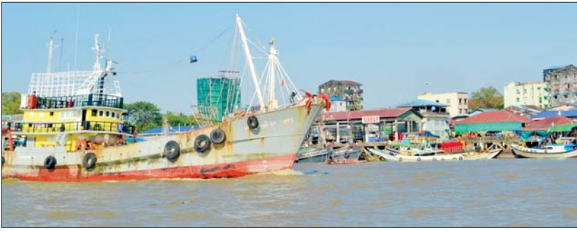
ပြည်တွင်းစားသုံးမှုနှင့် ပြည်ပပို့ကုန်အဖြစ် တင်ပို့နေသည့် ကြည့်မြင်တိုင် ဗဟိုစီပြင်ငါးဈေး၏ ရေချိုရေငန်ဝင်ရောက်ဖြန့်ချိမှုကို တွေ့ရစဉ်။

ရန်ကုန် မေ ၆ မြန်မာနိုင်ငံမှ ပြည်ပနိုင်ငံများသို့ ရေငန်ထွက်ကုန် ၇၀ ရာခိုင်နှုန်းနှင့် ရေချိုထွက်ကုန် ၃၀ ရာခိုင်နှုန်း တင်ပို့လျက်ရှိကြောင်း ၂၀၂၃-၂၀၂၄ ရေလုပ်ငန်းထုတ်ကုန်စာရင်းစာတမ်းများအရ သိရသည်။ ထိုသို့တင်ပို့ရာ၌ ငါး/ပစ္စည်းများကို ဥရောပနိုင်ငံများအပါအဝင် နိုင်ငံပေါင်း ၄၂ နိုင်ငံသို့ တင်ပို့လျက်ရှိသည်။ ၂၀၂၃-၂၀၂၄ ဘဏ္ဍာနှစ်တွင် ရေထွက်ကုန် မက်ထရစ်တန်ချိန် ၅၂၂၅၆၅ ဒသမ ၈၁၄ တန် တင်ပို့နိုင်ခဲ့ပြီး အမေရိကန်ဒေါ်လာ ၇၂၉ ဒသမ ၄၂၂ သန်း ရရှိခဲ့ကြောင်း သိရသည်။ “ပင်လယ်ပြင်မှာ ငါးသယ်စာတရားလောတွဲအပြင် ဒီနှစ်မှာ ထုတ်လုပ်စရိတ်မကုန်ရင် ပင်လယ်ပြင်ဖမ်းဆီးရေးမထွက်ဖို့များတာကြောင့် ရေငန်ထွက်ကုန်ကျသွားနိုင်တယ်။ ဒါကြောင့် ပြည်ပ