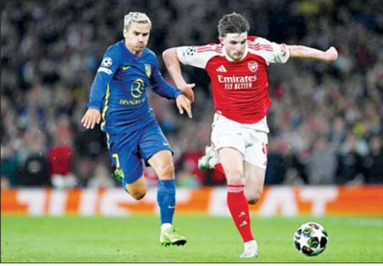
အာဆင်နယ်အသင်းနှင့် အက်သလက်တီကိုမက်ဒရစ်အသင်းတို့ ယှဉ်ပြိုင်ကစားကြစဉ်။

အာဆင်နယ်အသင်းဟာ မေ ၆ ရက် နံနက်ပိုင်းက အက်သလက်တီကိုမက်ဒရစ်အသင်းနဲ့ ယှဉ်ပြိုင်ကစားခဲ့တဲ့ ချန်ပီယံလိဂ်ဆီမီးပိုင်နယ် ဒုတိယအကျော့ပွဲစဉ်မှာ အနိုင်ရရှိခဲ့ပြီးနောက် နှစ်ပေါင်း ၂၀ အတွင်း ချန်ပီယံလိဂ်ဗိုလ်လုပွဲကို ပထမဆုံးအကြိမ် တက်လှမ်းခွင့်ရရှိခဲ့ပြီဖြစ်ပါတယ်။ အာဆင်နယ် အသင်းအနေနဲ့ အက်သလက်တီကိုမက်ဒရစ်အသင်းကို ဒုတိယအကျော့မှာ ဆာကာရဲ့ တစ်လုံးတည်းသောသွင်းဂိုးဖြင့် အနိုင်ရရှိခဲ့ပြီး ပထမအကျော့မှာ တစ်ဖက်တစ်ဂိုးစီ သရေရလဒ် ထွက်ပေါ်ခဲ့တာကြောင့် နှစ်ကျော့ပေါင်းရလဒ် နှစ်ဂိုး-တစ်ဂိုးဖြင့် စာမျက်နှာ ၁၁ ကော်လံ ၁ သို့ □