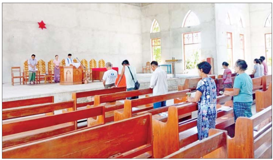
ခရစ်ယာန်ဘာသာဝင်များက စုပေါင်းဆုတောင်းမေတ္တာပို့သကြစဉ်။