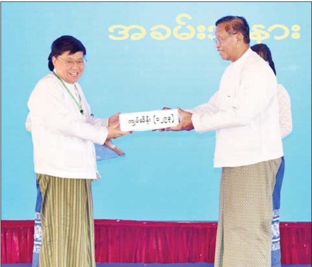
နိုင်ငံတော်စီမံအုပ်ချုပ်ရေးကောင်စီဝင် ပိုးရယ်အောင်သိန်း ငလျင်ဘေးဒဏ်သင့်ဒေသများ၌ ကူညီကယ်ဆယ်ရေးလုပ်ငန်းများ ဆောင်ရွက်ရန် စေတနာရှင်အလှူရှင်များ၏ အလှူငွေပေးအပ်မှုကို လက်ခံရယူစဉ်။