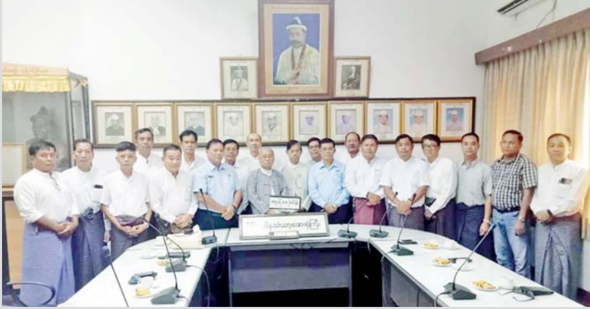
စစ်တက္ကသိုလ် အမှတ်စဉ် (၂၉) ၏ (၃၇) နှစ်မြောက် ကျောင်းဆင်းနှစ်ပတ်လည်နေ့ အထိမ်းအမှတ်အဖြစ် ဧပြီ ၁ ရက်က ရန်ကုန်မြို့ ဗဟန်းမြို့နယ်ရှိ ဇီဝိတဒါနသံဃာ့ ဆေးရုံသို့ အလှူငွေကျပ် ၁၀ သိန်း ပေးအပ်လှူဒါန်းစဉ်။

သို့ဖြစ်ရာ မြန်မာနိုင်ငံတွင် ကြုံတွေ့ခံစားရသည့် ငလျင်သဘာဝဘေးအန္တရာယ်နှင့်ပတ်သက်၍ စာနာထောက်ထားမှုများနှင့် အရေးပေါ်ကယ်ဆယ်ရေးအဖွဲ့များ စေလွှတ်ခြင်း၊ ကယ်ဆယ်ရေးပစ္စည်းများနှင့် အထောက်အပံ့များပေးအပ်ခြင်း၊ ဝမ်းနည်းကြောင်းသဝဏ်လွှာများပေးပို့ခြင်း၊ အားပေးစကားပြောကြားခြင်း၊ ဝမ်းနည်းကြောင်းလှုပ်ရှားမှုများ ပြုလုပ်ခြင်း၊ ကူညီကယ်ဆယ်ရေးလုပ်ငန်းများတွင် တက်ညီလက်ညီပါဝင်ဆောင်ရွက်ခြင်းတို့အပေါ် နိုင်ငံတော်စီမံအုပ်ချုပ်ရေးကောင်စီအနေဖြင့် အားလုံးကို အထူးပင်ကျေးဇူးတင်ရှိပြီး မြန်မာနိုင်ငံ ပြန်လည်ထူထောင်ရေးလုပ်ငန်းများ ဆောင်ရွက်သည်အထိ စဉ်ဆက်မပြတ် ပါဝင်စွမ်းဆောင်ကြမည်ဟု ယုံကြည်မျှော်လင့်ပါကြောင်း။