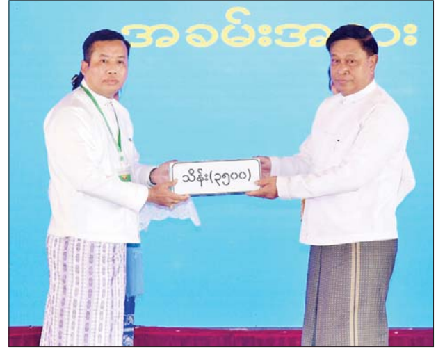
နိုင်ငံတော်စီမံအုပ်ချုပ်ရေးကောင်စီဝင် ဗိုလ်ချုပ်ကြီး တင်အောင်စန်း ငလျင်ဘေးဒဏ်သင့်ဒေသများ၌ ကူညီကယ်ဆယ် ရေးလုပ်ငန်းများဆောင်ရွက်ရန် စေတနာရှင်အလှူရှင်များ၏ အလှူငွေပေးအပ်မှုကို လက်ခံရယူစဉ်။