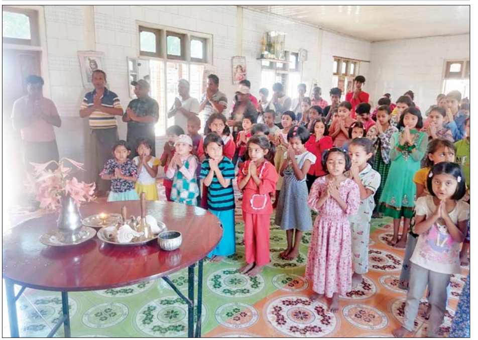
ဟိန္ဒူဘာသာဝင်များက စုပေါင်းဆုတောင်းမေတ္တာပို့သကြစဉ်။