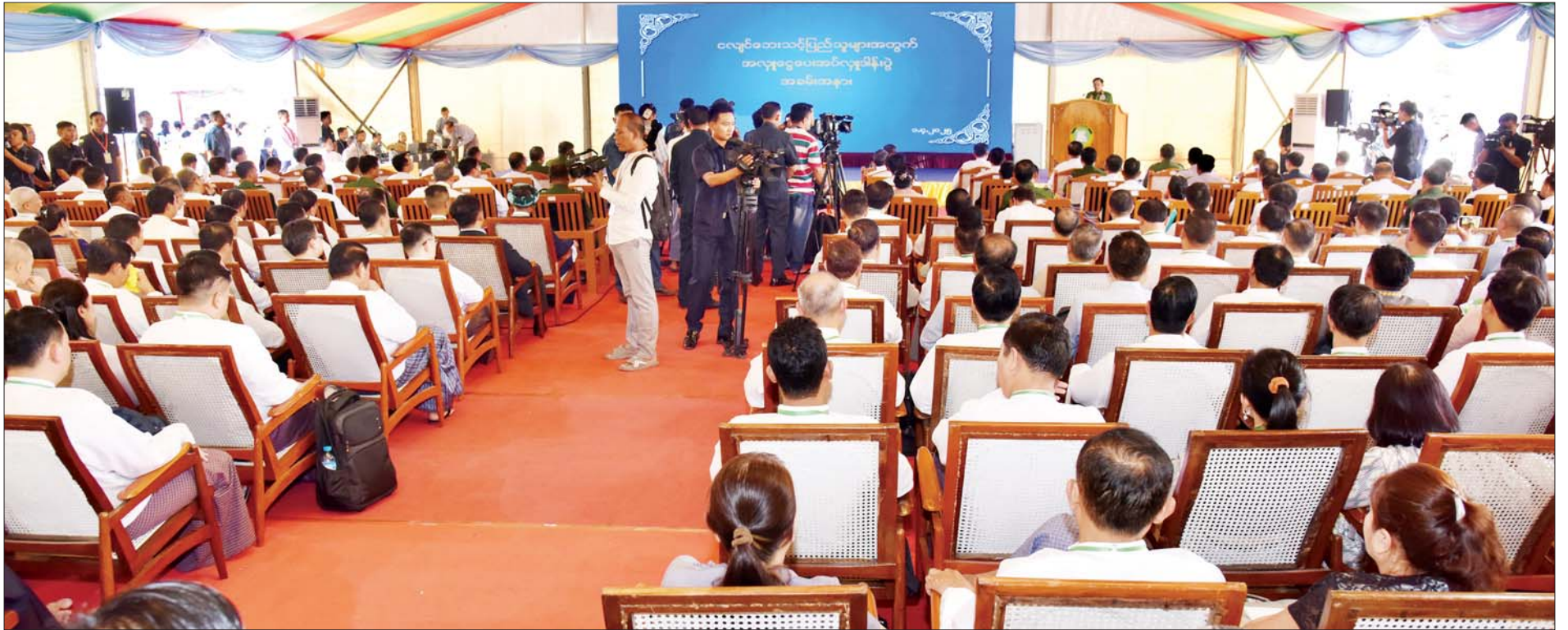
နိုင်ငံတော်စီမံအုပ်ချုပ်ရေးကောင်စီဥက္ကဋ္ဌ နိုင်ငံတော်ဝန်ကြီးချုပ် ဗိုလ်ချုပ်မှူးကြီးမင်းအောင်လှိုင် ငလျင်ဘေးဒဏ်သင့်ဒေသများ၌ ကူညီကယ်ဆယ်ရေးနှင့် ပြန်လည်တည်ဆောက်ရေးလုပ်ငန်းများ ဆောင်ရွက်ရန်အတွက် စေတနာရှင်၊ အလှူရှင်များက အလှူငွေများ ပေးအပ်လှူဒါန်းပွဲတွင် အမှာစကားပြောကြားစဉ်။