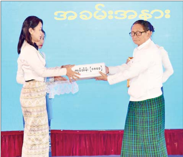
နိုင်ငံတော်စီမံအုပ်ချုပ်ရေးကောင်စီဝင် ဒေါက်တာ မှုထန် ငလျင်ဘေးဒဏ်သင့်ဒေသများ၌ ကူညီကယ်ဆယ်ရေးလုပ်ငန်းများ ဆောင်ရွက်ရန် စေတနာရှင်အလှူရှင်များ၏ အလှူငွေပေးအပ်မှုကို လက်ခံရယူစဉ်။