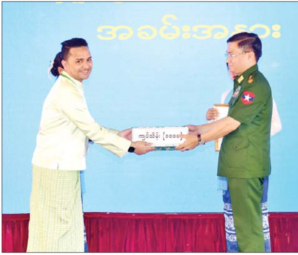
ညိုနိုင်ကွပ်ကဲရေးမှူး (ကြည်း၊ ရေ၊ လေ) ဗိုလ်ချုပ်ကြီး ကျော်စွာလင်း ငလျင်ဘေးဒဏ်သင့်ဒေသများ၌ ကူညီကယ်ဆယ်ရေး လုပ်ငန်းများ ဆောင်ရွက်ရန် စေတနာရှင်အလှူရှင်များ၏ အလှူငွေ ပေးအပ်မှုကို လက်ခံရယူစဉ်။

စာမျက်နှာ ၆ မှ ဆောင်ရွက်သွား ရန်လိုကြောင်း၊ နိုင်ငံတော်အပိုင်ကလည်း တတ်နိုင် သလောက် ကူညီဆောင်ရွက်ပေး သွားမည်ဖြစ်ကြောင်း၊ ပုဂ္ဂလိက တည်ဆောက်ရေး လုပ်ငန်းများ အတွက်လည်း နိုင်ငံတော်အနေ ဖြင့် တတ်နိုင်သမျှ ဖြည့်ဆည်း ဆောင်ရွက် ပေးသွားမည်ဖြစ် ကြောင်း၊ ယခုအခမ်းအနားသို့ မလာရောက်မီ မိမိအနေဖြင့် လွှတ်တော် အဆောက်အအုံများ ငလျင်ဘေးဒဏ်သင့်ခဲ့ရမှု အခြေ အနေများကို သွားရောက်ကြည့်ရှု စစ်ဆေးခဲ့ပြီး ပျက်စီးဆုံးရှုံးမှု များစွာ ပြန်လည်ပြုပြင်ဆောင်ရွက် သွားရမည် ဖြစ်ကြောင်း။