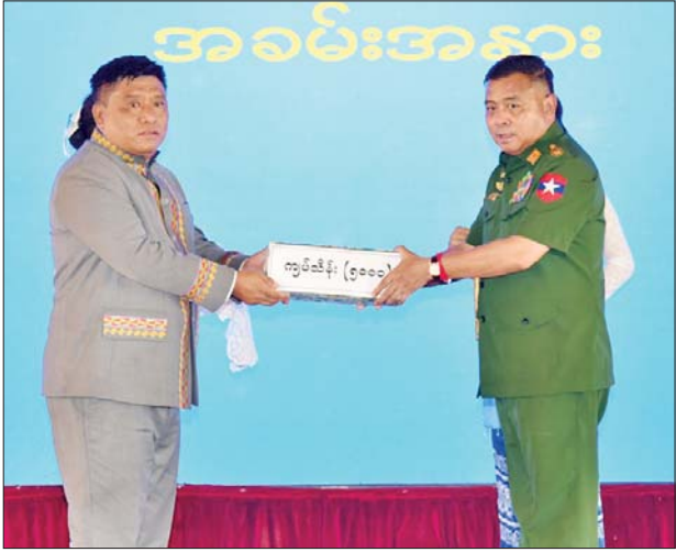
နိုင်ငံတော်စီမံအုပ်ချုပ်ရေးကောင်စီ တွဲဖက်အတွင်းရေးမှူး ဗိုလ်ချုပ်ကြီးရဲဝင်းဦး ငလျင်ဘေးဒဏ်သင့်ဒေသများ၌ ကူညီ ကယ်ဆယ်ရေးလုပ်ငန်းများဆောင်ရွက်ရန် စေတနာရှင်အလှူရှင် များ၏ အလှူငွေပေးအပ်မှုကို လက်ခံရယူစဉ်။

တည်ဆောက်ရေးနှင့် ပြန်လည် ထူထောင် ရေး လုပ်ငန်းများ ကို အင်တိုက်အားတိုက်ဖြင့် ဆက်လက် ဆောင်ရွက်သွားရ မည်ဖြစ်ကြောင်း ပြောကြား သည်။ ထို့နောက် ၁၂ နာရီ ၅၁ မိနစ် ၅၂ စက္ကန့်အချိန်တွင် နိုင်ငံတော်အဆင့် ဝမ်းနည်းခြင်း အထိမ်းအမှတ် နေ့ရက် တစ်နိုင်ငံလုံးအတိုင်း အတာလှုပ်ရှားမှုအဖြစ် နိုင်ငံတော် စီမံအုပ်ချုပ်ရေးကောင်စီ ဥက္ကဋ္ဌ နိုင်ငံတော်ဝန်ကြီးချုပ်နှင့် အဖွဲ့ ဝင်များ၊ စေတနာရှင်၊ အလှူရှင် များ၊ တက်ရောက်လာကြသူများ သည် တစ်မိနစ်ငြိမ်သက်စွာ ရပ်တန့်၍ တစ်နိုင်ငံလုံးမှ ပြည်သူ လူထုနှင့်အတူ ဦးညွှတ်ဂါရဝပြု ကြသည်။ ယင်းနောက် နိုင်ငံတော်စီမံ အုပ်ချုပ်ရေးကောင်စီ ဥက္ကဋ္ဌ နိုင်ငံတော် ဝန်ကြီးချုပ်က ဆက်လက် ပြောကြားရာတွင် အဆောက်အအုံများနှင့်ပတ်သက် ၍ အချို့အာမခံလုပ်ငန်းများ ဆောင်ရွက်ထားသည့် အဆောက် အအုံများအား အာမခံလျော်ကြေး ငွေများနှင့် အဆောက်အအုံများ ဖျက်သိမ်းခွင့် ရရှိရေးအတွက် စာမျက်နှာ ၇ သို့