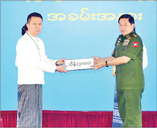
နိုင်ငံတော်စီမံအုပ်ချုပ်ရေးကောင်စီဝင် ဗိုလ်ချုပ်ကြီး ညိုစော ငလျင်ဘေးဒဏ်သင့်ဒေသများ၌ ကူညီကယ်ဆယ်ရေးလုပ်ငန်းများ ဆောင်ရွက်ရန် စေတနာရှင်အလှူရှင်များ၏ အလှူငွေပေးအပ်မှုကို လက်ခံရယူစဉ်။