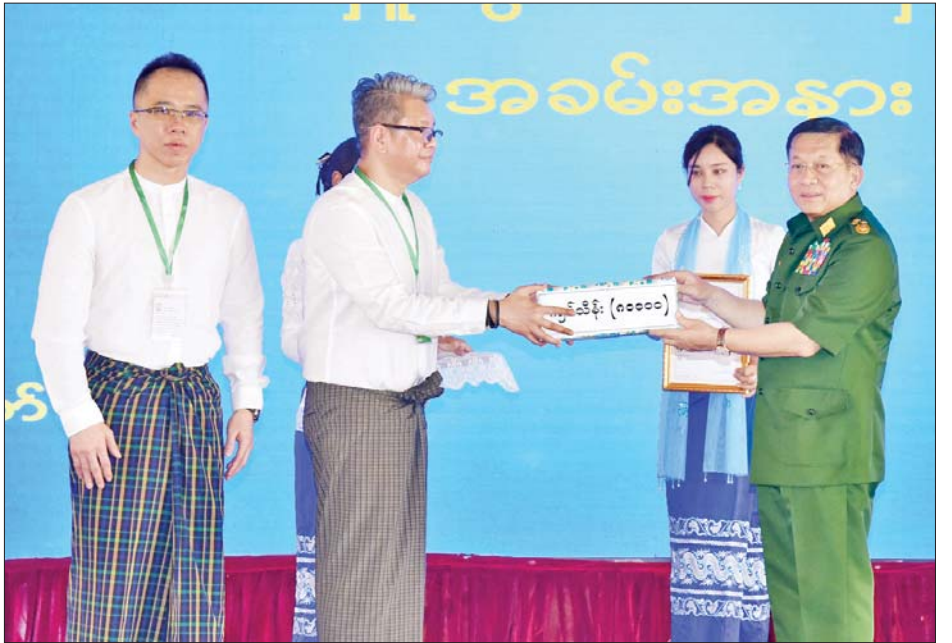
နိုင်ငံတော်စီမံအုပ်ချုပ်ရေးကောင်စီဥက္ကဋ္ဌ နိုင်ငံတော်ဝန်ကြီးချုပ် ဗိုလ်ချုပ်မှူးကြီးမင်းအောင်လှိုင် ငလျင်ဘေးဒဏ်သင့်ဒေသများ၌ ကူညီကယ်ဆယ်ရေးလုပ်ငန်းများဆောင်ရွက်ရန် စေတနာရှင်အလှူရှင် များ၏ အလှူငွေပေးအပ်မှုကို လက်ခံရယူစဉ်။

စာမျက်နှာ ၅ မှ ဆောင်ရွက်ရန် လိုအပ်ချက်များရှိ သည်ကိုတွေ့ရကြောင်း၊ အဆောက် အအုံများနှင့် ပတ်သက်၍လည်း အဆောက်အအုံများ ဆောက်လုပ် ရာတွင် ဖြစ်ပေါ်လာနိုင်မည့် ငလျင်ဒဏ်ကို ထည့်သွင်းစဉ်းစား ခြင်းမရှိဘဲ ဆောင်ရွက်ခဲ့သည် များရှိခြင်းကြောင့် ယခုဖြစ်ပေါ်ခဲ့ သည့် ငလျင်သဘာဝဘေးတွင် မလိုလားအပ်ဘဲ သေဆုံးခဲ့ရမှုများ၊ ဒဏ်ရာရရှိခဲ့ရမှုများနှင့် အပျောက် အဆုံးများရှိခဲ့ကြောင်း၊ ယနေ့ နံနက် ၈ နာရီအချိန်အထိ စာရင်း ကောက်ယူမှုများအရ ငလျင်ဘေး ဒဏ်ကြောင့် သေဆုံးခဲ့ရသူ ၂၇၀၉ ဦး၊ ထိခိုက်ဒဏ်ရာရရှိသူ ၄၅၂၁ ဦး၊ ပျောက်ဆုံးနေသူ ၄၄၁ ဦး ရှိသည်ဟုသိရှိရပြီး ကယ်ဆယ် ရေးလုပ်ငန်းများကို အင်တိုက် အားတိုက် ဆက်လက်ဆောင် ရွက်လျက်ရှိကြောင်း၊ မိမိအနေဖြင့် ငလျင် ဘေးဒဏ်သင့်ခဲ့ရသည့် ဒေသများသို့ သွားရောက်ကြည့်ရှု စစ်ဆေးခဲ့စဉ် ငလျင်သဘာဝဘေး ဒဏ်သည် အင်ဂျင်နီယာပိုင်း ဆိုင်ရာအတွက် ကြီးမားသည့် စိန်ခေါ်မှုပင် ဖြစ်ကြောင်း၊ အင်ဂျင်နီယာ ရှုထောင့်အရ အဆောက်အအုံများ တည်ဆောက်