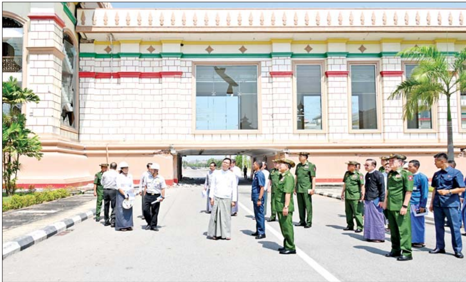
နိုင်ငံတော်စီမံအုပ်ချုပ်ရေးကောင်စီဥက္ကဋ္ဌ နိုင်ငံတော်ဝန်ကြီးချုပ် ဗိုလ်ချုပ်မှူးကြီးမင်းအောင်လှိုင် ငလျင်ဘေးဒဏ်ကြောင့် ထိခိုက်ပျက်စီးမှုများဖြစ်ပေါ်ခဲ့သည့် လွှတ်တော်အဆောက်အအုံများအား ကြည့်ရှုစစ်ဆေးစဉ်။

★ စာမျက်နှာ ၃ မှ ဖြစ်သဖြင့် ရေရှည်တည်တံ့ခိုင်မြဲမှု ရှိစေရေး ဖြစ်ပေါ်လာနိုင်မည့် အခြေအနေများအပေါ် တွက်ချက်၍ စနစ်တကျစီမံခန့်ခွဲဆောင်ရွက် သွားရန်လိုကြောင်း၊ ရုပ်ပွားတော် မြတ်ကြီးသည် ထုထည်ပမာဏ ကြီးမားပြီး ဉာဏ်တော်အရလည်း ကမ္ဘာပေါ်ရှိ ထိုင်တော်မူ ကျောက်ဆစ် ဗုဒ္ဓရုပ်ပွားတော်များ အနက် ဉာဏ်တော်အမြင့်ဆုံး ဖြစ်သကဲ့သို့ အဂ္ဂိမိပတိ သာသနာ့ ဗိမာန်တော်ကြီး သည်လည်း အတွင်း အလယ်ဒေါက်တိုင်လုံးဝ မပါရှိသည့် အတွင်းလိုက်သဏ္ဍာန် ဒီဇိုင်းရေးဆွဲ တည်ဆောက်ထား