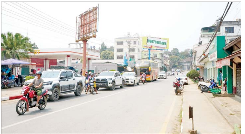
ကျိုင်းတုံမြို့၌ နိုင်ငံတော်အဆင့် ဝမ်းနည်းခြင်းအထိမ်းအမှတ်နေ့ရက်အဖြစ် လှုပ်ရှားမှုပြုလုပ်စဉ်။