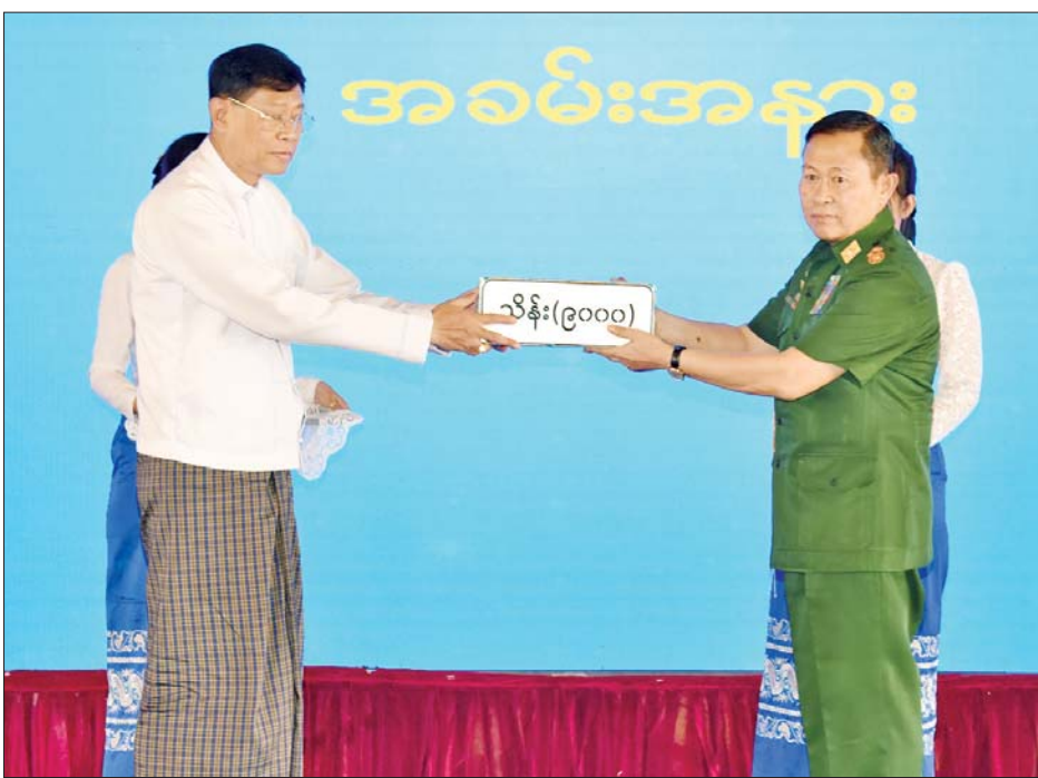
အမျိုးသားသဘာဝဘေးအန္တရာယ်ဆိုင်ရာ စီမံခန့်ခွဲမှုကော်မတီဥက္ကဋ္ဌ နိုင်ငံတော်စီမံအုပ်ချုပ်ရေး ကောင်စီဒုတိယဥက္ကဋ္ဌ ဒုတိယဝန်ကြီးချုပ် ဒုတိယဗိုလ်ချုပ်မှူးကြီးစိုးဝင်း ငလျင်ဘေးဒဏ်သင့်ဒေသများ၌ ကူညီကယ်ဆယ်ရေးလုပ်ငန်းများဆောင်ရွက်ရန် စေတနာရှင်အလှူရှင်များ၏ အလှူငွေပေးအပ်မှုကို လက်ခံရယူစဉ်။

စာမျက်နှာ ၅ မှ ဆောင်ရွက်ရန် လိုအပ်ချက်များရှိ သည်ကိုတွေ့ရကြောင်း၊ အဆောက် အအုံများနှင့် ပတ်သက်၍လည်း အဆောက်အအုံများ ဆောက်လုပ် ရာတွင် ဖြစ်ပေါ်လာနိုင်မည့် ငလျင်ဒဏ်ကို ထည့်သွင်းစဉ်းစား ခြင်းမရှိဘဲ ဆောင်ရွက်ခဲ့သည် များရှိခြင်းကြောင့် ယခုဖြစ်ပေါ်ခဲ့ သည့် ငလျင်သဘာဝဘေးတွင် မလိုလားအပ်ဘဲ သေဆုံးခဲ့ရမှုများ၊ ဒဏ်ရာရရှိခဲ့ရမှုများနှင့် အပျောက် အဆုံးများရှိခဲ့ကြောင်း၊ ယနေ့ နံနက် ၈ နာရီအချိန်အထိ စာရင်း ကောက်ယူမှုများအရ ငလျင်ဘေး ဒဏ်ကြောင့် သေဆုံးခဲ့ရသူ ၂၇၀၉ ဦး၊ ထိခိုက်ဒဏ်ရာရရှိသူ ၄၅၂၁ ဦး၊ ပျောက်ဆုံးနေသူ ၄၄၁ ဦး ရှိသည်ဟုသိရှိရပြီး ကယ်ဆယ် ရေးလုပ်ငန်းများကို အင်တိုက် အားတိုက် ဆက်လက်ဆောင် ရွက်လျက်ရှိကြောင်း၊ မိမိအနေဖြင့် ငလျင် ဘေးဒဏ်သင့်ခဲ့ရသည့် ဒေသများသို့ သွားရောက်ကြည့်ရှု စစ်ဆေးခဲ့စဉ် ငလျင်သဘာဝဘေး ဒဏ်သည် အင်ဂျင်နီယာပိုင်း ဆိုင်ရာအတွက် ကြီးမားသည့် စိန်ခေါ်မှုပင် ဖြစ်ကြောင်း၊ အင်ဂျင်နီယာ ရှုထောင့်အရ အဆောက်အအုံများ တည်ဆောက်