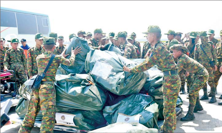
အင်ဒိုနီးရှားနိုင်ငံမှ ကယ်ဆယ်ရေးအဖွဲ့များ၊ ဆရာဝန်များနှင့် သူနာပြုဆေးအဖွဲ့များ နေပြည်တော် တပ်မတော်လေဆိပ်သို့ ရောက်ရှိစဉ်။