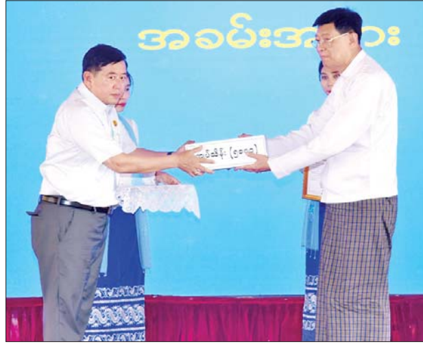
နိုင်ငံတော်စီမံအုပ်ချုပ်ရေးကောင်စီဝင် ဗိုလ်ချုပ်ကြီးမြထွန်းဦး ငလျင်ဘေးဒဏ်သင့်ဒေသများ၌ ကူညီကယ်ဆယ်ရေးလုပ်ငန်းများ ဆောင်ရွက်ရန် စေတနာရှင်အလှူရှင်များ၏ အလှူငွေပေးအပ်မှုကို လက်ခံရယူစဉ်။