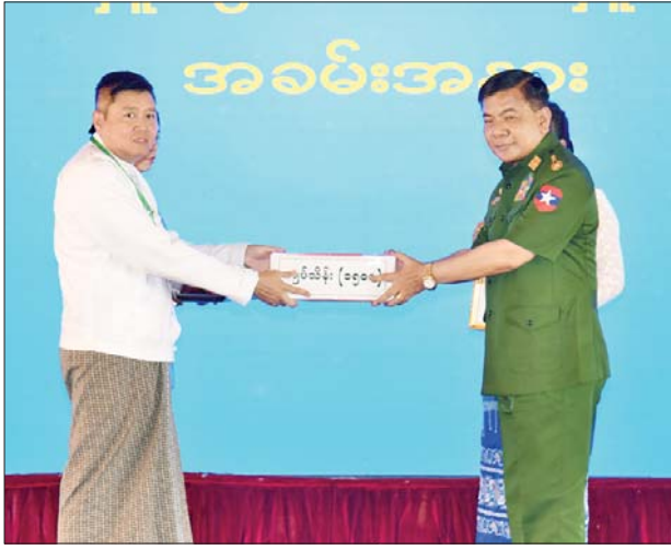
နိုင်ငံတော်စီမံအုပ်ချုပ်ရေးကောင်စီဝင် ဗိုလ်ချုပ်ကြီး မောင်မောင်အေး ငလျင်ဘေးဒဏ်သင့်ဒေသများ၌ ကူညီကယ်ဆယ် ရေးလုပ်ငန်းများဆောင်ရွက်ရန် စေတနာရှင်အလှူရှင်များ၏ အလှူငွေပေးအပ်မှုကို လက်ခံရယူစဉ်။