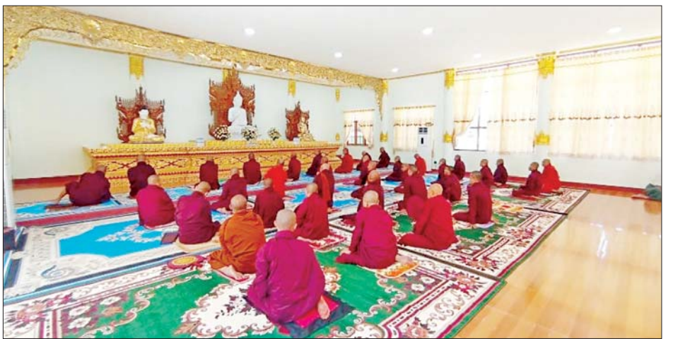
လွိုင်ကော်မြို့ သီရိမင်္ဂလာတောင်တော် (တောင်ကွဲစေတီ)၌ ဆရာတော်၊ သံဃာတော်များက ဆုတောင်း မေတ္တာပို့သကြစဉ်။