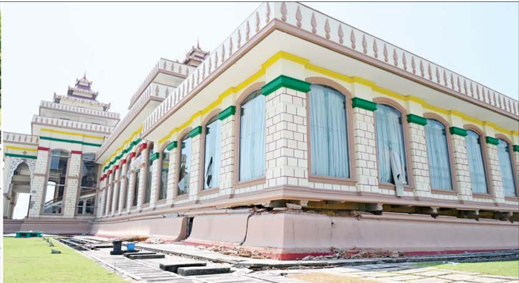
နိုင်ငံတော်စီမံအုပ်ချုပ်ရေးကောင်စီဥက္ကဋ္ဌ နိုင်ငံတော်ဝန်ကြီးချုပ် ဗိုလ်ချုပ်မှူးကြီးမင်းအောင်လှိုင် ငလျင်ဘေးဒဏ်ကြောင့် ထိခိုက်ပျက်စီးမှုများဖြစ်ပေါ်ခဲ့သည့် လွှတ်တော်အဆောက်အအုံများအား ကြည့်ရှုစစ်ဆေးစဉ်။