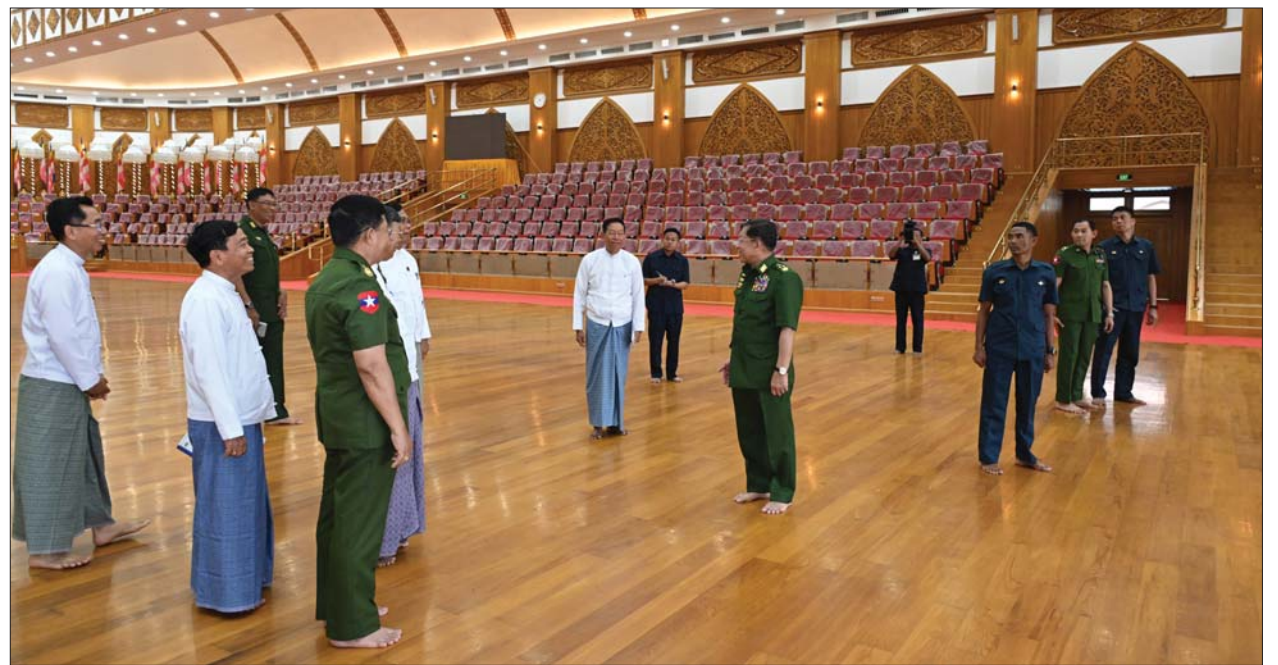
နိုင်ငံတော်စီမံအုပ်ချုပ်ရေးကောင်စီဥက္ကဋ္ဌ တပ်မတော်ကာကွယ်ရေးဦးစီးချုပ် ဗိုလ်ချုပ်မှူးကြီးမင်းအောင်လှိုင် အဂ္ဂိမိပတိသာသနာ့ဗိမာန်တော်ကြီးအတွင်း ကြည့်ရှုစစ်ဆေးစဉ်။

အပါအဝင် သာသနိကအဆောက်အအုံများရှိ မျက်နှာကြက်များ ငလျင်ဒဏ်ကြောင့် အနည်းငယ် ထိခိုက်ပျက်စီးခဲ့မှုနှင့် ပြုပြင်ဆောင်ရွက်လျက်ရှိမှု၊ အခြားသာသနိက အဆောက်အအုံများနှင့် ပရိဝုဏ်တော်အတွင်းရှိ ပတ်လမ်းများတွင် ငလျင်ဒဏ်ကြောင့် ထိခိုက်ပျက်စီးမှုများ အနည်းငယ်ဖြစ်ပေါ်ခဲ့မှု ရုပ်ပွားတော်မြတ်ကြီး စတင်တည်ထားစဉ် ကတည်းက ဖွဲ့စည်းထားရှိသည့် တည်ဆောက်ရေးအဖွဲ့နှင့် ငလျင်ပညာရှင်အဖွဲ့တို့ဖြင့် ငလျင်ဆိုင်ရာဖြစ်ပွားမှုအပေါ် ခေတ်မီနည်းပညာများဖြင့် စနစ်တကျ စစ်ဆေးနိုင်ရေးနှင့် မှတ်တမ်းတင် ထားရှိနိုင်ရေး၊ အနည်းငယ်သော ထိခိုက်ပျက်စီးမှုအခြေအနေများအား စနစ်တကျ ပြုပြင်နိုင်ရေး၊ နောင်တွင်ဖြစ်ပေါ်လာနိုင်မည့် ငလျင်အခြေအနေများအပေါ် ကြိုတင်ကာကွယ်နိုင်ရေး ဆောင်ရွက်လျက်ရှိမှုစသည်တို့ကို ရှင်းလင်းတင်ပြကြသည်။ ရှင်းလင်း တင်ပြမှုများအပေါ် နိုင်ငံတော်စီမံအုပ်ချုပ်ရေးကောင်စီဥက္ကဋ္ဌ တပ်မတော်ကာကွယ်ရေးဦးစီးချုပ်က မာရဝိဇယဗုဒ္ဓရုပ်ပွားတော်မြတ်ကြီး တည်ဆောက်ရေးလုပ်ငန်းများ စတင်ဆောင်ရွက်စဉ်ကတည်းကပင် ရေရှည်တည်တံ့ခိုင်မြဲစေရေးအတွက် လေပြင်းတိုက်ခတ်မှုဒဏ်ခံနိုင်ရေး၊ မြေငလျင်ဒဏ်ခံနိုင်ရေးနှင့် သဘာဝဘေးဒဏ်