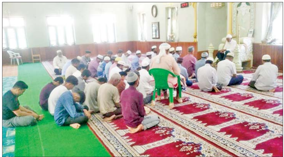
မွတ်ဆလင်ဘာသာဝင်များက စုပေါင်းဆုတောင်းမေတ္တာပို့သကြစဉ်။