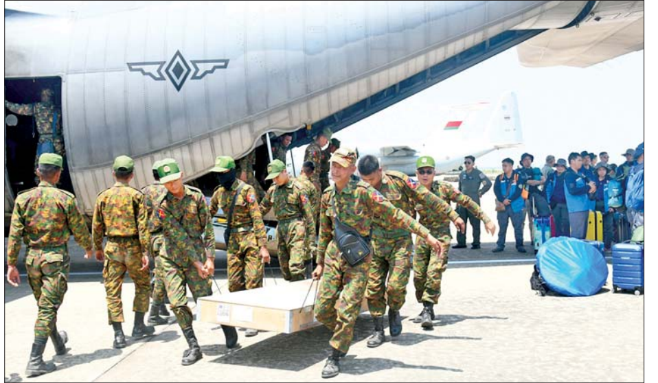
ဖိလစ်ပိုင်နိုင်ငံမှ ကယ်ဆယ်ရေးအဖွဲ့များ၊ ဆရာဝန်များနှင့် သူနာပြုဆေးအဖွဲ့များ နေပြည်တော် တပ်မတော်လေဆိပ်သို့ ရောက်ရှိစဉ်။