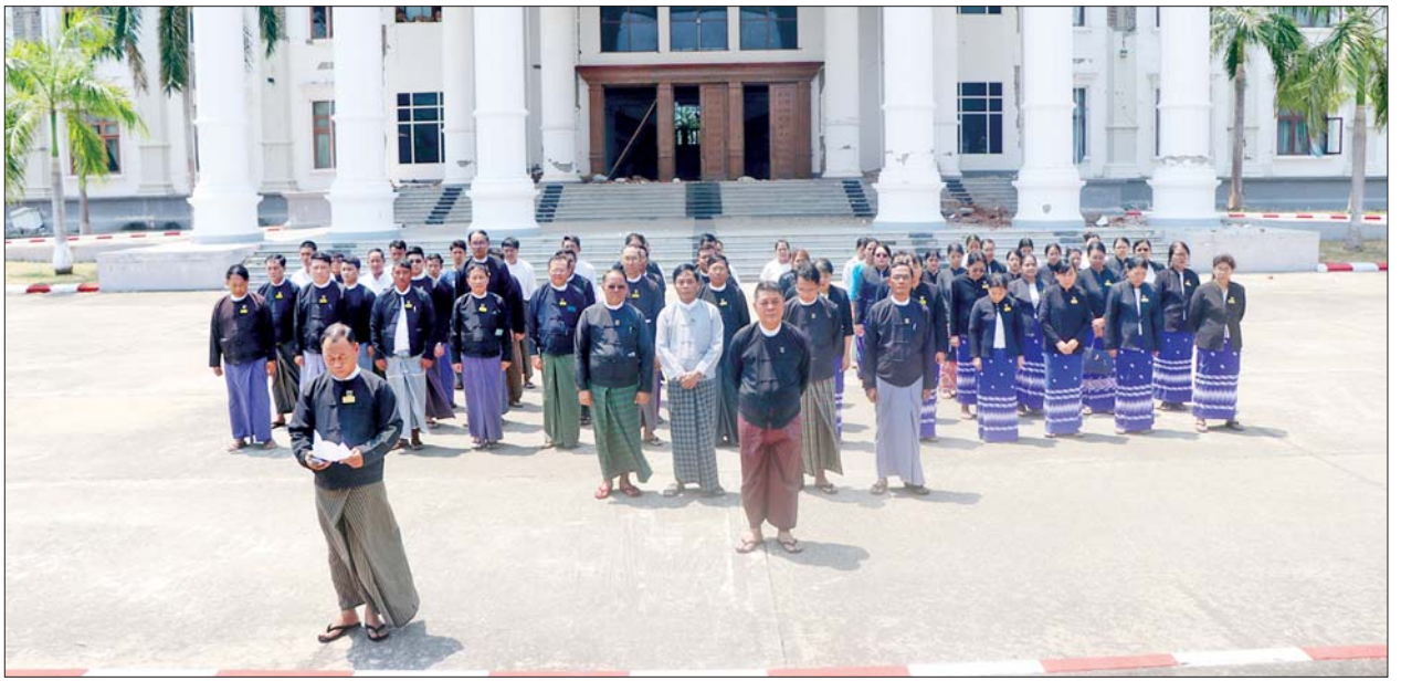
ဆုံးရှုံးခဲ့သော ဝန်ထမ်းမိသားစု ပို့သခြင်း၊ ဟွန်းတီးဂါရဝပြုခြင်း၊ စာများရွတ်ဆိုခြင်း၊ အမျှအတန်း ကြောင်း သိရသည်။ များအတွက် ဆုတောင်းမေတ္တာ အန္တရာယ်ကင်းပရိတ်များ၊ ဆုတောင်း ပေးဝေခြင်းတို့ကို ဆောင်ရွက်ခဲ့ သတင်းစဉ်

ထို့အပြင် ပြည်ထောင်စု တရားလွှတ်တော်ချုပ်မှ ထိခိုက်အသက်