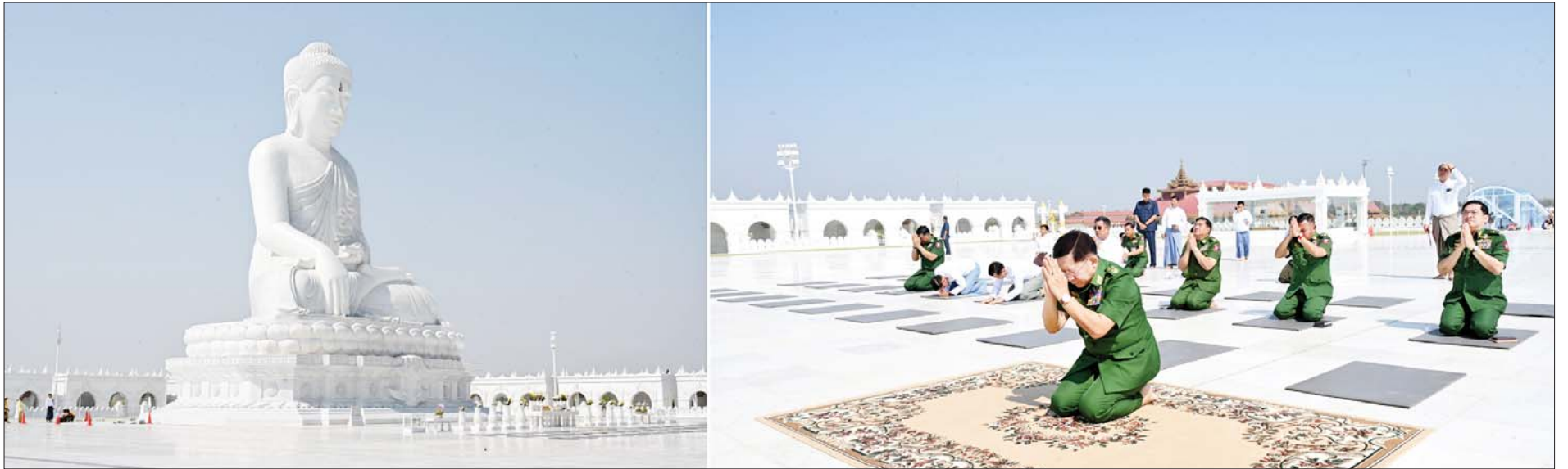
နိုင်ငံတော်စီမံအုပ်ချုပ်ရေးကောင်စီဥက္ကဋ္ဌ တပ်မတော်ကာကွယ်ရေးဦးစီးချုပ် ဗိုလ်ချုပ်မှူးကြီးမင်းအောင်လှိုင် မာရဝိဇယရုပ်ပွားတော်မြတ်ကြီးအား ဖူးမြော်ကြည်ညိုစဉ်။

★ ရှေ့ဖုံးမှ ဦးစွာ နိုင်ငံတော်စီမံအုပ်ချုပ်ရေးကောင်စီဥက္ကဋ္ဌ တပ်မတော်ကာကွယ်ရေး ဦးစီးချုပ်အား မာရဝိဇယ ဂေါပကအဖွဲ့ရုံး၌ ဂေါပကဥက္ကဋ္ဌ ဦးသန့်ဆွေ၊ စွမ်းအင်ဝန်ကြီးဌာန ပြည်ထောင်စုဝန်ကြီး ဦးကိုကိုလွင်နှင့် စစ်အင်ဂျင်နီယာ ညွှန်ကြားရေးမှူးရုံး ညွှန်ကြားရေးမှူး ဗိုလ်ချုပ်ဇော်နိုင်ဦး၊ ဆောက်လုပ်ရေးဝန်ကြီးဌာန ပြည်ထောင်စုဝန်ကြီး ဦးမျိုးသန့်နှင့် တာဝန်ရှိသူများက မာရဝိဇယ ဗုဒ္ဓရုပ်ပွားတော်မြတ်ကြီး ရေရှည်တည်တံ့ခိုင်မြဲရေးအတွက် ဆင်းတုတော်ကြီးနှင့် ပလ္လင်တော်ကြီး၏ အတိုင်းအတာ အချက်အလက်များနှင့် Datum Point များအား နေ့စဉ်၊ လစဉ် တိုင်းတာစစ်ဆေးလျက်ရှိမှု၊ မတ် ၂၇ ရက်အထိ တိုင်းတာထားရှိသည့် အချက်အလက်များနှင့် မတ် ၂၈ ရက် ငလျင်လှုပ်ခတ်ပြီးချိန်တွင် တိုင်းတာရရှိသည့် အချက်အလက်များအား တိုက်ဆိုင်စစ်ဆေးချက်များအရ Datum Point များ ပြောင်းလဲသွားခြင်းမရှိကြောင်းနှင့် ဆင်းတုတော်ကြီးနှင့် ပလ္လင်တော်ကြီးတို့အနေဖြင့် တိမ်းစောင်းခြင်း၊ နိမ့်ကျခြင်း၊ တွဲဆက်ထားသည့် အပိုင်းများကွဲအက်ခြင်းတို့ (လုံးဝ) မရှိကြောင်းကို စစ်ဆေးတွေ့ရှိရမှု ရင်ပြင်တော်ကြီး၊ ဂန္ဓကုဋ်တိုက်တို့ရှိ ကျောက်ပြားများ