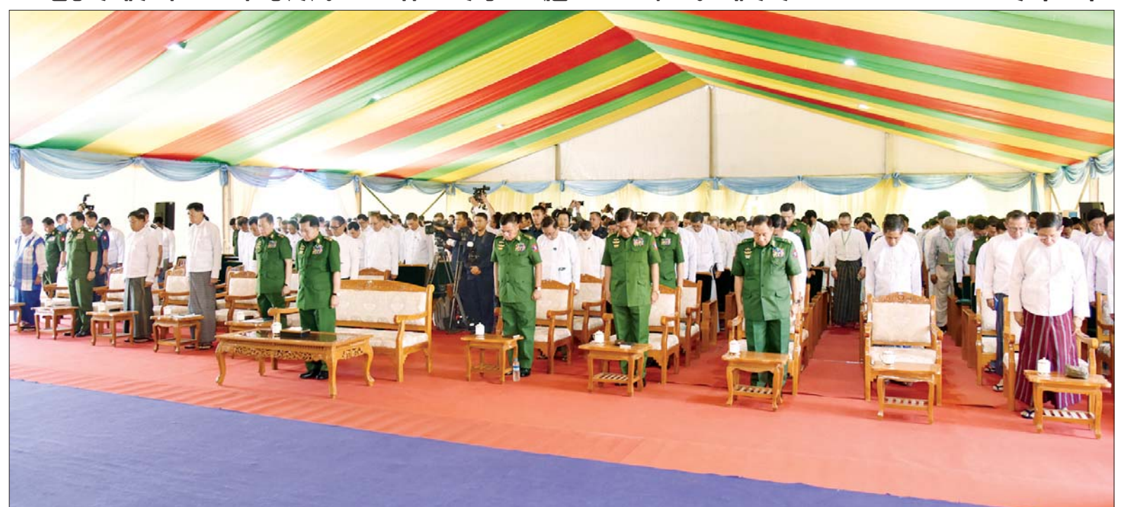
နိုင်ငံတော်စီမံအုပ်ချုပ်ရေးကောင်စီဥက္ကဋ္ဌ နိုင်ငံတော်ဝန်ကြီးချုပ် ဗိုလ်ချုပ်မှူးကြီးမင်းအောင်လှိုင်နှင့် အလှူငွေပေးအပ်ပွဲ အခမ်းအနားတက်ရောက်လာကြသူများ နိုင်ငံတော်အဆင့် ဝမ်းနည်းခြင်းအထိမ်းအမှတ်နေ့ရက် တစ်နိုင်ငံလုံးအတိုင်းအတာလှုပ်ရှားမှုအဖြစ် တစ်မိနစ်ငြိမ်သက်စွာရပ်တန့်၍ တစ်နိုင်ငံလုံးမှ ပြည်သူလူထုနှင့်အတူ ဦးညွတ်ဂါရဝပြုကြစဉ်။

ကမ္ဘာဒီးယားနိုင်ငံ၊ ဘရူနိုင်းနိုင်ငံ၊ နီကာရာဂွာနိုင်ငံတို့မှ အကြီးအကဲ များကလည်း ဝမ်းနည်းကြောင်း နှင့် စာနာထောက်ထားကြောင်း သဝဏ်လွှာများ ပေးပို့ဆက်သွယ် ခြင်းနှင့် အခြားလိုအပ်သည့် အကူအညီများကို ပေးအပ်ခဲ့ကြ ကြောင်း။