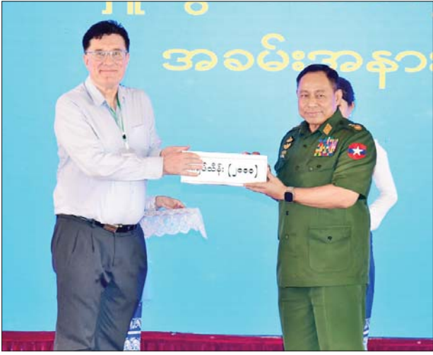
နိုင်ငံတော်စီမံအုပ်ချုပ်ရေးကောင်စီဝင် ဒုတိယ ဗိုလ်ချုပ်ကြီး ရာပြည့် ငလျင်ဘေးဒဏ်သင့်ဒေသများ၌ ကူညီကယ်ဆယ်ရေး လုပ်ငန်းများဆောင်ရွက်ရန် စေတနာရှင်အလှူရှင်များ၏ အလှူငွေ ပေးအပ်မှုကို လက်ခံရယူစဉ်။