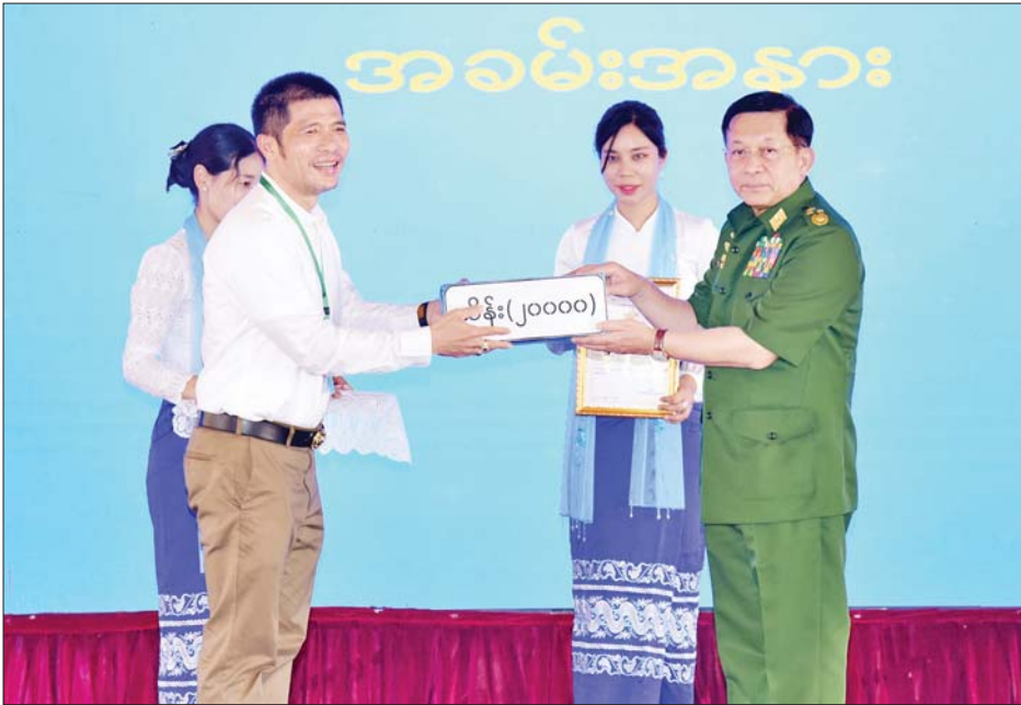
နိုင်ငံတော်စီမံအုပ်ချုပ်ရေးကောင်စီဥက္ကဋ္ဌ နိုင်ငံတော်ဝန်ကြီးချုပ် ဗိုလ်ချုပ်မှူးကြီးမင်းအောင်လှိုင် ငလျင်ဘေးဒဏ်သင့်ဒေသများ၌ ကူညီကယ်ဆယ်ရေးလုပ်ငန်းများဆောင်ရွက်ရန် စေတနာရှင်အလှူရှင် များ၏ အလှူငွေပေးအပ်မှုကို လက်ခံရယူစဉ်။