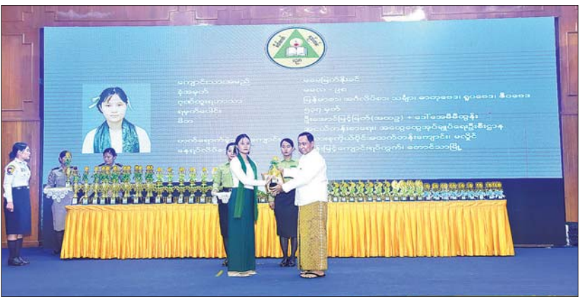
နိုင်ငံတော်စီမံအုပ်ချုပ်ရေးကောင်စီအဖွဲ့ဝင်၊ ပြည်ထဲရေးဝန်ကြီးဌာန ပြည်ထောင်စုဝန်ကြီး ဒုတိယဗိုလ်ချုပ်ကြီး ရာပြည့် ခြောက်ဘာသာဂုဏ်ထူးရှင် မမြေတိုးနိုင် အား ပညာထူးချွန်ဆု ပေးအပ်ချီးမြှင့်စဉ်။

ဦးတည်ချက်(၁)ရပ်ဖြစ်သည့် “တစ်နိုင်ငံလုံး အသိပညာ၊ အတတ်ပညာ မြှင့်မားတိုးတက်စေရေး၊ ကုန်ထုတ်လုပ်မှု အထောက်အကူပြု ပညာရှင်များ ထွန်းကားလာစေရေးအတွက် လူတိုင်းလက်လှမ်းမီသည့် ဘက်စုံပညာရေးစနစ်ကို အကောင်အထည်ဖော်ဆောင်ရွက်”အတွက် လိုအပ်သော နည်းပညာမြှင့်မားတိုးတက်မှုနှင့် စည်းကမ်းပြည့်ဝမှုတို့သည် ပညာရေးမြှင့်မားခြင်းအပေါ်တွင် မူတည်ပါကြောင်း၊ ကျောင်းသား မိဘ ဝန်ထမ်းများအနေဖြင့် သားသမီးများကို ပညာအမွေ လက်ဆင့်ကမ်းကာ မိမိတို့ထက်သာလွန်သော နိုင်ငံသားကောင်း ရတနာများဖြစ်စေရေး ဆုံးမသွန်သင်ပေးရန်နှင့် ကောင်းမွန်ပေးရန်လိုကြောင်း၊ ထို့ပြင် “စဉ်ဆက်မပြတ် ကိုယ်တိုင်လေ့လာသင်ယူမှု” သည် လည်း အရေးကြီးကြောင်း၊ စဉ်ဆက်မပြတ် ကိုယ်တိုင်လေ့လာ သင်ယူနိုင်စေရန် အခြေခံအကျဆုံး Infrastructure သည် စာကြည့်တိုက်များဖြစ်ပြီး “စာမတတ်သူ ပပျောက်ရေး” မှသည် “စာမဖတ်သူ ပပျောက်ရေး” ကိုလည်း စာဖတ်ရန်မြှင့်တင်၍ အားလုံးပိုင်းဝန်းဆောင်ရွက်ကြရန် တိုက်တွန်းပါကြောင်း ပြောကြားသည်။ ထူးချွန်သူများပေးအပ် ထိုနေ့က နိုင်ငံတော်စီမံအုပ်ချုပ်ရေးကောင်စီ အဖွဲ့ဝင်၊ ပြည်ထဲရေးဝန်ကြီးဌာန