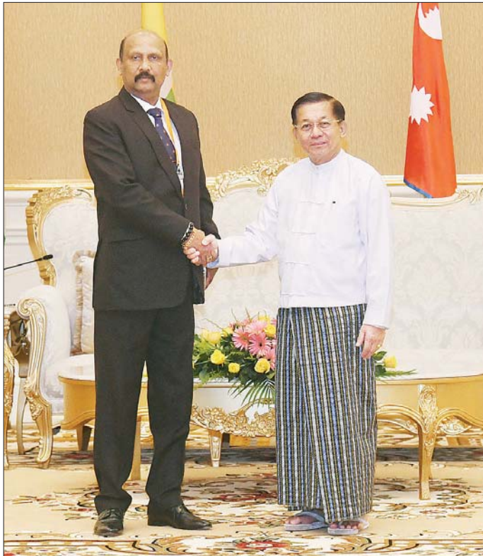
နိုင်ငံတော်စီမံအုပ်ချုပ်ရေးကောင်စီဥက္ကဋ္ဌ နိုင်ငံတော်ဝန်ကြီးချုပ် ဗိုလ်ချုပ်မှူးကြီး မင်းအောင်လှိုင် အမျိုးသားလုံခြုံရေးဆိုင်ရာ အကြီးအကဲ သီရိလင်္ကာနိုင်ငံမှ General Kamal Gunaratne (Retd) WWV RWP RSP USP Ndc psc MPhil အား ရင်းရင်းနှီးနှီး နှုတ်ဆက်စဉ်။

ဆိုင်ရာအကြီးအကဲများ၊ ကိုယ်စားလှယ်များ၊ ဘင်းမိ စတက် အတွင်းရေးမှူးချုပ်တို့သည် ဘင်းမိစတက် အဖွဲ့အစည်း ပေါ်ပေါက်လာမှုအခြေအနေနှင့် ရည်ရွယ်ချက်များ၊ စာမျက်နှာ ၅ သို့