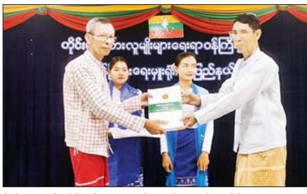
ဦးစီးဌာနနှင့် တိုင်းရင်းသားအဖွဲ့အစည်းများ ကာကွယ်စောင့်ရှောက်ရေးဦးစီးဌာနတို့မှ တာဝန်ရှိသူများ၊ မွန်၊ ကရင်၊ ပအိုဝ်း၊ ဗမာ စာပေနှင့် ယဉ်ကျေးမှုကော်မတီများမှ ကိုယ်စားလှယ်များ တက်ရောက်ကြသည်။

မော်လမြိုင် ဇူလိုင် ၂၅ မွန်ပြည်နယ် တိုင်းရင်းသားရေးရာဝန်ကြီး ဦးအင်မောင်ဦး ဦးဆောင်၍ မွန်ပြည်နယ်အတွင်းရှိ မွန်၊ ကရင်၊ ပအိုဝ်း၊ ဗမာစာပေနှင့် ယဉ်ကျေးမှုကော်မတီများ တွေ့ဆုံပွဲအခမ်းအနားကို ဇူလိုင် ၂၄ ရက်တွင် မော်လမြိုင်မြို့ရှိ တိုင်းရင်းသားလူမျိုးများရေးရာ ဝန်ကြီးဌာန မွန်ပြည်နယ် ညွှန်ကြားရေးမှူးရုံး၌ ကျင်းပသည်။