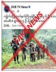
ဇာတာများကို တရားမဝင်တူးဖော် ရောင်းချခြင်းများ ဆောင်ရွက် လျက်ရှိရာ ယခုဖြစ်စဉ်တွင်လည်း ၎င်းတို့၏ ဥပဒေမဲ့လုပ်ရပ်များကို ဖုံးကွယ်ရန်အတွက် သတင်းတု၊ သတင်းအမှားများဖြင့် အများ ပြည်သူကို ဝါဒဖြန့်ဝေနေခြင်းသာ ဖြစ်ကြောင်း သတင်းရရှိသည်။

သည့်နေရာ အနီးတစ်ဝိုက်ကို လုံခြုံရေးတပ်ဖွဲ့ဝင်များက နယ်မြေ ရင်းလင်းခဲ့ရာ တရားမဝင်သည့် ဇာတာများ တူးဖော်ရာတွင် အသုံး ပြုမည့် ဘက်ဟိုးယာဉ် တစ်စီး ကို သိမ်းဆည်းရမိခဲ့ကြောင်း၊ ထိုသို့ တိုက်ပွဲဖြစ်ပွားမှုကြောင့် ပြည်သူများ ထိခိုက်သေဆုံးမှု မရှိကြောင်းနှင့် ပြည်သူများကို ဖမ်းဆီးခြင်းများလည်း မရှိကြောင်း လုံခြုံရေးတာဝန်ရှိသူ တစ်ဦး၏ ပြောကြားချက်အရ သိရသည်။ အဆိုပါ အကြမ်းဖက်သမား များသည် ၎င်းတို့ ဆက်လက် ရပ်တည်နိုင်ရေးအတွက် ပြည်သူ များထံမှ အတင်းအဓမ္မ ငွေကြေး တောင်းခံခြင်း၊ မူးယစ်ဆေးဝါးများ ရောင်းချခြင်းနှင့် သဘာဝသယံ