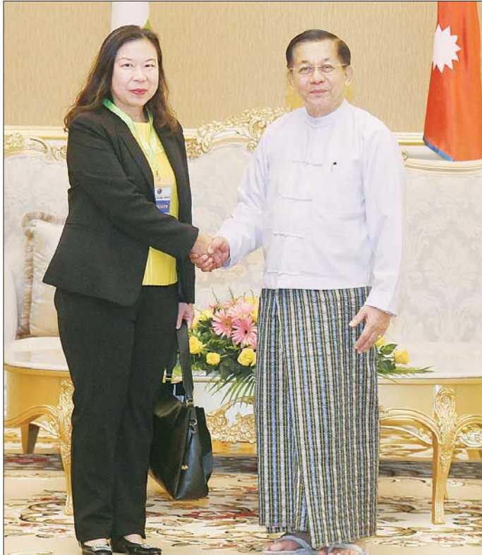
နိုင်ငံတော်စီမံအုပ်ချုပ်ရေးကောင်စီဥက္ကဋ္ဌ နိုင်ငံတော်ဝန်ကြီးချုပ် ဗိုလ်ချုပ်မှူးကြီး မင်းအောင်လှိုင် အမျိုးသားလုံခြုံရေးဆိုင်ရာအကြီးအကဲ ထိုင်းနိုင်ငံမှ Ms. Kanyarat Angkanavisalya အား ရင်းရင်းနှီးနှီး နှုတ်ဆက်စဉ်။