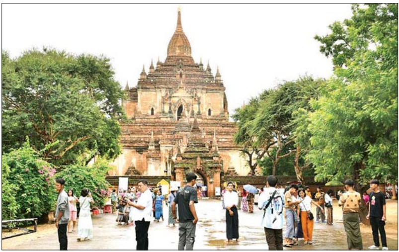
ပုဂံဒေသသို့ လာရောက်သော ဘုရားဖူးပြည်သူများကို တွေ့ရစဉ်။

ရန်ကုန် ဇူလိုင် ၂၅ ပုဂံရှေးဟောင်း ယဉ်ကျေးမှု နယ်မြေသို့ ဘုရားဖူးပြည်သူများ စဉ်ဆက်မပြတ် လာရောက်နေရာ ရန်ကုန်၊ မန္တလေးနှင့် ပဲခူးမြို့တို့မှ လာရောက်သူ ပိုမိုများပြားကြောင်း ဒေသခံများထံ မေးမြန်းထားသည့် အချက်အလက်များအရ သိရသည်။ “ဒီကာလမှာလည်း လာကြပါတယ်။ အခု ကျွန်တော်တို့ကို ငှားတဲ့သူ တော်တော်များများက ရန်ကုန်ဘက်က များတယ်။ ရန်ကုန်၊ ပဲခူးဘက်တွေက လာကြတာ များတယ်။ ဒီမှာ ဘုရားဖူးက ပြတ်လည်းပြတ်သွားတာ တော့မရှိပါဘူး။ သွားလာနေကြတာပါပဲ။ ဒေသခံတွေကတော့ အပြင်သွားတာ နည်းတယ်။ စာမျက်နှာ ၁၆ ကော်လံ ၅ *