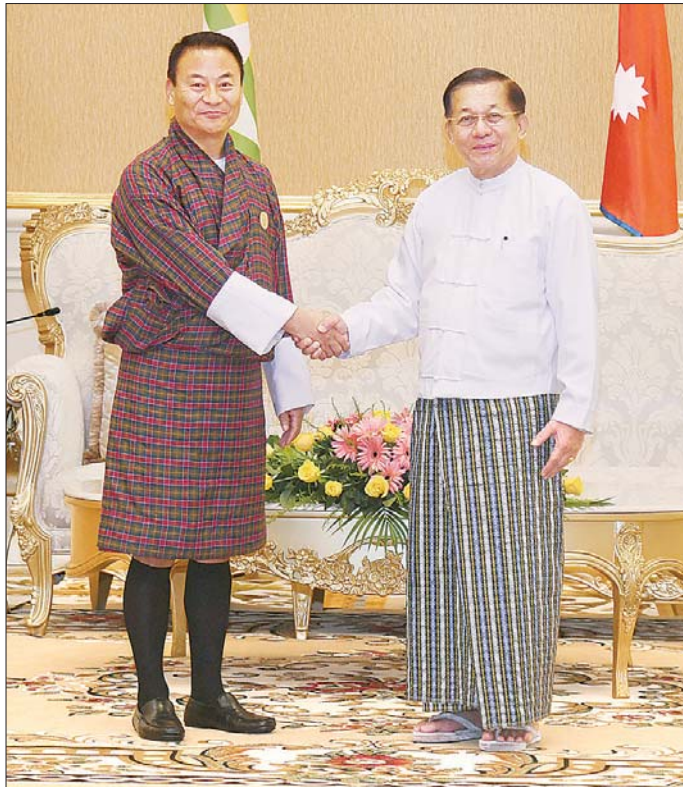
နိုင်ငံတော်စီမံအုပ်ချုပ်ရေးကောင်စီဥက္ကဋ္ဌ နိုင်ငံတော်ဝန်ကြီးချုပ် ဗိုလ်ချုပ်မှူးကြီး မင်းအောင်လှိုင် အမျိုးသားလုံခြုံရေးဆိုင်ရာ အကြီးအကဲ ဘူတန်နိုင်ငံမှ Mr. Sonam Wangyel အား ရင်းရင်းနှီးနှီး နှုတ်ဆက်စဉ်။

စာမျက်နှာ ၃ မှ အမျိုးသားလုံခြုံရေးဆိုင်ရာ အကြီးအကဲများ၊ ကိုယ်စားလှယ်များနှင့် ဘင်းမိစတက် အတွင်း ရေးမှူးချုပ်တို့က ဘင်းမိစတက်အဖွဲ့အစည်းနှင့်