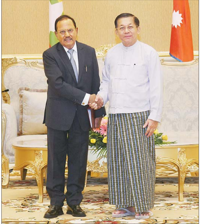
နိုင်ငံတော်စီမံအုပ်ချုပ်ရေးကောင်စီဥက္ကဋ္ဌ နိုင်ငံတော်ဝန်ကြီးချုပ် ဗိုလ်ချုပ်မှူးကြီး မင်းအောင်လှိုင် အမျိုးသားလုံခြုံရေးဆိုင်ရာ အကြီးအကဲ အိန္ဒိယနိုင်ငံမှ H.E. Shri Ajit Doval အား ရင်းရင်းနှီးနှီး နှုတ်ဆက်စဉ်။

❖ မြန်မာနိုင်ငံက အိမ်ရှင်အဖြစ်လက်ခံကျင်းပမည့် စတုတ္ထအကြိမ်မြောက် ဘင်းမိစတက် အမျိုးသားလုံခြုံရေးဆိုင်ရာ အကြီးအကဲများအစည်းအဝေးကို ပွင့်လင်းမြင်သာမှုရှိစွာ နှင့် အောင်မြင်စွာကျင်းပနိုင်ရေးကိစ္စရပ်များ၊ ထိုင်းနိုင်ငံတွင်ကျင်းပမည့် ဘင်းမိစတက် ထိပ်သီးအစည်းအဝေး အောင်မြင်စွာကျင်းပနိုင်ရေးကိစ္စရပ်များ၊ မြန်မာနိုင်ငံ၏ နိုင်ငံရေးဖြစ်ပေါ်တိုးတက်ပြောင်းလဲလာမှုအခြေအနေများနှင့် လွတ်လပ်ပြီး တရားမျှတသည့် ပါတီစုံဒီမိုကရေစီအထွေထွေရွေးကောက်ပွဲ အောင်မြင်စွာကျင်းပနိုင်ရေး ကြိုတင်ပြင်ဆင်ဆောင်ရွက်လျက်ရှိမှုအခြေအနေများနှင့် စပ်လျဉ်း၍ ရင်းရင်းနှီးနှီးဆွေးနွေး