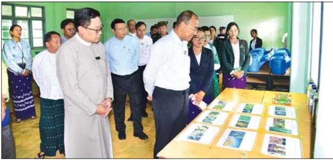
ရှမ်းလင်းတင်ပြကြပြီး ပြည်နယ် ဝန်ကြီးချုပ် ဦးအောင်အောင်က လိုအပ်သည်များ ဖြည့်စွက်

ပင်းတယ် ဇူလိုင် ၂၅ ဇုန် ကိုယ်ပိုင်အုပ်ချုပ်ခွင့်ရဒေသ ပင်းတယ်မြို့နယ်နန်းကျေးရွာ အုပ်စု ငမိန်းအင်းတွင်းအတွင်း မွေးမြူရေးဇုန် စီမံကိန်းဆောင် ရွက်မည့်နေရာသို့ ဇူလိုင် ၂၃ ရက် က ရှမ်းပြည်နယ်ဝန်ကြီးချုပ် ဦးအောင်အောင်၊ မြို့နယ်အဆင့် ဌာနဆိုင်ရာ တာဝန်ရှိသူများက ကွင်းဆင်းကြည့်ရှု စစ်ဆေးသည်။ မွေးမြူရေးဇုန် စီမံကိန်း နှင့် ပတ်သက်၍ သက်ဆိုင်ရာ ပြည်နယ်၊ မြို့နယ်အဆင့် ဌာန ဆိုင်ရာများက မြေယာ၊ လျှပ်စစ် မီး၊ ရေလမ်းစသည့်ကဏ္ဍအလိုက်