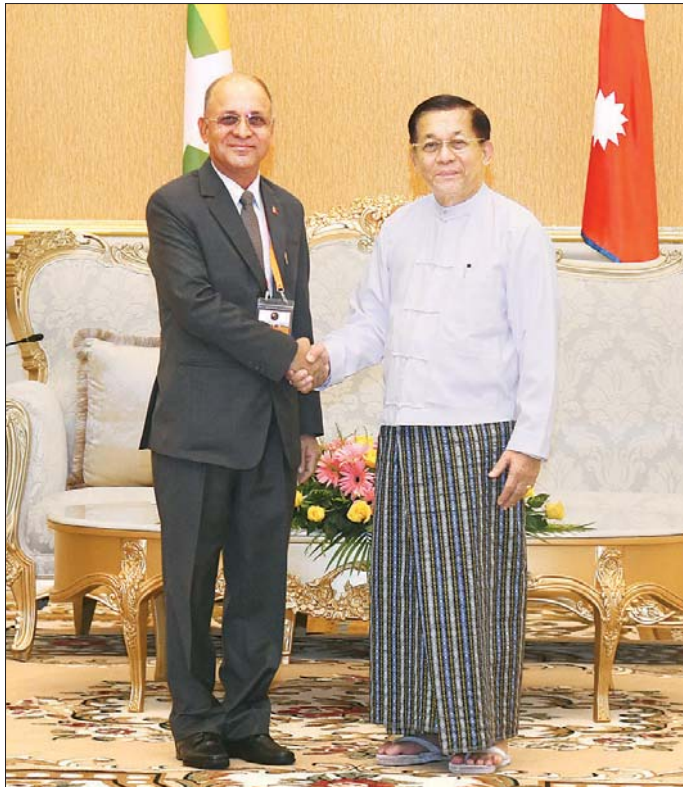
နိုင်ငံတော်စီမံအုပ်ချုပ်ရေးကောင်စီဥက္ကဋ္ဌ နိုင်ငံတော်ဝန်ကြီးချုပ် ဗိုလ်ချုပ်မှူးကြီး မင်းအောင်လှိုင် အမျိုးသားလုံခြုံရေးဆိုင်ရာအကြီးအကဲ နီပေါနိုင်ငံမှ H.E. Mr. Harishchandra Ghimire အား ရင်းရင်းနှီးနှီး နှုတ်ဆက်စဉ်။

ပတ်သက်၍ ပူးပေါင်းဆောင်ရွက်နေမှုနှင့် ရင်ဆိုင် ကြုံတွေ့နေရသည့် စိန်ခေါ်မှုများ၊ ယင်းစိန်ခေါ်မှုများကို ပူးပေါင်းအဖြေရှာ၍ မြေရှင်းဆောင်ရွက်သွားရမည့် အခြေအနေများနှင့်ပတ်သက်၍ တစ်ဦးချင်း