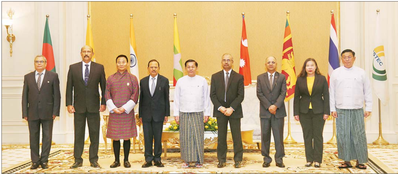
နိုင်ငံတော်စီမံအုပ်ချုပ်ရေးကောင်စီဥက္ကဋ္ဌ နိုင်ငံတော်ဝန်ကြီးချုပ် ဗိုလ်ချုပ်မှူးကြီး မင်းအောင်လှိုင် ဘင်းမိစတက်အဖွဲ့ဝင်နိုင်ငံများမှ အမျိုးသားလုံခြုံရေးဆိုင်ရာအကြီးအကဲများ၊ ကိုယ်စားလှယ်များ၊ ဘင်းမိစတက် အတွင်းရေးမှူးချုပ်တို့နှင့်အတူ စုပေါင်းမှတ်တမ်းတင်ဓာတ်ပုံရိုက်စဉ်။