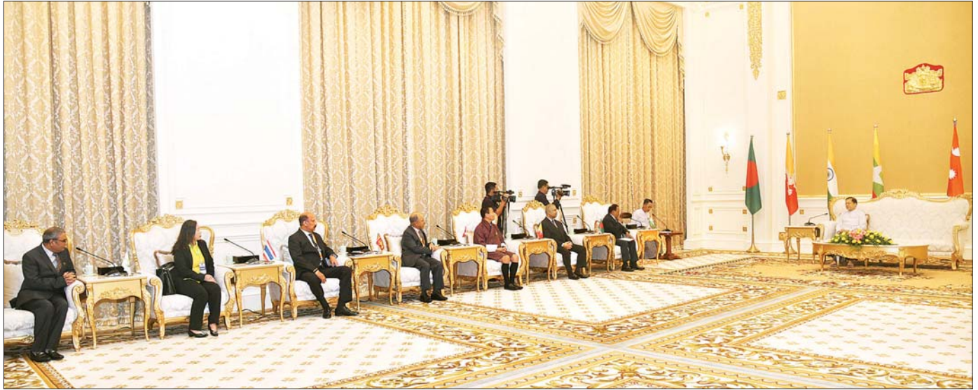
နိုင်ငံတော်စီမံအုပ်ချုပ်ရေးကောင်စီဥက္ကဋ္ဌ နိုင်ငံတော်ဝန်ကြီးချုပ် ဗိုလ်ချုပ်မှူးကြီး မင်းအောင်လှိုင် ထံ အတွင်းရေးမှူးချုပ်တို့က လာရောက်ဂရုပြုတွေ့ဆုံစဉ်။

❖ ရှေ့ဖွံ့ဖြိုးမှု အဆိုပါတွေ့ဆုံပွဲသို့ နိုင်ငံတော်စီမံအုပ်ချုပ်ရေးကောင်စီဥက္ကဋ္ဌ နိုင်ငံတော်ဝန်ကြီးချုပ်နှင့်အတူ ကောင်စီတွဲဖက်အတွင်းရေးမှူး ဒုတိယဗိုလ်ချုပ်ကြီး ရဲဝင်းဦး၊ ပြည်ထဲရေးဝန်ကြီးဌာန ပြည်ထောင်စုဝန်ကြီး ဒုတိယဗိုလ်ချုပ်ကြီး ရာပြည့်၊ ဒုတိယဝန်ကြီးချုပ်နှင့် နိုင်ငံခြားရေးဝန်ကြီးဌာန ပြည်ထောင်စုဝန်ကြီးဦးသန်းဆွေ၊ နိုင်ငံတော်စီမံအုပ်ချုပ်ရေးကောင်စီဥက္ကဋ္ဌရုံးဝန်ကြီးဌာန (၁) ပြည်ထောင်စုဝန်ကြီးဗိုလ်ချုပ်ကြီး မိုးအောင်၊ စိုက်ပျိုးရေး၊ မွေးမြူရေးနှင့် ဆည်မြောင်းဝန်ကြီးဌာန ပြည်ထောင်စုဝန်ကြီးဦးမင်းနောင်နှင့် တာဝန်ရှိသူများတက်ရောက်ကြပြီး အမျိုးသားလုံခြုံရေးဆိုင်ရာ အကြီးအကဲများဖြစ်ကြသည့် အိန္ဒိယနိုင်ငံမှ H.E. Shri Ajit Doval ၊