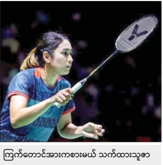
ကြက်တောင်အားကစားမယ် သက်ထားသူဇာ

ရန်ကုန် ဇူလိုင် ၂၅ ပြင်သစ်နိုင်ငံ၌ ကျင်းပလျက်ရှိသည့် ၂၀၂၄ ပါရီအိုလံပစ် ကြက်တောင်ပြိုင်ပွဲကို ဇူလိုင် ၂၇ ရက်တွင် စတင်ကျင်းပမည်ဖြစ်ပြီး မြန်မာ ကြက်တောင်အားကစားမယ် သက်ထားသူဇာသည် ကမ္ဘာ့အဆင့်- ၅ ရှိ ဂျပန်နိုင်ငံသူနှင့် အုပ်စုအဖွင့်ပွဲ ကစားရမည်ဖြစ်သည်။ ကြက်တောင်ပြိုင်ပွဲ အုပ်စုပွဲစဉ်များကို ဇူလိုင် ၂၇ ရက်တွင် စာမျက်နှာ ၁၆ ကော်လံ ၁ *