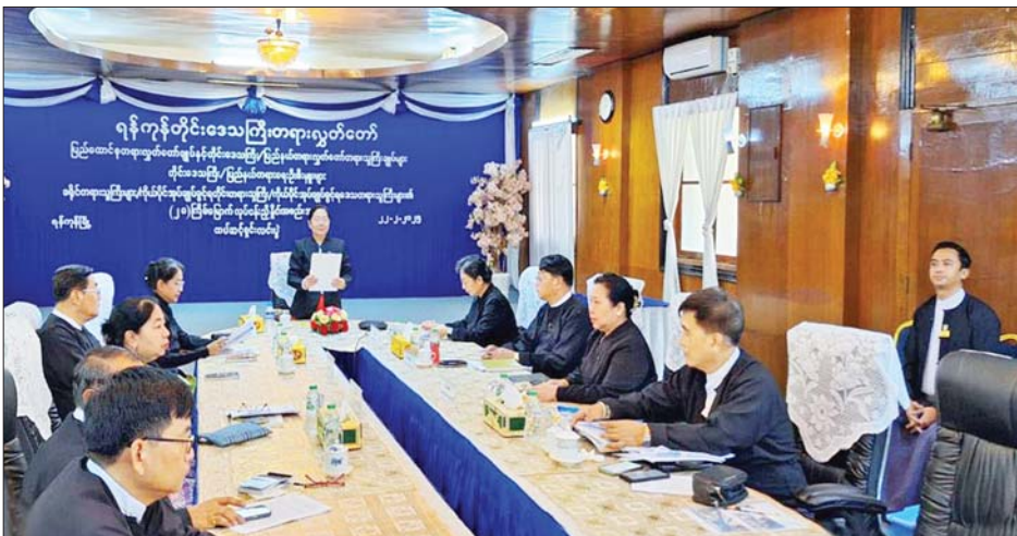
လွှတ်တော် အစည်းအဝေးခန်းမ၌ Virtual ဖြင့် ကျင်းပသည်။ ထပ်ဆင့် ရှင်းလင်းပွဲတွင် ရန်ကုန်တိုင်းဒေသကြီး တရား လွှတ်တော် တရားသူကြီးချုပ် ဒေါ်စန္ဒာသွယ်က ပြည်ထောင်စု တရားသူကြီးချုပ်နှင့် ပြည်ထောင် စုတရားလွှတ်တော်ချုပ် တရားသူ ကြီးများ၏ လမ်းညွှန်မှာကြား ချက်များပါ တရားစီရင်ရေးနှင့် တရားရုံး စီမံခန့်ခွဲရေးဆိုင်ရာ လုပ်ငန်းများကို ဆောင်ရွက် ရာတွင် ဥပဒေလုပ်ထုံးလုပ်နည်း များ၊ ညွှန်ကြားချက်များနှင့်အညီ တိတိကျကျ လိုက်နာဆောင်ရွက် ကြရန်၊ နိုင်ငံတော်လိုခြံရေး၊ တရားဥပဒေစိုးမိုးရေး ထိခိုက်စေ သည့်အမှုများကို လေးလေးနက် နက်ထားပြီး စဉ်းစားဆောင်ရွက် ကြရန်လိုကြောင်း၊ Judicial Collage ကို အာဆီယံ ဒေသ

ရန်ကုန် ဖေဖော်ဝါရီ ၂၄ နေပြည်တော်ရှိ ပြည်ထောင်စု တရားလွှတ်တော်ချုပ် တွင် ဖေဖော်ဝါရီ ၁၃ ရက် မှ ၁၄ ရက် အထိ Virtual စနစ်ဖြင့် ကျင်းပခဲ့ သော ပြည်ထောင်စုတရား လွှတ်တော်ချုပ်နှင့်တိုင်းဒေသကြီး/ ပြည်နယ် တရားလွှတ်တော်တရား သူကြီးချုပ်များ၊ တိုင်းဒေသကြီး/ ပြည်နယ် တရားရေးဦးစီးမှူးများ၊ ကိုယ်ပိုင်အုပ်ချုပ်ခွင့်ရ တိုင်း တရားသူကြီး/ ကိုယ်ပိုင်အုပ်ချုပ် ခွင့်ရဒေသ တရားသူကြီးများ/ ခရိုင်တရား သူကြီးများ၏ (၂၈) ကြိမ်မြောက် လုပ်ငန်းညှိနှိုင်း အစည်းအဝေးတွင် လမ်းညွှန် မှာကြားချက်များအပေါ် ထပ်ဆင့် ရှင်းလင်းသည့် အခမ်းအနားကို ဖေဖော်ဝါရီ ၂၂ ရက် နံနက်ပိုင်းက ရန်ကုန်တိုင်းဒေသကြီး တရား