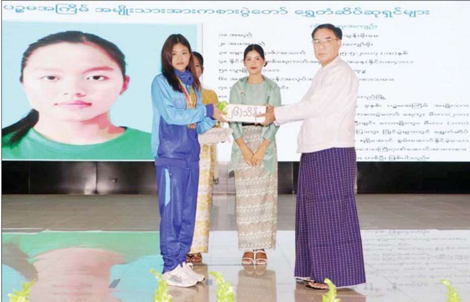
ကြေးတံဆိပ်အခု ၇၀ ရရှိခဲ့သည့် ဂုဏ်ပြုပွဲကျင်းပ ပေးရခြင်းဖြစ် ကိုယ်စားပြု အားကစားသမား ကြောင်း၊ တိုင်းဒေသကြီး များ၊ နည်းပြ/ အုပ်ချုပ်သူများ

ပဲခူး ဖေဖော်ဝါရီ ၂၄ ပဲခူးမြို့ မြို့တော်ခန်းမ၌ ယနေ့နံနက်ပိုင်းက ၂၀၂၄ ခုနှစ် ပဉ္စမအကြိမ် အမျိုးသားအားကစား ပွဲတော်တွင် အားကစားနည်း အလိုက် ရွှေ၊ ငွေ၊ ကြေး ဆုတံဆိပ်ရရှိခဲ့သော ပဲခူးတိုင်း ဒေသကြီး ကိုယ်စားပြုအားကစား သမားများ၊ အုပ်ချုပ်သူ/နည်းပြ များအား ဂုဏ်ပြုပွဲ ကျင်းပသည်။ ဦးစွာ ပဲခူးတိုင်းဒေသကြီး ဝန်ကြီးချုပ် ဦးမျိုးဆွေဝင်းက ၂၀၂၄ ခုနှစ် ပဉ္စမအကြိမ် အမျိုးသား အားကစားပွဲတော်၌ ပဲခူးတိုင်း ဒေသကြီးမှ အားကစားနည်း ၂၃ နည်းတွင် မသန်စွမ်းအားကစား သမားများအပါအဝင် ရွှေတံဆိပ် ၂၆ ခု၊ ငွေတံဆိပ်အခု ၄၀ နှင့်