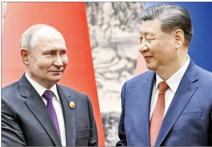
ခြားရေးမူဝါဒများသည် ရေရှည်ဆက်ဆံ ဖြစ်ကြောင်း ရှိက ပြောကြားခဲ့သည်။ ရေးအတွက် မျှော်မှန်းဆောင်ရွက်ခြင်း တရုတ်နိုင်ငံအနေဖြင့် ငြိမ်းချမ်းရေး

ပေကျင်း ဖေဖော်ဝါရီ ၂၄ တရုတ်သမ္မတရီကျင့်ဖျင်နှင့် ရုရှား သမ္မတဗလာဒီမာပူတင်တို့ ယနေ့တွင် ရုရှား-ယူကရိန်း အရေးအပါအဝင် ကမ္ဘာလုံးဆိုင်ရာကိစ္စရပ်များကို ဖုန်းဖြင့် အမြင်ချင်းဖလှယ် ဆွေးနွေးခဲ့ကြောင်း သိရသည်။