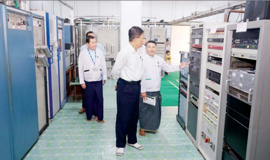
ဆောက်လုပ်ပေးထားသော ဘက်စုံသုံးခန်းမတို့ကို ကြည့်ရှုစစ်ဆေးသည်။ ယင်းနောက် ပြည်နယ်မှူးနှင့် ဝန်ထမ်းများ၊ ခရိုင် ရုံးဝန်ထမ်းများ၊ ဖာပွန်မြို့နယ်၊ ကော့ကရိတ်မြို့နယ်၊ လှိုင်းဘွဲ့မြို့နယ်၊ ရှမ်းရွာသစ်မြို့နှင့် ပိုင်ကျုံမြို့တို့မှ ဦးစီးမှူးများအား တွေ့ဆုံ၍ လုပ်ငန်းဆိုင်ရာများ မှာကြားသည်။ ထိုသို့ မှာကြားရာတွင် မြဝတီခရိုင် ဦးစီးမှူးနှင့် ကျန်မြို့နယ်များမှ ဦးစီးမှူးများကလည်း ဗီဒီယို ကွန်ဖရင့်စနစ်ဖြင့် တက်ရောက်ကြသည်။

မော်လမြိုင် ဖေဖော်ဝါရီ ၂၄ ပြန်ကြားရေးဝန်ကြီးဌာန ဒုတိယဝန်ကြီး ဦးရဲတင့်သည် ယမန်နေ့ နံနက်ပိုင်းက ကရင်ပြည်နယ် တိုင်းရင်းသားရေးရာဝန်ကြီး ဦးစန်းကို၊ ပြည်နယ် ပြန်ကြားရေးနှင့် ပြည်သူ့ဆက်ဆံရေးဦးစီးဌာန ညွှန်ကြားရေးမှူးတို့နှင့်အတူ ဘားအံမြို့၊ မြန်မာ့ အသံနှင့် ရုပ်မြင်သံကြားထပ်ဆင့်လွှင့်စက်ရုံကို ကြည့်ရှုစစ်ဆေးပြီး စက်ရုံမှူးနှင့် ဝန်ထမ်းများ၊ သတင်းဌာနခွဲမှ ဝန်ထမ်းများအား တွေ့ဆုံမှာကြား သည်။ စာအုပ်စာစောင်များလှူဒါန်း ထို့နောက် လှာကပြင်ကျေးရွာရှိ စာကြည့်တိုက် များ ဖွံ့ဖြိုးတိုးတက်ရေးအစီအစဉ်ဖြင့် ဆောက်လုပ် ဖွင့်လှစ်ပြီးဖြစ်သော “အလင်းတိုက်” စာကြည့်တိုက် ကို ကြည့်ရှုအားပေးပြီး ရုပ်မိရပ်ဖများ၊ စာကြည့်တိုက် များနှင့် တာဝန်ရှိသူများအား တွေ့ဆုံ၍ အားပေး မှာကြားကာ စာအုပ်စာစောင်များ လှူဒါန်းသည်။ ဆက်လက်၍ ဘားအံခရိုင် ပြန်ကြားရေးနှင့် ပြည်သူ့ဆက်ဆံရေးဦးစီးဌာနရုံးသို့ ရောက်ရှိပြီး စာကြည့်တိုက်နှင့် ပြည်နယ်အစိုးရအဖွဲ့ အစီအစဉ်ဖြင့်