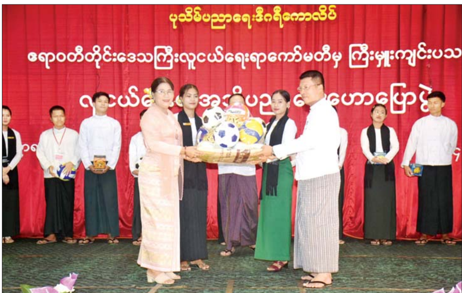
ဒေသကြီးဝန်ကြီးချုပ်က အားကစားပစ္စည်းများ နှစ်ဦးအား ဂုဏ်ပြုလက်ဆောင်များ ပေးအပ်ခဲ့ပြီး လက်ဆောင်ပေးအပ်ခဲ့သည်။ ထို့နောက် တိုင်းဒေသကြီး ဝန်ကြီးချုပ်က လူငယ်ရေးရာ အသိပညာပေးဟောပြောပေးခဲ့ကြသည့် ဆရာ ဆရာမ နှစ်ဦးအား ဂုဏ်ပြုလက်ဆောင်များ ပေးအပ်ခဲ့ပြီး ပုသိမ်ပညာရေးဒီဂရီကောလိပ်သို့ အားကစားပစ္စည်းများ ပေးအပ်လှူဒါန်းခဲ့ကြောင်း သိရသည်။ တိုင်းဒေသကြီး(ပြန်/ဆက်)