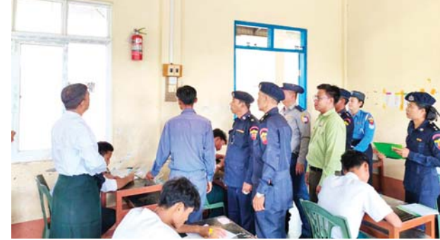
မိုးဟိန်းထက်

လိုအပ်သည်များ စစ်ဆေးသည်။ စစ်ဆေးရာတွင် စာသင်ကျောင်းများ၌ မီးသတ်ဆေးဘူးထားရှိမှု၊ လျှပ်စစ်သွယ်တန်းသုံးစွဲမှု၊ မီးသုံးစွဲမှု၊ မီးဘေးတားဆီးကာကွယ်ရေး ပစ္စည်းများ ထားသိုသုံးစွဲမှုအခြေအနေများကို စစ်ဆေးကာ လိုအပ် သည်များ လိုက်နာဆောင်ရွက်ကြရန်အသိပညာပေးပြောကြားခဲ့ကြောင်း သိရသည်။