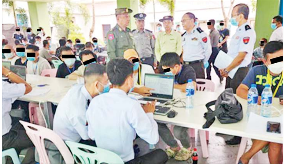
ထိန်းသိမ်းထားသည့် ပြည်ပနိုင်ငံသားများကို သက်ဆိုင်ရာနိုင်ငံများသို့ ပြန်လည်လွှဲပြောင်းပေးနိုင်ရေး ကိုယ်ရေးအချက်အလက်များနှင့် မှတ်တမ်းများ စာရင်းကောက်ယူခြင်းလုပ်ငန်းများ ဆောင်ရွက်စဉ်။