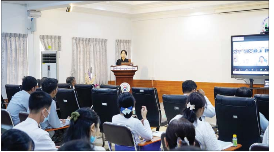
ယင်းနောက် တာဝန်ရှိသူများက ရာဇသတ်ကြီး၊ ဂရုပြုလိုက်နာသည်များကို ရှင်းလင်းဆွေးနွေးကြ မှူးယစ်ဆေးဝါးနှင့် စိတ်ကိုပြောင်းလဲစေသော ရာ တက်ရောက်လာကြသူများက သိရှိလိုသည်များ မေးမြန်းဆွေးနွေးခဲ့ကြကြောင်း သိရသည်။ သတင်းစဉ်

ထို့နောက် ရန်ကုန်တိုင်းဒေသကြီးဥပဒေချုပ် က စစ်မှန်သောစည်းကမ်းပြည့်ဝသည့် ပါတီစုံဒီမို ကရေစီစနစ် ပေါ်ပေါက်ရေးအတွက် ပြဋ္ဌာန်းထားသည့် ဥပဒေများကို လူတိုင်းသိရှိရန်လိုအပ်ကြောင်း၊ ဥပဒေအသိပညာသိရှိမှသာ လူမှုဘဝကို အကျိုးရှိစွာ အသုံးပြုနိုင်မည်ဖြစ်ကြောင်း ပြောကြားသည်။