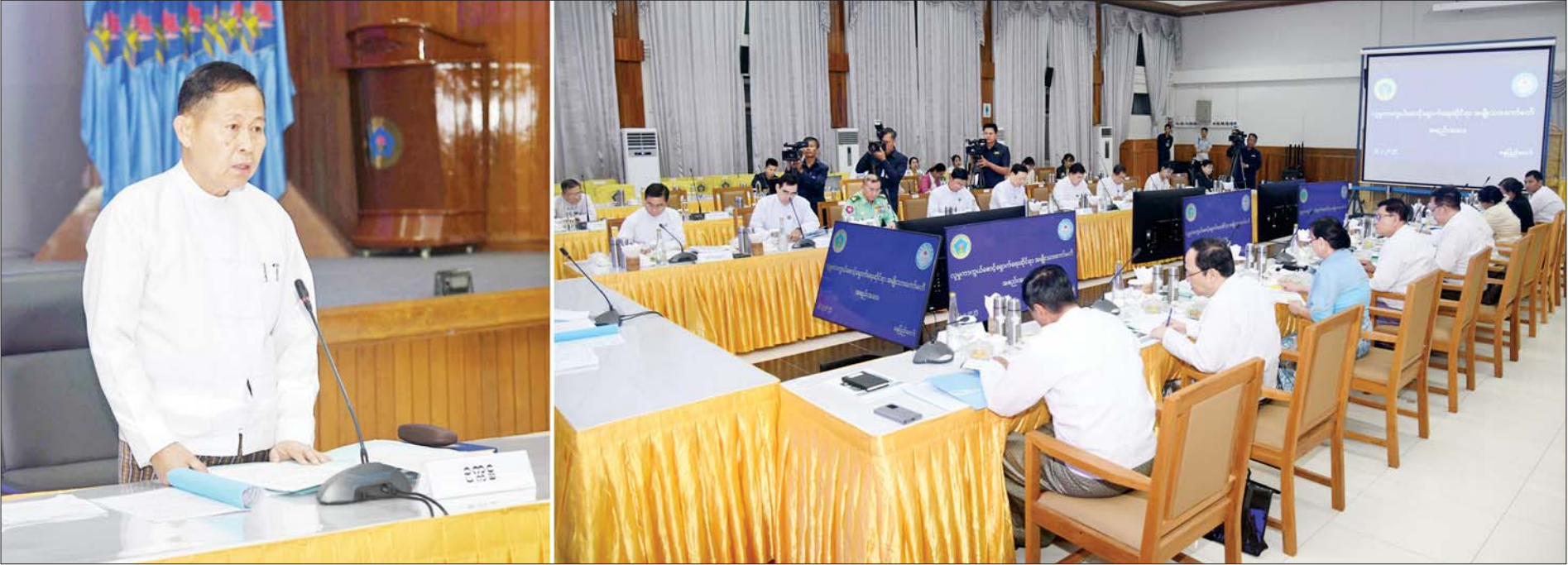
နိုင်ငံတော်စီမံအုပ်ချုပ်ရေးကောင်စီ ဒုတိယဥက္ကဋ္ဌ ဒုတိယဝန်ကြီးချုပ် ဒုတိယဗိုလ်ချုပ်မှူးကြီးစိုးဝင်း လူမှုကာကွယ်စောင့်ရှောက်ရေးဆိုင်ရာ အမျိုးသားကော်မတီအစည်းအဝေးတွင် အမှာစကားပြောကြားစဉ်။