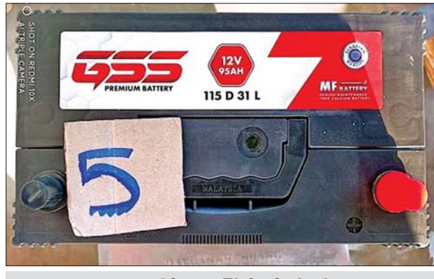
မန္တလေးတိုင်းဒေသကြီး၌ ဖမ်းဆီးရမိမှု။