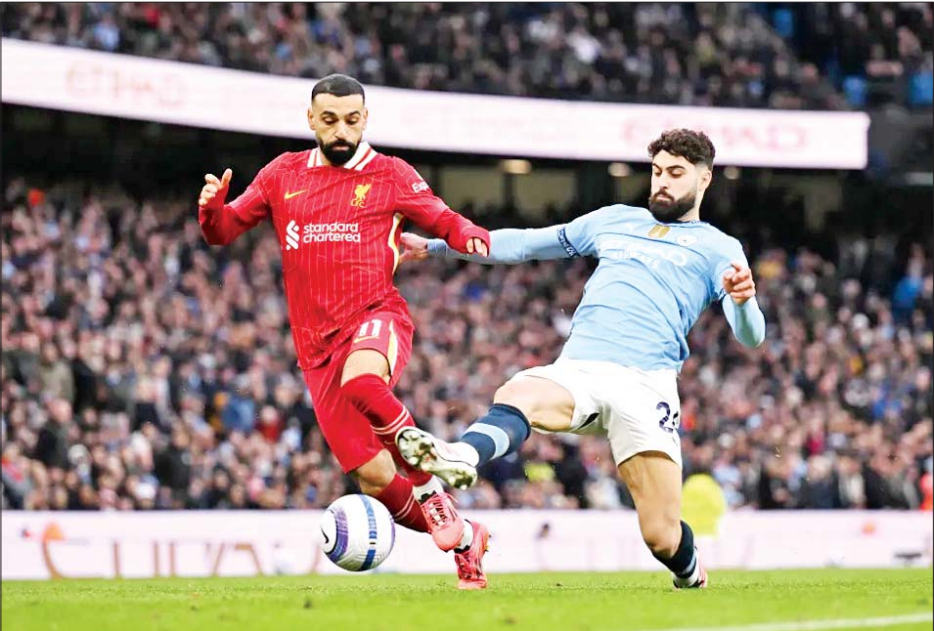
မန်စီးတီးအသင်းနှင့် လီဗာပူးအသင်းတို့ ယှဉ်ပြိုင်ကစားကြစဉ်။

ပရီမီယာလိဂ် ပွဲစဉ်(၂၇)အဖြစ် ဖေဖော်ဝါရီ ၂၃ ရက် ညပိုင်းက ယှဉ်ပြိုင်ကစားခဲ့တဲ့ မန်စီးတီးအသင်းနဲ့ လီဗာပူးအသင်းတို့ပွဲစဉ်မှာ လီဗာပူးအသင်းက မန်စီးတီးအသင်းကို နှစ်ဂိုးပြတ်နဲ့ အနိုင်ရရှိခဲ့တာကြောင့် ဇယားထိပ်ဆုံးမှာ ဆက်လက်ဦးဆောင်ခွင့် ရရှိခဲ့ပါတယ်။ မန်စီးတီးအသင်းနဲ့ လီဗာပူးအသင်းတို့ရဲ့ ပွဲစဉ်မှာ လီဗာပူးအသင်းအတွက် သွင်းဂိုးတွေကို ပထမပိုင်းပွဲကစားချိန် ၁၄ မိနစ်မှာ မိုဟာမက်ဆာလာက တစ်ဂိုး၊ ၃၇ မိနစ်မှာ ဇိုဘိုဆလိုင်ကတစ်ဂိုး သွင်းယူပေးခဲ့တာ ဖြစ်ပါတယ်။ စာမျက်နှာ ၂၂ ကော်လံ ၁ သို့ ❖