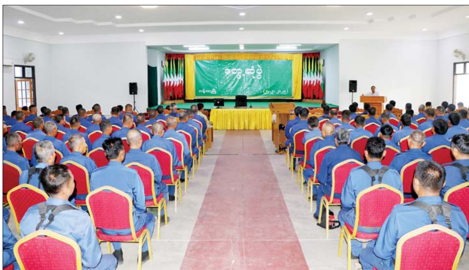
ဆက်လက်ပြီး တိုင်းဒေသကြီးအစိုးရအဖွဲ့ဝင်များ နှင့် တိုင်းဒေသကြီးအဆင့် ဌာနဆိုင်ရာများက ကန့်ဘလူမြို့နှင့် ကျွန်းလှမြို့တို့မှ မြို့နယ်အဆင့် ဌာနဆိုင်ရာဝန်ထမ်းများ၊ မြို့လုံခြုံရေးတာဝန် ထမ်းဆောင်နေကြသည့်အဖွဲ့များအား ချီးမြှင့်ငွေများ ပေးအပ်ချီးမြှင့်ကြသည်။

မုံရွာ ဖေဖော်ဝါရီ ၂၄ စစ်ကိုင်းတိုင်းဒေသကြီးဝန်ကြီးချုပ် ဦးမြတ်ကျော် သည် တာဝန်ရှိသူများနှင့်အတူ ဖေဖော်ဝါရီ ၂၄ ရက် နံနက်ပိုင်းတွင် ကန့်ဘလူခရိုင်စုပေါင်းရုံးရှိ ရွှေဆည်မြိုင်ခန်းမ၌ ကျင်းပသည့် ကန့်ဘလူခရိုင်/ မြို့နယ်အဆင့် ဌာနဆိုင်ရာများနှင့် တွေ့ဆုံပွဲ အခမ်းအနားသို့ တက်ရောက်ကြသည်။