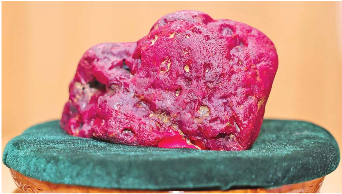
မိုးကုတ်ရတနာမြေမှ ရှာဖွေတွေ့ရှိသည့် ထူးခြားလှပပြီး အရွယ်အစားကြီးမားသော အလေးချိန် ၂၂၀၀ ဂရမ်(၁၁၀၀၀ ကရက်)ရှိ ပတ္တမြားကြီးအား တွေ့ရစဉ်။

အခမ်းအနားတက်ရောက်လာကြသူများ သည် ပတ္တမြားကြီးအား ကြည့်ရှုကြသည်။ ယခုရှာဖွေတွေ့ရှိခဲ့သော ပတ္တမြားသည် အလေးချိန် ၂၂၀၀ ဂရမ် (၁၁၀၀၀ ကရက်) ရှိသဖြင့် အရွယ်အစားကြီးမားသောကြောင့်