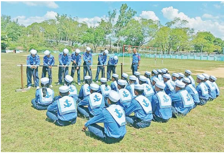
ရေကြောင်းလူငယ်အခြေခံသင်တန်းနှင့်တန်းမြင့်သင်တန်းတို့မှ သင်တန်းသား၊ သင်တန်းသူများ ရေတပ်သားဘာသာရပ်ဆိုင်ရာ ကြိုးချည်ကြိုးထိုးသင်ခန်းစာများ လေ့ကျင့်သင်ကြားနေမှုကိုတွေ့ရစဉ်။