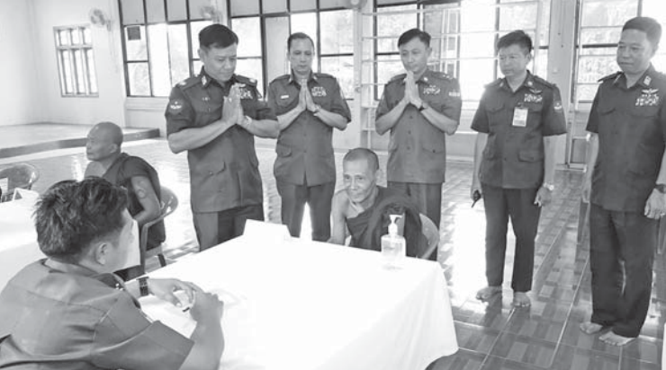
သံဃာတော်များအား မြောက်ပိုင်းတိုင်းစစ်ဌာနချုပ် နယ်လှည့်ဆေးကုသရေးအဖွဲ့ က ကျန်းမာရေးစောင့်ရှောက်မှုလုပ်ငန်းများဆောင်ရွက်ပေးရာ တာဝန်ရှိသူများက ကြည့်ရှုဖူးမြော်စဉ်။

နေပြည်တော် မေ ၇ တပ်မတော်အနေဖြင့် တိုင်းရင်းသား ပြည်သူများ၏ ကျန်းမာရေးစောင့်ရှောက်မှု လုပ်ငန်းများတွင် နိုင်ငံတော်အစိုးရနှင့်အတူ တစ်ဖက်တစ်လမ်းမှ ကူညီစောင့်ရှောက်မှု များဆောင်ရွက်ပေးလျက်ရှိရာ တိုင်းဒေသ ကြီးနှင့်ပြည်နယ်အသီးသီးရှိ တပ်မတော် နယ်လှည့်ဆေးကုသရေးအဖွဲ့များက ဒေသ အသီးသီးရှိ ဒေသခံတိုင်းရင်းသားပြည်သူ များကို ၎င်းတို့၏ မြို့နယ်၊ ကျေးရွာများ အရောက်သွားရောက်၍ လူမျိုး၊ ဘာသာ မရွေးဆေးကုသပေးခြင်းများ ဆောင်ရွက် ပေးလျက်ရှိသည်။ ထိုသို့ ဆောင်ရွက်ပေးလျက်ရှိရာ ယနေ့တွင် မြောက်ပိုင်းတိုင်းစစ်ဌာနချုပ်၊ နယ်လှည့်ဆေးကုသရေးအဖွဲ့က ကချင် ပြည်နယ်၊ မြစ်ကြီးနားမြို့ရှိ အဘယာရာမ ပရိယတ္တိစာသင်တိုက်၌ အခြေပြု၍ သံဃာ တော် ၃၀ ပါးတို့ကို ခွဲစိတ်ကုသမှုဆိုင်ရာ