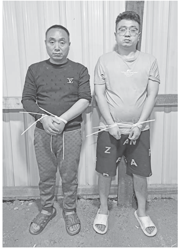
ရှမ်းပြည်နယ် (တောင်ပိုင်း) မိုင်းပန်မြို့နယ် အတွင်း မေလ ၆ ရက်နေ့တွင် တရားမဝင် အွန်လိုင်း လောင်းကစားမှု ကျူးလွန်သူ တရုတ် နိုင်ငံသား အမျိုးသား နှစ်ဦး ဖမ်းဆီး ရမိစဉ်။

အကွာ၌ တရားမဝင် အွန်လိုင်းလောင်းကစားမှုကျူးလွန်သူ တရုတ်နိုင်ငံသား အမျိုးသား ၂ ဦးအား ဖမ်းဆီးရမိခဲ့သည်။ ထို့ပြင် နယ်မြေအတွင်း အွန်လိုင်းလိမ်လည်လောင်းကစားမှုများ မရှိစေရေးအတွက် လုံခြုံရေးတပ်ဖွဲ့ဝင်များ၏ ရှာဖွေဖော်ထုတ်မှုများကြောင့် ယနေ့ညနေပိုင်းတွင် မိုင်းပန်မြို့၏မြောက်ဘက် မီတာ ၁၂၃၀၀ ခန့် အကွာတွင် တရားမဝင်အွန်လိုင်းလောင်းကစားမှုကျူးလွန်သူ တရုတ်နိုင်ငံသား ၁ ဦးအား ထပ်မံဖော်ထုတ်ဖမ်းဆီးနိုင်ခဲ့သည်။ အဆိုပါ အွန်လိုင်းလိမ်လည်လောင်းကစားမှုကျူးလွန်ရာတွင် ပါဝင်ပတ်သက်ခဲ့သည့် တရားမဝင်ပြည်ပနိုင်ငံသားများအား လိုအပ်သည့်စစ်ဆေးမှုများ ဆောင်ရွက်ပြီးစီးပါက တည်ဆဲဥပဒေများနှင့်အညီ ထိရောက်ပြင်းထန်စွာ အရေးယူဆောင်ရွက်သွားမည်ဖြစ်ကြောင်း သိရှိရသည်။ နိုင်ငံတော်အနေဖြင့် အွန်လိုင်းလိမ်လည်လောင်းကစားမှု ကျူးလွန်ခြင်းများပပျောက်စေရေးနှင့် မြန်မာနိုင်ငံအတွင်း အခြေချလုပ်ကိုင်နိုင်မှုမရှိစေရေးအတွက် အိမ်နီးချင်းနိုင်ငံများ၊ ဒေသတွင်းနိုင်ငံများ၊ နိုင်ငံတကာအဖွဲ့အစည်းများနှင့်ပူးပေါင်း၍ အွန်လိုင်းလိမ်လည်လောင်းကစားမှုတိုက်ဖျက်ရေးလုပ်ငန်းစဉ်များကို တက်ကြွစွာဆက်လက်ဆောင်ရွက်လျက်ရှိကြောင်း သတင်းရရှိသည်။ (၁၀၀)