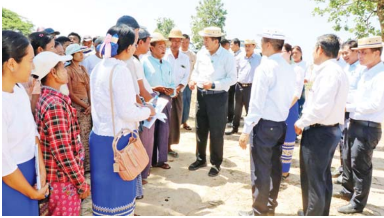
နေပြည်တော် မေ ၇

သမဝါယမနှင့် ကျေးလက်ဖွံ့ဖြိုးရေး ဝန်ကြီးဌာန ပြည်ထောင်စုဝန်ကြီး