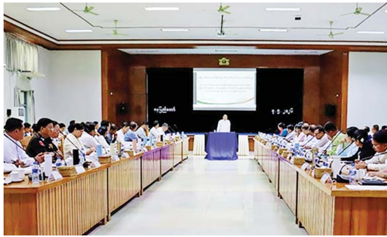
ဦးအောင်ကျော်ဟိုင်းက ပြည်ထောင်စုအဆင့် များအနေဖြင့် ရင်းနှီးမြှုပ်နှံမှုလုပ်ငန်းများနှင့် အဖွဲ့အစည်းများ၊ ပြည်ထောင်စုဝန်ကြီးဌာန စပ်လျဉ်း၍ ဌာန သို့မဟုတ် အဖွဲ့အစည်းက

စီမံခန့်ခွဲပိုင်ခွင့်ရှိသည့် မြေ၊ အဆောက်အအုံ နှင့် အခြားပိုင် ဆိုင်ပစ္စည်းများကို နှစ်တို၊ နှစ်ရှည် ငှားရမ်းခွင့်ပြုရာတွင် လုပ်ထုံး လုပ်နည်းများ တစ်ပြေးညီဖြစ်စေခြင်းမှ တစ်ဆင့် ပေါင်းစပ်ညှိနှိုင်း ဆောင်ရွက်ရ သည့် ဝန်ကြီးဌာနများအချင်းချင်း အကြား လုပ်ထုံးလုပ်နည်းများ ပိုမိုပွင့်လင်းမြင်သာ မှုရှိလာစေပြီး ပြည်တွင်း/ ပြည်ပ ရင်းနှီး မြှုပ်နှံမှု လုပ်ငန်းများ ပိုမိုတိုးတက်လာ နိုင် သည့် အကျိုးကျေးဇူးများ ရရှိ လာ မည်ဖြစ်ကြောင်း၊ နိုင်ငံတော်၏ ရင်းနှီးမြှုပ်နှံ မှုဆိုင်ရာမူဝါဒ လုပ်ငန်းစဉ်များ ပိုမိုတိုးတက် ကောင်း မွန်လာစေမည့်အပြင် အစိုးရဌာန၊ အစိုးရအဖွဲ့အစည်းများနှင့် ရင်းနှီးမြှုပ်နှံမှု