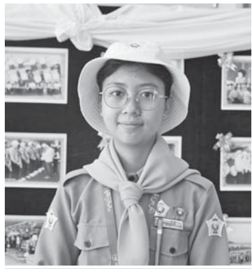
မရွှေယွန်းမီ

ရောဂါတိုင်းဒေသကြီး ငွေဆောင်မြို့ လူရည်ချွန်စခန်း(ငွေဆောင်)၌ မြန်မာတစ်နိုင်ငံလုံးမှ ၂၀၂၅-၂၀၂၆ ပညာသင်နှစ် ကောဒသမတန်း လူရည်ချွန်မောင်မယ် ၁၃၃ ဦးနှင့် ကြီးကြပ်ဆရာ၊ ဆရာမများသည် မေလ ၆ ရက်မှ ၉ ရက်အထိ ယာယီစခန်းချ၍ လူရည်ချွန်ဟောင်းကြီးများနှင့် ရင်းနှီးနှေးထွေးစွာတွေ့ဆုံခြင်း၊ ဒေသန္တရဗဟုသုတလေ့လာခြင်း၊ ကမ်းခြေတွင် အပန်းဖြေခြင်းတို့ကို ဆောင်ရွက်လျက်ရှိသည်။ အဆိုပါ လူရည်ချွန်စခန်းတွင်ရောက်ရှိနေသည့် လူရည်ချွန်ဟောင်းကြီးများ၊ ၂၀၂၅-၂၀၂၆ ပညာသင်နှစ် ကောဒသမတန်းလူရည်ချွန်မောင်မယ်များ၏ ရင်တွင်းစကားသံများကို ပြည်သူများသိရှိနိုင်ရန်အတွက်ဖော်ပြအပ်ပါသည်-