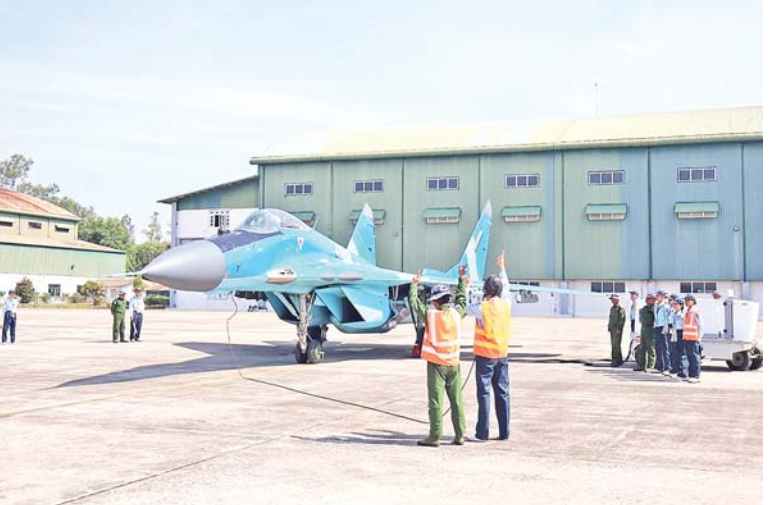
လေကြောင်းလူငယ်အခြေခံသင်တန်းနှင့်တန်းမြင့်သင်တန်းတို့မှ သင်တန်းသား၊ သင်တန်းသူများ စာတွေ့လက်တွေ့ လေ့ကျင့်သင်ကြားနေမှုကိုတွေ့ရစဉ်။

ဟိန်းဇဲဒေသရှိ ရေကြောင်းလူငယ်စခန်းမှ သင်ကြားပေးလျက်ရှိသည်။ မှ သင်တန်းသား ၆၃ ဦး၊ ရန်ကုန်မြို့ရှိ လေ့ကျင့်သင်ကြား ပို့ချပေးလျက်ရှိကြောင်း သင်တန်းသား၊ သင်တန်းသူ ၄၀ ဦး၊ အလားတူတပ်မတော်(လေ)က အခြေခံ ရန်ကုန်သင်တန်းစခန်းမှ သင်တန်းသား သတင်းရရှိသည်။ (၁၀၀)