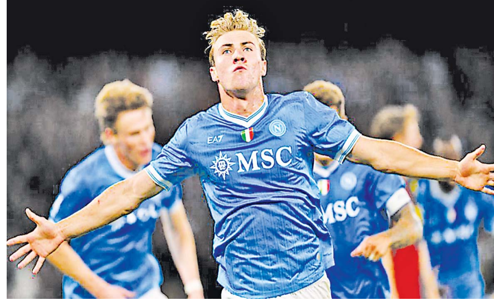
Ref;Top Skills Sports UK

အဓိက ကစားသမားအဖြစ်ပါဝင်ခဲ့ကာ ပြိုင်ပွဲစုံ ၄၁ ပွဲကစားရာတွင် ၁၄ ဂိုးသွင်းယူပြီး ဂိုးဖန်တီးမှုလေးကြိမ်ပြုလုပ်နိုင်ခဲ့သည့်အထိ ခြေစွမ်းပြနိုင်ပြီး နောက် နာပိုလီအသင်းက အပြီးသတ်စာချုပ်ဖြင့် ခေါ်ယူရန် ဆုံးဖြတ်ခဲ့ခြင်းဖြစ်သည်။ နာပိုလီအသင်းက ဟိုင်လန်းကို တစ်ရာသီအငှားစာချုပ်ဖြင့် ခေါ်ယူစဉ်ကတည်းက သက်တမ်းကုန်ဆုံးချိန်တွင် အပြီးသတ်စာချုပ်ဖြင့် ခေါ်ယူလိုပါက ခေါ်ယူနိုင်သောအချက်ပါဝင်သည့်အတွက် နာပိုလီအသင်းက ခြေစွမ်းပြလျက်ရှိနေသော ဟိုင်လန်းကို အပြီးသတ်စာချုပ်ဖြင့် ခေါ်ယူရန်ဆုံးဖြတ်ခဲ့ပြီးနောက် မန်ယူအသင်းနှင့်ပြောင်းရွှေ့ကြေးအတွက် ဆွေးနွေးမှုများလုပ်ဆောင်ခဲ့ရာ စတာလင်ပေါင် ၃၈ သန်းဖြင့် သဘောတူညီမှုရရှိခဲ့ကြောင်း သိရသည်။