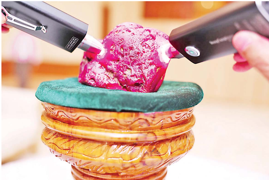
The recently-discovered ruby weighs 2,200 grammes (11,000 carats), making it exceptionally large, rare, and difficult to find. The giant ruby has a purplish-red colour with yellowish undertones and is considered to have a high-quality colour grade. It also has moderate transparency, excellent vitreous luster, and remains in its natural state without any treatment or enhancement.

and Environmental Conservation U Hsan Oo, inspected the piece of ruby at the hall of the President's Office this morning.