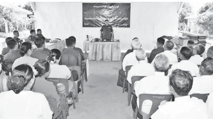
အရှေ့အလယ်ပိုင်းတိုင်းစစ်ဌာနချုပ်မှ တာဝန်ရှိသူတစ်ဦးက ခိုလှုံမြို့ စစ်မှုထမ်း ဟောင်းအဖွဲ့ဝင်များနှင့်မိသားစုဝင်များအား တွေ့ဆုံစဉ်။

တိုင်းစစ်ဌာနချုပ်မှ တာဝန်ရှိသူများက စစ်မှုထမ်းဟောင်းအဖွဲ့ဝင်များနှင့် မိသားစု ဝင်များအား စားသောက်ဖွယ်ရာများ ပေးအပ်ချီးမြှင့်ခဲ့ပြီး စစ်မှုထမ်းဟောင်း အဖွဲ့ဝင်များနှင့်မိသားစုဝင်များအား ရင်းရင်း နီးနီးလိုက်လံနှုတ်ဆက်ခဲ့ကြောင်း သတင်း ရရှိသည်။ (၁၀၀)