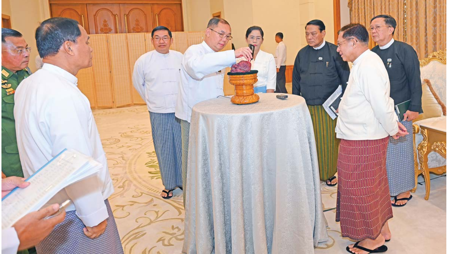
The Union Minister at the President's Office and the Union Minister for Natural Resources and Environmental Conservation reports to the President on facts about the recently discovered ruby piece.