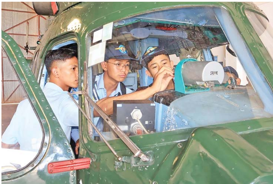
လေကြောင်းလူငယ်အခြေခံသင်တန်းနှင့်တန်းမြင့်သင်တန်းတို့မှ သင်တန်းသားများ လက်တွေ့လေ့ကျင့်သင်ကြားနေမှုကိုတွေ့ရစဉ်။