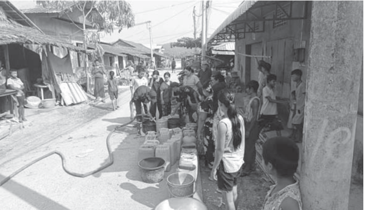
တနင်္သာရီတိုင်းဒေသကြီး ပုလောမြို့နယ် အမှတ်(၁)နှင့်အမှတ်(၂)ရပ်ကွက်တို့၌ သောက်သုံးရေလိုအပ်လျက်ရှိသော အိမ်ထောင်စုများသို့ ပုလောမြို့နယ်မီးသတ် စခန်းမှ သန္ဓေမီးသတ်တပ်ဖွဲ့ဝင်များက မေလ ၆ ရက်မွန်းလွဲပိုင်းတွင် ရေဂါလန် ၂၄၀၀ သွားရောက်လှူဒါန်းပေးစဉ်။ (၄၁၂)