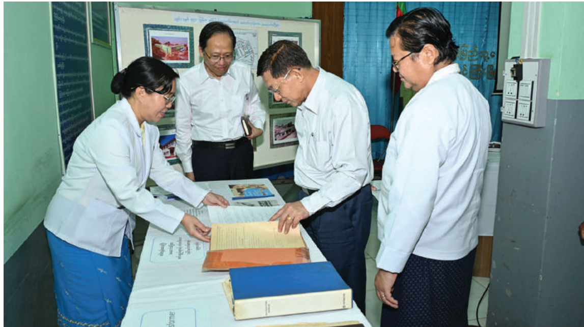
နိုင်ငံတော်စီမံအုပ်ချုပ်ရေးကောင်စီဥက္ကဋ္ဌ နိုင်ငံတော်ဝန်ကြီးချုပ် ဗိုလ်ချုပ်မှူးကြီးမင်းအောင်လှိုင် ခင်းကျင်းပြသထားသည့် စစ်တပ်ဆေးရုံကြီး အဆောက်အအုံများ၊ စက်ပစ္စည်းများနှင့်ပတ်သက်သော မှတ်တမ်းစာအုပ်များကို ကြည့်ရှုစဉ်။

ပင် အခြေခံကောင်းများရှိရန်လိုကြောင်း၊ ထို့ကြောင့် အစားအသောက်မှအစ ဂရုတစိုက် ဆောင်ရွက်ရန်လိုကြောင်း၊ ကျန်းမာရေးနှင့်ပတ်သက်၍ စနစ်တကျဖြင့် ဆောင်ရွက်ပေးကြစေလိုကြောင်း၊ ဆေးရုံများသည် ပြည်သူများအတွက် အားကိုးဖွယ်ရာဖြစ်အောင် ဆောင်ရွက်ကြရန်လိုကြောင်း၊ ပြောဆိုဆက်ဆံမှုမှအစ ကုသစောင့်ရှောက်မှုအပိုင်းများတွင် ပါ စနစ်တကျရှိစေလိုကြောင်း၊ ဆေးရုံသည် ကျန်းမာရေးစောင့်ရှောက်မှုပေး