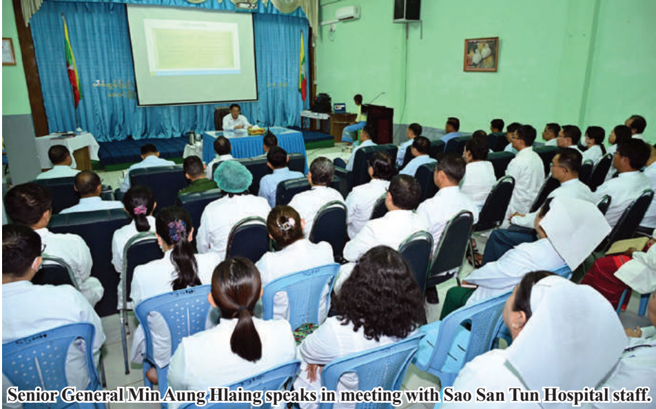
Senior General Min Aung Hlaing speaks in meeting with Sao San Tun Hospital staff.