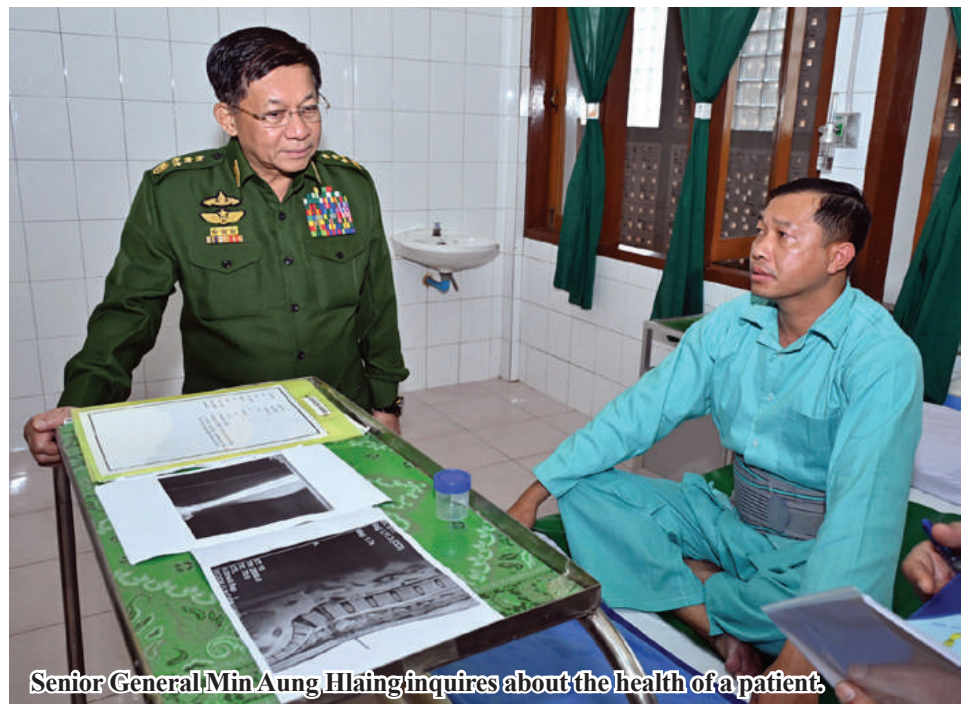
Senior General Min Aung Hlaing inquires about the health of a patient.