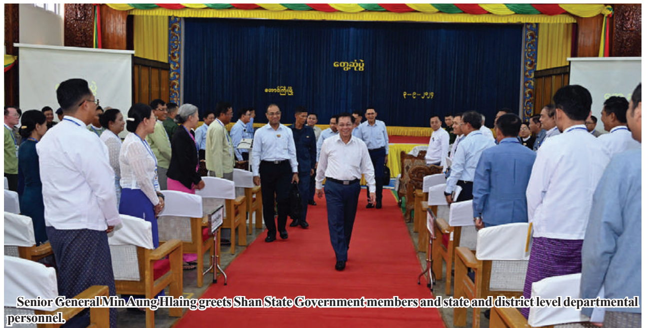
Senior General Min Aung Hlaing greets Shan State Government members and state and district level departmental personnel.

The Chairman of the State Administration Council, the Prime Minister continued by highlighting the interconnectedness of the economy and politics, noting that a strong economy often leads to a stable political environment. He pointed out that domestic manufacturing in the country has historical-