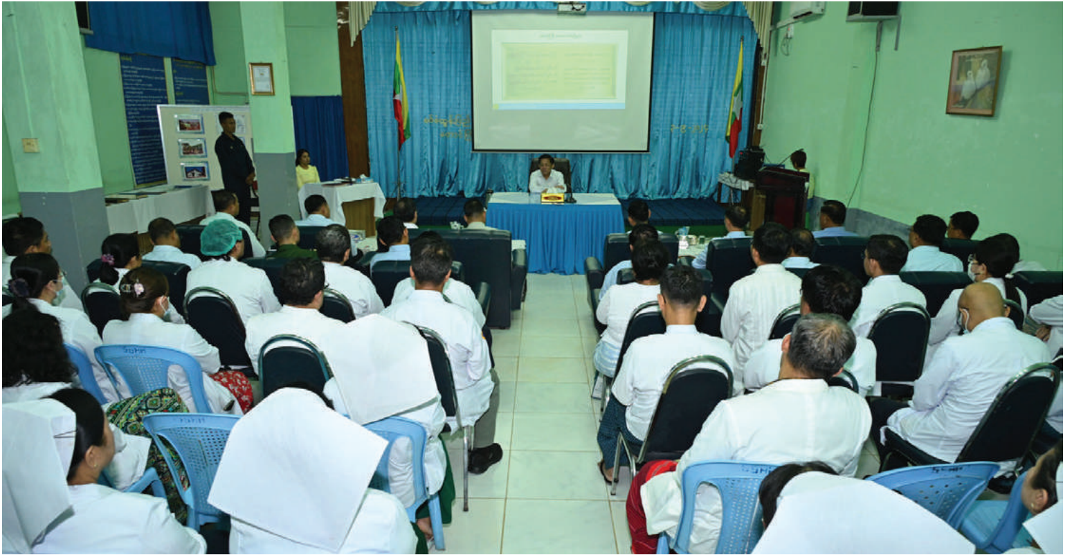
နိုင်ငံတော်စီမံအုပ်ချုပ်ရေးကောင်စီဥက္ကဋ္ဌ နိုင်ငံတော်ဝန်ကြီးချုပ် ဗိုလ်ချုပ်မှူးကြီးမင်းအောင်လှိုင် ရှမ်းပြည်နယ်(တောင်ပိုင်း) တောင်ကြီးမြို့ရှိ စစ်တပ်ဆေးရုံကြီး၌ ကျန်းမာရေးဝန်ထမ်းများကို တွေ့ဆုံအမှာစကားပြောကြားစဉ်။

ထို့နောက် နိုင်ငံတော်စီမံအုပ်ချုပ်ရေးကောင်စီဥက္ကဋ္ဌ နိုင်ငံတော်ဝန်ကြီးချုပ်က အမှာစကားပြောကြားရာတွင် ပြည်သူတိုင်းကျန်းမာရန်လိုကြောင်း၊ ကျန်းမာမှုပညာသင်ကြားနိုင်မည်၊ ကျန်းမာမှုအလုပ်လုပ်နိုင်မည်ဖြစ်ကြောင်း၊ ကျန်းမာရေးနှင့်ပတ်သက်၍ ငယ်ရွယ်စဉ်ကတည်းက