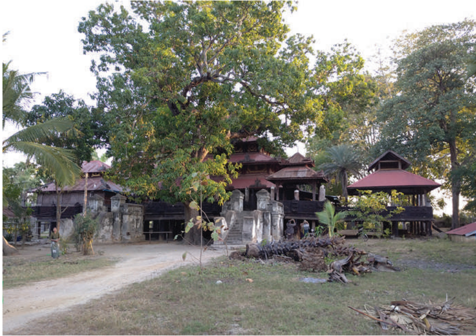
လယ်ကိုင်းရပ်စုံကျောင်းကို တွေ့ရစဉ်။

အမည်တွင်ခဲ့သည်။ ပြည်ထဲရေးဝန်ကြီးဌာနသည် ၁၉၇၂ ခုနှစ် ဇွန်လ ၁၉ ရက်တွင် ပွင့်ဖြူကို မြို့အဖြစ်သတ်မှတ်ခဲ့ကာ ပွင့်ဖြူမြို့နယ်ကို ရပ်ကွက် (၄) ရပ်ကွက်၊ ကျေးရွာအုပ်စု (၅၂)အုပ်စု၊ ကျေးရွာ (၂၀၄)ရွာဖြင့် ဖွဲ့စည်းခဲ့သည်။ လယ်ကိုင်းရပ်စုံကျောင်းတည်ရှိသည့် လယ်ကိုင်းကျေးရွာအုပ်စုသည် ၂၀၁၄ ခုနှစ် လူဦးရေစာရင်းအရ အိမ်ထောင်စု ၁၀၂၃ စုနှင့် လူဦးရေ ၂၅၄၄ ဦးနေထိုင်ခဲ့သည်။ လယ်ကိုင်းတွင် အစိုးရအထက်တန်းကျောင်းနှင့် ကျေးလက်ကျန်းမာရေးဌာနကို ဖွင့်လှစ်ထားသည်။