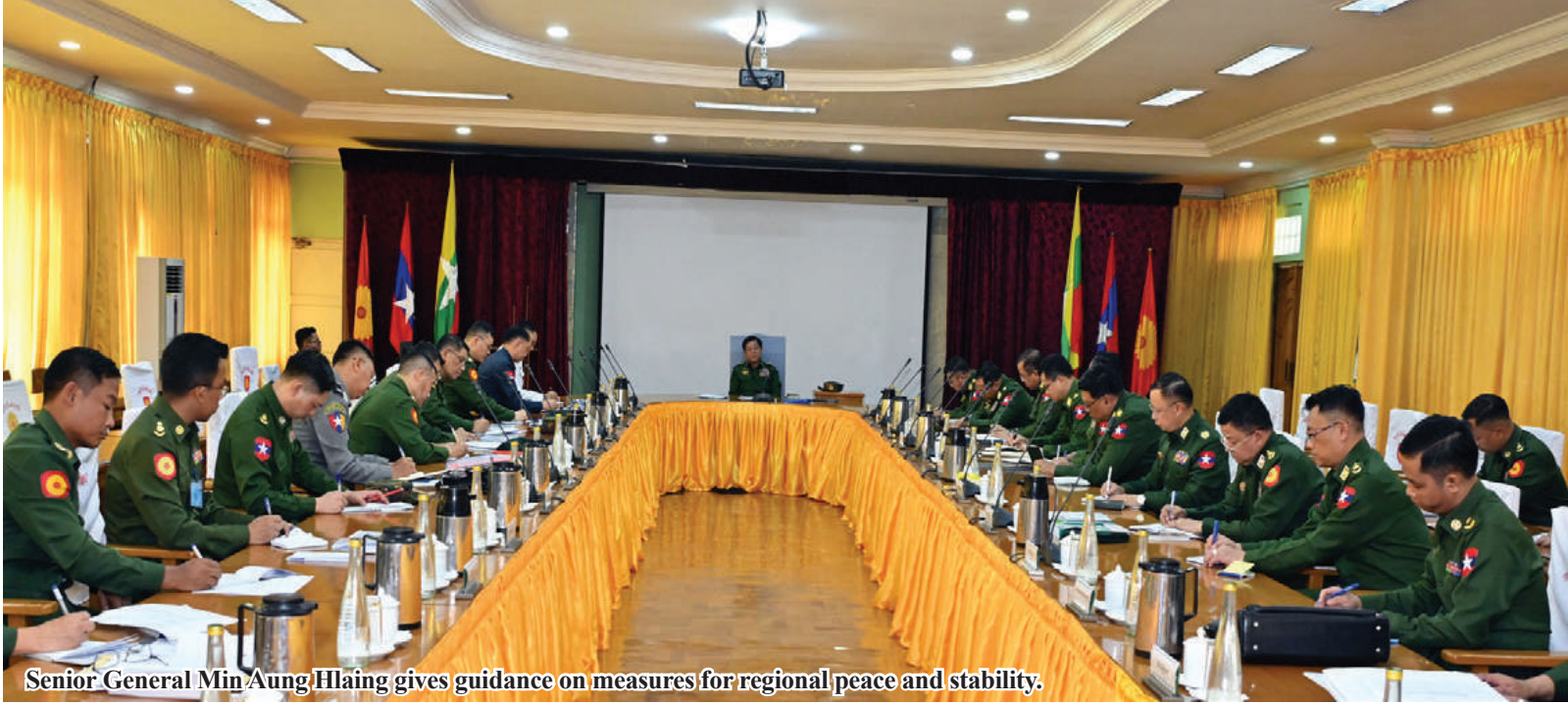
Senior General Min Aung Hlaing gives guidance on measures for regional peace and stability.