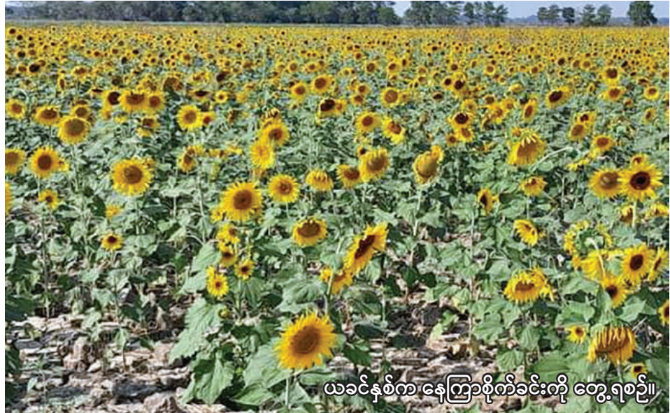
လာမည့်ဆောင်းသီးနှံစိုက်ပျိုးရာသီကို တွေ့ရစဉ်။

မော်လိုက် စက်တင်ဘာ ၃ စစ်ကိုင်းတိုင်းဒေသကြီး မော်လိုက်ခရိုင်တွင် လာမည့် ဆောင်းသီးနှံ စိုက်ပျိုးရာသီ၌ နေကြာသီးနှံ ဧက ၈၀၀၀ စိုက်ပျိုး မည်ဖြစ်ကြောင်း မော်လိုက်ခရိုင် စိုက်ပျိုးရေးဦးစီးဌာနမှ သိရသည်။ မော်လိုက်ခရိုင်တွင် လာမည့် ဆောင်းသီးနှံ စိုက်ပျိုးရာသီ၌ နေကြာသီးနှံစိုက်ပျိုးရန်အတွက်