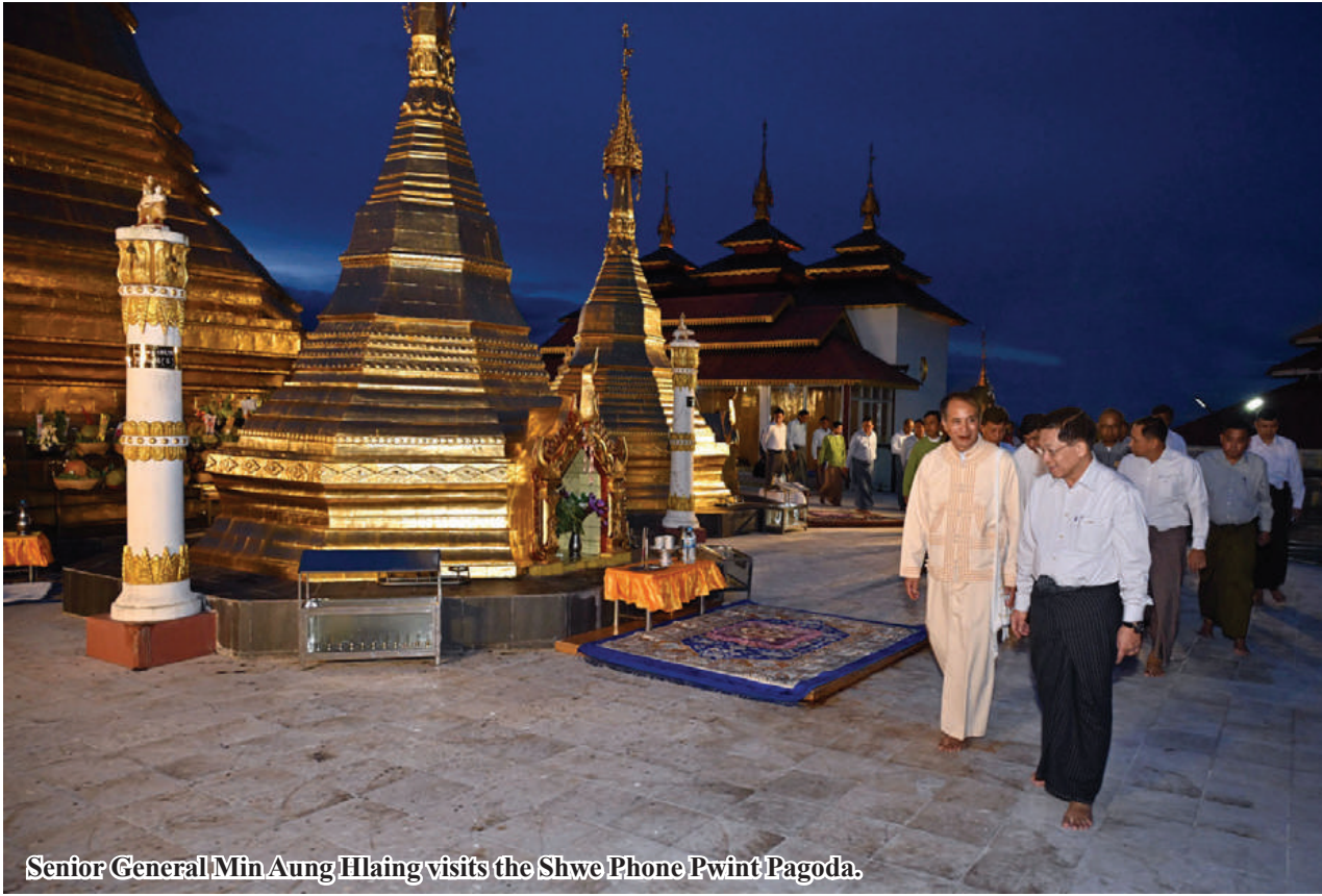
Senior General Min Aung Hlaing visits the Shwe Phone Pwint Pagoda.