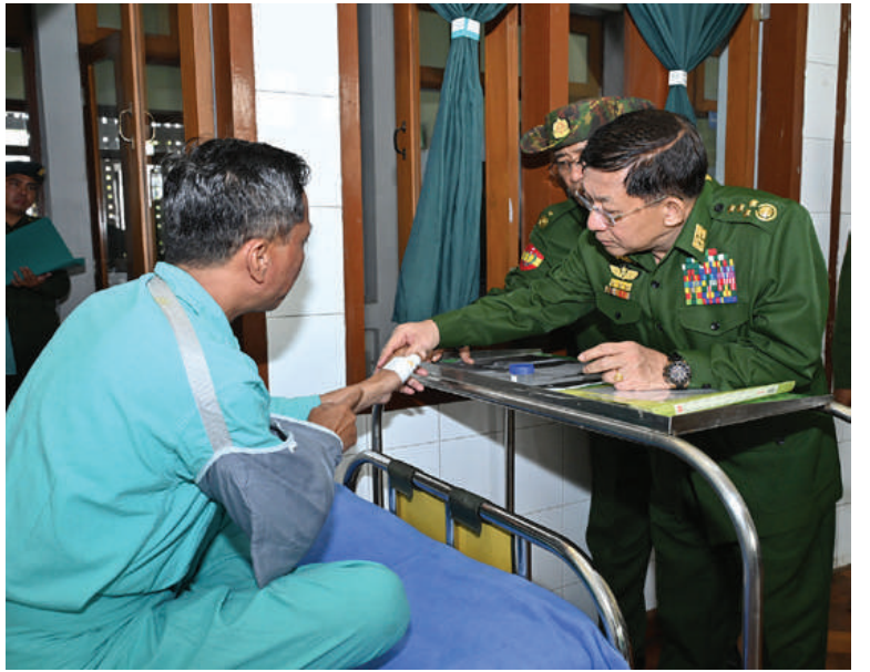
နိုင်ငံတော်စီမံအုပ်ချုပ်ရေးကောင်စီဥက္ကဋ္ဌ တပ်မတော်ကာကွယ်ရေးဦးစီးချုပ် ဗိုလ်ချုပ်မှူးကြီးမင်းအောင်လှိုင် ဆေးကုသမှုခံယူလျက်ရှိသည့် နိုင်ငံတော်ကာကွယ်ရေးနှင့် လုံခြုံရေးတာဝန်များထမ်းဆောင်စဉ် ထိခိုက်ဒဏ်ရာရရှိခဲ့သော အရာရှိ၊ စစ်သည်များကို တစ်ဦးချင်းလိုက်လံတွေ့ဆုံ၍ ရင်းနှီးနှေးထွေးစွာ မေးမြန်းအားပေးစကားပြော ကြားစဉ်။

တော်၊ တပ်မတော်နှင့်လက်တွဲ၍ ဆောင် ရွက်နေခြင်းဖြစ်ကြောင်း၊ ၎င်းတို့၏ ဒေသ များအတွင်း၌လည်း အကြမ်းဖက်သမား များဝင်ရောက်လှုပ်ရှားမှုများကြောင့် နယ် မြေမငြိမ်မသက်မှုများမဖြစ်စေရေးဆောင် ရွက်သွားရန်လိုကြောင်း၊ အကြမ်းဖက်မှု များကို ကျူးလွန်လျက်ရှိသည့် MNDA လက်နက်ကိုင်သောင်းကျန်းသူအဖွဲ့၊ ITNLA လက်နက်ကိုင် သောင်းကျန်းသူအဖွဲ့နှင့်