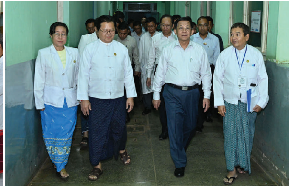
နိုင်ငံတော်စီမံအုပ်ချုပ်ရေးကောင်စီဥက္ကဋ္ဌ နိုင်ငံတော်ဝန်ကြီးချုပ် ဗိုလ်ချုပ်မှူးကြီးမင်းအောင်လှိုင် စစ်စံထွန်းပြည်သူ့ဆေးရုံကြီးအတွင်း လှည့်လည်ကြည့်ရှုစဉ်။

နေပြည်တော် စက်တင်ဘာ ၃ နိုင်ငံတော် စီမံအုပ်ချုပ်ရေးကောင်စီဥက္ကဋ္ဌ နိုင်ငံတော်ဝန်ကြီးချုပ် ဗိုလ်ချုပ်မှူးကြီးမင်းအောင်လှိုင်သည် ခရီးစဉ်တွင် လိုက်ပါလာသည့် အဖွဲ့ဝင်များနှင့်အတူ ယနေ့ညနေပိုင်းတွင် ရှမ်းပြည်နယ် (တောင်ပိုင်း) တောင်ကြီးမြို့ရှိ စစ်စံထွန်းပြည်သူ့ဆေးရုံကြီးသို့ သွားရောက်ကြည့်ရှုစစ်ဆေးပြီး ကျန်းမာရေးဝန်ထမ်းများကို တွေ့ဆုံ အမှာစကားပြောကြားသည်။ ဦးစွာ နိုင်ငံတော်စီမံအုပ်ချုပ်ရေးကောင်စီဥက္ကဋ္ဌ နိုင်ငံတော်ဝန်ကြီးချုပ်နှင့် အဖွဲ့ဝင်များသည် စစ်စံထွန်းပြည်သူ့ဆေးရုံကြီးသို့ ရောက်ရှိကြရာ ဆေးရုံအုပ်ကြီး ဒေါက်တာဝင်းမော်ဦးနှင့် ပါမောက္ခများ၊ အထူးကုဆရာဝန်ကြီးများနှင့် သူနာပြုများက ကြိုဆိုနှုတ်ဆက်ကြသည်။