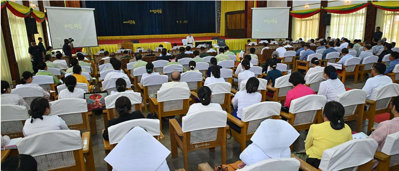
နိုင်ငံတော်စီမံအုပ်ချုပ်ရေးကောင်စီဥက္ကဋ္ဌ နိုင်ငံတော်ဝန်ကြီးချုပ် ဗိုလ်ချုပ်မှူးကြီးမင်းအောင်လှိုင် ရှမ်းပြည်နယ်အစိုးရအဖွဲ့ဝင်များ၊ ပြည်နယ်နှင့် ခရိုင်အဆင့်ဌာနဆိုင်ရာ တာဝန်ရှိသူများအား တွေ့ဆုံအမှာစကားပြောကြားစဉ်။

ကျောဖုံးမှအဆက် ဌာနဆိုင်ရာတာဝန်ရှိသူများ တက်ရောက်ကြ သည်။ ဒေသဆိုင်ရာအချက်အလက်များနှင့် ဒေသဖွံ့ဖြိုးတိုးတက်ရေး ဆောင်ရွက်နေမှုများကို ရှင်းလင်းတင်ပြ ဦးစွာ ပြည်နယ်ဝန်ကြီးချုပ်က ဒေသ ဆိုင်ရာအချက်အလက်များ၊ စိုက်ပျိုးရေးနှင့် မွေးမြူရေးလုပ်ငန်းများ အကောင်အထည် ဖော်ဆောင်ရွက်လျက်ရှိမှုနှင့် ထုတ်ကုန် ပစ္စည်းများထုတ်လုပ်နိုင်မှု၊ မွေးမြူရေးစနစ် များအလိုက် လုပ်ငန်းများတိုးတက်ရေး ဆောင်ရွက်လျက်ရှိမှုအသေးစား၊ အငယ်စား နှင့် အလတ်စား စီးပွားရေး(MSME)လုပ်ငန်း များ ဖွံ့ဖြိုးတိုးတက်ရေးဆောင်ရွက်လျက်ရှိ