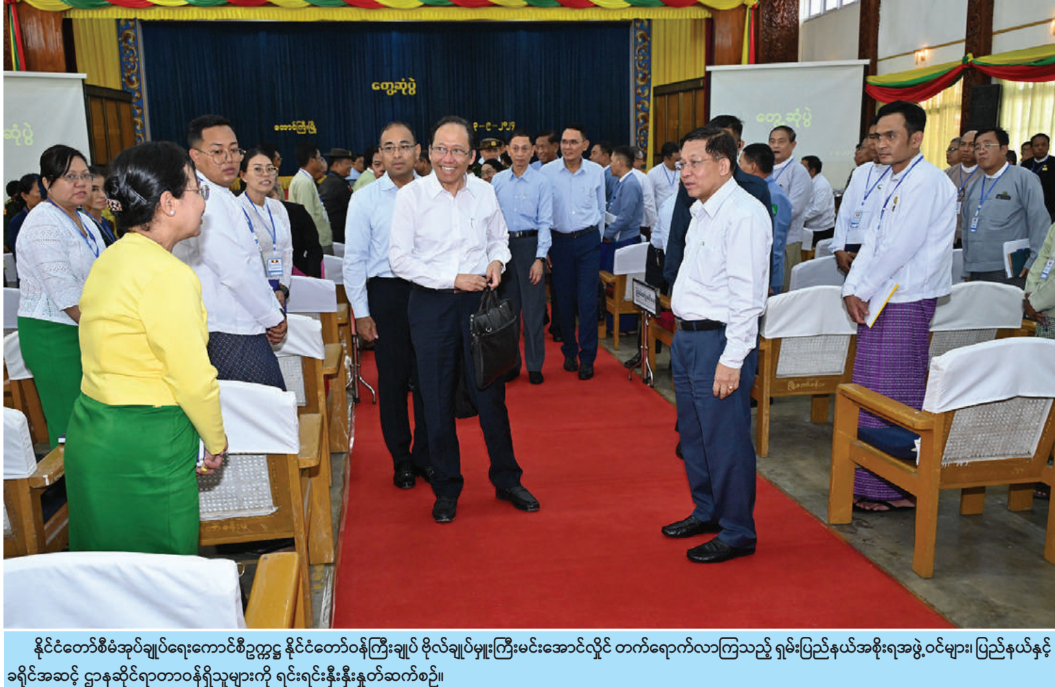
နိုင်ငံတော်စီမံအုပ်ချုပ်ရေးကောင်စီဥက္ကဋ္ဌ နိုင်ငံတော်ဝန်ကြီးချုပ် ဗိုလ်ချုပ်မှူးကြီးမင်းအောင်လှိုင် တက်ရောက်လာကြသည့် ရှမ်းပြည်နယ်အစိုးရအဖွဲ့ဝင်များ၊ ပြည်နယ်နှင့် ခရိုင်အဆင့် ဌာနဆိုင်ရာတာဝန်ရှိသူများကို ရင်းရင်းနှီးနှီးနှုတ်ဆက်စဉ်။

နေပြည်တော် စက်တင်ဘာ ၃ နိုင်ငံတော်စီမံအုပ်ချုပ်ရေးကောင်စီ ဥက္ကဋ္ဌ နိုင်ငံတော်ဝန်ကြီးချုပ် ဗိုလ်ချုပ်မှူးကြီး မင်းအောင်လှိုင်သည် ယနေ့နံနက်ပိုင်းတွင် ရှမ်းပြည်နယ်အစိုးရ အဖွဲ့ဝင်များ၊ ပြည်နယ်နှင့်ခရိုင်အဆင့်ဌာန ဆိုင်ရာတာဝန်ရှိသူများကို တောင်ကြီးမြို့ မြို့တော်ခန်းမ၌တွေ့ဆုံအမှာစကားပြော ကြားသည်။ အဆိုပါတွေ့ဆုံပွဲသို့ နိုင်ငံတော်စီမံ အုပ်ချုပ်ရေးကောင်စီဥက္ကဋ္ဌ နိုင်ငံတော် ဝန်ကြီးချုပ်နှင့်အတူ ကောင်စီတွဲဖက် အတွင်းရေးမှူး ဗိုလ်ချုပ်ကြီးရဲဝင်းဦး၊ ကောင်စီဝင်များဖြစ်ကြသည့် ဒုတိယ ဗိုလ်ချုပ်ကြီးရာပြည့်၊ ပိုးရယ်အောင်သိန်း၊ ခွန်စံလွင်ပြည်ထောင်စုဝန်ကြီးများဖြစ်ကြ သည့် ဒုတိယဗိုလ်ချုပ်ကြီးထွန်းထွန်းနောင်၊ ဒေါက်တာသက်ခိုင်ဝင်း၊ ဦးမျိုးသန့်၊ ရှမ်းပြည်နယ်ဝန်ကြီးချုပ်ဦးအောင်အောင်၊ ကာကွယ်ရေးဦးစီးချုပ်ရုံးမှ အဆင့်မြင့် တပ်မတော်အရာရှိကြီးများ၊ အရှေ့ပိုင်း တိုင်းစစ်ဌာနချုပ် တိုင်းမှူး၊ ဒုတိယဝန်ကြီး များ၊ ရှမ်းပြည်နယ်အစိုးရအဖွဲ့ဝင်များ၊ ပြည်နယ်နှင့် ခရိုင်အဆင့် စာမျက်နှာ ၁၆ ကော်လံ ၁ ☆