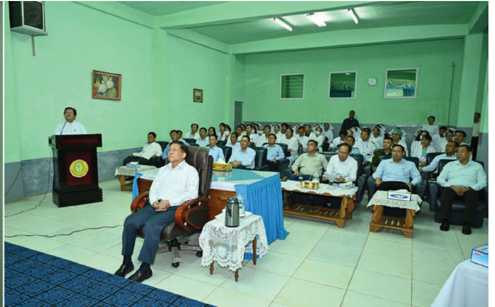
နိုင်ငံတော်စီမံအုပ်ချုပ်ရေးကောင်စီဥက္ကဋ္ဌ နိုင်ငံတော်ဝန်ကြီးချုပ် ဗိုလ်ချုပ်မှူးကြီးမင်းအောင်လှိုင်အား ဆေးရုံအုပ်ကြီး ဒေါက်တာဝင်းမော်ဦးက ဆေးရုံ၏သမိုင်းအကျဉ်း၊ အဆောက်အအုံများဆောက်လုပ်ထားရှိမှုနှင့် လူနာဆောင်သစ်များ ဆောက်လုပ်ထားရှိမှုအခြေအနေများနှင့်ပတ်သက်၍ ရှင်းလင်းတင်ပြစဉ်။