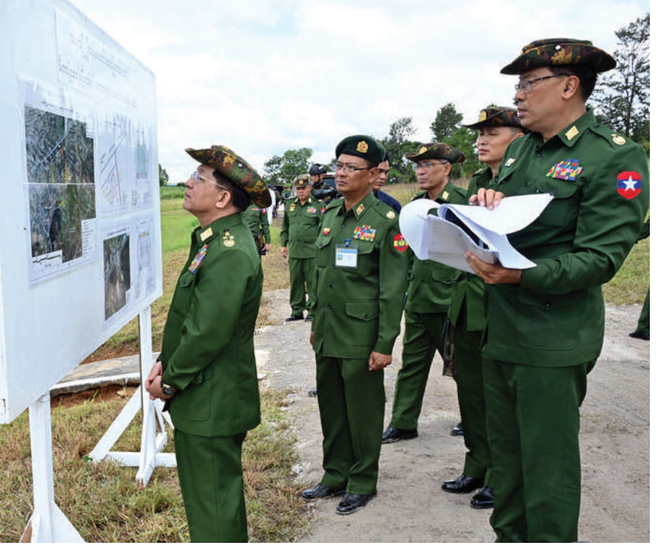
နိုင်ငံတော်စီမံအုပ်ချုပ်ရေးကောင်စီဥက္ကဋ္ဌ တပ်မတော်ကာကွယ်ရေးဦးစီးချုပ် ဗိုလ်ချုပ်မှူးကြီးမင်းအောင်လှိုင် အောင်ပန်းမြို့ရှိ နယ်မြေခံတပ်မတော်ဆေးရုံအတွင်း မီတာ ၄၀၀ ပြေးလမ်းပါ ဘောလုံးကွင်း တည်ဆောက်ရန် ဆောင်ရွက်နေမှုအခြေအနေများကို ကြည့်ရှုစစ်ဆေးစဉ်။