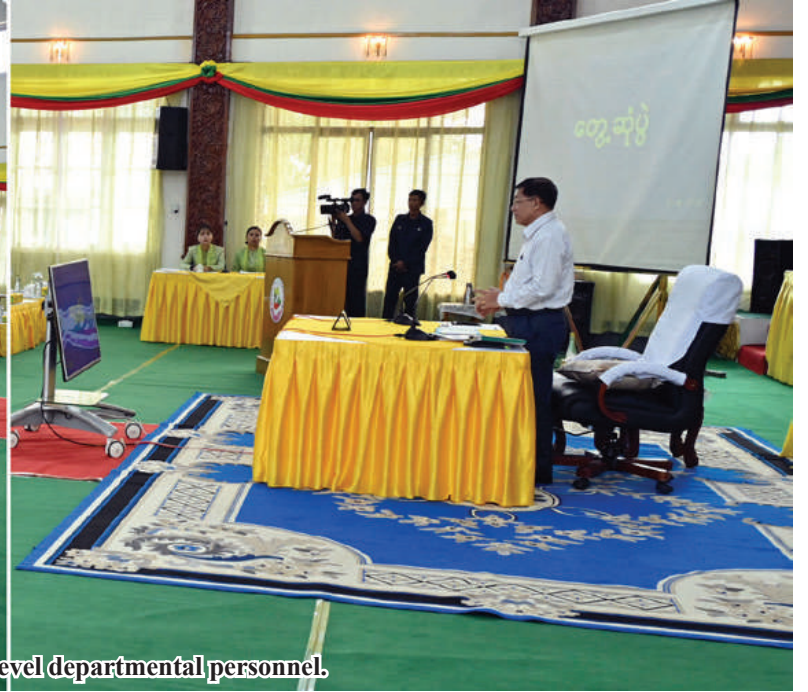
Senior General Min Aung Hlaing meets Shan State Government members and state and district level departmental personnel.