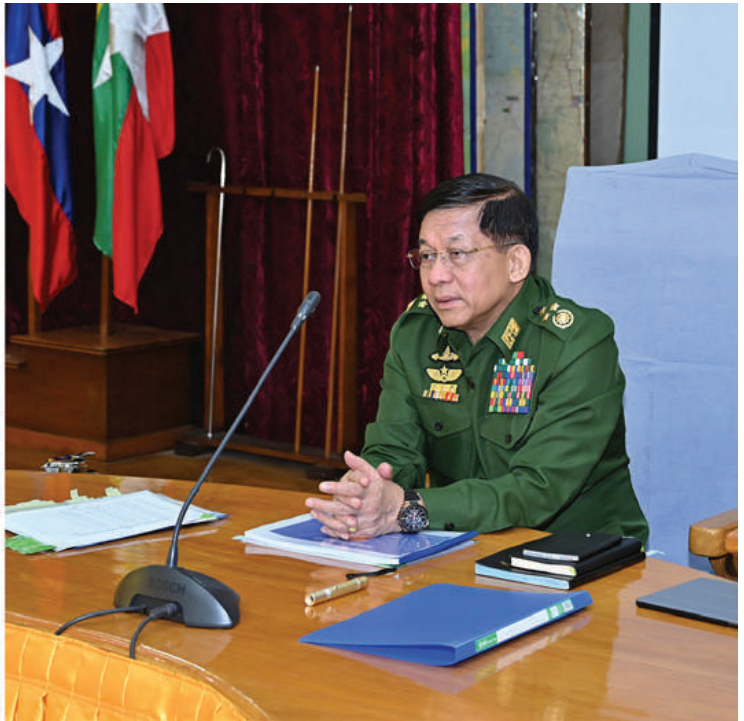
နိုင်ငံတော်စီမံအုပ်ချုပ်ရေးကောင်စီဥက္ကဋ္ဌ တပ်မတော်ကာကွယ်ရေးဦးစီးချုပ် ဗိုလ်ချုပ်မှူးကြီးမင်းအောင်လှိုင် အရှေ့ပိုင်းတိုင်းစစ်ဌာနချုပ်နယ်မြေအတွင်း နယ်မြေတည်ငြိမ်အေးချမ်းရေးဆိုင်ရာဆောင်ရွက်ထားရှိမှုများနှင့်ပတ်သက်၍ ရှင်းလင်းတင်ပြမှုများအပေါ် လမ်းညွှန်မှာကြားစဉ်။

နေပြည်တော် စက်တင်ဘာ ၃ နိုင်ငံတော်စီမံအုပ်ချုပ်ရေးကောင်စီ ဥက္ကဋ္ဌ တပ်မတော်ကာကွယ်ရေးဦးစီးချုပ် ဗိုလ်ချုပ်မှူးကြီးမင်းအောင်လှိုင် သည် ကာကွယ်ရေးဦးစီးချုပ်(ရှေ့) ဒုတိယဗိုလ်ချုပ်ကြီးထိန်ဝင်းကာကွယ်ရေး ဦးစီးချုပ်(လေ) ဗိုလ်ချုပ်ကြီးထွန်းအောင်၊ ပြည်ထောင်စုအဆင့်ပုဂ္ဂိုလ်များကာကွယ်ရေးဦးစီးချုပ်ရုံးမှ အဆင့်မြင့်တပ်မတော်အရာရှိကြီးများနှင့် တာဝန်ရှိသူများလိုက်ပါ၍ ယနေ့နံနက်ပိုင်းတွင် အရှေ့ပိုင်းတိုင်းစစ်ဌာနချုပ်နယ်မြေအတွင်း နယ်မြေတည်ငြိမ်အေးချမ်းရေးဆိုင်ရာဆောင်ရွက်ထားရှိမှုများကို စစ်ဆေးသည်။ ဦးစွာ အရှေ့ပိုင်းတိုင်းစစ်ဌာနချုပ်အစည်းအဝေးခန်းမတွင် တိုင်းမှူး ဗိုလ်ချုပ်ဇော်မင်းလတ်က အရှေ့ပိုင်းတိုင်းစစ်ဌာနချုပ်နယ်မြေအတွင်း တပ်မတော်သားများ၊ မြန်မာနိုင်ငံရဲတပ်ဖွဲ့ဝင်များနှင့် ပြည်သူ့စစ်(ဌာန)အဖွဲ့ဝင်များ ပူးပေါင်း၍ နယ်မြေလုံခြုံရေးနှင့် လမ်းတံတားများလုံခြုံရေးအတွက် ဆောင်ရွက်လျက်ရှိမှု၊ KNPP၊ KNDF အဖွဲ့နှင့် PDFအမည်ခံအကြမ်းဖက်သမားများ၏ တိုက်ခိုက်မှုကြောင့် ထိခိုက်ပျက်စီးမှုများဖြစ်ပေါ်ခဲ့သည့် လျှင်ကော်မြို့နှင့်အခြားမြို့များကိုပြန်လည်ထူထောင်ရေးလုပ်ငန်းများ ဆောင်ရွက်ပေးလျက်ရှိမှု၊ နယ်မြေလုံခြုံရေးလုပ်ငန်းများဆောင်ရွက်စဉ် PDF အမည်ခံ အကြမ်းဖက်သမားများထံမှ စာမျက်နှာ ၁၉ ကော်လံ ၁ ပု