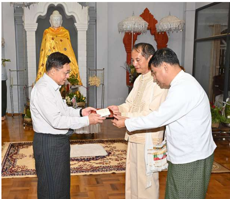
နိုင်ငံတော်စီမံအုပ်ချုပ်ရေးကောင်စီဥက္ကဋ္ဌ နိုင်ငံတော်ဝန်ကြီးချုပ် ဗိုလ်ချုပ်မှူးကြီးမင်းအောင်လှိုင် ရွှေဘုန်းပွင့်စေတီတော်မြတ်ကြီးအတွက် ဘက်စုံအလှူငွေများကို ပေးအပ်လှူဒါန်းစဉ်။

ထို့နောက် နိုင်ငံတော်စီမံအုပ်ချုပ်ရေးကောင်စီဥက္ကဋ္ဌ နိုင်ငံတော်ဝန်ကြီးချုပ်က အမှာစကားပြောကြားရာတွင် ရှမ်းပြည်နယ်အတွင်း ဒေသဖွံ့ဖြိုးတိုးတက်မှုများကို ဆောင်ရွက်ရာ၌ လိုအပ်သည်များကို ဆွေးနွေးပြောကြားနိုင်ရန်နှင့် ပေါင်းစပ်ညှိနှိုင်းဆောင်ရွက်ပေးနိုင်ရန် လာရောက်ခြင်းဖြစ်ကြောင်း၊ နိုင်ငံတော်တွင် ဖြစ်ပေါ်ခဲ့သည့် အခြေအနေများနှင့် လုံခြုံရေးပိုင်းဆိုင်ရာများကို ဦးစွာပြောကြားလိုကြောင်းဖြင့် ပြောကြားပြီး ၂၀၂၀ ပြည့်နှစ် ပါတီစုံဒီမိုကရေစီ အထွေထွေရွေးကောက်ပွဲတွင် မဲမသမာမှုများဖြစ်ပေါ်ခဲ့မှုနှင့် အဆိုပါ မဲမသမာမှုများကို တာဝန်ရှိသူများက ဖြေရှင်းဆောင်ရွက်ပေးခြင်းမရှိခဲ့မှု၊ နိုင်ငံတော်တွင် ဖြစ်ပေါ်လာခဲ့သည့် အခြေအနေများအရ ဖွဲ့စည်းပုံအခြေခံဥပဒေ(၂၀၀၈ ခုနှစ်)နှင့် အညီ နိုင်ငံတော်ကို နိုင်ငံရေးအရအရေးပေါ်အခြေအနေကြေညာခဲ့ပြီး တပ်မတော်ကနိုင်ငံတာဝန်များကို ထမ်းဆောင်ခဲ့ရမှု၊ နိုင်ငံတော်စီမံအုပ်ချုပ်ရေးကောင်စီကို နိုင်ငံတော်၏ ကောင်းရာကောင်းကျိုးကို ဖော်ဆောင်ပေးနိုင်မည့် စစ်ဘက်၊ အရပ်ဘက်မှ ပုဂ္ဂိုလ်များကို ရွေးချယ်၍ ဖွဲ့စည်းတာဝန်ပေးအပ်ခဲ့မှု၊ စတင်တာဝန်ထမ်းဆောင်ခဲ့စဉ် ကိုဗစ်-၁၉ ရောဂါကြောင့်ဖြစ်ပေါ်ခဲ့ရသည့် အကျပ်အတည်းများနှင့် နိုင်ငံရေးအမြတ်ထုတ်လိုသူများ၏ သွေးထိုးလှုံ့ဆော်မှုများကြောင့် ဖြစ်ပေါ်ခဲ့သည့် အကြမ်းဖက်မှုဖြစ်စဉ်ဖြစ်ရပ်များကို ဥပဒေနှင့်အညီ ထိန်းထိန်းသိမ်းသိမ်းဆောင်ရွက်ခဲ့မှု၊ တိုင်းရင်းသားလက်နက်ကိုင်အဖွဲ့များနှင့်ပတ်သက်၍ နိုင်ငံတော်နှင့် တပ်မတော်အနေဖြင့် ခေတ်အဆက်ဆက်တွင် ထိန်းထိန်းသိမ်းသိမ်းဖြင့်သာ ဖြေရှင်းဆောင်ရွက်ခဲ့မှု၊ အချို့သောတိုင်းရင်းသား