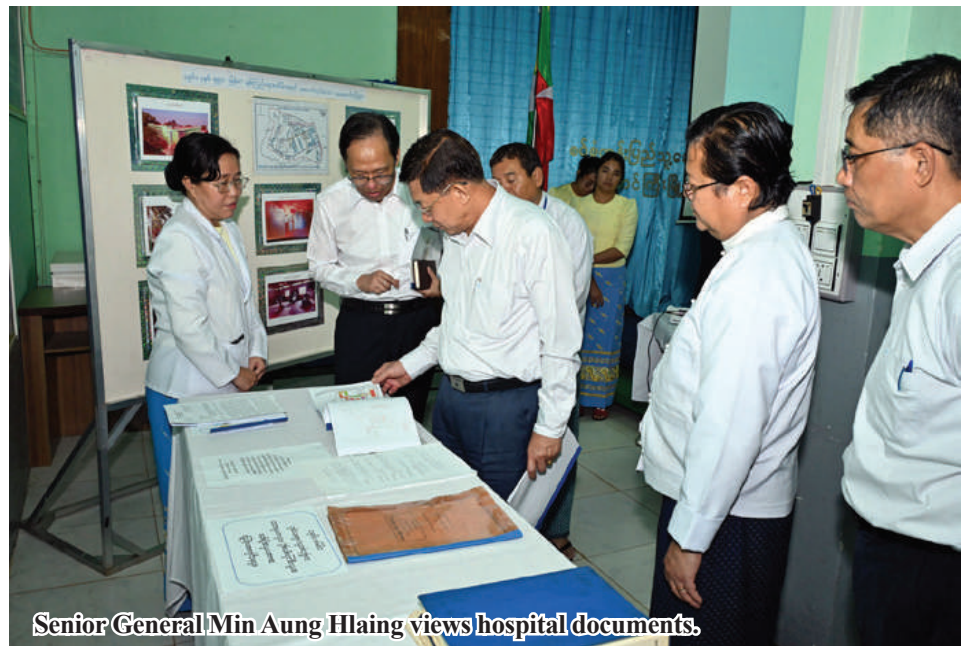
Senior General Min Aung Hlaing views hospital documents.