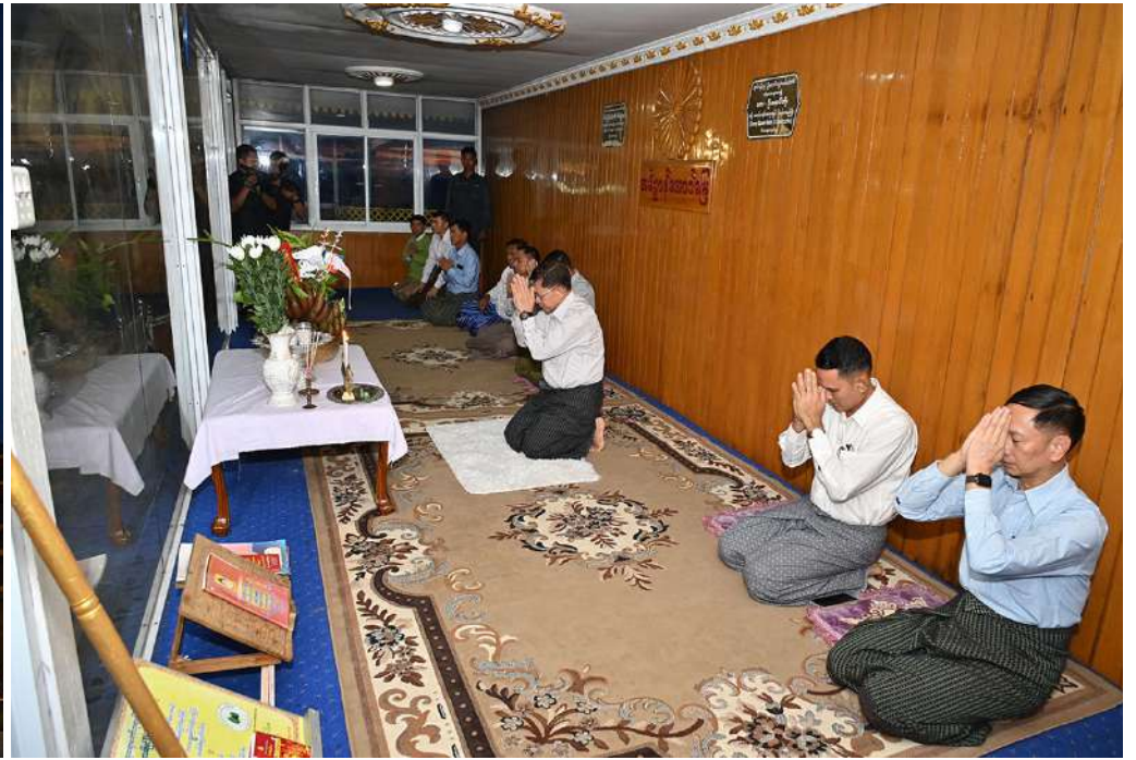
နိုင်ငံတော်စီမံအုပ်ချုပ်ရေးကောင်စီဥက္ကဋ္ဌ နိုင်ငံတော်ဝန်ကြီးချုပ် ဗိုလ်ချုပ်မှူးကြီးမင်းအောင်လှိုင် တောင်ကြီးမြို့ ကျက်သရေဆောင် ရွှေဘုန်းပွင့်စေတီတော်မြတ်ကြီးအား ဖူးမြော်ကြည့်ညိဉ်း။

မွေးမြူရေးလုပ်ငန်း ဆောင်ရွက်သူများနှင့် အပြန်အလှန်နှီးနှောဖလှယ်၍ တောင်သူများ၏ အခက်အခဲများကို ဖြေရှင်းဆောင်ရွက်ပေးလျက်ရှိမှု စိုက်ပျိုးမွေးမြူရေးလုပ်ငန်းများအတွက် လိုအပ်သည့်မျိုးကောင်းမျိုးသန့်များရရှိရေး ဆောင်ရွက်ပေးလျက်ရှိမှုနှင့် မွေးမြူရေးအစာများ လုံလောက်စွာရရှိရေး ဆောင်ရွက်ပေးလျက်ရှိမှု အခြေအနေများကို ပြန်လည်ဆွေးနွေးပြောကြားကြသည်။