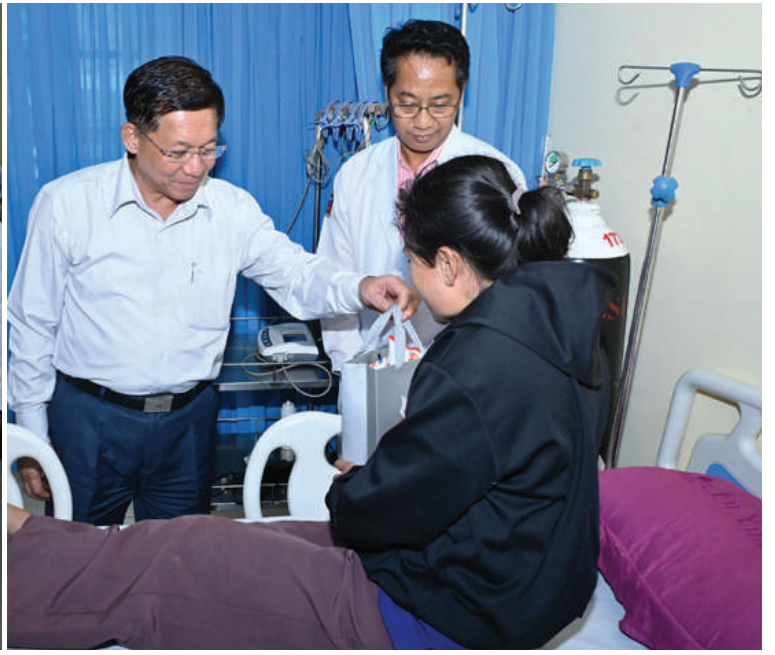
နိုင်ငံတော်စီမံအုပ်ချုပ်ရေးကောင်စီဥက္ကဋ္ဌ နိုင်ငံတော်ဝန်ကြီးချုပ် ဗိုလ်ချုပ်မှူးကြီးမင်းအောင်လှိုင် ဆေးကုသမှုခံယူလျက်ရှိသည့် ဒေသခံပြည်သူများ၏ ကျန်းမာရေးအခြေအနေများကို မေးမြန်းအားပေးစကားပြောကြားပြီး စားသောက်ဖွယ်ရာများ ပေးအပ်စဉ်။

ယင်းနောက် နိုင်ငံတော်စီမံအုပ်ချုပ်ရေးကောင်စီဥက္ကဋ္ဌ နိုင်ငံတော်ဝန်ကြီးချုပ်သည် အရေးပေါ်ကုသဆောင်တွင် တက်ရောက် ကုသမှုခံယူလျက်ရှိသည့် ဒေသခံပြည်သူများကို ကြည့်ရှု၍ ကျန်းမာရေးအခြေအနေများကို မေးမြန်းအားပေးစကားပြောကြားပြီး စားသောက်