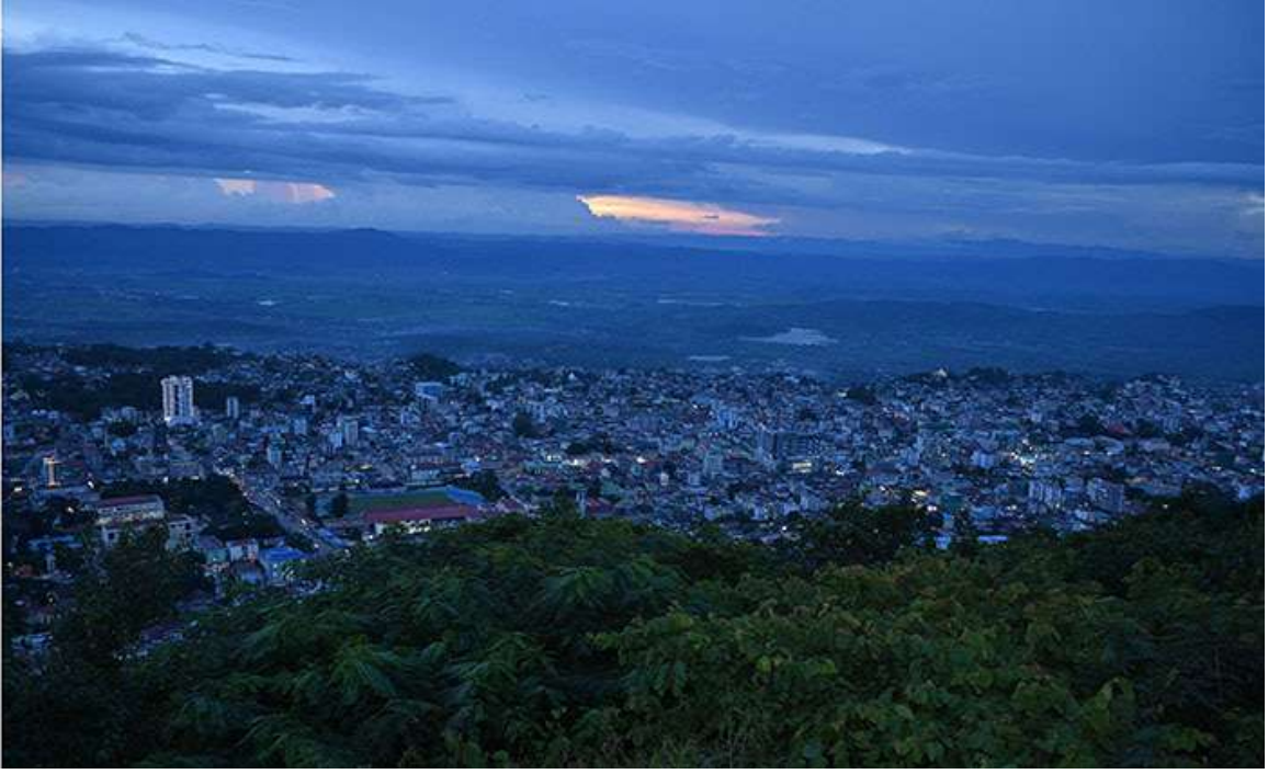
နိုင်ငံတော်စီမံအုပ်ချုပ်ရေးကောင်စီဥက္ကဋ္ဌ နိုင်ငံတော်ဝန်ကြီးချုပ် ဗိုလ်ချုပ်မှူးကြီးမင်းအောင်လှိုင် ရွှေဘုန်းပွင့်စေတီတော်မြတ်ကြီးပေါ်ရှိ ရှမ်းသာView Point မှတစ်ဆင့် တောင်ကြီးမြို့၏ ရှမ်းများကို ကြည့်ရှုစဉ်။

မှု၊ ရှမ်းပြည်နယ်အတွင်း ပြည်တွင်း၊ ပြည်ပ ခရီးသွားလုပ်ငန်းဖွံ့ဖြိုးတိုးတက်ရေးဆောင် ရွက်လျက်ရှိမှု၊ ပညာရေး၊ ကျန်းမာရေးကဏ္ဍ မြှင့်တင်ပေးနိုင်ရေး ဆောင်ရွက်လျက်ရှိမှု၊ ဒေသနေပြည်သူများ ကျန်းမာကြံ့ခိုင် သန်စွမ်းစေရေးအတွက် အားကစားရုံများ၊ လေ့ကျင့်ရေးကွင်းများ အဆင့်မြှင့်တင်တည် ဆောက်ပေးထားမှုနှင့် အားကစားပွဲများ ကျင်းပလျက်ရှိမှု၊ စာကြည့်တိုက်များဖွင့်လှစ် ထားရှိမှုနှင့် တိုးချဲ့ဖွင့်လှစ်ရန် ဆောင်ရွက် လျက်ရှိမှု၊ ရှမ်းပြည်နယ်အတွင်းရှိ အချို့ဒေသ များ၌ အကြမ်းဖက်သမားများ၏ လုပ်ရပ်