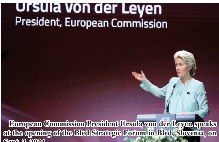
European Commission President Ursula von der Leyen speaks at the opening of the Bled Strategic Forum in Bled, Slovenia, on Sept. 2, 2024.

The host of the forum, Slovenia's Foreign Minister Tanja Fajon, called on countries to recognize Palestine as a sovereign state and to help end the violence in Gaza. Slovenia recognized the Palestinian state in June.