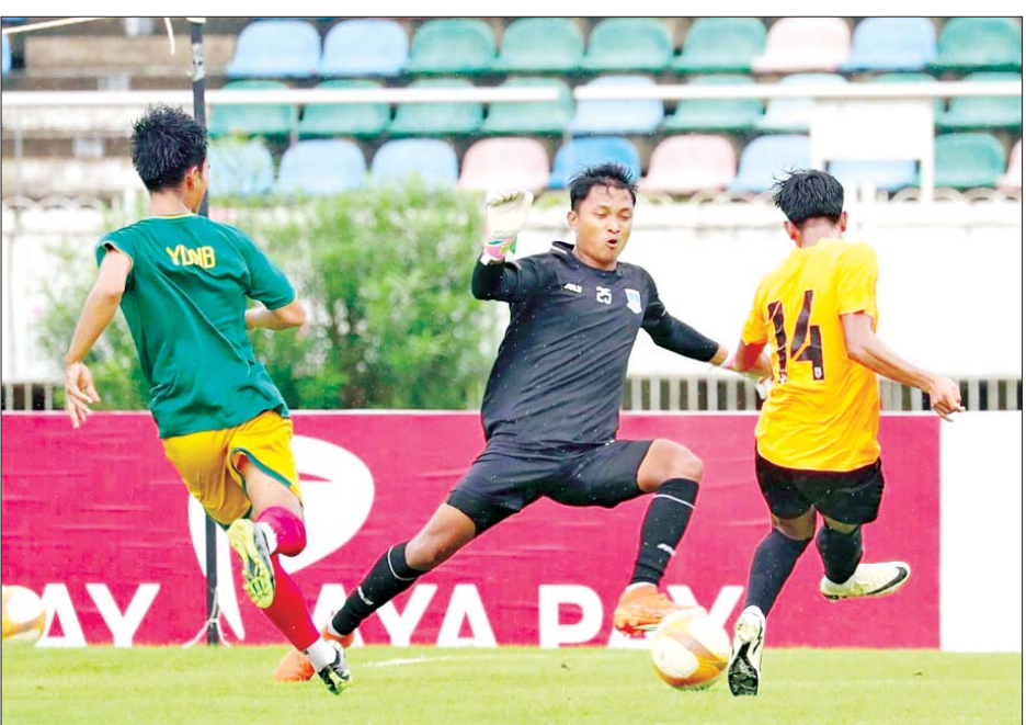
မြန်မာ ယူ-၁၉ အသင်းနှင့် ရတနာပုံအသင်းတို့ ခြေစမ်းကစားကြစဉ်။

ရန်ကုန် ဇွန် ၂၀ ယခုနှစ်အတွင်း ယှဉ်ပြိုင်ရမည့် နိုင်ငံတကာ ပြိုင်ပွဲများအတွက် လေ့ကျင့်ပြင်ဆင်နေသည့် မြန်မာ ယူ-၁၉ အသင်းသည် ဇွန် ၂၀ ရက် ညနေပိုင်းက သုဝဏ္ဏကွင်း၌ မြန်မာနေရှင်နယ်လိဂ် ကလပ် ရတနာပုံအသင်းနှင့် ခြေစမ်း ကစားရာ သုံးဂိုး-တစ်ဂိုးဖြင့် အနိုင် ရခဲ့သည်။ မြန်မာ ယူ-၁၉ အသင်းသည် ဇူလိုင်တတိယပတ်တွင် စတင် ကျင်းပမည့် ၂၀၂၄ အာဆီယံ ယူ-၁၉ ချန်ပီယံရှစ်ပြိုင်ပွဲအတွက် လေ့ကျင့် ပြင်ဆင်နေခြင်းဖြစ် ပြီး တရုတ်ခြေစမ်းခရီးစဉ် အပြီးတွင် ပြည်တွင်း ကလပ် အသင်းများနှင့် ခြေစမ်းကစားကာ စာမျက်နှာ ၁၅ ကော်လံ ၁ သို့ *