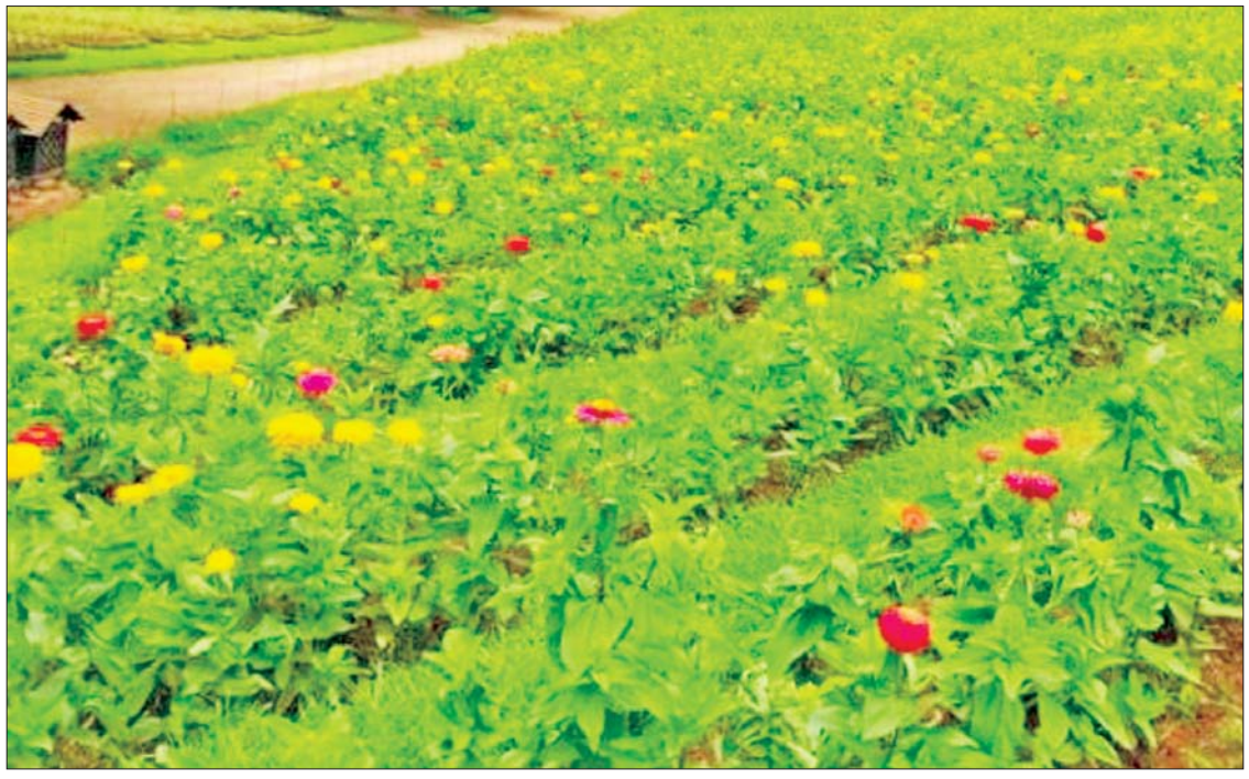
ထပ်တစ်ရာပန်းများ စိုက်ပျိုးထားမှုကိုတွေ့ရစဉ်။

ရန်ကုန် ဇွန် ၂၀ မြန်မာနိုင်ငံတွင် ပန်းမျိုးစိတ်နှင့် ပန်းအများဆုံး စိုက်ပျိုးထွက်ရှိရာ မန္တလေးတိုင်းဒေသကြီး ပြင်ဦးလွင်မြို့၌ ဒေသမျိုးရင်းများအပြင် ရာသီဥတုနှင့်ကိုက်ညီသည့် ပြည်ပမှ ပန်းမျိုးစိတ်များကို အများဆုံး စိုက်ပျိုးထုတ်လုပ်၍ နိုင်ငံတစ်ဝန်းသို့ ဖြန့်ဖြူးရောင်းချပေးလျက်ရှိကြောင်း သိရသည်။ တင်ပို့လျက်ရှိ ပြင်ဦးလွင်မှ ထွက်ရှိသောပန်းများကို ဘုရားပန်း၊ အခမ်းအနားပွဲများ၊ အလှူပွဲများ၊ မင်္ဂလာအခမ်းအနားများ၊ ပန်းအလှဆင်ခြင်းနှင့် နေ့စဉ်ကဏ္ဍစုံ၌ အသုံးပြုကြလျက်ရှိရာ လိုအပ်သော အသုံးပြုမှုပေါ်မူတည်၍ ပန်းအမျိုးအစားနှင့် ဈေးနှုန်းကွဲပြားပြီး ဒေသမျိုးရင်းထက် နိုင်ငံခြားမျိုးများ အရောင်းအဝယ်ကောင်းလျက်ရှိကာ နေပြည်တော်၊ ရန်ကုန်၊ မန္တလေးနှင့် စာမျက်နှာ ၃ ကော်လံ ၁ သို့ ၀