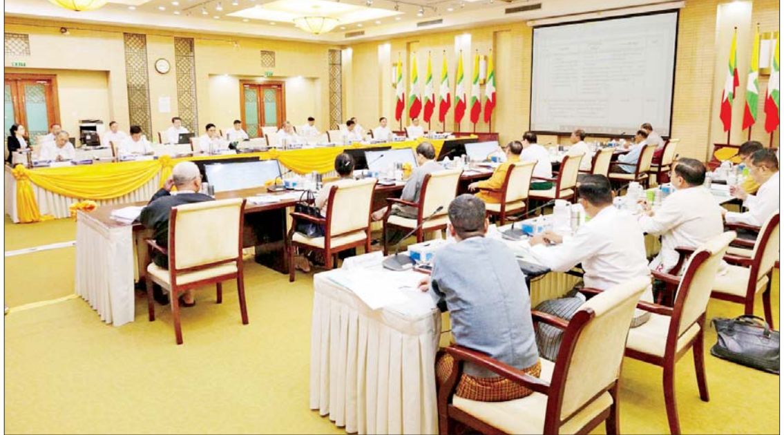
အောင်မြင်စွာနှင့် အလုပ်အဖွဲ့ကိုယ်စား တွေ့ဆုံဆွေးနွေးပွဲတွင်တက်ရောက် မပြီးပြတ်သေးသည့် ဖွဲ့စည်းပုံအခြေခံ ယူဆချက်များ တက်ရောက်ကြသည်။

နေပြည်တော် ဇွန် ၂၀ အမျိုးသားစည်းလုံးညီညွတ်ရေးနှင့် ငြိမ်းချမ်းရေးဖော်ဆောင်မှု ညှိနှိုင်းရေး ကော်မတီနှင့် နိုင်ငံရေးပါတီများအစုအဖွဲ့ ၏အလုပ်အဖွဲ့တို့တွေ့ဆုံဆွေးနွေးပွဲ ဒုတိယ နေ့ကို ယနေ့နံနက်ပိုင်းတွင် နေပြည်တော် ရှိ အမျိုးသားစည်းလုံးညီညွတ်ရေးနှင့် ငြိမ်းချမ်းရေးဖော်ဆောင်မှု ဗဟိုဌာန၌ ဆက်လက်ကျင်းပသည်။