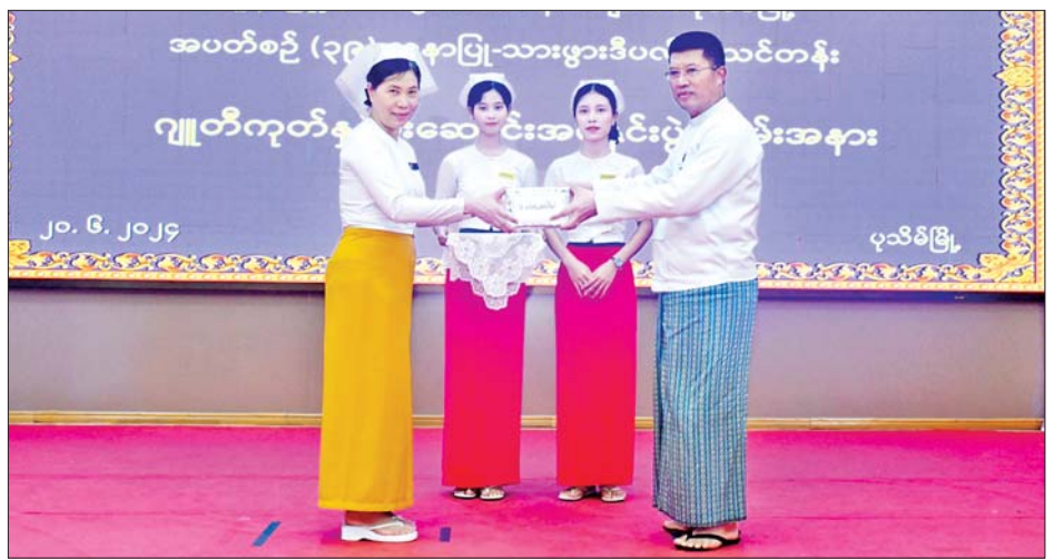
ယနေ့ပြုလုပ်သည့် ပုသိမ်သူနာပြုနှင့် သားဖွား သင်တန်းသား ၁၉ ဦး၊ သင်တန်းသူ ၉၄ ဦး စုစုပေါင်း သင်တန်းကျောင်း အပတ်စဉ်(၃၉) သူနာပြု-သားဖွား ၁၁၃ ဦးအား ဂျူတီကုတ်နှင့် ဦးဆောင်အပ်နှင်း (ဒီပလိုမာ) ပထမနှစ်သင်တန်းသား သင်တန်းသူများ ခွဲကြောင်း သိရသည်။ တိုင်းဒေသကြီး(ပြန်/ဆက်)

ထို့နောက် သင်တန်းသား သင်တန်းသူများက “ကရုဏာအလင်း” သီချင်းဖြင့် သီဆိုဂုဏ်ပြုပျော်ဖြေ ခဲ့ပြီး ပုသိမ်မြို့ သူနာပြုနှင့် သားဖွားသင်တန်း ကျောင်းအုပ်ကြီးနှင့် တာဝန်ရှိသူများက ဂျူတီကုတ် နှင့် ဦးဆောင်အပ်နှင်းပွဲကို နောက် သင်တန်းသား သင်တန်းသူများက သူနာပြုသစ္စာအဓိဋ္ဌာန် ရွတ်ဆိုခဲ့ ကြသည်။ ယင်းနောက် တိုင်းဒေသကြီးဝန်ကြီးချုပ်နှင့် ဇနီးတို့က ပထမနှစ်၊ ဒုတိယနှစ်၊ တတိယနှစ်သင်တန်း များတွင် ထူးချွန်ဆုရရှိသူများအား ဆုများချီးမြှင့်ခဲ့ပြီး သူနာပြုသင်တန်းကျောင်းအတွက် ထောက်ပံ့ငွေများ ပေးအပ်ခဲ့ရာ သူနာပြုနှင့် သားဖွားသင်တန်းကျောင်း မှ ကျောင်းအုပ်ကြီးက လက်ခံရယူခဲ့ကာ စုပေါင်း မှတ်တမ်းဓာတ်ပုံရိုက်ခဲ့ကြသည်။