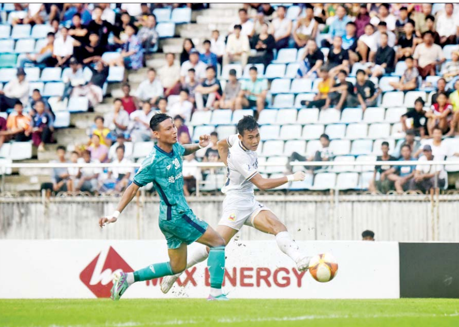
ရှမ်းယူနိုက်တက်အသင်းနှင့် ရန်ကုန်ယူနိုက်တက်အသင်းတို့ ဇွန် ၁၉ ရက်က MNL League Cup ဗိုလ်လုပွဲ ယှဉ်ပြိုင်ကစားကြစဉ်။

ရန်ကုန် ဇွန် ၂၀ မြန်မာနေရှင်နယ်လိဂ်သည် ၂၀၂၄-၂၀၂၅ ရာသီ MNL အမှတ်ပေးပြိုင်ပွဲ ပွဲစဉ်ဇယားကို ဇွန် ၂၀ ရက်က ထုတ်ပြန်လိုက်ပြီဖြစ်သည်။ ကျင်းပမည့်ကာလပြောင်းလဲ လာမည့်ရာသီ MNL အမှတ်ပေးပြိုင်ပွဲတွင် အသင်းစုစုပေါင်း ၁၂ သင်း ဝင်ရောက်ယှဉ်ပြိုင်မည် ဖြစ်ပြီး ၂၀၂၄ ခုနှစ် ဇူလိုင် ၆ ရက်မှ ၂၀၂၅ ခုနှစ် ဖေဖော်ဝါရီ ၁၆ ရက်အထိ ကျင်းပမည်ဖြစ်သည်။ မြန်မာနေရှင်နယ်လိဂ်သည် ကမ္ဘာ့ဘောလုံးအဖွဲ့ချုပ် နှင့် အာရှဘောလုံးအဖွဲ့ချုပ်က သတ်မှတ်ထားသည့် ဘောလုံးပြကွဒိန်နှင့် ကိုက်ညီစေရန် MNL အမှတ် ပေးပြိုင်ပွဲ ကျင်းပမည့်ကာလကို ပြောင်းလဲခဲ့ခြင်း ဖြစ်ပြီး ပြိုင်ပွဲသမိုင်းတစ်လျှောက် ပထမဆုံးအကြိမ် ပြကွဒိန်နှစ် နှစ်ခုတွင် ကျင်းပမည်ဖြစ်သည်။ လာမည့်ရာသီ MNL အမှတ်ပေးပြိုင်ပွဲကို ရန်ကုန်၊ တောင်ကြီးနှင့် ပုသိမ်မြို့တို့တွင် ကျင်းပ မည်ဖြစ်ပြီး ရန်ကုန်ယူနိုက်တက်၊ ရှမ်းယူနိုက်တက်နှင့် ဧရာဝတီယူနိုက်တက်အသင်းတို့က အိမ်ကွင်းပွဲများ စာမျက်နှာ ၁၇ ကော်လံ ၁ သို့ *