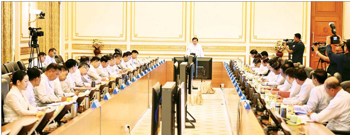
နိုင်ငံတော်စီမံအုပ်ချုပ်ရေးကောင်စီဥက္ကဋ္ဌ နိုင်ငံတော်ဝန်ကြီးချုပ် ဗိုလ်ချုပ်မှူးကြီး မင်းအောင်လှိုင် ပြည်ထောင်စုအစိုးရအဖွဲ့အစည်းအဝေးတွင် အမှာစကားပြောကြားစဉ်။