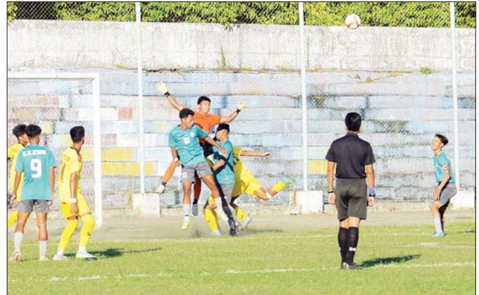
၂၀၂၄ ခုနှစ် ပဉ္စမအကြိမ် အမျိုးသားအားကစားပွဲတော် အားကစားပြိုင်ပွဲ ဝန်ကြီးဌာနပေါင်းစုံ အလွတ်တန်း အမျိုးသားဘောလုံးပြိုင်ပွဲတွင် ပြည်ထဲရေးဝန်ကြီးဌာနအသင်းနှင့် သာသနာရေးနှင့် ယဉ်ကျေးမှုဝန်ကြီး ဌာနအသင်းတို့ အကြိတ်အနယ် ယှဉ်ပြိုင်ကစားစဉ်။

ချထားရေးဝန်ကြီးဌာနအသင်းက ရိုးမရှိဖြင့်လည်းကောင်း၊ သမဝါယမ ဝန်ကြီးဌာနအသင်းကို သုံးရိုး- ရိုး မရှိဖြင့်လည်းကောင်း အနိုင်ရရှိခဲ့ ဌာနအသင်းက သိပ္ပံနှင့်နည်းပညာ ကြသည်။