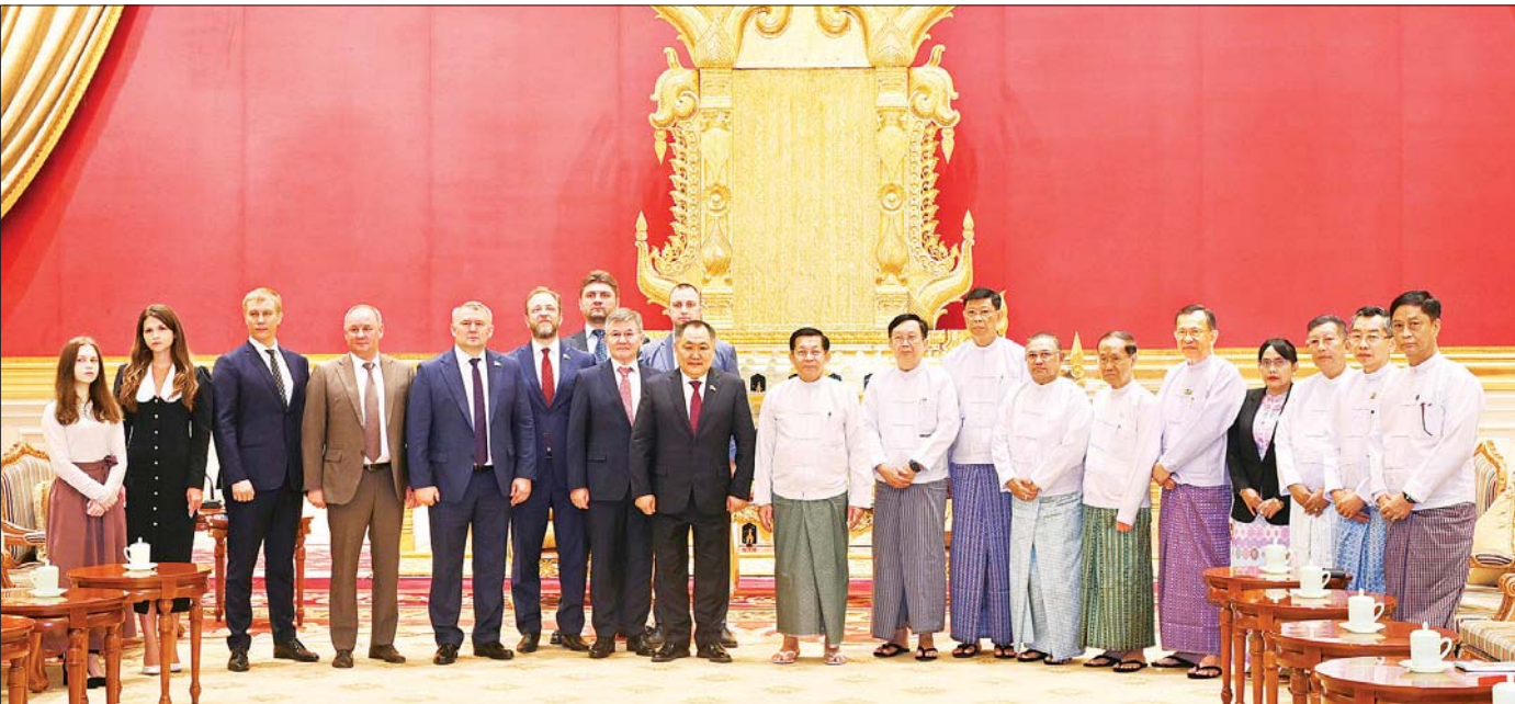
နိုင်ငံတော်စီမံအုပ်ချုပ်ရေးကောင်စီဥက္ကဋ္ဌ နိုင်ငံတော်ဝန်ကြီးချုပ် ဗိုလ်ချုပ်မှူးကြီး မင်းအောင်လှိုင်နှင့် အဖွဲ့ဝင်များ ရုရှားဖက်ဒရေရှင်းနိုင်ငံ ဒူးမားလွတ်တော် ဒုတိယဥက္ကဋ္ဌ H. E. Mr. Sholban Kara-Ool ဦးဆောင်သည့် ကိုယ်စားလှယ်အဖွဲ့နှင့်အတူ စုပေါင်းမှတ်တမ်းတင်စာတိပိုရိုက်စဉ်။

စုပေါင်းမှတ်တမ်းတင်စာတိပိုရိုက်တွေ့ဆုံပွဲအပြီးတွင် နိုင်ငံတော်စီမံအုပ်ချုပ်ရေးကောင်စီဥက္ကဋ္ဌ နိုင်ငံတော်ဝန်ကြီးချုပ်နှင့် ရုရှားဖက်ဒရေရှင်းနိုင်ငံ ဒူးမားလွတ်တော် ဒုတိယဥက္ကဋ္ဌတို့သည် အမှတ်တရ လက်ဆောင်ပစ္စည်းများ အပြန်အလှန်ပေးအပ်ပြီး စုပေါင်းမှတ်တမ်းတင်စာတိပိုရိုက်ခဲ့ကြကြောင်း သတင်းရရှိသည်။ သတင်းစဉ်