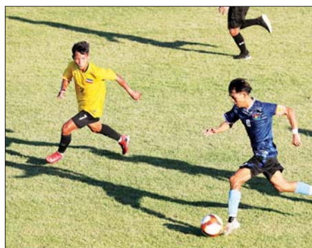
၂၀၂၄ ခုနှစ် ပဉ္စမအကြိမ် အမျိုးသားအားကစားပွဲတော် အားကစားပြိုင်ပွဲ ပြည်နယ်နှင့် တိုင်းဒေသကြီး အသက် (၂၀) နှစ်အောက် အမျိုးသားဘောလုံးပြိုင်ပွဲတွင် ကရင်ပြည်နယ်အသင်းနှင့် ကယားပြည်နယ် အသင်းတို့ အကြိတ်အနယ် ယှဉ်ပြိုင်ကစားစဉ်။

အသက် (၂၅)နှစ်အောက် အမျိုးသမီး ဘောလုံးပြိုင်ပွဲ ကျင်းပ ထိုပြင် ပြည်နယ်နှင့်တိုင်း ဒေသကြီး အသက် (၂၅) နှစ် အောက် အမျိုးသမီးဘောလုံး ပြိုင်ပွဲ ပွဲစဉ်များကို မွန်လုံပိုင်းတွင် ဘောဂဝတီအားကစားကွင်းနှင့် လယ်ဝေးမြို့နယ်အားကစားကွင်း တို့၌ ယှဉ်ပြိုင်ကစားကြရာ မကျေတိုင်းသေသကြီး အသင်းက ကရင်ပြည်နယ်အသင်းကို တစ်ရိုး- ရိုးမရှိဖြင့်လည်းကောင်း၊ ကချင် ပြည်နယ်အသင်းက ပြည်ထောင်စု နယ်မြေ နေပြည်တော်အသင်းကို သုံးရိုး-တစ်ရိုးဖြင့် လည်းကောင်း အနိုင်ရရှိခဲ့ကြသည်။