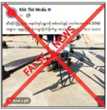
အဆိုပါသတင်းနှင့်ပတ်သက်၍ လုံခြုံရေးတပ်ဖွဲ့ဝင်များအနေဖြင့် ဆီဆိုင်

နေပြည်တော် ဒီဇင်ဘာ ၃ ရှမ်းပြည်နယ် (တောင်ပိုင်း) ဆီဆိုင်မြို့နယ် နောင်ရင်းရွာကို လုံခြုံရေးတပ်ဖွဲ့ဝင်များက ဒရုန်းဖြင့် ဖုံးကြံတိုက်ခိုက်ခဲ့မှုကြောင့် အသက် နှစ်နှစ်အရွယ် ကလေးငယ်တစ်ဦးနှင့် အမျိုးသမီးတစ်ဦး တို့သေဆုံးပြီး အမျိုးသားတစ်ဦး အပြင်းအထန်ဒဏ်ရာရရှိခဲ့ကြောင်း မဟုတ်မမှန်သတင်းများ ရေးသားဖြန့်ဝေလျက်ရှိကြောင်း တွေ့ရှိရသည်။