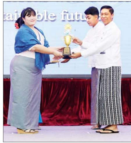
မသန်စွမ်းသူများ၏ အခွင့်အရေးများဆိုင်ရာ အမျိုးသားကော်မတီ ဒုတိယဥက္ကဋ္ဌ(၁)ပြည်ထောင်စုဝန်ကြီး ဒေါက်တာစိုးဝင်း အလုပ်အကိုင် အခွင့်အလမ်း ဂုဏ်ပြုဆုရရှိသူတစ်ဦးအား ဂုဏ်ပြုဆုနှင့် ဂုဏ်ပြု မှတ်တမ်းလွှာပေးအပ်စဉ်။

စာမျက်နှာ ၆ မှ မသန်စွမ်းသူများအနေဖြင့် အသက်မွေးဝမ်းကျောင်း လုပ်ငန်း များ လုပ်ကိုင်နိုင်ခြင်းဖြင့် လူမှုရေးပိုင်းဆိုင်ရာ အကျိုးဝင်မှု သာမက စီးပွားရေးအကျိုးဝင်မှုပါ ရရှိပြီး အမှီအခိုကင်းစွာ ဘဝ ရပ်တည်နေထိုင်နိုင်မည် ဖြစ်ကြောင်း၊ မသန်သော်လည်း စွမ်းဆောင်ရည်ရှိသူများ ဖြစ်ကြောင်း၊ နားလည်လက်ခံပြီး မသန်စွမ်းသူများကို အဖွဲ့အစည်း များတွင် ပါဝင်ဆောင်ရွက်စေခြင်း၊ မူဝါဒနှင့် ဆုံးဖြတ်ချက် ချမှတ်သည့် နေရာများတွင် တာဝန် ထမ်းဆောင်စေခြင်းတို့ကို ဆောင်ရွက်ကြရမည်ဖြစ်ကြောင်း။ မသန်စွမ်းသူအားလုံး လွှမ်းမိုးနိုင်သည့် ဖွံ့ဖြိုးတိုးတက်ရေးကို ဖော်ဆောင်နိုင်ရန် မသန်စွမ်းမှု အဆင့်သတ်မှတ်ခြင်းနှင့် မသန်စွမ်းသူများ မှတ်ပုံတင်ခြင်း လုပ်ငန်းကို စီမံကိန်းမြို့နယ် ၂၃ ခုတွင် လတ်တလော အကောင်အထည်ဖော် ဆောင်ရွက်လျက် ရှိရာတွင် ယနေ့အထိ ၅၉၃၇ ဦး မသန်စွမ်းမှတ်ပုံတင်နိုင်ခဲ့ပြီးဖြစ်ကြောင်း၊ မသန်စွမ်းသူများအပေါ်