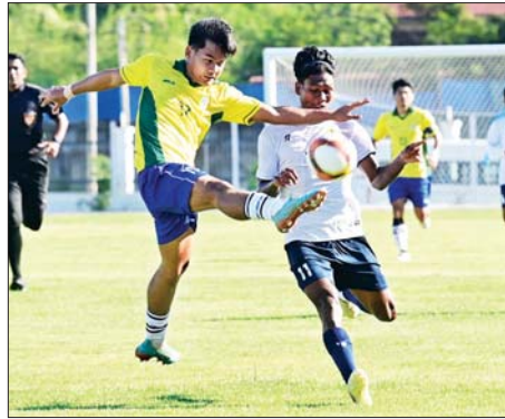
၂၀၂၄ ခုနှစ် ပဉ္စမအကြိမ် အမျိုးသားအားကစားပွဲတော် အားကစား ပြိုင်ပွဲ ဝန်ကြီးဌာနပေါင်းစုံ အလွတ်တန်း အမျိုးသားဘောလုံးပြိုင်ပွဲ တွင် လူမှုဝန်ထမ်း၊ ကယ်ဆယ်ရေးနှင့် ပြန်လည်နေရာချထားရေး ဝန်ကြီးဌာနအသင်းနှင့် ပို့ဆောင်ရေးနှင့် ဆက်သွယ်ရေးဝန်ကြီးဌာန အသင်းတို့ အကြိတ်အနယ် ယှဉ်ပြိုင်ကစားစဉ်။

စာမျက်နှာ ၁၂ မှ တစ်ဖက်တစ်ရိုးစီ သရဖိုင်လည်း ကောင်း၊ ကယားပြည်နယ်အသင်းက ကရင်ပြည်နယ်အသင်းကို နှစ် ရိုး-ရိုးမရှိဖြင့်လည်းကောင်း အနိုင် ရရှိခဲ့ကြသည်။