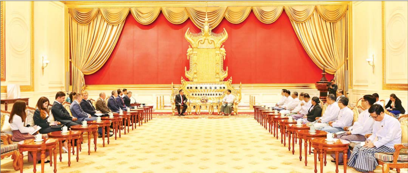
နိုင်ငံတော်စီမံအုပ်ချုပ်ရေးကောင်စီဥက္ကဋ္ဌ နိုင်ငံတော်ဝန်ကြီးချုပ် ဗိုလ်ချုပ်မှူးကြီး မင်းအောင်လှိုင် ထံ ရှုရှားဖက်ဒရေးရှင်းနိုင်ငံ ခူးမားလွတ်တော် ဒုတိယဥက္ကဋ္ဌ H. E. Mr. Sholban Kara-Ool ဦးဆောင်သည့် ကိုယ်စားလှယ်အဖွဲ့ လာရောက်ဂါရဝပြုတွေ့ဆုံစဉ်။