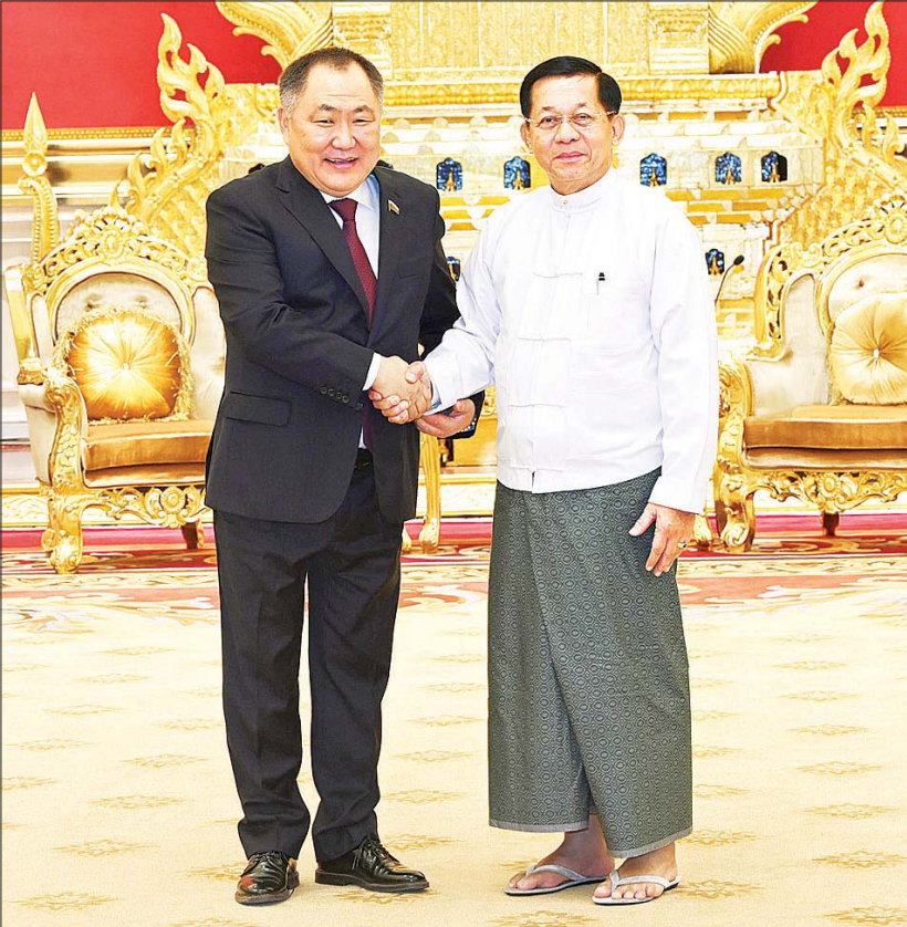
နိုင်ငံတော်စီမံအုပ်ချုပ်ရေးကောင်စီဥက္ကဋ္ဌ နိုင်ငံတော်ဝန်ကြီးချုပ် ဗိုလ်ချုပ်မှူးကြီး မင်းအောင်လှိုင် ရုရှားဖက်ဒရေရှင်းနိုင်ငံ ဒူးမားလွတ်တော် ဒုတိယဥက္ကဋ္ဌ H. E. Mr. Sholban Kara-Ool အား ရင်းရင်းနှီးနှီး နှုတ်ဆက်စဉ်။

ပိုမိုတိုးတက် ကောင်းမွန်လျက်ရှိမှုအခြေအနေများ၊ နှစ်နိုင်ငံအဆင့်မြင့်အရာရှိကြီးများ ချစ်ကြည်ရေးခရီး အပြန်အလှန် သွားရောက်လျက်ရှိမှု အခြေအနေများ၊ မြန်မာနိုင်ငံ၏ နိုင်ငံရေးဖြစ်ပေါ်ပြောင်းလဲမှုများအပေါ် နိုင်ငံတကာမျက်နှာစာတွင် ရုရှားနိုင်ငံအနေဖြင့် ခိုင်ခိုင်မာမာရပ်တည်ပေးလျက်ရှိမှုနှင့် မြန်မာနိုင်ငံအနေဖြင့်လည်း ရုရှားနိုင်ငံ၏ နိုင်ငံရေးဖြစ်ပေါ်ပြောင်းလဲမှုများအပေါ် ခိုင်ခိုင်မာမာရပ်တည်ပေးလျက်ရှိမှု အခြေအနေများ၊ မြန်မာနိုင်ငံ၌ လွတ်လပ်၍ တရားမျှတသည့် ရွေးကောက်ပွဲကျင်းပနိုင်ရေး ကြိုတင်ပြင်ဆင်ဆောင်ရွက်လျက်ရှိမှုနှင့် မှလေ့လာရေးအဖွဲ့များ ဖိတ်ခေါ်သွားမည့် အခြေအနေများ၊ ဥပဒေပိုင်းဆိုင်ရာများတွင် ပူးပေါင်းဆောင်ရွက်နိုင်သည့်အခြေအနေများ၊ ဘာသာရေးနှင့်ယဉ်ကျေးမှုများ ဆိုင်ရာများတွင် အပြန်အလှန်ဖလှယ်နိုင်မှုအခြေအနေများ၊ လူငယ်ရေးရာကိစ္စရပ်များတွင် အပြန်အလှန်ပူးပေါင်းဆောင်ရွက်နိုင်မည့် အခြေအနေများ၊ ခရီးသွား