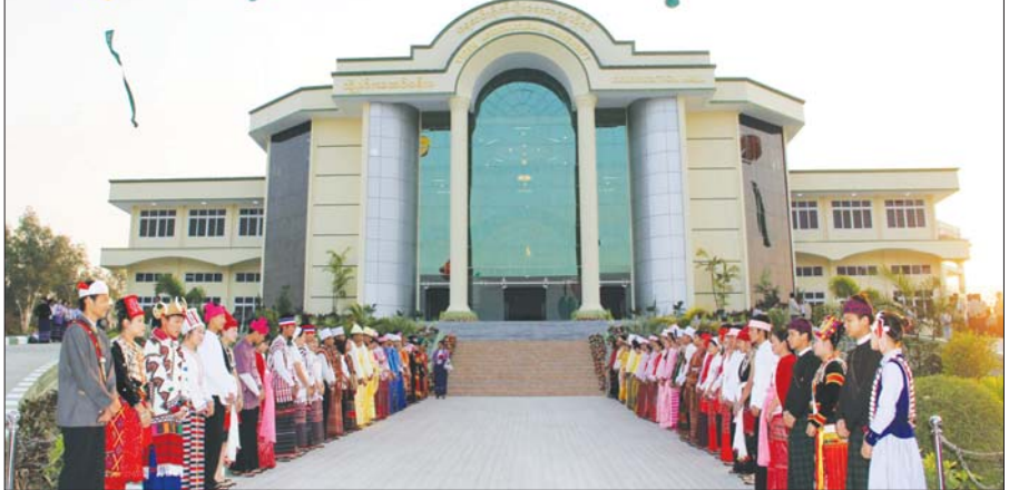
တက္ကသိုလ် နှစ် (၉၀) ပြည့်အထိမ်းအမှတ် ၂၀၁၄ ခုနှစ် မတ်လ ၂ ရက်နေ့ (တောင်သူလယ်သမားနေ့) တွင် ဖွင့်လှစ်သော ရေဆင်းစိုက်ပျိုးရေး တက္ကသိုလ်ဘွဲ့နှင်းသဘင်ခန်းမ။

သကဲ့သို့ တက္ကသိုလ်၏ အခြေခံအဆောက်အအုံများကိုလည်း ခေတ်မီပြီး အရည်အသွေးကောင်းမွန်စေရန် နိုင်ငံတော်၏ ပံ့ပိုးမှုဖြင့် အဓိကလုပ်ဆောင်နေပါသည်။ စိုက်ပျိုးရေးအပါအဝင် နည်းပညာအရှိန်အဟုန်ဖြင့် ဖွံ့ဖြိုးတိုးတက်နေသောခေတ်တွင် နိုင်ငံတကာသို့ သွားရောက်၍ အဆင့်မြင့်ဘွဲ့ လွန်ဘာသာရပ်အလိုက် ပညာဆက်လက်သင်ယူနိုင်ပြီး အမိန့်နိုင်ငံအတွင်း အဆိုပါ ဘာသာရပ်ကဏ္ဍတိုးတက်ဖွံ့ဖြိုးမှုကို အကျိုးရှိထိရောက်စွာ စွမ်းဆောင်နိုင်ကြသော သက်ဆိုင်ရာဘာသာရပ် ကျွမ်းကျင်ဘွဲ့ရများ ဖြစ်လာစေရေး သင်ကြားပို့ချမှုစနစ်နှင့် သင်ရိုးညွှန်းတမ်းများကိုလည်း မျက်မြင်မြင်ပတ်ညှိနှိုင်းပြင်ဆင်မှုများ ဆောင်ရွက်သည့်တက္ကသိုလ်ဖြစ်ပါသည်။ ထို့ကြောင့် ရေဆင်းစိုက်ပျိုးရေးတက္ကသိုလ်အနေဖြင့် "စိုက်ပျိုး