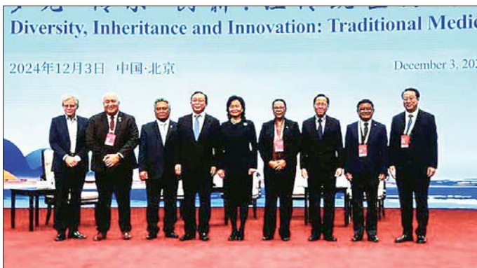
2024年12月3日 中国·北京 December 3, 2024

၂၀၂၄ ခုနှစ် ကမ္ဘာတိုင်းရင်းဆေး ညီလာခံကို ယနေ့တွင် တရုတ် ပြည်သူ့သမ္မတနိုင်ငံ ဝေကျင်းမြို့၊ China National Convention Center ၌ ကျင်းပရာ ပြည်ထောင်စုဝန်ကြီး ဒေါက်တာ သက်ခိုင်ဝင်းသည် တရုတ်ပြည်သူ့ သမ္မတနိုင်ငံ အမျိုးသားကျန်းမာ ရေးကော်မရှင်၊ ကျန်းမာရေး ဝန်ကြီး၊ အခြားဖိတ်ကြားထား သည့် နိုင်ငံများမှ ကျန်းမာရေး ဝန်ကြီးများ၊ ကျန်းမာရေးဆိုင်ရာ အဆင့်မြင့်အရာရှိကြီးများ၊ ကမ္ဘာ့ ကျန်းမာရေးအဖွဲ့ (WHO) မှ အဆင့်မြင့် ကိုယ်စားလှယ်များ၊ အခြား ဖိတ်ကြားထားသည့် ဧည့်သည်တော်များနှင့် အတူ တက်ရောက်ကြသည်။ ရှေးဦးစွာ တရုတ်ပြည်သူ့ သမ္မတနိုင်ငံသမ္မတ ရှီကျင့်ဖျင်က ပေးပို့သည့် ဂုဏ်ပြုသဝဏ်လွှာကို ဖတ်ကြားပြီး တရုတ်ပြည်သူ့