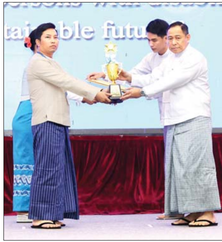
နိုင်ငံတော်စီမံအုပ်ချုပ်ရေးကောင်စီအဖွဲ့ဝင် ဒုတိယဗိုလ်ချုပ်ကြီး ရာပြည့် မသန်စွမ်းသူများအတွက် အတားအဆီးမဲ့ ခရီးသွားလာရေး ဂုဏ်ပြုဆုရရှိသူတစ်ဦးအား ဂုဏ်ပြုဆုနှင့် ဂုဏ်ပြုမှတ်တမ်းလွှာ ပေးအပ်စဉ်။