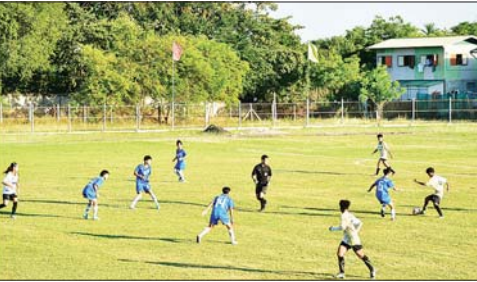
၂၀၂၄ ခုနှစ် ပဉ္စမအကြိမ် အမျိုးသားအားကစားပွဲတော် အားကစားပြိုင်ပွဲ ပြည်နယ်နှင့် တိုင်းဒေသကြီး အသက် (၂၅)နှစ်အောက် အမျိုးသမီး ဘောလုံးပြိုင်ပွဲတွင် ပြည်ထောင်စုနယ်မြေ နေပြည်တော်အသင်းနှင့် ကချင်ပြည်နယ်အသင်းတို့ အကြိတ်အနယ်ယှဉ်ပြိုင်ကစားနေမှု အားကစား ဝါသနာရှင်ပြည်သူများ စိတ်ပါဝင်စားစွာ ကြည့်ရှုအားပေးစဉ်။

သမီး)၊ ကရာတေး (အမျိုးသား/ အမျိုးသမီး)၊ ပိုက်ဂျက်ခြင်း (အမျိုးသား/ အမျိုးသမီး)၊ ရေကူး အလိုက် အဖွဲ့ချုပ်များမှ တာဝန်ရှိ (အမျိုးသား/ အမျိုးသမီး)၊ စားပွဲ သူများ၊ ဝန်ထမ်းများ၊ ကျောင်းသား တင်တင်းနှစ် (အမျိုးသား/ အမျိုး သမီး)၊ တိုက်ကွမ်ဒို (အမျိုးသား/ အမျိုးသမီး)၊ တင်းနစ်(အမျိုးသား)၊ ရိုးရာခြင်းလုံး (အမျိုးသား/ အမျိုး သမီး)၊ မြန်မာ့သိုင်း (အမျိုးသား/ အမျိုးသမီး)၊ ဘော်လီဘော (အမျိုးသား/ အမျိုးသမီး)၊ ဗိုလ်ချုပ် ကျင်းပသည့် ဝန်ကြီးဌာနအဆင့် (အမျိုးသား/အမျိုးသမီး)၊ အလေးမ အားကစားနည်း ခြောက်မျိုးတွင် (အမျိုးသား/ အမျိုးသမီး)၊ ဝူရှူး ပြေးခုန်ပစ် (အမျိုးသား/ အမျိုး သမီး)၊ ဘောလုံး (အမျိုးသား)၊ ဖူဆယ်(အမျိုးသား)၊ ဂေါက်သီး (အမျိုးသား)၊ ပိုက်ဂျက်ခြင်း (အမျိုးသား) နှင့် ဘော်လီဘော (အမျိုးသား)ပြိုင်ပွဲများ၊ ပြည်နယ် နှင့် တိုင်းဒေသကြီးအဆင့် အားကစားနည်း ၂၃ မျိုးတွင် ပြေးခုန်ပစ် (အမျိုးသား/ အမျိုး သမီး)၊ ဘတ်စကက်ဘော (အမျိုး သား)၊ ဘိုလီယက်/ စနူကာ (အမျိုးသား)၊ လက်ဝှေ့ (အမျိုးသား)၊ ကာယဗလနှင့် အမျိုးသမီး)၊ အမျိုးသား/ အမျိုးသမီး)၊ ခရစ်ကတ် (အမျိုးသား)၊ ဘောလုံး(အမျိုးသား/ အမျိုးသမီး)၊ ဖူဆယ် (အမျိုးသား/ အမျိုးသမီး)၊ ဂေါက်သီး (အမျိုး သား)၊ ဂျူဒို (အမျိုးသား/အမျိုး သတင်းစဉ်