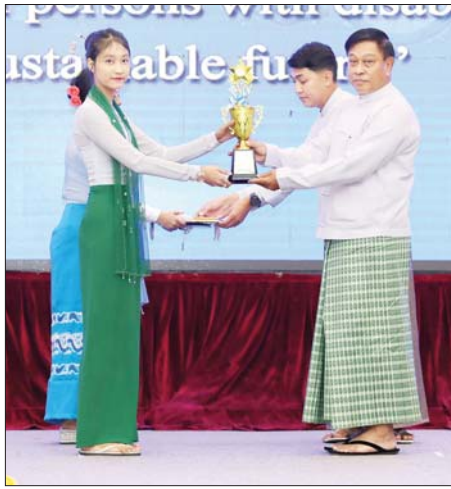
နိုင်ငံတော်စီမံအုပ်ချုပ်ရေးကောင်စီအဖွဲ့ဝင် ဗိုလ်ချုပ်ကြီး တင်အောင်စန်း အခြေခံပညာအထက်တန်းအဆင့် စာစီစာကုံး ပြိုင်ပွဲတွင် ပထမဆုရရှိသည့် မရွှေစင်ဖြူအား ဂုဏ်ပြုဆုနှင့် ဂုဏ်ပြု မှတ်တမ်းလွှာ ပေးအပ်စဉ်။

( ၃-၉-၂၀၂၄ ရက်နေ့တွင် နိုင်ငံတော်စီမံအုပ်ချုပ်ရေးကောင်စီဥက္ကဋ္ဌ နိုင်ငံတော်ဝန်ကြီးချုပ် ဗိုလ်ချုပ်မှူးကြီး မင်းအောင်လှိုင် ရှမ်းပြည်နယ်အစိုးရအဖွဲ့ဝင်များ၊ ပြည်နယ်နှင့် ခရိုင်အဆင့်ဌာနဆိုင်ရာတာဝန်ရှိသူများအား ပြောကြားသည့် အမှာစကားမှ ကောက်နုတ်ချက် )