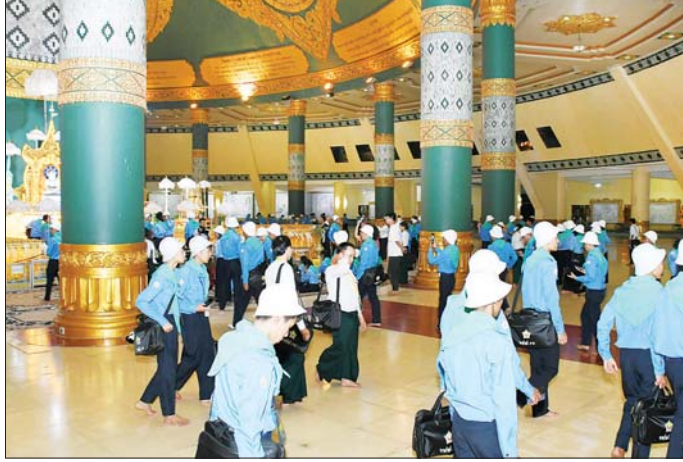
လူရည်ချွန်ကျောင်းသား ကျောင်းသူများ နေပြည်တော်ဥပ္ပါတသန္တိ စေတီတော်မြတ်ကြီးအား ဖူးမြော်လေ့လာကြည့်ညိကြစဉ်။

ဗိသုကာလက်ရာများဖြင့် ခမ်းနားထည်ဝါစွာ တည်ထားပူဇော်ထားသည့် ကျောက်စာရံစေတီတော်နှင့်အခြားသာသနိက အဆောက်အဦများကို ဆက်လက်ဖူးမြော်လေ့လာကြည့်ညိခဲ့ကြသည်။ ဆက်လက်၍ လူရည်ချွန်ကျောင်းသား ကျောင်းသူများသည် ဥပ္ပါတသန္တိစေတီတော်မြတ်ကြီးသို့ ရောက်ရှိကြကာ စေတီတော်မြတ်ကြီး လိုဏ်တော်အတွင်းရှိ ကျောက်စိမ်းရုပ်ပွားတော်များနှင့် စေတီတော်ရင်ပြင်အတွင်း လှည့်လည်ဖူးမြော်ကြည့်ညိကြပြီး စေတီတော်အရှေ့ဘက်မှခံရ ရတနာဆင်ဖြူတော်ထိန်းသိမ်းစောင့်ရှောက်ရေးဥပ္ပါတသို့ သွားရောက်၍ ဆင်ဖြူတော်များကို လေ့လာကြည့်ညိကြသည်။