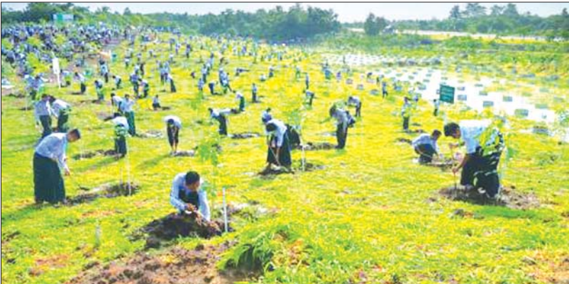
၂၀၂၃ ခုနှစ် မိုးရာသီ သစ်ပင်စိုက်ပျိုးပွဲအခမ်းအနားကို လယ်ဝေးမြို့နယ် ရန်အောင်မြင်ကြီးပိုင်း အကွက်အမှတ်(၁၃)အတွင်း ကျောင်းသား ကျောင်းသူများနှင့် တာဝန်ရှိသူများက စုပေါင်းစိုက်ပျိုးကြစဉ်။

ဗီဇ အရင်းအမြစ်များ၊ ဇီဝမျိုးစုံမျိုးကွဲများ၊ စားရေရိက္ခာများ စသည့် ထောက်ပံ့မှုဆိုင်ရာ ဝန်ဆောင်မှုများ၊