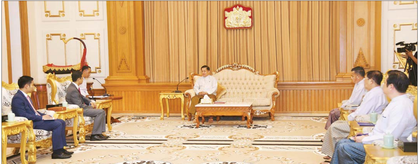
နိုင်ငံတော်စီမံအုပ်ချုပ်ရေးကောင်စီဥက္ကဋ္ဌ နိုင်ငံတော်ဝန်ကြီးချုပ် ဗိုလ်ချုပ်မှူးကြီး မင်းအောင်လှိုင် မြန်မာနိုင်ငံဆိုင်ရာ ကမ္ဘောဒီးယားနိုင်ငံ သံအမတ်ကြီး H.E. Mr. CHUM Angvichet အား လက်ခံတွေ့ဆုံစဉ်။