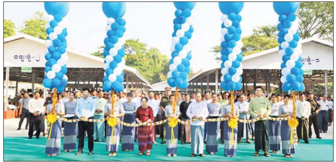
ဈေးရုံသစ်သည် အလျား ပေ ၆၀၊ အနံ ပေ ၄၀၊ သာယာရေးအဖွဲ့က တာဝန်ယူ တည်ဆောက်ခဲ့ ဈေးရုံ လေးရုံနှင့် အလျား ပေ ၄၀၊ အနံ ၂၄ ပေရှိ ကြောင်း သိရသည်။ စားသောက်ရုံသစ် တစ်ရုံကို မုံရွာမြို့နယ် စည်ပင် တိုင်းဒေသကြီး(ပြန်/ဆက်)

ပြောကြားသည်။ ဆက်လက်ပြီး တိုင်းဒေသကြီးဝန်ကြီးချုပ်၊ တိုင်းဒေသကြီး စီးပွားရေးရာဝန်ကြီး ဒေါ်ရီရီသန်း၊ တိုင်းဒေသကြီး စည်ပင်သာယာရေးအဖွဲ့ ဥက္ကဋ္ဌကြားရေးမှူး ဦးသစ်ထူးမြင့်နှင့် မုံရွာခရိုင် စီမံအုပ်ချုပ်ရေးအဖွဲ့ဥက္ကဋ္ဌ ဦးဇော်တင်မိုးတို့က “ဗန္ဓုလဈေး” ဈေးရုံသစ်များကို ဖဲကြိုးဖြတ် ဖွင့်လှစ်ပေးကြသည်။ (ယာဝု) ထို့နောက် တိုင်းဒေသကြီးဝန်ကြီးချုပ်နှင့် တာဝန်ရှိသူများသည် ဈေးရုံသစ်အတွင်း ဈေးရောင်း၊ ဈေးဝယ်များ စနစ်တကျရောင်းချနေမှုများကို လိုက်လံကြည့်ရှုစစ်ဆေးပြီး ဈေးရောင်းချသူများကို ရင်းရင်းနှီးနှီး နှုတ်ဆက်စကား ပြောကြားသည်။ အဆိုပါ မုံရွာမြို့ မြို့သစ်ရပ်ကွက်ရှိ ဗန္ဓုလ