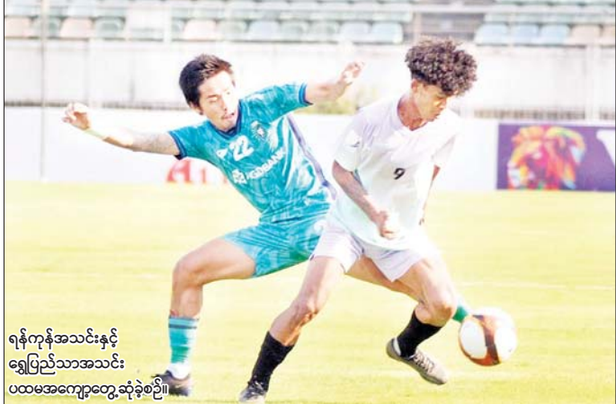
ရန်ကုန်အသင်းနှင့် ရွှေပြည်သာအသင်း ပထမအကျော့တွေ့ဆုံပွဲစဉ်။

ရန်ကုန် ဧပြီ ၂၄ ၂၀၂၄ MNL Cup ပြိုင်ပွဲအုပ်စု ဒုတိယအကျော့ပွဲစဉ်များကို ဧပြီ ၂၅ ရက်မှ မေ ၂၀ ရက်အထိ ကျင်းပမည်ဖြစ်ပြီး အဖွင့်ပွဲအဖြစ် ရွှေပြည်သာ-ရန်ကုန်၊ တက္ကသိုလ်-မဟာယူနိုက်တက်အသင်းတွေ့ဆုံနေသည်။ ဒုတိယအကျော့အဖွင့်ပွဲအဖြစ် ဧပြီ ၂၅ ရက် (ယနေ့) တွင် အုပ်စု (က) ပွဲစဉ်များကျင်းပမည်ဖြစ်ပြီး YUSC ကွင်း၌ ရွှေပြည်သာယူနိုက်တက်အသင်းနှင့် ရန်ကုန်ယူနိုက်တက်အသင်း၊ သုဝဏ္ဏကွင်း၌ မဟာယူနိုက်တက်အသင်းနှင့် စာမျက်နှာ ၁၈ ကော်လံ ၅ *