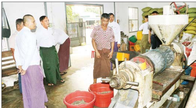
မြန်မာနိုင်ငံမှ ရေဆင်းမျိုး၊ ရှုရှားဖက်ဒါရေးရှင်းနိုင်ငံမှ Normal၊ Bravo၊ Excellent စသည့် ဆီထွက်သီးနှံ နေကြာစေ့များ၊ ပျဉ်းမနားမြို့နယ် Myanmar Agribusiness Public Cooperation Limited (MAP-

သမဝါယမနှင့် ကျေးလက်ဖွံ့ဖြိုးရေးဝန်ကြီးဌာန ပြည်ထောင်စုဝန်ကြီး ဦးလှမိုးသည် ယနေ့ မွန်းလွဲပိုင်း က ညွှန်ကြားရေးမှူးချုပ်များ၊ သက်ဆိုင်ရာတာဝန်ရှိ သူများနှင့်အတူ လယ်ဝေးမြို့နယ် ရုံးတော်ကျေးရွာ၌ ရွှေဝါထွန်း(၂) စိုက်ပျိုးထုတ်လုပ်ရေး သမဝါယမ အသင်း၏ အသင်းပိုင်မြေ ၁၅ ဧကပေါ်တွင် ရှုရှား သဘာဝမြေဩဇာအသုံးပြု၍ စမ်းသပ်စိုက်ပျိုးခြင်းမှ ထွက်ရှိသည့် မြန်မာနေကြာမျိုးနှင့် ရှုရှားနေကြာစေ့ များ ကြိတ်ခွဲဆောင်ရွက်နေမှု အခြေအနေများကို ကြည့်ရှုစစ်ဆေးသည်။