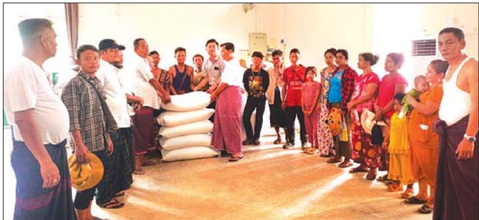
ရောက်ရှိနေကြပြီး ဆွေးနွေးချက်အိမ်၌ နေထိုင်နေကြရသည့် အိမ်ထောင်စုပေါင်း ၁၅၃၉ စု၊ လူဦးရေပေါင်း ၆၈၅၇ ဦး တို့အတွက် ဆန်ရိက္ခာ သုံးလစာဆန်အိတ်၆၄၂ အိတ်ကို လက်ဝယ်အရောက် ထောက်ပံ့ပေးခဲ့ကြောင်း သိရသည်။ လင်းသန့်(ပြန်/ဆက်)

လှိုင်းဘွဲ့မြို့နယ်ရှိ ယာယီတိုက်ပွဲရှောင်များအား ဆန်ရိက္ခာ သုံးလစာထောက်ပံ့ လှိုင်းဘွဲ့ ဧပြီ ၂၄ ကရင်ပြည်နယ် လှိုင်းဘွဲ့မြို့နယ် မြို့ပေါ်ရပ်ကွက်များနှင့် ကျေးရွာများရှိ ယာယီတိုက်ပွဲရှောင်များအတွက် ကရင်ပြည်နယ် အစိုးရအဖွဲ့မှ ထောက်ပံ့ပေးအပ်သော ဆန်အိတ်များကို ဧပြီ ၂၃ ရက်က အောင်ဆန်းခန်းမ၌ မြို့နယ်အုပ်ချုပ်ရေးမှူး ဦးဝင်းသန်းနှင့် အဖွဲ့ဝင်များက ဆက်လက် ထောက်ပံ့ပေးအပ်သည်။ လှိုင်းဘွဲ့မြို့နယ် မြိုင်ကြီးငူအထူးဒေသသို့ ဖာပွန်မြို့နယ်မှ ယာယီတိုက်ပွဲရှောင် ရောက်ရှိလာကြသော အိမ်ထောင်စုများနှင့် လှိုင်းဘွဲ့မြို့နယ် ပိုင်ကျုံမြို့၊ ကော့ကရိတ်မြို့နယ်နှင့် မြဝတီမြို့နယ်များမှ ယာယီတိုက်ပွဲရှောင်