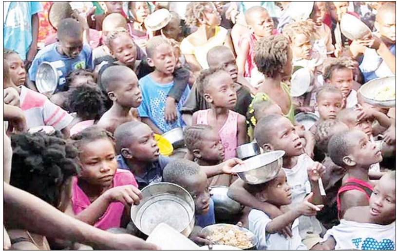
နိုင်ငံရေးအခြေအနေကြောင့် အစားအစာအတွက် ခုခွဲရောက်နေသည့် ဟေတီပြည်သူများ။

ကိုယ်ကျိုးအတွက်တော့ သူတွေ မြန်မာနိုင်ငံနဲ့ ဝေးဝေးနေပေးကြပါ။ အဲဒီလို နေပေးခြင်းဖြင့် မြန်မာနိုင်ငံရဲ့ ပြဿနာတွေ မြန်မြန်ဖြေရှင်းနိုင်မှာပါ။ အခြားနိုင်ငံတွေရဲ့ ဖြစ်စဉ်သာကောက် ထောက်ထားပြီး ကိုယ်ကျိုးအတွက်တော့ လက်ထဲ မြန်မာပြည်သူတွေရဲ့ ခုခွဲအတောမသတ် မဖြစ်ပါစေနဲ့။