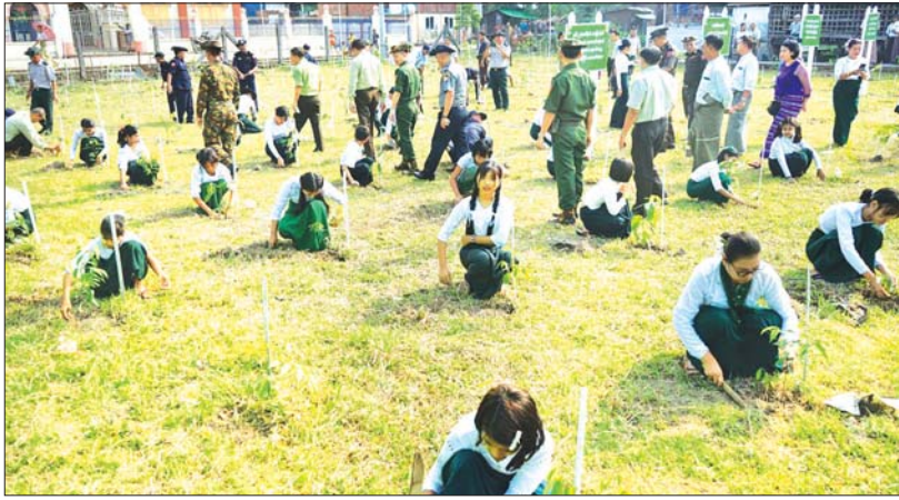
မွန်ပြည်နယ် သထုံမြို့နယ်၏ မိုးရာသီအကြိုစုပေါင်းသစ်ပင်စိုက်ပျိုးပွဲကို ၂၀၂၃ ခုနှစ် မေ ၂၀ ရက်က လိပ်အင်းရပ်ကွက်ရှိ အ.မ.က(စိန်ကုန်း)ကျောင်းဝင်းအတွင်း၌ ကျောင်းသား ကျောင်းသူများက စုပေါင်းစိုက်ပျိုးကြစဉ်။