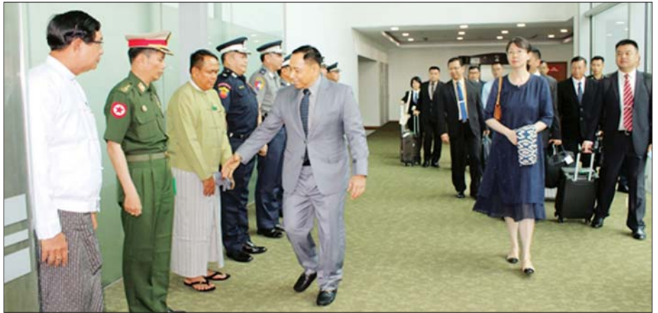
ကိုယ်စားလှယ်အရာရှိကြီးများလိုက်ပါ အဆိုပါ တရုတ်ပြည်သူ့သမ္မတနိုင်ငံ အလုပ်သဘောခရီးစဉ်တွင် နိုင်ငံတော်စီမံအုပ်ချုပ်ရေးကောင်စီ အဖွဲ့ဝင်၊ ပြည်ထောင်စုဝန်ကြီး ဦးဆောင်ပြီး ပြည်ထောင်စုဝန်ကြီးဌာနမှ ကိုယ်စားလှယ်အရာရှိကြီးများ လိုက်ပါသွားကြောင်း သိရသည်။ သတင်းစဉ်

နိုင်ငံတော်စီမံအုပ်ချုပ်ရေးကောင်စီအဖွဲ့ဝင်၊ ပြည်ထောင်စုဝန်ကြီး ဦးဆောင်သည့် မြန်မာကိုယ်စားလှယ်အဖွဲ့ကို ရန်ကုန်တိုင်းဒေသကြီး ဝန်ကြီးချုပ် ဦးစိုးသိန်း၊ ရန်ကုန်တိုင်းဒေသကြီး လုံခြုံရေးနှင့်နယ်စပ် ရေးရာဝန်ကြီး ဗိုလ်မှူးကြီး ဝင်းတင့်၊ မြန်မာနိုင်ငံဆိုင်ရာ တရုတ်နိုင်ငံ သံရုံး ဒုတိယအကြီးအကဲ Ms. Cao Jijie နှင့် ပြည်ထောင်စုဝန်ကြီးဌာနမှ တာဝန်ရှိသူများက ရန်ကုန်အပြည်ပြည်ဆိုင်ရာလေဆိပ်၌ ပို့ဆောင် နှုတ်ဆက်ကြသည်။ (ယာဝု)