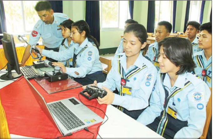
ရေကြောင်း၊ လေကြောင်းလူငယ်သင်တန်းသား သင်တန်းသူများအား သက်ဆိုင်ရာဘာသာရပ်အလိုက် နည်းပြများက သင်ကြားပို့ချပေးစဉ်။

နတ်မောက်မြို့နယ် မြို့မပျိုးဥယျာဉ်၌ ပျိုးပင်ပေါင်း ၉၃၄၀၀ ပျိုးထောင်ထားရှိ