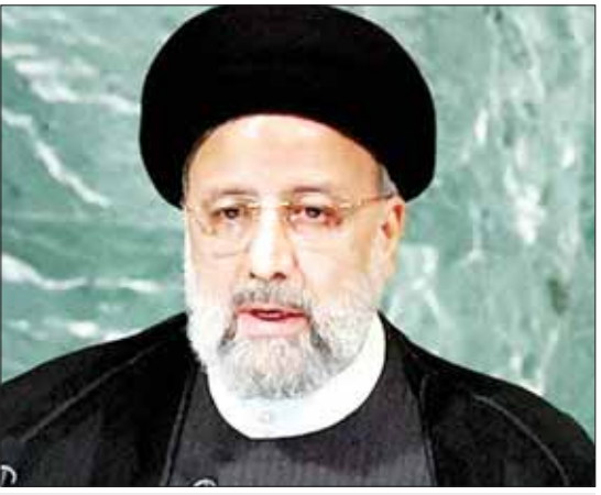
အီရန်သမ္မတ အီဗရာဟင် ရှိုင်စီ

အဆိုပါအဖွဲ့နှစ်ဖွဲ့စလုံးသည် ဟားမားစ်နှင့် စည်းလုံးညီညွတ်ကြောင်းပြသကာ အစွဲရောက်တိုက်ခိုက်မှုများ ဆက်လက်လုပ်ဆောင်လျက်ရှိသည်။