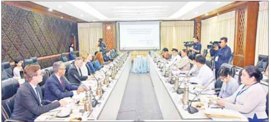
ဒုတိယဝန်ကြီးချုပ်နှင့် နိုင်ငံခြားရေးဝန်ကြီးဌာန ပြည်ထောင်စုဝန်ကြီး ဦးသန်းဆွေ မြန်မာနိုင်ငံရှိ ကုလသမဂ္ဂယာယီဌာနညှိနှိုင်းရေးမှူးနှင့် လူသားချင်းစာနာမှုဆိုင်ရာ ယာယီညှိနှိုင်းရေးမှူး၊ ကုလသမဂ္ဂအေဂျင်စီများမှ ကိုယ်စားလှယ်များအား တွေ့ဆုံစဉ်။

ဒုတိယဝန်ကြီးချုပ်နှင့် နိုင်ငံခြားရေးဝန်ကြီးဌာန ပြည်ထောင်စုဝန်ကြီးဦးသန်းဆွေသည် ယနေ့ မွန်းလွဲ ၂ နာရီတွင် နိုင်ငံခြားရေးဝန်ကြီးဌာန ရေဝတ်ခန်းမ၌ မြန်မာနိုင်ငံရှိ ကုလသမဂ္ဂယာယီဌာနညှိနှိုင်းရေးမှူးနှင့် လူသားချင်းစာနာမှုဆိုင်ရာ ယာယီညှိနှိုင်းရေးမှူး၊ ကုလသမဂ္ဂအေဂျင်စီများမှ ကိုယ်စားလှယ်များအား တွေ့ဆုံ၍ လူသားချင်းစာနာထောက်ထားမှုဆိုင်ရာ အကူအညီပေးမှုကိစ္စရပ်များကို ရှင်းလင်းဆွေးနွေးသည်။