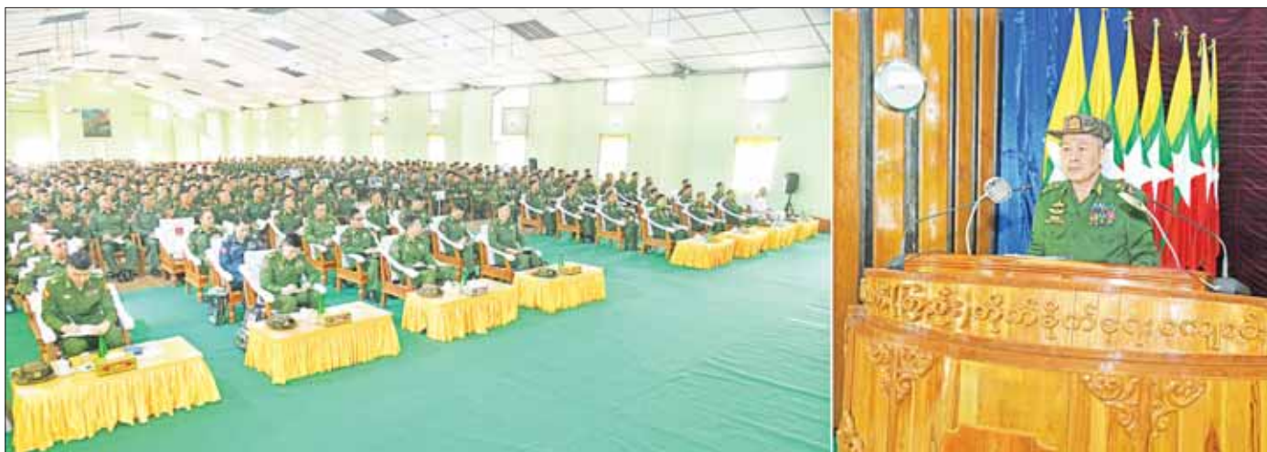
နိုင်ငံတော်စီမံအုပ်ချုပ်ရေးကောင်စီ ဒုတိယဥက္ကဋ္ဌ ဒုတိယတပ်မတော်ကာကွယ်ရေးဦးစီးချုပ် ကာကွယ်ရေးဦးစီးချုပ်(ကြည်း) ဒုတိယဗိုလ်ချုပ်မှူးကြီး စိုးဝင်း ဗထူးတပ်နယ်ရှိ ခြေလျင်တပ်စုမှူး သင်တန်းသားများနှင့် ဗိုလ်လောင်းများအား တွေ့ဆုံအမှာစကား ပြောကြားစဉ်။