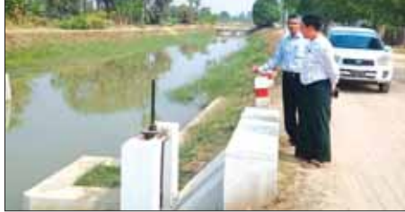
စလင်းမြို့နယ်အတွင်း စလင်း တစ်ဖွဲ့ရေကို လင်းစင်းဆည်မှ တစ်ဆင့် စိုက်ပျိုးရေးပေးပေးခဲ့ရာ ယခုအခါ စိုက်ပျိုးပြီး နွေစပါးဧက ၅၀၀ ကျော် ရှိနေပြီဖြစ်သည်။ ထို့ပြင် စလင်း၊ လင်းစင်းနှင့် မဲလီ ဆည်ရေသောက် နွေနှမ်းစိုက် ဧရိယာများအတွက် စိုက်ပျိုးရေး မောင်လွင် (စလင်း)

ယခုနှစ်တွင် ဆည်မြောင်းနှင့် ရေအသုံးချမှု စီမံခန့်ခွဲရေးဦးစီး ဌာနမှ တောင်သူများအား စိုက်ပျိုး ရေ ပြည့်ဝစွာ ပေးပေးနိုင်ရေး အတွက် ရေတံခါး အငယ်များ၊ ရေမြောင်းများတို့ကို ဖြုပြင် ဆောင်ရွက်ပေးခဲ့ကြောင်း ဆည် မြောင်းနှင့် ရေအသုံးချမှု စီမံခန့်ခွဲ ရေးဦးစီးဌာနမှ လက်ထောက် အင်ဂျင်နီယာ ဦးမျိုးမြင့်ထံမှ သိရသည်။