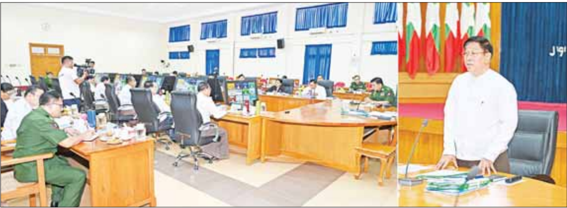
ပြည်သူ့စစ်မှုထမ်းဆောင်ရေးဗဟိုအဖွဲ့ဥက္ကဋ္ဌ နိုင်ငံတော်စီမံအုပ်ချုပ်ရေးကောင်စီဝင် ဒုတိယဝန်ကြီးချုပ်နှင့် ကာကွယ်ရေးဝန်ကြီးဌာန ပြည်ထောင်စုဝန်ကြီး ဗိုလ်ချုပ်ကြီး တင်အောင်စန်း ပြည်သူ့စစ်မှုထမ်းဆောင်ရေးဗဟိုအဖွဲ့ လုပ်ငန်းညှိနှိုင်းအစည်းအဝေး အမှတ်စဉ် (၃/၂၀၁၄) တွင် အမှာစကားပြောကြားစဉ်။

လုပ်ငန်းစဉ်များ ချမှတ်ပေးအစည်းအဝေးတွင် ပြည်သူ့စစ်မှုထမ်းဆောင်ရေးဗဟိုအဖွဲ့ ဥက္ကဋ္ဌ နိုင်ငံတော်စီမံအုပ်ချုပ်ရေးကောင်စီဝင် ဒုတိယဝန်ကြီးချုပ်နှင့် ကာကွယ်ရေးဝန်ကြီးဌာန ပြည်ထောင်စုဝန်ကြီး ဗိုလ်ချုပ်ကြီး တင်အောင်စန်းက ပြည်သူ့စစ်မှုထမ်းဆောင်ရေးနှင့်စပ်လျဉ်း၍ အစည်းအဝေး ၅ ကြိမ် ပြုလုပ်ခဲ့ပြီးဖြစ်ပါကြောင်း၊ ဗဟိုအဖွဲ့အနေဖြင့် လုပ်ငန်းအဖွဲ့များ အဆင့်ဆင့် ဖွဲ့စည်း တာဝန်ပေးအပ်ပြီး ရည်မှန်းချက် တာဝန်များပြီးမြောက်ရေး အရှိန်အဟုန်ဖြင့် ဆောင်ရွက်ခဲ့ပါကြောင်း၊ မြေပြင်တွင် လက်တွေ့ဆောင်ရွက်နေကြသည့် နေပြည်တော်ကောင်စီ၊ တိုင်းဒေသကြီးနှင့်ပြည်နယ် လုံခြုံရေးနှင့်နယ်စပ်ရေးရာ