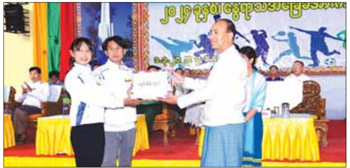
လမ်းပြကြယ် နွေရာသီအခြေခံ တောလုံးသင်တန်းမှ ဖြန့်မာနိုင်ငံတောလုံးအဖွဲ့ချုပ် မန္တလေးဘောလုံး အကယ်ဒမီကျောင်းတွင် တက်ရောက်ခွင့်ရရှိပြီး U-12၊ U-13၊ U-11 မြန်မာ့လက်ရွေးစင်အဖြစ် ရွေးချယ်

ထို့နောက် သင်တန်းနည်းပြဆရာများ၊ သင်တန်း ဆင်းလက်မှတ်၊ နွေရာသီအခြေခံအားကစားအလိုက် ထူးချွန်ဆရာရှိသူများနှင့် ဘင်ခရာတပ်ဖွဲ့၊ ပေါမူ