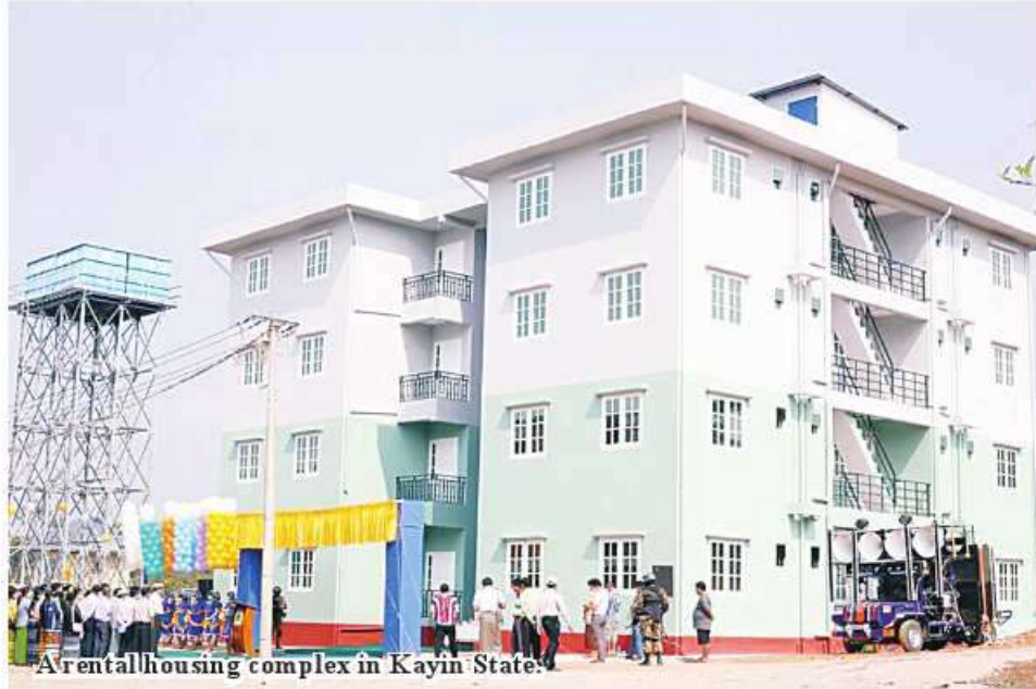
A rental housing complex in Kayin State.

Special Task Force-13 of the Ministry of Construction is building a three- storey building at Kayin State People's Hospital.