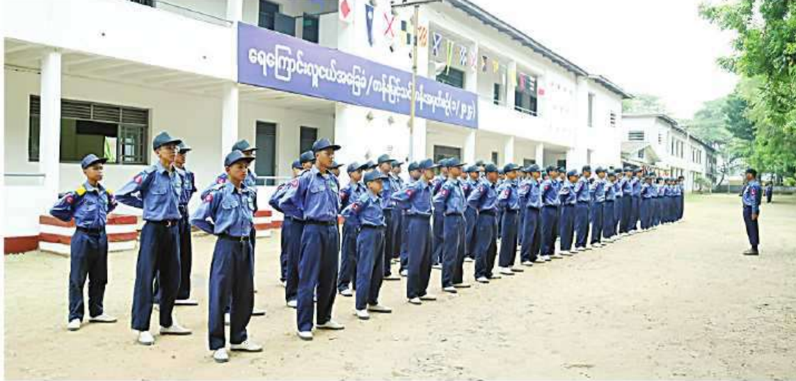
ရေကြောင်းလူငယ် အခြေခံ၊ တန်းမြှင့်သင်တန်းသား၊ သင်တန်းသူများအား သင်တန်းနည်းပြများက လေ့ကျင့်သင်ကြားပြသနေမှုကို တွေ့ရစဉ်။

သင်တန်းသူ ၁၂၂ ဦး၊ ရန်ကုန်တိုင်းဒေသကြီးရှိ အင်းယားရေကြောင်းလူငယ်စခန်းမှ သင်တန်းသား၊ သင်တန်းသူ ၉၇ ဦး၊ ကိုကိုးကျွန်းမြို့ရှိ ရေကြောင်းလူငယ်စခန်းမှ သင်တန်းသား၊ သင်တန်းသူ ၄၃ ဦး၊ ရောဝတီတိုင်းဒေသကြီး ဟိုင်းကြီးကျွန်းမြို့ရှိ ရေကြောင်းလူငယ်စခန်းမှ သင်တန်းသား၊ သင်တန်းသူ ၁၅၅ ဦး၊ မွန်ပြည်နယ် မော်လမြိုင်မြို့ရှိ ရေကြောင်းလူငယ်စခန်းမှ သင်တန်းသား၊ သင်တန်းသူ ဦးရေ ၇၀၊ တနင်္သာရီတိုင်းဒေသကြီး ဟိန်းခဲဒေသရှိ ရေကြောင်းလူငယ်စခန်းမှ သင်တန်းသား၊ သင်တန်းသူ ၆၀၊ မြိတ်မြို့ရှိ ရေကြောင်းလူငယ်စခန်းမှ သင်တန်းသား၊ သင်တန်းသူ ၅၄ ဦး၊ ကျွန်းစုမြို့ရှိ ရေကြောင်းလူငယ်စခန်းမှ သင်တန်းသား၊ သင်တန်းသူ ၅၂ ဦး၊ မန္တလေးတိုင်းဒေသကြီး မန္တလေးမြို့ရှိ ရေကြောင်းလူငယ်စခန်းမှ သင်တန်းသား၊