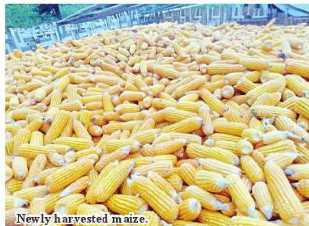
Newly harvested maize.

they grew 3,296 acres of maize and corns. In 2023-24 FY, the authorities set a plan to grow 6,291 acres of maize and corns. Local farmers