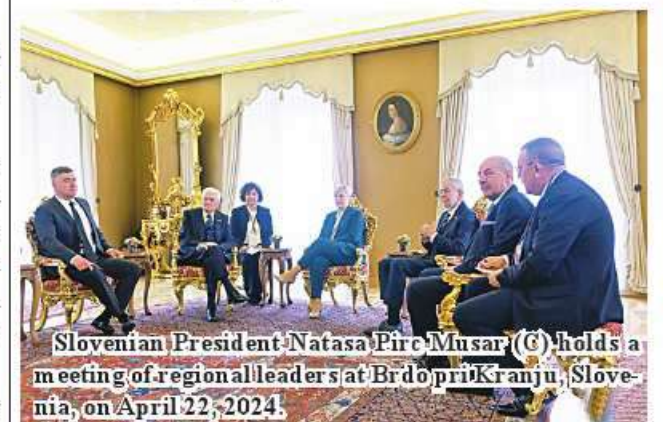
Slovenian President Nataša Pirc Musar (C) holds a meeting of regional leaders at Brdo pri Kranju, Slovenia, on April 22, 2024.