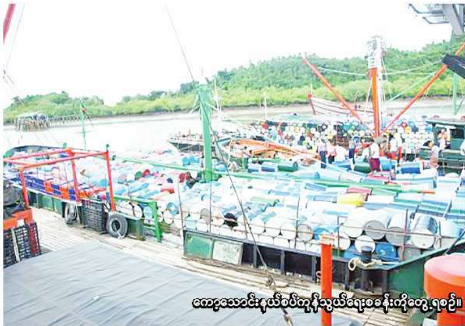
ကော့သောင်းနယ်စပ်ကုန်သွယ်ရေးစခန်းကိုတွေ့ရစဉ်။