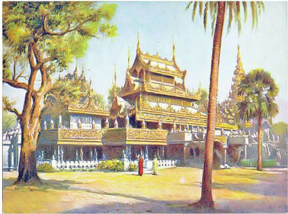
သီပေါမင်း၏မိဖုရားခေါင် စုဖုရားလတ်လှူဒါန်းခဲ့သည့် မူလမြတောင်ကျောင်းတိုက်။

ကုန်းဘောင်ဆက် နောက်ဆုံးဘုရင် သီပေါမင်း၏မိဖုရားခေါင် စုဖုရားလတ် ဆောက်လုပ်လှူဒါန်းခဲ့သည့် သာသနိကအဆောက်အအုံတစ်ခုဖြစ်သော မြတောင်ကျောင်းသည် မန္တလေးမြို့ ၃၅ လမ်း၊ ၈၅ လမ်းနှင့် ၈၆ လမ်းကြားတွင် တစ်ချိန်က တည်ရှိခဲ့သည်။ လက်ရှိတည်ရှိနေသည့် မြတောင်ကျောင်းသည် မိဖုရားခေါင်ကြီးစုဖုရားလတ် တည်ဆောက်လှူဒါန်းခဲ့သည့် မူလအဆောက်အအုံမဟုတ်ချေ။ မူလကျောင်းအဆောက်အအုံသည် ဒုတိယကမ္ဘာစစ်အတွင်း ၁၉၄၂ ခုနှစ် ဧပြီ ၇ ရက်တွင် မီးလောင်ပျက်စီးသွားခဲ့ပြီဖြစ်သည်။