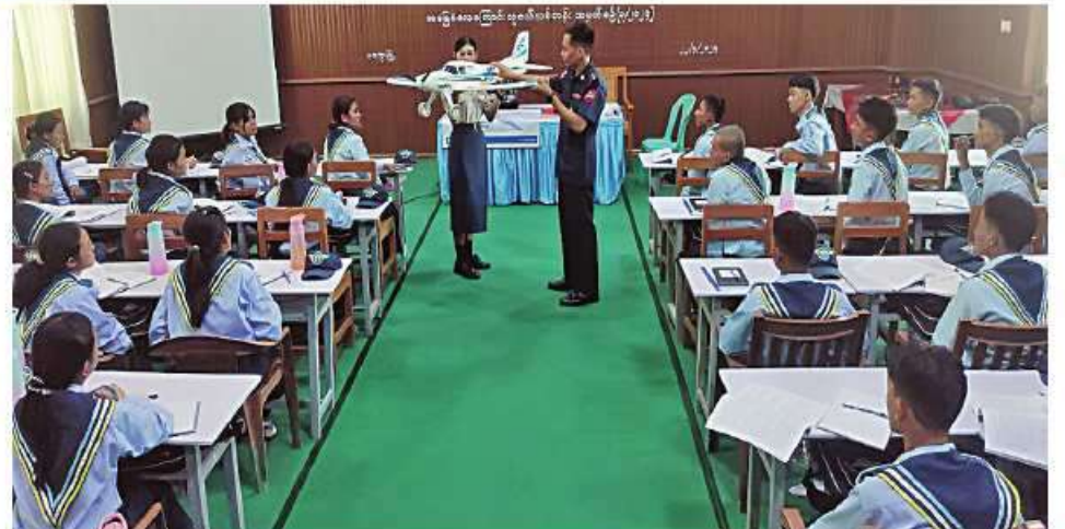
မကွေးသင်တန်းစခန်းမှ အခြေခံလေကြောင်းလူငယ် သင်တန်းသား၊ သင်တန်းသူများအား သင်တန်းနည်းပြများက လေ့ကျင့်သင်ကြားပြသနေမှုကို တွေ့ရစဉ်။