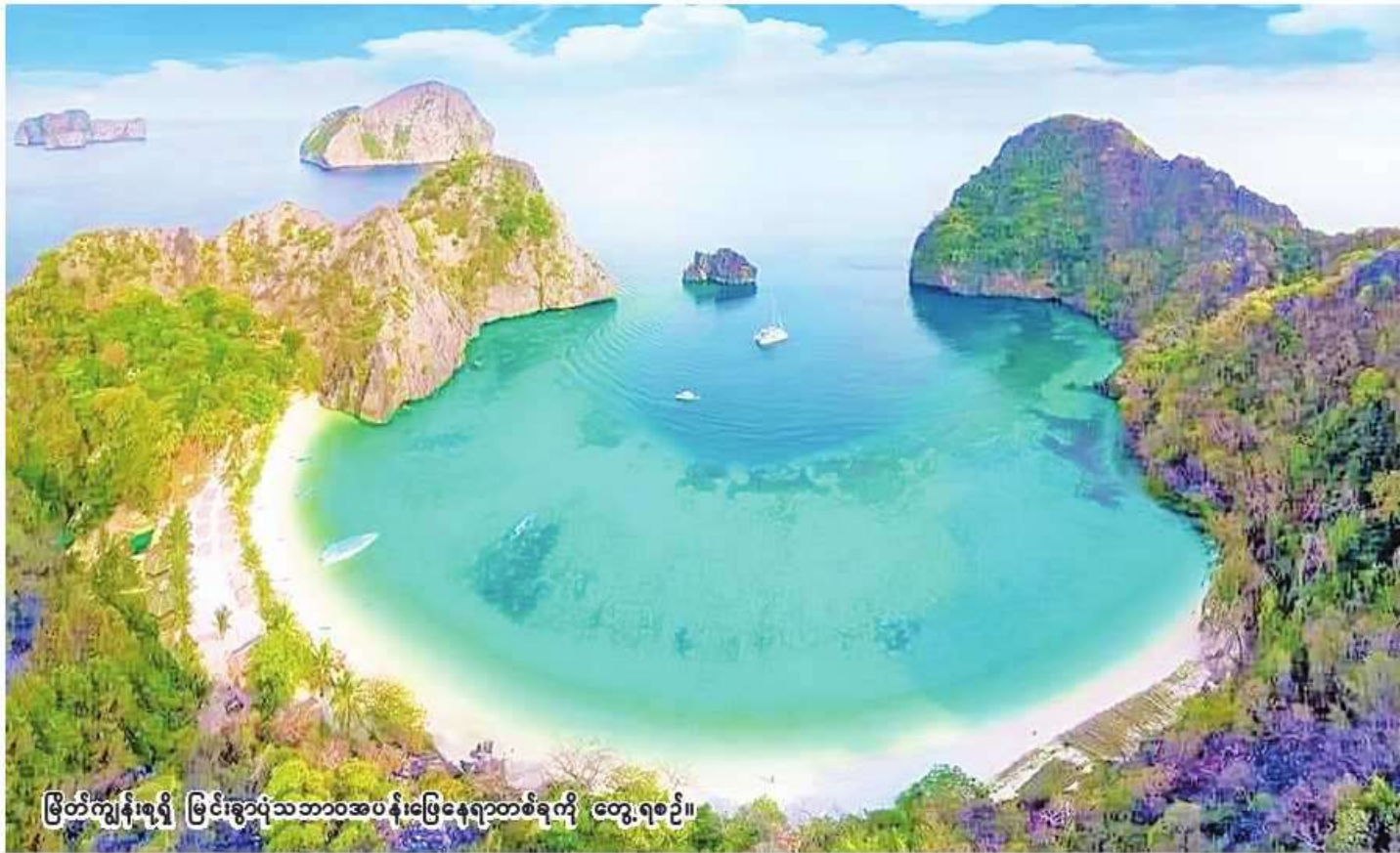
မြိတ်ကျွန်း၊ရရှိ မြင်းခွာပုံသဘာဝအပန်းဖြေနေရာတစ်ခုကို တွေ့ရစဉ်။