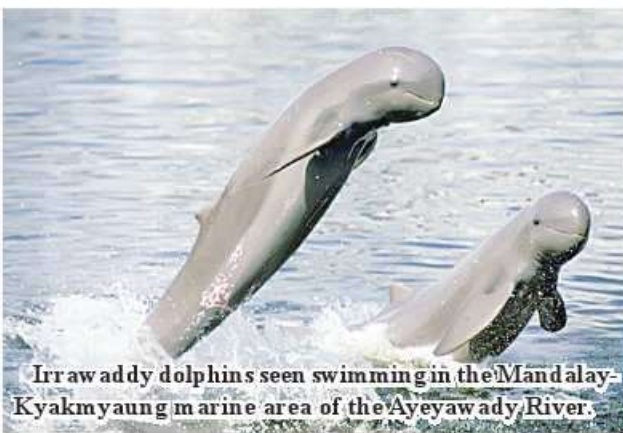
Irrawaddy dolphins seen swimming in the Mandalay-Kyakmyaung marine area of the Ayeyarwaddy River.

scene, including pottery and earthenware production, alongside its pagodas. The initiative extends beyond Hsethe Village, encompassing several villages in Mandalay Region's Madaya and Singu Townships, as well as Paletwa Township in Sagaing Region. While tourist arrivals in Hsethe Village surpassed 150 during the first week of April, the numbers have significantly increased since the second week, exceeding 250 visitors. The report also mentions tourists from Madaya Township villages who embark on boat trips along the Ayeyarwaddy River to spot Irrawaddy dolphins.