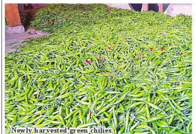
Newly harvested green chilies.