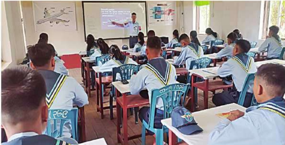
အခြေခံလေကြောင်းလူငယ် သင်တန်းသား၊ သင်တန်းသူများအား သင်တန်းနည်းပြများက လေ့ကျင့်သင်ကြားပြသနေမှုကို တွေ့ရစဉ်။

ပေးလျက်ရှိသည်။ အလားတူ တပ်မတော်(လေ)က အခြေခံ လေကြောင်းလူငယ်သင်တန်းနှင့် တန်းမြှင့် လေကြောင်းလူငယ်သင်တန်းများကို သင်တန်းစခန်း ၁၇ ခုမှ သင်တန်းသား၊ သင်တန်းသူစုစုပေါင်း ဦးရေ ၈၅၀ တို့သည် ယနေ့တွင် အခြေခံစစ်ရေးပြဘာသာရပ်၊ လေကြောင်းပညာ သမိုင်းဘာသာရပ်၊ လေယာဉ်ပျံသန်းမှု အခြေခံသဘောတရားဘာသာရပ်၊ လေကြောင်းဆိုင်ရာ အခြေခံ ဗဟုသုတများဘာသာရပ်၊ Airfield Procedure ဘာသာရပ်၊ လွတ်လပ်ရေးကြိုးပမ်းမှုသမိုင်းနှင့် ဇာတိသွေး၊ ဇာတိမာန်ဘာသာရပ်၊ RC လေယာဉ်၊ ရဟတ်ယာဉ်မောင်းနှင်ခြင်းဘာသာရပ်နှင့် RC/Flight Simulator မောင်းနှင်ခြင်းဘာသာရပ်များကို သက်ဆိုင်ရာနယ်မြေအသီးသီးမှ တာဝန်ရှိသူနည်းပြများက လေ့ကျင့်သင်ကြားပေး