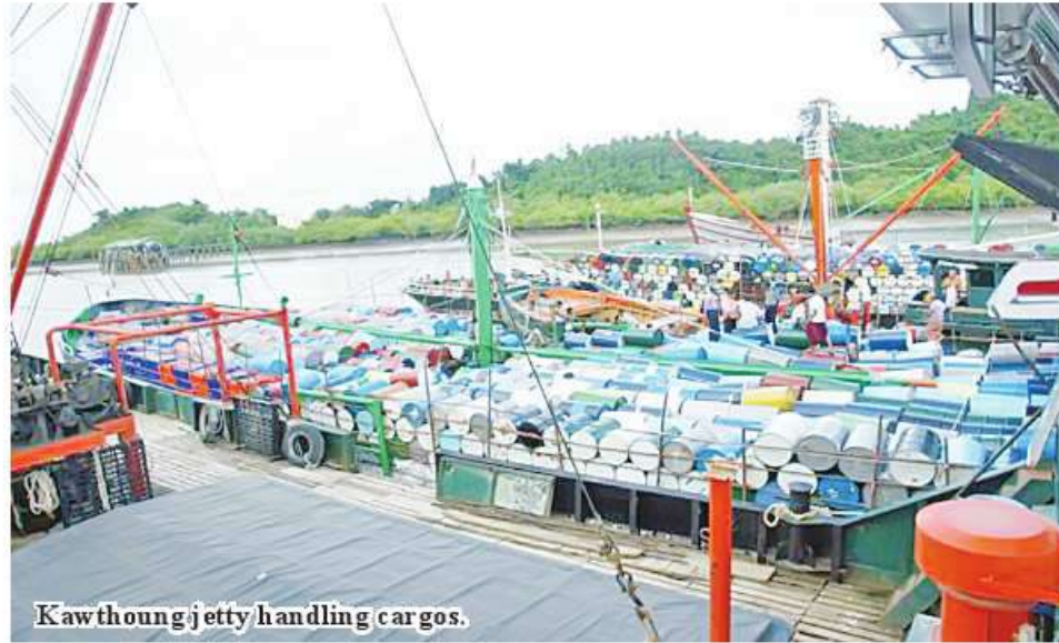
Kawthoung jetty handling cargos.

Nay Pyi Taw April 23 The Ministry of Commerce stated that Kawthoung border trade camp managed trading process to earn more than US$153 million of trade surplus in 2023-24 financial year.