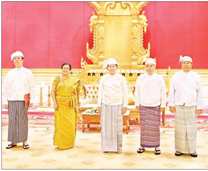
နိုင်ငံတော်စီမံအုပ်ချုပ်ရေးကောင်စီဥက္ကဋ္ဌ နိုင်ငံတော်ဝန်ကြီးချုပ် ဗိုလ်ချုပ်မှူးကြီး မင်းအောင်လှိုင်နှင့် အဖွဲ့ဝင်များ မြန်မာနိုင်ငံဆိုင်ရာ သီရိလင်္ကာနိုင်ငံ သံအမတ်ကြီး H.E. Mrs. Ponnampereuma Arachige Prabashini Ponnampereuma နှင့်အတူ စုပေါင်းမှတ်တမ်းတင်ဓာတ်ပုံရိုက်စဉ်။

ဆောင်ရွက်ရေးဆိုင်ရာ ကိစ္စရပ် များ၊ နှစ်နိုင်ငံအကြား အပြန်အလှန် ကုန်သွယ်မှုများ မြှင့်တင်ရေးနှင့် စိုက်ပျိုးရေးကဏ္ဍ၊ ဆေးဝါး ထုတ်လုပ်မှုကဏ္ဍတို့တွင် ပူးပေါင်း ဆောင်ရွက်ရေးဆိုင်ရာ ကိစ္စရပ် များနှင့် ကာကွယ်ရေးဆိုင်ရာကိစ္စ ရပ်များတွင် ပူးပေါင်းဆောင်ရွက် မှုများ တိုးမြှင့်ဆောင်ရွက်ရေး ဆိုင်ရာ ကိစ္စရပ်များနှင့်စပ်လျဉ်းပြီး