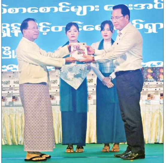
နိုင်ငံတော်စီမံအုပ်ချုပ်ရေးကောင်စီဥက္ကဋ္ဌ နိုင်ငံတော်ဝန်ကြီးချုပ် ဗိုလ်ချုပ်မှူးကြီး မင်းအောင်လှိုင်နှင့်ဇနီး ဒေါ်ကြူကြူလှ မိသားစုမှ လှူဒါန်းသည့် လူထုသိပ္ပံကျမ်းအတွဲ(၄)နှင့် အတွဲ(၅)စာအုပ် ၁၇၅၀ ကို အလှူရှင်များကိုယ်စား ပြည်ထောင်စုဝန်ကြီး ဦးမောင်မောင်အုန်းက မြန်မာနိုင်ငံစာကြည့်တိုက်များ ဖောင်ဒေးရှင်းသို့ ပေးအပ်လှူဒါန်းစဉ်။

များ၊ တပ်ရင်း၊ တပ်ဖွဲ့ စာကြည့်တိုက်များအတွက် စာအုပ် ၁၀၀၀ ကိုလည်းကောင်း၊ မြန်မာနိုင်ငံစာကြည့်တိုက်များ ဖောင်ဒေးရှင်းသို့ စာအုပ် ၁၇၅၀ ကိုလည်းကောင်း ပေးအပ်လှူဒါန်းရာ တာဝန်ရှိသူများက လက်ခံရယူကြသည်။ ထို့နောက် မြန်မာနိုင်ငံစာကြည့်တိုက်များ ဖောင်ဒေးရှင်းနာယက ဦးကျော်ဆန်းက ရန်ကုန်တိုင်းဒေသကြီးအတွင်းရှိ စာကြည့်တိုက် ၁၂၅ တိုက်သို့ လူထုသိပ္ပံကျမ်း အတွဲ(၄) နှင့် အတွဲ(၅)စာအုပ် ၂၅၀ အား ပေးအပ်လှူဒါန်းရာ ရန်ကုန်တိုင်းဒေသကြီး၊ စာကြည့်တိုက်များ ကြီးကြပ်ရေးကော်မတီဥက္ကဋ္ဌ ရန်ကုန်တိုင်းဒေသကြီး လူမှုရေးရာဝန်ကြီး ဦးဌေးအောင်က လက်ခံရယူသည်။