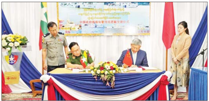
ပေါက်ဖော်ချစ်ကြည်ရေးနှင့် အိမ်နီးချင်းကောင်း အတွက်လည်းကောင်း ၂၈ မီတာ ကင်းလှည့်ရေယာဉ် ဆက်ဆံရေးတို့အပေါ် အခြေပြု၍လည်းကောင်း၊ နှစ်စင်းနှင့် ၄၈ မီတာ ကင်းလှည့်ရေယာဉ် လေးစင်း မြန်မာနိုင်ငံရဲတပ်ဖွဲ့၊ ရေကြောင်းရဲတပ်ဖွဲ့၏ တရား တို့ကို အကူအညီပေးအပ်ခြင်းဖြစ်ကြောင်း သိရသည်။ ဥပဒေစိုးမိုးရေးလုပ်ငန်းစဉ်များ အားကောင်းစေရေး သတင်းစဉ်

ထို့နောက် လွှဲပြောင်း/လက်ခံခြင်း စာလွှာများကို လက်မှတ်ရေးထိုး၍ အပြန်အလှန် လဲလှယ်ကြသည်။ ယနေ့အခမ်းအနားတွင် တရုတ်-မြန်မာ ဆွေမျိုး