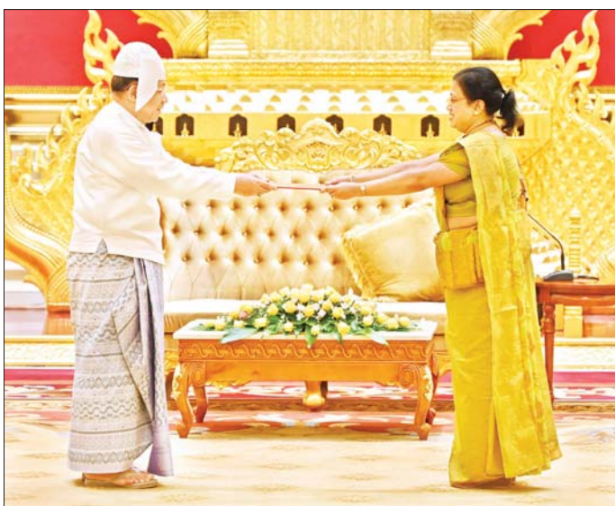
နိုင်ငံတော်စီမံအုပ်ချုပ်ရေးကောင်စီဥက္ကဋ္ဌ နိုင်ငံတော်ဝန်ကြီးချုပ် ဗိုလ်ချုပ်မှူးကြီး မင်းအောင်လှိုင် ထံ မြန်မာနိုင်ငံဆိုင်ရာ သီရိလင်္ကာနိုင်ငံ သံအမတ်ကြီးအဖြစ် ခန့်အပ်ရန် သဘောတူညီပြီးဖြစ်သော သံအမတ် ကြီး H.E. Mrs. Ponnampereuma Arachige Prabashini Ponnampereuma က ၎င်း၏ သံအမတ် ခန့်အပ်လွှာကို ပေးအပ်စဉ်။

ရဟန်းသံဃာများနှင့် သာသနာ နှယ်ဝင်သီလရှင်များ သီရိလင်္ကာ နိုင်ငံတွင် ပညာသင်ကြားလျက်ရှိ မှုနှင့် သီရိလင်္ကာနိုင်ငံရှိ ထေရ်ကြီး ဝါကြီး ဆရာတော်ကြီးများအား မြန်မာနိုင်ငံမှ သာသနာတော် ဆိုင်ရာ ဘွဲ့တံဆိပ်တော်များ ဆက်ကပ်လျက်ရှိမှု အခြေအနေ များ၊ ခရီးသွားလုပ်ငန်းများ တိုးတက်ရေးအတွက် ပူးပေါင်း