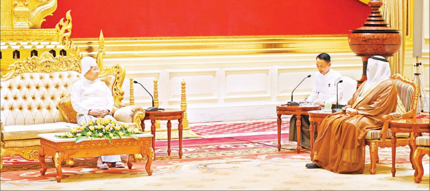
နိုင်ငံတော်စီမံအုပ်ချုပ်ရေးကောင်စီဥက္ကဋ္ဌ နိုင်ငံတော်ဝန်ကြီးချုပ် ဗိုလ်ချုပ်မှူးကြီး မင်းအောင်လှိုင် မြန်မာနိုင်ငံဆိုင်ရာ အာရပ်စော်ဘွားများ ပြည်ထောင်စုနိုင်ငံ (UAE) သံအမတ်ကြီး H.E. Mr. Mutaz Abdullah Abduljaleel Mohamed Al Faheem အား လက်ခံတွေ့ဆုံစဉ်။