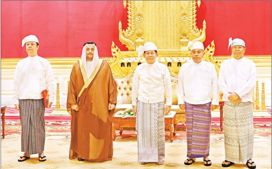
နိုင်ငံတော်စီမံအုပ်ချုပ်ရေးကောင်စီဥက္ကဋ္ဌ နိုင်ငံတော်ဝန်ကြီးချုပ် ဗိုလ်ချုပ်မှူးကြီး မင်းအောင်လှိုင်နှင့်အဖွဲ့ဝင်များ မြန်မာနိုင်ငံဆိုင်ရာ အာရပ် စော်ဘွားများ ပြည်ထောင်စုနိုင်ငံ (UAE) သံအမတ်ကြီး H.E. Mr. Mutaz Abdullah Abduljaleel Mohamed Al Faheem နှင့်အဖွဲ့ စုပေါင်းမှတ်တမ်းတင်ဓာတ်ပုံရိုက်စဉ်။

ဘင်္ဂလားဒေ့ရှ် နှစ်နိုင်ငံ သဘော တူညီချက်များနှင့်အညီ စိစစ် ဆောင်ရွက်လျက်ရှိမှုအခြေအနေ များနှင့် စပ်လျဉ်းပြီး ရင်းရင်းနှီးနှီး ဆွေးနွေးခဲ့ကြသည်။ မှတ်တမ်းတင်ဓာတ်ပုံရိုက် ကျက်အပြီးတွင် နိုင်ငံတော် စီမံအုပ်ချုပ်ရေးကောင်စီ ဥက္ကဋ္ဌ နိုင်ငံတော်ဝန်ကြီးချုပ်နှင့် မြန်မာ နိုင်ငံဆိုင်ရာ အာရပ်စော်ဘွားများ ပြည်ထောင်စုနိုင်ငံ (UAE) သံအမတ် ကြီးတို့သည် စုပေါင်းမှတ်တမ်း တင် ဓာတ်ပုံရိုက်ကြသည်။ အဆိုပါ သံအမတ်ခန့်အပ်လွှာ ပေးအပ်ပွဲသို့ ကောင်စီတွဲဖက် အတွင်းရေးမှူး ဒုတိယဗိုလ်ချုပ် ကြီး ရဲဝင်းဦး၊ ဒုတိယဝန်ကြီးချုပ် နှင့် နိုင်ငံခြားရေးဝန်ကြီးဌာန ပြည်ထောင်စုဝန်ကြီး ဦးသန်းဆွေ နှင့် နိုင်ငံခြားရေးဝန်ကြီးဌာန၊ သံတမန်ရေးရာဦးစီးဌာန ညွှန်ကြား ရေးမှူးချုပ် ဦးဝဏ္ဏဟန်တို့ တက်ရောက်ခဲ့ကြကြောင်း သတင်း ရရှိသည်။ သတင်းစဉ်