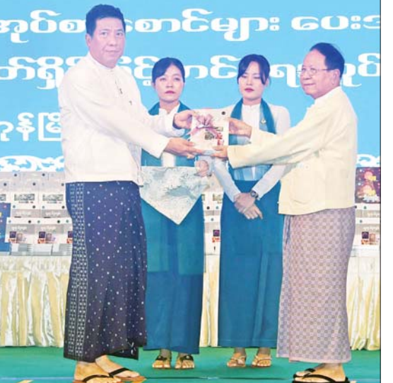
မြန်မာနိုင်ငံစာကြည့်တိုက်များ ဖောင်ဒေးရှင်းနာယက ဦးကျော်ဆန်း ရန်ကုန်တိုင်းဒေသကြီးအတွင်းရှိ စာကြည့်တိုက် ၁၂၅ တိုက်သို့ လူထုသိပ္ပံကျမ်းအတွဲ(၄)နှင့် အတွဲ(၅) စာအုပ် ၂၅၀ အား ပေးအပ်လှူဒါန်းရာ ရန်ကုန်တိုင်းဒေသကြီး စာကြည့်တိုက်များ ကြီးကြပ်ရေးကော်မတီဥက္ကဋ္ဌ ရန်ကုန်တိုင်းဒေသကြီး လူမှုရေးရာဝန်ကြီး ဦးဌေးအောင်က လက်ခံရယူစဉ်။

ကျေးဇူးတင်မုဒိတာစကား ပြောကြားထို့နောက် မြန်မာနိုင်ငံစာကြည့်တိုက်များ ဖောင်ဒေးရှင်းနာယက ဦးကျော်ဆန်းက ကျေးဇူးတင်မုဒိတာစကား ပြောကြားသည်။ ထို့နောက် မြန်မာနိုင်ငံရုပ်ရှင်အစည်းအရုံးဥက္ကဋ္ဌ ဦးကြည်စိုးထွန်း (စာရေးဆရာမောင်ကျော်ခဲ) က စာဖတ်ရိုက်ဖြင့်တင်ရေးဆိုင်ရာကို ဟောပြောဆွေးနွေးသည်။ ဆက်လက်၍ ရန်ကုန်တိုင်းဒေသကြီးကမ္ဘာ့ဂန္ထဝင်မြို့နယ် လေ့ကျင့်ရေးအထက်တန်းကျောင်းမှ ကျောင်းသား ကျောင်းသူများက “ဘက်စုံပညာရည် တို့လှမ်းချီ” သီချင်းဖြင့်လည်းကောင်း၊ ရန်ကုန်တိုင်းဒေသကြီး သယ်ယူပို့ဆောင်ရေးဦးစီးဌာနမှ သယ်ယူပို့ဆောင်ရေးဒီဂရီကောလိပ်မှ ကျောင်းသားကျောင်းသူများက “အနာဂတ်မြန်မာသို့” သီချင်းဖြင့် ဖျော်ဖြေတင်ဆက်ပြီး ဖျော်ဖြေတင်ဆက်ခဲ့ကြသည့် ကျောင်းသား ကျောင်းသူများအား ပြည်ထောင်စုဝန်ကြီး ဦးမောင်မောင်အုန်းက ငွေကျပ် ၁၀ သိန်း ပေးအပ်ချီးမြှင့်ခဲ့သည်။