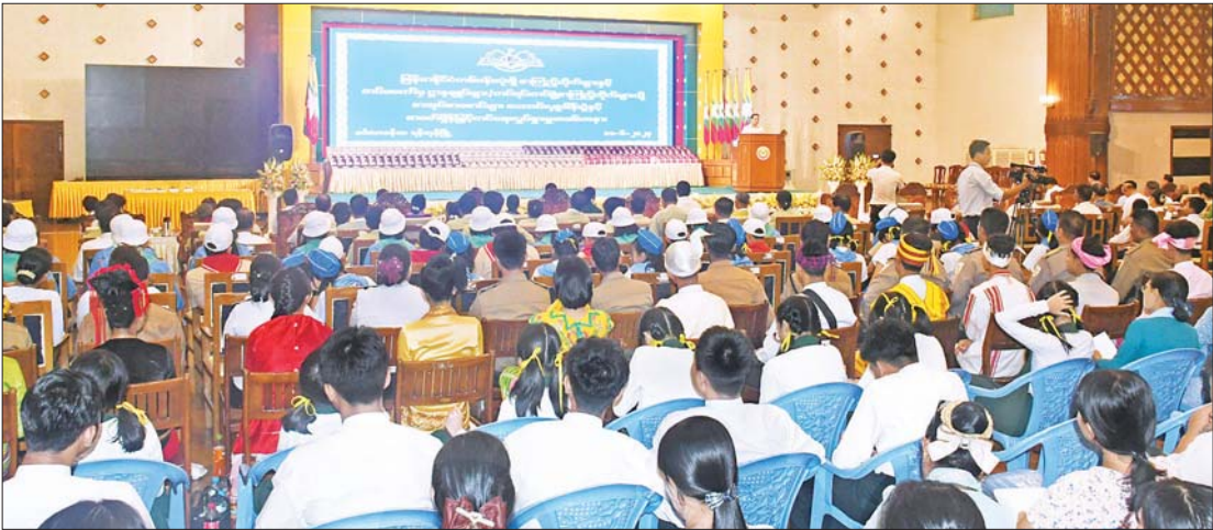
မြန်မာနိုင်ငံစာကြည့်တိုက်များ ဖွံ့ဖြိုးတိုးတက်ရေး ပူးပေါင်းဆောင်ရွက်မှုကော်မတီဥက္ကဋ္ဌ ပြည်ထောင်စုဝန်ကြီး ဦးမောင်မောင်အုန်း၊ မြန်မာနိုင်ငံတစ်ဝန်းလုံးရှိ စာကြည့်တိုက်များနှင့် တပ်မတော်ဌာနချုပ်များ၊ တပ်ရင်းတပ်ဖွဲ့ စာကြည့်တိုက်များသို့ စာအုပ်စာစောင်များ ပေးအပ်လှူဒါန်းပွဲနှင့် စာဖတ်ရိုက် ဖြင့်တင်ရေးလှုပ်ရှားမှုအခမ်းအနားတွင် အမှာစကားပြောကြားစဉ်။

ရန်ကုန် ဇွန် ၁၁ မြန်မာနိုင်ငံတစ်ဝန်းလုံးရှိ စာကြည့်တိုက်များနှင့် တပ်မတော်ဌာနချုပ်များ၊ တပ်ရင်းတပ်ဖွဲ့ စာကြည့်တိုက်များသို့ စာအုပ်စာစောင်များ ပေးအပ်လှူဒါန်းပွဲနှင့် စာဖတ်ရိုက် ဖြင့်တင်ရေးလှုပ်ရှားမှု အခမ်းအနားကို ယနေ့မွန်လွင်ပြင်တွင် ရန်ကုန်တိုင်းဒေသကြီး အစိုးရအဖွဲ့ရုံး၊ မင်္ဂလာခန်းမ၌ ကျင်းပသည်။ အခမ်းအနားသို့ ပြန်ကြားရေးဝန်ကြီးဌာန ပြည်ထောင်စုဝန်ကြီး ဦးမောင်မောင်အုန်း၊ ရန်ကုန်တိုင်းဒေသကြီးဝန်ကြီးများ၊ မြန်မာနိုင်ငံစာကြည့်တိုက်များ ဖောင်ဒေးရှင်း နာယက ဦးကျော်ဆန်း၊ ဥက္ကဋ္ဌ ဦးညွန့်ဆွေနှင့် အဖွဲ့ဝင်များ၊ မြန်မာနိုင်ငံစာရေးဆရာအသင်းဥက္ကဋ္ဌ ဦးအုန်းမောင်(မြင်းမူမောင်နိုင်မိုး)၊ မြန်မာနိုင်ငံရုပ်ရှင်အစည်းအရုံး ဥက္ကဋ္ဌ ဦးကြည်စိုးထွန်း၊ ဌာနဆိုင်ရာများမှ တာဝန်ရှိသူများ၊ ဆရာ ဆရာမများ၊ ကျောင်းသား ကျောင်းသူများ တက်ရောက်ကြသည်။