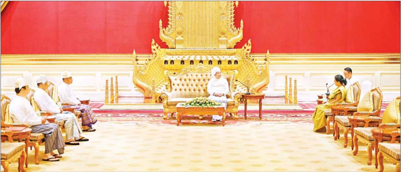
နိုင်ငံတော်စီမံအုပ်ချုပ်ရေးကောင်စီဥက္ကဋ္ဌ နိုင်ငံတော်ဝန်ကြီးချုပ် ဗိုလ်ချုပ်မှူးကြီး မင်းအောင်လှိုင် မြန်မာနိုင်ငံဆိုင်ရာ သီရိလင်္ကာနိုင်ငံ သံအမတ်ကြီး H.E. Mrs. Ponnampereuma Arachige Prabashini Ponnampereuma အား လက်ခံတွေ့ဆုံစဉ်။