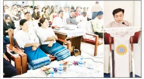
ရန်ကုန်တိုင်းဒေသကြီးအတွင်းရှိ မြို့နယ်အခွန် ဦးစီးဌာနမှူးရုံးများအနေဖြင့် အခွန်ပညာပေးဆွေးနွေးမှု လုပ်ငန်းများဆောင်ရွက်