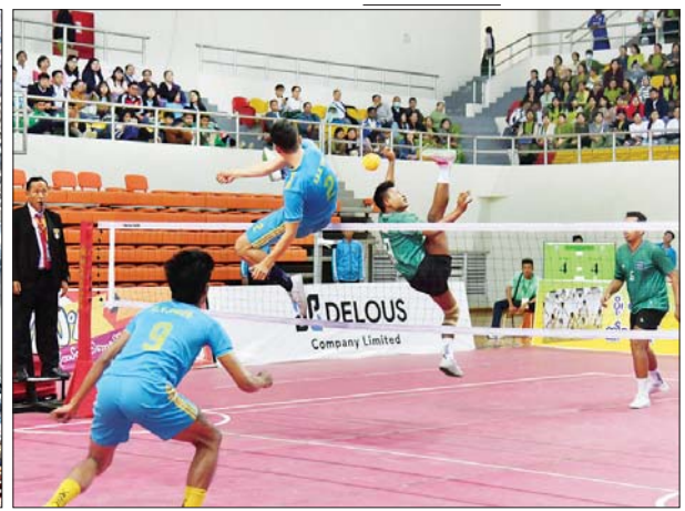
ပြည်နယ်နှင့်တိုင်းဒေသကြီး အမျိုးသားဘောလုံးပြိုင်ပွဲ ဆီမီးဖိုင်နယ်ပွဲစဉ် တွင် ပြည်ထောင်စုနယ်မြေနေပြည်တော်အသင်းနှင့် ဧရာဝတီတိုင်း ဒေသကြီးအသင်းတို့ ယှဉ်ပြိုင်ကစားစဉ်။