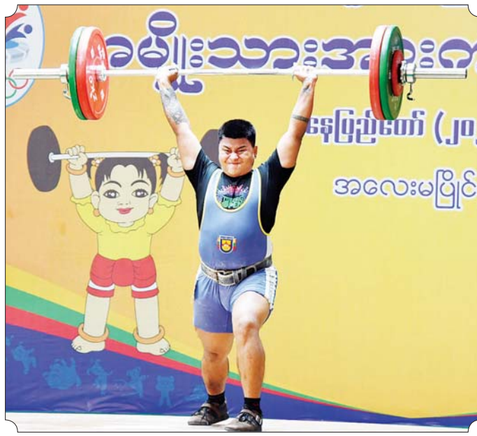
ပြည်နယ်နှင့်တိုင်းဒေသကြီး အမျိုးသားအလေးမပြိုင်ပွဲတွင် မန္တလေးတိုင်းဒေသကြီးမှ ပြိုင်ပွဲဝင်တစ်ဦး ယှဉ်ပြိုင်နေမှုကို တွေ့ရစဉ်။

ဌာနအသင်းကို ၂ ဂိုး - ၁ ဂိုး၊ ဆောက်လုပ်ရေး ဝန်ကြီးဌာန အသင်းက နယ်စပ်ရေးရာဝန်ကြီး ဌာနအသင်းကို ၃ ဂိုး - ၆ ဂိုး၊ သမဝါယမနှင့် ကျေးလက်ဖွံ့ဖြိုး ရေးဝန်ကြီးဌာန အသင်းက ပြန်ကြားရေးဝန်ကြီးဌာန အသင်း ကို ၁ ဂိုး - ၆ ဂိုး၊ စီမံကိန်းနှင့် ဘဏ္ဍာရေးဝန်ကြီးဌာနအသင်းက ကာကွယ်ရေးဝန်ကြီးဌာနအသင်း ကို ၇ ဂိုး - ၅ ဂိုးဖြင့် အနိုင်ရရှိခဲ့ကြ သည်။ ဝန်ကြီးဌာနပေါင်းစုံ အမျိုးသား ဖူဆယ်ပြိုင်ပွဲ ပထမအဆင့် ရှုံးထွက်ပွဲစဉ်များကို ဝဏ္ဏသိဒ္ဓိအား ကစားကွင်းဖူဆယ်ရုံ၌ ကျင်းပရာ လူမှုဝန်ထမ်း၊ ကယ်ဆယ်ရေးနှင့် ပြန်လည်နေရာချထားရေးဝန်ကြီး ဌာနအသင်းက အားကစားနှင့် လူငယ်ရေးရာဝန်ကြီးဌာနအသင်း ကို ၄ ဂိုး - ၁ ဂိုး၊ တိုတယ်နှင့် ခရီး သွားလာရေးဝန်ကြီးဌာန အသင်း က ပြန်ကြားရေးဝန်ကြီးဌာန အသင်းကို ၇ ဂိုး - ၁ ဂိုး၊ ပြည်ထဲ ရေးဝန်ကြီးဌာနအသင်းက ကျန်းမာ