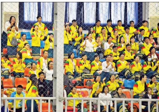
ဝန်ကြီးဌာနပေါင်းစုံ အမျိုးသားဖူဆယ်ဘောလုံးပြိုင်ပွဲတွင် ပြန်ကြားရေးဝန်ကြီးဌာနအသင်းနှင့် ဟိုတယ်နှင့်ခရီးသွားလာရေးဝန်ကြီးဌာနအသင်းတို့ ယှဉ်ပြိုင်ကစားနေမှုကို ပရိသတ်များက ကြည့်ရှုအားပေးစဉ်။