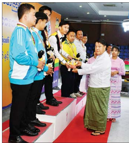
ပြည်ထောင်စု တရားသူကြီးချုပ် ဦးသာဌေး 9 Ball Pool Double နှစ်ယောက်တွဲပြိုင်ပွဲတွင် ပထမဆုရရှိသည့် ရှမ်းပြည်နယ်အသင်းမှ ပြိုင်ပွဲဝင်များကို ဂုဏ်ပြုဆုတံဆိပ်နှင့် အမျိုးသားအားကစားပွဲတော် အထိမ်းအမှတ်အရုပ် ပေးအပ်ချီးမြှင့်စဉ်။

၌ ကျင်းပရာ မြန်မာနိုင်ငံ ပြေးခုန်ပစ်အဖွဲ့ချုပ် ဒုတိယဥက္ကဋ္ဌ ဦးသာအောင်က အမျိုးသားမိတာ (၅၀၀၀) အပြေးပြိုင်ပွဲတွင် ပထမ နှင့်ဒုတိယဆုရရှိသည့် ဆောက်လုပ် ရေးဝန်ကြီးဌာန၊ တတိယဆုရရှိ သည့် စိုက်ပျိုးရေး၊ မွေးမြူရေးနှင့် ဆည်မြောင်းဝန်ကြီးဌာန အသင်း တို့မှ ပြိုင်ပွဲဝင်များကိုလည်း ကောင်း၊ အဖွဲ့ချုပ်ဥက္ကဋ္ဌ ဦးရှိန်ဝင်း က အမျိုးသမီး မိတာ(၅၀၀၀) အပြေးပြိုင်ပွဲတွင် ပထမဆုရရှိ သည့် အားကစားနှင့်လူငယ်ရေးရာ ဝန်ကြီးဌာန၊ ဒုတိယဆုရရှိသည့် ကာကွယ်ရေး ဝန်ကြီးဌာနနှင့် တတိယဆုရရှိသည့် ဆောက်လုပ် ရေး ဝန်ကြီးဌာနအသင်းတို့မှ ပြိုင်ပွဲဝင်များကို လည်းကောင်း၊ ဒုတိယဝန်ကြီး ဦးထိန်လင်းက အမျိုးသားမိတာ(၄၀၀) တန်းကျော် ပြိုင်ပွဲတွင် ပထမဆုရရှိသည့် တိုင်းရင်းသား လူမျိုးများရေးရာ