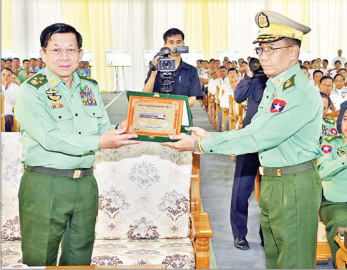
နိုင်ငံတော်စီမံအုပ်ချုပ်ရေးကောင်စီဥက္ကဋ္ဌ တပ်မတော်ကာကွယ်ရေးဦးစီးချုပ် ဗိုလ်ချုပ်မှူးကြီး မင်းအောင်လှိုင်ထံ စစ်လက်နက်ပစ္စည်းညွှန်ကြားရေးမှူးရုံး ညွှန်ကြားရေးမှူးက ဖွင့်ပွဲအထိမ်းအမှတ် လက်ဆောင်အား ဂါရဝပြုပေးအပ်စဉ်။