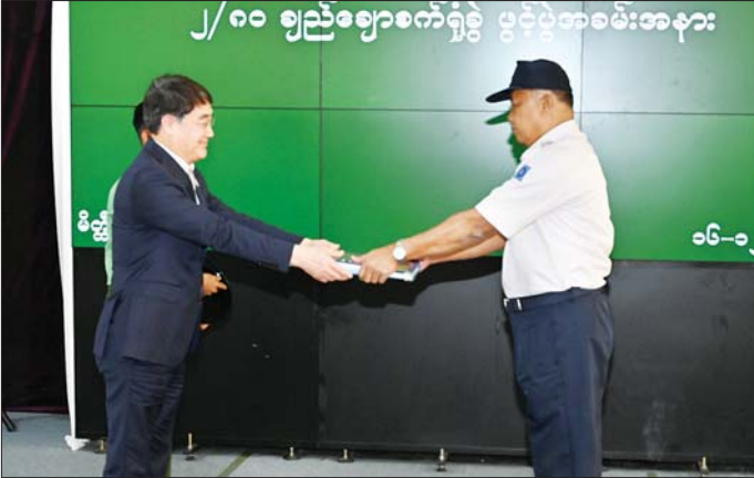
China Texmatech Co. Ltd. မှ တာဝန်ရှိသူတစ်ဦးက စက်ပစ္စည်းတပ်ဆင်မှုနှင့် ပတ်သက်သည့် စာရွက် စာတမ်းများကို စက်ရုံမှူးထံ လွှဲပြောင်းပေးအပ်စဉ်။