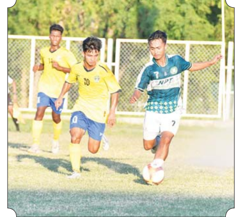
ပြည်နယ်နှင့်တိုင်းဒေသကြီး အမျိုးသားဘောလုံးပြိုင်ပွဲ ဆီမီးဖိုင်နယ်ပွဲစဉ် တွင် ပြည်ထောင်စုနယ်မြေနေပြည်တော်အသင်းနှင့် ဧရာဝတီတိုင်း ဒေသကြီးအသင်းတို့ ယှဉ်ပြိုင်ကစားစဉ်။

ပြတ်၊ ပဲခူးတိုင်းဒေသကြီးအသင်း က ကရင်ပြည်နယ်အသင်းကို ၂ ပွဲပြတ်ဖြင့် အနိုင်ရရှိခဲ့ကြ သည်။