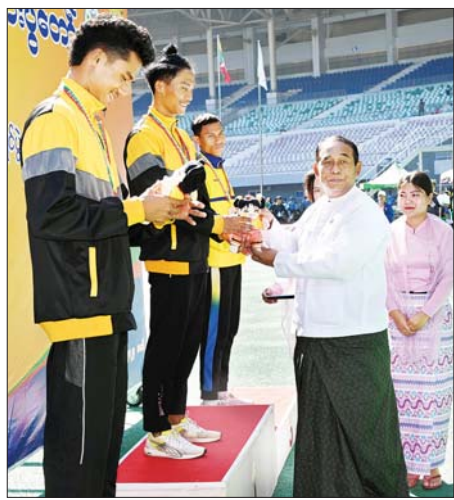
ပြည်ထောင်စုဝန်ကြီး ဦးမြင့်နောင် အမျိုးသား မိတာ ၁၀၀၀ အပြေး ပြိုင်ပွဲတွင် ပထမဆုရရှိသည့် ဆောက်လုပ်ရေးဝန်ကြီးဌာနအသင်းမှ ပြိုင်ပွဲဝင်အား ဂုဏ်ပြုဆုတံဆိပ်နှင့် အမျိုးသားအားကစားပွဲတော် အထိမ်းအမှတ်အရုပ် ပေးအပ်ချီးမြှင့်စဉ်။