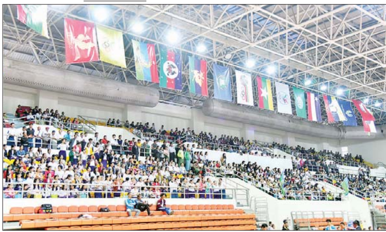
ဝန်ကြီးဌာနပေါင်းစုံ အမျိုးသားပိုက်ကျော်ခြင်း သုံးယောက်တွဲပြိုင်ပွဲတွင် စီမံကိန်းနှင့်ဘဏ္ဍာရေးဝန်ကြီးဌာနအသင်းနှင့် စိုက်ပျိုးရေး၊ မွေးမြူရေးနှင့် ဆည်မြောင်းဝန်ကြီးဌာနအသင်းတို့ ယှဉ်ပြိုင်နေမှုကို ဝါသနာရှင်များ တစ်ခဲနက် ကြည့်ရှုအားပေးကြစဉ်။