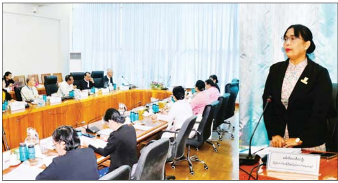
Act (သက်သေခံအက်ဥပဒေ) တို့ကို ဆွေးနွေး အဖွဲ့ဝင်များ၊ လုပ်ငန်းကော်မတီနှင့် လုပ်ငန်းအဖွဲ့ငယ် အတည်ပြုမည်ဖြစ်ပြီး ဘာသာပြန်ဆိုချက်များ များမှအဖွဲ့ဝင်များက(အပေါ်ပုံ) တက်ရောက်ဆွေးနွေး တည့်မတ်မှန်ကန်စေရေးအတွက် အားလုံးက ဝိုင်းဝန်း ကြံပြီး အစည်းအဝေးကို နှစ်ရက်ကြာ ကျင်းပမည် ဆွေးနွေး အကြံပြုစေလိုကြောင်း ပြောကြားသည်။ အစည်းအဝေးသို့ ဥပဒေဘာသာပြန်ကော်မရှင် သတင်းစဉ်

ထုတ်ပြန်ကြေညာထားသော ဥပဒေများသည် မူလစာမူနှင့် အလားတူ အာဏာတည်မည်ဖြစ်ပြီး ထိုသို့ထုတ်ပြန်ကြေညာထားသော ဘာသာပြန်ဆိုချက်ပါ ဖော်ပြချက်တစ်ရပ်သည် မူလစာမူနှင့် ကွဲလွဲပါက အဆိုပါဖော်ပြချက်တစ်ရပ်နှင့်စပ်လျဉ်း၍ မူလစာမူကို အတည်ယူရမည်ဖြစ်ကြောင်း။ မြန်မာနိုင်ငံတစ်ဆိပ်ခေါင်းအက်ဥပဒေ (The Myanmar Stamp Act) ကိုလည်း စာအုပ်အမှတ် (၁၅)အဖြစ် မကြာမီပုံနှိပ်ထုတ်ဝေနိုင်တော့မည် ဖြစ်ကြောင်း၊ ယခုအစည်းအဝေးတွင် ဥပဒေ ၆ ရပ် ဖြစ်သည့် The Bills of Lading Act (သင်္ဘောကုန်တင်တန်ဆာအက်ဥပဒေ)၊ The District Cesses Act (ခရိုင်ခိုင်ကြေးအက်ဥပဒေ)၊ The Religious Societies Act (ဘာသာရေးအသင်းအဖွဲ့များအက်ဥပဒေ)၊ The Obstructions in Fairways Act (ရေကြောင်းအတားအဆီးများအက်ဥပဒေ)၊ The Myanmar Territorial Force Act (မြန်မာနိုင်ငံပိုင်နက်နယ်မြေတပ်ဖွဲ့အက်ဥပဒေ)၊ The Evidence