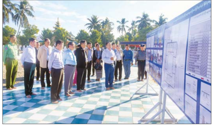
နိုင်ငံတော်စီမံအုပ်ချုပ်ရေးကောင်စီအဖွဲ့ဝင်များနှင့် တာဝန်ရှိသူများ ရင်ပြင်တော်တွင် တည်ထားကိုးကွယ် မည့် မာရဝိဇယဆင်းတုတော်နှင့် အဘယရာဇမုနိ ဆင်းတုတော်နှစ်ဆူအတွက် စံကျောင်းတော်(၂) ဆောက်လုပ်နေမှုနှင့် နေပူခံကျောက်ပြားခင်းခြင်းလုပ်ငန်း ဆောင်ရွက်နေမှုကို ကြည့်ရှုစစ်ဆေးစဉ်။