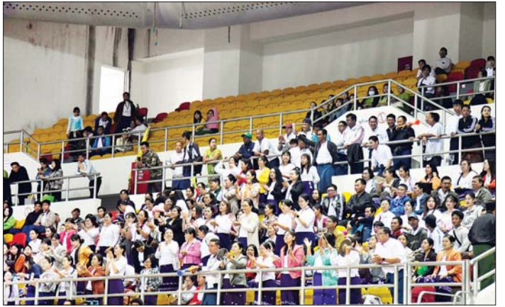
ဝန်ကြီးဌာနပေါင်းစုံ အမျိုးသမီးဘော်လီဘောပြိုင်ပွဲတွင် သမဝါယမနှင့်ကျေးလက်ဖွံ့ဖြိုးရေးဝန်ကြီးဌာနအသင်းနှင့် အားကစားနှင့်လူငယ်ရေးရာဝန်ကြီးဌာနအသင်းတို့ ယှဉ်ပြိုင်နေမှုကို ပရိသတ်များ ကြည့်ရှုအားပေးကြစဉ်။