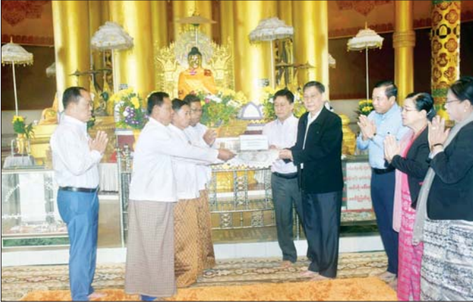
နိုင်ငံတော်စီမံအုပ်ချုပ်ရေးကောင်စီအဖွဲ့ဝင်များနှင့် တာဝန်ရှိသူများ စစ်တွေမြို့ လောကာနန္ဒာစေတီတော် မြတ်ကြီး ဘက်စုံပြင်ဆင်ရေးအတွက် အလှူငွေများ ပေးအပ်လှူဒါန်းစဉ်။