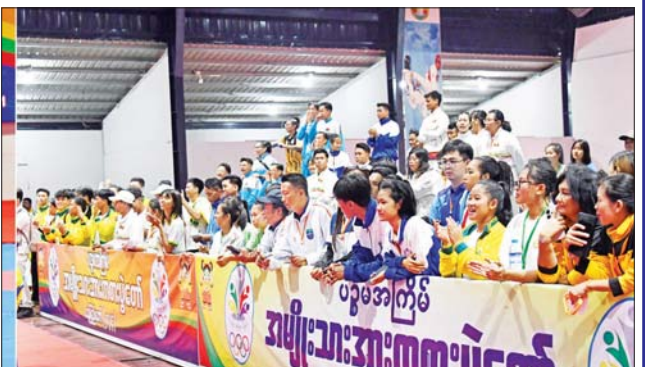
ပြည်နယ်နှင့် တိုင်းဒေသကြီး ကရာတေးပြိုင်ပွဲတွင် ရန်ကုန်တိုင်းဒေသကြီးမှ ပြိုင်ပွဲဝင်တစ်ဦး ယှဉ်ပြိုင်နေမှုကို ပရိသတ်များက ကြည့်ရှုအားပေးစဉ်။