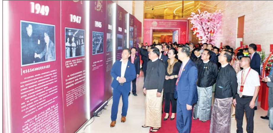
နိုင်ငံတော်စီမံအုပ်ချုပ်ရေးကောင်စီဥက္ကဋ္ဌ နိုင်ငံတော်ဝန်ကြီးချုပ်ကိုယ်စား နိုင်ငံတော်စီမံအုပ်ချုပ်ရေးကောင်စီအဖွဲ့ဝင် ဗိုလ်ချုပ်ကြီး ညိုစောနှင့် အခမ်းအနားတက်ရောက်လာသူများ ခင်းကျင်းပြုသထားသည့် မြန်မာနိုင်ငံ တရုတ်ကုန်သည်များအသင်းချုပ်၏ သမိုင်းကြောင်း မှတ်တမ်းဓာတ်ပုံများကို ကြည့်ရှုစဉ်။

အား ညစာစားပွဲဖြင့် တည်ခင်းဆောင်ရွက်ခဲ့သည်။ ထို့နောက် မြန်မာနိုင်ငံ တရုတ်ကုန်သည်များအသင်းချုပ်ဥက္ကဋ္ဌက လူမှုဗဟိုထမ်း၊ ကယ်ဆယ်ရေးနှင့် ပြန်လည်နေရာချထားရေးဝန်ကြီးဌာနနှင့် ကျန်းမာရေးဝန်ကြီးဌာနအောက်ရှိ ရန်ကုန်ပြည်သူ့ဆေးရုံကြီး၊ ရန်ကုန်ကလေးဆေးရုံကြီး၊ ဝေဘာဂီအထူးကုဆေးရုံကြီးတို့အတွက် အလှူငွေများ ပေးအပ်လှူဒါန်းရာ တာဝန်ရှိသူများက လက်ခံကြသည်။ အမှတ်တရကိတ်မုန့်ကို လှီးဖြတ်ယင်းနောက် နိုင်ငံတော်စီမံအုပ်ချုပ်ရေးကောင်စီ အဖွဲ့ဝင် ဗိုလ်ချုပ်ကြီး ညိုစော၊ မြန်မာနိုင်ငံဆိုင်ရာ တရုတ်ပြည်သူ့သမ္မတနိုင်ငံ သံအမတ်ကြီးနှင့် မြန်မာနိုင်ငံ တရုတ်ကုန်သည်များအသင်းချုပ်ဥက္ကဋ္ဌတို့က အမှတ်တရကိတ်မုန့်ကို လှီးဖြတ်ပေးခဲ့ကြသည်။