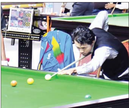
ပြည်နယ်နှင့် တိုင်းဒေသကြီး ဘီလီယက်ပြိုင်ပွဲတွင် ပြိုင်ပွဲဝင်တစ်ဦး ယှဉ်ပြိုင်နေမှုကို တွေ့ရစဉ်။