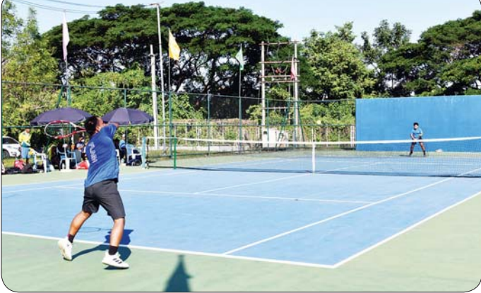
ပြည်နယ်နှင့်တိုင်းဒေသကြီး အမျိုးသားတင်းနစ်ပြိုင်ပွဲတွင် ကရင်ပြည်နယ်အသင်းနှင့် ရန်ကုန်တိုင်းဒေသကြီးအသင်းမှ ပြိုင်ပွဲဝင်များ ယှဉ်ပြိုင်ကစားနေမှုကို တွေ့ရစဉ်။

အားကစားကွင်း (C) ရှိ၍ ကျင်းပရာ အမျိုးသား/အမျိုးသမီး ရိုးရာခြင်းလုံးခတ်ပြိုင်ပွဲ ဒုတိယအကျော့ပွဲစဉ်များကို ပြည်နယ်နှင့်တိုင်းဒေသကြီးများမှ ပြိုင်ပွဲဝင်အားကစားသမားများကဝင်ရောက်ယှဉ်ပြိုင်ကြသည်။