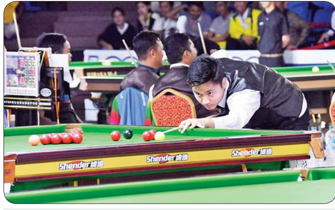
ပြည်နယ်နှင့်တိုင်းဒေသကြီး ဘီလီယာန်နှင့်စနူကာပြိုင်ပွဲတွင် ပြိုင်ပွဲဝင်တစ်ဦး ယှဉ်ပြိုင်နေမှုကို တွေ့ရစဉ်။