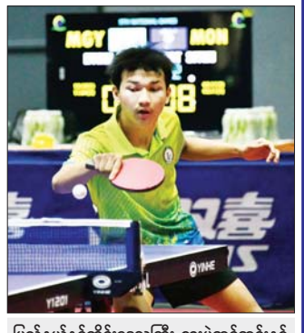
ပြည်နယ်နှင့်တိုင်းဒေသကြီး စားပွဲတင်တင်းနစ်ပြိုင်ပွဲတွင် မကွေးတိုင်းဒေသကြီးမှ ပြိုင်ပွဲဝင်တစ်ဦး ယှဉ်ပြိုင်နေမှုကို တွေ့ရစဉ်။