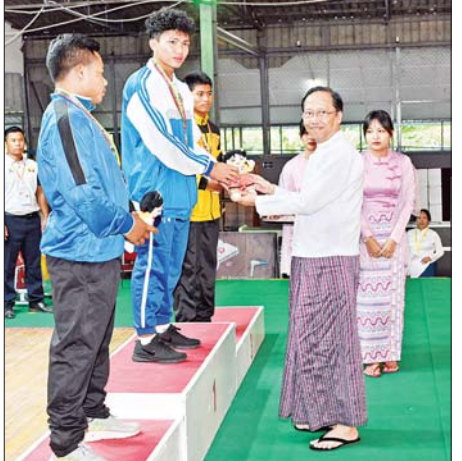
ပြည်ထောင်စုဝန်ကြီး ဒေါက်တာ သက်ခိုင်ဝင်း အမျိုးသား ၆၇ ကီလို အလေးမပြိုင်ပွဲတွင် ပထမဆုရရှိသည့် ဧရာဝတီတိုင်းဒေသကြီးအသင်း မှ ပြိုင်ပွဲဝင်အား ဂုဏ်ပြုဆုတံဆိပ်နှင့် အမျိုးသားအားကစား ပွဲတော် အထိမ်းအမှတ်အရုပ် ပေးအပ်ချီးမြှင့်စဉ်။

ဝန်ကြီးဌာန၊ ဒုတိယနှင့် တတိယ ဆုရရှိသည့် ကာကွယ်ရေးဝန်ကြီး ဌာနအသင်းတို့မှ ပြိုင်ပွဲဝင်များကို လည်းကောင်း တစ်ဦးချင်းဂုဏ်ပြု ဆုတံဆိပ်နှင့်အမျိုးသားအားကစား ပွဲတော် အထိမ်းအမှတ်အရုပ်အား ပေးအပ်ချီးမြှင့်ကြသည်။