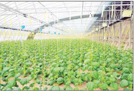
Siji Yangkun Agricultural Technology Development Co.,Ltd. ၏ Green House စိုက်ခင်းများနှင့် သီးနှံပင်များ။

ဟိုတယ်တွေ၊ တိုပွားလုပ်ငန်းတွေ၊ ရိုးရာစီးအိမ် လုပ်ငန်းတွေ၊ ကျောက်သားကြိတ်ဆုံ အမှုန့်ကြိတ် လုပ်ငန်း (ရိုးရာနည်းလမ်းနဲ့ ဂျုံ၊ မုန့်လုပ်ဖို့ အဆင့်ဆင့်ကို) စက်ကိရိယာတွေနဲ့ ပြုလုပ်တဲ့ လုပ်ငန်း၊ ပန်းပွင့်ပုံလုပ်ဖို့ ပြုလုပ်ရာမှာ အရောင် ပါရှိတဲ့ သဘာဝအသီးအရွက်တွေ အသုံးပြုပြီး အွန်လိုင်းမှ Livestreaming နဲ့ ရောင်းချတဲ့ လုပ်ငန်းနဲ့ တရုတ်ရိုးရာ စက္ကူညှပ်လုပ်ငန်းတွေလို စက်မှုလက်မှုလုပ်ငန်းတွေ၊ ရိုးရာယဉ်ကျေးမှု အမွေအနှစ် လုပ်ငန်းတွေနဲ့ ခရီးသွားဧည့်သည်တွေ ကို ဆွဲဆောင်နေတာ တွေ့ရပါတယ်။ ကျေးလက် ဒေသဖွံ့ဖြိုးရေးကို အထောက်အကူဖြစ်စေဖို့အတွက် ဆန်းသစ်တီထွင်မှု၊ စွန့်ပစ်ထွင်စီးပွားရေးလုပ်ငန်း တွေ၊ ခရီးသွားလုပ်ငန်း၊ ဖျော်ဖြေရေးလုပ်ငန်းတွေ၊ လယ်ယာစိုက်ပျိုးရေးလုပ်ငန်းတွေကို ပေါင်းစပ်ပြီး ကဏ္ဍစုံပင်တင်တဲ့ စက်မှုလုပ်ငန်းပုံစံနဲ့ ဆောင်ရွက် နေတာကို တွေ့ရှိရပါတယ်။