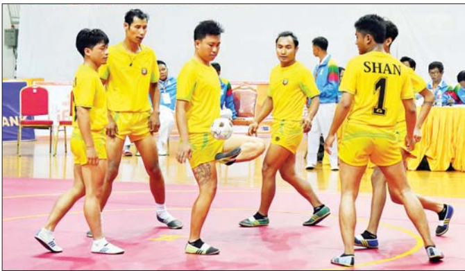
ပြည်နယ်နှင့် တိုင်းဒေသကြီး အမျိုးသားရိုးရာခြင်းလုံးခတ်ပြိုင်ပွဲတွင် ရှမ်းပြည်နယ်မှ ပြိုင်ပွဲဝင်များ ယှဉ်ပြိုင်နေမှုကို တွေ့ရစဉ်။