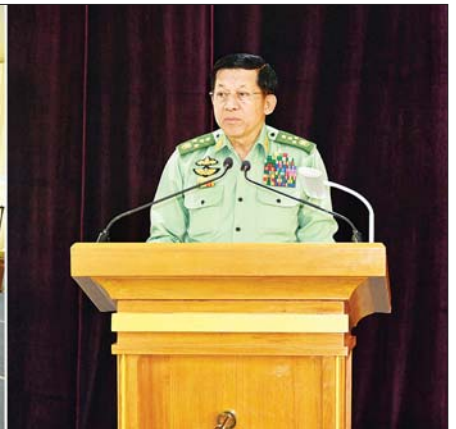
နိုင်ငံတော်စီမံအုပ်ချုပ်ရေးကောင်စီဥက္ကဋ္ဌ တပ်မတော်ကာကွယ်ရေးဦးစီးချုပ် ဗိုလ်ချုပ်မှူးကြီး မင်းအောင်လှိုင် တပ်မတော်ချည်မျှင်နှင့် အထည်စက်ရုံ(မိတ္ထီလာ) ၂/၈၀ ချည်ချောစက်ရုံခွဲ ဖွင့်ပွဲအခမ်းအနားတွင် အမှာစကားပြောကြားစဉ်။