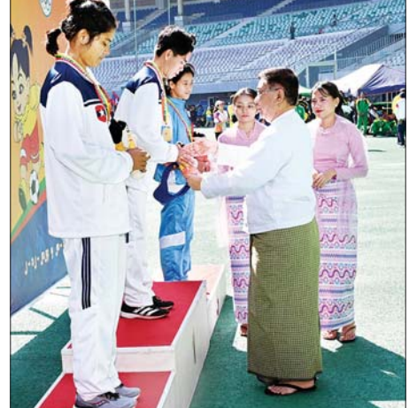
ပြည်ထောင်စုဝန်ကြီး ဒေါက်တာညွန့်ဖေ အမျိုးသမီး မာရသွန်အပြေး ပြိုင်ပွဲတွင် ပထမဆုရရှိသည့် ကာကွယ်ရေးဝန်ကြီးဌာနအသင်းမှ ပြိုင်ပွဲဝင်အား ဂုဏ်ပြုဆုတံဆိပ်နှင့် အမျိုးသားအားကစားပွဲတော် အထိမ်းအမှတ်အရုပ် ပေးအပ်ချီးမြှင့်စဉ်။