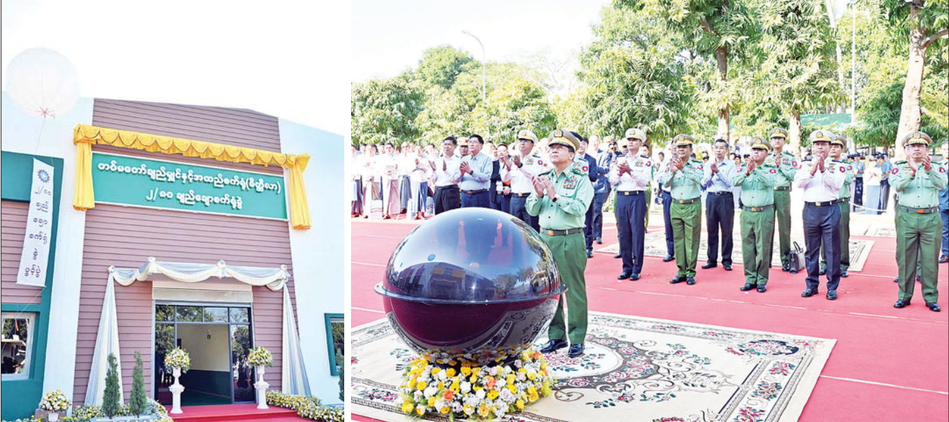
နိုင်ငံတော်စီမံအုပ်ချုပ်ရေးကောင်စီဥက္ကဋ္ဌ တပ်မတော်ကာကွယ်ရေးဦးစီးချုပ် ဗိုလ်ချုပ်မှူးကြီး မင်းအောင်လှိုင် တပ်မတော်ချုပ်ချုပ်နှင့် အထည်စက်ရုံ(မိတ္ထီလာ) ၂/၈၀ ချည်ချောစက်ရုံခွဲဆိုင်ဘုတ်ကို စက်ခလုတ်နှိပ် ဖွင့်လှစ်ပေးစဉ်။