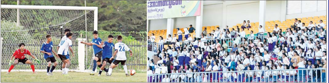
ဝန်ကြီးဌာနပေါင်းစုံ အလွတ်တန်းအမျိုးသားဘောလုံးပြိုင်ပွဲတွင် သမဝါယမနှင့် ကျေးလက်ဖွံ့ဖြိုးရေးဝန်ကြီးဌာနအသင်းနှင့် ပြန်ကြားရေးဝန်ကြီးဌာနအသင်းတို့ အကြိတ်အနယ်ယှဉ်ပြိုင်ကစားနေမှုကို ပရိသတ်များ တစ်ခဲနက်ကြည့်ရှုအားပေးစဉ်။