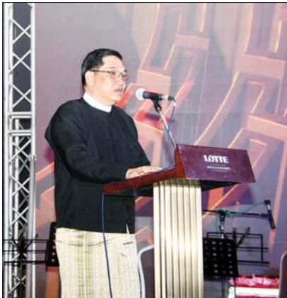
နိုင်ငံတော်စီမံအုပ်ချုပ်ရေးကောင်စီဥက္ကဋ္ဌ နိုင်ငံတော်ဝန်ကြီးချုပ်ကိုယ်စား နိုင်ငံတော်စီမံအုပ်ချုပ်ရေးကောင်စီအဖွဲ့ဝင် ဗိုလ်ချုပ်ကြီး ညိုစော မြန်မာနိုင်ငံ တရုတ်ကုန်သည်များအသင်းချုပ်တည်ထောင်ခြင်း ၁၁၅ နှစ်ပြည့်အထိမ်းအမှတ် ညစာစားပွဲအခမ်းအနားတွင် နှုတ်ခွန်းဆက်စကားပြောကြားစဉ်။

အခမ်းအနားသို့ နိုင်ငံတော်စီမံအုပ်ချုပ်ရေးကောင်စီ ဥက္ကဋ္ဌ နိုင်ငံတော်ဝန်ကြီးချုပ် ကိုယ်စား နိုင်ငံတော်စီမံအုပ်ချုပ်ရေးကောင်စီအဖွဲ့ဝင် ဗိုလ်ချုပ်ကြီး ညိုစော၊ ဒုတိယဝန်ကြီးချုပ်နှင့် ပြည်ထောင်စုဝန်ကြီး ဦးဝင်းရှိန်၊ ဦးမောင်မောင်အုန်း၊ ဒေါက်တာချာလီသန်း၊ ဦးထွန်းအံ၊ ရန်ကုန်တိုင်းဒေသကြီးဝန်ကြီးချုပ် ဦးစိုးသိန်း၊ မြန်မာ့စီးပွားရေးဦးပိုင်အများနှင့်သက်ဆိုင်သော ကုမ္ပဏီလီမိတက်ဥက္ကဋ္ဌ ဒုတိယဗိုလ်ချုပ်ကြီး ဆန်းဦး၊ ဒုတိယဝန်ကြီး ဒေါက်တာဝါဝါမောင်၊ တိုင်းဒေသကြီးဝန်ကြီးများ၊ မြန်မာနိုင်ငံ