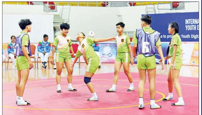
ပြည်နယ်နှင့် တိုင်းဒေသကြီး အမျိုးသမီးရိုးရာခြင်းလုံးခတ်ပြိုင်ပွဲတွင် ပဲခူးတိုင်းဒေသကြီးမှ ပြိုင်ပွဲဝင်များ ယှဉ်ပြိုင်နေမှုကို တွေ့ရစဉ်။