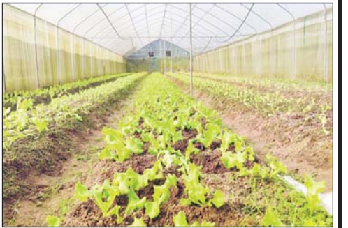
ပဲခူးတိုင်းဒေသကြီး ရွာသစ်ကျေးရွာတွင် မဲခေါင်-လန်ချန်း အထူးရန်ပုံငွေဖြင့် ဆောင်ရွက်သည့် Green House စနစ်ဖြင့် စိုက်ပျိုးထားရှိသည့် စိုက်ခင်းများနှင့် သီးနှံပင်များ။

စာရေးသူအနေနဲ့ Siji Yangkun Agricultural Technology Development Co.,Ltd. ရဲ့ စက်မှုအခြေပြုဖွံ့ဖြိုးတိုးတက်ရေးကနဦးဆောင်ရွက်မှုတွေကနေ လယ်သမားတွေ ဝင်ငွေတိုးပွားစေဖို့ ရည်ရွယ်ချက်နဲ့ e-commerce စနစ်နဲ့ ရောင်းချမှုတွေ၊ စိုက်ပျိုးရေးဆိုင်ရာ နည်းလမ်းတွေ ညွှန်ပြပေးမှု၊ သမဝါယမအဖွဲ့တွေ ဖွဲ့စည်းဆောင်ရွက်မှုတွေ၊ Daxing ခရိုင်ရှိ မူလတန်းကျောင်း၊ အထက်တန်းကျောင်းတွေနဲ့ ပူးပေါင်းကာ လက်တွေ့သရုပ်ပြစိုက်ပျိုးထားရှိမှုတွေကို လာရောက်လေ့လာလည်ပတ်နိုင်ဖို့ စီစဉ်ထားရှိမှုတွေကို လေ့လာခွင့်ရရှိခဲ့ပြီး စိုက်ပျိုးဧက ၇၉ ဧကပေါ်မှာ ခေတ်မီနည်းပညာတွေနဲ့ ပေါင်းစပ်ကာ သီးနှံမျိုးစုံစိုက်ပျိုးနေမှုတွေကို သွားရောက်ကွင်းဆင်းလေ့လာခွင့် ရရှိခဲ့ပါတယ်။