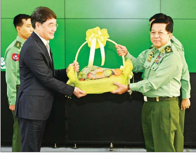
နိုင်ငံတော်စီမံအုပ်ချုပ်ရေးကောင်စီဥက္ကဋ္ဌ တပ်မတော်ကာကွယ်ရေးဦးစီးချုပ် ဗိုလ်ချုပ်မှူးကြီး မင်းအောင်လှိုင် စက်ရုံတည်ဆောက်ရာတွင် ပါဝင်ခဲ့သည့် CTMTC ကုမ္ပဏီမှ တာဝန်ရှိသူတစ်ဦးအား သစ်သီးခြင်းပေးအပ်စဉ်။