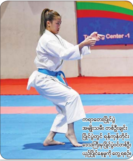
ကရာတေးပြိုင်ပွဲ အမျိုးသမီး တစ်ဦးချင်း ပြိုင်ပွဲတွင် ရန်ကုန်တိုင်း ဒေသကြီးမှ ပြိုင်ပွဲဝင်တစ်ဦး ယှဉ်ပြိုင်နေမှုကို တွေ့ရစဉ်။

နေပြည်တော် ဒီဇင်ဘာ ၁၆ ၂၀၂၄ ခုနှစ် ပဉ္စမအကြိမ်အမျိုးသား အားကစားပွဲတော် အားကစားပြိုင်ပွဲ ပွဲစဉ်များကို ယနေ့နံနက်ပိုင်းတွင် နေပြည်တော်ကောင်စီ နယ်မြေအတွင်းရှိ သတ်မှတ်ထားသော အားကစားကွင်း/ရုံများ၌ ဆက်လက်ယှဉ်ပြိုင်ကစားကြသည်။ ဝန်ကြီးဌာနပေါင်းစုံ ပြေးခုန်ပစ်ပြိုင်ပွဲကို ဝဏ္ဏသိဒ္ဓိအားကစားကွင်း၌ ကျင်းပရာ အမျိုးသား/အမျိုးသမီး မာရသုန်အပြေးပြိုင်ပွဲ၊ အမျိုးသား/အမျိုးသမီး သံပြားပိုင်းပစ်ပြိုင်ပွဲ၊ အမျိုးသား/အမျိုးသမီး စီတာ ၅၀၀၀ အပြေးပြိုင်ပွဲ၊ အမျိုးသား/ အမျိုးသမီး စီတာ ၈၀၀ အပြေးပြိုင်ပွဲ၊ အမျိုးသား/အမျိုးသမီး စီတာ ၄၀၀ တန်းကုတ် အပြေးပြိုင်ပွဲ၊ အမျိုးသား/အမျိုးသမီး စီတာ ၁၀၀ အပြေးပြိုင်ပွဲများကို ယှဉ်ပြိုင်ကစားကြပြီး ပထမ၊ ဒုတိယနှင့် တတိယ ဆုရရှိခဲ့ကြသူများကို တာဝန်ရှိသူများက ဂုဏ်ပြုဆုနှင့် ဆုတံဆိပ်များ ပေးအပ်ချီးမြှင့်ခဲ့ကြသည်။ ပြည်နယ်နှင့် တိုင်းဒေသကြီး ဝှေးပြိုင်ပွဲကို ရွှေကြာပင်အားကစားရုံ၌ ကျင်းပရာ အမျိုးသား/အမျိုးသမီး ချွန်းချွမ်းပြိုင်ပွဲ၊ အမျိုးသား/အမျိုးသမီး နန်းချွမ်းပြိုင်ပွဲများ ယှဉ်ပြိုင်ကစားခဲ့ကြပြီး ပထမ၊ ဒုတိယနှင့် တတိယ ဆုရရှိခဲ့ကြသူများကို တာဝန်ရှိသူများက ဂုဏ်ပြုဆုနှင့် ဆုတံဆိပ်များ ပေးအပ်ချီးမြှင့်ခဲ့ကြသည်။ စာမျက်နှာ ၁၂ ကော်လံ ၁ ❖