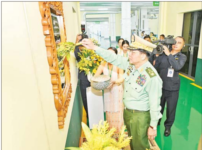
နိုင်ငံတော်စီမံအုပ်ချုပ်ရေးကောင်စီဥက္ကဋ္ဌ တပ်မတော်ကာကွယ်ရေးဦးစီးချုပ် ဗိုလ်ချုပ်မှူးကြီး မင်းအောင်လှိုင် စက်ရုံကမ္ဘာ့ဦးစီးအဖွဲ့အစည်းနှင့်အဖွဲ့ဝင်များနှင့်အတူ ပတ်ဖျန်းပေးစဉ်။