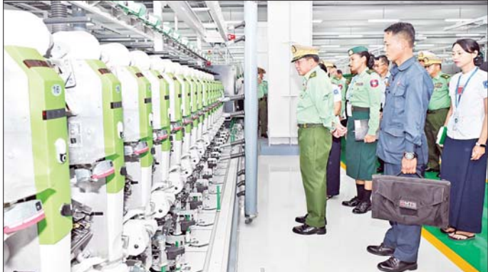
နိုင်ငံတော်စီမံအုပ်ချုပ်ရေးကောင်စီဥက္ကဋ္ဌ တပ်မတော်ကာကွယ်ရေးဦးစီးချုပ် ဗိုလ်ချုပ်မှူးကြီး မင်းအောင်လှိုင် စက်ရုံအတွင်းရှိ ချည်မျှင် အဆင့်ဆင့်ထုတ်လုပ်နေမှုအခြေအနေများကို ကြည့်ရှုစဉ်။

စက်ရုံမှ တာဝန်ရှိသူတစ်ဦးက လက်ခံရယူသည်။ အဆိုပါ တပ်မတော်ချည်မျှင်နှင့် အထည်စက်ရုံ (မိတ္ထီလာ)အနေဖြင့် တပ်မတော်နှင့် မြန်မာနိုင်ငံ ရဲတပ်ဖွဲ့ဝင်များအတွက် လိုအပ်သည့် ဝတ်စုံများကို ချုပ်လုပ်ပေးလျက်ရှိသကဲ့သို့ ကျောင်းဝတ်စုံများ၊ အခြားနေ့စဉ်သုံး ချည်ထည်ပစ္စည်းများကိုလည်း ထုတ်လုပ်ပေးလျက်ရှိကြောင်း၊ နိုင်ငံတော်အနေဖြင့် ပြည်သူများ၏ ဝတ်ရေကို ပိုမိုအထောက်အကူပြုစေ ရန်နှင့် ပြည်တွင်းချည်ချောထုတ်လုပ်မှုများ တိုးတက် စေရေးဆောင်ရွက်လျက်ရှိချိန်တွင် ယခုကဲ့သို့ ၊၈၀ ချည်ချောစက်ရုံခွဲကို ထပ်မံတိုးချဲ့တည်ဆောက်နိုင် ခဲ့ခြင်းဖြင့် ပြည်တွင်းရှိ အထည်အလိပ်နှင့် ပတ်သက် သည့် စက်မှုလုပ်ငန်းများအတွက် လိုအပ်ချက်ရှိနေ သည့် ချည်မျှင်နှင့်အထည်အလိပ်များကို အတိုင်း အတာတစ်ခုအထိ ထုတ်လုပ်ဖြည့်ဆည်းပေးနိုင်တော့ မည်ဖြစ်ကြောင်းနှင့် သတ်မှတ်ထားသည့် အရည် အသွေးစံနှုန်းများအတိုင်း ပြည့်မီစွာထုတ်လုပ်နိုင် မည်ဖြစ်ကြောင်း သတင်းရရှိသည်။ သတင်းစဉ်