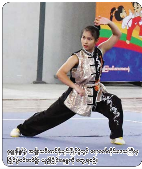
ဝှေးပြိုင်ပွဲ အမျိုးသမီးတစ်ဦးချင်းပြိုင်ပွဲတွင် ဧရာဝတီတိုင်းဒေသကြီးမှ ပြိုင်ပွဲဝင်တစ်ဦး ယှဉ်ပြိုင်နေမှုကို တွေ့ရစဉ်။

နေပြည်တော် ဒီဇင်ဘာ ၁၆ ၂၀၂၄ ခုနှစ် ပဉ္စမအကြိမ်အမျိုးသား အားကစားပွဲတော် အားကစားပြိုင်ပွဲ ပွဲစဉ်များကို ယနေ့နံနက်ပိုင်းတွင် နေပြည်တော်ကောင်စီ နယ်မြေအတွင်းရှိ သတ်မှတ်ထားသော အားကစားကွင်း/ရုံများ၌ ဆက်လက်ယှဉ်ပြိုင်ကစားကြသည်။ ဝန်ကြီးဌာနပေါင်းစုံ ပြေးခုန်ပစ်ပြိုင်ပွဲကို ဝဏ္ဏသိဒ္ဓိအားကစားကွင်း၌ ကျင်းပရာ အမျိုးသား/အမျိုးသမီး မာရသုန်အပြေးပြိုင်ပွဲ၊ အမျိုးသား/အမျိုးသမီး သံပြားပိုင်းပစ်ပြိုင်ပွဲ၊ အမျိုးသား/အမျိုးသမီး စီတာ ၅၀၀၀ အပြေးပြိုင်ပွဲ၊ အမျိုးသား/ အမျိုးသမီး စီတာ ၈၀၀ အပြေးပြိုင်ပွဲ၊ အမျိုးသား/အမျိုးသမီး စီတာ ၄၀၀ တန်းကုတ် အပြေးပြိုင်ပွဲ၊ အမျိုးသား/အမျိုးသမီး စီတာ ၁၀၀ အပြေးပြိုင်ပွဲများကို ယှဉ်ပြိုင်ကစားကြပြီး ပထမ၊ ဒုတိယနှင့် တတိယ ဆုရရှိခဲ့ကြသူများကို တာဝန်ရှိသူများက ဂုဏ်ပြုဆုနှင့် ဆုတံဆိပ်များ ပေးအပ်ချီးမြှင့်ခဲ့ကြသည်။ ပြည်နယ်နှင့် တိုင်းဒေသကြီး ဝှေးပြိုင်ပွဲကို ရွှေကြာပင်အားကစားရုံ၌ ကျင်းပရာ အမျိုးသား/အမျိုးသမီး ချွန်းချွမ်းပြိုင်ပွဲ၊ အမျိုးသား/အမျိုးသမီး နန်းချွမ်းပြိုင်ပွဲများ ယှဉ်ပြိုင်ကစားခဲ့ကြပြီး ပထမ၊ ဒုတိယနှင့် တတိယ ဆုရရှိခဲ့ကြသူများကို တာဝန်ရှိသူများက ဂုဏ်ပြုဆုနှင့် ဆုတံဆိပ်များ ပေးအပ်ချီးမြှင့်ခဲ့ကြသည်။ စာမျက်နှာ ၁၂ ကော်လံ ၁ ❖