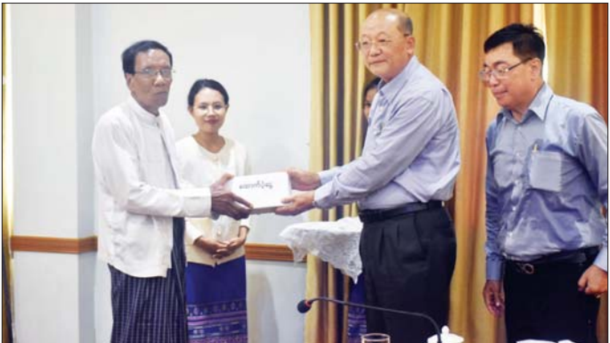
စနစ်ကို အခြေခံသည့် ပြည်ထောင်စုကြီးတည်ဆောက်ရေးလုပ်ငန်းများတွင် မိမိတို့ကျရာကဏ္ဍမှ ကိုယ်စွမ်း ဉာဏ်စွမ်းရှိသရွေ့ အားကြီးမာန်တက် အစွမ်းကုန် ကြိုးပမ်းအကောင်အထည်ဖော် ဆောင်ရွက်သွားကြရန် တိုက်တွန်းပြောကြားသည်။ ယင်းနောက် ဒုတိယဝန်ကြီး ဦးဇော်အေးမောင်က အမှာစကားပြောကြားပြီး ရခိုင်ပြည်နယ် တိုင်းရင်းသားရေးရာဝန်ကြီးက ရခိုင်ပြည်နယ်အတွင်း တိုင်းရင်းသားရေးရာကိစ္စရပ်များနှင့် ဒေသအတွင်း ဖွံ့ဖြိုးရေးဆိုင်ရာကိစ္စရပ်များ ဆောင်ရွက်ထားရှိမှု

တိုင်းရင်းသားလူမျိုးများရေးရာ ဝန်ကြီးဌာန ပြည်ထောင်စုဝန်ကြီး Jeng Phang နော်တောင် နှင့် ဒုတိယဝန်ကြီး ဦးဇော်အေးမောင်တို့သည် ရခိုင်ပြည်နယ် တိုင်းရင်းသားရေးရာဝန်ကြီး ဦးတင်လှနှင့် အတူ ယမန်နေ့ မွန်းလွဲပိုင်းတွင် စစ်တွေမြို့ ရခိုင်ပြည်နယ်အစိုးရဧည့်ရိပ်သာ အစည်းအဝေးခန်းမ၌ ရခိုင်ပြည်နယ်အတွင်းရှိ တိုင်းရင်းသားစာပေနှင့် ယဉ်ကျေးမှုအသင်းအဖွဲ့များနှင့် တွေ့ဆုံဆွေးနွေးသည်။ ဦးစွာ ပြည်ထောင်စုဝန်ကြီးက မိမိတို့နိုင်ငံသည် တိုင်းရင်းသားလူမျိုးပေါင်း ၁၃၀ ကျော် စုပေါင်းနေထိုင်ကြသည့် ပြည်ထောင်စုနိုင်ငံတော်ကြီး ဖြစ်သည်နှင့်အညီ စစ်မှန်သော မျိုးချစ်စိတ်ဓာတ် ဖြစ်သည့် ပြည်ထောင်စုစိတ်ဓာတ်ထားရှိကြရန် လိုအပ်ပါကြောင်း၊ စစ်မှန်သော မျိုးချစ်စိတ်ဓာတ် ဖြစ်သည့် ပြည်ထောင်စုစိတ်ဓာတ်ကို အခြေခံ၍ ဒီတာဝန်အရေးသုံးပါးကို မထိခိုက်စေဘဲ နိုင်ငံသူ၊ နိုင်ငံသားများနှင့် တိုင်းရင်းသားပြည်သူများအားလုံး မျှော်လင့်တောင့်တနေသည့် ဒီမိုကရေစီနှင့်ဖက်ဒရယ်