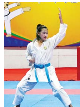
ပြည်နယ်နှင့် တိုင်းဒေသကြီး ကရာတေးပြိုင်ပွဲတွင် ရန်ကုန်တိုင်းဒေသကြီးမှ ပြိုင်ပွဲဝင်တစ်ဦး ယှဉ်ပြိုင်နေမှုကို ပရိသတ်များက ကြည့်ရှုအားပေးစဉ်။