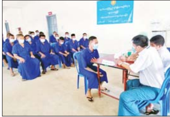
ကျန်းမာရေးစောင့်ရှောက်မှု ပြုလုပ်ပေးခြင်းအား သက်သာသောနှုန်းထားဖြင့် ရောင်းချပေးလျက်ရှိကြောင်း စောင့်ရှောက်မှုပေးခြင်းအား ပဲခူးတိုင်းဒေသကြီး ဝန်ကြီးချုပ် ဦးမျိုးဆွေဝင်းက ပြောကြားခဲ့သည်။