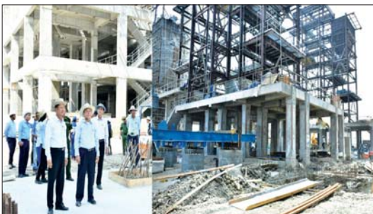
မွေးမြူရေး လုပ်ငန်းများကို အဓိကထားဆောင်ရွက် လျက်ရှိရာ ထွက်ရှိလာသည့် သီးနှံ၊ သား၊ ငါး၊ ရေထွက် ပစ္စည်းများအား ပြည်တွင်းပြည်ပသို့ တင်ပို့ရောင်းချ လျက်ရှိကြောင်း။

အားလုံးကို Water Drop Catcher ဖြင့် အပြီးသတ် ပေးလှူစစ်ထုတ်ပြီး သန့်စင်ဓာတ်ငွေ့များကို