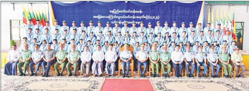
တာကွယ်ရေးဦးစီးချုပ်(လေ) ဗိုလ်ချုပ်ကြီးထွန်းအောင်နှင့် တာဝန်ရှိသူများ လေ့ကျင့်ရေးလုပ်သင် သင်တန်းသား သင်တန်းသူများနှင့် စုပေါင်းမှတ်တမ်းတင်ဓာတ်ပုံ ရိုက်ခတ်ခဲ့

စေ့မှုကိစ္စ ၆ မှ ပြီးခဲ့သည့် ၂၀၂၃ ခုနှစ်အထိ အခြေခံ အဆင့် သင်တန်းသား ၆၉၂၄ ဦးနှင့် တန်းမြှင့်သင်တန်းသား ၅၅၁၂ ဦးနှင့် သင်တန်းသား ၇၄၅၅ ဦးကို လေ့ကျင့် သင်ကြားပေးနိုင်ခဲ့ပြီး ဖြစ်ကြောင်း၊ နိုင်ငံတော်၏ အနာတဲကြွယ်ပွင့်များ ဖြစ်သည့် ဖျိုအောင်စစ်မောင်းပေးများကို ယခုလို နွေရာသီကျောင်းပိတ်ရက်တွင် တန်ဖိုးရှိလှသည့် လေ့ကျောင်းဆိုင်ရာ ပညာရပ်များကို လက်ဆင့်ကမ်းပေးနိုင် မည်ဖြစ်သည့်အတွက် ဂုဏ်ယူဝမ်းမြောက် ကြောင်း ပြောကြား၍ သင်တန်းကို ဖွင့်လှစ်ပေးသည်။