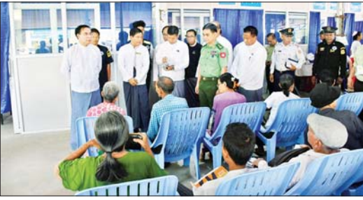
ဝေးရံကြီးများ သွား ကျန်းမာရေး စောင့်ရှောက်မှုများ ပြုလုပ်ပေး လျက်ရှိသည့်အပြင် လူနာတစ်ဦးအဖို့ အခမဲ့စစ်ပေး တစ်လစာ လစဉ် ထောက်ပံ့ပေးလျက်ရှိ ကြောင်းနှင့် အခြေခံစားသုံးကုန်များအား သက်သာသောနှုန်းထားဖြင့် ရောင်းချပေးလျက်ရှိကြောင်း စောင့်ရှောက်မှုပေးခြင်းအား ပဲခူးတိုင်းဒေသကြီး ဝန်ကြီးချုပ် ဦးမျိုးဆွေဝင်းက ပြောကြားခဲ့သည်။

ခဲ့ကြသည့် နိုင်ငံဝန်ထမ်းများ အနေဖြင့် အငြိမ်းစားယူပြီးနောက် ကျန်းမာရေးနှင့် ပတ်သက်၍ အရည်အသွေးပြည့်သော ကျန်းမာရေး စောင့်ရှောက်မှုကို ခံယူခြင်းဖြင့် ကျန်းမာပျော်ရွှင် အသက်ရှည်စွာနေထိုင်ရေးအတွက် ပဲခူးတိုင်းဒေသကြီး အစိုးရအဖွဲ့၏ ဌာနဆိုင်ရာ မြို့မိမိဖွဲ့ဖွဲ့ လူမှုရေးအသင်းအဖွဲ့များ၏ ပူးပေါင်းကူညီပါဝင်မှုဖြင့် လစဉ် တိုင်းဒေသကြီးအတွင်း မြို့နယ် ၂၈ မြို့နယ်ရှိ ပြည်သူ