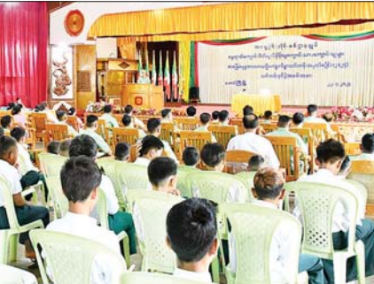
အရှေ့ပိုင်းတိုင်းစစ်ဌာနချုပ်၌ ကောင်းသား ကျောင်းသူများအတွက် နွေရာသီအခြေခံဗုဒ္ဓဘာသာယဉ်ကျေး လိုသည့်သင်တန်းဖွင့်လှစ် ကျင်းပခဲ့

သက်ဆိုင်ရာ တိုင်းမှူးများနှင့် တာဝန်ရှိသူများ အရာရှိ စစ်သည်၊ မိသားစုဝင်များ၊ ကျောင်းသား ကျောင်းသူများ သင်တန်းနှင့်ပြ များနှင့် မိတ်ကြားထားသူများ တက်ရောက်ကြသည်။ ဦးစွာ တိုင်းမှူးများနှင့် တာဝန်ရှိသူများက သင်တန်းဖွင့် လှစ်ခြင်းနှင့်ပတ်သက်၍ အခွာ စကားများ အသီးသီးပြောကြား ကြသည်။ ထို့နောက် တိုင်းမှူးများ နှင့် တာဝန်ရှိသူများက ကျောင်း သား ကျောင်းသူများအား ရင်းရင်း နီးနီး လိုက်လံနှုတ်ဆက်ကြပြီး လိုအပ်သည့်များ ပေါင်းစပ်ညှိနှိုင်း ဆောင်ရွက် ပေးခဲ့ကြကြောင်း သတင်းရရှိသည်။ သတင်းစဉ်