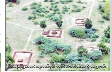
မိသားစုမြို့ဟောင်းတူးဖော်မှု၏ တစ်စိတ်တစ်ဒေသကို တွေ့ရစဉ်။

မြို့ဟောင်းကြီး၏ နာမည် အတိုကောက် BTO လို့သာ စတင်သတ်မှတ်ပြီး ကုန်းအမှတ် BTO1 ကနေ ပြန်လည်တူးဖော်ခဲ့ကြပါတယ်။ မိသားစုမြို့ဟောင်းကြီး၏ တူးဖော်သုတေသနခန်းမ တစ်လျှောက် ၆၉ ကုန်းမြီးစီးခဲ့သည့် နေရာမှာ ၂၀၀၃ ခုနှစ် ကုန်း