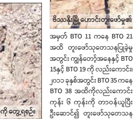
မိသားစုမြို့ဟောင်းတူးဖော်မှု၏ တစ်စိတ်တစ်ဒေသကို တွေ့ရစဉ်။

အမှတ် BTO 11 ကနေ BTO 21 အထိ တူးဖော်သုတေသနပြုခဲ့ရာ အတွင်း ကျွန်ုပ်တို့အနေနှင့် BTO 15နှင့် BTO 19 တို့ လည်းကောင်း၊ ၂၀၁၁ ခုနှစ်အတွင်း BTO 35 ကနေ BTO 38 အထိကိုလည်းကောင်း ကုန်း ၆ ကုန်းကို တာဝန်ယူပြီး ဦးဆောင်၍ တူးဖော်သုတေသန