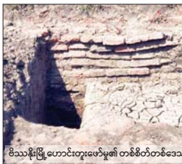
မိသားစုမြို့ဟောင်းတူးဖော်မှု၏ တစ်စိတ်တစ်ဒေသကို တွေ့ရစဉ်။