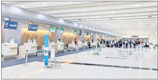
အင်ဒိုနီးရှားနိုင်ငံ ဆစ်ရာတူလန်ရှိ အပြည်ပြည်ဆိုင်ရာလေဆိပ်။