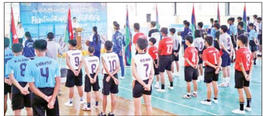
က ကြည့်ရှုအားပေးရာ တနင်္သာရီမြို့နယ်အသင်း ငါးသင်းဖြင့် ဧပြီ ၂၆ ရက်အထိ ယှဉ်ပြိုင်ကစားကြ အနိုင်ရရှိရမည်။ မည်ဖြစ်ကြောင်း သိရသည်။ တိုင်းဒေသကြီး (ပြန်/ဆက်)

အောင်မြင်မှုရရှိရေးအတွက် တာဝန်ရှိပုဂ္ဂိုလ်များနှင့် အားကစားသမားများပါ အဖွဲ့ခွဲကုန် ကြိုးစားဆောင်ရွက်သွားကြရန် တိုင်းကော်မတီဝင် နိုင်ငံ့ကော်မတီဝင် အားကစားသမားကော်မတီများဖြစ်အောင် ကြိုးပမ်း ယှဉ်ပြိုင်ကစားကြရန်လိုအပ်ကြောင်း ပြောကြားသည်။ (ယာပုံ) ထို့နောက် ပြိုင်ပွဲဝင်အသင်းများက အားကစား သစ္စာအိမ်ဌာနရှိကွတ်ဆိဖြိုး ကွင်းအတွင်းမှ ပြန်လည်ထွက်ခွာကာ အမျိုးသမီး ထားဝယ်အသင်းနှင့် တနင်္သာရီမြို့နယ်အသင်းတို့၏ ယှဉ်ပြိုင်ကစားနေမှုကို တိုင်းဒေသကြီးဝန်ကြီးချုပ် တိုင်းဒေသကြီးကော်မတီဝင်တစ်ဦးက တာဝန်ရှိသူများ၊ ပြိုင်ပွဲဝင် အားကစားသမားများနှင့် အားကစားဝါသနာရှင်များ