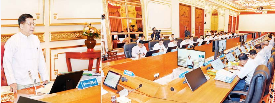
နိုင်ငံတော်စီမံအုပ်ချုပ်ရေးကောင်စီဥက္ကဋ္ဌ နိုင်ငံတော်ဝန်ကြီးချုပ် ဝိုလ်ချုပ်မှူးကြီး မင်းအောင်လှိုင် ပြည်ထောင်စုအစိုးရအဖွဲ့အစည်းအဝေးအမှတ်စဉ်(၄/၂၀၂၄) တွင် အမှာစကားပြောကြားစဉ်။

နိုင်ငံတော်စီမံအုပ်ချုပ်ရေးကောင်စီ၏ ရှေ့လုပ်ငန်းစဉ် (၅) ရပ် ၁။ လွတ်လပ်ပြီးတရားမျှတသော ပါတီစုံဒီမိုကရေစီအထွေထွေရွေးကောက်ပွဲ အောင်မြင်စွာ ကျင်းပနိုင်ရေး ပြည်ထောင်စုတစ်ဝန်းလုံး တည်ငြိမ်အေးချမ်း၍ တရားဥပဒေစိုးမိုးရေး အပြည့်အဝရရှိလာအောင် အလေးထားဆောင်ရွက်သွားမည်။ ၂။ တိုင်းရင်းသားပြည်သူတစ်ရပ်လုံးနှင့် အကျိုးဝင်သော စိုက်ပျိုးမွေးမြူရေးကို အခြေခံသည့် ကုန်ထုတ်လုပ်ငန်းများအားဖြင့်တင်၍ နိုင်ငံစီးပွားဖြင့်မားရေးနှင့် ပြည်သူ့လူထုတစ်ရပ်လုံး၏ လူမှုစီးပွားဘဝဖြင့်မားရေး ဆက်လက်ကြိုးပမ်းဆောင်ရွက်သွားမည်။ ၃။ နိုင်ငံတော်၏ ပကတိအနှစ်သာရဖြစ်သော ပြည်တွင်းငြိမ်းချမ်းရေးနှင့် ရရှိထားသည့် ပြည်တွင်း ငြိမ်းချမ်းရေးရလဒ်များ တည်ငြိမ်မှုရှိစေရေးအတွက် (NCA) ပါ သဘောတူညီချက်များ အတိုင်း ဖြစ်နိုင်သမျှ အလေးထားလုပ်ဆောင်သွားမည်။ ၄။ စစ်မှန်စည်းကမ်းပြည့်ဝသည့် ပါတီစုံဒီမိုကရေစီစနစ် ခိုင်မာစေရေးနှင့် ဒီမိုကရေစီနှင့် ဖက်ဒရယ်စနစ်ကို အခြေခံသည့် ပြည်ထောင်စုတည်ဆောက်ရေးလုပ်ငန်းစဉ်များကို အရှိန်အဟုန်ဖြင့် ဆက်လက်ဆောင်ရွက်သွားမည်။ ၅။ ဆန္ဒမဲပေးပိုင်ခွင့်ရှိသူအားလုံး၏ အခွင့်အရေးများ နစ်နာမှုမရှိစေရေးနှင့် နည်းလမ်းကျန် မှန်ကန်မှုရှိသည့် အထွေထွေရွေးကောက်ပွဲတစ်ရပ်ဖြစ်စေရေး ဆောင်ရွက်ခြင်း၊ အရေးပေါ်ကာလဆိုင်ရာ ပြဋ္ဌာန်းချက်များနှင့်အညီ ဆောင်ရွက်ခြင်းတို့ဖြင့်စီးပွား လွတ်လပ်ပြီး တရားမျှတသော ပါတီစုံဒီမိုကရေစီအထွေထွေရွေးကောက်ပွဲ ကျင်းပ၍ ထွက်ပေါ်လာသည့် အစိုးရအား နိုင်ငံတော်တာဝန်လွှဲအပ်နိုင်ရေး ဆက်လက်ဆောင်ရွက် သွားမည်။