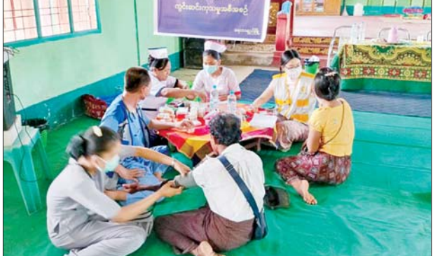
ဦးစီးဌာနမှ ဝန်ထမ်းများသည် လုပ်ငန်းများ ဆောင်ရွက်ခဲ့ကြသည့်အပြင် ယမန်နေ့မွန်းလွဲပိုင်းက နယ်လှည့်ကွင်းဆင်း ဆေးကုသမှု အဆိုပါ အထူးကုဆေးကုသမှု

အဖွဲ့သည် ပြည်သူများအား ကျန်းမာရေး အသိပညာပေး ဟောပြော ဆွေးနွေးခြင်းနှင့် ဆေးကုသမှုပေးခြင်းများ ဆောင်ရွက်ခဲ့ရာ အရေပြားနှင့်သက်ဆိုင်သော လူနာ ၄၂ ဦး၊ သားဖွားမီးယပ်နှင့် သက်ဆိုင်သောလူနာ ၂၆ ဦးနှင့် အခြားအထွေထွေရောဂါ လူနာ ၅၃ ဦး စုစုပေါင်း ၁၂၁ ဦးတို့ကို ကြည့်ရှုကုသမှုများ ပြုလုပ်ပေးခဲ့ကြောင်း သိရသည်။ မြို့နယ်(ပြန်/ဆက်)