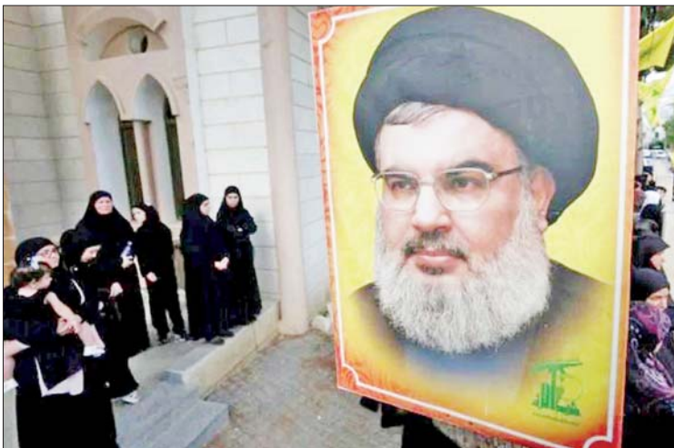
ရုရှားပြင်းထန်လာခဲ့ပြီး လက်ဘနွန်နိုင်ငံ တိုက်ခိုက်မှုများ ဖြစ်ပွားခဲ့ကြောင်း သိရအရှေ့တောင်ပိုင်းတွင် အစ္စရေးနိုင်ငံ၏ သည်း ကိုးကား-ဆင်ယူာ အမြောက်ပစ်ခတ်မှုနှင့် လေကြောင်း ဘာသာပြန်-အလင်းသစ်

အဖွဲ့၏ ကွပ်ကဲမှုဌာနချုပ်ကို ပစ်မှတ်ထား တိုက်ခိုက်ခဲ့သည့် အစ္စရေး၏ လေကြောင်း တိုက်ခိုက်မှုတွင် ၎င်းတို့၏ခေါင်းဆောင် ဟာဆန်နာရာလာ သေဆုံးခဲ့ကြောင်း စက်တင်ဘာ ၂၈ ရက်တွင် ဟစ်ဇ်ဘိုလာက အတည်ပြုခဲ့သည်။