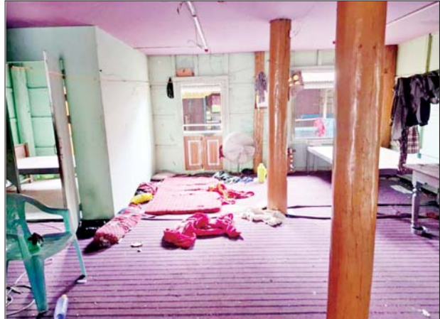
မတ္တရာမြို့နယ် သုံးဆယ်ပေးကျေးရွာအတွင်းရှိ ဘုန်းတော်ကြီးကျောင်း၌ အကြမ်းဖက်သမားများ နေထိုင်အသုံးပြုခဲ့သည့် အသုံးအဆောင်ပစ္စည်းများကို တွေ့ရစဉ်။