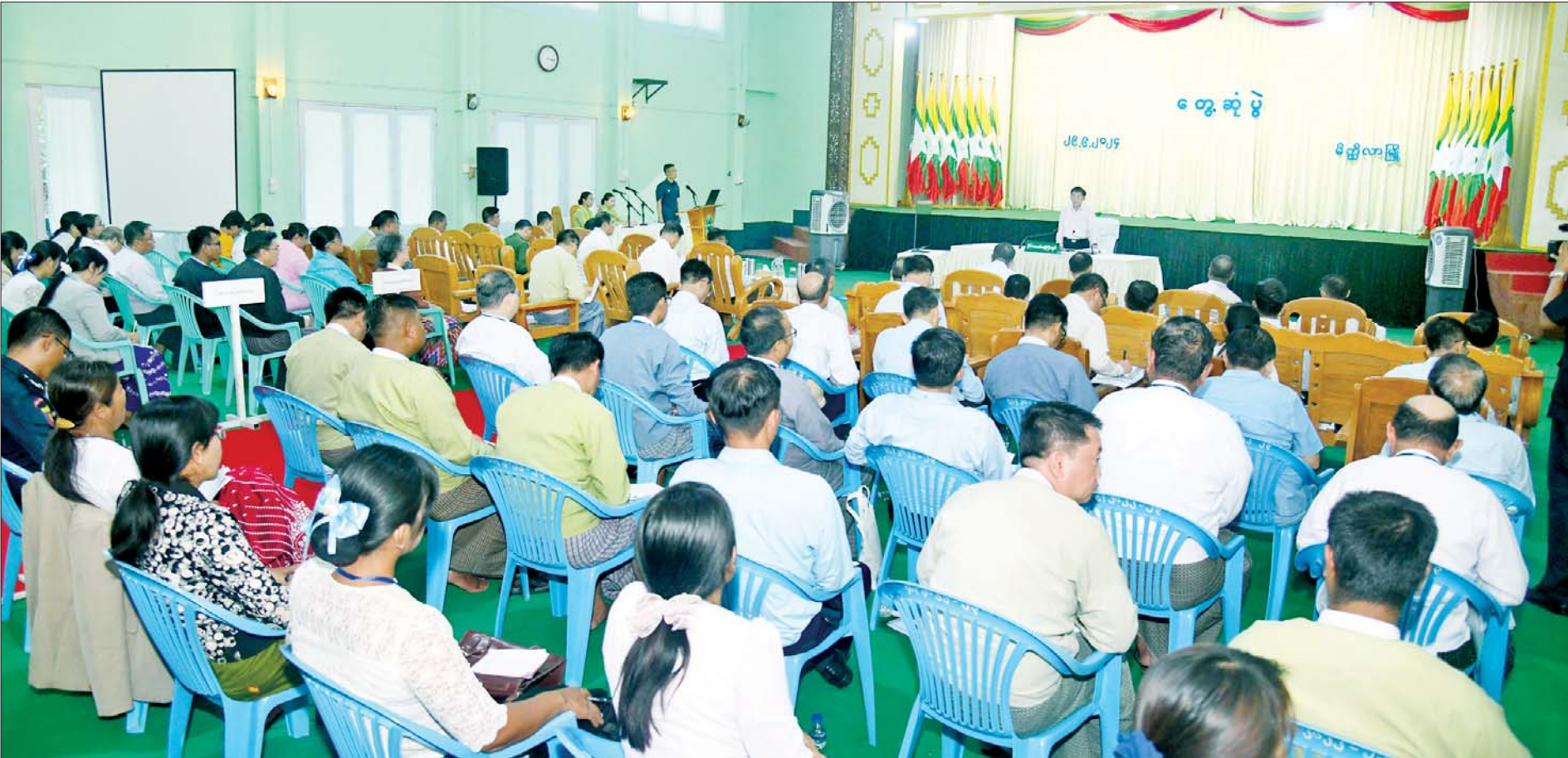
နိုင်ငံတော်စီမံအုပ်ချုပ်ရေးကောင်စီဥက္ကဋ္ဌ နိုင်ငံတော်ဝန်ကြီးချုပ်ဗိုလ်ချုပ်မှူးကြီး မင်းအောင်လှိုင် မိတ္ထီလာခရိုင်အတွင်းရှိ ဌာနဆိုင်ရာတာဝန်ရှိသူများ၊ မြို့မိမြို့ဖများအားတွေ့ဆုံ၍ ဒေသစီးပွားဖွံ့ဖြိုးတိုးတက် ရေးဆိုင်ရာများ ဆွေးနွေးပြောကြားစဉ်။

နေပြည်တော် စက်တင်ဘာ ၂၉ နိုင်ငံတော်စီမံအုပ်ချုပ်ရေးကောင်စီဥက္ကဋ္ဌ နိုင်ငံတော်ဝန်ကြီးချုပ် ဗိုလ်ချုပ်မှူးကြီးမင်းအောင်လှိုင်သည် မိတ္ထီလာခရိုင်အတွင်းရှိ ဌာနဆိုင်ရာတာဝန်ရှိသူများ၊ မြို့မိမြို့ဖများအား ယနေ့မွန်းလွဲပိုင်းတွင် မိတ္ထီလာမြို့ရှိ ကန်တော်မင်္ဂလာခန်းမ၌တွေ့ဆုံ၍ ဒေသဖွံ့ဖြိုးတိုးတက်ရေးဆိုင်ရာများ ဆွေးနွေးပြောကြားသည်။ စာမျက်နှာ ၃ ကော်လံ ၁ သို့