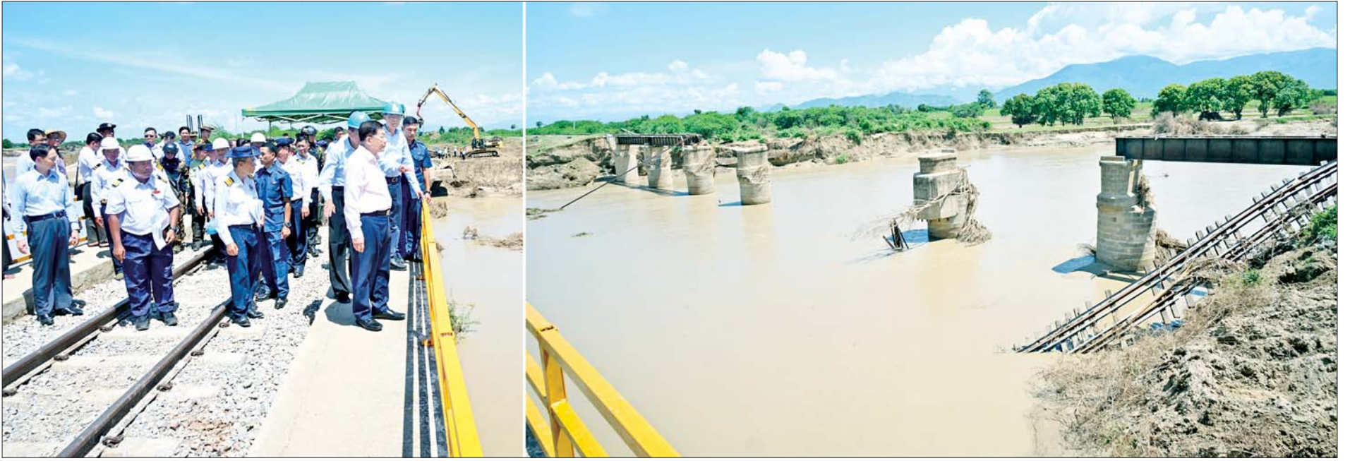
နိုင်ငံတော်စီမံအုပ်ချုပ်ရေးကောင်စီဥက္ကဋ္ဌ နိုင်ငံတော်ဝန်ကြီးချုပ် ဗိုလ်ချုပ်မှူးကြီးမင်းအောင်လှိုင် ရေကြီးရေလျှံမှုကြောင့် ထိခိုက်ပျက်စီးခဲ့မှုများဖြစ်ပေါ်ခဲ့သည့် စမုံချောင်းတံတားကို ကြည့်ရှုစစ်ဆေးစဉ်။