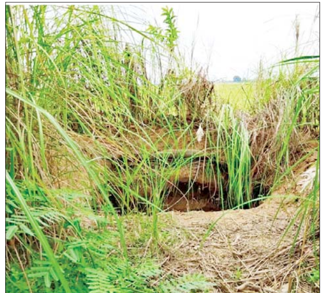
မတ္တရာမြို့နယ် သုံးဆယ်ပေးကျေးရွာအတွင်း၌ အကြမ်းဖက်သမားများအသုံးပြုခဲ့သည့် ဆက်သွယ်ရေးမြောင်းနှင့် ပစ်ကျင်းများကို တွေ့ရစဉ်။