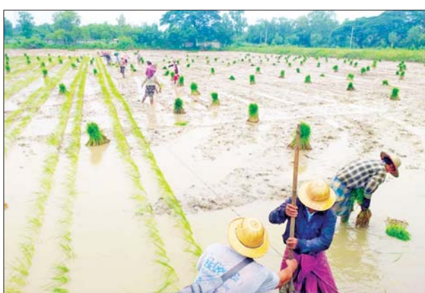
ရေကြီးနှစ်မြုပ်ပျက်စီးခဲ့သည့် စပါးစိုက်ခင်းများနေရာတွင် အစားထိုးပြန်လည်စိုက်ပျိုးနေမှုကို တွေ့ရစဉ်။

★ ကျောမိုးမှ ယခုနှစ်မိုးရာသီတွင် တိုင်း ဒေသကြီးအတွင်း မိုးစပါး ၁၁၄၈၂၂ ဧက တိုးချဲ့စိုက်ပျိုး ရန် လျာထားဆောင်ရွက်ခဲ့ရာ ၁၁၀၅၀၆ ဧက စိုက်ပျိုးခဲ့ပြီး ဧရာဝတီမြစ်ရေမှ တစ်ဆင့် လှိုင်မြစ်ရေမြင့်တက်ခဲ့မှုကြောင့် မိုးစပါးစိုက်ခင်း ၉၉၂၀၅ ဧက ရေနှစ် မြုပ်ပျက်စီးခဲ့ရာ ၇၄၀၁၁ ဧက ပျက်စီးမှုတွင် စက်တင်ဘာ ၂၅ ရက် အထိမိုးစပါး ၄၆၇၉၆ ဧက ပြန်လည် စိုက်ပျိုးနိုင်ခဲ့ခြင်းဖြစ်သည်။ ရန်ကုန်တိုင်းဒေသကြီး စိုက်ပျိုး ရေးဦးစီးဌာနသည် ရေကြီးနှစ်မြုပ် မှုကြောင့် ထိခိုက်မှုရှိခဲ့သော မိုးစပါးဧရိယာတို့တွင် ကောက်ပင် စိပ်သည့်နေရာမှ ပြန်လည်နုတ်ယူ ၍ ကောက်ပင်ကျသွားသောနေရာ တို့၌ ကောက်ပင်ဖာထေးခြင်း၊ ကောက်ပင်လှန်နိုင်မှု အားကောင်း စေရန် ရေထုတ်ပေးခြင်း၊ ကျောက် မှန်ဂျစ်ပဆန် (၁၁၂ ပေါင်/ဧက)