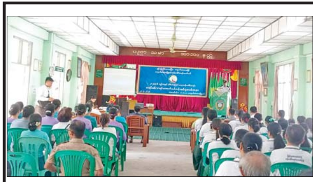
၂၀၂၄ ခုနှစ် လူဦးရေနှင့်အိမ်အကြောင်းအရာ သန်းခေါင်စာရင်းကောက်ယူရေးအတွက် စာရင်းစစ် စာရင်းကောက် သင်တန်းဆင်းပွဲအခမ်းအနားကို စက်တင်ဘာ ၂၈ ရက်က ရန်ကုန်တိုင်းဒေသကြီးကျောက်တံတားမြို့နယ် အထက(ကျောက်တံတား) စကားဝါခန်းမ၌ ကျင်းပစဉ်။ မြို့နယ်(ပြန်/ဆက်)

ကာ နှစ်စဉ်လျှပ်စစ်ဓာတ်အား ၂၀ ဒသမ ၃၀၈ ကီလိုဝပ်နာရီသန်း ပေါင်းအား ထုတ်လုပ်နိုင်မည်ဖြစ်ပြီး လဟယ်မြို့နှင့် အနီးဝန်းကျင် ကျေးရွာများအား လျှပ်စစ်ဓာတ်အား ထုတ်လုပ်ဖြန့်ဖြူးနိုင်မည်ဖြစ်သည်။ ယင်းနောက် တိုင်းဒေသကြီးဝန်ကြီးချုပ်နှင့် တာဝန်ရှိသူများသည် လဟယ်မြို့နယ် စည်ပင်သာယာရေးအဖွဲ့မှ တာဝန်ယူဆောင်ရွက်ခဲ့သည့် လဟယ်မြို့နေပြည်သူများ သောက်သုံးရေအဆင်ပြေစေရန်နှင့် အပန်းဖြေနိုင်စေရန်အတွက် တစ်ရက်လျှင် ရေဂါလန် ၁၅၀၀၀ ခန့် ထွက်ရှိသည့်စီမံစမ်းရေအား ဆည်ပိတ်ကာ ပြန်လည်တူးဖော်ခဲ့သည့်အကျယ် သုံးဧကကျော်နှင့် အနက် ၁၂ ပေရှိ ရေဂါလန် ၉၈ သိန်းကျော်