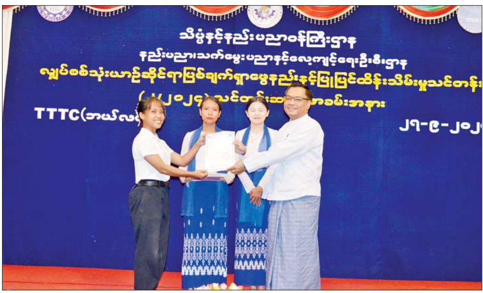
Electude Digital Learning Management System ဖြင့် စက်တင်ဘာ ၉ ရက်မှ ၂၇ ရက်အထိ သင်တန်းကာလ သုံးပတ်အတွင်း တစ်ပတ်လျှင် ငါးရက်၊ တစ်ရက်လျှင် ၆ နာရီနှုန်းဖြင့် ပို့ချခဲ့ပြီး ပြင်ပ EV လုပ်ငန်းရှင်များ၏ နည်းပညာလိုအပ်ချက်နှင့် တက်ရောက်နိုင်မှု တို့အပေါ် မူတည်၍ သင်တန်းများကို တိုးချဲ့ဖွင့်လှစ်သွားရန် စီစဉ်ဆောင်ရွက်လျက်ရှိကြောင်း သိရသည်။ သတင်းစဉ်

ကြည့်ရှုအားပေးကာ လိုအပ်သည်များကို မှာကြားသည်။ သင်တန်းဆင်းအောင်လက်မှတ်များ ပေးအပ်ထို့နောက် ဒုတိယဝန်ကြီးသည် EV ပြုပြင်ထိန်းသိမ်းမှုသင်တန်း(၂/၂၀၂၄)သင်တန်းဆင်းပွဲ အခမ်းအနားသို့ တက်ရောက်၍ EV နည်းပညာသင်တန်းများကို စံနှုန်းများနှင့်အညီ ဖွင့်လှစ်ကာ ကျွမ်းကျင်သူများကို စဉ်ဆက်မပြတ် ပျိုးထောင်ပေးလျက်ရှိကြောင်း၊ သင်တန်းဆင်းများသည် လေ့လာသိရှိခဲ့သည့် နည်းပညာများကို မိမိတို့၏ ဌာနနှင့် လုပ်ငန်းခွင်များတွင် ပိုမိုတိုးတက်မှုရှိစေရန် အကျိုးရှိစွာ ပြန်လည်အသုံးပြုရန်၊ EV သုံးစွဲသည့်ပြည်သူများ၏လက်ဝယ်အရောက် နည်းပညာများကို ဆက်လက် ဖြန့်ဝေပေးသွားရန် တိုက်တွန်းပြောကြားပြီး သင်တန်းသားများထံ သင်တန်းဆင်းအောင်လက်မှတ်များ ပေးအပ်ချီးမြှင့်သည်။ သင်တန်းသို့ ပြင်ပ EV ကုမ္ပဏီများနှင့် EV Workshop များမှ သင်တန်းသား ၁၈ ဦးနှင့် ဝန်ကြီးဌာနများမှ သင်တန်းသား ခုနစ်ဦး တက်ရောက်ပြီး EV အဆင့်မြင့် သင်ထောက်ကူ ပစ္စည်းများကို