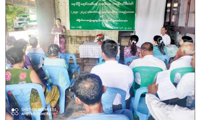
အား ၂၀၂၄-၂၀၂၅ ဘဏ္ဍာနှစ်မှ ဥပဒေ၊ နည်းပဒေများနှင့်အညီ စတင်ကာ ငါးနှစ်တာဆက်လက် တာဝန်ယူ ဆောင်ရွက်ကြမည့် အမှုဆောင်သစ်များကို မြို့နယ် အမှုဆောင်သစ်ရွေးချယ်ပွဲကို မြို့နယ် ရယူကာ ဖွဲ့စည်းပေးခဲ့ကြောင်း သိရသည်။ ခရိုင်(ပြန်/ဆက်)