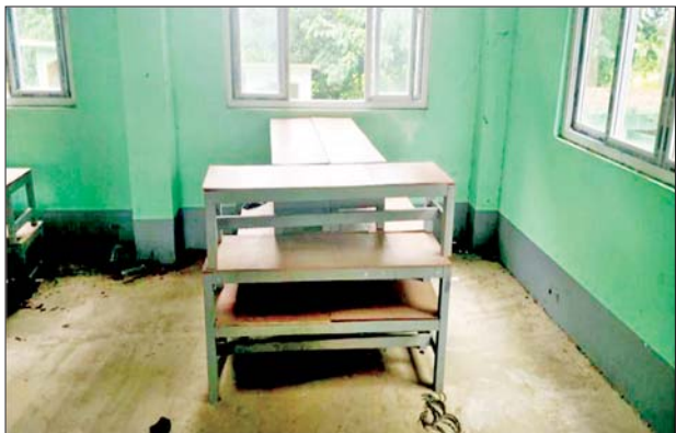
ဧရာဝတီမြစ်ကြောင်းတစ်လျှောက်ရှိ ကျေးရွာများမှ စာသင် ကျောင်းများ၌ အကြမ်းဖက်သမားများ နေထိုင်အသုံးပြုထားသည့် အသုံးအဆောင်ပစ္စည်းများကို တွေ့ရစဉ်။