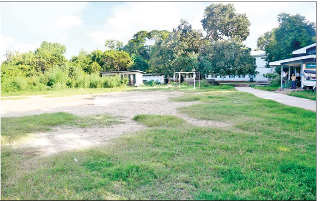
နိုင်ငံတော်စီမံအုပ်ချုပ်ရေးကောင်စီဥက္ကဋ္ဌ နိုင်ငံတော်ဝန်ကြီးချုပ် ဗိုလ်ချုပ်မှူးကြီးမင်းအောင်လှိုင် မိတ္ထီလာမြို့၌ ကျောင်းသားစုပေါင်းခန်းမဆောက်လုပ်မည့် လျာထားမြေနေရာကို ကြည့်ရှုစဉ်။

ရေဖုံးမှ အဆိုပါတွေ့ဆုံပွဲသို့ နိုင်ငံတော်စီမံ အုပ်ချုပ်ရေးကောင်စီဥက္ကဋ္ဌ နိုင်ငံတော် ဝန်ကြီးချုပ်နှင့်အတူ ကောင်စီတွဲဖက် အတွင်းရေးမှူး ဗိုလ်ချုပ်ကြီးရဲဝင်းဦး၊ ကောင်စီဝင်များဖြစ်ကြသည့် ဗိုလ်ချုပ် ကြီးမောင်မောင်အေး၊ ဒုတိယဗိုလ်ချုပ်ကြီး ရာပြည့်နှင့် ပြည်ထောင်စုဝန်ကြီးများ ဖြစ်ကြသည့် ဦးမင်းနောင်၊ ဦးလှမိုးနှင့် ဒေါက်တာညွန့်ဖေ၊ မန္တလေးတိုင်းဒေသ ကြီးဝန်ကြီးချုပ် ဦးမျိုးအောင်၊ ကာကွယ် ရေးဦးစီးချုပ်ရုံး(ကြည်း)မှ အဆင့်မြင့် တပ်မတော်အရာရှိကြီးများ၊ မန္တလေးတိုင်း ဒေသကြီး အစိုးရအဖွဲ့ဝင်များ၊ မိတ္ထီလာ ခရိုင်အတွင်းရှိ ခရိုင်နှင့်မြို့နယ်အဆင့် ဌာန ဆိုင်ရာတာဝန်ရှိသူများ၊ အုပ်ချုပ်ရေးမှူး များ၊ မြို့မိမြို့ဖများ တက်ရောက်ကြသည်။ ဒေသဆိုင်ရာအချက်အလက်များနှင့် ဒေသဖွံ့ဖြိုးတိုးတက်ရေးဆောင်ရွက် နေမှုများအား ရှင်းလင်းတင်ပြ ဦးစွာ မိတ္ထီလာခရိုင် အုပ်ချုပ်ရေးမှူး