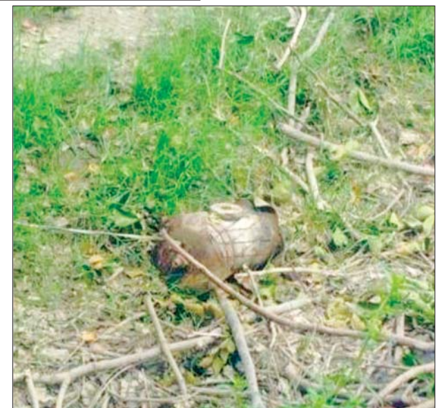
ဧရာဝတီမြစ်ကြောင်းတစ်လျှောက်ရှိ ကျေးရွာများတွင် အကြမ်းဖက်သမားများ ထောင်ထားသည့် လက်လုပ်မိုင်းများကို တွေ့ရစဉ်။