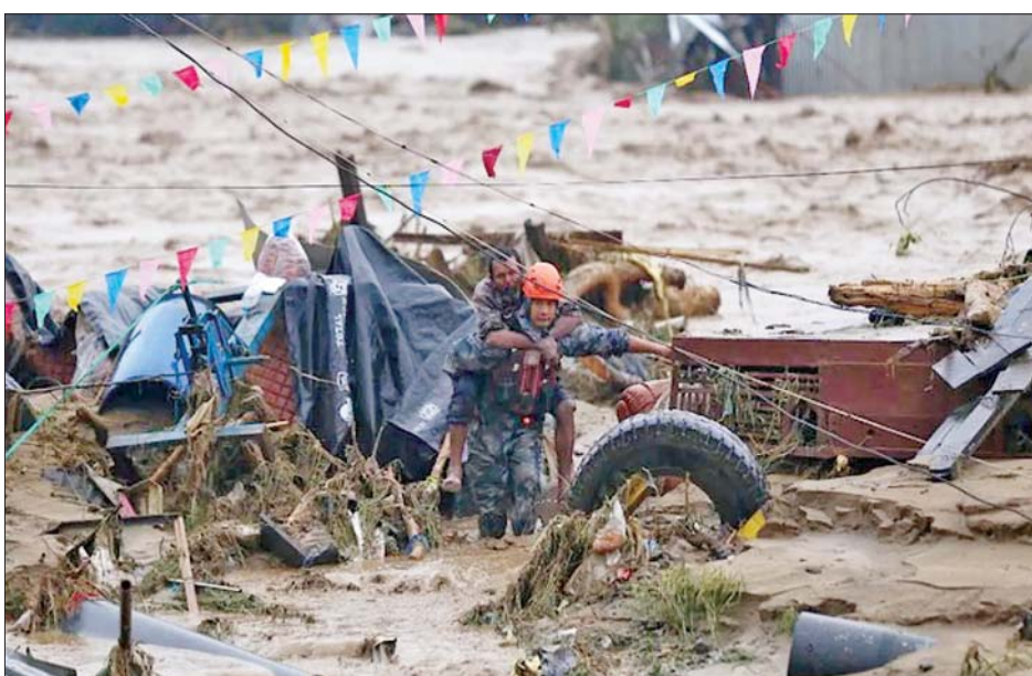
မိုးအဆက်မပြတ် ရွာသွန်းမှု ကြောင့် နီပေါနိုင်ငံတစ်ဝန်းရှိ အဓိကလမ်းမကြီးအများစုသည် မြေပြိုမှုနှင့် ရေကြီးမှုများကြောင့် ပိတ်ဆို့မှုများဖြစ်ပွားခဲ့ပြီး လူပေါင်း များစွာ ထိခိုက်မှုရှိခဲ့ကြောင်း ရဲတပ်ဖွဲ့က ပြောကြားသည်။ လက်ရှိတွင် နီပေါနိုင်ငံ၏ ယာယီဝန်ကြီးချုပ်နှင့် မြို့ပြဖွံ့ဖြိုး တိုးတက်ရေးဝန်ကြီး ပရာကက်ရှီ မန်ဆင်းသည် ကယ်ဆယ်ရေး လုပ်ငန်းများအတွက် ပံ့ပိုးကူညီမှု ရယူရန် အဖွဲ့အစည်းပေါင်းစုံ အစည်းအဝေးကို သဘာပတိ အဖြစ်ဆောင်ရွက်လျက်ရှိကြောင်း သိရသည်။ ကိုးကား-ဆင်ယူာ ဘာသာပြန်-အလင်းသစ်