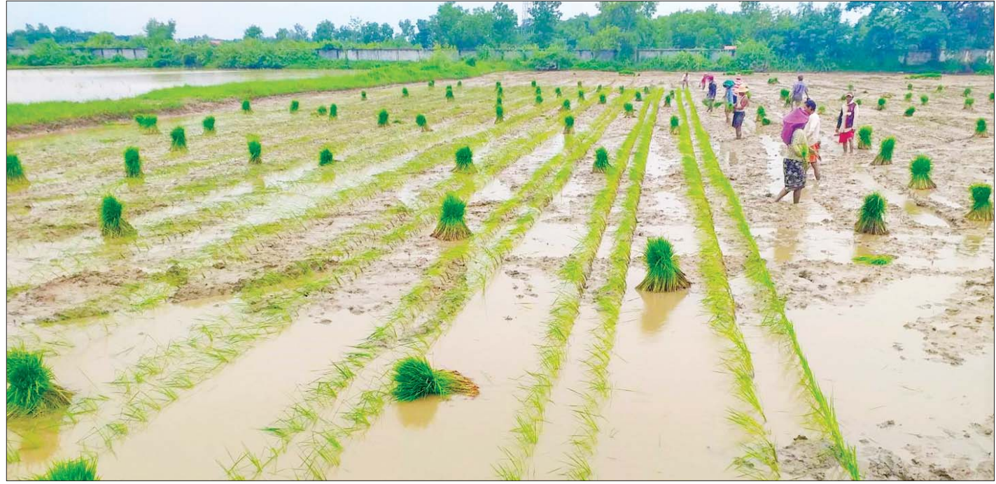
ရေကြီးနစ်မြုပ်ပျက်စီးခဲ့သည့် စပါးစိုက်ခင်းများနေရာတွင် အစားထိုးပြန်လည်စိုက်ပျိုးမှုကိုတွေ့ရစဉ်။