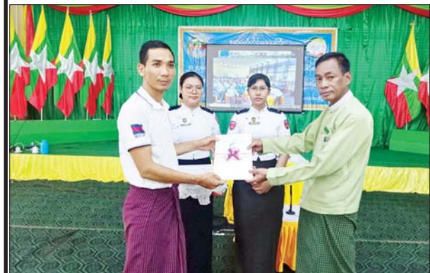
ဧရာဝတီတိုင်းဒေသကြီး ဟင်္သာတမြို့နယ်၌ ၂၀၂၄ ခုနှစ် လူဦးရေနှင့် အိမ်အကြောင်းအရာ သန်းခေါင်စာရင်း စာရင်းစစ်/စာရင်းကောက်သင်တန်းဆင်းပွဲကို စက်တင်ဘာ ၂၈ ရက်က ပြုလုပ်ရာ သန်းခေါင်စာရင်းသင်တန်း တက်ရောက်ခဲ့သည့် စာရင်းစစ်/စာရင်းကောက်များအား ခန့်အပ်လွှာများ ပေးအပ်စဉ်။ ခရိုင်(ပြန်/ဆက်)