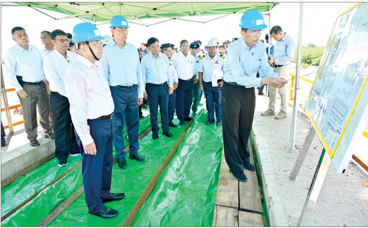
နိုင်ငံတော်စီမံအုပ်ချုပ်ရေးကောင်စီဥက္ကဋ္ဌ နိုင်ငံတော်ဝန်ကြီးချုပ် ဗိုလ်ချုပ်မှူးကြီးမင်းအောင်လှိုင်အား တာဝန်ရှိသူတစ်ဦးက ရှင်းလင်းတင်ပြစဉ်။

နေပြည်တော် စက်တင်ဘာ ၂၉ နိုင်ငံတော် စီမံအုပ်ချုပ်ရေးကောင်စီဥက္ကဋ္ဌ နိုင်ငံတော်ဝန်ကြီးချုပ် ဗိုလ်ချုပ်မှူးကြီးမင်းအောင်လှိုင်သည် ယနေ့နံနက်ပိုင်းတွင် ကောင်စီတွဲဖက်အတွင်းရေးမှူး ဗိုလ်ချုပ်ကြီး ရဲဝင်းဦး၊ ကောင်စီဝင်များဖြစ်ကြသည့် ဗိုလ်ချုပ်ကြီး မြထွန်းဦးနှင့် ဗိုလ်ချုပ်ကြီး မောင်မောင်အေး၊ ပြည်ထောင်စုဝန်ကြီးများဖြစ်ကြသည့် ဦးမင်းနောင်၊ ဦးလှမိုး၊ ဒေါက်တာ ညွန့်မေ၊ မန္တလေးတိုင်းဒေသကြီးဝန်ကြီးချုပ်ဦးမျိုးအောင်၊ ကာကွယ်ရေး ဦးစီးချုပ်ရုံးမှ အဆင့်မြင့်တပ်မတော်အရာရှိကြီးများနှင့် တာဝန်ရှိသူများလိုက်ပါ၍ ရေကြီးရေလျှံမှုကြောင့် ထိခိုက်ပျက်စီးမှုများ ဖြစ်ပေါ်ခဲ့သည့် သာစည်-မန္တလေး မီးရထားလမ်းပိုင်းပေါ်ရှိ စမုံချောင်းတံတား ပြန်လည်ပြုပြင်ဆောင်ရွက်နေမှု အခြေအနေများအား သွားရောက်ကြည့်ရှုစစ်ဆေးသည်။