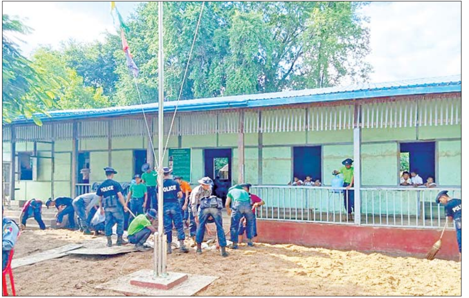
ဆက်သွယ်ရေး အမြန်ပြန်လည်ကောင်းမွန်စေရန် အတွက် ကြိုးပမ်းဆောင်ရွက်လျက်ရှိရာ ပျက်စီးခဲ့သည့် လမ်း/တံတားများကိုလည်း ယာယီသံပေါင်ဘေးလီတံတားများအစားထိုး၍ အမြန်ဆုံးပြန်လည်

ဆက်သွယ်ရေး အမြန်ပြန်လည်ကောင်းမွန်စေရန် အတွက် ကြိုးပမ်းဆောင်ရွက်လျက်ရှိရာ ပျက်စီးခဲ့သည့် လမ်း/တံတားများကိုလည်း ယာယီသံပေါင်ဘေးလီတံတားများအစားထိုး၍ အမြန်ဆုံးပြန်လည် ပြင်ဆင်ဆောင်ရွက်ပေးလျက်ရှိကြောင်းနှင့် ပြုပြင်ရန် ကျန်ရှိနေသည့်တံတားများကိုလည်း အမြန်ဆုံးဆက်လက် ပြုပြင်ဆောင်ရွက်လျက်ရှိကြောင်း သတင်းစဉ်