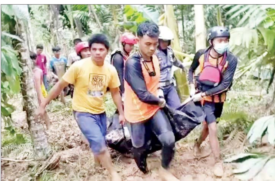
မသိရသေးကြောင်း ဆင်ယူာ သတင်းဌာနသို့ ပြောကြားသည်။ နောက်ဆုံး ရရှိထားသည့် သတင်းအချက်အလက်များ အရ ၁၂ ဦး အသက်ဆုံးရှုံးခဲ့ပြီး ဒဏ်ရာ ရရှိသူ ၁၁ ဦးသည် ဆေးကုသမှု ခံယူနေကြောင်း သိရသည်။ ပိတ်မိနေသော မိုင်းတွင်း လုပ်သားများ၏ အခြေအနေနှင့် စပ်လျဉ်း၍ အသက်ရှင်သန်ခြင်းရှိ မရှိကို အတည်မပြုနိုင်သေးကြောင်း အဗ္ဗဒူလ်မာလစ်က ပြောကြားသည်။ သို့ရာတွင် ၎င်းအနေဖြင့် အကောင်းဆုံးကို မျှော်လင့်လျက်ရှိပြီး အသက်ရှင် နေစေရေး ဆုတောင်းပေးလျက် ရှိကြောင်း ပြောကြားသည်။ ရှာဖွေကယ်ဆယ်ရေး လုပ်ငန်း တွင် ဒေသဆိုင်ရာကယ်ဆယ်ရေး ရုံးမှ ၂၉ ဦးနှင့် ဒေသဆိုင်ရာ အာဏာပိုင်များနှင့် ရပ်ရွာလူထု များပါဝင်သော ပူးပေါင်းအဖွဲ့မှ လူ ၂၀၀ ကျော် အပါအဝင် လူ ၂၂၉ ဦး ပါဝင်ဆောင်ရွက်လျက်ရှိ ကြောင်း သိရသည်။ ကိုးကား-ဆင်ယူာ ဘာသာပြန်-အလင်းသစ်

ဂျကာတာ စက်တင်ဘာ ၂၉ အင်ဒိုနီးရှားနိုင်ငံ အနောက် ဆူမားတြားပြည်နယ် ဆွတ်ခရိုင်ရှိ တရားမဝင် ရွှေတွင်းတစ်ခု၌ မြေပြိုမှုကြောင့် စက်တင်ဘာ ၂၈ ရက်က မိုင်းလုပ်သား ၁၂ ဦး သေဆုံးပြီး ၁၁ ဦး ဒဏ်ရာရရှိခဲ့ကြောင်း ယနေ့ ဆင်ယူာသတင်းတစ်ရပ် အရသိရသည်။