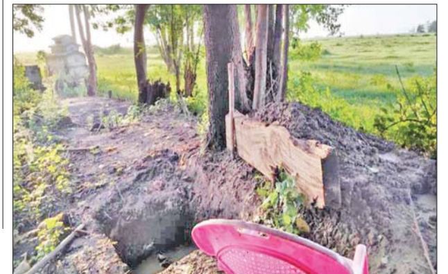
ဧရာဝတီမြစ်ကြောင်းတစ်လျှောက်ရှိ ကျေးရွာများတွင် အကြမ်း ဖက်သမားများ အသုံးပြုခဲ့သည့် ဆက်သွယ်ရေးမြောင်းများနှင့် ပစ်ကျင်းများကို တွေ့ရစဉ်။