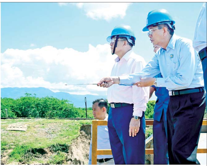
ကြည့်ရှုစစ်ဆေး နိုင်ငံတော်စီမံအုပ်ချုပ်ရေးကောင်စီဥက္ကဋ္ဌ နိုင်ငံတော်ဝန်ကြီးချုပ် ဗိုလ်ချုပ်မှူးကြီး မင်းအောင်လှိုင် စနစ်တကျ တံတားပြန်လည်ပြုပြင်ဆောင်ရွက်နေမှုကို ကြည့်ရှုစစ်ဆေးစဉ်။

ဘူတာသို့ ရောက်ရှိပြီးနောက် သဲတော - ဝမ်းတွင်း - မိတ္ထီလာ လမ်းကြောင်းအတိုင်း မော်တော် ယာဉ်များဖြင့် ထွက်ခွာခဲ့ကာ လမ်းကြောင်းတစ်လျှောက် ဒေသ ဖွံ့ဖြိုးတိုးတက်ရေး ဆောင်ရွက် ထားရှိမှုများ၊ စိုက်ပျိုးရေးလုပ်ငန်း ဆောင်ရွက် ထားရှိမှုများကို ကြည့်ရှုစစ်ဆေးခဲ့ကြောင်း သိရ သည်။ သတင်းစဉ်