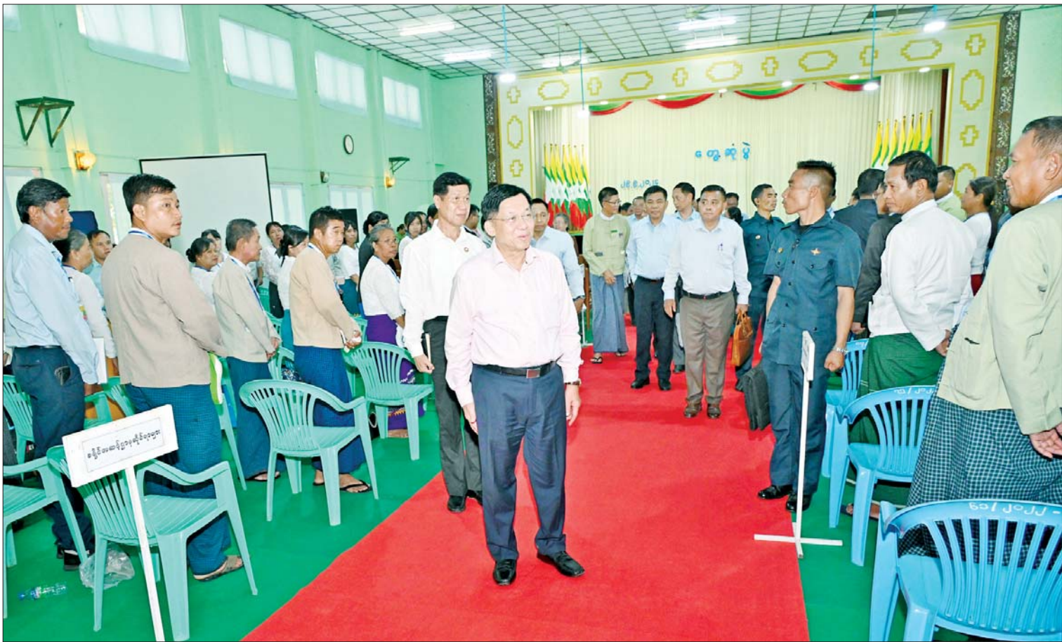
နိုင်ငံတော်စီမံအုပ်ချုပ်ရေးကောင်စီဥက္ကဋ္ဌ နိုင်ငံတော်ဝန်ကြီးချုပ် ဗိုလ်ချုပ်မှူးကြီးမင်းအောင်လှိုင် တက်ရောက်လာကြသည့် ဌာနဆိုင်ရာတာဝန်ရှိသူများ၊ မြို့မိ မြို့ဖများအား ရင်းရင်းနှီးနှီးနှုတ်ဆက်စဉ်။

ထို့ကြောင့် ဆရာ ဆရာမများအနေ ဖြင့် စနစ်တကျသင်ကြားပေးမည်ဆိုပါက စိတ်ဓာတ်၊ စည်းကမ်း ကောင်းမွန်သည့် အဖိုးတန်မျိုးဆက်သစ် လူငယ်များကို မွေးထုတ်ပေးနိုင်မည်ဖြစ်ကြောင်း၊ ပညာ ရေးကဏ္ဍမြှင့်တင်ရေးအတွက် မိမိတို့ အနေဖြင့် ကြိုးပမ်းဆောင်ရွက်လျက်ရှိပြီး နိုင်ငံ၏ အနာဂတ်ဖွံ့ဖြိုးတိုးတက်ရေး အတွက် ပညာတတ်များ ပေါ်ကြွယ်ဝအောင် ဆောင်ရွက်သွားရမည်ဖြစ်ကြောင်း၊ လက်ရှိ အချိန်တွင် မိမိတို့နိုင်ငံမှ ပြည်ပနိုင်ငံများ သို့သွားရောက်၍ အလုပ်လုပ်ကိုင်နေသူ များရှိကြောင်း၊ နိုင်ငံတွင်းရှိ စိုက်ပျိုးမွေးမြူ ရေးလုပ်ငန်းများကို အခြေခံသည့် ကုန်ထုတ်လုပ်ငန်းများကို ဖွံ့ဖြိုးတိုးတက် အောင် ဆောင်ရွက်ပေးနိုင်မည်ဆိုပါက အလုပ်အကိုင် အခွင့်အလမ်းများကိုလည်း ဖော်ဆောင်ပေးနိုင်မည် ဖြစ်ကြောင်း။