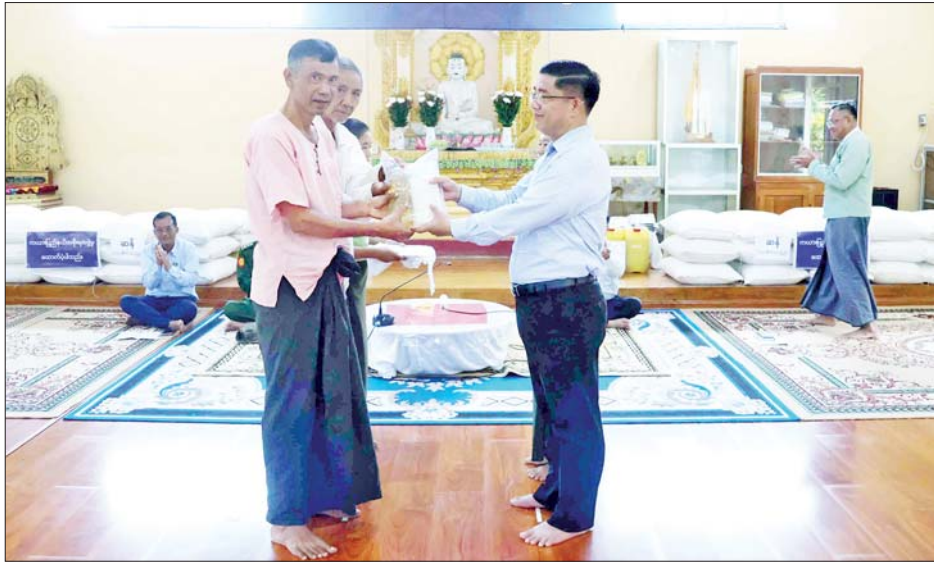
ထိုနေ့က ပြည်နယ်ဝန်ကြီးချုပ်နှင့် တာဝန်ရှိသူများက ရေဘေးသင့်ပြည်သူများသို့ ဆန်၊ ဆီ၊ လူသုံးကုန်ပစ္စည်းများနှင့် ထောက်ပံ့ငွေများပေးအပ်ကာ ရေဘေးသင့်ပြည်သူများအား ချက်ပြုတ်ကျွေးမွေး

လွိုင်ကော် စက်တင်ဘာ ၂၉ လွိုင်ကော်မြို့နယ်အတွင်း လက်ရှိဖြစ်ပေါ်နေသော ရေကြီးရေလျှံဖြစ်ပွားမှုများအတွက် ပြည်နယ်အစိုးရအဖွဲ့သည် ရေဘေးသင့်ဘုန်းတော်ကြီးကျောင်းများ၊ ရေဘေးသင့်ပြည်သူများနှင့် ဝန်ထမ်းများအတွက် ဆန်၊ ဆီ စသည်တို့ကို စဉ်ဆက်မပြတ် လှူဒါန်းထောက်ပံ့ပေးနိုင်ရေး စီမံဆောင်ရွက်လျက်ရှိပြီး စေတနာရှင် အလှူရှင်များကလည်း လာရောက်ကူညီလှူဒါန်းလျက်ရှိသည်။