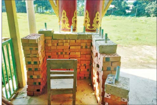
ဧရာဝတီမြစ်ကြောင်းတစ်လျှောက်ရှိ ကျေးရွာများမှ ဘုန်းတော်ကြီးကျောင်းများတွင် အကြမ်းဖက်သမားများအသုံးပြုထားသည့် ဘန်ကာများကို တွေ့ရစဉ်။