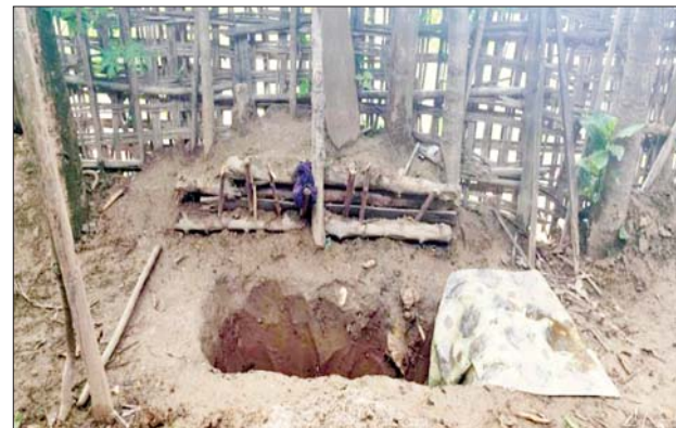
ဧရာဝတီမြစ်ကြောင်းတစ်လျှောက်ရှိ ကျေးရွာများတွင် အကြမ်း ဖက်သမားများ အသုံးပြုထားသည့် ပစ်ကျင်းများနှင့် ဘန်ကာများကို တွေ့ရစဉ်။