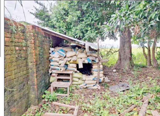
မတ္တရာမြို့နယ် သုံးဆယ်ပေးကျေးရွာအတွင်းရှိ လူနေအိမ်များကို အကာအကွယ်ရယူ၍ အကြမ်းဖက်သမားများအသုံးပြုခဲ့သည့် သဲအိတ်ဘန်ကာများကို တွေ့ရစဉ်။