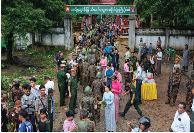
ရှေ့တန်းပြန် နိုင်ငံ့သားကောင်းတပ်မတော်သားများကို အနောက်တောင်တိုင်း စစ်ဌာနချုပ် တိုင်းမှူး ဗိုလ်မှူးချုပ်အောင်ကျော်ခိုင်၊ အရာရှိ စစ်သည်၊ မိသားစုဝင်များ၊ ဌာနဆိုင်ရာတာဝန်ထမ်းများ၊ ဒေသခံတိုင်းရင်းသားပြည်သူများက ဂုဏ်ပြုကြိုဆိုစဉ်။

နေပြည်တော် ဇွန် ၂၈ နိုင်ငံတော်တည်ငြိမ်ရေးနှင့် နယ်မြေ အေးချမ်းသာယာရေးအတွက် ဘောမိ၊ မကျီးစင်၊ လေးမျက်နှာ၊ မြောက်စမ်း၊ ညောင်မှော်၊ သောင်တန်းဒေသများ အတွင်း စစ်ဆင်ရေးနှင့် နယ်မြေလုံခြုံရေး တာဝန်များထမ်းဆောင်၍ ပြန်လည် ရောက်ရှိလာသော အောင်ပွဲရရှေ့တန်းပြန် နိုင်ငံ့သားကောင်း တပ်မတော်သားများ ဂုဏ်ပြုကြိုဆိုခြင်းကို ယနေ့ညနေ ပိုင်းတွင် ဧရာဝတီတိုင်းဒေသကြီး ပုသိမ် မြို့ရှိ နယ်မြေခံတပ်ရင်း၌ပြုလုပ်ရာ အနောက်တောင်တိုင်းစစ်ဌာနချုပ် တိုင်းမှူး ဗိုလ်မှူးချုပ်အောင်ကျော်ခိုင်နှင့် တာဝန်ရှိ သူများ၊ အရာရှိ စစ်သည်၊ မိသားစုဝင်များ၊ ဌာနဆိုင်ရာတာဝန်ရှိသူများ၊ ဒေသခံ တိုင်းရင်းသားပြည်သူများ၊ ဆရာ၊ ဆရာမ များ၊ ကျောင်းသား၊ ကျောင်းသူများနှင့် တိုင်းရင်းသားရိုးရာအကအဖွဲ့များ တက်