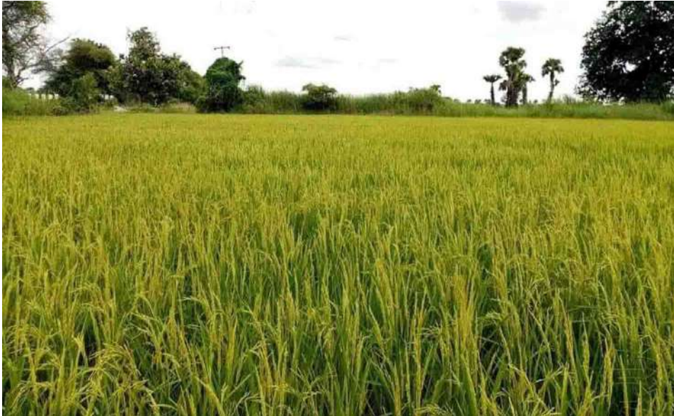
Photo shows a thriving monsoon paddy plantation.

Bamauk June 28 Agricultural daya from Katha District Agriculture Department stated that local authorities in Bamauk Township of Sagaing Region have earmarked cultivation of more than 38,000 acres of rainfed paddy in the township this monsoon.