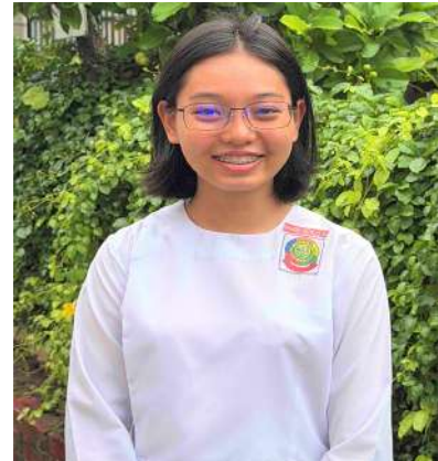
မသက်နှင်းစံ

တက္ကသိုလ်ဝင်တန်း အောင်မြင်ခဲ့တဲ့ ကျောင်းသား၊ ကျောင်းသူတွေအနေနဲ့ အောင်မြင်မှုကိုအခြေခံပြီး ပိုမိုမြင့်မားတဲ့ ပညာရပ်တွေကိုဆည်းပူးပြီး နိုင်ငံနဲ့လူမှုအသိုက်အဝန်းအတွက် အကျိုးပြုနိုင်ပါစေလို့ ဆုမွန်ကောင်းတောင်းပါတယ်။ အားနည်းခဲ့တဲ့သူတွေကလဲ တစ်ခါမအောင်မြင်တာ