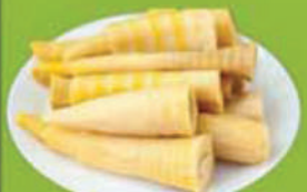
မျှစ်စုံ