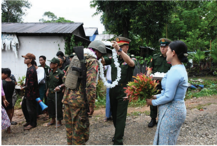
အနောက်တောင်တိုင်းစစ်ဌာနချုပ် တိုင်းမှူး ဗိုလ်မှူးချုပ်အောင်ကျော်ခိုင် ရှေ့တန်းပြန်နိုင်ငံ့သားကောင်း တပ်မတော်သားများကို ဂုဏ်ပြုကြိုဆိုစဉ်။

ချမ်းသာစွာ နေထိုင်လုပ်ကိုင်စားသောက် နိုင်ရေးနှင့် အသက်အိုးအိမ် စည်းစိမ်ဥစ္စာ လုံခြုံမှုရှိစေရေး၊ နိုင်ငံတော်တည်ငြိမ်ရေး၊ နယ်မြေအေးချမ်းရေးအတွက် ရှေ့တန်း စစ်မျက်နှာများတွင် စစ်ဆင်ရေးတာဝန် များကို နေ့မအားညမအား စွမ်းစွမ်းတမ်း တာဝန်ထမ်းဆောင်ခဲ့သော ရှေ့တန်းပြန် တပ်မတော်သားများကို တက်ရောက်လာ ကြသူများက အောင်သပြေခက်များဖြင့် လည်းကောင်း၊ ပန်းကုံးများဖြင့်လည်း ကောင်း၊ အိုးစည်ဒိုးပတ်အကအခုန်များ ဖြင့်လည်းကောင်း ဝမ်းမြောက်စွာ သောင်းသောင်းဖြဖြ ကြိုဆိုဂုဏ်ပြုခဲ့ကြ သည်။ ထို့နောက် တိုင်းမှူးက အောင်ပွဲရ ရှေ့တန်းပြန် တပ်မတော်သားများကို