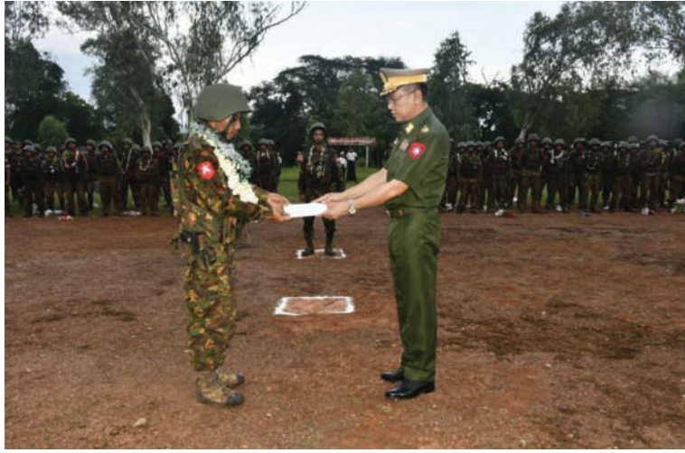
တောင်ပိုင်းတိုင်းစစ်ဌာနချုပ် တိုင်းမှူး ဗိုလ်ချုပ်စိုးကျော်ထက် ရှေ့တန်းပြန် နိုင်ငံ့သားကောင်းတပ်မတော်သားများအတွက် ဂုဏ်ပြုချီးမြှင့်ငွေပေးအပ်စဉ်။

☆ ကျောဖုံးမှအဆက် ဖြင့်လည်းကောင်း၊ အိုးစည်ခိုးပတ်အတီး၊ နေ့မအားညမအား စွမ်းစွမ်းတစ်တာဝန် အမှုတော်၊ အက၊အခန်းများဖြင့်လည်းကောင်း ထမ်းဆောင်ခဲ့သော ရှေ့တန်းပြန် ဝမ်းမြောက်စွာ သောင်းသောင်းဖြဖြကြိုဆို တပ်မတော်သားများကို တက်ရောက် ဂုဏ်ပြုခဲ့ကြကြောင်း သတင်းရရှိသည်။ (၅၀၁)