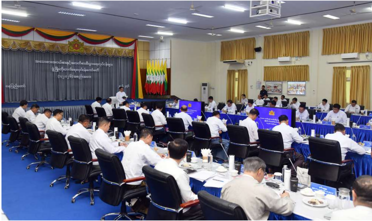
Vice President U Nyo Saw delivers an address at the MSME Development Work Committee Meeting (1/2026).

Nay Pyi Taw June 28 The Micro, Small and Medium Enterprises (MSME) Development Work Committee Meeting (1/2026) was held at 9:30 am today in the assembly hall of Ministry Office No. 30, the Ministry of Industry and Micro, Small and Medium Enterprises Development in Nay Pyi Taw. Vice President U Nyo Saw, also Chairman of the MSME Development Work Committee, attended and delivered an address.