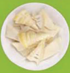
မျှစ်ချဉ်