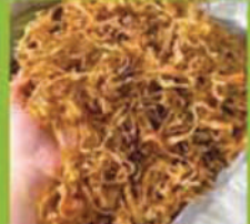
မျှစ်ခြောက်