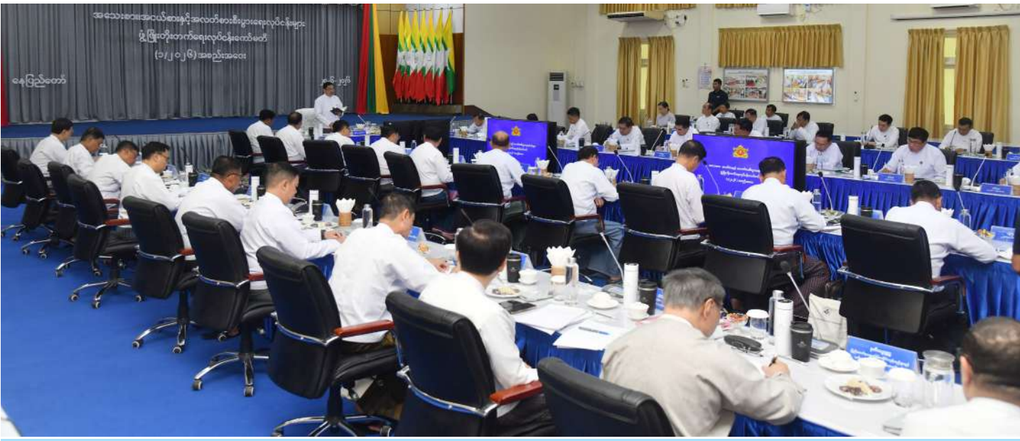
အသေးစား၊ အငယ်စားနှင့် အလတ်စားစီးပွားရေးလုပ်ငန်းများဖွံ့ဖြိုးတိုးတက်ရေးလုပ်ငန်းကော်မတီဥက္ကဋ္ဌ ဒုတိယသမ္မတ ဦးညိုစော အသေးစား၊ အငယ်စားနှင့် အလတ်စားစီးပွားရေးလုပ်ငန်းများဖွံ့ဖြိုးတိုးတက်ရေးလုပ်ငန်းကော်မတီ(၁/၂၀၂၆)အစည်းအဝေးတွင် အမှာစကားပြောကြားစဉ်။

နေပြည်တော် ဇွန် ၂၈ အသေးစား၊ အငယ်စားနှင့် အလတ်စားစီးပွားရေးလုပ်ငန်းများ ဖွံ့ဖြိုးတိုးတက်ရေးလုပ်ငန်းကော်မတီ (၁/၂၀၂၆)အစည်းအဝေးကို ယနေ့နံနက် ၉ နာရီခွဲတွင် နေပြည်တော်ရှိ ရုံးအမှတ်(၃၀) စက်မှုနှင့်အသေးစား၊ ကော်မတီဥက္ကဋ္ဌ ဒုတိယသမ္မတ ဦးညိုစော တက်ရောက်အမှာစကားပြောကြားသည်။ အငယ်စား၊ အလတ်စားနှင့် စီးပွားရေးလုပ်ငန်းများ ဖွံ့ဖြိုးတိုးတက်ရေးဝန်ကြီးဌာန အစည်းအဝေးခန်းမ၌ ကျင်းပရာ အသေးစား၊ အငယ်စားနှင့် အလတ်စားစီးပွားရေးလုပ်ငန်းများ ဖွံ့ဖြိုးတိုးတက်ရေးလုပ်ငန်းကော်မတီဥက္ကဋ္ဌ ဒုတိယသမ္မတ ဦးညိုစော တက်ရောက်အမှာစကားပြောကြားသည်။ အစည်းအဝေးသို့ လုပ်ငန်းကော်မတီ ဒုတိယဥက္ကဋ္ဌ ပြည်ထောင်စုဝန်ကြီး ဒေါက်တာချာလီသန်း၊ အဖွဲ့ဝင် ပြည်ထောင်စုဝန်ကြီးများဖြစ်ကြသည့် ဒေါက်တာကံဇော်၊ စာမျက်နှာ ၁၆ ကော်လံ ၁