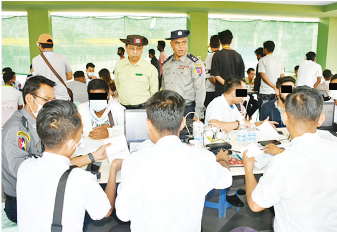
မြန်မာနိုင်ငံအတွင်းသို့ တရားမဝင် ဝင်ရောက်လာသည့် ပြည်ပနိုင်ငံသား ၁၄၁ ဦးကို ထပ်မံဖော်ထုတ်ထိန်းသိမ်းနိုင်ခဲ့မှု မှတ်တမ်းဓာတ်ပုံ။

(ဂ) နိုင်ငံ၏ ဖွံ့ဖြိုးတိုးတက်ရေးလုပ်ငန်းစဉ်များ၌ လူငယ်များ အနေဖြင့် အဓိကစွမ်းအားစုအဖြစ် ပါဝင်နိုင်ရေး ဗလငါးတန် နှင့် ပြည့်စုံသော လူငယ်များဖြစ်စေရန် လူငယ်ကဏ္ဍကို မြှင့်တင်ဆောင်ရွက်ရေး။