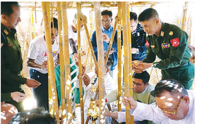
စတုရဂ္ဂသုမင်္ဂလစေတီတော်မြတ်ကြီးအား ကြိုဒေသတိုင်းစစ်ဌာနချုပ် တိုင်းမှူး ဗိုလ်မှူးချုပ်စိုးလှိုင် ရွှေသင်္ကန်းကပ်လှူပူဇော်စဉ်။