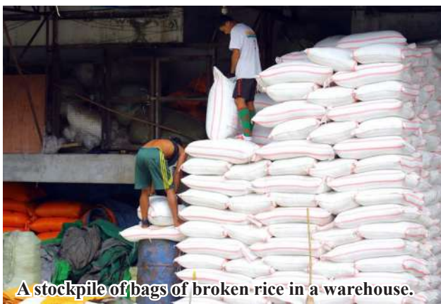
A stockpile of bags of broken rice in a warehouse.

In December 2024, Bogale Township had only been able to ship around 42,000 bags of 24-mark broken rice to Yangon. In January, volume of the broken rice to Yangon increased to 65,000 bags, indicating