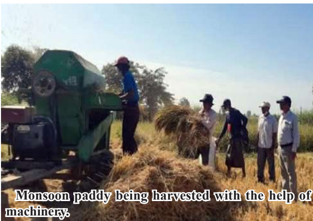
Monsoon paddy being harvested with the help of machinery

Staff of the department join hands with local farmers in growing monsoon paddy with weeding, prevention of pest, removal of different strains of crops and systematic broadcasting of fertilizers in order to increase per-acre yield of monsoon paddy. 206