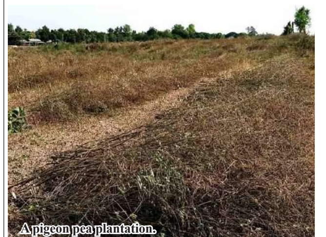
A pigeon pea plantation.

Moreover, officials of the department shared techniques of making natural fertilizers and pests with farmers to cut cost of cultivation.