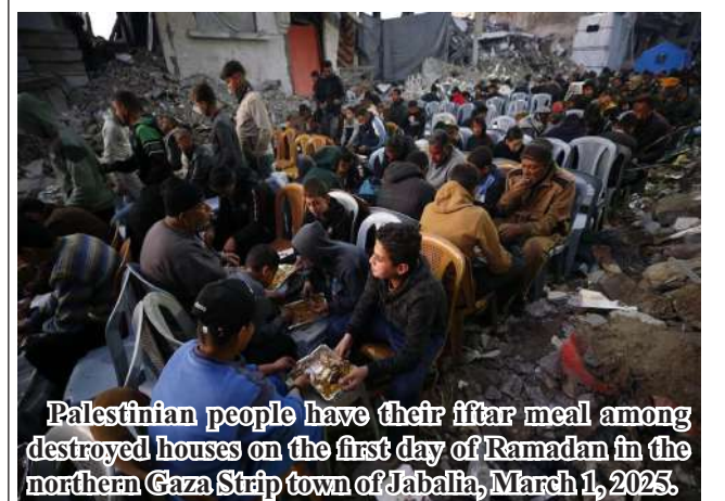
Palestinian people have their iftar meal among destroyed houses on the first day of Ramadan in the northern Gaza Strip town of Jabalia, March 1, 2025.