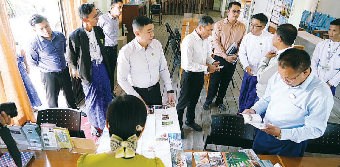
ညောင်ရွှေခရီးစဉ်ဒေသဖွံ့ဖြိုးတိုးတက်ရေး ဒုတိယဝန်ကြီး ဦးမြိုးဇော်စိုး ကွင်းဆင်းဆောင်ရွက်

အချက်အလက်များကို ပြည့်စုံမှန်ကန် အောင်မြင်တင်ဆောင်ရွက်ထားစေလိုပါ ကြောင်းဖြင့် မှာကြားသည်။ ထို့နောက် ဒုတိယဝန်ကြီးနှင့်အဖွဲ့သည် အင်းလေးကန်သို့ လာရောက်လည်ပတ် ကြသည့် ခရီးသည်များ အသုံးပြုနိုင်ရန် ညောင်ရွှေမြို့နယ် စည်ပင်သာယာရေးဌာန ကဆောင်ရွက်ထားသည့် စက်လှေဆိပ် ကို လှည့်လည်ကြည့်ရှုသည်။ မွန်းလွဲပိုင်းတွင် ညောင်ရွှေမြို့နယ်ရှိ အင်းလေးရေတံခွန်သို့ သွားရောက်ကာ ပြည်တွင်း၊ ပြည်ပခရီးသွားဧည့်သည်များလာ ရောက်အပ်နံ့ဖြေလည်ပတ်နိုင်ရန်အတွက် ခရီးစဉ်ဒေသအသစ်ဖော်ထုတ်ဆောင်ရွက် နိုင်မှုအခြေအနေများကို လှည့်လည် ကြည့်ရှုပြီး လိုအပ်သည်များမှာကြားခဲ့ ကြောင်း သတင်းရရှိသည်။ (သတင်းစဉ်)