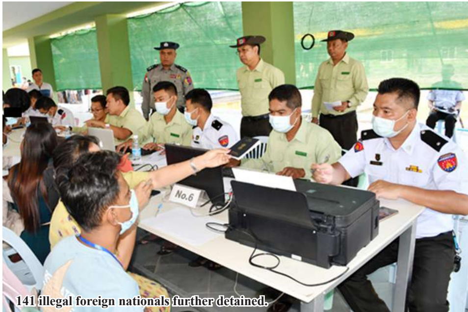
141 illegal foreign nationals further detained.

Nay Pyi Taw March 2 Through the trilateral cooperation between Myanmar, China, and Thailand, authorities are actively investigating and cracking down on individuals involved in online scams, online gambling, and