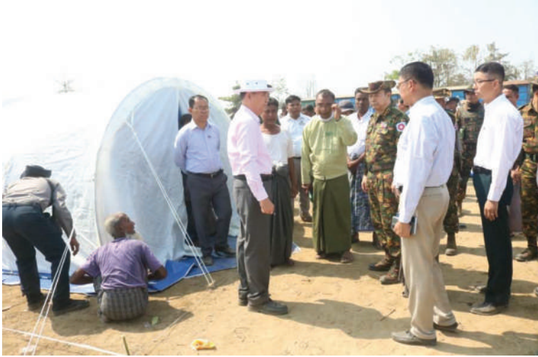
ရခိုင်ပြည်နယ်ဝန်ကြီးချုပ် ဦးထိန်လင်းနှင့် အနောက်ပိုင်းတိုင်းစစ်ဌာနချုပ် တိုင်းမှူး ဗိုလ်ချုပ်ကျော်စွာဦးတို့ စစ်တွေမြို့နယ် ခေါင်းဒုက္ခာကျေးရွာရှိ ကယ်ဆယ်ရေးစခန်း မီးလောင်ကျွမ်းမှုကို ကြည့်ရှုစစ်ဆေးစဉ်။

တပ်ဖွဲ့ဝင်များက မီးသတ်ယာဉ် နှစ်စီး၊ ရေသယ်ယာဉ်သုံးစီး၊ တပ်မတော်ရေသယ်ယာဉ်တစ်စီးတို့နှင့် ပိုင်းဝန်းမီးငြိမ်းသတ်ခဲ့ကြကြောင်း သိရှိရသည်။ အဆိုပါ မီးလောင်ကျွမ်းမှုကြောင့် ခေါင်းဒုက္ခာကျေးရွာ ကယ်ဆယ်ရေးစခန်းမှ အလျား ၄၅ ပေ၊ အနံ ၁၈ ပေ (သွပ်မိုး၊ ထရီကာ၊ ပျဉ်ခင်း) အဆောင် ၃၄ ဆောင်ရှိ အလျား ၁၁ ပေ၊ အနံ ကိုးပေ (သွပ်မိုး၊ ထရီကာ၊ ပျဉ်ခင်း) အခန်း ၂၇၂ ခန်း မီးလောင်ကျွမ်းခဲ့သဖြင့် အိမ်ထောင်စု ၃၁၄ စုနှင့် လူဦးရေ ၂၁၄၉ ဦးတို့ မီးဘေးသင့်ခဲ့ရသည်။ ထိုသို့ မီးလောင်မှုဖြစ်ပွားခဲ့သည့် ခေါင်းဒုက္ခာကျေးရွာကယ်ဆယ်ရေးစခန်း မီးလောင်ပြင်နေရာသို့ ယနေ့နံနက်ပိုင်း