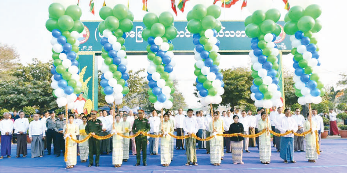
မန္တလေးတိုင်းဒေသကြီးဝန်ကြီးချုပ် ဦးမျိုးအောင်၊ အလယ်ပိုင်းတိုင်းစစ်ဌာနချုပ် တိုင်းမှူး ဗိုလ်မှူးချုပ်ကျော်ကိုထိုက်နှင့် တာဝန်ရှိသူများက ၆၃ နှစ်မြောက် တောင်သူလယ်သမားနေ့အခမ်းအနားမှန်ဦးကို ဖဲကြိုးဖြတ်ဖွင့်လှစ်ပေးစဉ်။

ယင်းနောက် တိုင်းဒေသကြီးဝန်ကြီးချုပ်၊ တိုင်းမှူးနှင့် တာဝန်ရှိသူတို့က သီးနှံစိုက် စွမ်းအားထူးချွန်ဆုရရှိသော ခရိုင်နှင့်သီးနှံ စိုက်ပျိုးထုတ်လုပ်မှု ထူးချွန်ဆုရရှိသော မြို့နယ်များအား ထူးချွန်ဆုတံဆိပ်၊ ဂုဏ်ပြု လွှာနှင့် ဂုဏ်ပြုဆုငွေများကို အသီးသီး ပေးအပ်ချီးမြှင့်ကြသည်။ ၎င်းနောက် တိုင်းဒေသကြီးဝန်ကြီးချုပ်၊ တိုင်းမှူးနှင့် တာဝန်ရှိသူများသည် ကွင်းအတွင်း၌ ခင်းကျင်းပြသထားသော ၆၃ နှစ်မြောက် တောင်သူလယ်သမားနေ့အထိမ်းအမှတ် စိုက်ပျိုးရေးဦးစီးဌာနပြခန်းများနှင့် ပုဂ္ဂလိက ပြခန်းများကို လှည့်လည်ကြည့်ရှုအေးပေး ခဲ့ကြကြောင်း သတင်းရရှိသည်။ (၅၀၁)