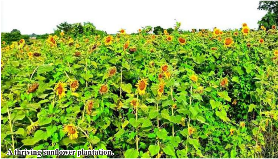
A thriving sunflower plantation.

ship, 1,457 acres in KhinU Township, 4,440 acres in Wetlet Township and 149 acres in Kyaukmyaung, totalling 6,391 acres.