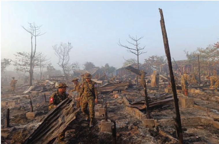
စစ်တွေမြို့နယ် ခေါင်းဒုက္ခာကျေးရွာရှိ ကယ်ဆယ်ရေးစခန်းမီးလောင်ကျွမ်းခဲ့မှုကို တွေ့ရစဉ်။

နေပြည်တော် မတ် ၂ ရခိုင်ပြည်နယ် စစ်တွေမြို့နယ် ခေါင်းဒုက္ခာကျေးရွာရှိ ကယ်ဆယ်ရေးစခန်း၌ မတ် ၁ ရက် နံနက် ၂ နာရီ ၁၅ မိနစ်ခန့်တွင် မီးလောင်မှုဖြစ်ပွားခဲ့သဖြင့် အနောက်ပိုင်းတိုင်းစစ်ဌာနချုပ် စစ်တွေတပ်နယ်မှ နယ်မြေခံတပ်မတော်သားများ၊ မြန်မာနိုင်ငံရဲတပ်ဖွဲ့ဝင်များ၊ ပြည်နယ်မီးသတ်