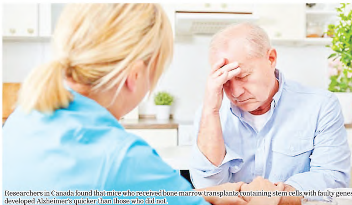
Researchers in Canada found that mice who received bone marrow transplants containing stem cells with faulty genes developed Alzheimer's quicker than those who did not.

The authors of the new research called for blood, tissue, and organ donors to be screened for Alzheimer's to prevent possibly