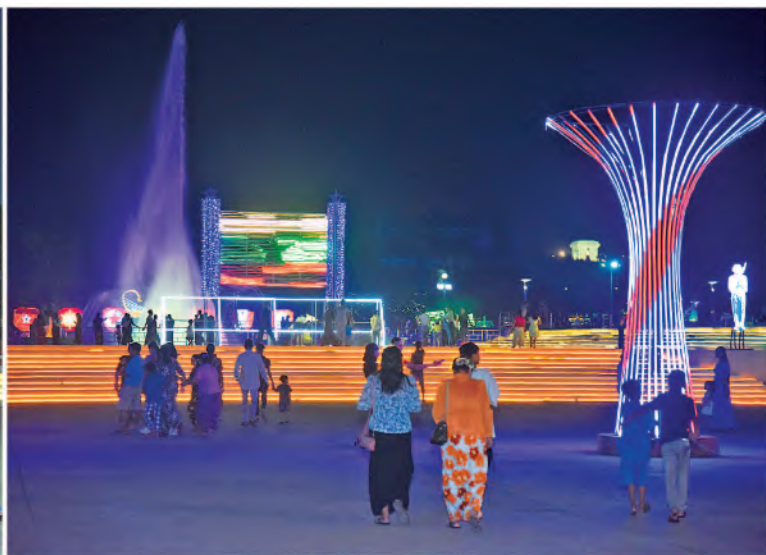
(၇၉)နှစ်မြောက် တပ်မတော်နေ့အား ဂုဏ်ပြုသောအားဖြင့် တပ်မတော်ပန်းခြံ၌ မီးအလှများ၊ ပန်းအလှများဖြင့် အလှဆင်ထားရာ လာရောက်အပန်းဖြေလည်ပတ်သူများဖြင့် စည်ကားနေမှုကို တွေ့ရစဉ်။

နေပြည်တော် စစ်ရေးပြကွင်းကြီးရှေ့ရှိ တပ်မတော်ပန်းခြံတွင်လည်း မီးအလှများဖြင့် ဖန်တီးပုံဖော်ထားသည့် ပြည်ထောင်စု သမ္မတမြန်မာနိုင်ငံတော်အလံနှင့် (၇၉) နှစ်မြောက် တပ်မတော်နေ့အထိမ်းအမှတ်တံဆိပ်၊ တပ်မတော်(ကြည်း၊ ရေ၊ လေ) တပ်ဖွဲ့များတွင် အသုံးပြုသည့် ယာဉ်ယန္တရားပုံစံငယ်များ၊ ရေယာဉ်ပုံစံငယ်များ၊ လေယာဉ်ပုံစံငယ်များ၊ ရဟတ်ယာဉ်ပုံစံငယ်များကို ပြသထားသည်။ ပန်းခြံအတွင်း ဖိုက်ဘာဖြင့် ပြုလုပ်ထားသည့် စစ်သည်ရုပ်တုငယ်များ၊ ပုံဖော်ထားသည့် ပန်းအလှများ၊ သစ်ပင်များတွင် တပ်ဆင်ထားသည့် မီးရောင်စုံများ၊ မီးရောင်စုံများဖြင့် ပြုလုပ်ထားရှိရာ ယနေ့တွင်လည်းလာရောက် အပန်းဖြေလည်ပတ်ကြသူများဖြင့် စည်ကားလျက်ရှိကြောင်း သတင်းရရှိသည်။