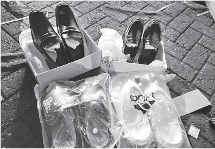
အေးရှားဝေါလ်ကုန်သေတ္တာစစ်ဆေးရေးစခန်း၌ ဖမ်းဆီးရမိမှု။