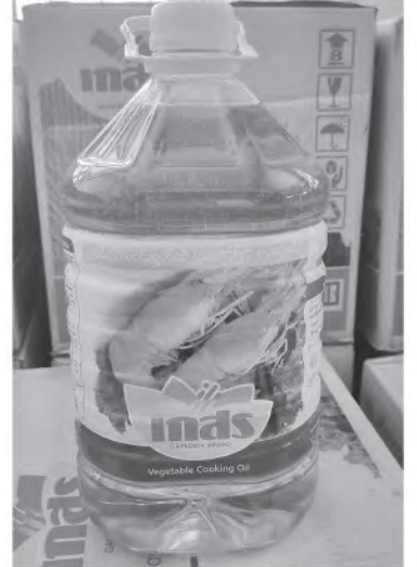
မွန်ပြည်နယ်၌ ဖမ်းဆီးရမိမှု။