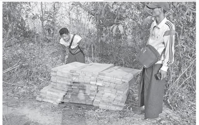
ပဲခူးတိုင်းဒေသကြီး၌ ဖမ်းဆီးရမိမှု။

တရားမဝင်ကုန်သွယ်မှုတိုက်ဖျက်ရေး ဦးဆောင်ကော်မတီ၏ ကြီးကြပ်ကွပ်ကဲမှုဖြင့် တရားမဝင်ကုန်သွယ်မှုများကို ဥပဒေနှင့်အညီ ထိရောက်စွာ တားဆီးအရေးယူနိုင်ရေး ဆောင်ရွက်လျက်ရှိရာ အကောက်ခွန်ဦးစီးဌာန၏ စီမံခန့်ခွဲမှုဖြင့် တာဝန်ကျပူးပေါင်း အဖွဲ့များက စစ်ဆေးမှုများဆောင်ရွက်ရာ တွင် မတ်လ ၂၉ ရက်တွင် အေးရှားဝေါလ် ကုန်သေတ္တာစစ်ဆေးရေးစခန်း၌ ကုန်သေတ္တာ (၁)လုံးအတွင်းမှ သွင်းကုန်ကြေညာလွှာတွင် ကြေညာထားခြင်းမရှိသည့် တရက်နိုင်ငံထုတ် ဖိနပ်မျိုးစုံအရန်(၁၀၀၀၀) စုစုပေါင်း(ခန့်မှန်း တန်ဖိုးငွေကျပ် ၇၀၀၀၀၀၀)ကို ဖမ်းဆီး ရမိခဲ့ပြီး အကောက်ခွန်လုပ်ထုံးလုပ်နည်းများ နှင့်အညီ အရေးယူဆောင်ရွက်လျက်ရှိသည်။ ထို့အတူ မတ်လ ၂၉ ရက်တွင် နေပြည်တော်ကောင်စီတရားမဝင်ကုန်သွယ် မှုတိုက်ဖျက်ရေးအထူးအဖွဲ့၏ စီမံခန့်ခွဲမှုဖြင့် တာဝန်ကျပူးပေါင်းအဖွဲ့က စစ်ဆေးမှုများ