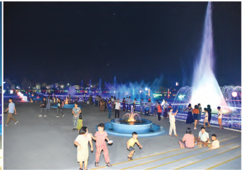
(၇၉)နှစ်မြောက် တပ်မတော်နေ့အား ဂုဏ်ပြုသောအားဖြင့် တပ်မတော်ပန်းခြံ၌ မီးအလှများ၊ ပန်းအလှများဖြင့် အလှဆင်ထားရာ လာရောက်အပန်းဖြေလည်ပတ်သူများဖြင့် စည်ကားနေမှုကိုတွေ့ရစဉ်။