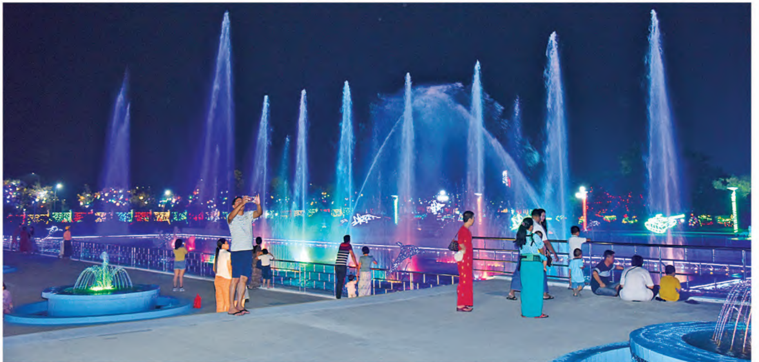
(၇၉)နှစ်မြောက်တပ်မတော်နေ့အား ဂုဏ်ပြုသောအားဖြင့် တပ်မတော်ပန်းခြံ၌ မီးအလှများ၊ ပန်းအလှများဖြင့်အလှဆင်ထားရာ လာရောက်အပန်းဖြေလည်ပတ်သူများဖြင့် စည်ကားနေမှုကို တွေ့ရစဉ်။