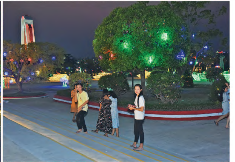
(၇၉)နှစ်မြောက် တပ်မတော်နေ့အား ဂုဏ်ပြုသောအားဖြင့် တပ်မတော်ပန်းခြံ၌ မီးအလှများ၊ ပန်းအလှများဖြင့် ခမ်းနားထည်ဝါစွာအလှဆင်ထားမှုကိုတွေ့ရစဉ်။