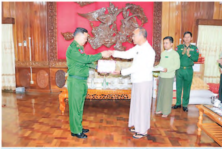
ရှမ်းပြည်နယ်ဝန်ကြီးချုပ် ဦးအောင်အောင်က လုံခြုံရေးတပ်ဖွဲ့ဝင်များအတွက် ရှမ်းပြည်နယ်အစိုးရအဖွဲ့မှဂုဏ်ပြုချီးမြှင့်သည့် ငွေကျပ် ၄၄၇ သိန်းနှင့်စားသောက်ဖွယ်ရာများကိုပေးအပ်ရာ တာဝန်ရှိသူတစ်ဦးက လက်ခံရလေ့စဉ်။

အရှေ့မြောက်တိုင်းစစ်ဌာနချုပ်နယ်မြေအတွင်း လုံခြုံရေးတာဝန်များကို စွမ်းစွမ်းတမ်းတမ်းဆောင်ရွက်ခဲ့သည့် လုံခြုံရေးတပ်ဖွဲ့ဝင်များအတွက် ဂုဏ်ပြုချီးမြှင့်ငွေနှင့် စားသောက်ဖွယ်ရာများ ဂုဏ်ပြုပေးအပ်ပွဲကို တိုင်းစစ်ဌာနချုပ်၊ ပင်လုံခိုလှုံသော၌ ပြုလုပ်ရာ ရှမ်းပြည်နယ်ဝန်ကြီးချုပ် ဦးအောင်အောင်၊ ကာကွယ်ရေးဦးစီးချုပ်ရုံး(ကြည်း)မှ ဗိုလ်ချုပ်ခင်နိုင်ဦး၊ အရှေ့ပိုင်းတိုင်းစစ်ဌာနချုပ် တိုင်းမှူးဗိုလ်ချုပ်ဇော်မင်းလတ်နှင့် အဖွဲ့ဝင်များ