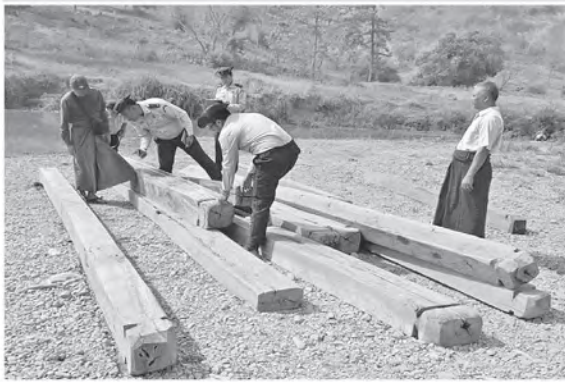
ပဲခူးတိုင်းဒေသကြီး၌ ဖမ်းဆီးရမိမှု။