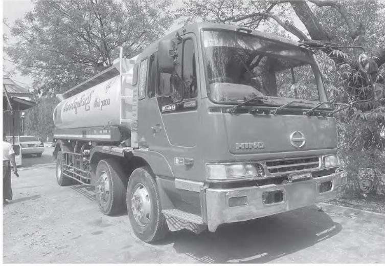
မန္တလေးတိုင်းဒေသကြီး၌ ဖမ်းဆီးရမိမှု။