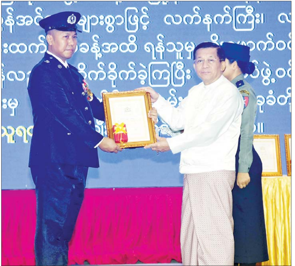
နိုင်ငံတော်စီမံအုပ်ချုပ်ရေးကောင်စီဥက္ကဋ္ဌ နိုင်ငံတော်ဝန်ကြီးချုပ် ဗိုလ်ချုပ်မှူးကြီး မင်းအောင်လှိုင် စွမ်းရည်သတ္တိဂုဏ်ထူးဆောင်တံဆိပ်ရရှိသူတစ်ဦးအား ဆုပေးအပ်ချီးမြှင့်စဉ်။

မြန်မာနိုင်ငံရဲတပ်ဖွဲ့ဝင် အဆင့်အတန်းအားလုံးသည် မြန်မာနိုင်ငံရဲတပ်ဖွဲ့ကို "မျိုးချစ်စိတ်ရှိရမည်၊ စွမ်းရည်ပြည့်ဝရမည်၊ ခေတ်မီရမည်" ဆိုသည့် မျှော်မှန်းချက်များနှင့် တည်ဆောက်ရာတွင် အဖွဲ့အစည်းကောင်း တစ်ခု၏ အနှစ်သာရဖြစ်သည့် စိတ်ဓာတ်ကောင်းမွန်ရေး၊ စွမ်းရည်ပြည့်ဝရေးနှင့် တာဝန်ကျေပွန်ရေးစသည်များကို စဉ်ဆက်မပြတ် ဆက်လက်ခံယူလေ့ကျင့် ဆောင်ရွက်သွားကြရန် ပြည်သူ့လူထု၏ အကျိုးစီးပွားကို ကာကွယ်စောင့်ရှောက်ရာတွင် လည်း ရဲလုပ်ငန်းကျွမ်းကျင်မှု၊ ရိုးသားဖြောင့်မတ်မှု၊ သမာသမတ်ရှိမှုနှင့် ကျေပွန်စွာထမ်းဆောင်ရင်း ဂုဏ်သိက္ခာမြင့်မားပြီး ပြည်သူက လေးစားအားကိုးရလောက်သည့် ဥပဒေဘက်တော်သားများ ဖြစ်လာစေရေး ကြိုးပမ်းဆောင်ရွက်သွားကြရန်၊ ဒို့တာဝန်အရေး (၃) ပါးကို ဦးထိပ်ပန်ဆင်ပြီး မြန်မာနိုင်ငံရဲတပ်ဖွဲ့ရည်မှန်းချက်တာဝန်