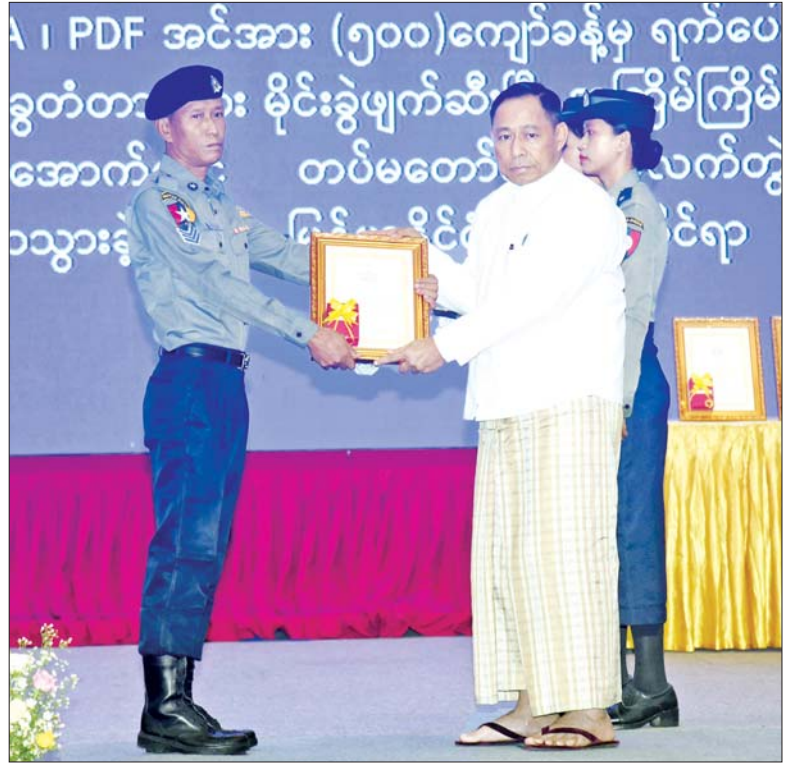
နိုင်ငံတော်စီမံအုပ်ချုပ်ရေးကောင်စီအဖွဲ့ဝင် ပြည်ထောင်စုဝန်ကြီး ဒုတိယဗိုလ်ချုပ်ကြီး ရာပြည့် စွမ်းရည်သတ္တိဂုဏ်ထူးဆောင်တံဆိပ် ရရှိသူတစ်ဦးအား ဆုပေးအပ်ချီးမြှင့်စဉ်။