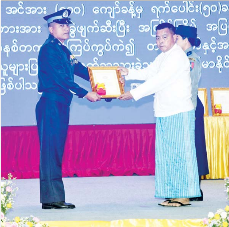
နိုင်ငံတော်စီမံအုပ်ချုပ်ရေးကောင်စီဥက္ကဋ္ဌ နိုင်ငံတော်ဝန်ကြီးချုပ် ဗိုလ်ချုပ်မှူးကြီး ရဲဝင်းဦး စွမ်းရည်သတ္တိဂုဏ်ထူးဆောင်တံဆိပ် ရရှိသူတစ်ဦးအား ဆုပေးအပ်ချီးမြှင့်စဉ်။