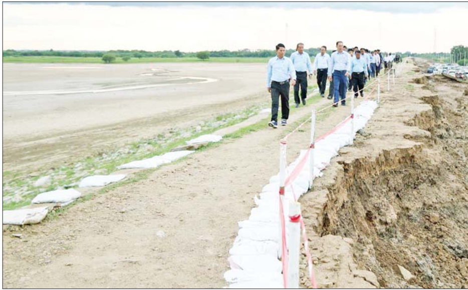
ပြည်ထောင်စုဝန်ကြီး ဦးမင်းနောင် စစ်ရေထိန်းတစ် ထိခိုက်ပျက်စီးခဲ့မှုအား ကြည့်ရှုစစ်ဆေးစဉ်။

စိုက်ပျိုးရေး၊ မွေးမြူရေးနှင့် ဆည်မြောင်းဝန်ကြီးဌာန ပြည်ထောင်စုဝန်ကြီး ဦးမင်းနောင်၊ သယံဇာတနှင့် သဘာဝပတ်ဝန်းကျင် ထိန်းသိမ်းရေးဝန်ကြီးဌာန ပြည်ထောင်စုဝန်ကြီး ဦးခင်မောင်ရှိတို့သည် တာဝန်ရှိသူများနှင့်အတူ ယမန်နေ့နံနက်ပိုင်းက မြစ်သားမြို့နယ် ငပြောင်ဆည်ရေသောက်စနစ်အတွင်းရှိ မိုးစပါးစိုက်ခင်းအား သွားရောက်ကြည့်ရှုစစ်ဆေးရာ တာဝန်ရှိသူများက မိုးစပါးအတွက် ရေဆက်လက်ပေးဝေနိုင်ရေး စီမံဆောင်ရွက်ထားရှိမှု အခြေအနေကို ရှင်းလင်းတင်ပြကြသည်။