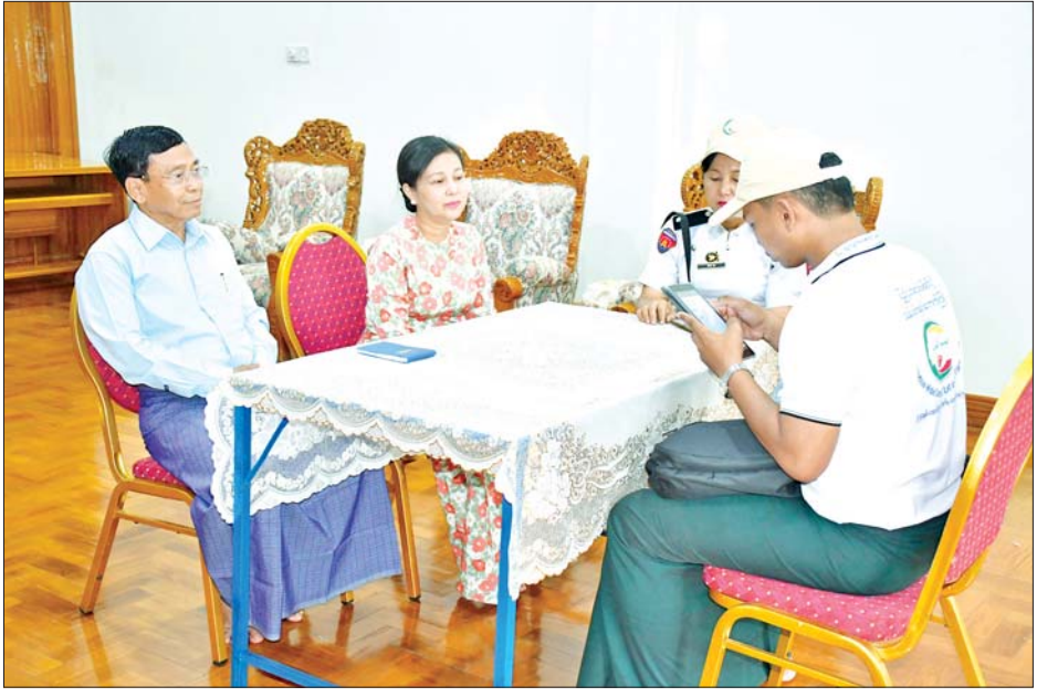
နေပြည်တော်ကောင်စီဥက္ကဋ္ဌ ဦးသန်းထွန်းဦးနှင့်ဇနီးတို့ သန်းခေါင်စာရင်းကောက်ယူရေးအဖွဲ့က မေးမြန်းသည့် မေးခွန်းများကို ဖြေကြားစဉ်။

◆ ကျောဖုံးမှ ထို့ပြင် ဧမ္မာသီရိမြို့နယ်အတွင်းရှိ သန်းခေါင်စာရင်းကောက်ကွက် ၂၂ ကွက်ဖြစ်သည့် ဝဏ္ဏသိဒ္ဓိ ရပ်ကွက် နှစ်နေရာ၊ သုခသိဒ္ဓိ ရပ်ကွက် နှစ်နေရာ၊ ဓနသိဒ္ဓိ ရပ်ကွက် နှစ်နေရာ၊ ဗလသိဒ္ဓိ ရပ်ကွက် တစ်နေရာ၊ မင်္ဂလာသိဒ္ဓိ ရပ်ကွက် နှစ်နေရာ၊ ဘောဂသိဒ္ဓိ ရပ်ကွက် နှစ်နေရာ၊ ဉာဏသိဒ္ဓိ ရပ်ကွက် တစ်နေရာ၊ ပညာသိဒ္ဓိ ရပ်ကွက် နှစ်နေရာ၊ ရွှေကြာပင် ရပ်ကွက် နှစ်နေရာ၊ သပြေကုန်း ရပ်ကွက် တစ်နေရာ၊ အောင်ဧမ္မာ ရပ်ကွက် နှစ်နေရာနှင့် တဲကြီး ကုန်းကျေးရွာအုပ်စု တစ်နေရာ စသည့် သတ်မှတ်နေရာများအတွင်းရှိ ဌာနဆိုင်ရာအကြီးအကဲများ၏ မိသားစုဝင်များ၊ နိုင်ငံ့ဝန်ထမ်းများ၏ မိသားစုဝင်များ၊ ရပ်ကွက်နေပြည်သူများ၏ မိသားစုဝင်များကို မြို့နယ်သန်းခေါင်စာရင်းကောက်ယူရေး ကြီးကြပ်မှုကော်မတီ၊ ရပ်ကွက်သန်းခေါင်စာရင်းကော်မတီ၊ ရပ်ကွက်သန်းခေါင်စာရင်း ကောက်ယူရေး အထောက်အကူပြု အဖွဲ့များနှင့် ပူးပေါင်း၍ သတ်မှတ်နေရာများသို့ သွားရောက်၍ အိမ်ထောင်စု မေးခွန်းပုံစံမေးခွန်း ၆၈ ခုကို Mobile Tablet များအသုံးပြုကာ မေးမြန်းစာရင်းကောက်ယူပြီး ရရှိ