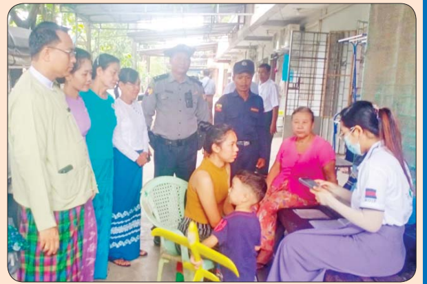
ရွှေပြည်သာမြို့နယ်