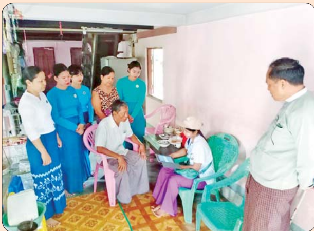
ကျောင်းကုန်းမြို့နယ်