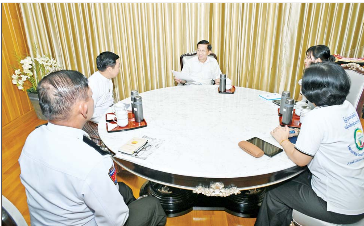
နိုင်ငံတော်စီမံအုပ်ချုပ်ရေးကောင်စီဥက္ကဋ္ဌ နိုင်ငံတော်ဝန်ကြီးချုပ် ဗိုလ်ချုပ်မှူးကြီးမင်းအောင်လှိုင် သန်းခေါင်စာရင်းကောက်ယူရေးအဖွဲ့၏ သန်းခေါင်စာရင်းမေးခွန်းများကို ပြည့်ပြည့်စုံစုံ ဖြေကြားစဉ်။

သန်းခေါင်စာရင်း ကောက်ယူ ရေးအဖွဲ့က သန်းခေါင်စာရင်း မေးခွန်းများကို မေးမြန်းဖြည့်စွက် ကြရာ နိုင်ငံတော်စီမံအုပ်ချုပ်ရေး ကောင်စီဥက္ကဋ္ဌ နိုင်ငံတော်