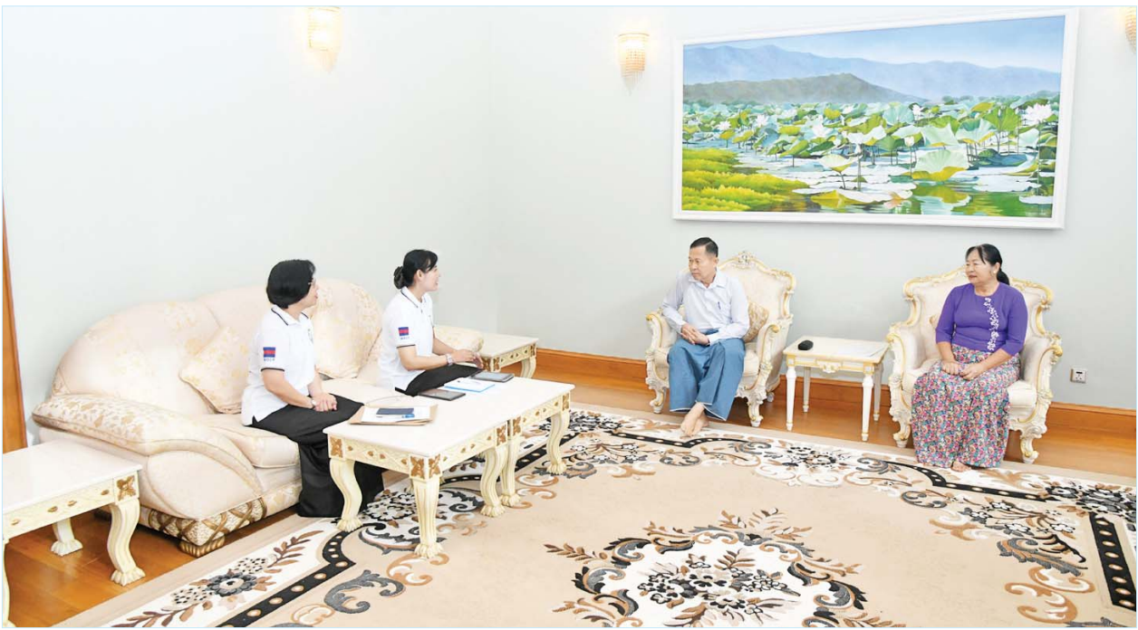
နိုင်ငံတော်စီမံအုပ်ချုပ်ရေးကောင်စီ ဒုတိယဥက္ကဋ္ဌ ဒုတိယဝန်ကြီးချုပ် ဒုတိယဗိုလ်ချုပ်မှူးကြီး စိုးဝင်း၏ မိသားစုက သန်းခေါင်စာရင်းကောက်ယူရေးအဖွဲ့၏ မေးခွန်းများကို ဖြေကြားစဉ်။

မေးမြန်း ကောက်ယူသွားမည်ဖြစ်ကြောင်း သိရှိရသည်။ တိုးမြှင့်မေးမြန်းထား ထပ်မံ တိုးမြှင့်ကောက်ခံမည့် အချက်အလက်များမှ ထင်ရှားသောဥပမာအနေဖြင့် ပညာရေးကဏ္ဍတွင် ကျောင်းဆက်လက်မတက်ရောက်ရသည့် အဓိကအကြောင်းရင်း၊ အိမ်အကြောင်းအရာကဏ္ဍတွင် အမှိုက်စွန့်ပစ်မှုစနစ်၊ သန့်ရှင်းမှုစနစ် စသည်ဖြင့် တိုးမြှင့် မေးမြန်းထားသည်ကို တွေ့ရှိရပြီး ယင်းအချက်များမှာ ပြည်သူလူထု၏ ပညာရေး၊ ကျန်းမာရေး၊ လူမှုရေးကဏ္ဍတို့တွင် အစိုးရမည်ကဲ့သို့ ဖြည့်ဆည်းပေးရမည်ကို သုံးသပ်သည့်မေးခွန်းများဖြစ်သဖြင့် လက်တွေ့အသုံးဝင်သည့် အချက်အလက်များပင်ဖြစ်ကြောင်း၊ စာရင်းကောက်ယူသူများက နံနက် ၇ နာရီမှ ညနေ ၆ နာရီအတွင်း နေအိမ်များသို့ လာရောက်စာရင်းကောက်ယူမည်ဖြစ်ပြီး နေအိမ်များသို့ စာရင်းလာကောက်မည့်နေ့ကို ကြိုတင်အကြောင်းကြားမည်ဖြစ်ကြောင်း၊ သန်းခေါင်စာရင်း ကောက်ယူခြင်းသည် အိမ်ထောင်စုစာရင်း ပုံစံ (၆၆/၆) သို့မဟုတ် ပုံစံ (၁၀) ရှိခြင်း/မရှိခြင်း၊ နိုင်ငံသားစိစစ်ရေးကတ်ပြားရှိခြင်း/မရှိခြင်းနှင့် မသက်ဆိုင်ကြောင်း၊ တိုင်းရင်းသားဖြစ်ခြင်း၊ မဖြစ်ခြင်း၊ နိုင်ငံသားဖြစ်ခြင်း၊ မဖြစ်ခြင်းနှင့် မသက်ဆိုင်ကြောင်း၊ သန်းခေါင်စာရင်း ထည့်သွင်းမကောက်ရမည့် သူများမှအပ သန်းခေါင်စာရင်း ရည်ညွှန်းချိန်