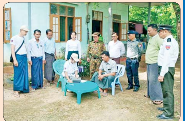
အုတ်ဖိုမြို့နယ်