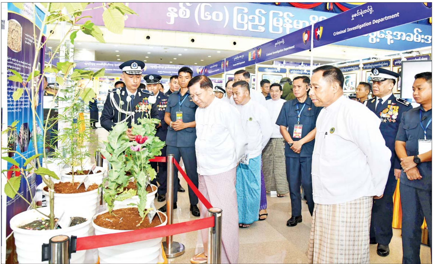
နိုင်ငံတော်စီမံအုပ်ချုပ်ရေးကောင်စီဥက္ကဋ္ဌ နိုင်ငံတော်ဝန်ကြီးချုပ် ဗိုလ်ချုပ်မှူးကြီး မင်းအောင်လှိုင် နှစ်(၆၀) ပြည့် မြန်မာနိုင်ငံရဲတပ်ဖွဲ့နေ့အခမ်းအနားတွင် ခင်းကျင်းပြသထားသည့် ပြခန်းများကို လှည့်လည်ကြည့်ရှုစဉ်။

ယနေ့ အပြည်ပြည်ဆိုင်ရာ သက်ကြီးပုဂ္ဂိုလ်များနေ့ ဖတ်စရာ ဂုဏ်ပြုအခမ်းအနားကျင်းပ