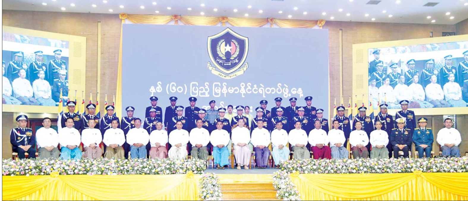
နိုင်ငံတော်စီမံအုပ်ချုပ်ရေးကောင်စီဥက္ကဋ္ဌ နိုင်ငံတော်ဝန်ကြီးချုပ် ဗိုလ်ချုပ်မှူးကြီး မင်းအောင်လှိုင် အခမ်းအနားတက်ရောက်လာကြသူများနှင့်အတူ စုပေါင်းမှတ်တမ်းတင်ဓာတ်ပုံရိုက်စဉ်။

လှည့်လည်ကြည့်ရှု ယင်းနောက် နှစ်(၆၀)ပြည့် မြန်မာနိုင်ငံရဲတပ်ဖွဲ့နေ့ အထိမ်းအမှတ် ခင်းကျင်းပြုသထားသည့် မှတ်တမ်းဓာတ်ပုံများ၊ ရုပ်လုံးရုပ်ကြွများ၊ တပ်ဖွဲ့/ဌာနများတွင် အသုံးပြုလျက်ရှိသည့် စက်ကိရိယာများ၊ နည်းပညာဆိုင်ရာပစ္စည်းများ၊ လက်နက်များ၊ ဝတ်စုံများ၊ ဆက်သွယ်ရေးပစ္စည်းများ၊ မူးယစ်ဆေးဝါး ရှာဖွေစစ်ဆေးရေးစက်များနှင့် ပြခန်းများအတွင်း စိတ်ပါဝင်စားစွာဖြင့် လှည့်လည်ကြည့်ရှုခဲ့ကြောင်း သိရသည်။ သတင်းစဉ်