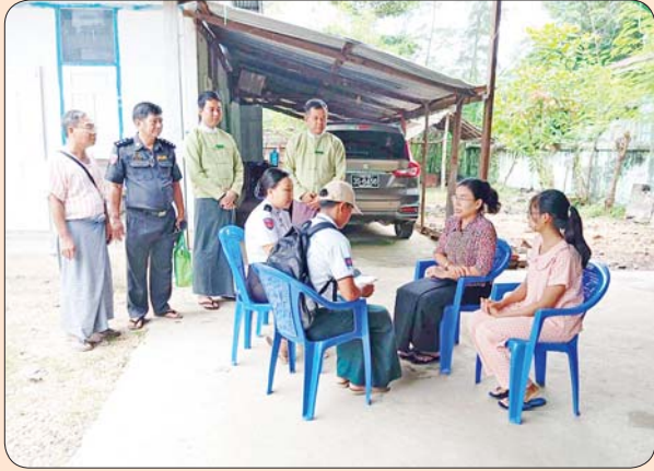
နတ်တလင်းမြို့နယ်