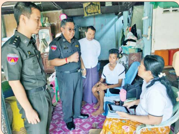
ကော့သောင်းမြို့နယ်