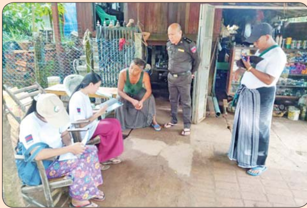
ဘီးလင်းမြို့နယ်