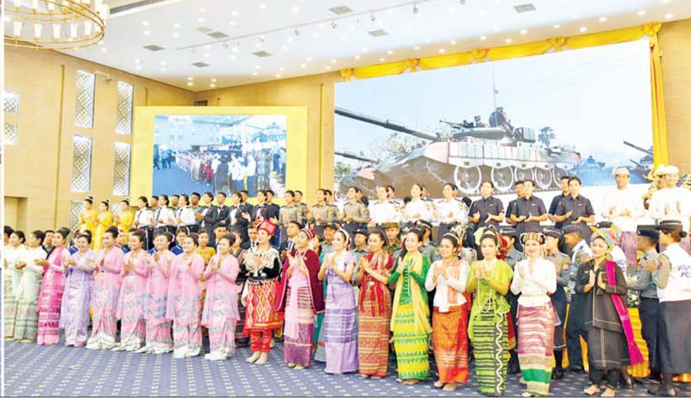
နှစ်(၆၀)ပြည့် မြန်မာနိုင်ငံရဲတပ်ဖွဲ့နေ့အထိမ်းအမှတ် ဂုဏ်ပြုညစာစားပွဲအခမ်းအနား ကျင်းပစဉ်။

နိုင်ငံ့ဝန်ထမ်းများအား မည်သည့်နည်းလမ်းဖြင့်မဆို ခြိမ်းခြောက်ခြင်း၊ တာဝန်ထမ်းဆောင်မှုအား နှောင့်ယှက်ခြင်းများ ဆောင်ရွက်ပါက တည်ဆဲဥပဒေများနှင့်အညီ အရေးယူခံရနိုင်ပါသည်။