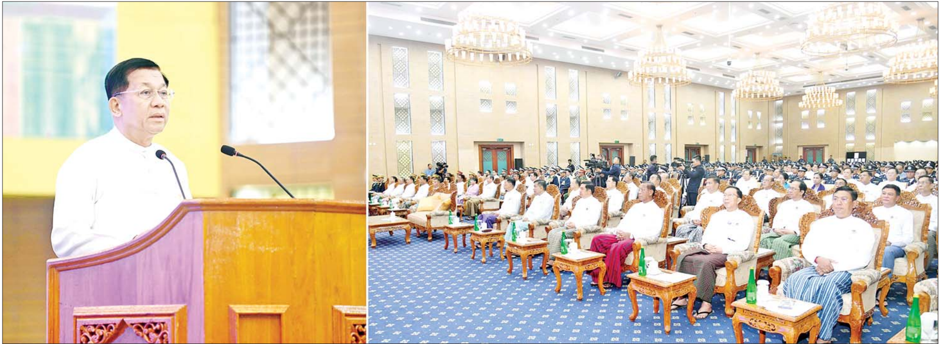
နိုင်ငံတော်စီမံအုပ်ချုပ်ရေးကောင်စီဥက္ကဋ္ဌ နိုင်ငံတော်ဝန်ကြီးချုပ် ဗိုလ်ချုပ်မှူးကြီး မင်းအောင်လှိုင် နှစ်(၆၀) ပြည့် မြန်မာနိုင်ငံရဲတပ်ဖွဲ့နေ့အခမ်းအနားတွင် မိန့်ခွန်းပြောကြားစဉ်။

» ရှေ့ဖို့မှ ဦးစွာ နိုင်ငံတော်စီမံအုပ်ချုပ်ရေးကောင်စီဥက္ကဋ္ဌ နိုင်ငံတော်ဝန်ကြီးချုပ်နှင့် အခမ်းအနားသို့ တက်ရောက် လာကြသူများက ပြည်ထောင်စုသမ္မတမြန်မာနိုင်ငံတော်အလံကို အလေးပြုကြပြီး တာဝန်ထမ်းဆောင်ရင်း ကျဆုံးခဲ့ကြသော ရဲတပ်ဖွဲ့ဝင်များအား အမှတ်ရ ဂုဏ်ပြုသောအားဖြင့် တစ်မိနစ်ငြိမ်သက်ကြသည်။ ထို့နောက် နိုင်ငံတော်စီမံအုပ်ချုပ်ရေးကောင်စီဥက္ကဋ္ဌ နိုင်ငံတော်ဝန်ကြီးချုပ် ဗိုလ်ချုပ်မှူးကြီး မင်းအောင်လှိုင်က မိန့်ခွန်းပြောကြားရာတွင် လွတ်လပ်ရေးရပြီး သည့်နောက်ပိုင်းတွင် မြန်မာနိုင်ငံရဲတပ်ဖွဲ့ကို ပြုပြင်ပြောင်းလဲမှုများ ပြုလုပ်ခဲ့ကြကြောင်း၊ တော်လှန်ရေးကောင်စီခေတ် ၁၉၆၄ ခုနှစ် အောက်တိုဘာလ ၁ ရက်နေ့တွင် “ပြည်သူ့ရဲတပ်ဖွဲ့” ဟု ခေါ်ဝေါ်သတ်မှတ်ခဲ့ပြီး ရဲတပ်ဖွဲ့နေ့အဖြစ်လည်း စတင်သတ်မှတ်ခဲ့ကြောင်း၊ ၁၉၉၅ ခုနှစ် အောက်တိုဘာလ ၁ ရက်နေ့တွင် ပြည်သူ့ရဲတပ်ဖွဲ့မှ “မြန်မာနိုင်ငံရဲတပ်ဖွဲ့” ဟုပြင်ဆင်သတ်မှတ်ခဲ့ကြောင်း၊ ယခုအခါ နှစ်(၆၀) ပြည့် မြန်မာနိုင်ငံ ရဲတပ်ဖွဲ့နေ့သို့ ရောက်ရှိခဲ့ပြီဖြစ်ကြောင်း၊ ဒို့တာဝန် အရေး(၃)ပါးကို ဦးထိပ်ပန်ဆင်ပြီး နိုင်ငံတော်စီမံအုပ်ချုပ်ရေးကောင်စီ ရှေ့လှုပ်နှံစဉ် (၅)ရပ်နှင့် ဦးတည်ချက်(၉)ရပ်အောင်မြင်စေရေး၊ ပြည်သူလူထု၏ လူမှုစီးပွားဘဝလုံခြုံရေးအတွက် ပြည်ထောင်စုတစ်ဝန်းလုံး တည်ငြိမ်အေးချမ်းရေးနှင့် တရားဥပဒေစိုးမိုးရေး အပြည့်အဝရရှိစေရေးတို့ကို အလေးထားဆက်လက်ဆောင်ရွက်သွားကြရမည် ဖြစ်ကြောင်း၊ မြန်မာနိုင်ငံရဲတပ်ဖွဲ့သည် တပ်မတော်နှင့်အတူ အကြမ်းဖက်မှုချေမှုန်းရေးကိုလည်း ပြည်သူနှင့်အတူလက်တွဲပြီး ဆောင်ရွက်ရန် အလေးထား မှာကြားလိုကြောင်း၊ ထို့ပြင် ပြည်တွင်းလုံခြုံရေးနှင့် ရပ်ရွာအေးချမ်း သာယာရေး၊