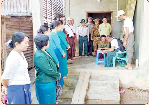
မိုးညိုမြို့နယ်