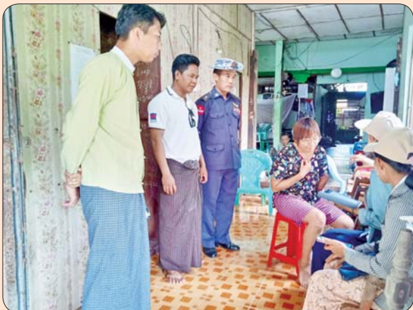
အိမ်မဲမြို့နယ်