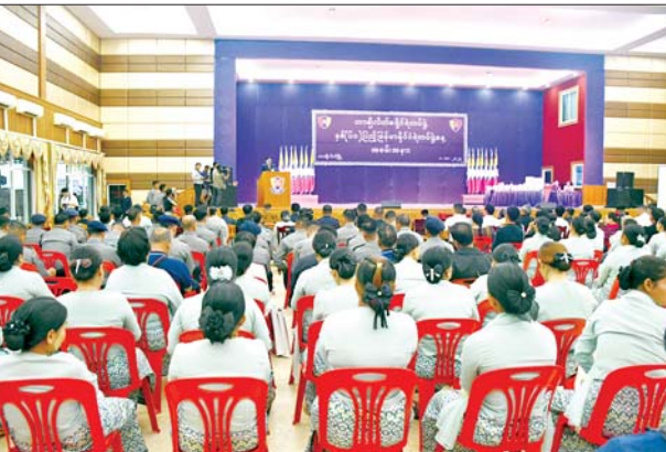
ပြောကြားသည်။ ချီးမြှင့်ပေးအပ် ဆက်လက်၍ မှုခင်းများကို စွမ်းစွမ်းတမံ ဖော်ထုတ်ခဲ့သည့် ရဲတပ်ဖွဲ့ဝင်များနှင့် ရုံးလုပ်ငန်း တာဝန်များကို ကျေပွန်စွာ ဆောင်ရွက်ခဲ့သည့် ရဲတပ်ဖွဲ့ဝင်

တာချီလိတ် အောက်တိုဘာ ၁ နှစ်(၆၀)ပြည့် မြန်မာနိုင်ငံရဲ တပ်ဖွဲ့နေ့အခမ်းအနားကို ရှမ်း ပြည်နယ်(အရှေ့ပိုင်း) တာချီလိတ် မြို့ ရန်အောင်မြေရပ်ကွက်တက္ကသိုလ် ခန်းမတွင် ယနေ့ နံနက် ၉ နာရီခွဲ က ကျင်းပရာ အခမ်းအနားတွင် ခရိုင်စီမံအုပ်ချုပ်ရေးအဖွဲ့ ဥက္ကဋ္ဌ ဦးမင်းကိုက အမှာစကားပြော ကြားပြီး ပြည်ထဲရေးဝန်ကြီးဌာန ဒုတိယဝန်ကြီး၊ မြန်မာနိုင်ငံရဲတပ် ဖွဲ့ ရဲချုပ် ဒုတိယရဲဗိုလ်ချုပ်ကြီး ဝင်းဇော်မိုးထံမှ ပေးပို့သည့် သဝဏ်လွှာကို ခရိုင်ရဲတပ်ဖွဲ့မှူး ဒုတိယရဲမှူးကြီး ချမ်းမြေ့ဝင်းက ဖတ်ကြားကာ ဝမ်းပုံရေကြောင်း ရဲတပ်ဖွဲ့မှူး ရဲမှူးကြီး အောင်ဇော်မိုး က ဂုဏ်ပြုကျေးဇူးတင်စကား