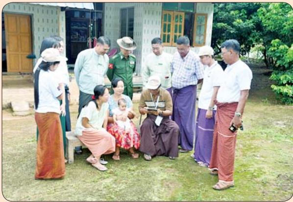
သထုံမြို့နယ်