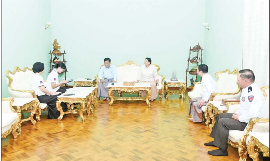
နိုင်ငံတော်စီမံအုပ်ချုပ်ရေးကောင်စီအဖွဲ့ဝင် ဗိုလ်ချုပ်ကြီး မောင်မောင်အေး၏ မိသားစုက သန်းခေါင်စာရင်း ကောက်ယူရေးအဖွဲ့၏ မေးခွန်းများကို ဖြေကြားစဉ်။