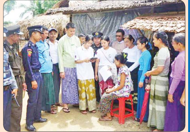
ပုလောမြို့နယ်