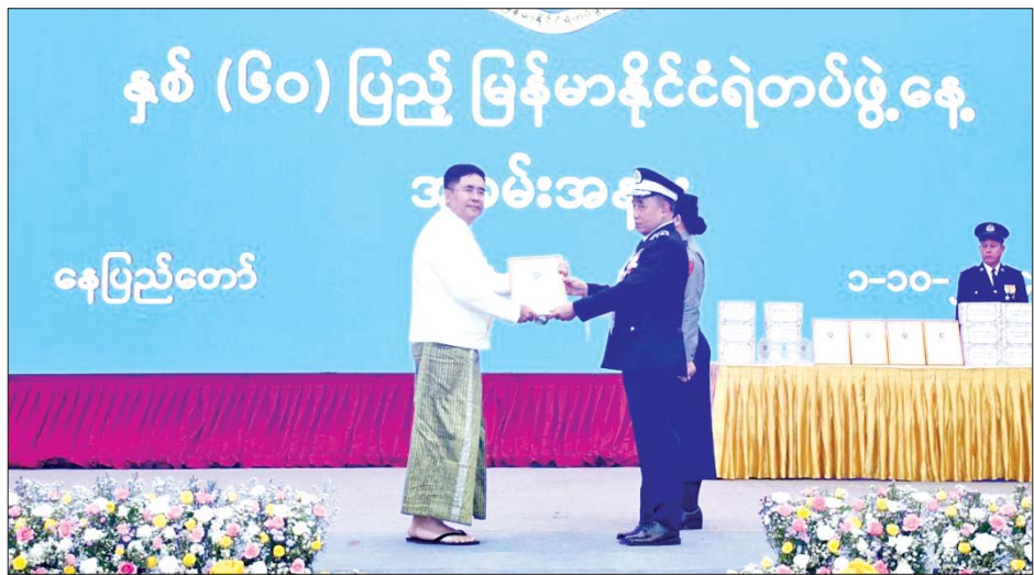
မူအတွက် ရာထူးအဆင့်တိုးဆုရရှိသူ အရာရှိ နှစ်ဦး အနုပညာရှင်ကိုယ်စားလှယ်တစ်ဦးအား ဂုဏ်ပြု မှတ်တမ်းလွှာပေးအပ်ခဲ့သည်။

နေပြည်တော် အောက်တိုဘာ ၁ နှစ်(၆၀)ပြည့် မြန်မာနိုင်ငံရဲတပ်ဖွဲ့နေ့အခမ်းအနားကို ယနေ့နံနက်ပိုင်းတွင် နေပြည်တော်ရှိ မြန်မာ အပြည်ပြည်ဆိုင်ရာကွန်ဗင်းရှင်းဗဟိုဌာန-၂ (MICC-2) ၌ ကျင်းပခဲ့ရာ ပြည်ထဲရေးဝန်ကြီးဌာန မြန်မာနိုင်ငံ ရဲတပ်ဖွဲ့ ရဲချုပ် ဒုတိယရဲဗိုလ်ချုပ်ကြီး ဝင်းဇော်မိုး တက်ရောက် မိန့်ခွန်းပြောကြားခဲ့သည်။