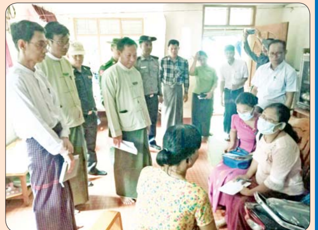
ကျိုက်ထိုမြို့နယ်