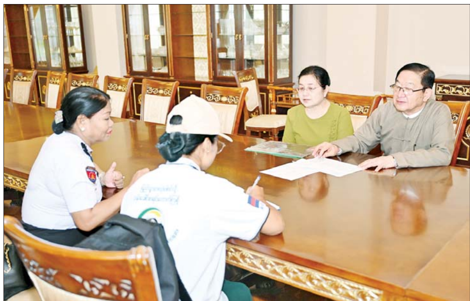
ပြည်သူ့လွှတ်တော်ဥက္ကဋ္ဌ ဦးတီခွန်မြတ်၏မိသားစုက သန်းခေါင်စာရင်းကောက်ယူရေးအဖွဲ့၏ မေးခွန်းများကို ဖြေကြားစဉ်။

ယခု ၂၀၂၄ ခုနှစ်၊ လူဦးရေနှင့် အိမ်အကြောင်းအရာ သန်းခေါင် စာရင်းကောက်ယူခြင်းကို မြန်မာ နိုင်ငံ၏ တိကျမှန်ကန်သည့် စာမျက်နှာ ၇ သို့ *