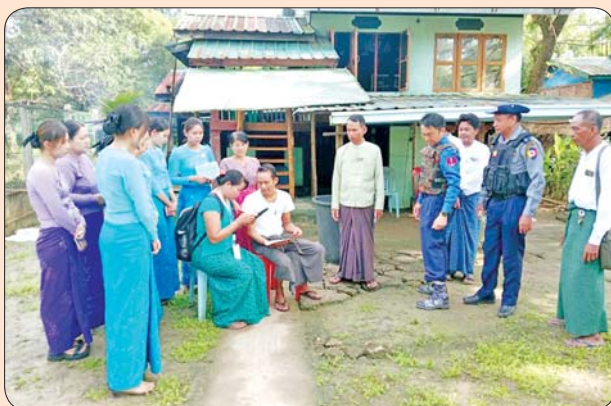
သုံးခွမြို့နယ်