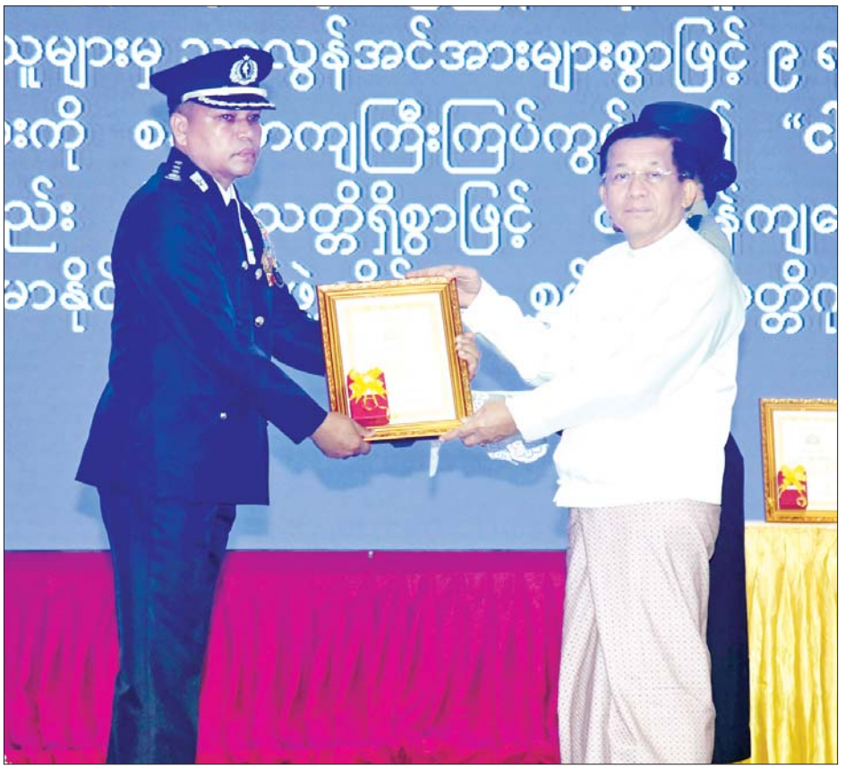
နိုင်ငံတော်စီမံအုပ်ချုပ်ရေးကောင်စီဥက္ကဋ္ဌ နိုင်ငံတော်ဝန်ကြီးချုပ် ဗိုလ်ချုပ်မှူးကြီး မင်းအောင်လှိုင် စွမ်းရည်သတ္တိဂုဏ်ထူးဆောင်တံဆိပ် ရရှိသူတစ်ဦးအား ဆုပေးအပ်ချီးမြှင့်စဉ်။

အိမ်နီးချင်းငါးနိုင်ငံနှင့်အတူ နယ်စပ်ဆက်ဆံရေးရုံးများ (Border Liaison Offices-BLOs) ကွန်ရက်စနစ်တည်ထောင်ပြီး သတင်းအချက်အလက်များကို အချိန်နဲ့တစ်ပြေးညီ အပြန်အလှန် မျှဝေဖလှယ်နိုင်ရေးအတွက် BLO အစည်းအဝေးများကိုလည်း အခါအားလျော်စွာ စဉ်ဆက်မပြတ် ကျင်းပပြုလုပ်ဆောင်ရွက်သွားကြရန် မှာကြားလိုကြောင်း။ ၂၀၂၃ ခုနှစ် အောက်တိုဘာလ ၂၀၂၄ ခုနှစ် ဩဂုတ်လအထိ မြန်မာနိုင်ငံအတွင်းသို့ နိုင်ငံပေါင်း ၂၈ နိုင်ငံမှ တရားမဝင် ဝင်ရောက်လာသည့် နိုင်ငံခြားသား ၅၄၄၃၃ ဦးတို့ကိုလည်း လုပ်ထုံးလုပ်နည်းနှင့်အညီ ပြည်နှင့်ဆောင်ရွက်ခဲ့ပြီး ဖြစ်ကြောင်း။ မြန်မာနိုင်ငံအနေဖြင့် မူးယစ်ဆေးဝါးအန္တရာယ် တားဆီးနှိမ်နင်းရေးအတွက် နိုင်ငံတကာအဖွဲ့အစည်းများနှင့်လည်း အနီးကပ်ပူးပေါင်း ဆောင်ရွက်လျက်ရှိကြောင်း၊ စာမျက်နှာ ၄ သို့ »