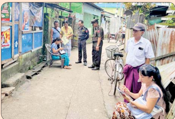
အင်းစိန်မြို့နယ်