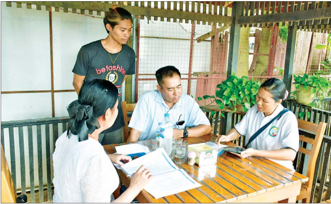
နေပြည်တော်ကောင်စီနယ်မြေအတွင်း လူဦးရေနှင့် အိမ်အကြောင်းအရာ သန်းခေါင်စာရင်း ကောက်ယူစဉ်။