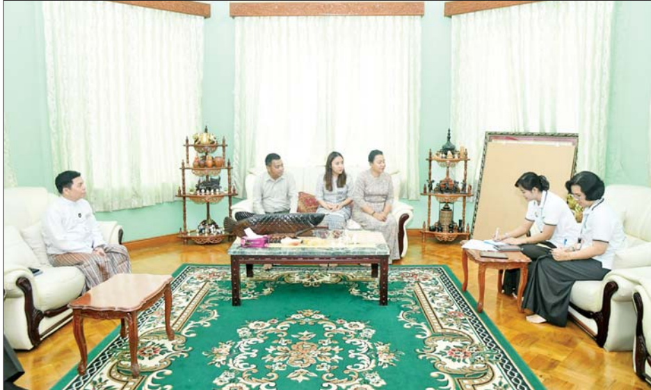
နိုင်ငံတော်စီမံအုပ်ချုပ်ရေးကောင်စီ တွဲဖက်အတွင်းရေးမှူး ဗိုလ်ချုပ်ကြီး ရဲဝင်းဦး၏ မိသားစုက သန်းခေါင်စာရင်းကောက်ယူရေးအဖွဲ့၏ မေးခွန်းများကို ဖြေကြားစဉ်။

* စာရင်းကောက်ယူသူများက နံနက် ၇ နာရီမှ ညနေ ၆ နာရီအတွင်း နေအိမ်များသို့ လာရောက်စာရင်းကောက်ယူမည်ဖြစ်ပြီး နေအိမ်များသို့ စာရင်းလာကောက်မည့်နေ့ကို ကြိုတင်အကြောင်းကြားမည် * သန်းခေါင်စာရင်းကောက်ယူခြင်းသည် အိမ်ထောင်စုစာရင်းပုံစံ (၆၆/၆) သို့မဟုတ် ပုံစံ (၁၀) ရှိခြင်း/မရှိခြင်း၊ နိုင်ငံသားစိစစ်ရေးကတ်ပြားရှိခြင်း/မရှိခြင်းနှင့် မသက်ဆိုင်ကြောင်း၊ တိုင်းရင်းသားဖြစ်ခြင်း၊ မဖြစ်ခြင်း၊ နိုင်ငံသားဖြစ်ခြင်း၊ မဖြစ်ခြင်းနှင့်မသက်ဆိုင်ကြောင်း၊ သန်းခေါင်စာရင်းထည့်သွင်းမကောက်ရမည့် သူများမှ အပ သန်းခေါင်စာရင်းရည်ညွှန်းချိန်တွင် မြန်မာနိုင်ငံနယ်နိမိတ်အတွင်းရှိနေသူ အားလုံးကို စာရင်းကောက်ယူမည်