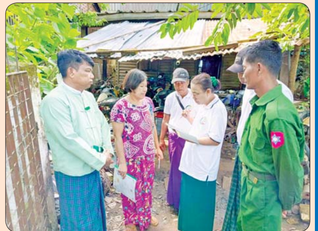
မင်းလှမြို့နယ်