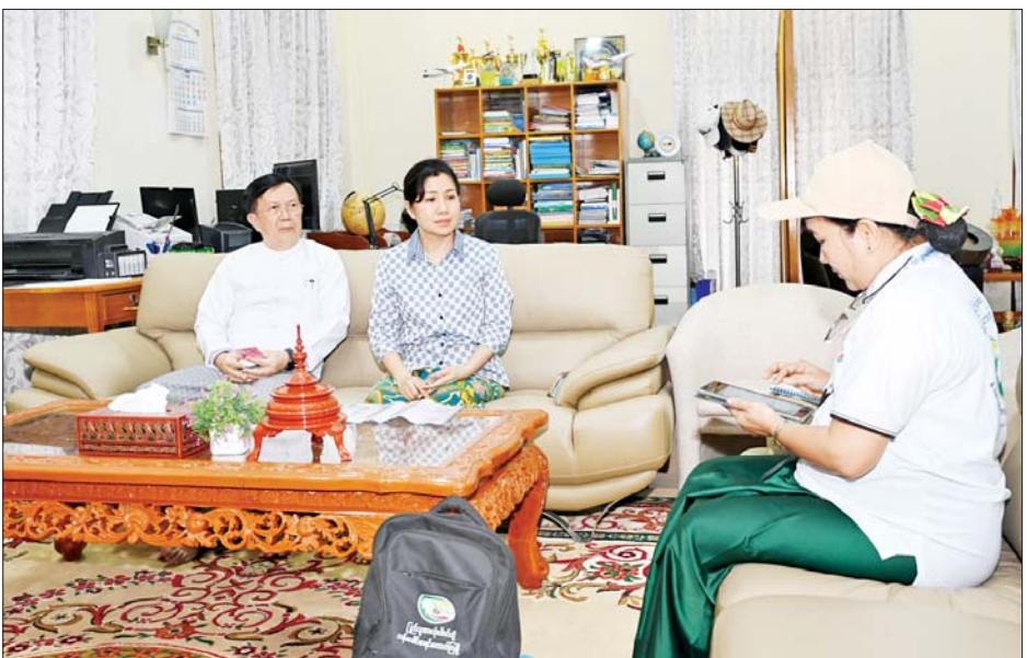
နိုင်ငံတော်စီမံအုပ်ချုပ်ရေးကောင်စီ အတွင်းရေးမှူး ဗိုလ်ချုပ်ကြီးအောင်လင်းခွေး၏မိသားစုက သန်းခေါင်စာရင်းကောက်ယူရေးအဖွဲ့၏ မေးခွန်းများကို ဖြေကြားစဉ်။