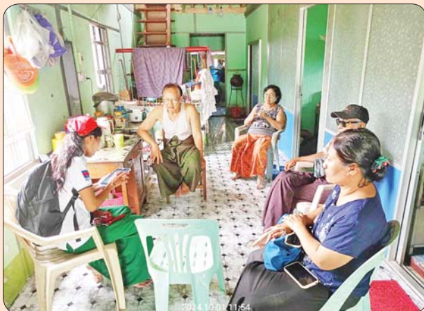
ပြည်မြို့နယ်