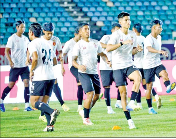
မြန်မာအသင်း အားကစားသမားများ လေ့ကျင့်နေစဉ်။