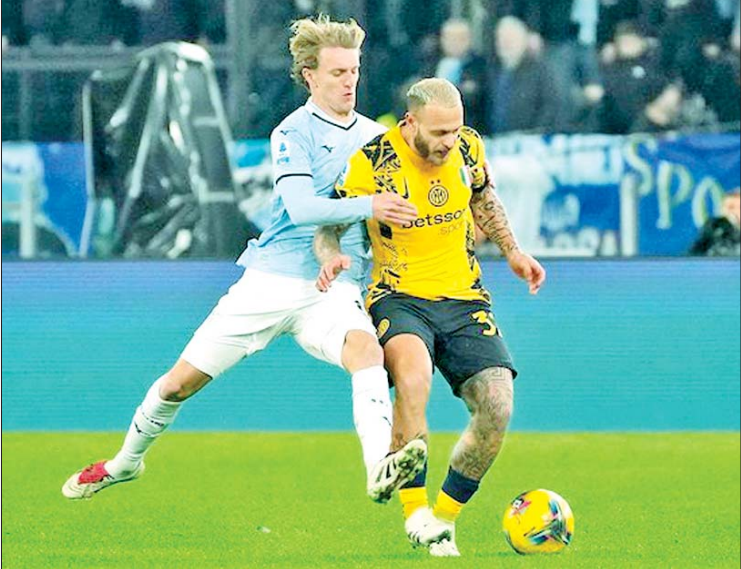
လာဇီယိုအသင်းနှင့် အင်တာမီလန်အသင်းတို့ ယှဉ်ပြိုင်ကစားကြစဉ်။

လာဇီယိုအသင်းနဲ့ အင်တာမီလန်အသင်းတို့ ဒီဇင်ဘာ ၁၆ ရက်ညပိုင်းက ယှဉ်ပြိုင်ကစားခဲ့တဲ့ အီတလီစီးရီးအေ ပွဲစဉ်မှာ အဝေးကွင်း လာရောက်ကစားခဲ့ရတဲ့ အင်တာမီလန်အသင်းက ခြောက်ဂိုးပြတ်နဲ့ အနိုင်ရခဲ့ပြီး အမှတ်ပေးဇယားအဆင့် ၃ နေရာကို တက်လှမ်းခဲ့ပါတယ်။ အဲဒီပွဲစဉ်မှာ အင်တာမီလန်အသင်းအတွက် သွင်းဂိုးတွေကို ကယ်ဟာနိုလူ၊ ဒီမာကို၊ ဘာရယ်လာ၊ ဒမ်ဖရီး၊ အောဂတ်စတို၊ တူရမ်တို့က တစ်ဂိုးစီသွင်းယူပေးခဲ့တာဖြစ်ပါတယ်။ လာဇီယိုအသင်းဟာ အင်တာမီလန်အသင်းကို အိမ်ကွင်းမှာ ခြောက်ဂိုးပြတ် ရှုံးနိမ့်ခဲ့တာကြောင့် လာဇီယိုအသင်းဟာ ၁၉၅၉ ခုနှစ် နောက်ပိုင်း ငါးဂိုးနဲ့အထက် ဂိုးပြတ်ရှုံးပွဲ စာမျက်နှာ ၂၁ ကော်လံ ၁ သို့ ❖