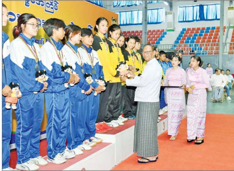
အဂတိလိုက်စားမှုတိုက်ဖျက်ရေးကော်မရှင်ဥက္ကဋ္ဌ ဦးစစ်အေး ပြည်နယ်နှင့် တိုင်းဒေသကြီးအဆင့် အမျိုးသမီးစားပွဲတင်တင်းနစ်ပြိုင်ပွဲတွင် ပထမဆုရရှိသည့် မွန်ပြည်နယ်အသင်းမှ ပြိုင်ပွဲဝင်များအား ဆုပေးအပ်ချီးမြှင့်စဉ်။

သည့် မွန်ပြည်နယ်နှင့် ကရင်ပြည်နယ်အသင်းတို့မှ ပြိုင်ပွဲဝင်များအားလည်းကောင်း၊ ရန်ကုန်တိုင်းဒေသကြီး လူမှုရေးရာဝန်ကြီးဦးဌေးအောင်က ဒုတိယဆုရရှိသည့် မန္တလေးတိုင်းဒေသကြီးအသင်းမှ ပြိုင်ပွဲဝင်များအားလည်းကောင်း၊ ပြည်ထောင်စုရာထူးဝန်အဖွဲ့ဥက္ကဋ္ဌ ဦးအောင်သော်က ပထမဆုရရှိသည့် ရန်ကုန်တိုင်းဒေသကြီးအသင်းမှ ပြိုင်ပွဲဝင်များအားလည်းကောင်း တစ်ဦးချင်း ဂုဏ်ပြုဆုတံဆိပ်နှင့် အမျိုးသားအားကစားပွဲတော်အထိမ်းအမှတ်အရပ်များကို ပေးအပ်ချီးမြှင့်ကြသည်။