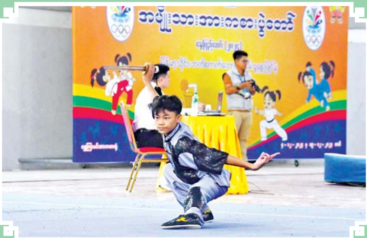
ပြည်နယ်နှင့် တိုင်းဒေသကြီး အမျိုးသား ဂူရှူး-ထောက်လှပြိုင်ပွဲတွင် ပြိုင်ပွဲဝင် တစ်ဦး ယှဉ်ပြိုင်နေမှုကို တွေ့ရစဉ်။