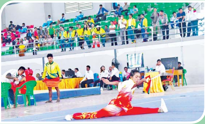
ပြည်နယ်နှင့် တိုင်းဒေသကြီး အမျိုးသမီး ဂူရှူး-ထောက်လှပြိုင်ပွဲတွင် ပြိုင်ပွဲဝင် တစ်ဦးယှဉ်ပြိုင်စဉ်။