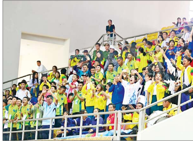
၂၀၂၄ ခုနှစ် ပဉ္စမအကြိမ် အမျိုးသားအားကစားပွဲတော် ပြည်နယ်နှင့် တိုင်းဒေသကြီးအဆင့်ပြိုင်ပွဲများတွင် လာရောက်ကြည့်ရှုအားပေးကြသူများအား တွေ့ရစဉ်။

၂၀၂၄ ခုနှစ် ပဉ္စမအကြိမ် အမျိုးသား အားကစားပွဲတော် ပြည်နယ်နှင့် တိုင်းဒေသကြီးအဆင့် အမျိုးသား ၂၁ နှစ်အောက် ဘောလုံးပြိုင်ပွဲ၊ ဂူရူးပြိုင်ပွဲ၊ ကရာတေးပြိုင်ပွဲ၊ ရိုးရာခြင်းလုံးပြိုင်ပွဲနှင့် ဘီလီယက်/စနူကာပြိုင်ပွဲ ဗိုလ်လုပွဲနှင့် ဆုချီးမြှင့်ပွဲအခမ်းအနားများကို ဒီဇင်ဘာ ၁၈ ရက်တွင် သက်ဆိုင်ရာ အားကစားရုံများနှင့် အားကစားကွင်းများ၌ ဆက်လက် ကျင်းပသွားမည်ဖြစ်ကြောင်း သိရသည်။ သတင်းစဉ်