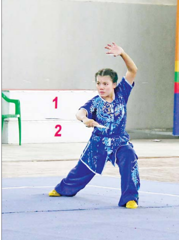
ပြည်နယ်နှင့်တိုင်းဒေသကြီး ဝူရှူးပြိုင်ပွဲတွင် ကချင်ပြည်နယ်မှ ပြိုင်ပွဲဝင်တစ်ဦး ယှဉ်ပြိုင်စဉ်။