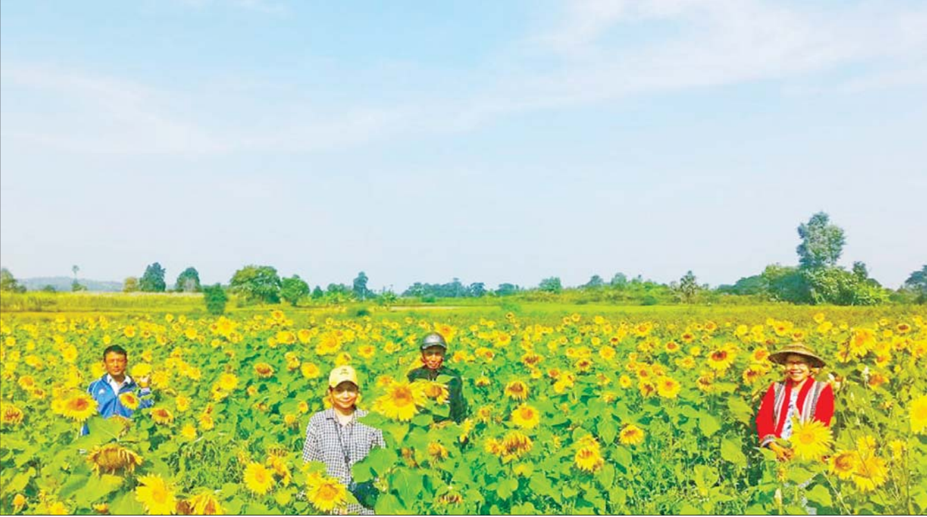
ပေါက်ခေါင်းမြို့နယ်၌ ဖြစ်ထွန်းအောင်မြင်လျက်ရှိသော နေကြာစိုက်ခင်းများကို တွေ့ရစဉ်။

ပေါက်ခေါင်း ဒီဇင်ဘာ ၁၇ ပဲခူးတိုင်းဒေသကြီး ပေါက်ခေါင်းမြို့နယ်၌ ၂၀၂၄-၂၀၂၅ ဘဏ္ဍာနှစ်အတွင်း စိုက်ပျိုးထားသော ဝါသီးနှံနှင့် နေကြာများ အောင်မြင်ဖြစ်ထွန်းလျက်ရှိကြောင်း သိရသည်။ စာမျက်နှာ ၃ ကော်လံ ၁ သို့ ☆