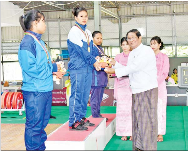
ပြည်ထောင်စုဝန်ကြီး ဦးညွှန်ထွန်း ပြည်နယ်နှင့် တိုင်းဒေသကြီးအဆင့်အမျိုးသမီး ၆၄ ကီလိုတန်း အလေးမပြိုင်ပွဲတွင် ပထမဆုရရှိသည့် စစ်ကိုင်းတိုင်းဒေသကြီးအသင်းမှ ပြိုင်ပွဲဝင်များအား ဆုပေးအပ်ချီးမြှင့်စဉ်။

ဆက်လက်၍ ပြည်ထောင်စုဝန်ကြီး ဦးတင်ဦးလွင်က အမျိုးသား ၈၉ ကီလိုတန်း အလေးမပြိုင်ပွဲတွင် ပထမဆုရရှိသည့် စစ်ကိုင်းတိုင်းဒေသကြီး၊ ဒုတိယဆုရရှိသည့် ဧရာဝတီတိုင်းဒေသကြီးနှင့် တတိယဆုရရှိသည့် မကွေးတိုင်းဒေသကြီးတို့မှ ပြိုင်ပွဲဝင်များအား လည်းကောင်း၊ အမျိုးသား ၉၆ ကီလိုတန်း အလေးမပြိုင်ပွဲတွင် ပထမဆုရရှိသည့် မကွေးတိုင်းဒေသကြီး၊ ဒုတိယဆုရရှိသည့် ကချင်ပြည်နယ်နှင့် တတိယဆုရရှိသည့် ဧရာဝတီတိုင်းဒေသကြီးတို့မှ ပြိုင်ပွဲဝင်များအားလည်းကောင်း၊ ဂုဏ်ပြုဆုတံဆိပ်နှင့် အမျိုးသား အားကစားပွဲတော်အထိမ်းအမှတ် အရပ်များကို ပေးအပ်ချီးမြှင့်ကြသည်။