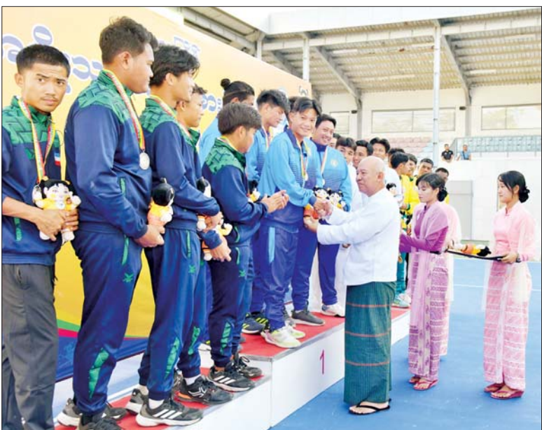
နိုင်ငံတော် ဖွဲ့စည်းပုံအခြေခံဥပဒေဆိုင်ရာခုံရုံးဥက္ကဋ္ဌ ဦးအောင်ဇော်သိန်း ပြည်နယ် နှင့် တိုင်းဒေသကြီးအဆင့် အမျိုးသားအသင်းလိုက် တင်းနစ်ပြိုင်ပွဲတွင် ပထမဆုရရှိသည့် ပဲခူးတိုင်းဒေသကြီးအသင်းမှ ပြိုင်ပွဲဝင်များအား ဆုချီးမြှင့်စဉ်။

ဦးစွာ ၂၀၂၄ ခုနှစ် ပဉ္စမအကြိမ် အမျိုးသား အားကစားပွဲတော် ပြည်နယ်နှင့် တိုင်းဒေသကြီးအဆင့် အမျိုးသား အမျိုးသမီး အသက် ၃၅ နှစ်အောက် တင်းနစ်ပြိုင်ပွဲ ဗိုလ်လုပွဲ ပွဲစဉ်များကို မွန်းလွဲပိုင်း တွင် နေပြည်တော်ရှိ ဝဏ္ဏသိဒ္ဓိ အားကစားကွင်း တင်းနစ် အားကစားပြိုင်ပွဲရုံ၌ ကျင်းပရာ နိုင်ငံတော် ဖွဲ့စည်းပုံအခြေခံဥပဒေ ဆိုင်ရာခုံရုံးဥက္ကဋ္ဌ ဦးအောင်ဇော်သိန်း ပြည်နယ် နှင့် တိုင်းဒေသကြီးအဆင့် အမျိုးသားအသင်းလိုက် တင်းနစ်ပြိုင်ပွဲတွင် ပထမဆုရရှိသည့် ပဲခူးတိုင်းဒေသကြီးအသင်းမှ ပြိုင်ပွဲဝင်များအား ဆုချီးမြှင့်စဉ်။