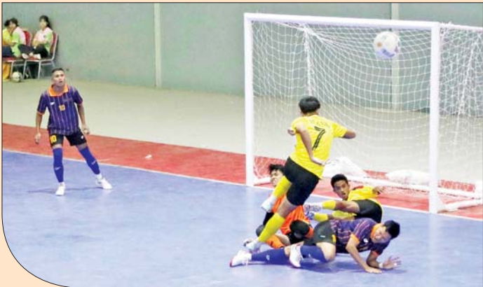
ဝန်ကြီးဌာနပေါင်းစုံ အမျိုးသားဖူဆယ်ပြိုင်ပွဲတွင် ပြည်ထဲရေးဝန်ကြီးဌာန အသင်းနှင့် စီမံကိန်းနှင့်ဘဏ္ဍာရေးဝန်ကြီးဌာနအသင်းတို့ ယှဉ်ပြိုင်ကစားကြစဉ်။