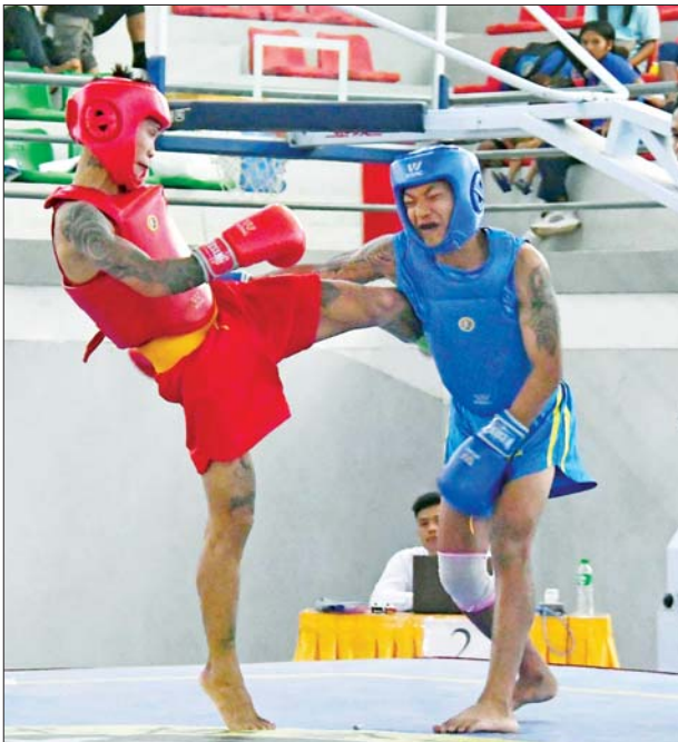
ပြည်နယ်နှင့် တိုင်းဒေသကြီး ဝဏ္ဏသိဒ္ဓိအားကစားကွင်း ရှမ်းပြည်နယ်နှင့် ရန်ကုန်တိုင်းဒေသကြီးတို့မှ ပြိုင်ပွဲဝင်အားကစားသမားများ ယှဉ်ပြိုင်ကစားကြစဉ်။

ယနေ့ကျင်းပသည့် အားကစားပြိုင်ပွဲများသို့ ပြည်ထောင်စုအဆင့် ပုဂ္ဂိုလ်များ၊ ဒုတိယဝန်ကြီးများ၊ တိုင်းဒေသကြီးနှင့် ပြည်နယ် ဝန်ကြီးများ၊ ဌာနဆိုင်ရာများ၊ အားကစားနည်းအလိုက် အဖွဲ့ချုပ်များမှ တာဝန်ရှိသူများ၊ ဝန်ထမ်းများ၊ ကျောင်းသား ကျောင်းသူများနှင့် အားကစားဝါသနာရှင် ပြည်သူများ စိတ်ပါဝင်စားစွာ လာရောက်ကြည့်ရှု အားပေးခဲ့ကြသည်။