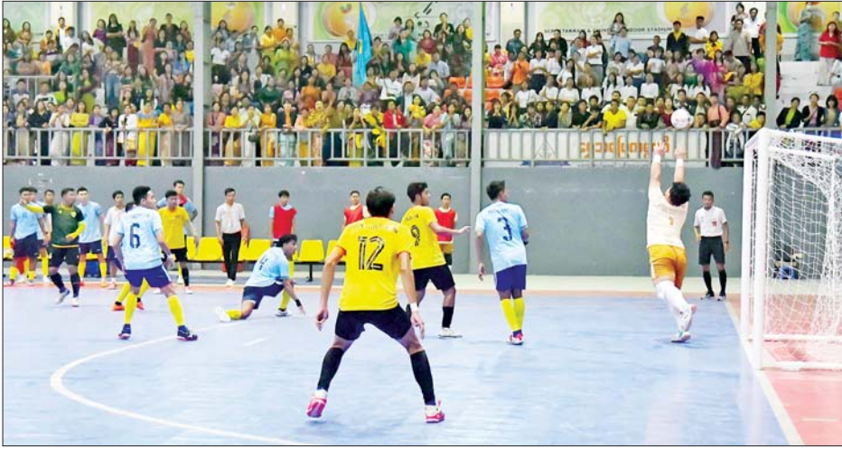
ဝန်ကြီးဌာနပေါင်းစုံ အမျိုးသား ဖူဆယ်ပြိုင်ပွဲတွင် ပို့ဆောင်ရေးနှင့်ဆက်သွယ်ရေးဝန်ကြီးဌာန အသင်းနှင့် ဆောက်လုပ်ရေးဝန်ကြီးဌာနအသင်းတို့ ယှဉ်ပြိုင်ကစားကြစဉ်။