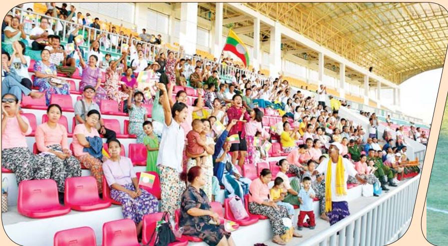
ပြည်နယ်နှင့် တိုင်းဒေသကြီး အသက် ၂၅ နှစ်အောက် အမျိုးသမီးဘောလုံးပြိုင်ပွဲ ဗိုလ်လုပွဲအဖြစ် ရှမ်းပြည်နယ်အသင်းနှင့် မန္တလေးတိုင်းဒေသကြီးအသင်းတို့ ယှဉ်ပြိုင်နေမှုကို ကြည့်ရှုအားပေးကြစဉ်။