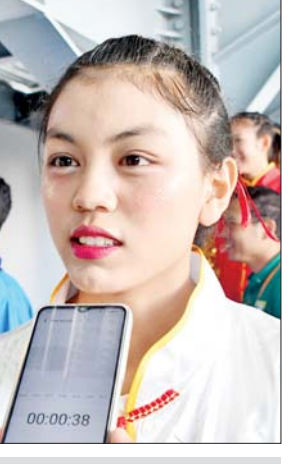
မန်းမောင်ထိပ်ထားအောင်

ကျေးဇူးတင်ပါတယ်။ ဘီလီယက် နဲ့ စနုကာအားကစားက လွယ်လွယ် လေးနဲ့ထိုးလို့မရဘူး။ သေချာစခန်း သွင်းလေ့ကျင့်ပြီးမှ ဆရာတွေ ကောင်းကောင်းနဲ့ လေ့ကျင့်မှ ပြိုင်ပွဲ ဝင်နိုင်တာပါ။ အဲဒါတောင် အချိန် အများကြီးပေးရတဲ့ အားကစား လည်းဖြစ်ပါတယ်။ ကျွန်တော် လည်း ဒီပြိုင်ပွဲဖို့ မြစ်ကြီးနားမှာ သုံးလလောက် အပြင်းအထန် လေ့ကျင့်ခဲ့ရတယ်။ အုပ်စုလည်း ချောင်လို့ ဒီအဆင့်ထိရောက်ခဲ့ တာပါ။ ရခိုင်၊ ပဲခူး စတဲ့အသင်း တွေနဲ့ ယှဉ်ပြိုင်ခဲ့ရတာဖြစ်ပါ တယ်။