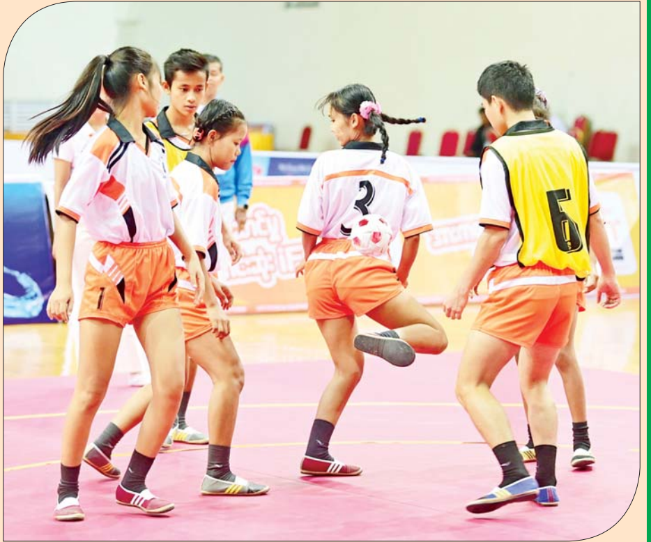
ပြည်နယ်နှင့် တိုင်းဒေသကြီး အမျိုးသမီးရိုးရာခြင်းလုံးခတ်ပြိုင်ပွဲတွင် မကွေးတိုင်းဒေသကြီးအသင်း မှ ပြိုင်ပွဲဝင်များ ယှဉ်ပြိုင်ကစားကြစဉ်။