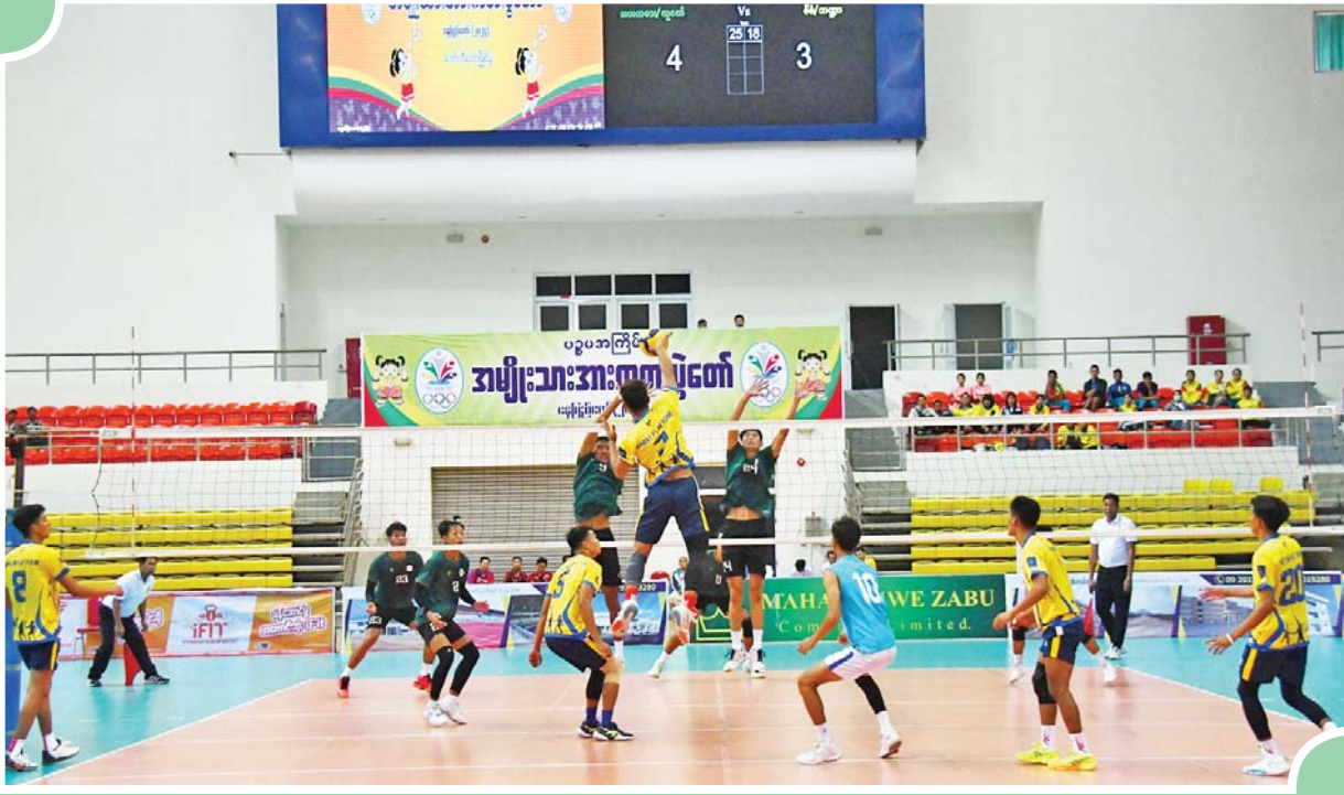
ဝန်ကြီးဌာနပေါင်းစုံ အမျိုးသား ဘော်လီဘောပြိုင်ပွဲတွင် အားကစားနှင့်လူငယ်ရေးရာဝန်ကြီးဌာနအသင်းနှင့် စီမံကိန်းနှင့် ဘဏ္ဍာရေး ဝန်ကြီးဌာနအသင်းတို့ ယှဉ်ပြိုင်ကစားကြစဉ်။