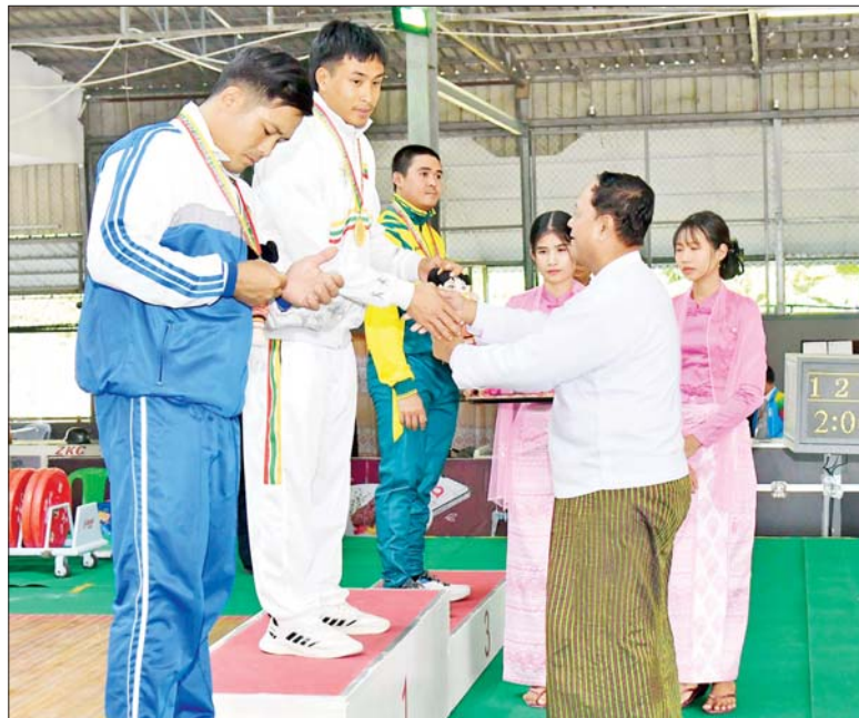
ပြည်ထောင်စုဝန်ကြီး ဦးလှမိုး ပြည်နယ်နှင့် တိုင်းဒေသကြီးအဆင့် အမျိုးသား ရာဇကီလိုတန်း အလေးမပြိုင်ပွဲတွင် ပထမဆုရရှိသည့် ရှမ်းပြည်နယ်မှ ပြိုင်ပွဲဝင်အား ဆုချီးမြှင့်စဉ်။

ထို့နောက် ဆုချီးမြှင့်ပွဲအခမ်း အနားကို ဆက်လက်ကျင်းပရာ ပြည်ထောင်စု စာရင်းစစ်ချုပ် ဒေါက်တာခင်နိုင်ဦးက အမျိုးသမီး အသင်းလိုက်ပြိုင်ပွဲတွင် ပထမဆု ရရှိသည့် မန္တလေးတိုင်းဒေသကြီး၊ ဒုတိယဆုရရှိသည့် ပဲခူးတိုင်းဒေသ ကြီး၊ ပူးတွဲတတိယဆုရရှိသည့် ကချင်ပြည်နယ်နှင့် ကရင်ပြည်နယ် အသင်းတို့မှ ပြိုင်ပွဲဝင်များအား လည်းကောင်း၊ နိုင်ငံတော်ဖွဲ့စည်းပုံ အခြေခံဥပဒေဆိုင်ရာခုံရုံး ဥက္ကဋ္ဌ ဦးအောင်ဇော်သိန်းက အမျိုးသား အသင်းလိုက်ပြိုင်ပွဲတွင် ပထမဆု ရရှိသည့် ပဲခူးတိုင်းဒေသကြီး၊ ဒုတိယဆုရရှိသည့် ကရင် ပြည်နယ်၊ ပူးတွဲတတိယဆုရရှိ သည့် ရန်ကုန်တိုင်းဒေသကြီးနှင့် ကချင်ပြည်နယ် အသင်းတို့မှ ပြိုင်ပွဲဝင်များအား လည်းကောင်း တစ်ဦးချင်း ဂုဏ်ပြုဆုတံဆိပ်နှင့် အမျိုးသား အားကစားပွဲတော် အထိမ်းအမှတ် အရုပ်များကို ပေးအပ်ချီးမြှင့်ကြသည်။