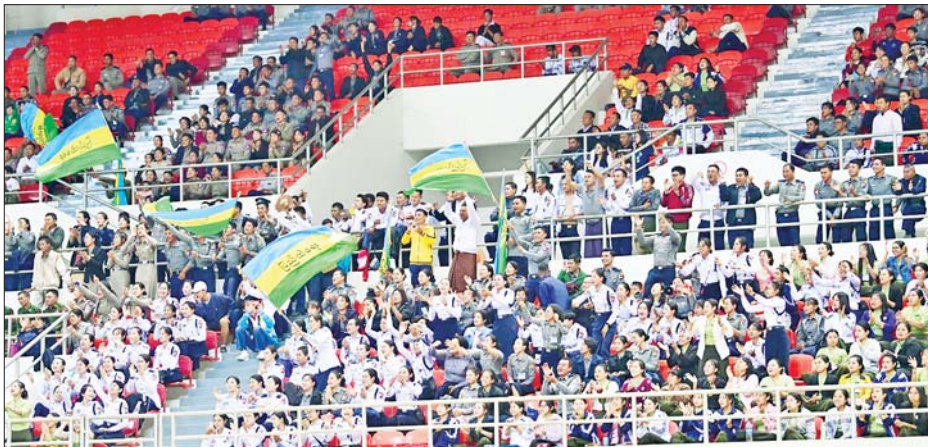
၂၀၂၄ ခုနှစ် ပဉ္စမအကြိမ် အမျိုးသားအားကစားပွဲတော် ပြည်နယ်နှင့် တိုင်းဒေသကြီးအဆင့်ပြိုင်ပွဲများ တွင် လာရောက်ကြည့်ရှုအားပေးကြသူများကို တွေ့ရစဉ်။

ထို့နောက် ဆုချီးမြှင့်ပွဲအခမ်း အနားကို ဆက်လက်ကျင်းပရာ ပြည်ထောင်စုဝန်ကြီး ဦးညွှန်ထွန်း က အမျိုးသမီး ၅၉ ကီလိုတန်း အလေးမပြိုင်ပွဲတွင် ပထမဆုရရှိ သည့် ဧရာဝတီတိုင်းဒေသကြီး၊ ဒုတိယဆုရရှိသည့် စစ်ကိုင်းတိုင်း ဒေသကြီးနှင့် တတိယဆု ရရှိသည့် ရခိုင်ပြည်နယ်တို့မှ ပြိုင်ပွဲဝင်များအား လည်းကောင်း၊ စာမျက်နှာ ၅ သို့