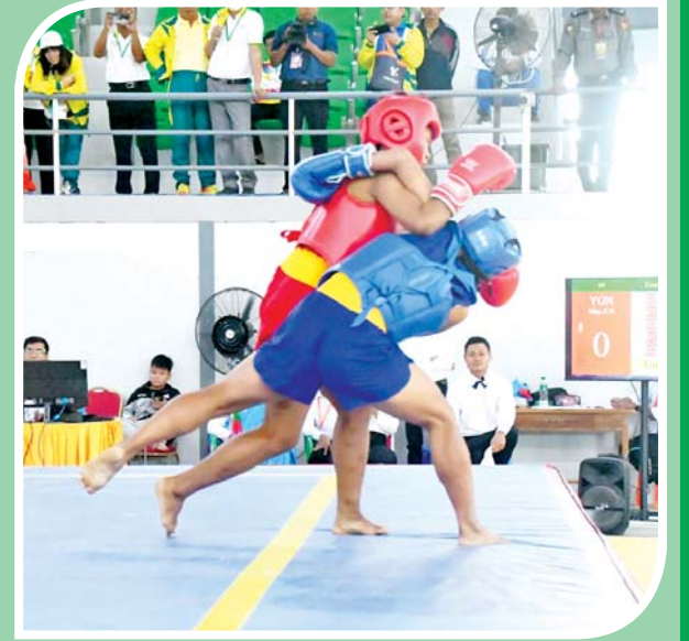
ပြည်နယ်နှင့် တိုင်းဒေသကြီး အမျိုးသမီး ဂူရှူး-ဆန်းဆို ပြိုင်ပွဲ တွင် ရန်ကုန်တိုင်းဒေသကြီးနှင့် ကရင်ပြည်နယ်တို့မှ ပြိုင်ပွဲဝင်များ ယှဉ်ပြိုင်စဉ်။