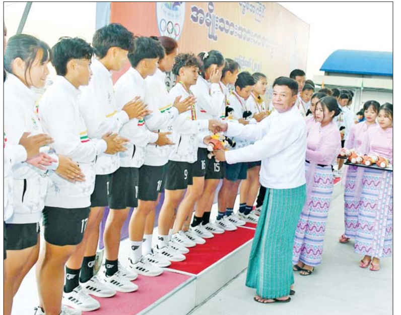
ပြည်ထောင်စုဝန်ကြီး ဦးမင်းသိန်းစံ ပြည်နယ်နှင့် တိုင်းဒေသကြီးအဆင့်အမျိုးသမီး ဘောလုံးပြိုင်ပွဲတွင် ဒုတိယဆုရရှိသည့် ရှမ်းပြည်နယ်အသင်းမှ ပြိုင်ပွဲဝင်များအား ဆုပေးအပ်ချီးမြှင့်စဉ်။