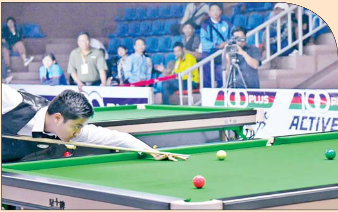
ပြည်နယ်နှင့် တိုင်းဒေသကြီး ဘီလီယက်နှင့် စနူကာပြိုင်ပွဲတွင် ပြိုင်ပွဲဝင် တစ်ဦး ယှဉ်ပြိုင်ကစားစဉ်။