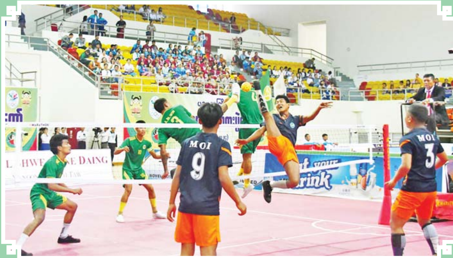
ဝန်ကြီးဌာန ပေါင်းစုံ အမျိုးသား ဝိုက်ကျော်ခြင်းပြိုင်ပွဲ တွင် ပြန်ကြားရေး ဝန်ကြီးဌာနအသင်း နှင့် စိုက်ပျိုးရေး၊ မွေးမြူရေးနှင့် ဆည် မြောင်းဝန်ကြီးဌာန အသင်းတို့ ယှဉ်ပြိုင် ကစားကြစဉ်။