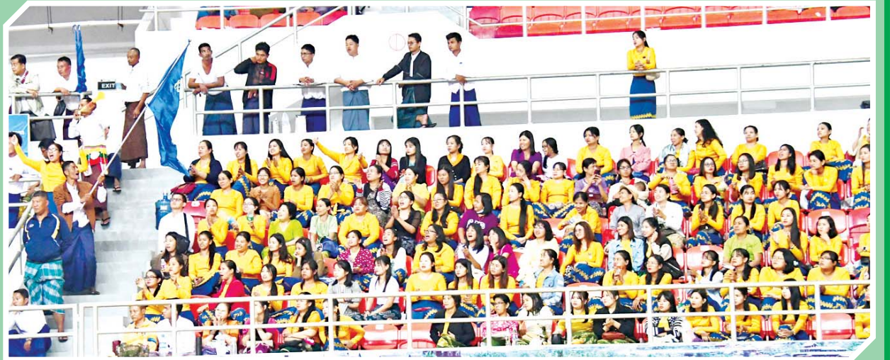
ပဉ္စမအကြိမ် အမျိုးသားအားကစားပွဲတော် အားကစားပြိုင်ပွဲများသို့ လာရောက်ကြည့်ရှုကြသူများကို တွေ့ရစဉ်။