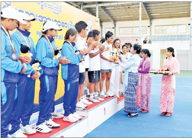
ပြည်ထောင်စုစာရင်းစစ်ချုပ် ဒေါက်တာခင်နိုင်ဦး ပြည်နယ်နှင့် တိုင်းဒေသကြီးအဆင့် တင်းနစ်ပြိုင်ပွဲ အမျိုးသမီးအသင်းလိုက်ပြိုင်ပွဲတွင် ပထမဆုရရှိသည့် မန္တလေးတိုင်းဒေသကြီးအသင်းမှ ပြိုင်ပွဲဝင်များအား ဆုပေးအပ်ချီးမြှင့်စဉ်။