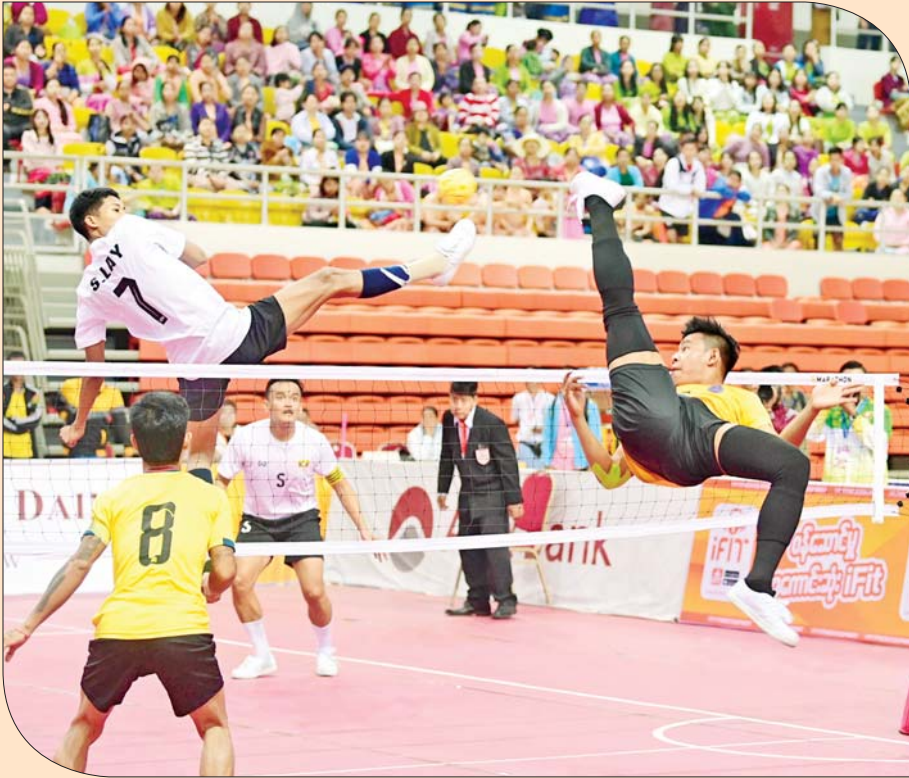
ဝန်ကြီးဌာနပေါင်းစုံ အမျိုးသားပိုက်ကျော်ခြင်းသုံးယောက်တွဲပြိုင်ပွဲတွင် ကာကွယ်ရေးဝန်ကြီးဌာန အသင်းနှင့် အားကစားနှင့်လူငယ်ရေးရာဝန်ကြီးဌာနအသင်းတို့ ယှဉ်ပြိုင်ကစားကြစဉ်။