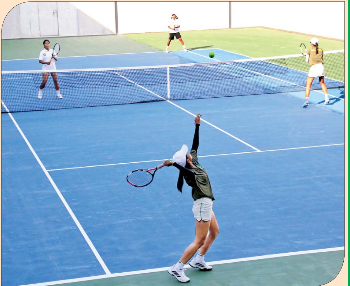
ပြည်နယ်နှင့် တိုင်းဒေသကြီး အမျိုးသမီးနှစ်ယောက်တွဲ တင်းနစ်ပြိုင်ပွဲတွင် မန္တလေးတိုင်းဒေသကြီးအသင်းနှင့် ပဲခူးတိုင်း ဒေသကြီးအသင်းတို့မှ ပြိုင်ပွဲဝင်များ ယှဉ်ပြိုင်ကစားကြစဉ်။