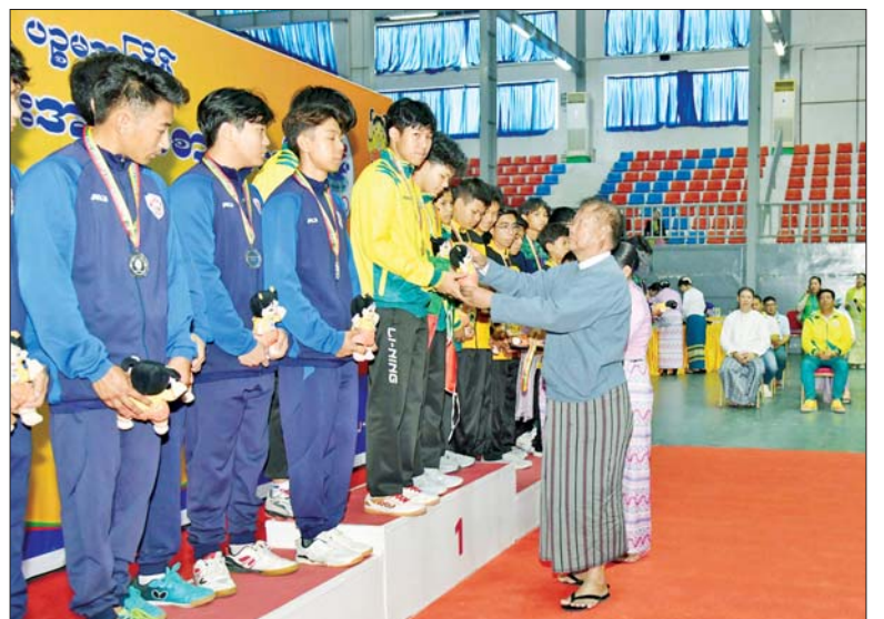
ပြည်ထောင်စုရာထူးဝန်အဖွဲ့ဥက္ကဋ္ဌ ဦးအောင်သော် ပြည်နယ်နှင့် တိုင်းဒေသကြီးအဆင့် အမျိုးသားစားပွဲတင်တင်းနစ်ပြိုင်ပွဲတွင် ပထမဆုရရှိသည့် ရန်ကုန်တိုင်းဒေသကြီးအသင်းမှ ပြိုင်ပွဲဝင်များအား ဆုပေးအပ်ချီးမြှင့်စဉ်။

အလားတူ ပြည်နယ်နှင့်တိုင်းဒေသကြီးအဆင့် အမျိုးသား/အမျိုးသမီးအသက် ၂၅ နှစ်အောက် စားပွဲတင်တင်းနစ်ပြိုင်ပွဲ ဗိုလ်လုပွဲပွဲစဉ်များကို ဝဏ္ဏသိဒ္ဓိအားကစားကွင်း လက်ဝှေ့အားကစားခန်းမ၌ ကျင်းပရာ ပြည်ထောင်စုရာထူးဝန်အဖွဲ့ဥက္ကဋ္ဌ ဦးအောင်သော်၊ အဂတိလိုက်စားမှု တိုက်ဖျက်ရေးကော်မရှင်ဥက္ကဋ္ဌ ဦးစစ်အေး၊ ပြည်နယ်နှင့် တိုင်းဒေသကြီးတို့မှ