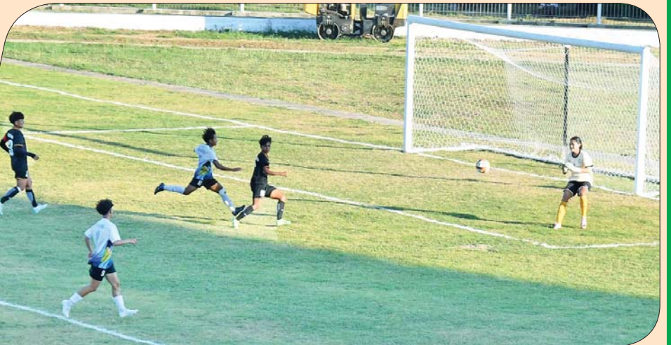
ပြည်နယ်နှင့် တိုင်းဒေသကြီး အသက် ၂၅ နှစ်အောက် အမျိုးသမီးဘောလုံးပြိုင်ပွဲ ဗိုလ်လုပွဲအဖြစ် ရှမ်းပြည်နယ်အသင်းနှင့် မန္တလေးတိုင်းဒေသကြီးအသင်းတို့ ယှဉ်ပြိုင်နေမှုကို ကြည့်ရှုအားပေးကြစဉ်။