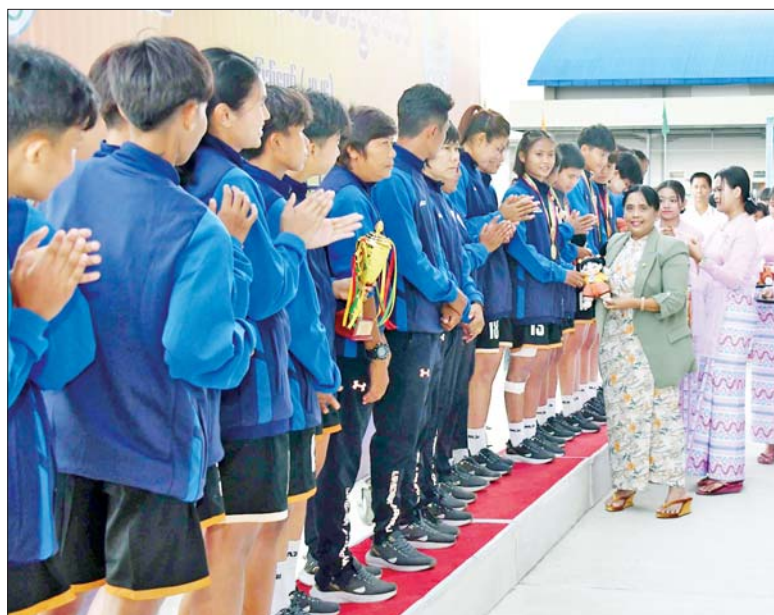
ပြည်ထောင်စုဝန်ကြီးနှင့် ပြည်ထောင်စုရှေ့နေချုပ် ဒေါက်တာသီတာဦး ပြည်နယ် နှင့် တိုင်းဒေသကြီးအဆင့် အမျိုးသမီးဘောလုံးပြိုင်ပွဲတွင် ပထမဆုရရှိသည့် မန္တလေးတိုင်း ဒေသကြီးအသင်းမှ ပြိုင်ပွဲဝင်များအား ဆုချီးမြှင့်စဉ်။