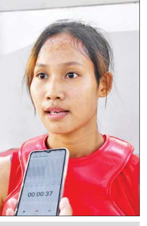
မဇင်ဝေအောင်