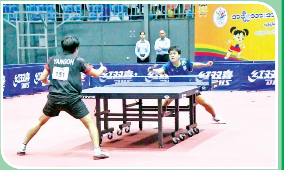
ပြည်နယ်နှင့် တိုင်းဒေသကြီး အမျိုး သား စားပွဲတင် တင်းနစ်ပြိုင်ပွဲတွင် ရန်ကုန်တိုင်းဒေသ ကြီးနှင့် မန္တလေးတိုင်း ဒေသကြီးတို့မှ ပြိုင်ပွဲ ဝင်များ ယှဉ်ပြိုင် ကစားကြစဉ်။