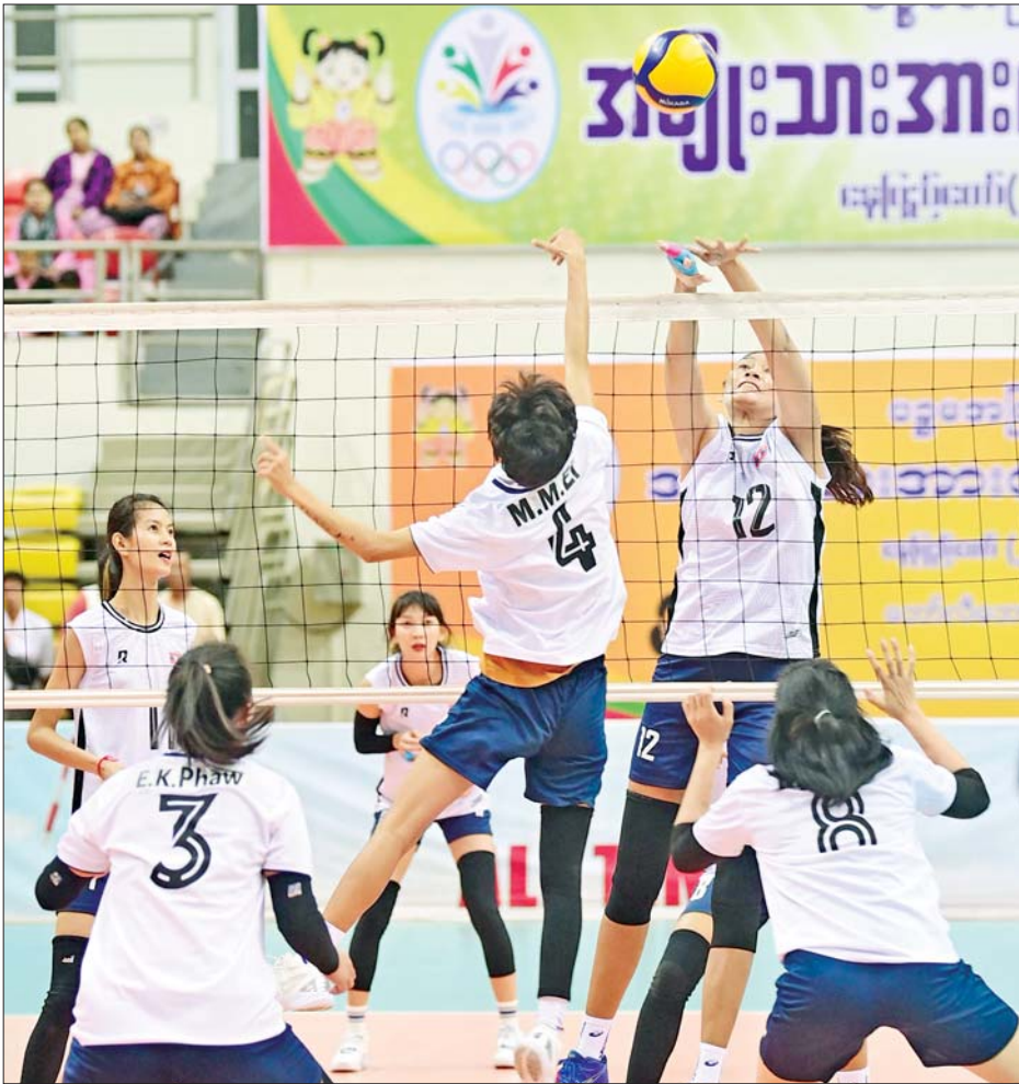
ဝန်ကြီးဌာနပေါင်းစုံ အမျိုးသမီး ဘော်လီဘောပြိုင်ပွဲတွင် ပို့ဆောင်ရေးနှင့်ဆက်သွယ်ရေးဝန်ကြီးဌာနအသင်းနှင့် ကာကွယ်ရေးဝန်ကြီးဌာနအသင်းတို့ ယှဉ်ပြိုင်ကစားကြစဉ်။

ဝန်ကြီးဌာနပေါင်းစုံ အမျိုးသား ပိုက်ကျော်ခြင်း ပြိုင်ပွဲများကို ဝဏ္ဏသိဒ္ဓိအားကစားကွင်း (A) ရှိ၍ ကျင်းပရာ အမျိုးသားပိုက်ကျော်ခြင်းလေးယောက်တွဲပြိုင်ပွဲ အုပ်စုပတ်လည်ပွဲစဉ်များကို ဝန်ကြီးဌာနများမှ ပြိုင်ပွဲဝင်အားကစားသမားများ ဝင်ရောက်ယှဉ်ပြိုင်ကစားကြပြီး အမျိုးသားပိုက်ကျော်ခြင်း သုံးယောက်တွဲပြိုင်ပွဲ တတိယလှပွဲတွင် ဆောက်လုပ်ရေးဝန်ကြီးဌာနအသင်းက ပို့ဆောင်ရေးနှင့်