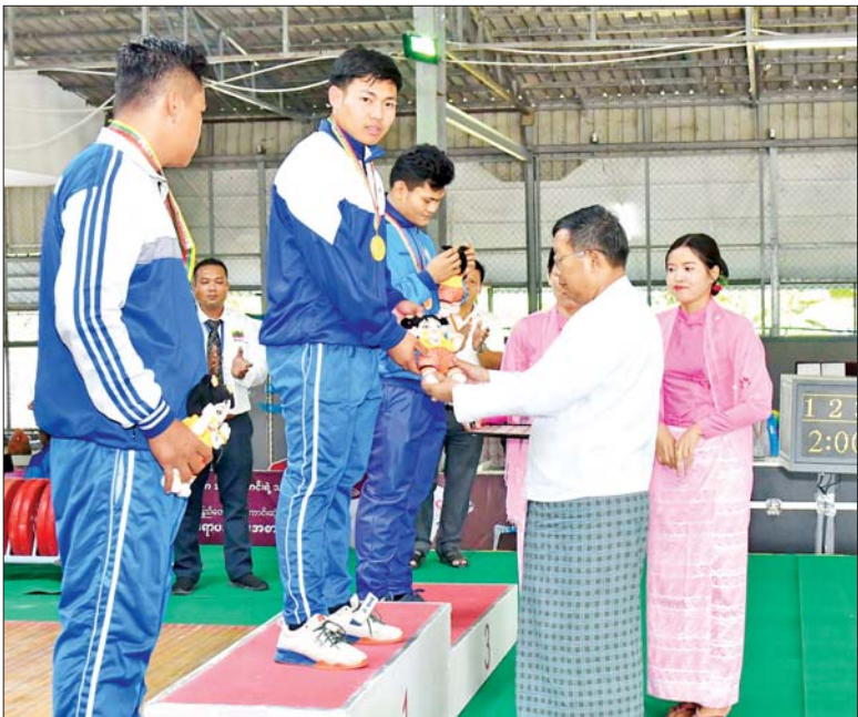
ပြည်ထောင်စုဝန်ကြီး ဦးတင်ဦးလွင် ပြည်နယ်နှင့် တိုင်းဒေသကြီးအဆင့် အမျိုးသား ရာဇကီလိုတန်း အလေးမပြိုင်ပွဲတွင် ပထမဆုရရှိသည့် စစ်ကိုင်းတိုင်းဒေသကြီးအသင်းမှ ပြိုင်ပွဲဝင်အား ဆုချီးမြှင့်စဉ်။