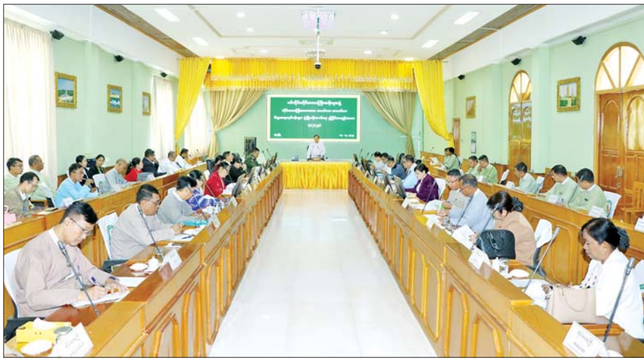
ရွေးချယ်ဆောင်ရွက်ပေးသွားရမည် ဖြစ်ကြောင်း ပြောကြားသည်။

မုံရွာ ဒီဇင်ဘာ ၁၇ စစ်ကိုင်းတိုင်းဒေသကြီးအတွင်း အသေးစား၊ အငယ်စားနှင့် အလတ်စားစီးပွားရေးလုပ်ငန်းများ ဖွံ့ဖြိုးတိုးတက်ရေး ညှိနှိုင်းစည်းဝေး (၃/၂၀၂၄) ကို ယနေ့နံနက်ပိုင်းက တိုင်းဒေသကြီး အစိုးရအဖွဲ့ရုံး အစည်းအဝေးခန်းမ၌ ကျင်းပသည်။