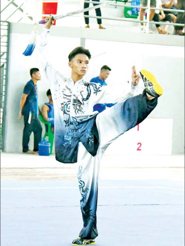
ပြည်နယ်နှင့်တိုင်းဒေသကြီး ဝူရှူးပြိုင်ပွဲတွင် ရန်ကုန်တိုင်းဒေသကြီးမှ ပြိုင်ပွဲဝင်တစ်ဦး ယှဉ်ပြိုင်စဉ်။