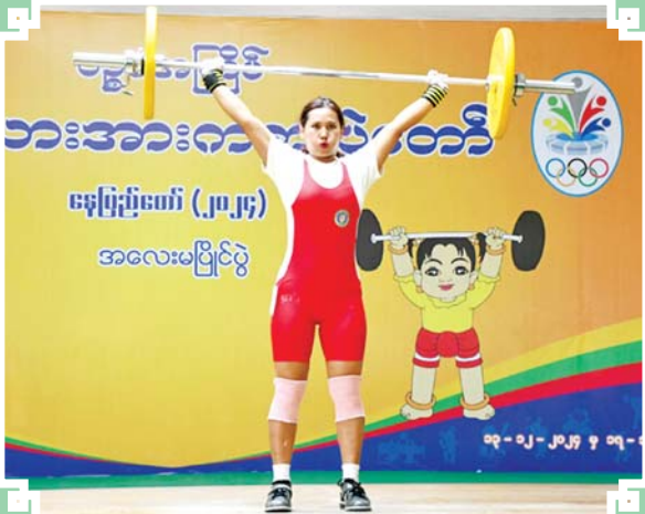
ပြည်နယ်နှင့် တိုင်းဒေသကြီး အမျိုးသမီး အလေးမပြိုင်ပွဲတွင် ပဲခူးတိုင်းဒေသကြီးမှ ပြိုင်ပွဲဝင်တစ်ဦး ယှဉ်ပြိုင်စဉ်။