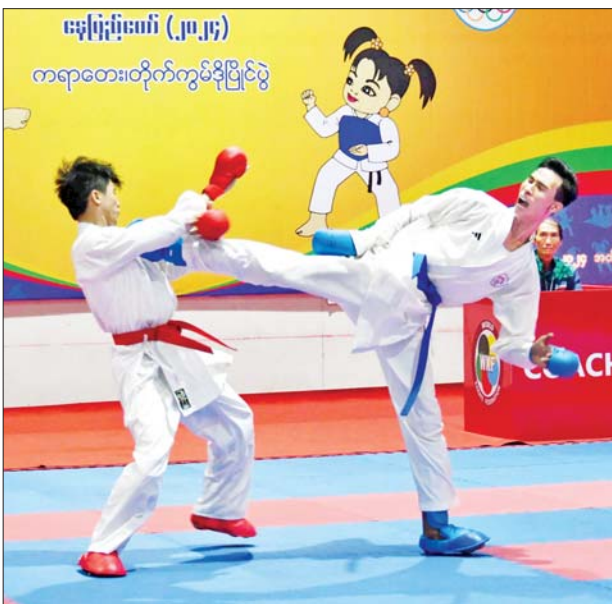
ပြည်နယ်နှင့်တိုင်းဒေသကြီး ကရာတေးပြိုင်ပွဲ အမျိုးသား ကုမိတူပြိုင်ပွဲတွင် ကရင်ပြည်နယ်နှင့် မန္တလေးတိုင်းဒေသကြီးတို့မှ ပြိုင်ပွဲဝင်အားကစားသမားများ ယှဉ်ပြိုင်ကစားကြစဉ်။

ပြည်နယ်နှင့် တိုင်းဒေသကြီး အမျိုးသားအသင်းလိုက် စားပွဲတင် တင်းနစ်ပြိုင်ပွဲ ဗိုလ်လုပွဲစဉ် အမျိုးသမီးအသင်းလိုက် စားပွဲတင် တင်းနစ်ပြိုင်ပွဲ ဗိုလ်လုပွဲစဉ်များကို ဝဏ္ဏသိဒ္ဓိအားကစားကွင်း လက်ဝှေ့ရုံ၌ လည်းကောင်း၊ ပြည်နယ်နှင့် တိုင်းဒေသကြီး အသက် ၂၅ နှစ်အောက် အမျိုးသမီးဘောလုံးပြိုင်ပွဲ တတိယလှပွဲနှင့် ဗိုလ်လုပွဲစဉ်ကို ဝဏ္ဏသိဒ္ဓိအားကစားကွင်း လေ့ကျင့်ရေးကွင်း (၃) နှင့် ရွှေကြာပင်အားကစားကွင်းတို့၌ လည်းကောင်း၊ ပြည်နယ်နှင့် တိုင်းဒေသကြီး အမျိုးသားအသင်းလိုက် တင်းနစ်ပြိုင်ပွဲ ဗိုလ်လုပွဲစဉ်၊ အမျိုးသမီးအသင်းလိုက် တင်းနစ်ပြိုင်ပွဲ ဗိုလ်လုပွဲစဉ်များကို ဝဏ္ဏသိဒ္ဓိအားကစားကွင်း တင်းနစ်ကွင်း၌ လည်းကောင်း၊ ပြည်နယ်နှင့် တိုင်းဒေသကြီး အလေးမပြိုင်ပွဲ အမျိုးသား ၉၆ ကီလိုတန်း ဗိုလ်လုပွဲစဉ်နှင့် အမျိုးသမီး ၆၄ ကီလိုတန်း ဗိုလ်လုပွဲစဉ်တို့ကို အလေးမရုံ၌ လည်းကောင်း ယှဉ်ပြိုင်ကစား