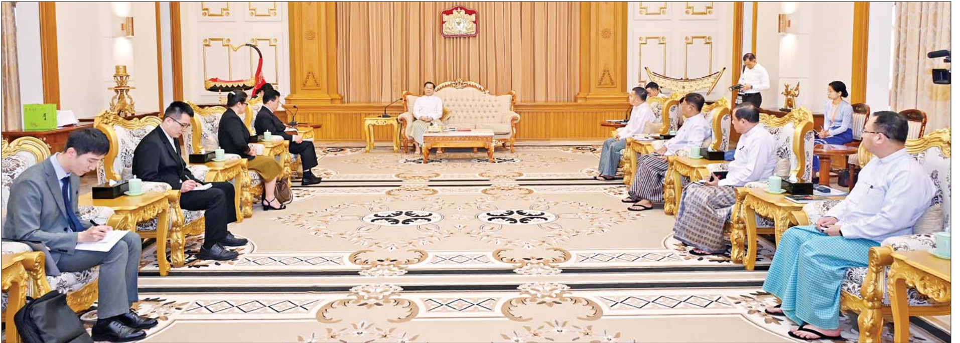
နိုင်ငံတော်စီမံအုပ်ချုပ်ရေးကောင်စီဥက္ကဋ္ဌ နိုင်ငံတော်ဝန်ကြီးချုပ် ဗိုလ်ချုပ်မှူးကြီး မင်းအောင်လှိုင် တရုတ်နိုင်ငံခြားရေးဝန်ကြီးဌာန အာရှရေးရာအထူးကိုယ်စားလှယ် H. E. Mr. Deng Xijun အား လက်ခံတွေ့ဆုံစဉ်။