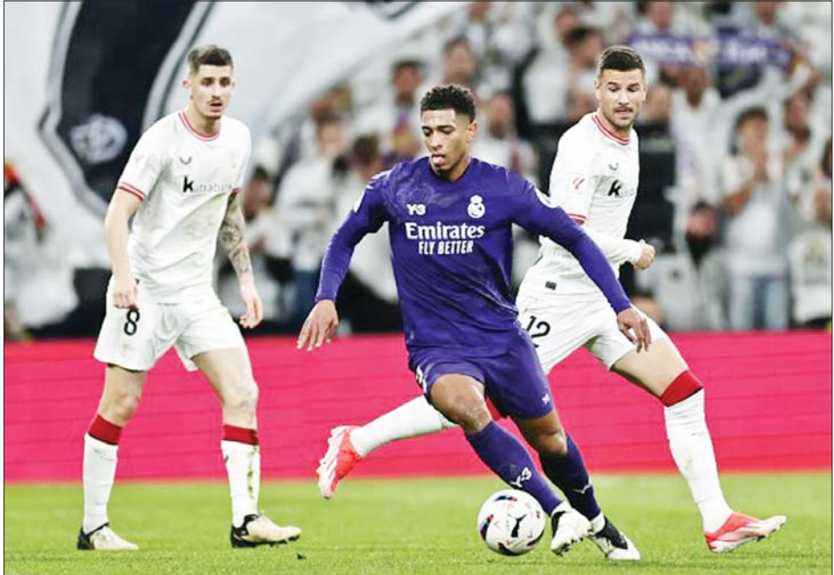
ရီးယဲလ်မက်ဒရစ်အသင်းနှင့် ဘီဘာအိုအသင်းတို့ ယှဉ်ပြိုင်ကစားကြစဉ်။