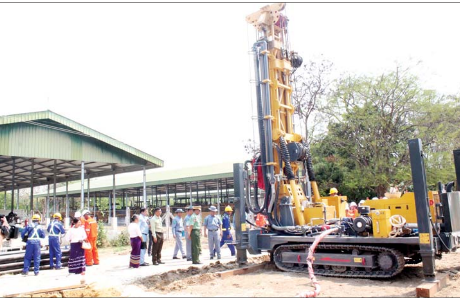
များကို ဝယ်ယူအသုံးပြု၍ ဝန်ထမ်းများအား ကျွမ်းကျင်ပညာရှင်များဖြင့် စာတွေ့၊ လက်တွေ့ပို့ချ နိုင်ရေးအတွက် ယခုသင်တန်းကို ဖွင့်လှစ်ပေးခြင်း ဖြစ်ပါကြောင်း။ ဝန်ထမ်းများအနေဖြင့် ရေရရှိရေးအတွက်

နေပြည်တော် ဧပြီ ၁ နယ်စပ်ရေးရာဝန်ကြီးဌာန ဒုတိယဝန်ကြီး ဗိုလ်ချုပ်ဖြိုးသန့်၊ နယ်စပ်ဒေသနှင့် တိုင်းရင်းသား လူမျိုးများ ဖွံ့ဖြိုးတိုးတက်ရေးဦးစီးဌာန ညွှန်ကြား ရေးမှူးချုပ် ဦးစိုင်းထွန်းညိုနှင့် တာဝန်ရှိသူများသည် ယနေ့နံနက်ပိုင်းတွင် မန္တလေးတိုင်းဒေသကြီး မိတ္ထီလာခရိုင် ဖွံ့ဖြိုးမှုကြီးကြပ်ရေးရုံး၌ ကျင်းပသည့် နိုင်ငံတစ်ဝန်း သန့်ရှင်းသော သောက်သုံးရေရရှိရေး အတွက် ရေကြောရှာဖွေစက်နှင့် ရေတွင်းတူးစက် ကျွမ်းကျင်စွာအသုံးပြုနိုင်ရေး သင်တန်းဖွင့်ပွဲသို့ တက်ရောက်သည်။ ဦးစွာ ဒုတိယဝန်ကြီးက ယနေ့သင်တန်းကို တက်ရောက်လာကြသည့် ဝန်ထမ်းများအနေဖြင့် သန့်ရှင်းသော မြေအောက်သောက်သုံးရေရရှိရေး လုပ်ငန်းများ ဆောင်ရွက်နိုင်ရန်အတွက် နယ်စပ်ရေးရာ ဝန်ကြီးဌာနမှ မြန်မာနိုင်ငံတွင် အနက် မီတာ ၁၀၀၀ (ပေ ၃၀၀၀) အထိ တူးဖော်အသုံးပြုနိုင်မည့် စက်ယန္တရား များဖြင့် ပထမဦးဆုံး ဆောင်ရွက်သွားမည်ဖြစ်ပါ ကြောင်း၊ အဆိုပါ ရေရရှိရေးလုပ်ငန်းများ အောင်မြင် စွာ ဆောင်ရွက်နိုင်ရေးအတွက် ဝန်ကြီးဌာနအနေဖြင့် အဆင့်မြင့် ရေကြောရှာဖွေစက်၊ ရေတွင်းတူးစက်