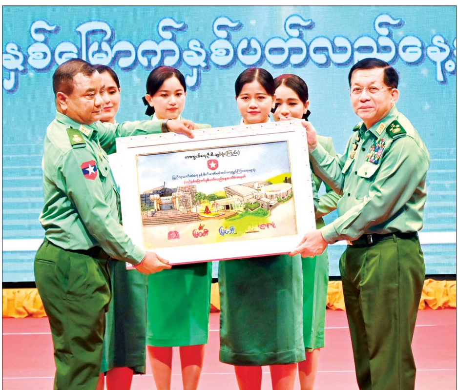
နိုင်ငံတော်စီမံအုပ်ချုပ်ရေးကောင်စီဥက္ကဋ္ဌ တပ်မတော်ကာကွယ်ရေးဦးစီးချုပ် ဗိုလ်ချုပ်မှူးကြီး မင်းအောင်လှိုင်ထံ ပြည်သူ့ဆက်ဆံရေးနှင့် စိတ်ဓာတ်စစ်ဆင်ရေးညွှန်ကြားရေးမှူးရုံး ညွှန်ကြားရေးမှူး ဗိုလ်ချုပ်ဇော်မင်းထွန်းက နှစ်ပတ်လည်နေ့ အထိမ်းအမှတ်လက်ဆောင်ကို ဂါရဝပြုပေးအပ်စဉ်။

နောင်တာဝန်ထမ်းဆောင်ကြမည့် မျိုးဆက်သစ် နိုင်ငံသားများကို လည်း နိုင်ငံတော်အတွက်တာဝန် ထမ်းဆောင်ကြမည့် ဟူသည့် ခံယူချက်မျိုးဖြစ်လာရေး ကြိုးစား ဆောင်ရွက်သွားရမည်ဖြစ်ကြောင်း။ ပြည်သူ့ဆက်ဆံရေးနှင့်စိတ်ဓာတ် စစ်ဆင်ရေးတပ်များသည် စာပေ၊ ဂီတ၊ မီဒီယာ စသည့် အသိပညာ ရှင်၊ အတတ်ပညာရှင်များဖြင့် အနုပညာဆိုင်ရာသဘောသဘာဝ အပေါ်အခြေခံပြီး ဖွဲ့စည်းထား သည့် တပ်ဖွဲ့များဖြစ်သောကြောင့် တပ်ဖွဲ့တွင်း စည်းလုံးညီညွတ်မှု ရှိစေရေးသည် အရေးကြီးကြောင်း၊ ပေးအပ်လာသည့် တာဝန်အရပ်ရပ် အပေါ် တစ်ဦးတစ်ယောက် ကောင်းအားထက်စုပေါင်းအားကို အဓိကမဏ္ဍိုင်ပြုပြီး ကျေပွန် အောင် ထမ်းဆောင်သွားကြရန် လိုကြောင်း၊ မှန်ကန်သည့်အသိ၊ ခိုင်မာသည့် ခံယူချက်ကောင်းများ နှင့် မိမိတို့ကိုယ်စီ တတ်မြောက် ကျွမ်းကျင်ထားကြသည့် အတတ် ပညာ စွမ်းအားများ ပေါင်းစပ်ပြီး နိုင်ငံတော်၊ တပ်မတော်နှင့် တိုင်းရင်းသားပြည်သူတစ်ရပ်လုံး