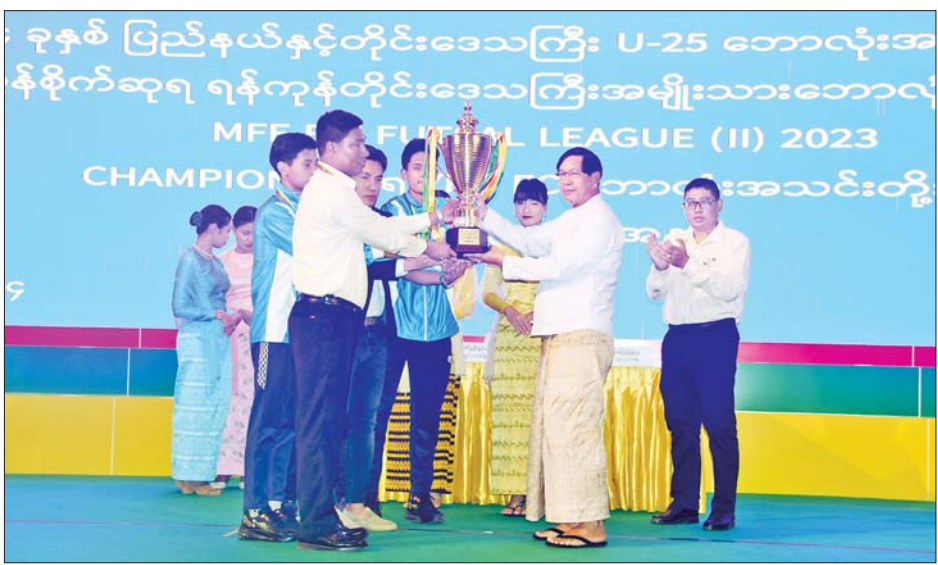
ဂုဏ်ပြုဆုပေးပေးအပ်ချီးမြှင့်ကြသည်။ ပြိုင်ပွဲအတွေ့အကြုံများကို ရှင်းလင်းတင်ပြကြပြီး ထို့နောက် ဘောလုံးအသင်းအုပ်ချုပ်သူများက ကျေးဇူးတင်စကားပြောကြားသည်။ သတင်းစဉ်