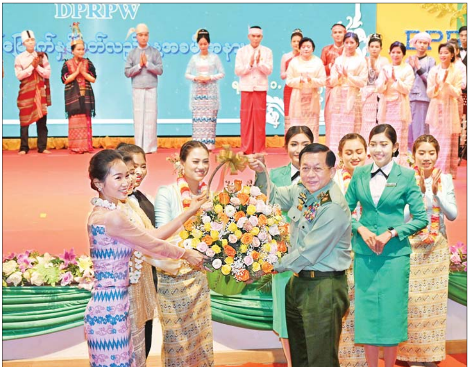
နိုင်ငံတော်စီမံအုပ်ချုပ်ရေးကောင်စီဥက္ကဋ္ဌ တပ်မတော်ကာကွယ်ရေးဦးစီးချုပ် ဗိုလ်ချုပ်မှူးကြီး မင်းအောင်လှိုင် အနုပညာရှင်များနှင့် ဖျော်ဖြေရေးအဖွဲ့များအား ဂုဏ်ပြုပန်းခြင်း ပေးအပ်စဉ်။

အခမ်းအနားအပြီးတွင် နိုင်ငံတော် စီမံအုပ်ချုပ်ရေးကောင်စီဥက္ကဋ္ဌ တပ်မတော်ကာကွယ်ရေးဦးစီးချုပ် နှင့် အဖွဲ့ဝင်များသည် ပြည်သူ့ ဆက်ဆံရေးနှင့်စိတ်ဓာတ်စစ်ဆင် ရေးညွှန်ကြားရေးမှူးရုံး (၇၇)နှစ် မြောက် နှစ်ပတ်လည်နေ့ အခမ်း အနား Signing Booth တွင် အမှတ်တရ လက်မှတ်ရေးထိုးကြ ပြီး နှစ်ပတ်လည်နေ့ အထိမ်း အမှတ်အဖြစ် ခင်းကျင်းပြသထား သည့် ပညာရေးပြခန်း၊ အမှတ်(၁) တပ်မတော် ရုပ်မြင်သံကြား ထုတ်လွှင့်ရေးတပ်ပြခန်း၊ အမှတ် (၂) တပ်မတော်ရုပ်မြင်သံကြား ထုတ်လွှင့်ရေးတပ်ပြခန်း၊ အမှတ် (၁) တပ်မတော်အသံလွှင့်တပ် ပြခန်း၊ မြဝတီစာပေတိုက်ပြခန်း၊ မြဝတီသတင်းစာတိုက်ပြခန်းနှင့် ရတနာပုံသတင်းစာတိုက်ပြခန်း တို့ကို လှည့်လည်ကြည့်ရှု၍ ရှင်းလင်းတင်ပြမှုများအပေါ် သိရှိ လိုသည်များမေးမြန်းပြီး လိုအပ် သည့်များ လမ်းညွှန်မှာကြား သည်။