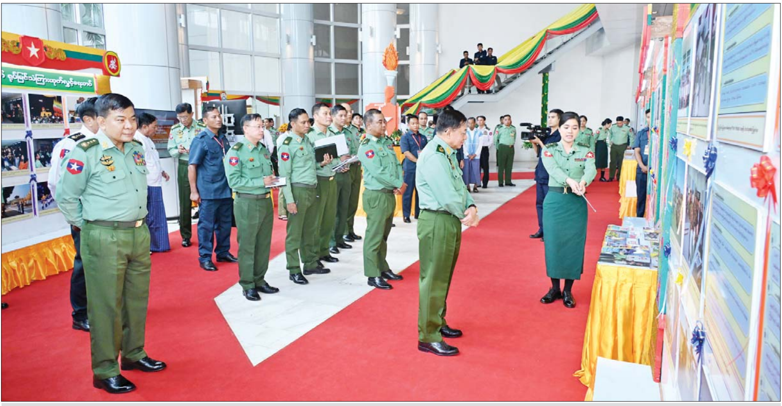
နိုင်ငံတော်စီမံအုပ်ချုပ်ရေးကောင်စီဥက္ကဋ္ဌ တပ်မတော်ကာကွယ်ရေးဦးစီးချုပ် ဗိုလ်ချုပ်မှူးကြီးမင်းအောင်လှိုင် ခင်းကျင်းပြသထားသည့် ပြခန်းများကို လှည့်လည်ကြည့်ရှု စဉ်။

အနုပညာအရသာမက တိုက်ပွဲ ဝင်စည်းရုံးရေးသင်တန်းကျောင်း များ အသီးသီးကလည်း တပ်မတော် (ကြည်း၊ ရေ၊ လေ)အရာရှိ စစ်သည် များ၏ တိုက်ပွဲဝင်စိတ်ဓာတ် မြင့်မားရေးကို အထူးအလေးထား ဆောင်ရွက်သွားရန် တိုက်တွန်းလို ကြောင်း၊ မကြာခင် စစ်မှုထမ်းကြ တော့မည့် ပြည်သူ့စစ်မှုထမ်းများ ကိုလည်း တိုင်းချစ်ပြည်ချစ်စိတ်၊ နိုင်ငံတော် ကာကွယ်လိုစိတ် ထာဝရကိန်းအောင်းသွားစေရေး ဆောင်ရွက်သွားရန် လိုသကဲ့သို့