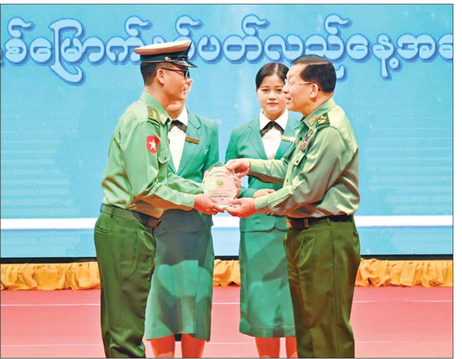
နိုင်ငံတော်စီမံအုပ်ချုပ်ရေးကောင်စီဥက္ကဋ္ဌ တပ်မတော်ကာကွယ်ရေးဦးစီးချုပ် ဗိုလ်ချုပ်မှူးကြီး မင်းအောင်လှိုင် ၂၀၂၂ ခုနှစ် စာပေဗိမာန်စာမူဆု စာပဒေသာ(ပထမဆု) ရရှိသည့် ဗိုလ်ကြီးနေထွဋ်အောင်အား ဆုပေးအပ်ချီးမြှင့်စဉ်။

ယင်းနောက် နိုင်ငံတော်စီမံအုပ်ချုပ်ရေးကောင်စီ ဥက္ကဋ္ဌ တပ်မတော်ကာကွယ်ရေးဦးစီးချုပ်က အမှာစကားပြောကြားရာတွင်