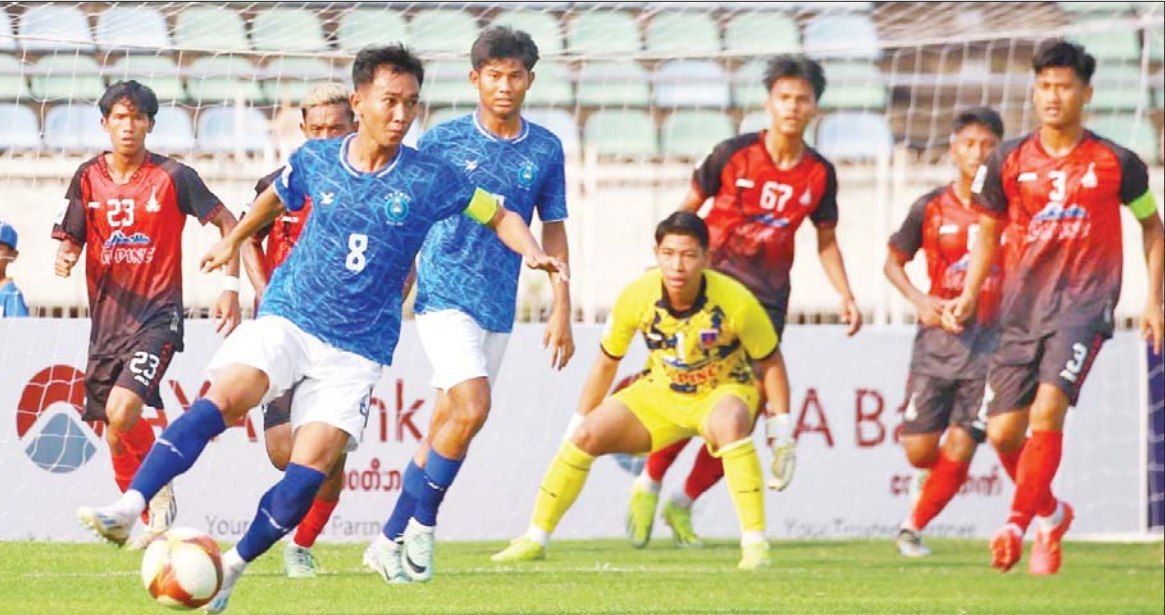
အား/ကာသိပွဲအသင်းနှင့် ရတနာပုံအသင်း ယှဉ်ပြိုင်ကစားစဉ်။