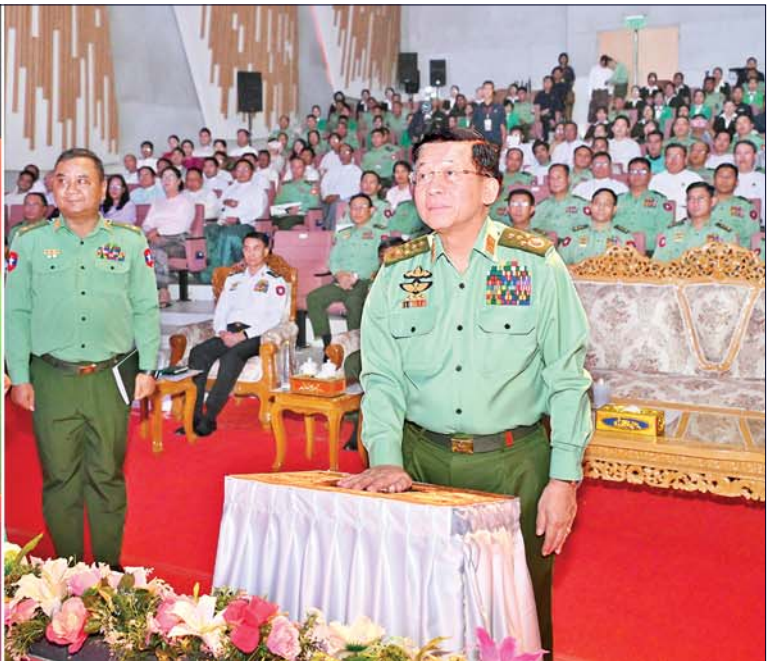
နိုင်ငံတော်စီမံအုပ်ချုပ်ရေးကောင်စီဥက္ကဋ္ဌ တပ်မတော်ကာကွယ်ရေးဦးစီးချုပ် ဗိုလ်ချုပ်မှူးကြီးမင်းအောင်လှိုင် ကာကွယ်ရေးဦးစီးချုပ်(ကြည်း) ပြည်သူ့ဆက်ဆံရေးနှင့် စိတ်ဓာတ်စစ်ဆင်ရေး ညွှန်ကြားရေးမှူးရုံး (၇၇)နှစ်မြောက် နှစ်ပတ်လည်နေ့အခမ်းအနားနှင့် မြဝတီစာပေတိုက်မှ ထုတ်ဝေလျက်ရှိသည့် တေဇရပ်စုံစာစောင်နှင့် မိုးသောက်ပန်းဂျာနယ်တို့အား Amuze Webtoon Application တွင် ထည့်သွင်းခြင်းတို့ကို Digital နည်းပညာအသုံးပြု၍ ဖွင့်လှစ်ပေးစဉ်။