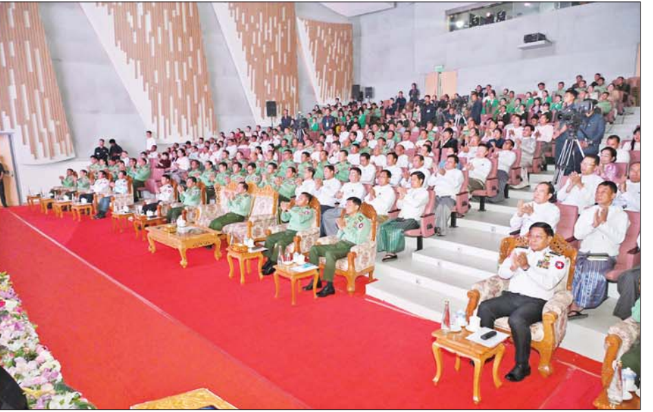
နိုင်ငံတော်စီမံအုပ်ချုပ်ရေးကောင်စီဥက္ကဋ္ဌ တပ်မတော်ကာကွယ်ရေးဦးစီးချုပ် ဗိုလ်ချုပ်မှူးကြီးမင်းအောင်လှိုင်နှင့် အခမ်းအနားတက်ရောက်လာကြသူများ ဂုဏ်ပြုဖျော်ဖြေတင်ဆက်နေမှုကို ကြည့်ရှုအားပေးစဉ်။