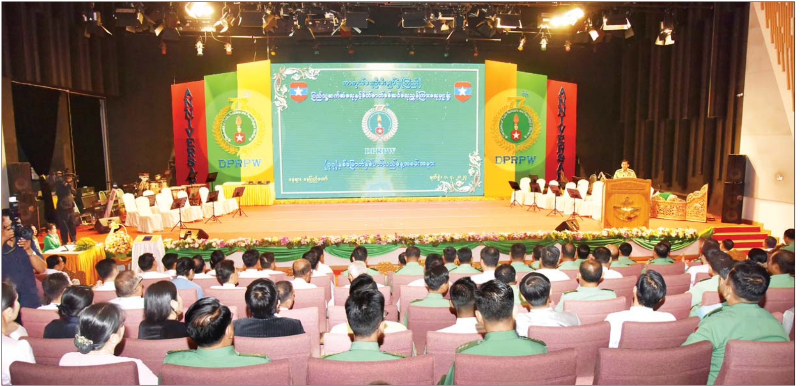
နိုင်ငံတော် စီမံအုပ်ချုပ်ရေးကောင်စီဥက္ကဋ္ဌ တပ်မတော်ကာကွယ်ရေးဦးစီးချုပ် ဗိုလ်ချုပ်မှူးကြီးမင်းအောင်လှိုင် ကာကွယ်ရေးဦးစီးချုပ်ရုံး(ကြည်း)၊ ပြည်သူ့ဆက်ဆံရေးနှင့် စိတ်ဓာတ်စစ်ဆင်ရေး ညွှန်ကြားရေးမှူးရုံး (၇၇)နှစ်မြောက် နှစ်ပတ်လည်နေ့အခမ်းအနားတွင် အမှာစကားပြောကြားစဉ်။

အဆိုပါ ကာကွယ်ရေးဦးစီးချုပ်ရုံး (ကြည်း)၊ ပြည်သူ့ဆက်ဆံရေးနှင့် စိတ်ဓာတ်စစ်ဆင်ရေး ညွှန်ကြားရေးမှူးရုံး (၇၇)နှစ်မြောက် နှစ်ပတ်လည်နေ့ အခမ်းအနားသို့ နိုင်ငံတော်စီမံအုပ်ချုပ်ရေးကောင်စီ