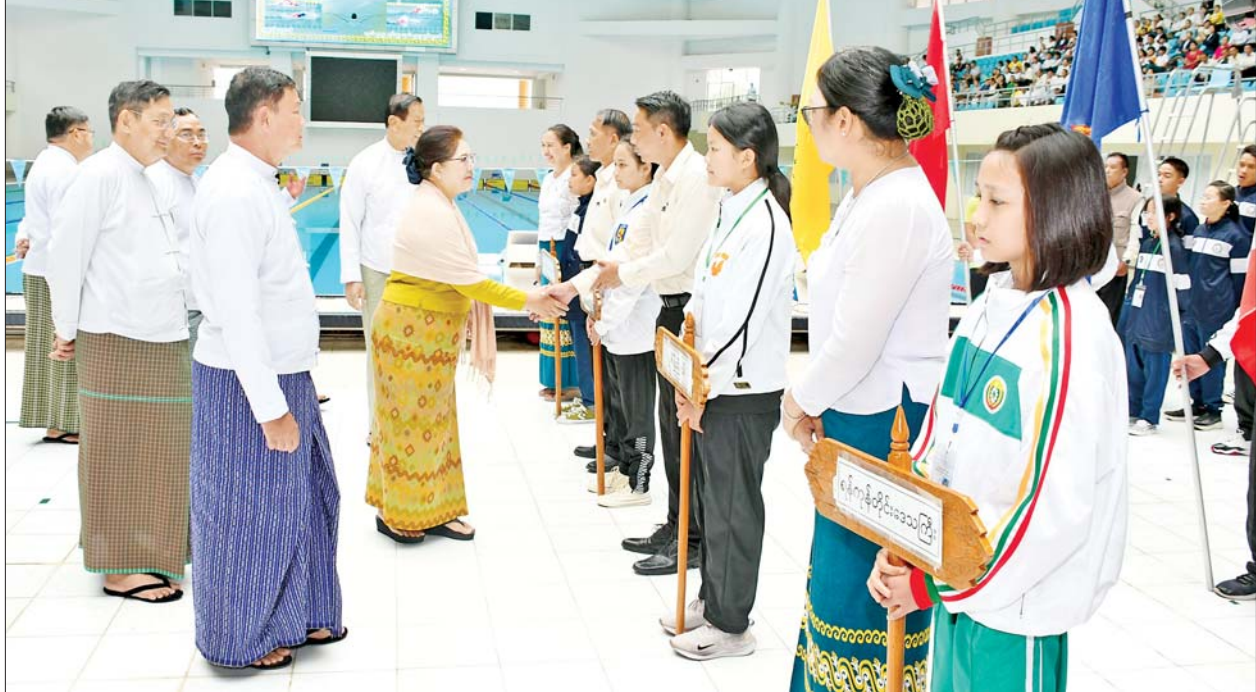
နိုင်ငံတော်စီမံအုပ်ချုပ်ရေးကောင်စီအဖွဲ့ဝင်များနှင့် တာဝန်ရှိသူများက ပြိုင်ပွဲဝင်အားကစားသမားများကို ရင်းရင်းနှီးနှီး နှုတ်ဆက်စဉ်။

ရုဏ်ဆောင် အားကစားသမားကောင်းများဖြစ်လာစေရန် ကြိုးစားသွားကြစေလိုကြောင်း တိုက်တွန်းပြောကြားပြီး ၂၀၂၄ ခုနှစ်ပြည်နယ်နှင့် တိုင်းဒေသကြီး ရေကူးပြိုင်ပွဲကို ဖွင့်လှစ်ပေးသည်။