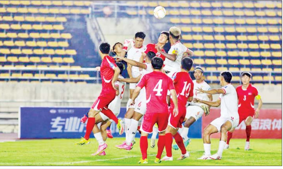
မြောက်ကိုရီးယားအသင်းနှင့် မြန်မာအသင်းတို့ ဇွန် ၁၁ ရက်က ယှဉ်ပြိုင်ကစားကြစဉ်။