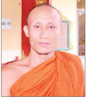
ဥူးတေဇနိယ