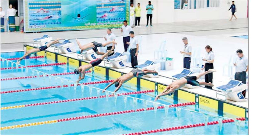
နိုင်ငံတော်စီမံအုပ်ချုပ်ရေးကောင်စီအဖွဲ့ဝင်များ ၂၀၂၄ ခုနှစ် ပြည်နယ်နှင့် တိုင်းဒေသကြီး ရေကူးပြိုင်ပွဲ ဖွင့်ပွဲအခမ်းအနားသို့ တက်ရောက်ကြည့်ရှုအားပေးစဉ်။