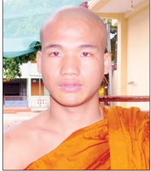
ကိုရင်ပညာဇောတ