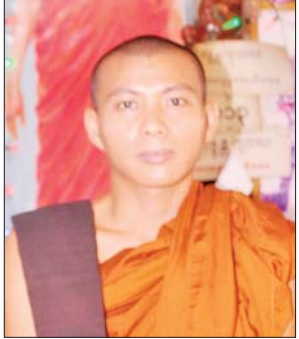
ဥူးသုတဓရ

နိုင်ငံတော်ကသတ်မှတ်ထားတဲ့ ကျောင်းအပ်နှံရေးရက်သတ္တပတ် ကစပြီး ကျောင်းအပ်လက်ခံခဲ့ပြီးတော့ ဇွန် ၃ ရက်ကစပြီး ကျောင်းဖွင့် ခဲ့တယ်။ ကျောင်းကကိုရင်နဲ့ သီလရှင်ဆရာလေးတွေဆိုရင် ပညာကို တော်တော်လိုလားကြတယ်။ မြို့နယ်တွေက လာတက်ကြတဲ့ ကလေး တွေဆိုရင်လည်းအတူတူပဲ။ ဆရာ ဆရာမတွေကလည်း ဖိဖိစီးစီး သင်ကြားပေးကြတယ်။ ပညာသင်ကြားရေးအပိုင်းမှာ ဆရာ ဆရာမတွေ ကို အထူးပဲကျေးဇူးတင်ရပါတယ်။ ရရှိတဲ့ လစာငွေလေးနဲ့ ကလေးတွေရဲ့ ပညာရေးကို စေတနာ့၊ အနစ်နာ၊ ဝါသနာနဲ့ ယနေ့အထိ သင်ကြားပေးနေ မှုဟာ ဂုဏ်ယူစရာပါ။ တိုင်းရင်းသားတွေဆိုရင် ဒေသဖွံ့ဖြိုးမှုအပေါ် မူတည်ပြီး ရန်ကုန်မြို့က ဘုန်းတော်ကြီးကျောင်းတွေမှာ ကျောင်းအိပ် ကျောင်းစားနဲ့ ပညာသင်ကြားနေကြတာများတယ်။ နတ်မောက်ဘုန်းတော် ကြီးသင်ပညာရေးကျောင်းက နိုင်ငံဝန်ထမ်းနဲ့ ဘာသာရေးနယ်ပယ်မှာ တာဝန်ထမ်းဆောင်နေသူတွေကို မွေးထုတ်ပေးခဲ့တဲ့ ကျောင်းလည်းဖြစ် ပါတယ်။