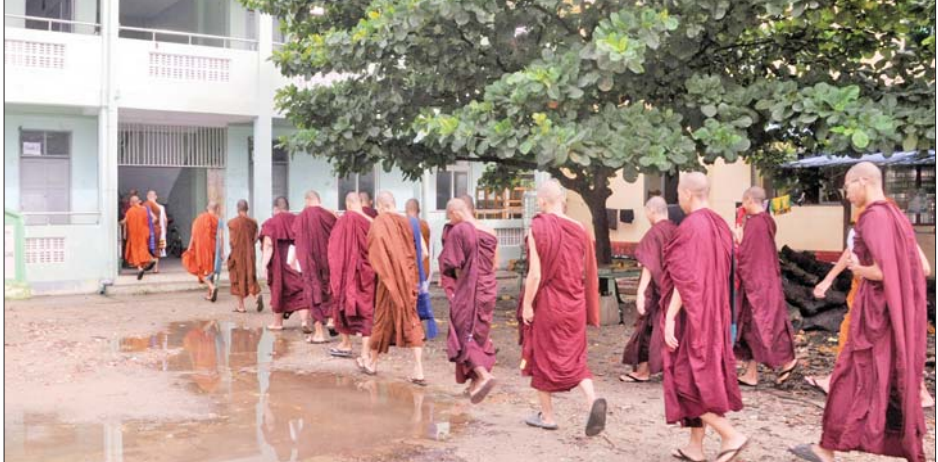
သာဓကတမြို့နယ် နတ်မောက်ဘုန်းတော်ကြီးသင်ပညာရေးအလယ်တန်းကျောင်းတွင် တက်ရောက်သင်ကြားနေကြသည့် အလယ်တန်း၊ အထက်တန်းကိုရင်၊ သီလရှင်နှင့် ကျောင်းသား ကျောင်းသူများကို တွေ့ရစဉ်။