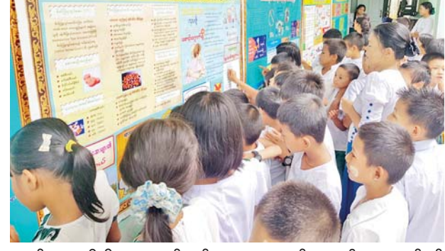
ဆက်ဆံရေးဦးစီးဌာနမှ ဝန်ထမ်းများက မူးယစ်ဆေးဝါးအန္တရာယ်နှင့် ဆိုးကျိုးများ၊ မူးယစ်ကင်းစင်ရေးအတွက် ဆောင်ရန်/ရှောင်ရန်အချက်များနှင့် ကျောင်းပြင်ပစာပေများ လေ့လာဖတ်ရှုကြရေးတို့ကို ဟောပြောဆွေးနွေးပြီး စာဖတ်စွမ်းရည် ပုံပြင်ပြော၊ ကဗျာရွတ်ဆို ယှဉ်ပြိုင်ခြင်းများ ပြုလုပ်ခဲ့ကြကြောင်း သိရသည်။

သထုံ ဇွန် ၁၂ မွန်ပြည်နယ် သထုံမြို့နယ်တွင် ပြန်ကြားရေးနှင့်ပြည်သူ့ဆက်ဆံရေးဦးစီးဌာနနှင့် အခြေခံပညာဦးစီးဌာနတို့ပူးပေါင်း၍ မူးယစ်ဆေးဝါးအန္တရာယ် တားဆီးကာကွယ်ရေးနှင့် စာဖတ်ရိုက်နှိပ်ခြင်းများဖြင့် အသိပညာဗဟုသုတတိုးပွားစေရေး အသိပညာပေးဟောပြောခြင်း၊ နံရံကပ်စာစောင်ပြသခြင်းများကို ယနေ့နံနက်ပိုင်းတွင် သထုံမြို့ ဘင်လှိုင်ရပ်ကွက်ရှိ မရမ်းချောင်း အခြေခံပညာမူလတန်းလွန်ကျောင်း၌ ဆောင်ရွက်ခဲ့ကြသည်။