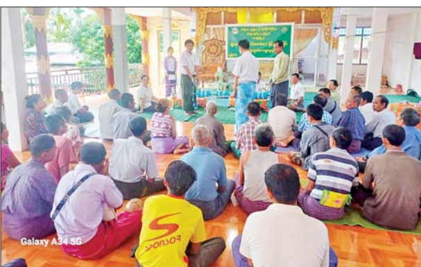
Galaxy A34 5G