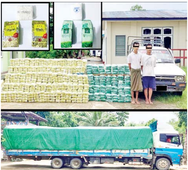
သိမ်းဆည်းရမိသည့် စိတ်ပြောင်းဆေးဝါးများနှင့်အတူ တွေ့ရစဉ်။

နေပြည်တော် ဇွန် ၁၂ ရှမ်းပြည်နယ် (အရှေ့ပိုင်း) ကျိုင်းတုံမြို့နယ်တွင် ငွေကျပ် ၅ ဒသမ ၇ ဘီလီယံတန်ဖိုးရှိ အိုက်စ် (မက်သ်အဖက်တမင်း) ကီလို ၅၀၀ နှင့် ကက်တမင်း ကီလို ၂၀၀ သိမ်းဆည်းရမိခဲ့ကြောင်း မြန်မာနိုင်ငံရဲတပ်ဖွဲ့မှ သိရသည်။