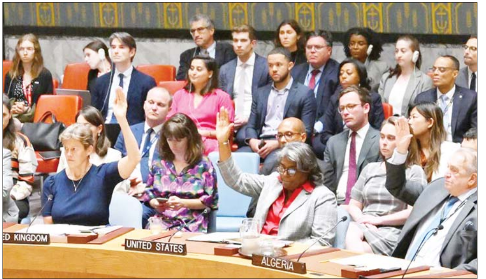
ဆိုင်ရာ လုံခြုံရေးကောင်စီ၏ ဆုံးဖြတ်ချက်သည် အစွရေးနှင့် ဟားမတ်စ်တို့အပေါ် ဖိအားပေးနိုင်ခြင်းရှိ မရှိဆိုသည်ကို ဆက်လက်စောင့်ကြည့်ရမည်