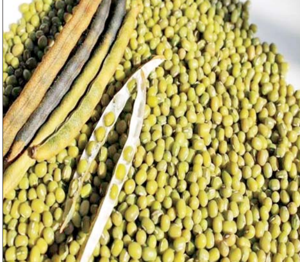
သတင်းရင်းမြစ်- စီးပွား/ကူးသန်း

ပဲတီစိမ်း (မိုးကြို) သီးနှံကို ဇွန်လဆန်းမှ စတင်၍ ရိတ်သိမ်းလျက် ရှိရာ အထွက်နှုန်းအနေဖြင့် တစ်ဧကလျှင် ၁၂ တင်းခန့် ထွက်ရှိကြောင်း၊ ဈေးကွက်အနေဖြင့် ကျောက်ဆည်မြို့ရှိ ပွဲရုံများသို့ တင်ပို့ရောင်းချ လျက်ရှိပြီး ပွဲရုံများမှတစ်ဆင့် ရန်ကုန်နှင့် မန္တလေးမြို့တို့သို့ တင်ပို့ ရောင်းချလျက်ရှိကြောင်း၊ ယခုနှစ် ပဲတီစိမ်း (မိုးကြို) သီးနှံ ဈေးနှုန်း များမှာ ယခင်နှစ်ထက် ဈေးနှုန်းပိုမိုကောင်းမွန်သည့်အတွက် တောင်သူများအနေဖြင့် အကျိုးအမြတ်များ ပိုမိုရရှိကာ အဆင်ပြေ လျက်ရှိကြောင်း သိရသည်။