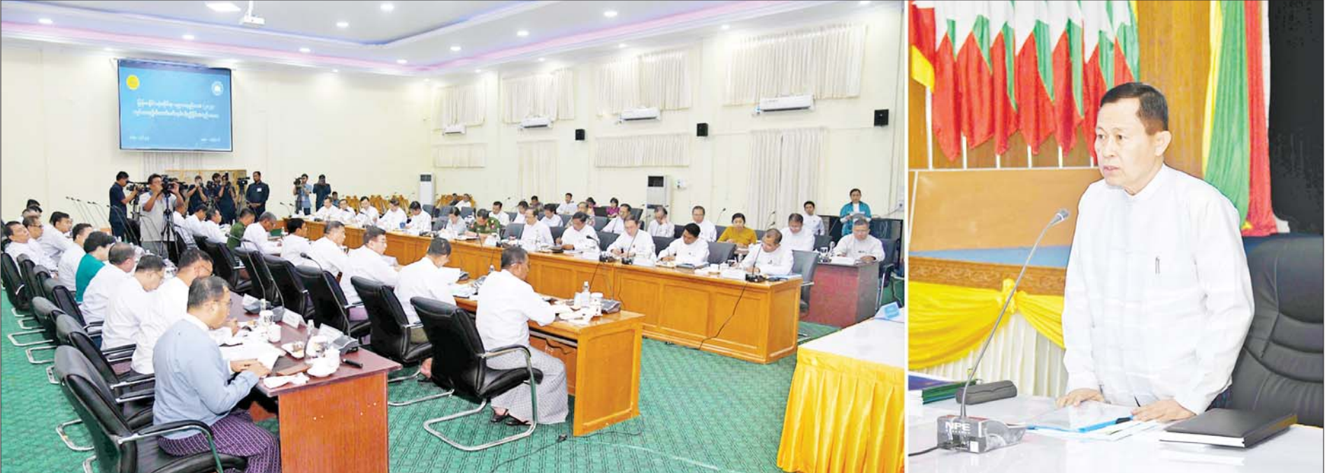
နိုင်ငံတော်စီမံအုပ်ချုပ်ရေးကောင်စီ ဒုတိယဥက္ကဋ္ဌ ဒုတိယဝန်ကြီးချုပ် ဒုတိယဗိုလ်ချုပ်မှူးကြီးစိုးဝင်း မြန်မာနိုင်ငံလုံးဆိုင်ရာပညာရေးညီလာခံ(၂၀၂၄) ကျင်းပရေး ဦးစီးကော်မတီ ညှိနှိုင်းအစည်းအဝေးတွင် အမှာစကားပြောကြားစဉ်။