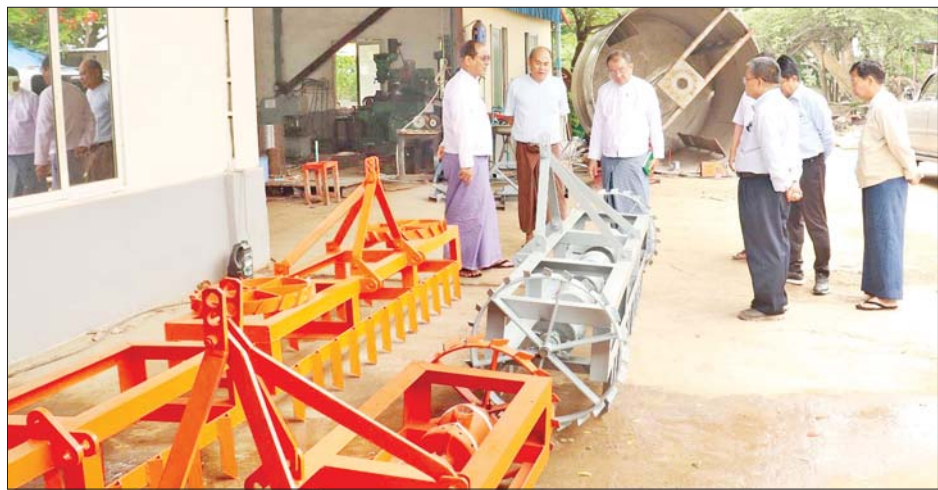
မြေပြုပြင်သည့်စနစ်များကို အသိပညာပေးဆောင်ရွက်ပေးကြရန်၊ စိုက်ပျိုးရေး လုံလောက်စွာရရှိနိုင်ရန်အတွက် ရေရရှိနိုင်သော အရင်းအမြစ်များ ရှာဖွေဖော်ထုတ်ပေးကြရန်နှင့် တောင်သူများ လက်တွေ့ထွန်ယက် စိုက်ပျိုးရာတွင် ဖြစ်ပေါ်လာနိုင်သည့် အခက်အခဲများကို သက်ဆိုင်ရာဌာနများ ပူးပေါင်း၍ ဝိုင်းဝန်းကူညီ ဆောင်ရွက်ပေးကြရန် ဆွေးနွေးမှာကြားသည်။ ဆက်လက်၍ ဒုတိယဝန်ကြီး

နေပြည်တော် ဇွန် ၁၂ စိုက်ပျိုးရေး၊ မွေးမြူရေးနှင့် ဆည်မြောင်းဝန်ကြီးဌာန ဒုတိယဝန်ကြီး ဦးဗိုလ်ဗိုလ်ကျော်သည် ယနေ့နံနက်ပိုင်းတွင် ပျဉ်းမနားမြို့နယ် သစ်လေးလုံးကျေးရွာ အုပ်စု ပုရွက်ဆိတ်ကုန်းရွာရှိ မိုးစပါး ငါးဧကစိုက်ခင်း၌ ထွန်စက်ကြီးဖြင့် တွဲဖက်သုံးမျိုးစေ့ချက်ရိယာ လက်တွေ့စိုက်ပျိုးနေမှုကို ကြည့်ရှုအားပေးပြီး ဒေသခံတောင်သူများနှင့် တွေ့ဆုံသည်။