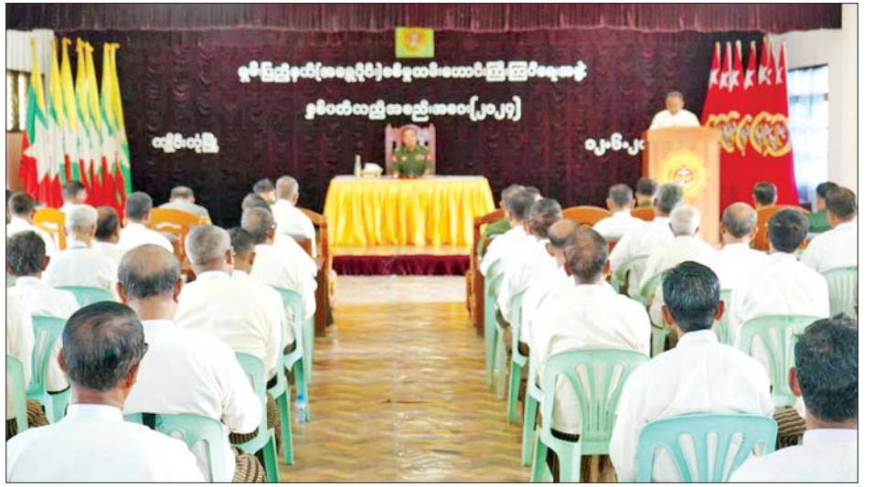
ရှမ်းပြည်နယ်(အရှေ့ပိုင်း)စစ်မှုထမ်းဟောင်းကြီးကြပ်ရေးအဖွဲ့ နှစ်ပတ်လည်အစည်းအဝေး(၂၀၂၄) ကျင်းပနေကြောင်း

ဦးစွာ တိုင်းမှူးက အမှာစကားပြောကြားသည်။ ထို့နောက် တိုင်းမှူးနှင့် တာဝန်ရှိသူများက စစ်မှုထမ်းဟောင်းအဖွဲ့ဝင်များ၏ တင်ပြချက်များအပေါ် လိုအပ်သည်များ ညှိနှိုင်းဆောင်ရွက်ပေးကာ စစ်မှုထမ်းဟောင်းအဖွဲ့ဝင်များအတွက် ထောက်ပံ့ငွေနှင့် စားသောက်ဖွယ်ရာများ ပေးအပ်သည်။ ယင်းနောက် ရှမ်းပြည်နယ်(အရှေ့ပိုင်း) စစ်မှုထမ်းဟောင်းကြီးကြပ်ရေးအဖွဲ့ နှစ်ပတ်လည်အစည်းအဝေး(၂၀၂၄)ကို ဆက်လက်ကျင်းပခဲ့ကြောင်း သိရသည်။