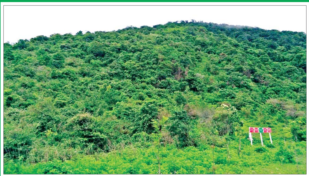
ရုန်းတောင်ကြိုးပြင်ကာကွယ်တော သဘာဝရှုခင်းကို တွေ့ရစဉ်။