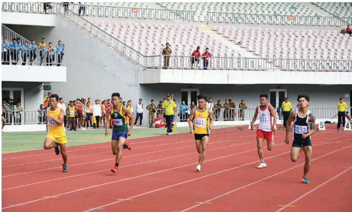
တပ်မတော်(ကြည်း၊ ရေ၊ လေ) အားကစားပြိုင်ပွဲတွင် အပြေးပြိုင်ပွဲ ယှဉ်ပြိုင်နေမှုကို တွေ့ရစဉ်။