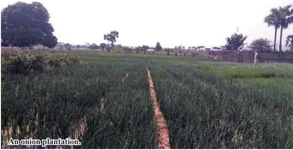
An onion plantation.