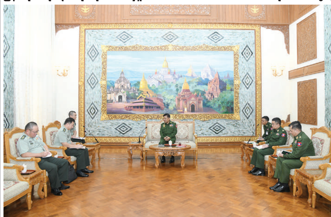
ညှိနှိုင်းကွပ်ကဲရေးမှူး(ကြည်း၊ ရေ၊ လေ) ဗိုလ်ချုပ်ကြီးမောင်မောင်အေး မြန်မာနိုင်ငံဆိုင်ရာ တရုတ်နိုင်ငံစစ်သံမှူး Senior Colonel Qu Zhe ဦးဆောင်သော ကိုယ်စားလှယ်အဖွဲ့ကို လက်ခံတွေ့ဆုံစဉ်။

နေပြည်တော် စက်တင်ဘာ ၂၆ ကိုယ်စားလှယ်အဖွဲ့ကို ယနေ့မွန်းလွဲပိုင်း ရင်းနှီးမှုနှင့်ဆက်ဆံရေးတိုးတက်ကောင်း ညှိနှိုင်းကွပ်ကဲရေးမှူး (ကြည်း၊ ရေ၊ လေ) ဗိုလ်ချုပ်ကြီးမောင်မောင်အေးသည် တွင် နေပြည်တော်ရှိ ဘုရင့်နောင်ရိပ်သာ ဧည့်ခန်းမဆောင်၌ လက်ခံတွေ့ဆုံသည်။ မွန်လျက်ရှိသည့်အခြေအနေများ၊ နှစ်နိုင်ငံ လေ့ကျင့်ရေးပိုင်းဆိုင်ရာများနှင့် စစ်ဘက် ဆိုင်ရာများတွင် မြန်မာနိုင်ငံဆိုင်ရာ တရုတ်နိုင်ငံစစ်သံမှူး Senior Colonel Qu Zhe ဦးဆောင်သော တပ်မတော်နှစ်ရပ်ကြား ချစ်ကြည် စာမျက်နှာ ၁၆ ကော်လံ ၁ □