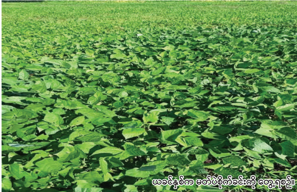
ဖာခင်နှစ်က မတ်ပဲစိုက်ခင်းတို့ တွေ့ရပုံ။

ကောလင်း စက်တင်ဘာ ၂၆ စစ်ကိုင်းတိုင်းဒေသကြီးကောလင်းခရိုင်တွင် လာမည့် ဆောင်းသီးနှံစိုက်ပျိုးရာသီ၌ မတ်ပဲ ၃၉၈၂ ဧက စိုက်ပျိုးမည်ဖြစ်ကြောင်း ကောလင်းခရိုင် စိုက်ပျိုးရေးဦးစီးဌာနမှ သိရသည်။