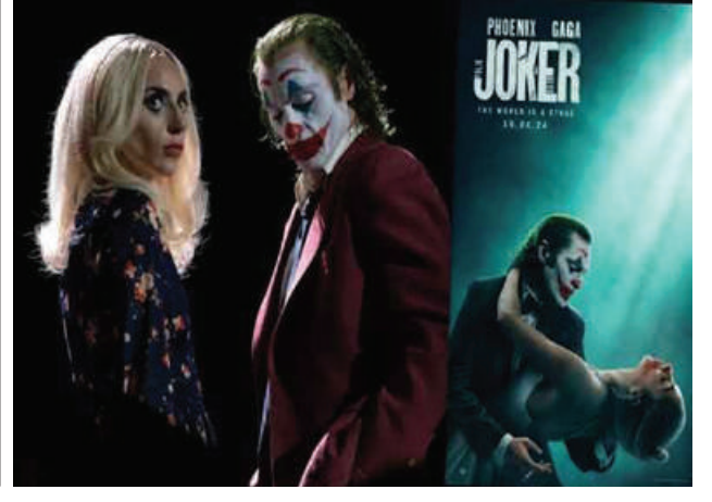
Ref : Russia Today Trs : KKO

ဈေးကွက်၌ ရုံတင်ပြသခွင့်မရခဲ့ ကြောင်း သိရသည်။ သို့ရာတွင် ၎င်းဇာတ်ကား၏ နောက်ဆက်တွဲ Jokes : Folie a Deux ဇာတ်ကားကိုမူ တရုတ် ရုပ်ရှင်ဈေးကွက်၌ အောက်တို ဘာ ၁၆ ရက်မှစ၍ ရုံတင်ပြသ ရန် ဝါနာဘရားသား ရုပ်ရှင် ကုမ္ပဏီက စီစဉ်ထားကြောင်း သိရသည်။ Joker : Folie a Deux ဇာတ် ကားကို အောက်တိုဘာ ၄ ရက် တွင် အမေရိကန် ပြည်တွင်း ရုပ်ရှင်ဈေးကွက်၌ စတင်ရုံတင် ပြသမည်ဖြစ်ကြောင်း ဝါနာဘရား သားရုပ်ရှင်ကုမ္ပဏီက စီစဉ်ထား ကြောင်း သိရသည်။