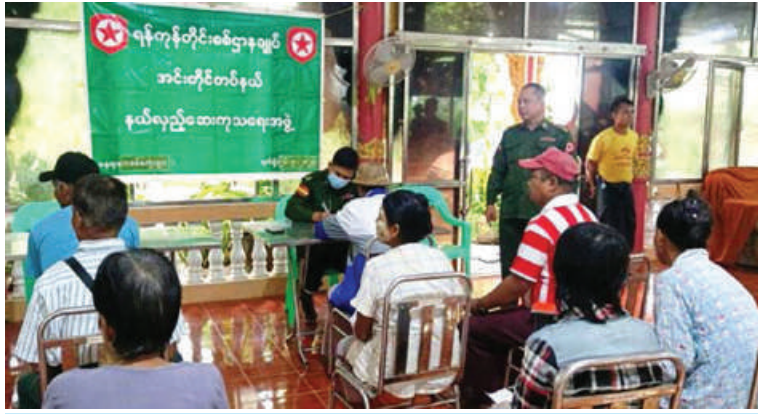
ရန်ကုန်တိုင်းစစ်ဌာနချုပ် နယ်လှည့်ဆေးကုသရေးအဖွဲ့က ဒေသခံပြည်သူများကို ကျန်းမာရေးစောင့်ရှောက်မှုလုပ်ငန်းများ ဆောင်ရွက်ပေးစဉ်။

နေပြည်တော် စက်တင်ဘာ ၂၆ ကချင်ပြည်နယ် မြစ်ကြီးနားမြို့ပေါ်ရှိ သံဃာတော်များအား ယနေ့နံနက်ပိုင်းတွင် မြောက်ပိုင်းတိုင်းစစ်ဌာနချုပ် နယ်လှည့်ဆေးကုသရေးအဖွဲ့က အဆိုပါမြို့ရှိ ခေမာသီဝံ ပရိယတ္တိကျောင်းတိုက်၌ ကျန်းမာရေး စောင့်ရှောက်မှုလုပ်ငန်းများ ဆောင်ရွက်ပေးသည်။ ထိုသို့ဆောင်ရွက်ပေးရာတွင်