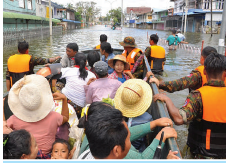
နယ်မြေခံတပ်မတော်သားများ၊ မြန်မာနိုင်ငံရဲတပ်ဖွဲ့ဝင်များက လွိုင်ကော်မြို့နယ် အတွင်းရှိ ရေဘေးသင့်ဒေသခံပြည်သူများအား ကူညီကယ်ဆယ်ရေးလုပ်ငန်းများ ဆောင်ရွက်စဉ်။

နှင့် သန့်ရှင်းရေးလုပ်ငန်းများ ဆောင်ရွက် ပေးခြင်း၊ လမ်း၊ တံတားများ၊ ရပ်ကွက်၊ ကျေးရွာများအတွင်း၌ တင်ကျန်ခဲ့သည့် များကို တပ်မတော်သားများ၊ မြန်မာနိုင်ငံ နန်းများ၊ သစ်ပင်သစ်ကိုင်းများ ဖယ်ရှား ပေးခြင်းအပါအဝင် အခြားလိုအပ်သည့် များကို တပ်မတော်သားများ၊ မြန်မာနိုင်ငံ