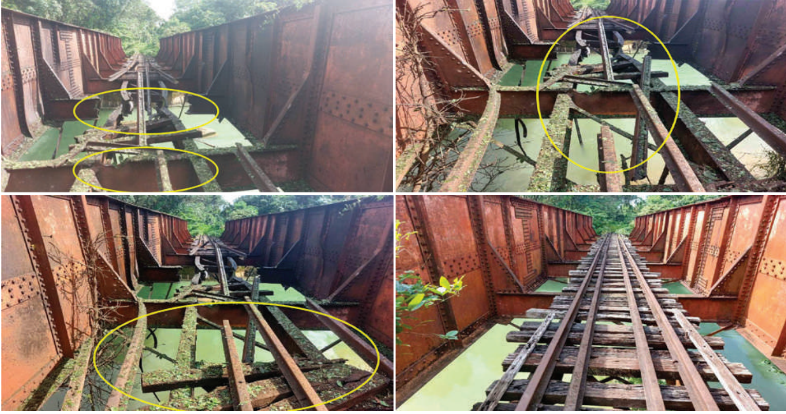
ရေး-ထားဝယ်ရထားလမ်းပိုင်းအတွင်း တနင်္သာရီတိုင်းဒေသကြီး ထားဝယ်မြို့နယ် ရေဖြူနှင့်ထားဝယ်ဘူတာကြား တံတားအမှတ်(၆၀၆) မောင်မယ်ရှောင်တံတား မိုင်းခွဲဖျက်ဆီးခံထားရမှု မှတ်တမ်းဓာတ်ပုံ။

နေပြည်တော် စက်တင်ဘာ ၂၆ တနင်္သာရီတိုင်းဒေသကြီး ရေး-ထားဝယ် ရထားလမ်းပိုင်းအတွင်း ထားဝယ်မြို့နယ် ရေဖြူဘူတာနှင့် ထားဝယ်ဘူတာကြား မိုင်တိုင်အမှတ်၂၆၄/၁၁-၁၂ ရှိ တံတား အမှတ်(၆၀၆) မောင်မယ်ရှောင်တံတားကို စက်တင်ဘာ ၂၅ ရက် ညနေပိုင်းတွင် အကြမ်းဖက်သောင်းကျန်းသူအဖွဲ့က မိုင်းခွဲ ဖျက်ဆီးမှုကြောင့် တံတား၏အောက်ခံ