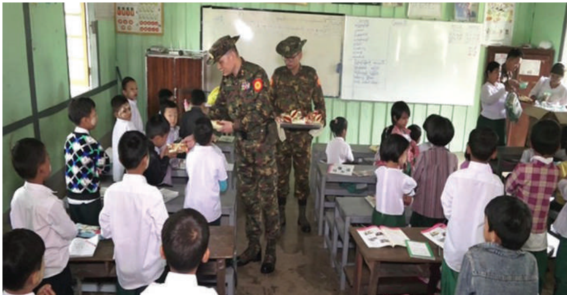
အရှေ့ပိုင်းတိုင်းစစ်ဌာနချုပ် တိုင်းမှူး ဗိုလ်ချုပ်ဇော်မင်းလတ် ရေကြီးမှုဖြစ်ပေါ်ခဲ့သည့် လွိုင်ကော်မြို့ရှိ စာသင်ကျောင်းများမှ ကျောင်းသား၊ ကျောင်းသူများအား စားသောက်ဖွယ်ရာများ ပေးအပ်စဉ်။

နေပြည်တော် စက်တင်ဘာ ၂၆ နေပြည်တော်ကောင်စီနယ်မြေ အပါအဝင် တိုင်းဒေသကြီးနှင့် ပြည်နယ်များရှိ ရေကြီးရေလျှံမှုဖြစ်ပေါ်ခဲ့သည့် ရပ်ကွက်၊ ကျေးရွာများတွင် ကူညီကယ်ဆယ်ရေး လုပ်ငန်းများနှင့် ပြန်လည်ထူထောင်ရေး လုပ်ငန်းများကို အင်တိုက်အားတိုက် တက်ကြွစွာ ပူးပေါင်းဆောင်ရွက်ပေးလျက် ရှိရာ ယနေ့တွင်လည်း နေပြည်တော် ကောင်စီနယ်မြေ ဇေယျာသီရိမြို့နယ်၊ ပျဉ်းမနားမြို့နယ်၊ တပ်ကုန်းမြို့နယ်၊ လယ်ဝေးမြို့နယ်၊ ပုဗ္ဗသီရိမြို့နယ်တို့တွင် လည်းကောင်း၊ ရှမ်းပြည်နယ်(တောင်ပိုင်း) ကလေးမြို့နယ်နှင့် ကယားပြည်နယ်၊ လွိုင်ကော်မြို့နယ်တွင်လည်းကောင်း၊ ပဲခူး တိုင်းဒေသကြီး တောင်ငူမြို့နယ်တွင် လည်းကောင်း ဘုန်းတော်ကြီးကျောင်း များ၊ စာသင်ကျောင်းများ၊ ဆေးရုံ၊ ဆေးခန်း များ၊ ဌာနဆိုင်ရာအဆောက်အအုံများတွင် လိုအပ်သည်များ ကူညီရွှေ့ပြောင်းပေးခြင်း