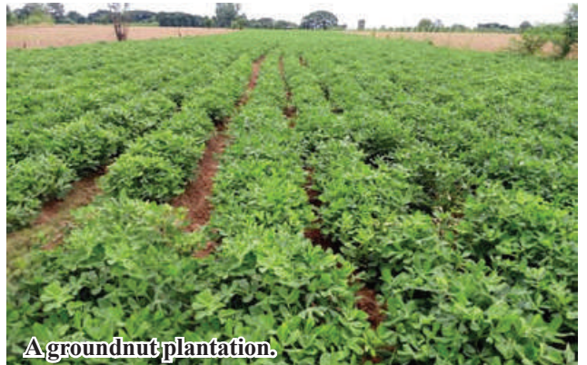
A groundnut plantation.