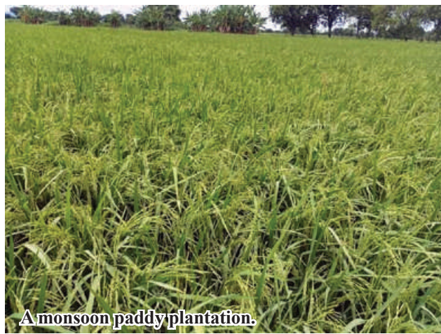
A monsoon paddy plantation.

This year, officials of Township Agriculture Department and local farmers cooperate with each other in systematically grow monsoon paddy without difficulties. Officials of Township Agriculture Department helped local farmers with agricultural techniques, prevention of pests, minimizing