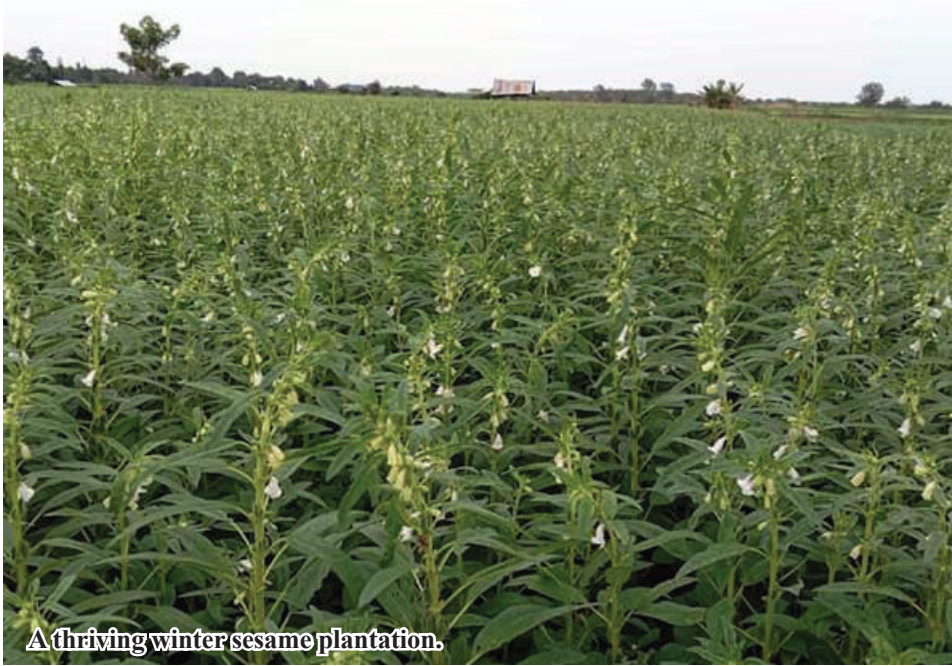
A thriving winter sesame plantation.

Budalin September 26 Budalin Township Agriculture Department stated that the township authorities plan to grow 15,680 acres of winter sesame in Budalin Township of Sagaing Region this year. In 2024-25 winter, local farmers will start cultivation of winter sesame on 15,680 acres of croplands in October till December.