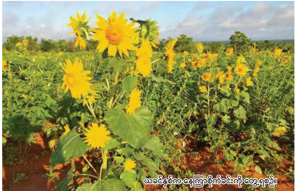
ယခင်နှစ်က နေကြာစိုက်ခင်းကို တွေ့ရစဉ်။

ဝက်လက် စက်တင်ဘာ ၂၆ ရာသီ၌ ဝက်လက်မြို့နယ်တွင် စစ်ကိုင်းတိုင်းဒေသကြီး ရွှေဘို နေကြာ ၄၄၃၃ ဧကစိုက်ပျိုးရန် ခရိုင် ဝက်လက်မြို့နယ်တွင် လျာထားပြီး ယခုနှစ် အောက်တို ယခုနှစ်ဆောင်းသီးနှံစိုက်ပျိုးရာသီ ဘာလမှစ၍ ဒီဇင်ဘာလထိ ဌာနဆိုင်ရာသီးနှံစိုက်ပျိုးရာသီ စိုက်ပျိုးမည်ဖြစ်ကြောင်း သိရသည်။ ဝက်လက်မြို့နယ်စိုက်ပျိုးရေးဦးစီး "ဒီနှစ် ဆောင်းသီးနှံစိုက်ပျိုး ရာသီမှာ ဝက်လက်မြို့နယ်အတွင်း ရာသီမှာ ဝက်လက်မြို့နယ်အတွင်း ဌာနမှ သိရသည်။ နေကြာဧက ၄၀၀၀ ကျော် စိုက်ပျိုး ယခုနှစ် ဆောင်းသီးနှံစိုက်ပျိုး ဖို့လျာထားပါတယ်။ လျာထား