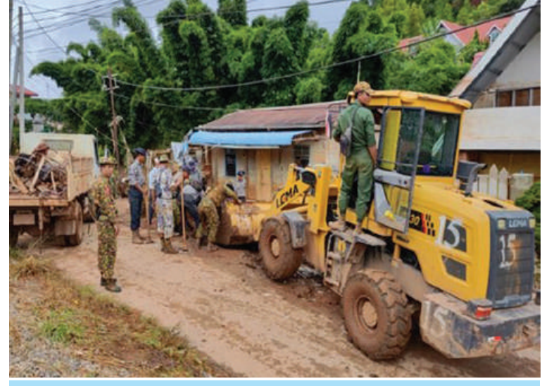
နယ်မြေခံတပ်မတော်သားများ၊ မြန်မာနိုင်ငံရဲတပ်ဖွဲ့ဝင်များ၊ မီးသတ်တပ်ဖွဲ့ဝင်များက ကလေးမြို့၌ ရေကျဆင်းသွားသဖြင့် တင်ကျန်ခဲ့သောနန်းများ၊ အမှိုက်သရိုက်များအား ဖယ်ရှား ရှင်းလင်းပေးစဉ်။

အလားတူ ရေကြီးမှုကြောင့် ပျက်စီးမှု များဖြစ်ပေါ်ခဲ့သည့် လမ်း၊ တံတားများ ကိုလည်း လမ်းပန်းဆက်သွယ်ရေး အမြန် ပြန်လည်ကောင်းမွန်စေရန်အတွက် ကြိုးပမ်းဆောင်ရွက်လျက်ရှိရာ ပျက်စီးခဲ့ သည့် လမ်း၊ တံတားများကိုလည်း ယာယီ သံပေါင်ဘေလီတံတားများ အစားထိုး၍ အမြန်ဆုံး ပြန်လည်ပြင်ဆင်ဆောင်ရွက် ပေးလျက်ရှိကြောင်းနှင့် ပြုပြင်ရန်ကျန်ရှိ နေသည့် တံတားများကိုလည်း အမြန်ဆုံး ဆက်လက်ပြုပြင် ဆောင်ရွက်လျက်ရှိ ကြောင်း သတင်းရရှိသည်။ (၅၀၁)