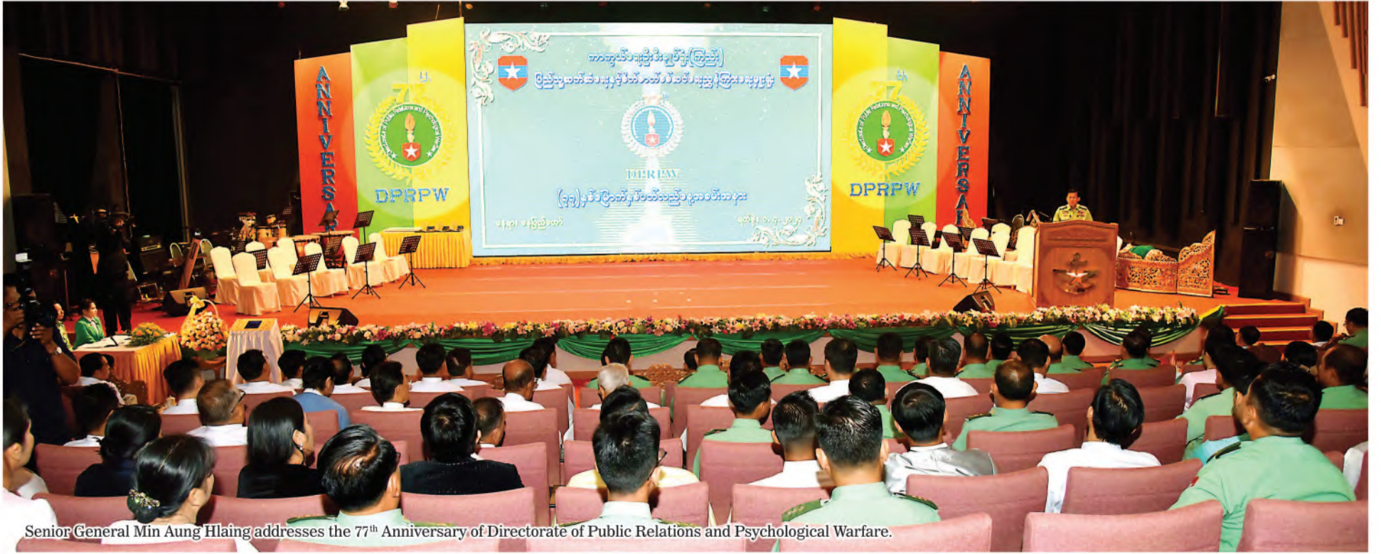
Senior General Min Aung Hlaing addresses the 77 th Anniversary of Directorate of Public Relations and Psychological Warfare.

The Directorate of Public Relations and Psychological Warfare of the Office of the Commander-in-Chief (Army) marked the 77 th Anniversary celebration at the No 1 Tatmadaw TV broadcasting unit in Taungnyo of Ottarathiri Township of Nay Pyi Taw Council Area this afternoon, with an address by Chairman of the State Administration Council Commander-in-Chief of Defence Services Senior General Min Aung Hlaing.