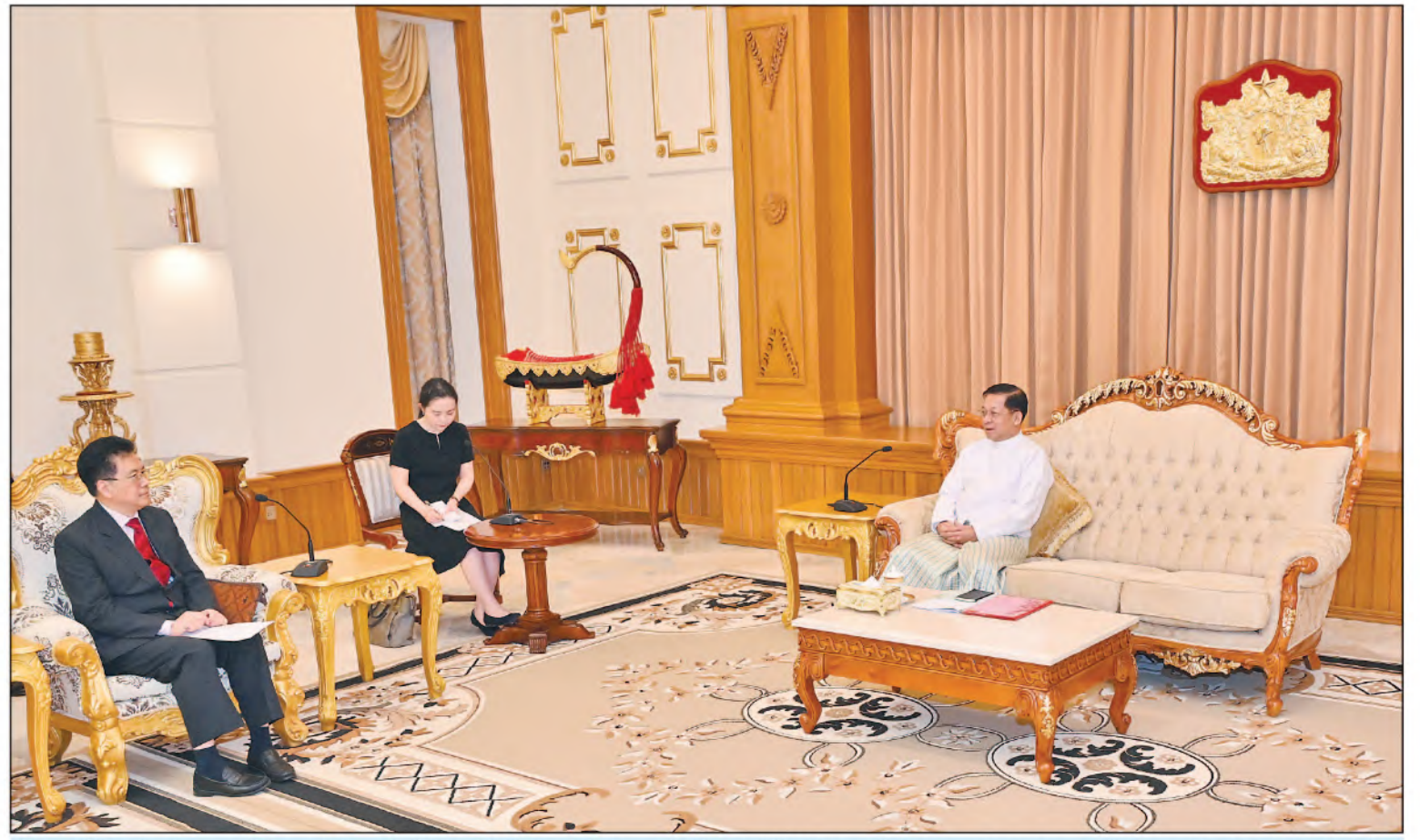
နိုင်ငံတော်စီမံအုပ်ချုပ်ရေးကောင်စီဥက္ကဋ္ဌ နိုင်ငံတော်ဝန်ကြီးချုပ် ဗိုလ်ချုပ်မှူးကြီးမင်းအောင်လှိုင် တရုတ်နိုင်ငံခြားရေးဝန်ကြီးဌာန၊ အာရှရေးရာအထူးကိုယ်စားလှယ် H.E. Mr. Deng Xijun အား လက်ခံတွေ့ဆုံပွဲ။

နေပြည်တော် ဧပြီ ၁ နိုင်ငံတော်စီမံအုပ်ချုပ်ရေးကောင်စီ ဥက္ကဋ္ဌ နိုင်ငံတော်ဝန်ကြီးချုပ် ဗိုလ်ချုပ်မှူးကြီးမင်းအောင်လှိုင်သည် တရုတ်နိုင်ငံခြားရေးဝန်ကြီးဌာန၊ အာရှရေးရာအထူးကိုယ်စားလှယ် H.E. Mr. Deng Xijun အား ယနေ့နံနက်ပိုင်းတွင် နေပြည်တော်ရှိ နိုင်ငံတော်စီမံအုပ်ချုပ်ရေးကောင်စီဥက္ကဋ္ဌရုံး၊ ဧည့်ခန်းမ၌ လက်ခံတွေ့ဆုံသည်။ အဆိုပါတွေ့ဆုံပွဲသို့ နိုင်ငံတော်စီမံအုပ်ချုပ်ရေးကောင်စီဥက္ကဋ္ဌ နိုင်ငံတော်ဝန်ကြီးချုပ်နှင့်အတူ ကောင်စီတွဲဖက်အတွင်းရေးမှူး ဒုတိယဗိုလ်ချုပ်ကြီးရဲဝင်းဦး၊ နိုင်ငံခြားရေးဝန်ကြီးဌာန ပြည်ထောင်စုဝန်ကြီး ဦးသန်းဆွေ၊ အမျိုးသားစည်းလုံးညီညွတ်ရေးနှင့် ငြိမ်းချမ်းရေးဖော်ဆောင်မှုညွှန်ကြားရေးကော်မတီဥက္ကဋ္ဌ ဒုတိယဗိုလ်ချုပ်ကြီးထွန်းထွန်းနောင်နှင့် တာဝန်ရှိသူများတက်ရောက်ကြပြီး တရုတ်နိုင်ငံခြားရေးဝန်ကြီးဌာန၊ အာရှရေးရာအထူးကိုယ်စားလှယ်နှင့်အတူ မြန်မာနိုင်ငံဆိုင်ရာ တရုတ်နိုင်ငံသံရုံးမှ တာဝန်ရှိသူများ တက်ရောက်ကြသည်။ ထိုသို့တွေ့ဆုံရာတွင် နယ်စပ်ဒေသနှင့် ပြည်တွင်းတည်ငြိမ်အေးချမ်းရေးအတွက် နိုင်ငံတော်မှ စာမျက်နှာ ၅ ကော်လံ ၁ ★