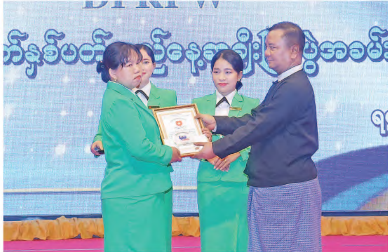
ပြည်သူ့ဆက်ဆံရေးနှင့် စိတ်ဓာတ်စစ်ဆင်ရေးညွှန်ကြားရေးမှူးရုံး၊ ညွှန်ကြားရေးမှူး ဗိုလ်ချုပ်ဇော်မင်းထွန်းက မြဝတီသတင်းစာတိုက်မှ ထူးချွန်ဆုရရှိသူတစ်ဦးအား ဂုဏ်ပြုမှတ်တမ်းလွှာနှင့်ဆုပေးအပ်ချီးမြှင့်စဉ်။

အလင်းမဂ္ဂဇင်းတို့တွင် အကောင်းဆုံးကာတွန်းဆု၊ ကဗျာဆု၊ ဆောင်းပါးဆု၊ ဝတ္ထုတိုဆုနှင့် ဝတ္ထုရှည်ဆုရရှိသူများကိုလည်း ကောင်း။ ပြည်သူ့ဆက်ဆံရေးနှင့် စိတ်ဓာတ်စစ်ဆင်ရေးညွှန်ကြားရေးမှူးရုံး၊ ညွှန်ကြားရေးမှူးက သင်္ဃာတင်လွှာတွင် (၂၀) နှစ်တိုင် တာဝန်ထမ်းဆောင်ခဲ့ကြသည့် ဝန်ထမ်းများ၊ မြဝတီသတင်းစာတိုက်နှင့် ရတနာပုံသတင်းစာတိုက်တို့တွင် (၁၀)နှစ်တိုင် တာဝန်ထမ်းဆောင်ခဲ့ကြသည့် ဝန်ထမ်းများနှင့် ထူးချွန်ဆုရ အရာရှိ၊ စစ်သည်၊ ဝန်ထမ်းများကိုလည်းကောင်း ဆုများအသီးသီးပေးအပ်ချီးမြှင့်သည်။ အခမ်းအနားအပြီးတွင် တက်ရောက်လာကြသည့် တပ်မတော်အရာရှိကြီးများနှင့် ဧည့်သည်တော်များအား ဂုဏ်ပြုညစာဖြင့် တည်ခင်းဧည့်ခံခဲ့ကြောင်း သတင်းရရှိသည်။ (၁၀၀)