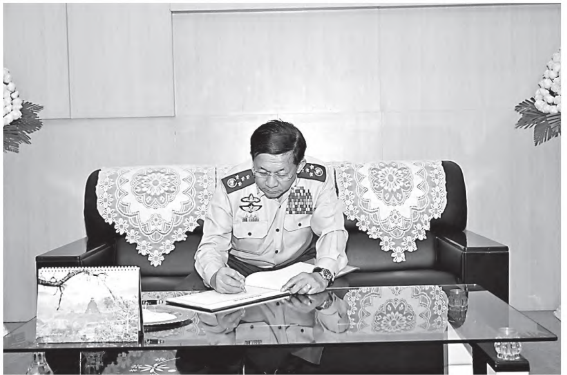
Senior General Min Aung Hlaing signs the guest's book.

As corps of public relations and psychological warfare are units formed with intellectuals and technicians based on artistic nature, unity in the units is important. It is necessary to perform assigned duties responsibly pivoting not on strengths of individuals but on team work. Efforts must be made to consolidate national pride of the country, the Tatmadaw and the entire national people by integrating correct consciousness and firm convictions and power of skills each one of you has learnt.