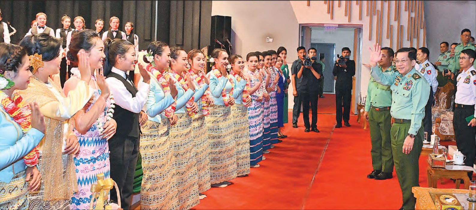
နိုင်ငံတော်စီမံအုပ်ချုပ်ရေးကောင်စီဥက္ကဋ္ဌ တပ်မတော်ကာကွယ်ရေးဦးစီးချုပ် ဗိုလ်ချုပ်မှူးကြီးမင်းအောင်လှိုင် အနုပညာရှင်များနှင့်ဖျော်ဖြေရေးအဖွဲ့များအား ရင်းရင်းနှီးနှီးနှုတ်ဆက်စဉ်။

ဆောင်ခဲ့ကြသည့် အငြိမ်းစားတပ်မတော် အရာရှိကြီးများ၊ ပြန်ကြားရေးဝန်ကြီးဌာနမှ တာဝန်ရှိသူများ၊ မြန်မာနိုင်ငံသတင်းမီဒီယာ ကောင်စီ၊ မြန်မာနိုင်ငံဂီတအစည်းအရုံး၊