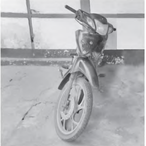
စစ်ကိုင်းတိုင်းဒေသကြီး၌ ဖမ်းဆီးရမိမှု။

ထို့အတူ မတ်လ ၃၁ ရက်တွင် မန္တလေး တိုင်းဒေသကြီး တရားမဝင်ကုန်သွယ်မှု တိုက်ဖျက်ရေးအထူးအဖွဲ့၏ စီမံခန့်ခွဲမှုဖြင့် တာဝန်ကျပူးပေါင်းအဖွဲ့က စစ်ဆေးမှုများ ဆောင်ရွက်ခဲ့ရာ ရွှေကျင်ပူးပေါင်းစစ်ဆေး ရေးဂိတ်၌ ဆီသယ်ယာဉ်(၁)စီးပေါ်မှ တရားမဝင်စက်သုံးဆီ ဒီဇယ်ဆီ ၈၀လီနီ (၄၀၀) (ခန့်မှန်းတန်ဖိုးငွေကျပ် ၄၄၅၅၀၀)