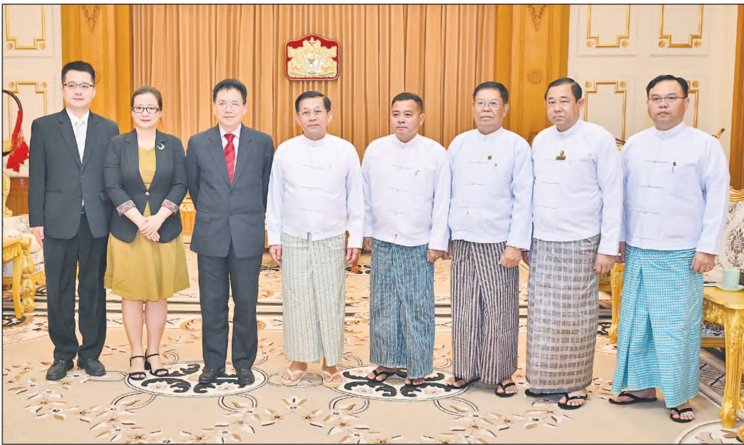
နိုင်ငံတော်စီမံအုပ်ချုပ်ရေးကောင်စီဥက္ကဋ္ဌ နိုင်ငံတော်ဝန်ကြီးချုပ် ဗိုလ်ချုပ်မှူးကြီးမင်းအောင်လှိုင် တရုတ်နိုင်ငံခြားရေးဝန်ကြီးဌာန၊ အာရှရေးရာအထူးကိုယ်စားလှယ် H.E. Mr. Deng Xijun တို့ တက်ရောက်လာကြသူများနှင့်အတူ မှတ်တမ်းတင်စုပေါင်းဓာတ်ပုံရိုက်စဉ်။