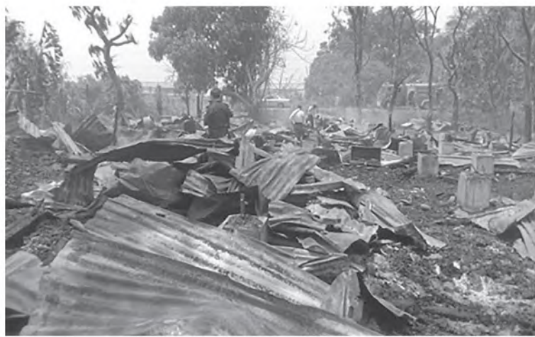
တောင်ငူမြို့နယ်၊ ညောင်ကိုင်းတက္ကသိုလ်ဝင်းအတွင်းရှိ ဝန်ထမ်းအိမ်ရာမီးလောင်ဆုံးရှုံးမှုကို တွေ့ရစဉ်။

မီးလောင်မှုဖြစ်ပွားရာနေရာသို့ မီးသတ် တပ်ဖွဲ့ဝင်များ၊ လူမှုရေးအသင်းအဖွဲ့များနှင့် ဒေသခံပြည်သူများက မီးသတ်ယာဉ် ၁ စီး၊ ရေသယ်ယာဉ် ၂ စီးနှင့် အုပ်ချုပ်မှုယာဉ် ၁ စီး တို့ဖြင့် ဝိုင်းဝန်းမီးငြိမ်းသတ်ခဲ့ရာ နံနက် ၁၀ နာရီ ၅ မိနစ်ခန့်တွင် မီးငြိမ်းသွားခဲ့ သည်။ အဆိုပါမီးလောင်မှုကြောင့် တက္ကသိုလ် ကျောင်းဝင်းအတွင်းရှိ စခန်းတွဲ ဝန်ထမ်း အိမ်ရာတစ်လုံးမီးလောင်ဆုံးရှုံးခဲ့ပြီး လူနှင့် တိရစ္ဆာန်ထိခိုက်ဒဏ်ရာရရှိမှုမရှိကြောင်း နှင့် မီးလောင်မှုနှင့်ပတ်သက်၍ တာဝန်ရှိ သူအား တောင်ငူမြို့မရဲစခန်းမှ အမှုဖွင့် အရေးယူထားကြောင်း သတင်းရရှိသည်။ (၁၀၀)