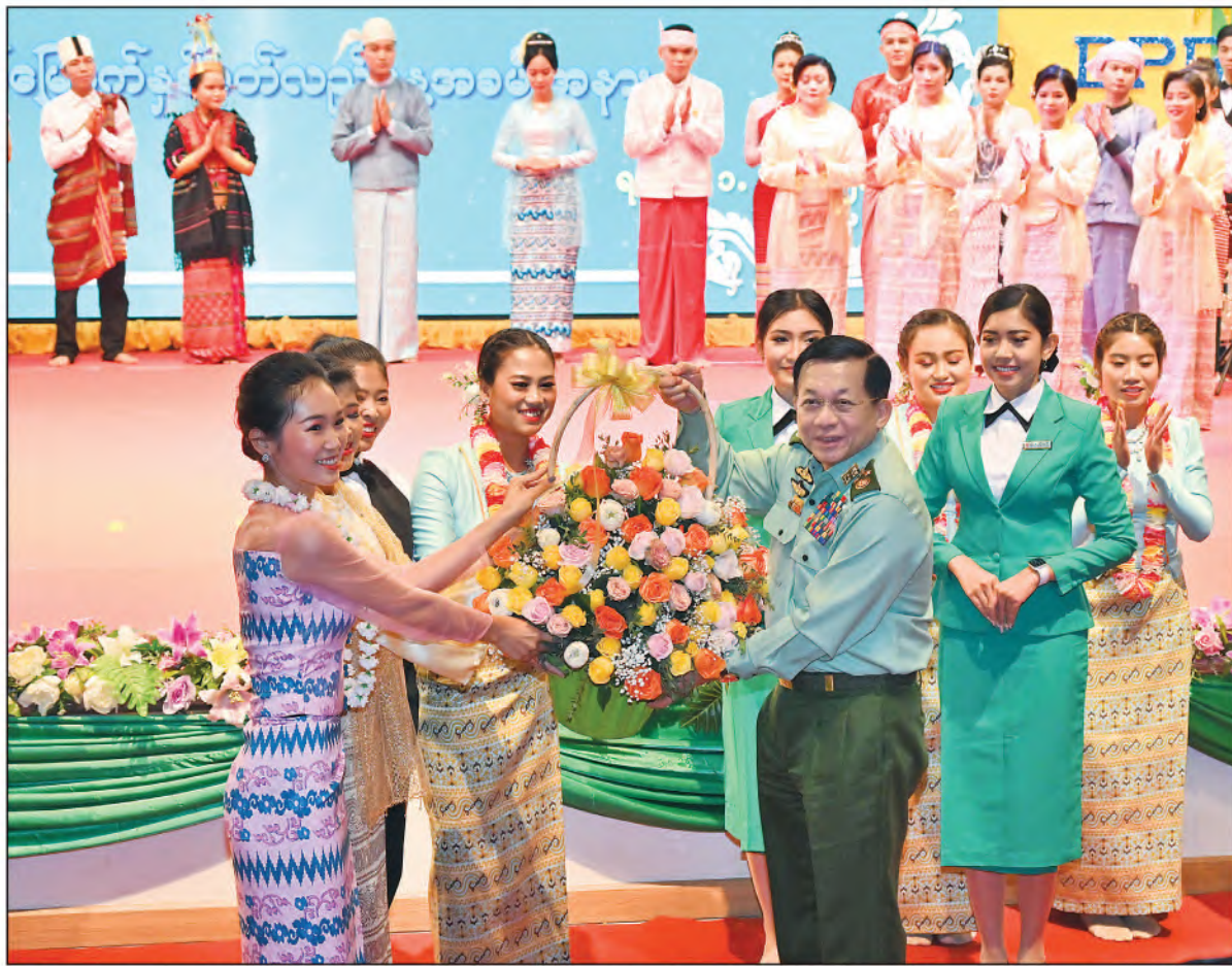
နိုင်ငံတော်စီမံအုပ်ချုပ်ရေးကောင်စီဥက္ကဋ္ဌ တပ်မတော်ကာကွယ်ရေးဦးစီးချုပ် ဗိုလ်ချုပ်မှူးကြီးမင်းအောင်လှိုင် ဖျော်ဖြေတင်ဆက်ခဲ့ကြသည့် အနုပညာရှင်များနှင့်ဖျော်ဖြေရေးအဖွဲ့များအား ဂုဏ်ပြုပန်းခြင်းပေးအပ်စဉ်။

တွင်ထည့်သွင်းခြင်း Video Clip ကို ကြည့်ရှုကြသည်။ ယင်းနောက် မြဝတီရုပ်မြင်သံကြားမှ ဝန်ထမ်းများက “အောင်လံလွှင့်ချီ ကတ ပြည်” တေးသီချင်းဖြင့် သီဆိုကပြဖျော်ဖြေ တင်ဆက်ကြပြီး (၇၇)နှစ်မြောက် ပြည်သူ့ ဆက်ဆံရေးနှင့် စိတ်ဓာတ်စစ်ဆင်ရေး ညွှန်ကြားရေးမှူးရုံး နှစ်ပတ်လည်နေ့ မှတ်တမ်းဗီဒီယိုကိုပြသသည်။ အဆိုပါကာကွယ်ရေးဦးစီးချုပ်ရုံး(ကြည်း)၊ ပြည်သူ့ဆက်ဆံရေးနှင့် စိတ်ဓာတ်စစ်ဆင် ရေးညွှန်ကြားရေးမှူးရုံး (၇၇)နှစ်မြောက် နှစ်ပတ်လည်နေ့အခမ်းအနားသို့ နိုင်ငံတော် စီမံအုပ်ချုပ်ရေးကောင်စီဥက္ကဋ္ဌ တပ်မတော် ကာကွယ်ရေးဦးစီးချုပ်နှင့်အတူ ညွှန်ကြား ကွပ်ကဲရေးမှူး (ကြည်း၊ ရေ၊ လေ) ဗိုလ်ချုပ်ကြီး မောင်မောင်အေး၊ ကာကွယ်ရေးဦးစီးချုပ် (ရေ) ဒုတိယဗိုလ်ချုပ်ကြီးဇွဲဝင်းမြင့်၊ ကာကွယ် ရေးဦးစီးချုပ်(လေ) ဗိုလ်ချုပ်ကြီးထွန်းအောင်၊ ကောင်စီတွဲဖက်အတွင်းရေးမှူးနှင့်ကောင်စီဝင် များ၊ ပြည်ထောင်စုအဆင့်ပုဂ္ဂိုလ်များ၊ ကာကွယ်ရေးဦးစီးချုပ်ရုံးမှ အဆင့်မြင့် တပ်မတော်အရာရှိကြီးများ၊ ဒုတိယဝန်ကြီး များ၊ ကာကွယ်ရေးဦးစီးချုပ်ရုံး(ကြည်း)၊ ပြည်သူ့ဆက်ဆံရေးနှင့် စိတ်ဓာတ်စစ်ဆင် ရေးညွှန်ကြားရေးမှူးရုံးတွင် တာဝန်ထမ်း