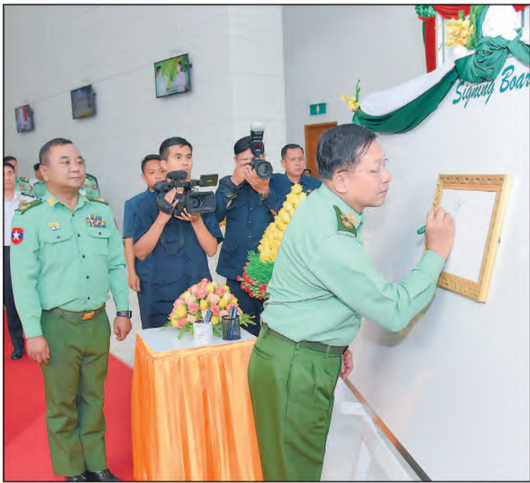
နိုင်ငံတော်စီမံအုပ်ချုပ်ရေးကောင်စီဥက္ကဋ္ဌ တပ်မတော်ကာကွယ်ရေးဦးစီးချုပ် ဗိုလ်ချုပ်မှူးကြီးမင်းအောင်လှိုင် ပြည်သူ့ဆက်ဆံရေးနှင့် စိတ်ဓာတ်စစ်ဆင်ရေး ညွှန်ကြားရေးမှူးရုံး (၇၇)နှစ်မြောက် နှစ်ပတ်လည်နေ့အခမ်းအနား Signing Board တွင် အမှတ်တရလက်မှတ်ရေးထိုးစဉ်။

ညီညွတ်ရေး၊ ရှေ့တန်းရောက်တပ်မတော် သားများ၏ တိုက်ပွဲဝင်စိတ်ဓာတ်များရှင်သန် နိုးကြားစေရေးတို့အတွက်လည်း သမိုင်း အဆက်ဆက်မှ ယနေ့ထက်တိုင်ကျေပွန်စွာ ထမ်းဆောင်နေကြသည်ကို တွေ့မြင်နေရဆဲ ဖြစ်ကြောင်း။