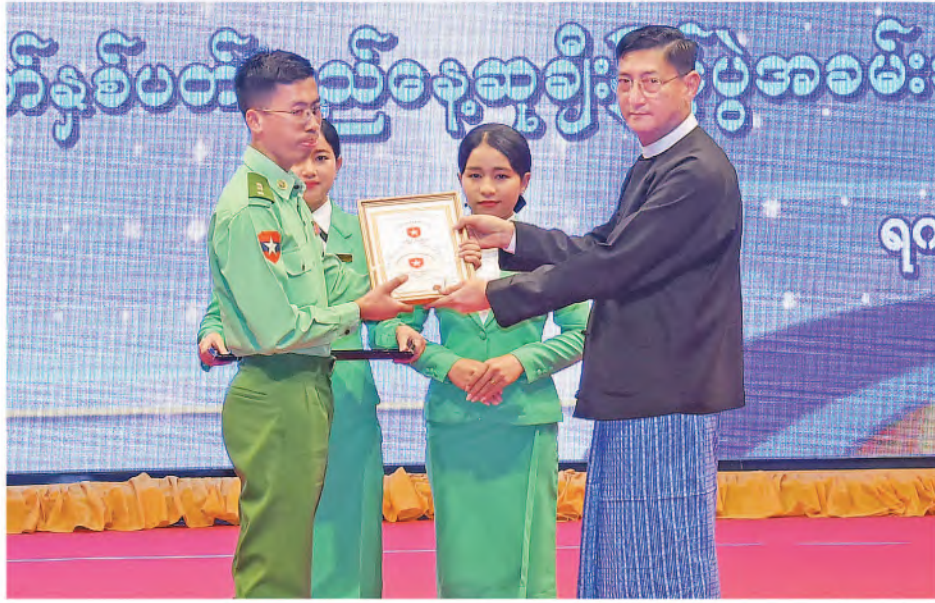
စိတ်ဓာတ်ရေးရာနှင့် လူထုဆက်ဆံရေးကော်မတီဥက္ကဋ္ဌ၊ စစ်ရေးချုပ် ဒုတိယဗိုလ်ချုပ်ကြီး စိုးမင်းဦးက ထူးချွန်ဆုရရှိသူ တစ်ဦးအား ဂုဏ်ပြုမှတ်တမ်းလွှာနှင့် ဆုပေးအပ်ချီးမြှင့်စဉ်။

မှူးရုံးတွင် တာဝန်ထမ်းဆောင်ခဲ့ကြသည့် အငြိမ်းစားတပ်မတော် အရာရှိကြီးများ၊ ပြည်သူ့ဆက်ဆံရေးနှင့် စိတ်ဓာတ်စစ်ဆင်ရေးညွှန်ကြားရေးမှူးရုံးကွပ်ကဲမှုအောက် တပ်၊ ကျောင်းများမှ ထူးချွန်ဆုရရှိခဲ့ကြသည့် အရာရှိ၊ စစ်သည်၊ အစားခန့်ဝန်ထမ်းများ၊ ဖိတ်ကြားထားသည့် ဧည့်သည်တော်များ တက်ရောက်ကြသည်။ ဦးစွာ စိတ်ဓာတ်ရေးရာနှင့် လူထုဆက်ဆံရေးကော်မတီဥက္ကဋ္ဌ၊ စစ်ရေးချုပ် ဒုတိယဗိုလ်ချုပ်ကြီးစိုးမင်းဦးက ဂုဏ်ပြုအမှာစကားပြောကြားသည်။ ထို့နောက် ဆုချီးမြှင့်ခြင်းအစီအစဉ်ကို ကျင်းပပြုလုပ်ရာ မြဝတီရပ်ခြင်းသံကြားတွင် (၁၀)နှစ်တိုင် တာဝန်ထမ်းဆောင်ခဲ့ကြသည့် ဝန်ထမ်း