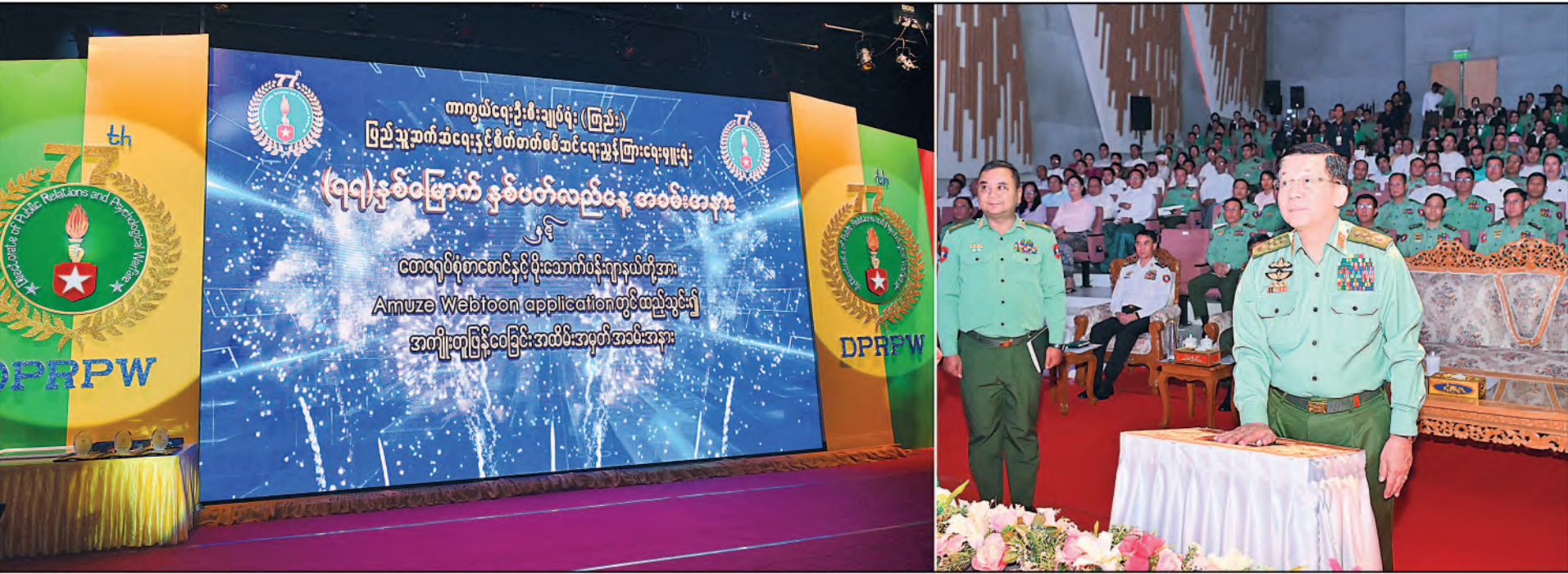
နိုင်ငံတော်စီမံအုပ်ချုပ်ရေးကောင်စီဥက္ကဋ္ဌ တပ်မတော်ကာကွယ်ရေးဦးစီးချုပ် ဗိုလ်ချုပ်မှူးကြီးမင်းအောင်လှိုင် ကာကွယ်ရေးဦးစီးချုပ်ရုံး(ကြည်း)၊ ပြည်သူ့ဆက်ဆံရေးနှင့် စိတ်ဓာတ်စစ်ဆင်ရေးညွှန်ကြားရေးမှူးရုံး (၇၇)နှစ်မြောက် နှစ်ပတ်လည်နေ့ အခမ်းအနားနှင့် မြဝတီစာပေတိုက်မှ ထုတ်ဝေလျက်ရှိသည့် တေဇရဝန်စာစောင်နှင့်မိုးသောက်ပန်းဂျာနယ်တို့အား Amuze Webtoon Application တွင် ထည့်သွင်းခြင်းတို့ကို Digital နည်းပညာအသုံးပြု၍ ဖွင့်လှစ်ပေးစဉ်။

ပေးအပ်လာသည့်တာဝန်အရပ်ရပ်အပေါ် တစ်ဦးတစ်ယောက်ကောင်းအားထက် စုပေါင်းအားကို အဓိကမဏ္ဍိုင်ပြုပြီး ကျေပွန်အောင်ထမ်းဆောင်