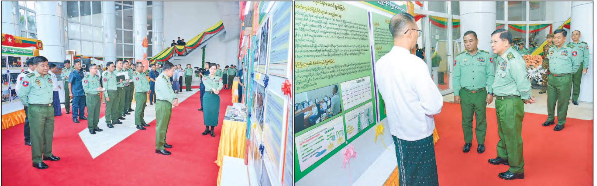
နိုင်ငံတော်စီမံအုပ်ချုပ်ရေးကောင်စီဥက္ကဋ္ဌ တပ်မတော်ကာကွယ်ရေးဦးစီးချုပ် ဗိုလ်ချုပ်မှူးကြီးမင်းအောင်လှိုင် ပြည်သူ့ဆက်ဆံရေးနှင့်စိတ်ဓာတ်စစ်ဆင်ရေးညွှန်ကြားရေးမှူးရုံး (၇၇)နှစ်မြောက် နှစ်ပတ်လည်နေ့အခမ်းအနားအဖြစ် ခင်းကျင်းပြသထားသည့် ပြခန်းများကိုလှည့်လည်ကြည့်ရှုစဉ်။

လုပ်ငန်း၊ စိတ်ဓာတ်စစ်ဆင်ရေးလုပ်ငန်း၊ ပညာရေးလုပ်ငန်းနှင့် စည်းရုံးရေးလုပ်ငန်း များကို ကျေပွန်အောင်မြင်စွာထမ်းဆောင် နိုင်ရေးအတွက် မိမိတို့သိသင့်သိထိုက် သည့်အသိပညာများနှင့်တတ်ကျွမ်းရမည့် အတတ်ပညာရပ်များကို စဉ်ဆက်မပြတ် လေ့လာနေကြရမည်ဖြစ်ကြောင်း၊ ပြည်သူ့ ဆက်ဆံရေးနှင့် စိတ်ဓာတ်စစ်ဆင်ရေး တပ်ဖွဲ့ဝင်များပီပီ နိုင်ငံတော်၏အမျိုးသား ရေးမူဝါဒများကို လေးနက်စွာခံယူနားလည် ပြီး တပ်မတော်သားများ၊ တပ်မတော်သား