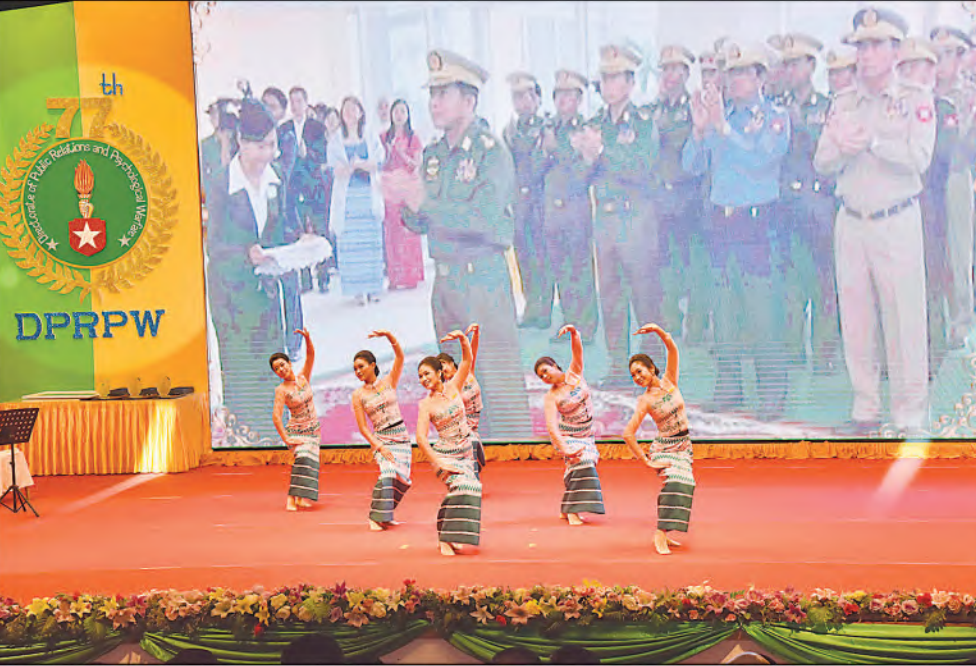
နိုင်ငံတော်စီမံအုပ်ချုပ်ရေးကောင်စီဥက္ကဋ္ဌ တပ်မတော်ကာကွယ်ရေးဦးစီးချုပ် ဗိုလ်ချုပ်မှူးကြီးမင်းအောင်လှိုင်နှင့်အဖွဲ့ဝင်များက ပြည်သူ့ဆက်ဆံရေးနှင့်စိတ်ဓာတ်စစ်ဆင်ရေးညွှန်ကြားရေးမှူးရုံး ကွပ်ကဲမှုအောက်ရှိ တပ်ဖွဲ့များမှ စစ်သမားများ၊ မြန်မာ့အသံနှင့်ရုပ်မြင်သံကြားမှ အနုပညာရှင်များ၊ ရုပ်ရှင်နှင့်သဘင်ဂီတအနုပညာရှင်များပူးပေါင်း၍ ဂုဏ်ပြုဖျော်ဖြေတင်ဆက်မှုများကို ကြည့်ရှုအားပေးစဉ်။