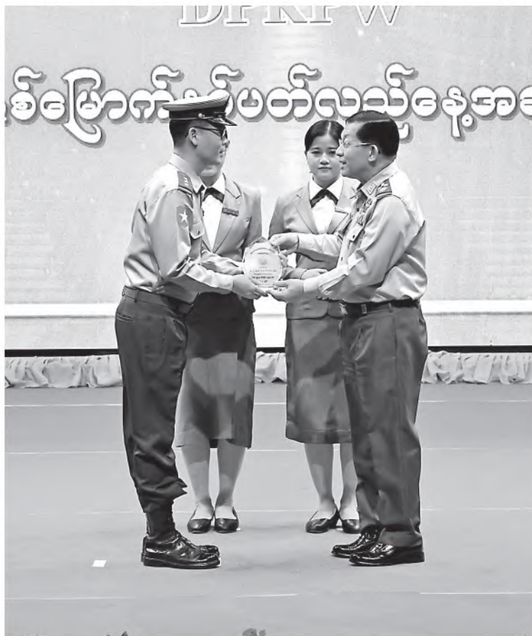
Senior General Min Aung Hlaing presents prize to a winner.

Afterward, the Senior General accepted the gifts commemo-