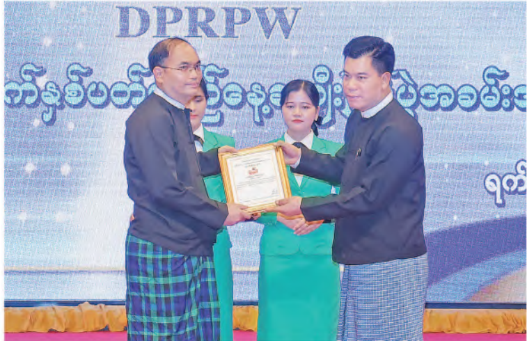
နေပြည်တော်တိုင်းစစ်ဌာနချုပ် တိုင်းမှူး ဗိုလ်ချုပ်စောသန်းလှိုင်က အကောင်းဆုံးဆုရရှိသူ တစ်ဦးအား ဂုဏ်ပြုမှတ်တမ်းလွှာနှင့်ဆုပေးအပ်ချီးမြှင့်စဉ်။