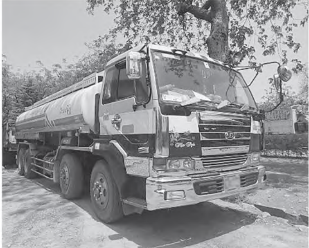
မန္တလေးတိုင်းဒေသကြီး၌ ဖမ်းဆီးရမိမှု။

တရားမဝင်ကုန်သွယ်မှုတိုက်ဖျက်ရေး ဦးဆောင်ကော်မတီ၏ ကြီးကြပ်ကွပ်ကဲမှုဖြင့် တရားမဝင်ကုန်သွယ်မှုများကို ဥပဒေနှင့် အညီ ထိရောက်စွာတားဆီးအရေးယူ နိုင်ရေးဆောင်ရွက်လျက်ရှိရာ မတ်လ ၃၀ ရက်တွင် ဧရာဝတီတိုင်းဒေသကြီး တရား မဝင်ကုန်သွယ်မှု တိုက်ဖျက်ရေးအထူးအဖွဲ့ ၏ စီမံခန့်ခွဲမှုဖြင့် တာဝန်ကျပူးပေါင်း အဖွဲ့က စစ်ဆေးမှုများဆောင်ရွက်ခဲ့ရာ မြန်အောင်ခရိုင်၊ အင်္ဂပူမြို့နယ်၌ တရားမဝင် ကျွန်းသစ် (သုည ဒသမ ၈၁၃)တန် (ခန့်မှန်း တန်ဖိုးငွေကျပ် ၉၂၅၀၀)ကို သစ်တော ဥပဒေနှင့်အညီ အရေးယူဆောင်ရွက်လျက် ရှိသည်။