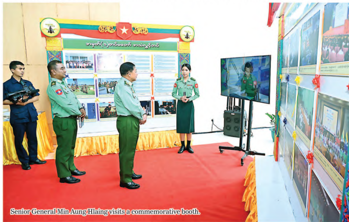
Senior General Min Aung Hlaing visits a commemorative booth.