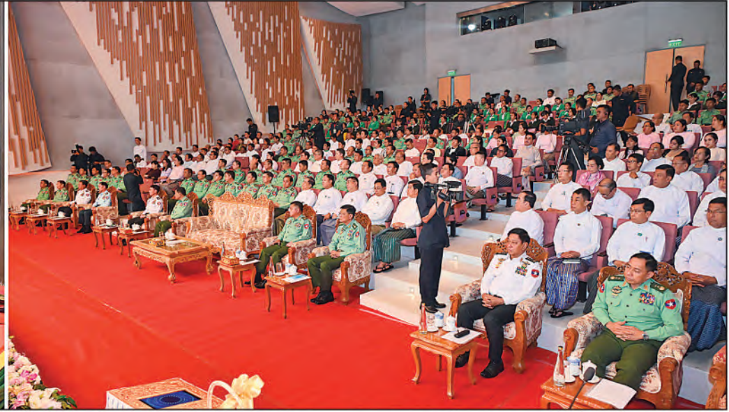
နိုင်ငံတော်စီမံအုပ်ချုပ်ရေးကောင်စီဥက္ကဋ္ဌ တပ်မတော်ကာကွယ်ရေးဦးစီးချုပ် ဗိုလ်ချုပ်မှူးကြီးမင်းအောင်လှိုင် ကာကွယ်ရေးဦးစီးချုပ်ရုံး(ကြည်း)၊ ပြည်သူ့ဆက်ဆံရေးနှင့်စိတ်ဓာတ်စစ်ဆင်ရေးညွှန်ကြားရေးမှူးရုံး (၇၇)နှစ်မြောက် နှစ်ပတ်လည်နေ့ အခမ်းအနားတွင် ဂုဏ်ပြုအမှာစကားပြောကြားစဉ်။