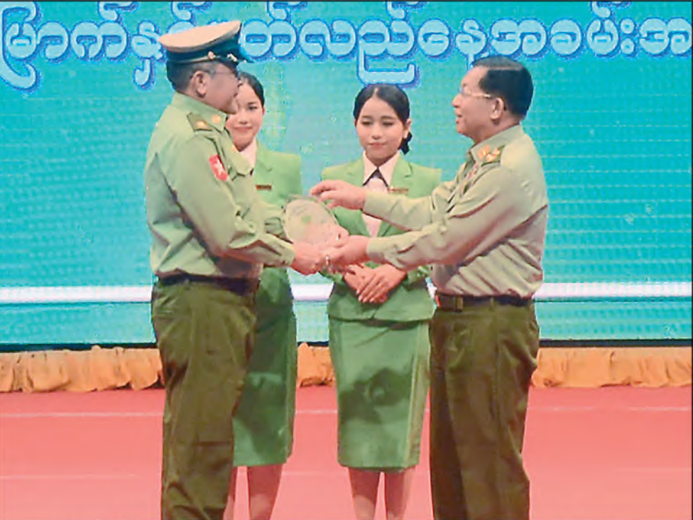
နိုင်ငံတော်စီမံအုပ်ချုပ်ရေးကောင်စီဥက္ကဋ္ဌ တပ်မတော်ကာကွယ်ရေးဦးစီးချုပ် ဗိုလ်ချုပ်မှူးကြီးမင်းအောင်လှိုင် ၂၀၂၃ ခုနှစ် မြန်မာ့ရုပ်ရှင်ထူးချွန်ဆုချီးမြှင့်ပွဲအခမ်းအနားတွင် “စောင်နီလေးတစ်ထည်” ဇာတ်ကားဖြင့် အကောင်းဆုံးရုပ်ရှင်ဒါရိုက်တာ ဆုရရှိခဲ့သည့် ဗိုလ်မှူးတင်အောင်စိုးအား ဆုပေးအပ်ချီးမြှင့်စဉ်။