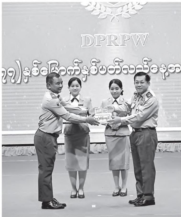
Senior General Min Aung Hlaing presents honorary cash award.

It can be seen that members of the corps accepting the national policies of the State are serving their duties for enhancement of education standard of Tatmadaw members and families, ensuring military unity, and sharpening fight spirit of Tatmadaw members in frontlines by applying their talent and skills in literature, music, fine arts and media techniques.