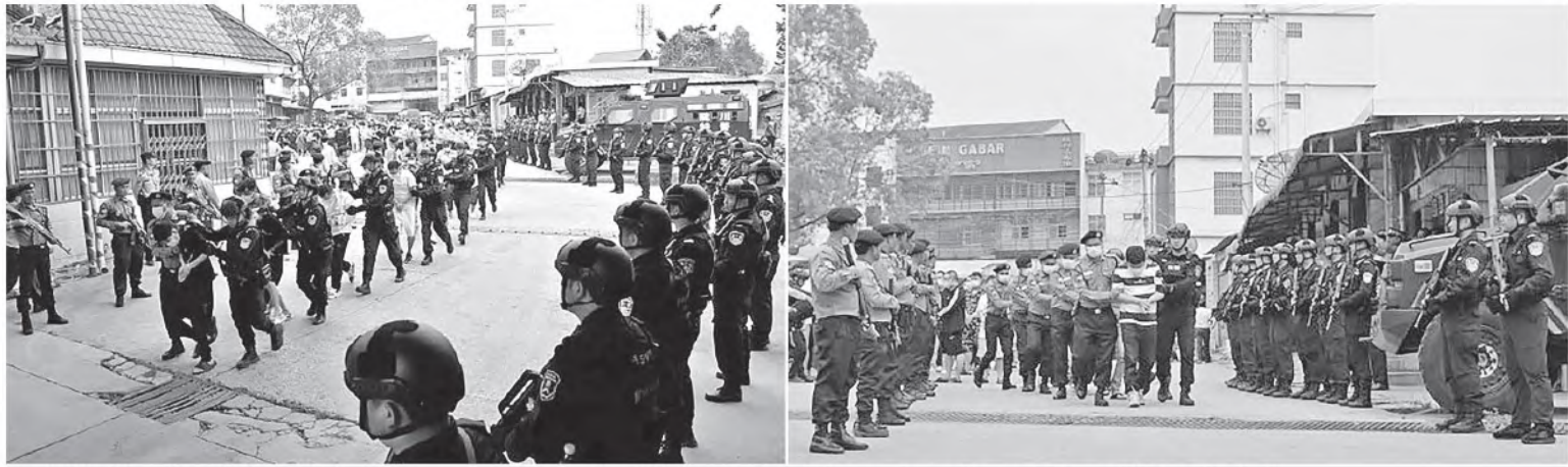
အွန်လိုင်းလိမ်လည်မှုလုပ်ငန်းများတိုက်ဖျက်ရေးအတွက် မြန်မာ-တရုတ် နှစ်နိုင်ငံ တရားဥပဒေစိုးမိုးရေးအဖွဲ့အစည်းများအကြား ပူးပေါင်းဆောင်ရွက်ခဲ့ပါသည်။

မြန်မာ-တရုတ် နှစ်နိုင်ငံအကြား အွန်လိုင်း လိမ်လည်မှုလုပ်ငန်းများ တိုက်ဖျက်ရေး အတွက် နှစ်နိုင်ငံတရားဥပဒေစိုးမိုးရေးအဖွဲ့ အစည်းများအကြား ပူးပေါင်းဆောင်ရွက်မှု တစ်ရပ်အား ၂၀၂၄ ခုနှစ်၊ မတ်လအတွင်း