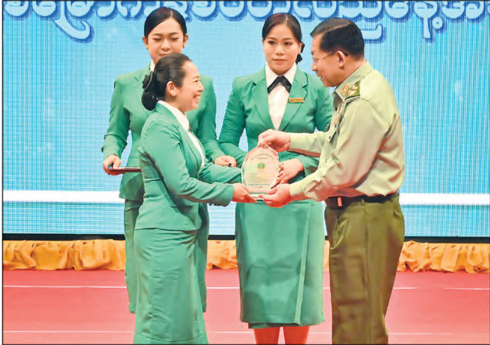
နိုင်ငံတော်စီမံအုပ်ချုပ်ရေးကောင်စီဥက္ကဋ္ဌ တပ်မတော်ကာကွယ်ရေးဦးစီးချုပ် ဗိုလ်ချုပ်မှူးကြီးမင်းအောင်လှိုင် ၂၀၂၃ ခုနှစ် (၂၄)ကြိမ်မြောက် မြန်မာ့ရိုးရာယဉ်ကျေးမှု အဆို၊ အက၊ အရေး၊ အတီးပြိုင်ပွဲတွင် ဝါသနာရှင် ဒုတိယတန်းအဆင့် (အမျိုးသမီး) ပတ္တလားအတီးပြိုင်ပွဲ(ပထမဆင့်)နှင့် ဝါသနာရှင် ပထမတန်းအဆင့်(အမျိုးသမီး) စန္ဒရားအတီးပြိုင်ပွဲ(တတိယဆင့်) ရရှိသည့် ဒုတိယအရာခံဗိုလ်အစားခန့် ဒေါ်တင်ဇာအေးလွင်အား ဆုပေးအပ်ချီးမြှင့်စဉ်။