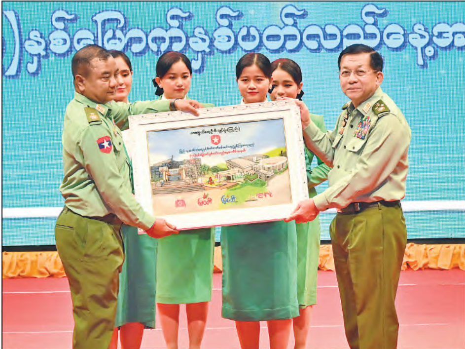
နိုင်ငံတော်စီမံအုပ်ချုပ်ရေးကောင်စီဥက္ကဋ္ဌ တပ်မတော်ကာကွယ်ရေးဦးစီးချုပ် ဗိုလ်ချုပ်မှူးကြီးမင်းအောင်လှိုင် တပ်မတော်ကာကွယ်ရေးဦးစီးချုပ်ရုံး(ကြည်း)၊ ပြည်သူ့ဆက်ဆံရေးနှင့်စိတ်ဓာတ်စစ်ဆင်ရေးညွှန်ကြားရေးမှူးရုံး၊ ညွှန်ကြားရေးမှူး ဗိုလ်ချုပ်ဇော်မင်းထွန်းက နှစ်ပတ်လည်နေ့အခမ်းအနားအမှာစကားပြောကြားစဉ်။

● ကျောပုံးမှအဆက် လှိုက်လှဲနွေးထွေးစွာကြိုဆို ဦးစွာ နိုင်ငံတော်စီမံအုပ်ချုပ်ရေးကောင်စီ ဥက္ကဋ္ဌ တပ်မတော်ကာကွယ်ရေးဦးစီးချုပ်နှင့် အဖွဲ့ဝင်များသည် အခမ်းအနားကျင်းပပြုလုပ် မည့် အမှတ်(၂) တပ်မတော်ရပ်မြင်သံကြား ထုတ်လွှင့်ရေးတပ်သို့ရောက်ရှိကြရာ ပြည်သူ့ ဆက်ဆံရေးနှင့် စိတ်ဓာတ်စစ်ဆင်ရေး ညွှန်ကြားရေးမှူးရုံး၊ ညွှန်ကြားရေးမှူး ဗိုလ်ချုပ်ဇော်မင်းထွန်းနှင့်အဖွဲ့ဝင်များ၊ မြဝတီ ရုပ်မြင်သံကြားမှဝန်ထမ်းများ၊ တာဝန်ရှိသူ များက လှိုက်လှဲနွေးထွေးစွာကြိုဆိုနှုတ်ဆက် ကြသည်။ ယင်းနောက် ကာကွယ်ရေးဦးစီးချုပ်ရုံး (ကြည်း) ပြည်သူ့ဆက်ဆံရေးနှင့်စိတ်ဓာတ် စစ်ဆင်ရေးညွှန်ကြားရေးမှူးရုံး (၇၇)နှစ် မြောက် နှစ်ပတ်လည်နေ့အခမ်းအနားကို စတင်ကျင်းပရာ နိုင်ငံတော်စီမံအုပ်ချုပ်ရေး ကောင်စီဥက္ကဋ္ဌ တပ်မတော်ကာကွယ်ရေး ဦးစီးချုပ်က နှစ်ပတ်လည်နေ့အခမ်းအနား နှင့် မြဝတီစာပေတိုက်မှ ထုတ်ဝေလျက်ရှိ သည့် တေဇရုပ်စုံစာစောင်နှင့်မိုးသောက်ပန်း ဂျာနယ်တို့အား Amuze Webtoon Application တွင် ထည့်သွင်းခြင်းတို့ကို Digital နည်းပညာအသုံးပြု၍ ဖွင့်လှစ် ပေးပြီး Amuze Webtoon Application