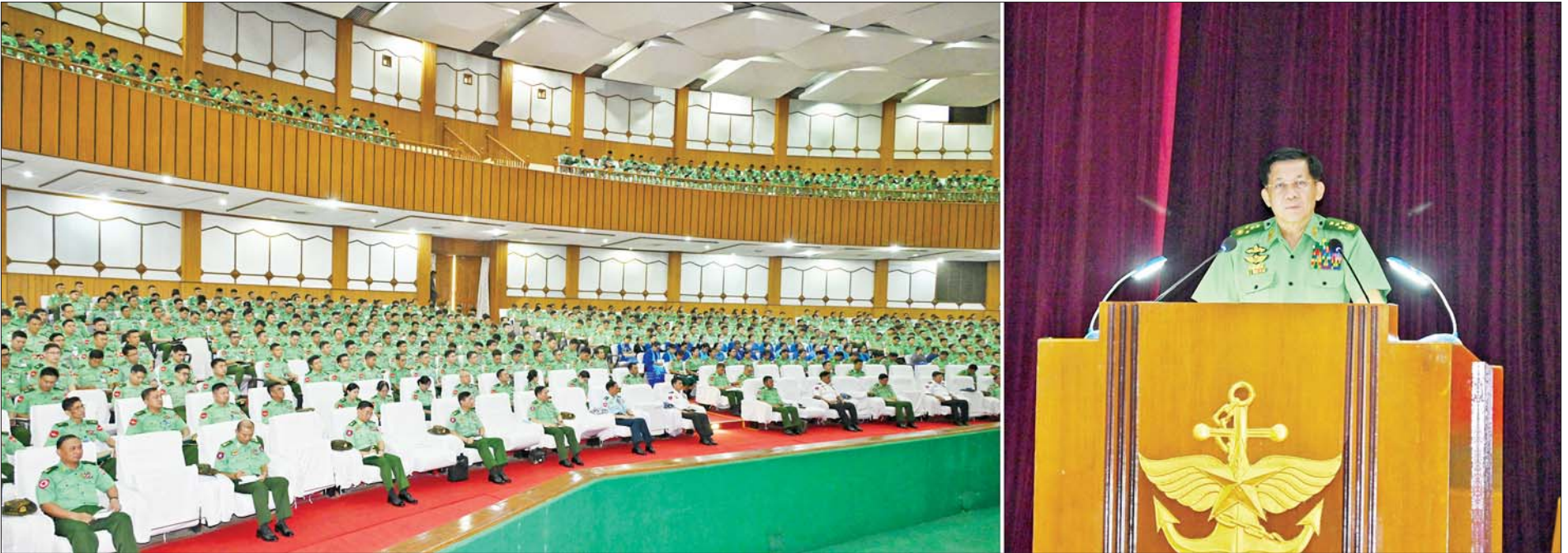
နိုင်ငံတော်စီမံအုပ်ချုပ်ရေးကောင်စီဥက္ကဋ္ဌ တပ်မတော်ကာကွယ်ရေးဦးစီးချုပ် ဗိုလ်ချုပ်မှူးကြီးမင်းအောင်လှိုင် တပ်မတော်ဆေးတက္ကသိုလ်တွင် အမှာစကားပြောကြားစဉ်။