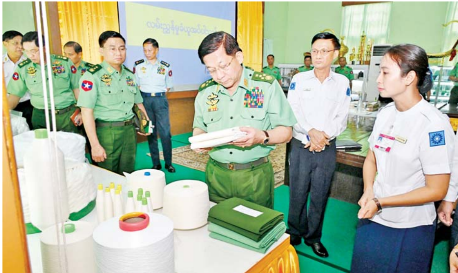
နိုင်ငံတော်စီမံအုပ်ချုပ်ရေးကောင်စီဥက္ကဋ္ဌ တပ်မတော်ကာကွယ်ရေးဦးစီးချုပ် ဗိုလ်ချုပ်မှူးကြီး မင်းအောင်လှိုင် တပ်မတော် ချည်မျှင်နှင့်အထည်စက်ရုံ (သမိုင်း) အတွင်း ကြည့်ရှုစစ်ဆေးစဉ်။