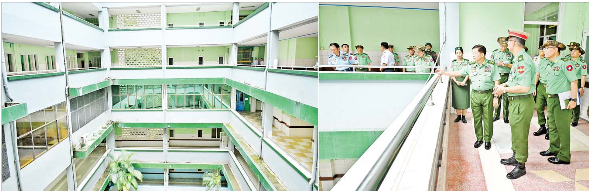
နိုင်ငံတော်စီမံအုပ်ချုပ်ရေးကောင်စီဥက္ကဋ္ဌ တပ်မတော်ကာကွယ်ရေးဦးစီးချုပ် ဗိုလ်ချုပ်မှူးကြီးမင်းအောင်လှိုင် ရန်ကုန်မြို့ရှိ တပ်မတော်အရိုးရောဂါအထူးကုဆေးရုံကြီးအတွင်း လှည့်လည်ကြည့်ရှုစဉ်။