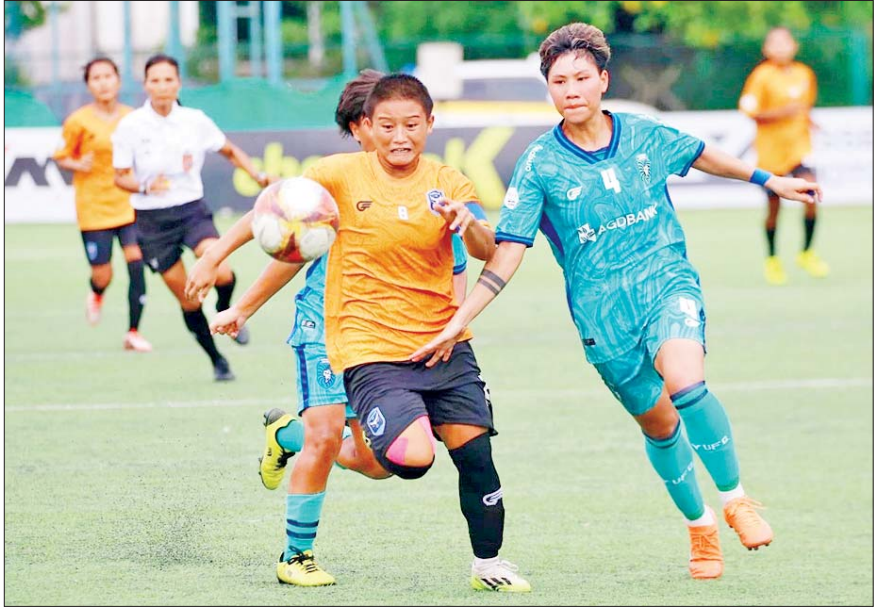
ရန်ကုန်ယူနိုက်တက်အသင်းနှင့် ဧရာဝတီအသင်းတို့ ယှဉ်ပြိုင်ကစားကြစဉ်။