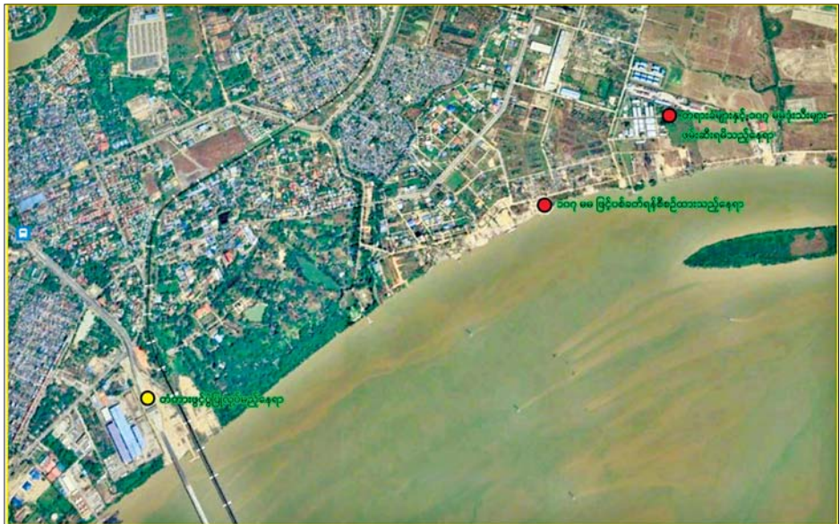
သန်လျင်တံတားအမှတ်(၃)ဖွင့်ပွဲအခမ်းအနားအား အကြမ်းဖက်သမားများက ၁၀၇ မမ ရှော့တိုက် ခွဲသီးဖြင့် ပစ်ခတ်ရန် စီစဉ်ဆောင်ရွက်ခဲ့မှု အခြေအနေ။