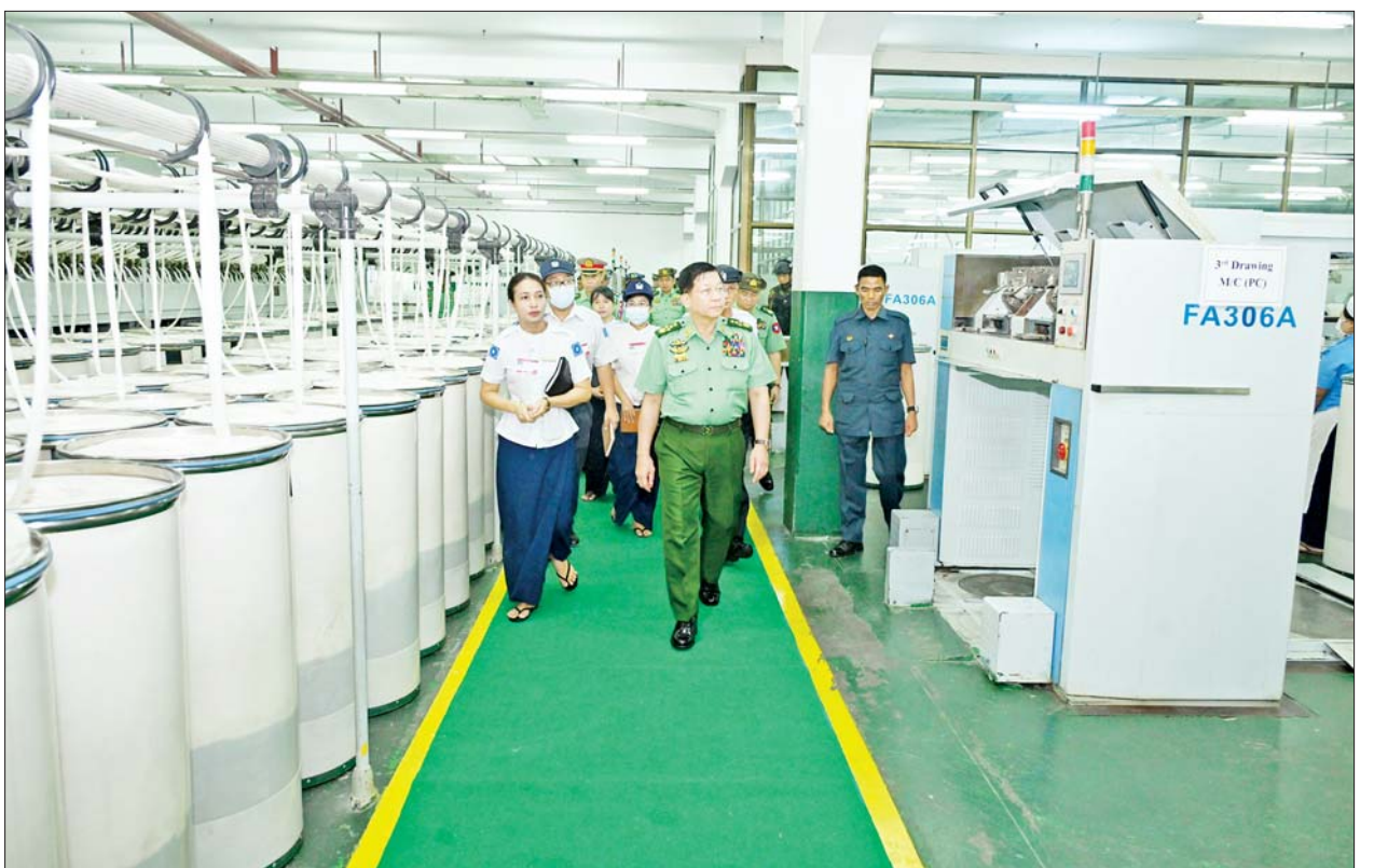
နိုင်ငံတော်စီမံအုပ်ချုပ်ရေးကောင်စီဥက္ကဋ္ဌ တပ်မတော်ကာကွယ်ရေးဦးစီးချုပ် ဗိုလ်ချုပ်မှူးကြီး မင်းအောင်လှိုင် တပ်မတော်ချည်မျှင်နှင့် အထည်စက်ရုံ(သမိုင်း)တွင် ကြည့်ရှုစစ်ဆေးစဉ်။

ကောင်စီဥက္ကဋ္ဌ တပ်မတော် ကာကွယ်ရေးဦးစီးချုပ် တပ်မတော် ဝါစိုက်ပျိုးရေး တပ်များသို့ ရောက်ရှိစစ်ဆေးစဉ် လမ်းညွှန် မှာကြားချက်များအား လိုက်နာ ဆောင်ရွက်ပြီးစီးမှုအခြေအနေများ၊ စိုက်ပျိုးရာသီအလိုက် လုပ်ငန်းများ အဆင့်ဆင့်ဆောင်ရွက်ခဲ့မှုနှင့် ဆက်လက်စိုက်ပျိုးသွားရန် လျာထား ဆောင်ရွက်လျက်ရှိသည့် အခြေအနေများကိုလည်းကောင်း၊ စက်ရုံများ ဦးခိုင်ရွှေက တပ်မတော် ချည်မျှင်နှင့် အထည်စက်ရုံ (သမိုင်း) အနေဖြင့် နိုင်ငံတော်စီမံအုပ်ချုပ် ရေးကောင်စီဥက္ကဋ္ဌ တပ်မတော် ကာကွယ်ရေးဦးစီးချုပ်၏ လမ်းညွှန် မှာကြားချက်များအပေါ် အကောင်အထည်ဖော်ဆောင်ရွက်လျက်ရှိ သည့်အခြေအနေများ၊ စက်ရုံ သမိုင်းအကျဉ်းနှင့် လုပ်ငန်း လည်ပတ်ဆောင်ရွက်နေမှုအခြေ အနေများ၊ ဝန်ထမ်းများ ခန့်အပ် ထားရှိမှုနှင့် ဝန်ထမ်းများ၏ သက်သာ ချောင်ချိရေးအတွက် ဆောင်ရွက်ပေးလျက်ရှိသည့် အခြေ အနေများနှင့် ပတ်သက်၍လည်း ကောင်း ရှင်းလင်းတင်ပြကြသည်။