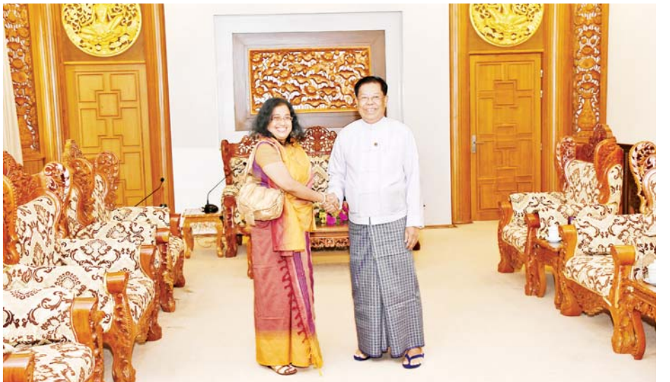
ဒုတိယဝန်ကြီးချုပ်နှင့် ပြည်ထောင်စုဝန်ကြီး ဦးသန်းဆွေနှင့် သီရိလင်္ကာ ဒီမိုကရက်တစ် ဆိုရှယ်လစ် သမ္မတနိုင်ငံ သံအမတ်ကြီး မစ္စတာ ပွန်နမ်ပီရူးမား အာရာချ်ချိုဂီ ပရာဘာရှိနီ ပွန်နမ်ပီရူးမားတို့ ရင်းနှီးနှီး တွေ့ဆုံနှုတ်ဆက်စဉ်။

အလားတူ သီရိလင်္ကာ ဒီမိုကရက်တစ် ဆိုရှယ်လစ်သမ္မတနိုင်ငံ သံအမတ်ကြီးနှင့် တွေ့ဆုံစဉ် ပြည်ထောင်စုသမ္မတ မြန်မာနိုင်ငံတော်ဆိုင်ရာ သီရိလင်္ကာသံအမတ်ကြီးအဖြစ် ခန့်အပ်တာဝန်ပေး ခြင်းခံရသည့်အတွက် ဂုဏ်ယူဝမ်းမြောက်ကြောင်း ပြောကြားခဲ့ပြီး မြန်မာ-သီရိလင်္ကာ နှစ်နိုင်ငံအကြား ရှိရင်းစွဲချစ်ကြည်ရင်းနှီးသော ဆက်ဆံရေးနှင့် အကျိုး တူပူးပေါင်းဆောင်ရွက်မှုများ ပိုမိုမြှင့်တင်ရေး၊ မြန်မာ