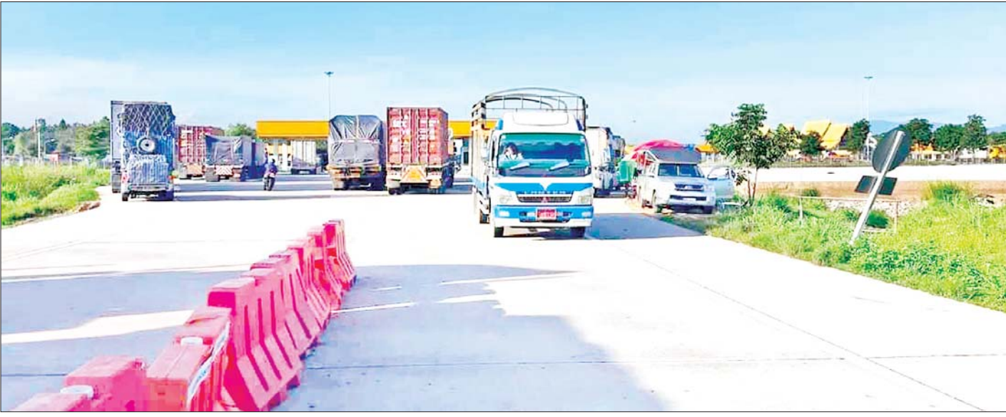
မြန်မာ-ထိုင်း ချစ်ကြည်ရေးတံတားအမှတ်(၂)တွင် ကုန်တင်ယာဉ်များ သွားလာမှုကို တွေ့ရစဉ်။

(နိုင်ငံတော်စီမံအုပ်ချုပ်ရေးကောင်စီဥက္ကဋ္ဌ နိုင်ငံတော်ဝန်ကြီးချုပ် ဗိုလ်ချုပ်မှူးကြီး မင်းအောင်လှိုင်၏ ၂၀၂၄ ခုနှစ်၊ ဖေဖော်ဝါရီလ ၂ ရက်နေ့တွင် ပြုလုပ်သော ပြည်ထောင်စုအစိုးရအဖွဲ့ အစည်းအဝေး(၂/၂၀၂၄)တွင် အမှာစကားပြောကြားမှုမှ ကောက်နုတ်ချက်)