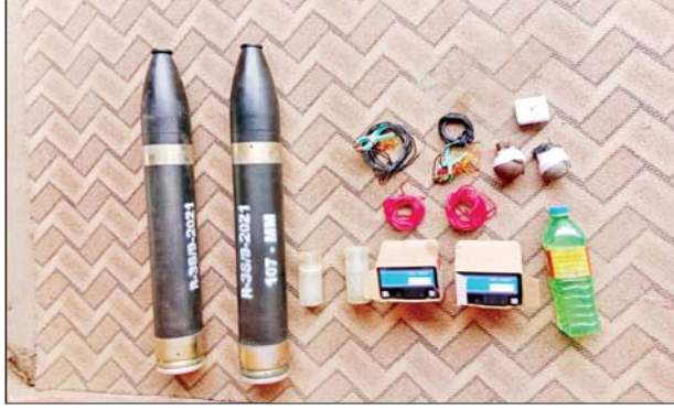
ဇွန် ၈ ရက်တွင် သန်လျင်တံတားအမှတ်(၃)ဖွင့်ပွဲအား ပစ်ခတ် မည့် ၁၀၇ မမ ရှော့တိုက်ခွဲနှင့် ဆက်စပ်ပစ္စည်းများ သိမ်းဆည်းရမိမှု မှတ်တမ်းဓာတ်ပုံ။

ဖြစ်ပြီး အကြမ်းဖက်မှုဆောင်ရွက် နေသူများအား ပြည်သူတစ်ရပ်လုံး က ဝိုင်းဝန်းကာကွယ်တိုက်ဖျက် ကြရန်နှင့် ပြစ်မှုကျူးလွန်ရာတွင် ပါဝင်ပတ်သက်သူများ နောက် ကွယ်မှ ထောက်ပံ့ပေးလျက်ရှိ သော ဆက်စပ်တရားခံများအား အမြန်ဆုံးဖမ်းဆီးရမိရေးအတွက် ၎င်းတို့ပုန်းခိုနေရာများ၊ လှုပ်ရှား သွားလာနေထိုင်မှု သတင်းများရရှိ ပါက သက်ဆိုင်ရာသို့ လျှို့ဝှက်စွာ သတင်းပေး တိုင်ကြားနိုင်ပါ ကြောင်း၊ သတင်းပေးသူနှင့် ဖမ်းဆီးပေးသူများအား ထိုက်တန် စွာလျှို့ဝှက်၍ ဆုငွေများချီးမြှင့် ပေးလျက်ရှိကြောင်းနှင့် မြို့ရွာများ အမြန်ဆုံးအေးချမ်း တည်ငြိမ်ရေး အတွက် ပြည်သူတစ်ရပ်လုံး ပူးပေါင်းပါဝင်ကြိုးပမ်းဆောင်ရွက် နိုင်ပါရန်မေတ္တာရပ်ခံအပ်ကြောင်း အသိပေး သတင်းထုတ်ပြန်ထား သည်။