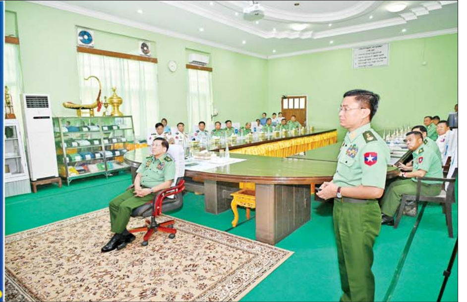
နိုင်ငံတော်စီမံအုပ်ချုပ်ရေးကောင်စီဥက္ကဋ္ဌ တပ်မတော်ကာကွယ်ရေးဦးစီးချုပ် ဗိုလ်ချုပ်မှူးကြီး မင်းအောင်လှိုင်အား စစ်ထောက်ချုပ် ဒုတိယဗိုလ်ချုပ်ကြီး ကျော်စွာလင်းက ရှင်းလင်းတင်ပြစဉ်။