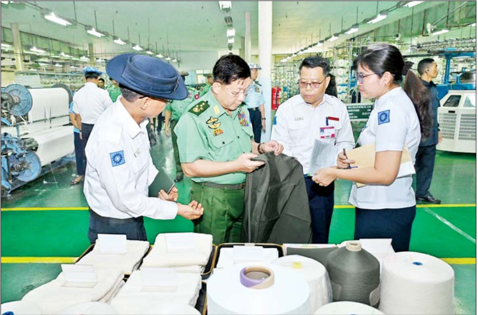
နိုင်ငံတော်စီမံအုပ်ချုပ်ရေးကောင်စီဥက္ကဋ္ဌ တပ်မတော်ကာကွယ်ရေးဦးစီးချုပ် ဗိုလ်ချုပ်မှူးကြီး မင်းအောင်လှိုင် တပ်မတော်ချည်မျှင်နှင့် အထည်စက်ရုံ(သမိုင်း)တွင် ကြည့်ရှုစစ်ဆေးစဉ်။

ဦးစီးချုပ်က ဝါစိုက်ပျိုးရေးလုပ်ငန်းများ အောင်မြင်ဖြစ်ထွန်းပြီး အထွက်နှုန်း ကောင်းမွန်စေရေးအတွက် မြေအရည်အသွေး စစ်ဆေးခြင်း သုတေသနလုပ်ငန်းများကို ဦးစွာဆောင်ရွက်ပြီး မြေဆီလွှာ အမျိုးအစားအလိုက် သည့်အထွက်နှုန်းများကို လေ့လာ စနစ်တကျ ပြုပြင်ဆောင်ရွက် သွားရန်လိုကြောင်း၊ လိုအပ်သည့် သွင်းအားစုများ အပြည့်အဝ ထည့်သွင်းရန်နှင့် စိုက်ပျိုးရေးရရှိ အောင် ဆောင်ရွက်ပေးရန်လည်း လိုကြောင်း၊ စိုက်ပျိုးသည့် မြေ အမျိုးအစားအလိုက် ထွက်ရှိသင့် သည့်အထွက်နှုန်းများကို လေ့လာ ဆန်းစစ်ရန်နှင့် အထွက်နှုန်း ပြည့်မီစေရေး ဆောင်ရွက်သွားရန် လိုကြောင်း၊ ဝါစိုက်ပျိုးမှုနှင့် ပတ်သက်၍ တပ်မတော်အနေဖြင့် စံနမူနာပြုဖြစ်အောင် ဆောင်ရွက် ကြရန်လိုပြီး A Grade အမျိုးအစား ဝါများ ထွက်ရှိအောင် ကြိုးစား ဆောင်ရွက်ကြရန် လိုကြောင်း၊ စာမျက်နှာ ၆ သို့ ၀