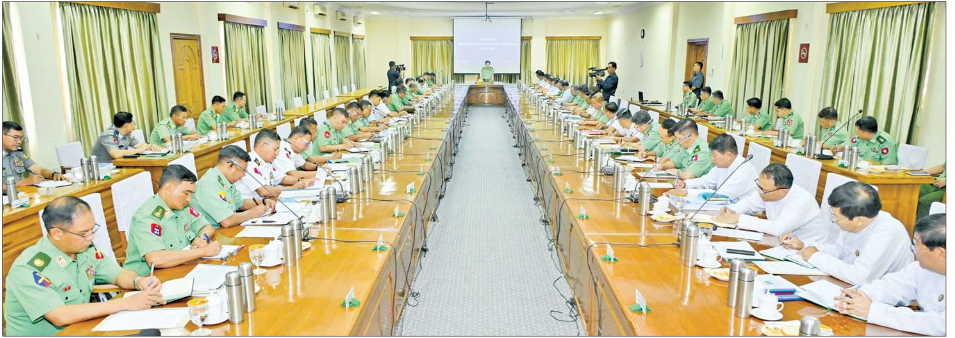
နိုင်ငံတော်စီမံအုပ်ချုပ်ရေးကောင်စီဥက္ကဋ္ဌ နိုင်ငံတော်ဝန်ကြီးချုပ် ဗိုလ်ချုပ်မှူးကြီး မင်းအောင်လှိုင် ရန်ကုန်တိုင်းဒေသကြီး တည်ငြိမ်အေးချမ်းရေးနှင့် ဖွံ့ဖြိုးတိုးတက်ရေးအစည်းအဝေးတွင် အမှာစကား ပြောကြားစဉ်။