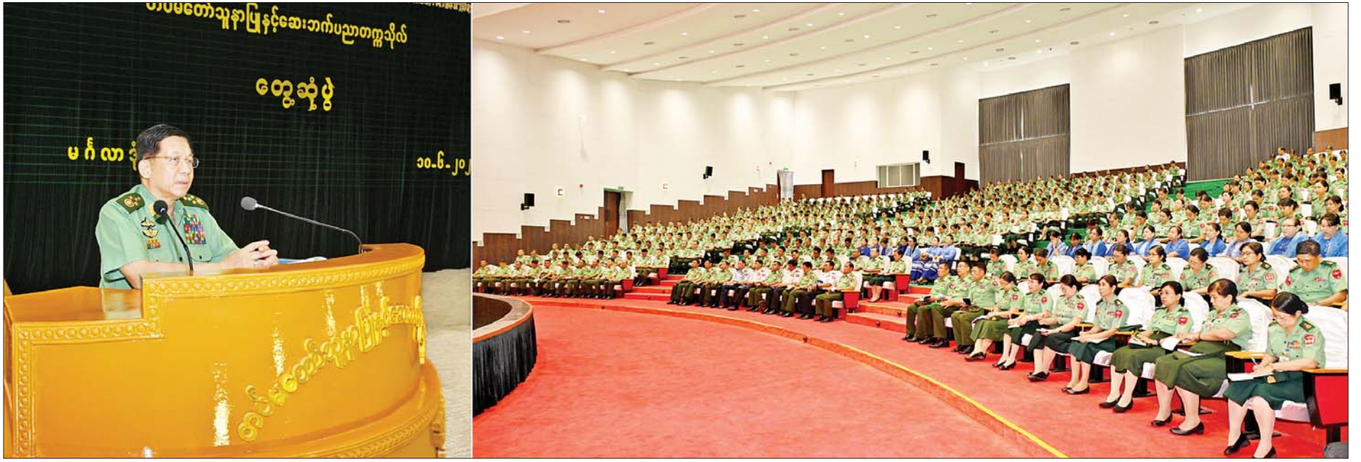
နိုင်ငံတော်စီမံအုပ်ချုပ်ရေးကောင်စီဥက္ကဋ္ဌ တပ်မတော်ကာကွယ်ရေးဦးစီးချုပ် ဗိုလ်ချုပ်မှူးကြီးမင်းအောင်လှိုင် တပ်မတော်သူနာပြုနှင့် ဆေးဘက်ပညာတက္ကသိုလ်တွင် အမှာစကားပြောကြားစဉ်။

☆ ရှေးဦးမှ ကျွမ်းကျင်သည့် ဆေးဘက်ဆိုင်ရာ အရာရှိကောင်းများ၊ သူနာပြုများ၊ ဆေးဝါးကျွမ်းကျင်သူများ၊ ဆေးဘက်ပညာသည်များ မွေးထုတ်ပေးနိုင်ရေး ဦးစွာ နိုင်ငံတော်စီမံအုပ်ချုပ်ရေးကောင်စီဥက္ကဋ္ဌ တပ်မတော်ကာကွယ်ရေးဦးစီးချုပ်က အမှာစကားပြောကြားရာတွင် တပ်မတော်ဆေးတက္ကသိုလ်ကို “တပ်မတော် (ကြည်း၊ ရေ၊ လေ)အတွက် လိုအပ်သော လက်ရုံးရည်၊ နှလုံးရည်ပြည့်ဝသည့် ဆေးသိပ္ပံပညာရှင် အရာရှိများ မွေးထုတ်ပေးရန်” ဟူသည့် ရည်ရွယ်ချက်ဖြင့် တည်ထောင်ခဲ့ခြင်းဖြစ်ပြီး သင်တန်းသား ဗိုလ်လောင်းများက ဆေးဘက်ပညာဆိုင်ရာ အရာရှိငယ်များကို မွေးထုတ်ပေးခြင်းရှိသကဲ့သို့ ၎င်းအရာရှိများမှ တစ်ဆင့် တပ်မတော်ဆေးဘက်ဆိုင်ရာ အရာရှိကြီးများကို အဆင့်ဆင့်မွေးထုတ်ပေးလျက်ရှိကြောင်း၊ အခြေခံအားဖြင့် သင်တန်း သား ဗိုလ်လောင်းဘဝကတည်းက လက်ရုံးရည်၊ နှလုံးရည်ပြည့်ဝသည့် ဗိုလ်လောင်းများ ဖြစ်အောင် လေ့ကျင့်ဆောင်ရွက်ပေးရန် လိုကြောင်း၊ ဗိုလ်လောင်းများအနေဖြင့် ရှိသင့်ရှိထိုက်သည့် ကိုယ်ခန္ဓာအချိုးအစား၊ ကိုယ်ကာယကြံ့ခိုင်မှုနှင့် ကြံ့ခိုင်သန်စွမ်းမှုများရှိရမည်ဖြစ်ကြောင်း၊ ဗိုလ်လောင်းများအနေဖြင့် နေ့စဉ်လေ့ကျင့်ရေးပိုင်းဆိုင်ရာများ၊ စာပေပညာရပ်ဆိုင်ရာများကို စဉ်ဆက်မပြတ် ဆောင်ရွက်ရမည်ဖြစ်သဖြင့် အာဟာရပြည့်ပြည့်ဝဝ စားသုံးမှု သာ ကိုယ်ခံစွမ်းအားကောင်းမွန်စွာဖြင့် လိုက်ပါလုပ်ဆောင်နိုင်မည် ဖြစ်ကြောင်း၊ ထို့ကြောင့် သင်တန်းသားများအတွက် စနစ်တကျတွက်ချက်ပြီး ကျွေးမွေးလျက်