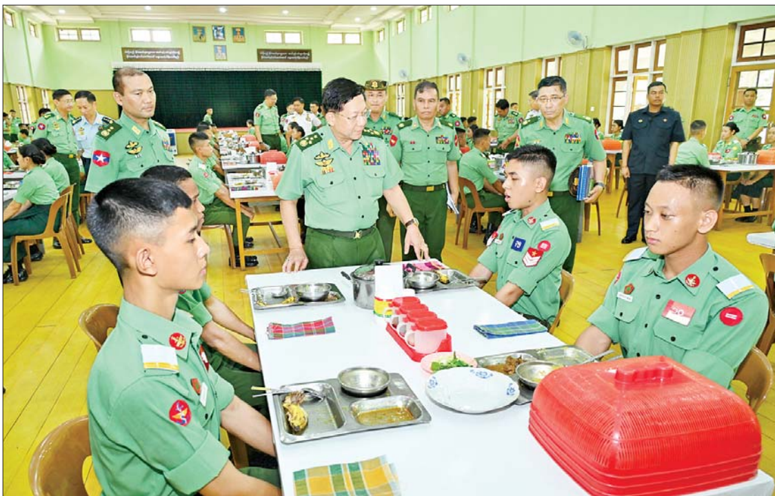
နိုင်ငံတော်စီမံအုပ်ချုပ်ရေးကောင်စီဥက္ကဋ္ဌ တပ်မတော်ကာကွယ်ရေးဦးစီးချုပ် ဗိုလ်ချုပ်မှူးကြီးမင်းအောင်လှိုင် တပ်မတော်ဆေးတက္ကသိုလ်မှ ဗိုလ်လောင်းများအား ရင်းရင်းနှီးနှီး နှုတ်ဆက်စဉ်။

☆ ရှေးဦးမှ ကျွမ်းကျင်သည့် ဆေးဘက်ဆိုင်ရာ အရာရှိကောင်းများ၊ သူနာပြုများ၊ ဆေးဝါးကျွမ်းကျင်သူများ၊ ဆေးဘက်ပညာသည်များ မွေးထုတ်ပေးနိုင်ရေး ဦးစွာ နိုင်ငံတော်စီမံအုပ်ချုပ်ရေးကောင်စီဥက္ကဋ္ဌ တပ်မတော်ကာကွယ်ရေးဦးစီးချုပ်က အမှာစကားပြောကြားရာတွင် တပ်မတော်ဆေးတက္ကသိုလ်ကို “တပ်မတော် (ကြည်း၊ ရေ၊ လေ)အတွက် လိုအပ်သော လက်ရုံးရည်၊ နှလုံးရည်ပြည့်ဝသည့် ဆေးသိပ္ပံပညာရှင် အရာရှိများ မွေးထုတ်ပေးရန်” ဟူသည့် ရည်ရွယ်ချက်ဖြင့် တည်ထောင်ခဲ့ခြင်းဖြစ်ပြီး သင်တန်းသား ဗိုလ်လောင်းများက ဆေးဘက်ပညာဆိုင်ရာ အရာရှိငယ်များကို မွေးထုတ်ပေးခြင်းရှိသကဲ့သို့ ၎င်းအရာရှိများမှ တစ်ဆင့် တပ်မတော်ဆေးဘက်ဆိုင်ရာ အရာရှိကြီးများကို အဆင့်ဆင့်မွေးထုတ်ပေးလျက်ရှိကြောင်း၊ အခြေခံအားဖြင့် သင်တန်း သား ဗိုလ်လောင်းဘဝကတည်းက လက်ရုံးရည်၊ နှလုံးရည်ပြည့်ဝသည့် ဗိုလ်လောင်းများ ဖြစ်အောင် လေ့ကျင့်ဆောင်ရွက်ပေးရန် လိုကြောင်း၊ ဗိုလ်လောင်းများအနေဖြင့် ရှိသင့်ရှိထိုက်သည့် ကိုယ်ခန္ဓာအချိုးအစား၊ ကိုယ်ကာယကြံ့ခိုင်မှုနှင့် ကြံ့ခိုင်သန်စွမ်းမှုများရှိရမည်ဖြစ်ကြောင်း၊ ဗိုလ်လောင်းများအနေဖြင့် နေ့စဉ်လေ့ကျင့်ရေးပိုင်းဆိုင်ရာများ၊ စာပေပညာရပ်ဆိုင်ရာများကို စဉ်ဆက်မပြတ် ဆောင်ရွက်ရမည်ဖြစ်သဖြင့် အာဟာရပြည့်ပြည့်ဝဝ စားသုံးမှု သာ ကိုယ်ခံစွမ်းအားကောင်းမွန်စွာဖြင့် လိုက်ပါလုပ်ဆောင်နိုင်မည် ဖြစ်ကြောင်း၊ ထို့ကြောင့် သင်တန်းသားများအတွက် စနစ်တကျတွက်ချက်ပြီး ကျွေးမွေးလျက်