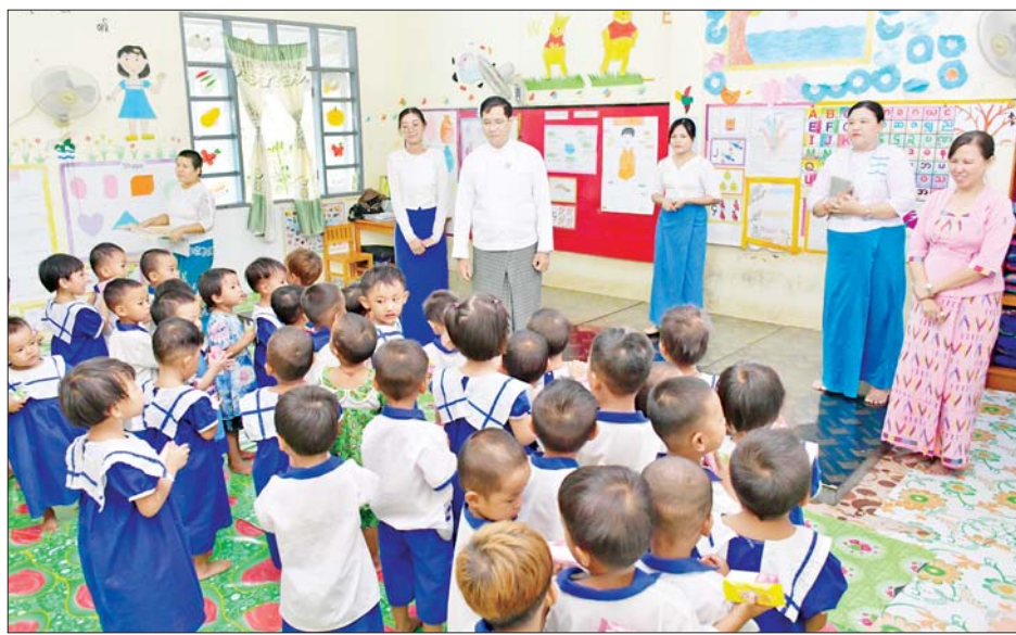
များနှင့် မိဘအသိပညာပေး အစီအစဉ်များကို ပုဂ္ဂလိက မူလတန်းကြိုကျောင်းများနှင့် ပူးပေါင်း ဆောင်ရွက်နိုင်ရေး ကြိုးပမ်းဆောင်ရွက်ကြရန်

ထိုသို့ ကြည့်ရှုစစ်ဆေးစဉ် ဒုတိယဝန်ကြီးက ရှေးဦးအရွယ်ကလေးသူငယ်ပြုစုပျိုးထောင်ရေးနှင့် ဖွံ့ဖြိုးရေးဆိုင်ရာနည်းလမ်းများကို ပြည်သူ့လူထုက ကျယ်ကျယ်ပြန့်ပြန့် သိရှိစေရေးအတွက် အားလုံး ပိုင်းဝန်းဆောင်ရွက်ရန်၊ နှစ်အလိုက် ကျောင်းတွင်း လှုပ်ရှားမှု ဆောင်ရွက်ချက်များဖြစ်ကြသည့် ကာယ၊ ဉာဏစွမ်းရည်ပြိုင်ပွဲများ၊ လေ့လာရေးအစီအစဉ်