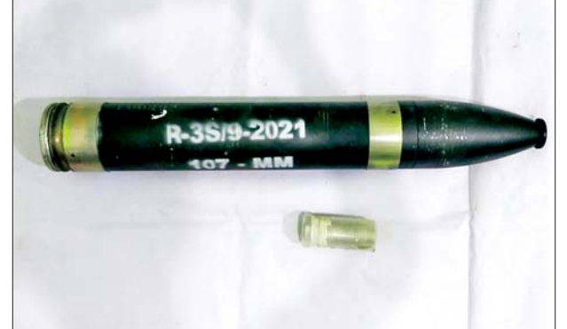
ဇွန် ၉ ရက်တွင် သန်လျင်တံတားအမှတ်(၃)ဖွင့်ပွဲအား ပစ်ခတ် မည့် ၁၀၇ မမ ရှော့တိုက်ခွဲ သိမ်းဆည်းရမိမှု မှတ်တမ်းဓာတ်ပုံ။