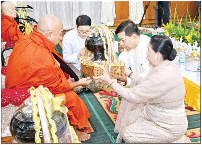
နိုင်ငံတော်စီမံအုပ်ချုပ်ရေးကောင်စီဝင် ညွှန်ကြားမှုကွပ်ကဲရေးမှူးကြီး (ကြည်းရေး) ဗိုလ်ချုပ်ကြီး မောင်မောင်အေးနှင့် ဇနီးတို့ ရေဆင်းကဲဦးကျောင်း ဆရာတော်ထံ လှူဖွယ်ပစ္စည်းများ ဆက်ကပ်လှူဒါန်းစဉ်။