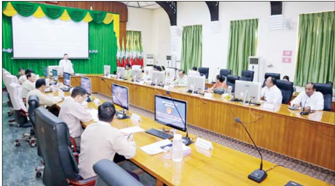
တို့မှ ပြည်နယ်ဦးစီးမှူးများက မြို့နယ်အလိုက် ဆောင်းဆီထွက်သီးနှံ မြေပဲ၊ နှမ်း၊ နေကြာ ပိုမိုစိုက်ပျိုးထုတ်လုပ်နိုင်ရေး မျိုးစေ့ထုတ်လုပ်ငန်းများ ဆောင်ရွက်ထားရှိမှု၊ စိုက်ပျိုးရေးရရှိရေး၊ လယ်ယာသုံးစွဲကြောင်း သိရသည်။

မြေဩဇာစနစ်တကျသုံးစွဲရေးနှင့် သီးနှံများ ပန်းတိုင်အထွက်နှုန်းရရှိရေးနှင့် ပြည်နယ်အတွင်း လူမှုစီးပွားဘဝ ဖွံ့ဖြိုးတိုးတက်စေရေး ပိုင်းဝန်းဆောင်ရွက်သွားကြစေလိုကြောင်း ပြောကြားသည်။ ရှင်းလင်းတင်ပြ ထို့နောက် ပြည်နယ်လုံခြုံရေးနှင့် နယ်စပ်ရေးရာဝန်ကြီးက ပြည်နယ်အတွင်း ဆီထွက်သီးနှံ မြေပဲ၊ နှမ်း၊ နေကြာ တိုးချဲ့စိုက်ပျိုးရေးဆောင်ရွက်မည့် အစီအစဉ်များ၊ ပြည်နယ်အစိုးရအဖွဲ့အတွင်းရေးမှူးက ၂၀၂၄-၂၀၂၅ ခုနှစ် ဆောင်းဆီထွက်သီးနှံ လျာထားစိုက်ပျိုးမှုနှင့် ဆီဖူလုံမှုအခြေအနေများကို ရှင်းလင်းတင်ပြကြသည်။ ယင်းနောက် ပြည်နယ်စိုက်ပျိုးရေးဦးစီးဌာန၊ ပြည်နယ်စက်မှုလယ်ယာဦးစီးဌာနနှင့် ပြည်နယ်ဆည်မြောင်းနှင့် ရေအသုံးချမှုစီမံခန့်ခွဲရေးဦးစီးဌာန