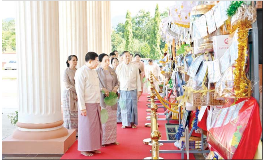
လှည့်လည်ကြည့်ရှု နိုင်ငံတော်စီမံအုပ်ချုပ်ရေး ကောင်စီဥက္ကဋ္ဌ တပ်မတော် ကာကွယ်ရေး ဦးစီးချုပ် ဗိုလ်ချုပ်မှူးကြီး မင်းအောင်လှိုင် နှင့်ဇနီး ဒေါ်ကြူကြူလှ၊ ဧည့်ပရိသတ်များ ဘုန်းတော် ကြီးကျောင်းများသို့ လှူဒါန်း ရန်ခင်းကျင်းပြင်ဆင်ထားသည့် ကထိန်လျာသင်္ကန်း၊ လှူဖွယ် ပစ္စည်းများနှင့် ပဒေသာပင် များအား လှည့်လည်ကြည့်ရှု ကြစဉ်။