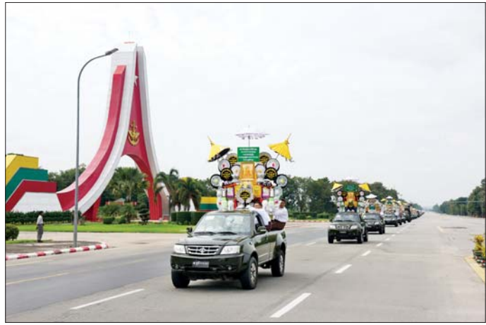
ကာကွယ်ရေးဦးစီးချုပ်ရုံး (ကြည်း၊ ရေ လေ) မိသားစုများ၏ ၂၀၂၄ ခုနှစ် မိသားစု မဟာဘုံကထိန်အလှူတော်အဖြစ် လှူဒါန်းထားသည့် ပဒေသာပင်များကို ဥပ္ပါတသန္တိစေတီတော်မြတ်ကြီးသို့ မော်တော်ယာဉ်များဖြင့် လှည့်လည်စဉ်။