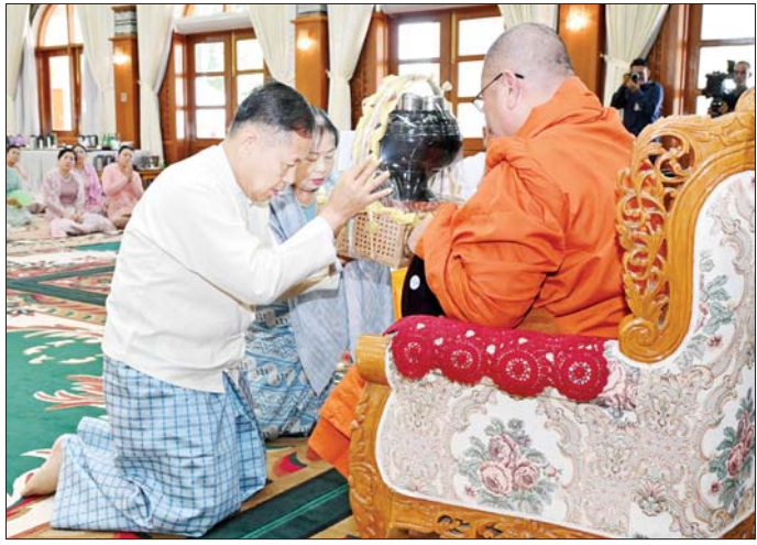
နိုင်ငံတော်စီမံအုပ်ချုပ်ရေးကောင်စီ ဒုတိယဥက္ကဋ္ဌ ဒုတိယတပ်မတော်ကာကွယ်ရေးဦးစီးချုပ် ကာကွယ်ရေးဦးစီးချုပ်ကြီး ဦးစိုးဝင်းနှင့်ဇနီး ဒေါ်သန်းသန်းနွယ်တို့ မန္တလေးမြို့ မစိုးရိမ်တိုက်သစ် ဆရာတော်ကြီးထံ ကထိန်သင်္ကန်းနှင့် လှူဖွယ်ပစ္စည်းများ ဆက်ကပ်လှူဒါန်းစဉ်။