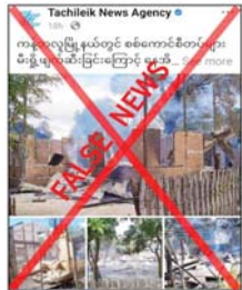
ဖြန့်ဝေနေခြင်းသာဖြစ်ကြောင်း သိရှိရသည်။ သတင်းစဉ်

ဟူ၍ အယူဝါဒဖြင့် ၎င်းတို့အား ထောက်ခံ အားပေးမှုမရှိသည့် ရပ်ကွက်၊ ကျေးရွာများအား မီးရှို့ ပျက်ဆီးခြင်းများ ကျူးလွန်လျက် ရှိပြီး ယင်းတို့၏ အကြမ်းဖက် လုပ်ရပ်များကို ဖုံးကွယ်ရန် နှင့် လုံခြုံရေးတပ်ဖွဲ့ဝင်များအပေါ် ပြည်သူများက အထင်အမြင် လွှဲများစေရန်အတွက် တရားမဝင် ပြည်ပကွန်မီဇီယာများက မဟုတ် မမှန် သတင်းများကို လုပ်ကြံ ရေးသားပြီး လူမှုကွန်ရက်တွင်