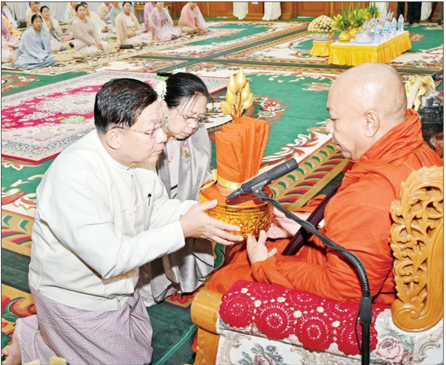
နိုင်ငံတော်စီမံအုပ်ချုပ်ရေးကောင်စီဥက္ကဋ္ဌ တပ်မတော်ကာကွယ်ရေးဦးစီးချုပ် ဗိုလ်ချုပ်မှူးကြီး မင်းအောင်လှိုင် နှင့် ဇနီး ဒေါ်ကြူကြူလှတို့ နေပြည်တော် ဝေယျာသီရိမြို့နယ် ရေခင်းကဦးကျောင်းဆရာတော် အဂ္ဂမဟာပဏ္ဍိတ ဘဒ္ဒန္တဇေယျာဝံသ ကထိန်လှူဒါန်းစဉ်။