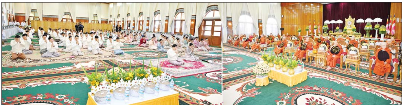
နိုင်ငံတော်စီမံအုပ်ချုပ်ရေးကောင်စီဥက္ကဋ္ဌ တပ်မတော်ကာကွယ်ရေးဦးစီးချုပ် ဗိုလ်ချုပ်မှူးကြီး မင်းအောင်လှိုင်နှင့် ဇနီး ဒေါ်ကြူကြူလှ၊ အခမ်းအနားတက်ရောက်လာကြသူများ သန့်လျင်မင်းကျောင်း ဆရာတော်ကြီးထံမှ ကိုးပါးသီလ ခံယူဆောက်တည်ကြစဉ်။

( ၃-၉-၂၀၂၄ ရက်နေ့တွင် နိုင်ငံတော်စီမံအုပ်ချုပ်ရေးကောင်စီဥက္ကဋ္ဌ နိုင်ငံတော် ဝန်ကြီးချုပ် ဗိုလ်ချုပ်မှူးကြီး မင်းအောင်လှိုင် ရှမ်းပြည်နယ် အစိုးရအဖွဲ့ဝင်များ၊ ပြည်နယ်နှင့် ခရိုင်အဆင့် ဌာနဆိုင်ရာတာဝန်ရှိသူများအား ပြောကြားသည့် အမှာ စကားမှ ကောက်နုတ်ချက် )