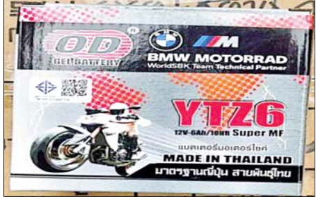
မန္တလေးတိုင်းဒေသကြီး၌ သိမ်းဆည်းရမိမှု။

တရားမဝင်ကုန်သွယ်မှုတိုက်ဖျက်ရေး ဦးဆောင်ကော်မတီ၏ ကြီးကြပ်ကွပ်ကဲမှုဖြင့် တရားမဝင်ကုန်သွယ်မှုများကို ဥပဒေနှင့်အညီ ထိရောက်စွာ တားဆီးအရေးယူနိုင်ရေး ဆောင်ရွက်လျက်ရှိရာ နိုဝင်ဘာ ၁၁ ရက်တွင် အကောက်ခွန်ဦးစီးဌာန၏ စီမံခန့်ခွဲမှုဖြင့်