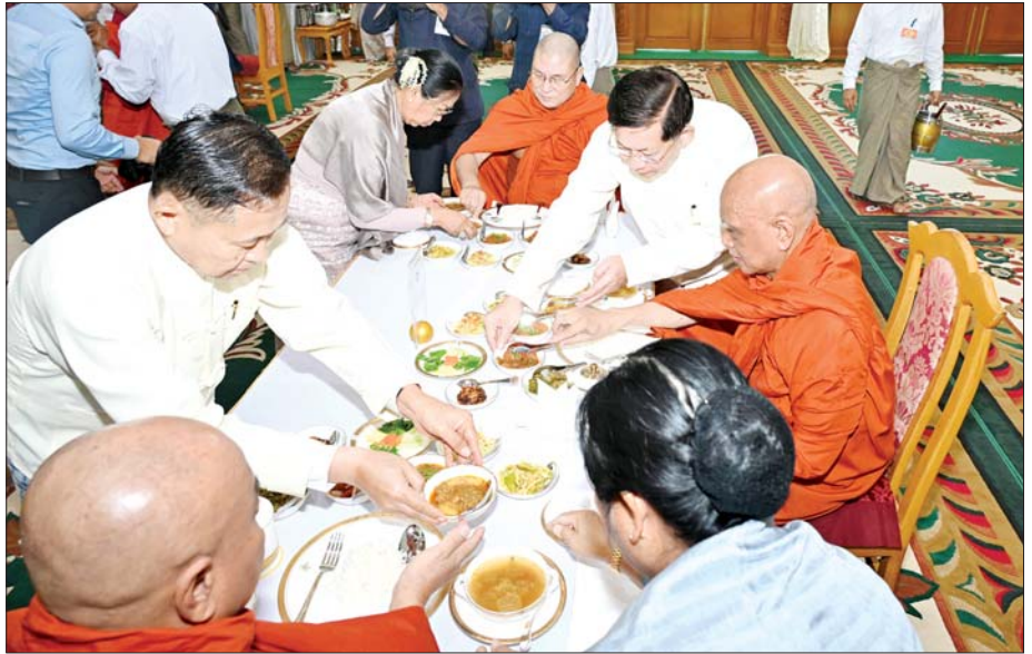
နိုင်ငံတော်စီမံအုပ်ချုပ်ရေးကောင်စီဥက္ကဋ္ဌ တပ်မတော်ကာကွယ်ရေးဦးစီးချုပ် ဗိုလ်ချုပ်မှူးကြီး မင်းအောင်လှိုင်နှင့် ဇနီး ဒေါ်ကြူကြူလှ၊ ကောင်စီဒုတိယဥက္ကဋ္ဌ ဒုတိယတပ်မတော်ကာကွယ်ရေးဦးစီးချုပ် ကာကွယ်ရေးဦးစီးချုပ် (ကြည်း) ဒုတိယဗိုလ်ချုပ်မှူးကြီး စိုးဝင်းနှင့်ဇနီး ဒေါ်သန်းသန်းနွယ်တို့ ဆရာတော်၊ သံဃာတော်များအား နေ့ဆွမ်း ဆက်ကပ်လှူဒါန်းစဉ်။

ထို့နောက် အခမ်းအနားကို “ဗုဒ္ဓသာသနံ စိရံ တိဋ္ဌတု” သုံးကြိမ် ရွတ်ဆိုဆုတောင်း၍ ရုပ်သိမ်းပြီး မဟာဘုံကထိန် အလှူတော် မင်္ဂလာအခမ်းအနား အောင်မြင် ပြင်းအထိမ်းအမှတ်အဖြစ် ရတနာ ရွှေမိုး၊ ငွေမိုးများ ရွာသွန်းပြီးကြ သည်။ အခမ်းအနားအပြီးတွင် နိုင်ငံတော် သံဃမဟာနာယက အဖွဲ့ဥက္ကဋ္ဌ သန့်လျင်မင်းကျောင်း ဆရာတော်ကြီး အမှူးပြုသည့် ဆရာတော်၊ သံဃာတော်များ