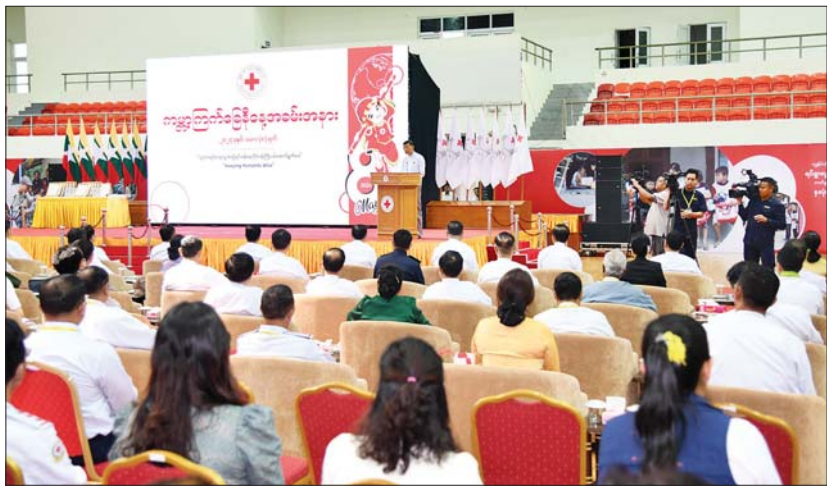
နိုင်ငံတော်စီမံအုပ်ချုပ်ရေးကောင်စီဝင် ဒုတိယဝန်ကြီးချုပ်နှင့် ပြည်ထောင်စုဝန်ကြီး ဗိုလ်ချုပ်ကြီး မြထွန်းဦး ၂၀၂၄ ခုနှစ် ကမ္ဘာ့ကြက်ခြေနီနေ့ အထိမ်းအမှတ်အခမ်းအနားတွင် အမှာစကားပြောကြားစဉ်။

ရာစုနှစ်တစ်ခုကျော် တည်ရှိခဲ့ခဲ့သည့် နိုင်ငံတော်စီမံအုပ်ချုပ်ရေးကောင်စီဝင် ဒုတိယဝန်ကြီးချုပ်နှင့် ပို့ဆောင်ရေးနှင့် ဆက်သွယ်ရေးဝန်ကြီးဌာန ပြည်ထောင်စုဝန်ကြီး ဗိုလ်ချုပ်ကြီး မြထွန်းဦးက ဂုဏ်ပြုအမှာစကားပြောကြားရာတွင် ၁၈၅၉ ခုနှစ် ဆိုဖာရီနို