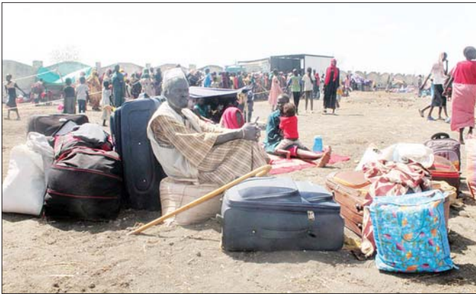
တောင်ဆူဒန်မှ နေရပ်စွန့်ခွာလာသူများကို ၂၀၂၃ ခုနှစ် ဧပြီ ၃၀ ရက်က တွေ့ရစဉ်။

ဂျူးဘား မေ ၈ တောင်ဆူဒန်နိုင်ငံ၌ ငြိမ်းချမ်းရေး သဘောတူညီချက်ကို လက်မှတ် ရေးထိုးပြီးသည့်အချိန်မှစတင်ကာ ၂၀၁၈ ခုနှစ် အောက်တိုဘာလမှ ၂၀၂၄ ခုနှစ် မတ် ၃၁ ရက်အတွင်း နေရပ်ပြန်သည့် တောင်ဆူဒန် နိုင်ငံသား ၁ ဒသမ ၃၃ သန်းခန့် ရှိသည်ဟု မေ ၈ ရက်တွင် ကုလသမဂ္ဂအေဂျင်စီက ပြောသည်။ မတ်လအတွင်း နေရပ်ပြန် သည့် တောင်ဆူဒန်နိုင်ငံသား ၄၅၄၂၉ ဦး ရှိပြီး ငြိမ်းချမ်းရေး ဖေ့စ်ဘွတ်ခ်လ်နှင့် နှိုင်းယှဉ်လျှင် နေရပ်ပြန်သည်ပေါင်း ၈၂ ရာခိုင်နှုန်းတိုးလာသည်ဟု ကုလသမဂ္ဂ ဒုက္ခသည်များဆိုင်ရာ မဟာမင်းကြီး ရုံးက သတင်းထုတ်ပြန်ခဲ့သည်။ တောင်ဆူဒန်မှ ဒုက္ခသည်များ ခိုလှုံနေသည့် ဆူဒန်နိုင်ငံအတွင်း အစားအသောက်ဖူလုံမှု မရှိခြင်းနှင့် အစားအသောက်ဝေခွဲပေးမှု