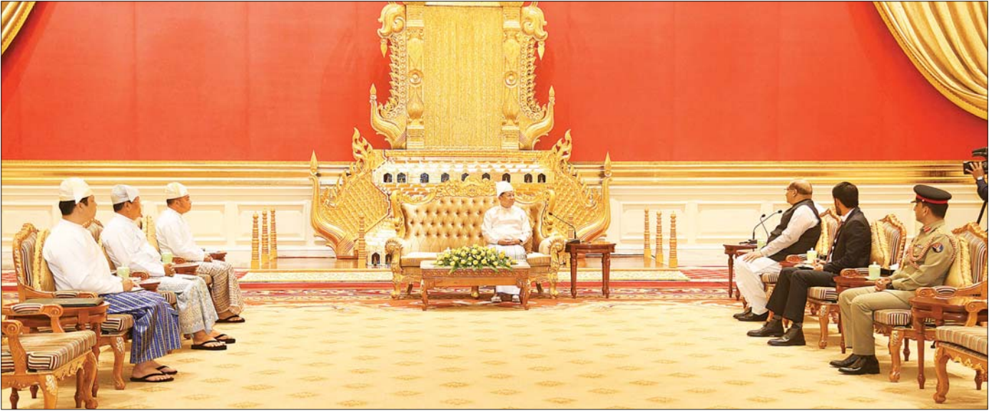
နိုင်ငံတော်စီမံအုပ်ချုပ်ရေးကောင်စီဥက္ကဋ္ဌ နိုင်ငံတော်ဝန်ကြီးချုပ် ဗိုလ်ချုပ်မှူးကြီး မင်းအောင်လှိုင် မြန်မာနိုင်ငံဆိုင်ရာ ပါကစ္စတန်နိုင်ငံ သံအမတ်ကြီး H.E. Mr. Imran Haider အား လက်ခံတွေ့ဆုံစဉ်။