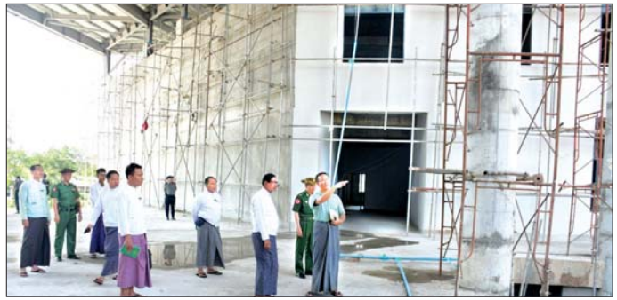
ပေးထားပြီး ပန်းခြံအတွင်း ပိုက်ကျော်ခြင်းကွင်း၊ ကြည့်ရှုပြီး တာဝန်ရှိသူများအား လိုအပ်သည်များ တော်လီဘောကွင်း၊ ဘောလုံးကွင်း ဆောင်ရွက် မှာကြားခဲ့ကြောင်း သိရသည်။ ဆန်းကျော်ဦး (ပြန်/ဆက်)

ယင်းနောက် တိုင်းဒေသကြီးဝန်ကြီးချုပ်နှင့် အဖွဲ့သည် ဘုရင့်နောင်တံတားနစ်စင်းကြားရှိ ပြည်သူ များ အနားယူအပန်းဖြေနိုင်ရေးပန်းခြံတည်ဆောက်