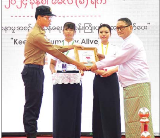
နိုင်ငံတော်စီမံအုပ်ချုပ်ရေးကောင်စီဝင် ဒေါက်တာမူထန် ၂၀၂၄ ခုနှစ် ကမ္ဘာ့ကြက်ခြေနီနေ့အထိမ်းအမှတ် စာစီစာကုံးပြိုင်ပွဲတွင် ဆုရရှိသူတစ်ဦးအား ဂုဏ်ပြုဆုတံဆိပ်၊ ဂုဏ်ပြုမှတ်တမ်းလွှာနှင့် ဂုဏ်ပြုဆုငွေများ ပေးအပ်ချီးမြှင့်စဉ်။