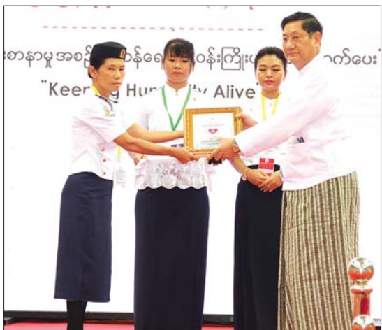
နိုင်ငံတော်စီမံအုပ်ချုပ်ရေးကောင်စီဝင် ဒေါက်တာဘရွှေ ၂၀၂၄ ခုနှစ် ကမ္ဘာ့ကြက်ခြေနီနေ့အထိမ်းအမှတ် ကဗျာပြိုင်ပွဲတွင် မြန်မာဘာသာဖြင့် ဆုရရှိသူတစ်ဦးအား ဂုဏ်ပြုဆုတံဆိပ်၊ ဂုဏ်ပြုမှတ်တမ်းလွှာနှင့် ဂုဏ်ပြုဆုငွေများ ပေးအပ်ချီးမြှင့်စဉ်။