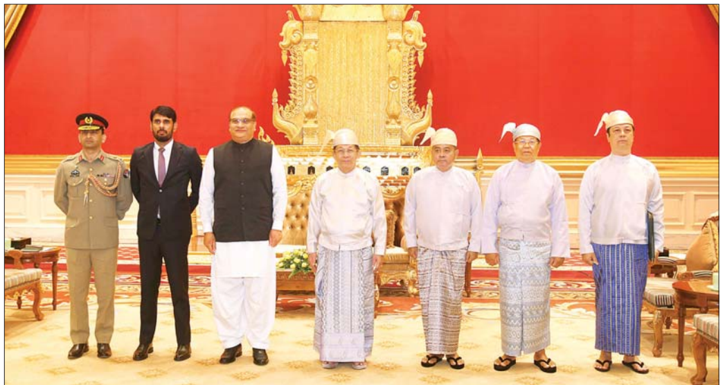
နိုင်ငံတော်စီမံအုပ်ချုပ်ရေးကောင်စီဥက္ကဋ္ဌ နိုင်ငံတော်ဝန်ကြီးချုပ် ဗိုလ်ချုပ်မှူးကြီး မင်းအောင်လှိုင်နှင့် အဖွဲ့ဝင်များ မြန်မာနိုင်ငံဆိုင်ရာ ပါကစ္စတန်နိုင်ငံသံအမတ် ကြီး H.E. Mr. Imran Haider ဦးဆောင်သောအဖွဲ့နှင့်အတူ စုပေါင်းမှတ်တမ်းတင်ဓာတ်ပုံရိုက်စဉ်။