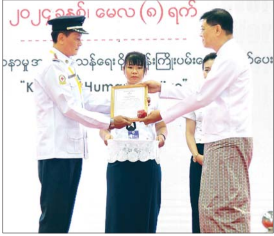
နိုင်ငံတော်စီမံအုပ်ချုပ်ရေးကောင်စီဝင် ဒုတိယဝန်ကြီးချုပ်နှင့် ပြည်ထောင်စုဝန်ကြီး ဗိုလ်ချုပ်ကြီး မြထွန်းဦး ကြက်ခြေနီသနာပြုတပ်ဖွဲ့ဝင်များကိုယ်စား မကျေးတိုင်းဒေသကြီးမှ တိုင်းဒေသကြီး တပ်ဖွဲ့မှူး ဦးကျော်မြင့်အား ဂုဏ်ပြုဆုတံဆိပ်၊ ဂုဏ်ပြုမှတ်တမ်းလွှာနှင့် ဂုဏ်ပြုဆုငွေများ ပေးအပ်ချီးမြှင့်စဉ်။