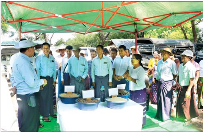
သဘာဝမြေဩဇာပြုလုပ်နည်းကို တာဝန်ရှိသူတစ်ဦးက ရှင်းပြနေစဉ်။

“မွေးမြူရေးချေးငွေ ကြိုတင်ငွေရော ပေးတာရှိ