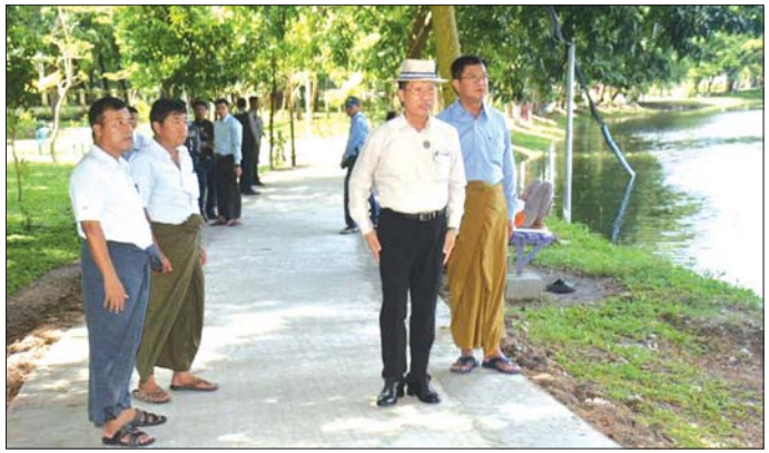
ရောဂါတိုင်းဒေသကြီးဝန်ကြီးချုပ် ဦးတင်မောင်ဝင်း ပုသိမ်မြို့ ကန့်သုံးဆင့်ကန့်ပတ်လမ်း တိုးချဲ့ ဆောင်ရွက်နေမှုများကို ကြည့်ရှုစစ်ဆေးစဉ်။

မြှင့်တင်ခြင်းလုပ်ငန်း ဆောင်ရွက်နေမှုများကို ကြည့်ရှုစစ်ဆေးပြီး တာဝန်ရှိသူများ၏ ရှင်းလင်း တင်ပြမှုများအပေါ် ကန့်ပတ်လမ်းအား လမ်းပန်းများ စနစ်တကျဆောင်ရွက်စေရေး၊ အများပြည်သူများ စိတ်အေးချမ်းစွာ အနားယူနိုင်စေရေး၊ မြက်ခင်းများ စနစ်တကျ စိုက်ပျိုးစေရေး၊ ပျိုးဥယျာဉ်များ စနစ် တကျစိုက်ပျိုးစေရေးနှင့် အမှိုက်ပုံးများထားရှိ၍ အမှိုက်များစနစ်တကျ စွန့်ပစ်စေရေးနှင့် သတ်မှတ် ကာလအတွင်း ပြီးစီးစေရေး မှာကြားသည်။ ထို့နောက် တိုင်းဒေသကြီး ဝန်ကြီးချုပ်နှင့် တာဝန်ရှိသူများက လမ်းလုပ်ငန်းဆောင်ရွက်နေမှုများ ကို ကြည့်ရှုစစ်ဆေးခဲ့ပြီး green area ဆောင်ရွက် မည့်အခြေအနေများကို ရှင်းလင်းတင်ပြမှုအပေါ် တိုင်းဒေသကြီး ဝန်ကြီးချုပ်က လမ်းအရည်အသွေး ပြည့်စီရေးနှင့် သတ်မှတ်ကာလအတွင်း ပြီးစီးစေ ရေးမှာကြားခဲ့ကြောင်း သိရသည်။ တိုင်းဒေသကြီး(ပြန်/ဆက်)