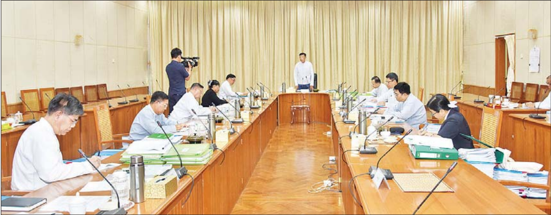
နိုင်ငံတော်စီမံအုပ်ချုပ်ရေးကောင်စီအဖွဲ့ဝင်၊ ဒုတိယဝန်ကြီးချုပ်နှင့် မြန်မာနိုင်ငံ ရင်းနှီးမြှုပ်နှံမှုကော်မရှင်ဥက္ကဋ္ဌ ဗိုလ်ချုပ်ကြီး မြထွန်းဦး၊ မြန်မာနိုင်ငံရင်းနှီးမြှုပ်နှံမှု ကော်မရှင်၏ (၈/၂၀၂၄) ကြိမ်မြောက် အစည်းအဝေးတွင် အမှာစကားပြောကြားစဉ်။

နေပြည်တော် စက်တင်ဘာ ၃၀ မြန်မာနိုင်ငံရင်းနှီးမြှုပ်နှံမှု ကော်မရှင်၏ (၈/၂၀၂၄) ကြိမ်မြောက် အစည်းအဝေးကို ယနေ့ နံနက်ပိုင်းတွင် နေပြည်တော်ရှိ ရုံးအမှတ်(၁၈) အစည်းအဝေးခန်းမ၌ ကျင်းပရာ အစည်းအဝေးသို့ နိုင်ငံတော်စီမံအုပ်ချုပ်ရေးကောင်စီအဖွဲ့ဝင်၊ ဒုတိယဝန်ကြီးချုပ်နှင့် မြန်မာနိုင်ငံ ရင်းနှီးမြှုပ်နှံမှု ကော်မရှင်ဥက္ကဋ္ဌ ဗိုလ်ချုပ်ကြီး မြထွန်းဦးနှင့် ကော်မရှင်အဖွဲ့ဝင်များ တက်ရောက်ကြသည်။