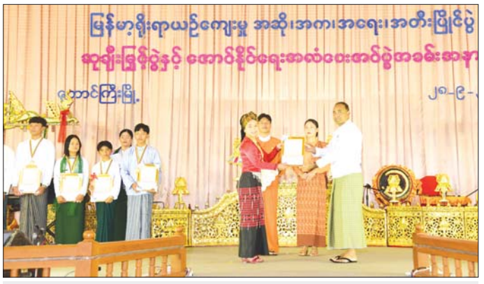
ပြည်နယ်ဝန်ကြီးချုပ် ဦးအောင်အောင် ပြိုင်ပွဲတွင် ဆုရရှိသူတစ်ဦးအား ဆုချီးမြှင့်စဉ်။

အခြေခံပညာ ဦးစီးဌာနတို့အား ဂုဏ်ပြုချီးမြှင့်ငွေများ ပေးအပ်သည်။ ယင်းနောက် ပြည်နယ်ဝန်ကြီးချုပ်က (၂၅)ကြိမ် မြောက် ငွေရတုအထိမ်းအမှတ် မြန်မာ့ရိုးရာ ယဉ်ကျေးမှု အဆို၊ အက၊ အရေး၊ အတီးပြိုင်ပွဲကို နေပြည်တော်တွင် သီတင်းကျွတ်ကျောင်းပိတ်ရက် ကာလဖြစ်သည့် အောက်တိုဘာ ၁၄ ရက်မှ ၂၃ ရက် အထိ စည်ကားသိုက်မြိုက်စွာ ကျင်းပမည်ဖြစ် ကြောင်း၊ ရှမ်းပြည်နယ်အဆင့် ပြိုင်ပွဲကြီးကိုလည်း ကိုယ်ပိုင်အုပ်ချုပ်ခွင့်ရဒေသများ၊ ခရိုင်များမှ ပြိုင်ပွဲဝင် ၂၅ ဦးဖြင့် အောင်မြင်စွာ ကျင်းပနိုင်ခဲ့ပြီ ဖြစ်ကြောင်း၊ နိုင်ငံတော်အဆင့် ပြိုင်ပွဲသို့ ရှမ်းပြည် နယ်အနေဖြင့် အဆိုဘာသာရပ်တွင် ပြိုင်ပွဲအမျိုး အစား ၁၆ မျိုး၊ အကဘာသာရပ်တွင် ပြိုင်ပွဲ အမျိုး အစား ၁၁ မျိုး၊ အရေးဘာသာရပ်တွင် ပြိုင်ပွဲအမျိုး အစား တစ်မျိုး၊ အတီးဘာသာရပ်တွင် ပြိုင်ပွဲအမျိုး အစား ၂၄ မျိုး စုစုပေါင်းပြိုင်ပွဲ အမျိုးအစား ၅၂ မျိုး တွင် ပြိုင်ပွဲဝင် ၁၂၈ ဦးဖြင့် သွားရောက်ယှဉ်ပြိုင်နိုင်ရေး ရွေးချယ်ပြီးဖြစ်၍ ပြိုင်ပွဲကြီးကို ဂုဏ်သိက္ခာ ရှိရှိပါဝင် ယှဉ်ပြိုင်ကြပြီး ရှမ်းပြည်နယ်၏ ဂုဏ်ကိုဆောင်နိုင် ရေးအတွက် ကိုယ်စွမ်း၊ ဉာဏ်စွမ်းရှိသရွေ့ စီရိယ