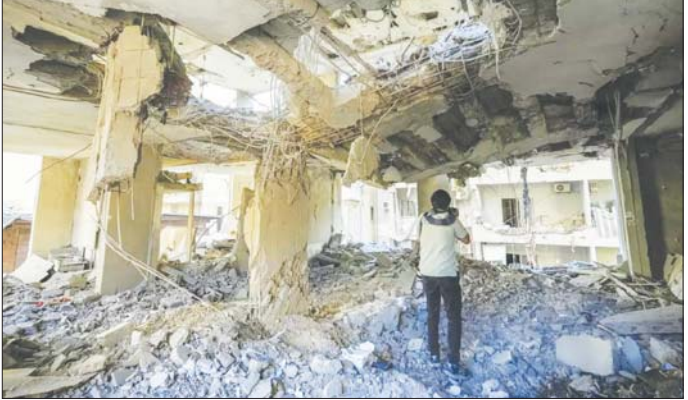
ဆင်ပွား၊ အင်န်အိတ်ချ်ကေ

နိုင်ငံအား တိုက်ခိုက်မှုတစ်ချိန်မှ စ၍ ဒုက္ခသည်စခန်းကို ပထမဆုံး အကြိမ် ပစ်မှတ်ထားတိုက်ခိုက် ခြင်းဖြစ်ကြောင်း လက်ဘနွန် အမျိုးသား သတင်းအေဂျင်စီ၏ ကနဦးသတင်းတွင် ဖော်ပြသည်။ ဖာတာရာရစ်ဖီသည် ပါလက် စတိုင်း စတိုင်း ပြည်သူများအတွက် တစ်သက်တာ တာဝန်ကျေပွန် စွာ ထမ်းဆောင်ခဲ့ပြီး ကျဆုံး လေပြီးသော ခေါင်းဆောင်များ၊ အာဇာနည်များနှင့်အတူ ပူးပေါင်း သွားပြီဖြစ်ကြောင်း ဟားမာစ် အဖွဲ့က အတည်ပြုထုတ်ပြန် သည်။