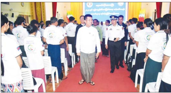
တိုင်းဒေသကြီး ဝန်ကြီးချုပ် ဦးတင်မောင်ဝင်း စာရင်းကောက်အဖွဲ့များအား ရင်းရင်းနှီးနှီး နှုတ်ဆက်စဉ်။

ပုသိမ် စက်တင်ဘာ ၃၀ ဧရာဝတီတိုင်းဒေသကြီး ပုသိမ် မြို့၊ မြို့တော်ခန်းမ၌ ၂၀၂၄ ခုနှစ် လူဦးရေနှင့်အိမ်အကြောင်း အရာသန်းခေါင်စာရင်းကောက်ယူ ရေးလုပ်ငန်း ညှိနှိုင်းအစည်းအဝေး ကို စက်တင်ဘာ ၂၈ ရက်က ကျင်းပသည်။ တင်ပြဆွေးနွေး ဦးစွာဧရာဝတီတိုင်းဒေသကြီး သန်းခေါင်စာရင်း ကြီးကြပ်မှု ကော်မတီဥက္ကဋ္ဌ တိုင်းဒေသကြီး ဝန်ကြီးချုပ်က ၂၀၂၄ ခုနှစ် လူဦး ရေနှင့် အိမ်အကြောင်းအရာ သန်းခေါင်စာရင်း အောင်မြင်စွာ ကောက်ယူနိုင်ရေးအတွက် ဖွဲ့စည်း အဆင့် စာရင်းစစ်၊ စာရင်း ကောက်သင်တန်းများ ဖွင့်လှစ်ခဲ့