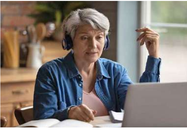
Ref : Sputnik News Trs : KKO

ခွေးများနှင့် ခွေးအမျိုးမပေါ်ထွက်မီကပင် မျိုးသုဉ်းပျောက်ကွယ်ခဲ့ရသည့် Hyaenodonts ခေါ် သားရဲအုပ်စုမှ မျိုးစိတ်တစ်ခုဖြစ်သည်။ Hyaenodonts အုပ်စုဝင် သားရဲများသည် ဒိုင်နိုဆော့သတ္တဝါများ ပျောက်ကွယ်ခဲ့ပြီးနောက် အာဖရိကတိုက်၏ ဂေဟဝန်းကျင်စနစ်ကို လွှမ်းမိုးထားခဲ့သော သက်ရှိများဖြစ်ကြသည်ဟု အီဂျစ် ပြောကြားကြောင်း သိရသည်။ Bastetodon Syrtos များသည် မျောက်များ၊ ဆင်သားပေါက်၊ ရေမြင်းသားပေါက်များကို အမဲလိုက်စားသောက်၍ ရှင်သန်ခဲ့ကြခြင်းဖြစ်နိုင်ကြောင်း သိပ္ပံပညာရှင်များက သုံးသပ်ထားသည်။ Ref : Russia Today Trs : KKO