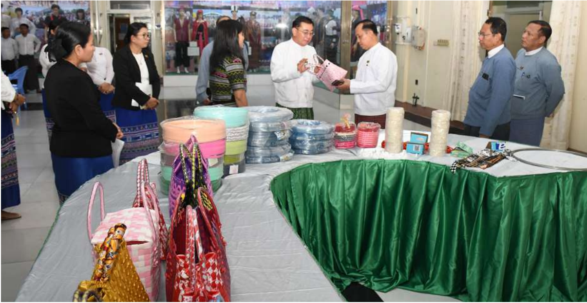
ကြိုးစားသင်ယူ၍ ကိုယ်ပိုင်အသေးစား သည့်စီးပွားရေးဦးတည်ချက်ကို အထောက်အခန်းကဏ္ဍမှ အားကြိုးမာန်တက် ကြိုးစားဆောင်ရွက်ကြရန်လိုကြောင်း၊ သင်တန်းတက်ရောက်သူများအနေဖြင့် ပြည်နယ်နှင့်

နေပြည်တော် ဖေဖော်ဝါရီ ၂၄ တိုင်းရင်းသားလူမျိုးများရေးရာဝန်ကြီးဌာန တိုင်းရင်းသားအခွင့်အရေးများကာကွယ်စောင့်ရှောက်ရေး ဦးစီးဌာနက ကြိုးပမ်းဆောင်ရွက်သည့် ခြင်းရက်လုပ်နည်းသင်တန်းအမှတ်စဉ်(၁/၂၀၂၅) ဖွင့်ပွဲအခမ်းအနားကို ယနေ့နံနက်ပိုင်းတွင် တိုင်းရင်းသားလူမျိုးရေးရာဝန်ကြီးဌာန အစည်းအဝေးခန်းမ၌ကျင်းပရာ ပြည်ထောင်စုဝန်ကြီး ခွန်သန့်ဇော်ထူး တက်ရောက်အားပေးသည်။