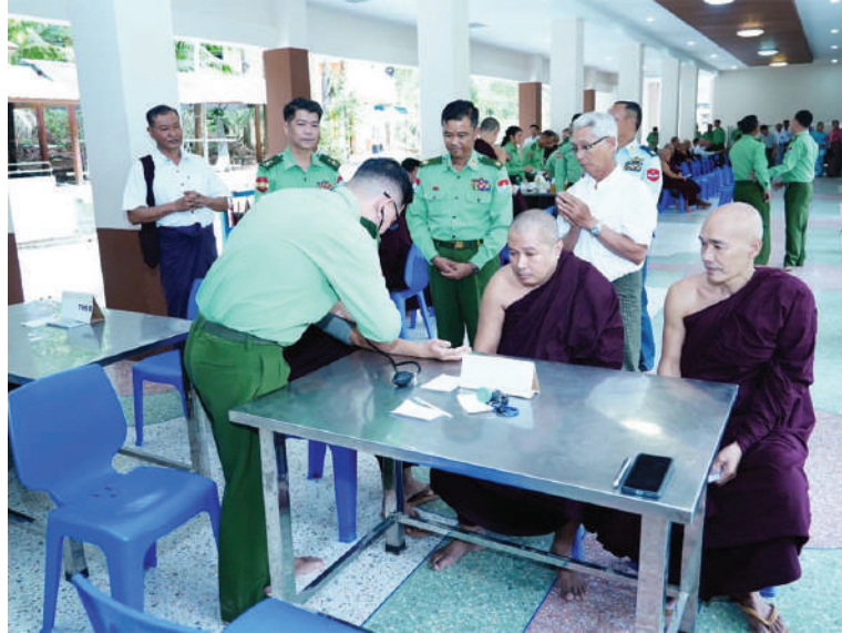
သံဃာတော်များအား နယ်လှည့်ဆေးကုသရေးအဖွဲ့က ကျန်းမာရေးစောင့်ရှောက်မှုလုပ်ငန်းများဆောင်ရွက်ပေးနေမှုကို ကမ်းရိုးတန်းဒေသတိုင်းစစ်ဌာနချုပ် တိုင်းမှူး ဗိုလ်မှူးချုပ်ကျော်ကျော်ဟန် ကြည့်ရှုအားပေးစဉ်။

နေပြည်တော် ဖေဖော်ဝါရီ ၂၄ တနင်္သာရီတိုင်းဒေသကြီး မြတ်မြို့ ဖားအောက်တောရဗုဒ္ဓသာသနာ့ရိပ်သာရှိ သံဃာတော်များ၊ သာသနာ့နယ်ဝင်သီလရှင်