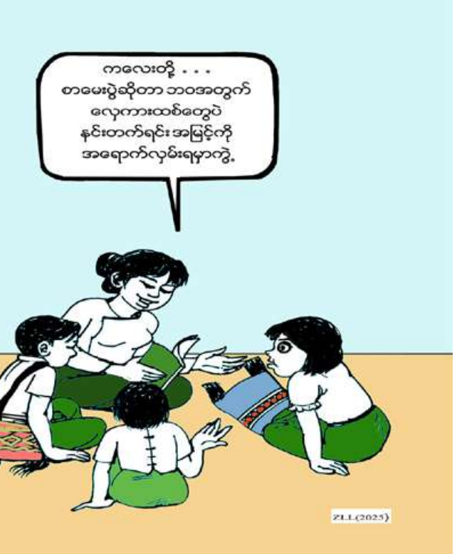
ကလေးတို့... စာမေးပွဲဆိုတာ ဘဝအတွက် လေ့ကျင့်ထမ်းတွေပဲ နင်းတက်ရင်း အမြင့်ကို အရောက်လှမ်းရမှာကွဲ့။

ကျိုက်လတ် ဖေဖော်ဝါရီ ၂၄ ခဲ့ကြောင်း သိရသည်။ ဧရာဝတီတိုင်းဒေသကြီး "ကျိုက်လတ်မြို့နယ်ကနေ ရန်ကုန် ဈေးကွက်ထဲကို မွေးမြူရေးအသားစား ကျိုက်လတ်မြို့နယ်မှ ရန်ကုန်ဈေးကွက် သို့ ဇန်နဝါရီလအတွင်း မွေးမြူရေး ကြက်တွေကို အကောင်လိုက်အရင်ကို အသားစားကြက်ပိဿာချိန် ၇၇၀၀၀ ထိ တင်ပို့ရောင်းချနိုင်ခဲ့ကြောင်း ကျိုက်လတ် မြို့နယ်မှ မွေးမြူရေးနှင့် ရေထွက်ကုန် ရောင်းဝယ်ရေး ပွဲရုံပိုင်ရှင်ဒေါ်အေးမော် က ပြောပြသည်။ ကျိုက်လတ်မြို့နယ်မှ ရန်ကုန် ဈေးကွက်သို့ ၂၀၂၄ခုနှစ် ဒီဇင်ဘာလ အတွင်းက မွေးမြူရေးအသားစားကြက် ပိဿာချိန် ၆၃၀၀၀ထိသာ တင်ပို့ ရောင်းချနိုင်ခဲ့ပြီး ဇန်နဝါရီလ ၁ ရက်မှ ၃၁ ရက်ထိ မွေးမြူရေးအသားစားကြက် ပိဿာချိန် ၇၇၀၀၀ ထိ တင်ပို့ရောင်းချ ရေထွက်ကုန်ရောင်းဝယ်ရေး ပွဲရုံပိုင်ရှင် ဒေါ်အေးမော်က ပြောပြ၍ သိရသည်။ ကျိုက်လတ်မြို့နယ်တွင်မှ ရန်ကုန် ဈေးကွက်သို့ တင်ပို့ရောင်းချခဲ့သည့် မွေးမြူရေးကြက်သား ၁၀ ပိဿာလျှင် ငွေကျပ် ၁၄၅၀၀၀ ပေါက်ဈေးရှိ ကြောင်း အဆိုပါမွေးမြူရေးကြက်သား များကို ရန်ကုန်ဈေးကွက်သို့ တင်ပို့ ရောင်းချမှု များပြားလာသည့်အတွက် မွေးမြူရေးလုပ်ငန်းရှင်များ၊ မွေးမြူရေး လုပ်သားများ၊ ကုန်သည်များ၊ ကုန်တင် ကုန်ချလုပ်သားများ အဆင်ပြေနေ ကြောင်း ကျိုက်လတ်မြို့နယ် မွေးမြူ ရေးနှင့် ရေထွက်ကုန်ရောင်းဝယ်ရေး ပွဲရုံပိုင်ရှင် ဒေါ်အေးမော်ထံမှ သိရသည်။ ကျော်ကျော်လင်း