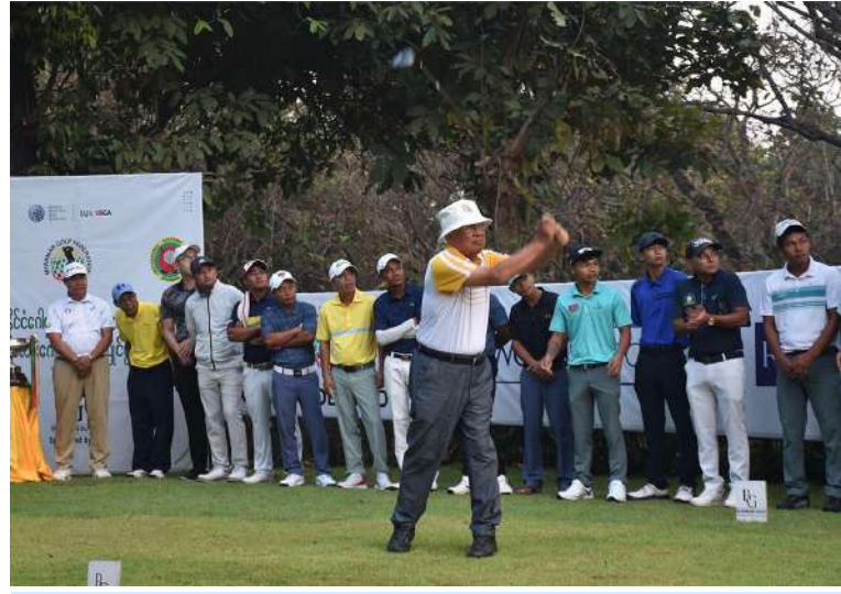
မြန်မာနိုင်ငံဂေါက်သီးအားကစားအဖွဲ့ချုပ် နာယက ဦးဝင်းလှိုင် ဂေါက်သီးရိုက်၍ ပြိုင်ပွဲကို ဖွင့်လှစ်ပေးစဉ်။

ကြသည်။ ယနေ့ပြိုင်ပွဲတွင် ဝါသနာရှင်အဆင့် အမျိုးသား ၁၄၄ ဦး၊ ဝါသနာရှင်အဆင့် သက်ကြီးတန်း(အသက်၅၅ နှစ်နှင့်အထက်) ၂၇ ဦး စုစုပေါင်း အားကစားသမား ၁၇၄ ဦး ဝင်ရောက်ယှဉ်ပြိုင်မည်ဖြစ်ပြီး ပြိုင်ပွဲကို မျိုးဆက်သစ်ဂေါက်သီးအားကစားသမားများ၏ လက်ရည်အဆင့်အတန်းတိုးတက်လာစေရန်နှင့် နိုင်ငံတကာအဆင့်မီယှဉ်ပြိုင်နိုင်စေရန် ရည်ရွယ်ကျင်းပခြင်းဖြစ်သည်။ ပြိုင်ပွဲကို ရန်ကုန်မြို့ရှိ ရန်ကုန်ဂေါက်ကွင်း(တည်းကုန်း)၌ ဖေဖော်ဝါရီ ၂၄ ရက် မှ ၂၇ ရက်နေ့ထိ လေးရက်ကြာပြုလုပ်သွားမည်ဖြစ်ကြောင်း သတင်းရရှိသည်။ (၅၀၁)