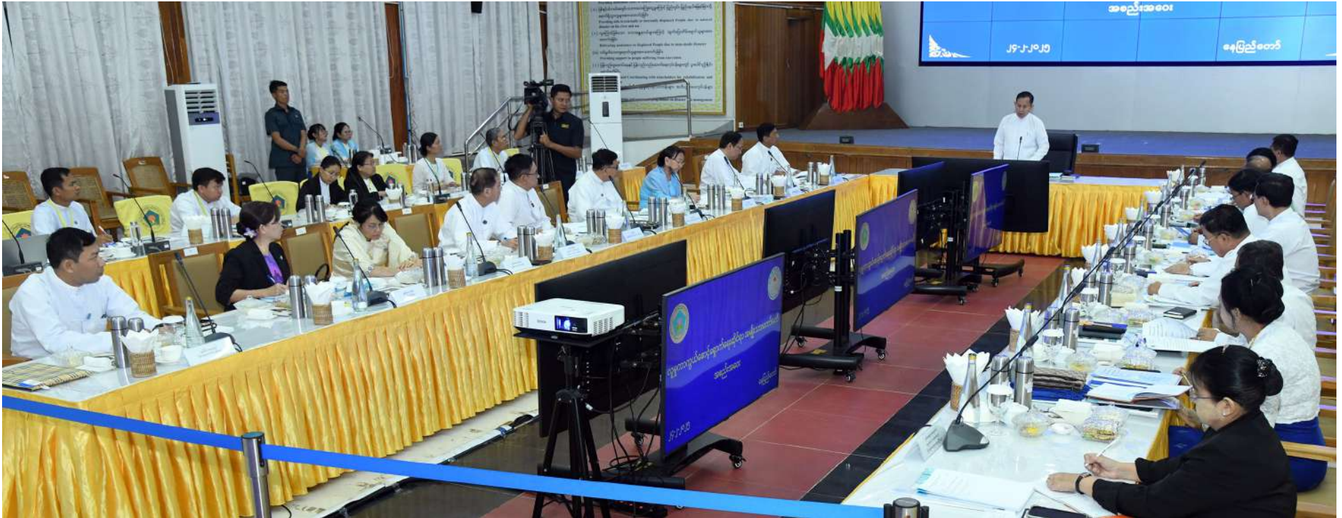
လူမှုကာကွယ်စောင့်ရှောက်ရေးဆိုင်ရာ အမျိုးသားကော်မတီဥက္ကဋ္ဌ နိုင်ငံတော်စီမံအုပ်ချုပ်ရေးကောင်စီ ဒုတိယဥက္ကဋ္ဌ ဒုတိယဝန်ကြီးချုပ် ဒုတိယဗိုလ်ချုပ်မှူးကြီးစိုးဝင်း လူမှုကာကွယ်စောင့်ရှောက်ရေးဆိုင်ရာ အမျိုးသားကော်မတီအစည်းအဝေးတွင် အမှာစကားပြောကြားစဉ်။