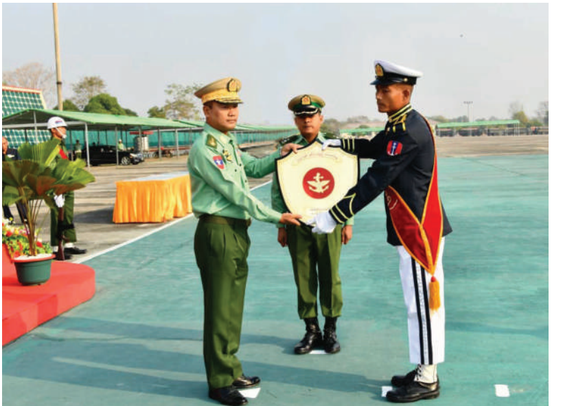
တပ်မတော်နေ့ကျင်းပရေးဦးစီးကော်မတီဥက္ကဋ္ဌ တပ်မတော်လေ့ကျင့်ရေးအရာရှိချုပ် ဒုတိယဗိုလ်ချုပ်ကြီးထိန်ဝင်း ပထမဆုရရှိသည့် ကာကွယ်ရေးဦးစီးချုပ်ရုံး(ရေ) ကိုယ်စားပြု စစ်တီးဝိုင်းအသင်းကို ဆုပေးအပ်ချီးမြှင့်စဉ်။

နှင့် ပထမဆုရရှိသည့် ကမ်းရိုးတန်းဒေသတိုင်းစစ်ဌာနချုပ်ကိုယ်စားပြု အမှတ်(၁) စစ်တီးဝိုင်း အသင်းခေါင်းဆောင်တို့ကို ဆုများအသီးသီးပေးအပ်ချီးမြှင့်သည်။ ဆက်လက်၍ (က)အဆင့်တွင် စစ်တီးဝိုင်းခေါင်းဆောင်ကျွမ်းကျင်မှု အကောင်းဆုံး ဆုရရှိသည့် စစ်တက္ကသိုလ်ကိုယ်စားပြု စစ်တီးဝိုင်းအသင်းခေါင်းဆောင်၊ (ခ)အဆင့်အသင်းလိုက် အထူးဆု ဂြိုဟ်ဒေသတိုင်းစစ်ဌာနချုပ်ကိုယ်စားပြုစစ်တီးဝိုင်းအသင်းနှင့် တောင်ပိုင်းတိုင်းစစ်ဌာနချုပ် ကိုယ်စားပြု စစ်တီးဝိုင်းအသင်း၊ တတိယဆုရရှိသည့် အလယ်ပိုင်းတိုင်းစစ်ဌာနချုပ် ကိုယ်စားပြု အမှတ်(၁)စစ်တီးဝိုင်းအသင်း၊ ဒုတိယဆုရရှိသည့် ရန်ကုန်တိုင်းစစ်ဌာနချုပ်ကိုယ်စားပြု အမှတ်(၁)စစ်တီးဝိုင်းအသင်း၊ ပထမဆုရရှိသည့် နေပြည်တော်တိုင်းစစ်ဌာနချုပ် ကိုယ်စားပြု အမှတ်(၁)စစ်တီးဝိုင်းအသင်း၊