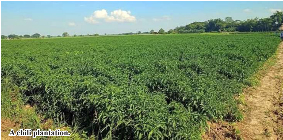
A chilli plantation.