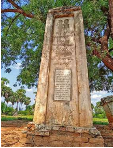
ယုန်လွတ်ကျွန်းအထိမ်းအမှတ် ကျောက်စာတိုင်ကို တွေ့ရစဉ်။

ဘီစီ ၄၈၄ မှာ မဟာသမ္ဘဝဟာ အဓိကပျူမြို့တော် သရေခေတ္တရာကို စတင်တည်ထောင်ခဲ့တယ်။ မင်းဆက် ၂၅ ဆက်ရှိပါတယ်။ အေဒီ ၉၄ ခုနှစ် သုပညာနာဂရဆိန္ဒလက်ထက်မှာ သရေခေတ္တရာ ပျူမြို့တော်ဟာ ပျက်စီးခဲ့ပါတယ်။ အဲဒီပျူတွေဟာ ဧရာဝတီမြစ်ကွေ့ပြီး တောင်ညိုမှာ သုံးနှစ်၊ ပန်းတောင်းမှာ ခြောက်နှစ်၊ မင်းတုန်းမှာ သုံးနှစ် ရွှေ့ပြောင်းနေထိုင်ခဲ့ပါတယ်။ ပျူလူမျိုးတွေက သူတို့နဲ့လူမျိုးလဲတူ၊ စကားပြောလဲတူ၊ ဓလေ့လဲ တူတဲ့နေရာကို စနည်းနာကာ မြို့သစ်တည်အခြေချ ဖို့ နေရာရွေးချယ်ကြတော့တယ်။ ခေါင်းဆောင် သမုတိရာဇ်ဟာ ဧရာဝတီအထက်ပိုင်းတစ်နေရာမှာ ပျူလူမျိုးတွေ အများကြီးစုဝေးနေထိုင်ကာ ပျူဈေး ရှိတဲ့ ပျူဂါမလိုခေါ်တဲ့ ပျူရွာ ၁၉ ရွာကို စုစည်းစည်း နဲ့ တွေ့ရှိခဲ့ပါတယ်။ ဒါကြောင့် အေဒီ ၁၀၇ မှာ ခေါင်းဆောင်သမုတိရာဇ် ပျူဂါမကိုရောက်တော့ ပျူ ၁၉ ရွာက သူကြီး ၁၉ ယောက်ကိုစုရုံး တုရင် တောင်ရဲ့အရှေ့မြောက်ခြေရင်းက ယုန်လွတ်ကျွန်းကို ဗဟိုပြုကာ လေးမိုင်အတွင်းရှိတဲ့ မြေခဲတွင်း(ယခု မြေသင်းတွင်းရွာ)၊ တောင်ပရွာ(ယခု တောင်ဘရွာ) နဲ့ တောင်ခွင်ရွာအရှေ့ နှစ်မိုင်ခွဲက ကုက္ကိုရွာ (ယခု ရွာပျက်ပြီး အနားက မြေသင်းတွင်းနဲ့ တောင်ခွင်ရွာ တွေမှာ ပြောင်းနေခဲ့ကြပြီ)တို့ ပါဝင်ပါတယ်။