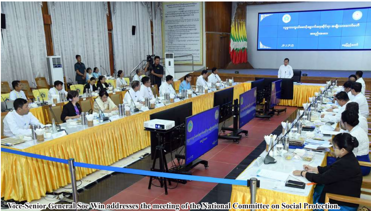
Vice-Senior General Soe Win addresses the meeting of the National Committee on Social Protection.