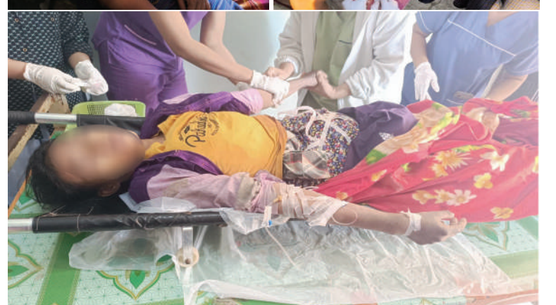
PDF အမည်ခံ အကြမ်းဖက်သမားများက လက်နက်ငယ်များဖြင့် လာရောက်ပစ်ခတ်ခဲ့မှုကြောင့် အပြစ်မဲ့ပြည်သူများ လက်နက်ငယ်ကျည်ထိမှန်ဒဏ်ရာများရရှိခဲ့မှု မှတ်တမ်းဓာတ်ပုံ။