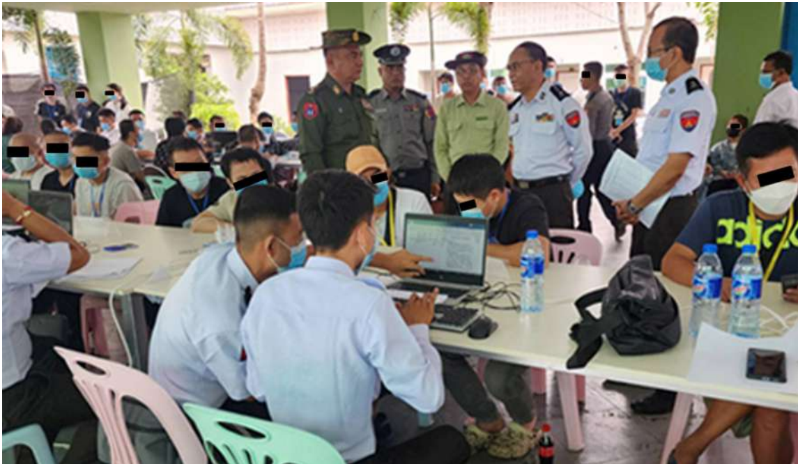
မြန်မာနိုင်ငံအတွင်းသို့ တရားမဝင် ဝင်ရောက်လာသည့် ပြည်ပနိုင်ငံသား ဦးရေ ၁၅၀ ထပ်မံစစ်ဆေးဖော်ထုတ်ထိန်းသိမ်းခဲ့မှု မှတ်တမ်းဓာတ်ပုံ။

နေပြည်တော် ဖေဖော်ဝါရီ ၂၄ နိုင်ငံတော်အစိုးရအနေဖြင့် နယ်စပ်ဒေသများတွင် ဖြစ်ပေါ်လျက်ရှိသည့် တရားမဝင် အွန်လိုင်းလောင်းကစားမှုများ၊ အွန်လိုင်းလိမ်လည်မှုများအပါအဝင် ဒုစရိုက်မှုများကို ထိထိရောက်ရောက်နှိမ်နင်းဆောင်ရွက်လျက်ရှိရာ ယနေ့တွင် မြဝတီမြို့-ရွှေဘိုကြိုလ်နှင့် KK Park နယ်မြေများသို့ တရားမဝင် လမ်းကြောင်းများမှတစ်ဆင့် ဝင်ရောက်နေကြသည့် ပြည်ပနိုင်ငံသား ဦးရေ ၁၅၀ ကို ထပ်မံစစ်ဆေးဖော်ထုတ် ထိန်းသိမ်းနိုင်ခဲ့သည်။ အဆိုပါ ထိန်းသိမ်းထားသည့် ပြည်ပနိုင်ငံသားများကို သက်ဆိုင်ရာနိုင်ငံများသို့ အမြန်ဆုံး ပြန်လည်လွှဲပြောင်းပေးအပ်နိုင်ရေး လိုအပ်သည့် ကိုယ်ရေးအချက်အလက်များနှင့် မှတ်တမ်းများ စာရင်းကောက်ယူခြင်းလုပ်ငန်းများကို ဌာနဆိုင်ရာ ပူးပေါင်းအဖွဲ့များဖြင့် နေ့ချင်းပြီးဆောင်ရွက်လျက်