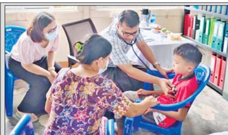
ပဲခူးတိုင်းဒေသကြီး သာယာဝတီခရိုင် ပြည်သူ့ဆေးရုံကြီးမှ အထူးထူးကုဆရာဝန်ကြီးများပါဝင်သော ဆေးကုသရေးအဖွဲ့သည် အုတ်ဖိုမြို့နယ်အတွင်းရှိ ဒေသခံပြည်သူများအား ဇွန် ၁၆ ရက်က မြို့နယ်ပြည်သူ့ဆေးရုံ၌ ကျန်းမာရေးဆေးစစ်ဆေးမှုများ ဆောင်ရွက် ပေးကြစဉ်။ အောင်သူ (အုတ်ဖို)

၉။ နိုင်ငံတော်သမ္မတ ဦးမင်းအောင်လှိုင်သည် ကိုယ်စားလှယ်အဖွဲ့အား နွေးထွေးစွာ ကြိုဆိုရက်ကြိုခဲ့သည့် သမ္မတ ရှိကျင့်ဖျင်၊ တရုတ်အစိုးရနှင့် တရုတ်ပြည်သူများအား လိုက်လံစောင့်ကြည့်ကြောင်း ပြောကြား ခဲ့ပြီး သမ္မတရှိကျင့်ဖျင်အား နှစ်ဦးနှစ်ဖက် အဆင်ပြေမည့်ကာလတွင် မြန်မာနိုင်ငံသို့ လာရောက်လည်ပတ်ပါရန် ရင်းနှီးလှိုက်လှိုက်ဖြင့် ဖိတ်ကြားခဲ့သည်။