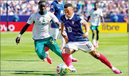
ပြင်သစ်အသင်းနှင့် ဆီနီဂေါအသင်းတို့ ယှဉ်ပြိုင်နေစဉ်။

၂၀၂၆ ခုနှစ် ကမ္ဘာ့ဖလားပြိုင်ပွဲရဲ့ ဇွန် ၁၇ ရက်မှာ ယှဉ်ပြိုင်ကစားခဲ့တဲ့ အုပ်စုအဆင့်ပွဲစဉ်တွေထဲမှာ လက်ရှိချန်ပီယံ အာဂျင်တီးနားအသင်းဟာ အယ်လ်ဂျီးရီးယားအသင်းကို တိုက်စစ်ဖျူးမက်ဆီရဲ့ ဟက်ထရစ်သွင်းဂိုးနဲ့ ဂိုးပြတ်နိုင်ပွဲရရှိခဲ့ပါတယ်။ စာမျက်နှာ ၁၇ ကော်လံ ၄ သို့ ။