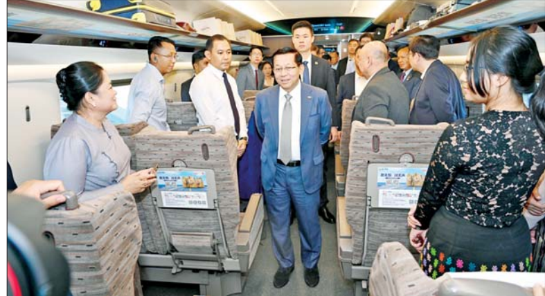
ပြည်ထောင်စုသမ္မတ မြန်မာနိုင်ငံတော် နိုင်ငံတော်သမ္မတ ဦးမင်းအောင်လှိုင် High-Speed Railway G23 ပေါ်၌ မြန်မာမီးရထားဆက်သွယ်ရေးလုပ်ငန်းဖွံ့ဖြိုးတိုးတက်ရေး အကောင်အထည်ဖော်ဆောင်ရာတွင် အတွေ့အကြုံယူ အသုံးပြု နိုင်ရေးအတွက် မေးမြန်းလေ့လာဆွေးနွေးစဉ်။