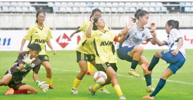
ဧရာဝတီအသင်း၏ ဂိုးသွင်းရန် ကြိုးပမ်းမှုကို သစ္စာအားမာန်အသင်း နောက်ခံလူများနှင့် ဂိုးသမား ကာကွယ်စဉ်။

သုဝဏ္ဏကွင်း၌ ကျင်းပသည့် ပွဲတွင် လက်ရှိချန်ပီယံ ဧရာဝတီအသင်းက သစ္စာအားမာန်အသင်းကို လေးဂိုးပြတ်အနိုင်ရခဲ့သည်။ ရာသီကြိုပြင်ဆင်မှုများစွာ ပြုလုပ်ထားသည့် ဧရာဝတီအသင်းသည် ဂိုးပြတ်အနိုင်ရလဒ်ဖြင့် စာမျက်နှာ ၁၇ ကော်လံ ၅ သို့ ။