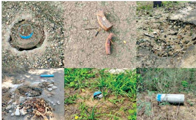
မြိုင်မြို့နယ် တွင်းမကျေးရွာအနီး ကမ္ဘ-မြိုင်သွား ကားလမ်းမပေါ်၌ PDF အမည်ခံ အကြမ်းဖက်သောင်းကျန်းသူများ ထောင်ထားသည့် လက်လုပ်မိုင်းမျိုးစုံ အလုံး ၂၀ အား လုံခြုံရေးတပ်ဖွဲ့ဝင်များက ဖယ်ရှားရှင်းလင်းနိုင်မှု။