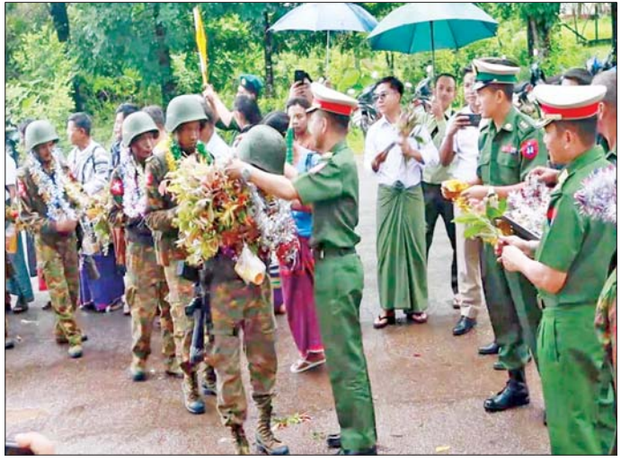
အောင်ပွဲရ ရှေ့တန်းပြန် နိုင်ငံ့သားကောင်းတပ်မတော်သားများအား အရှေ့တောင်တိုင်းစစ်ဌာနချုပ်မှ တာဝန်ရှိသူများ၊ ဌာနဆိုင်ရာတာဝန်ရှိသူများ၊ မြန်မာနိုင်ငံရဲတပ်ဖွဲ့ဝင်များ၊ ပြည်သူ့စစ်(ဌာန) တပ်ဖွဲ့ဝင်များနှင့် ဒေသခံပြည်သူများက သောင်းသောင်းဖြဖြ ဂုဏ်ပြုကြိုဆိုကြစဉ်။

ခဲ့သော ရှေ့တန်းပြန်တပ်မတော်သားများအား တက်ရောက်လာကြသူများက အောင်သပြေခက်များဖြင့်လည်းကောင်း၊ တိုင်းရင်းသားရိုးရာ အတိ၊ အမူတိ၊ အက၊ အခုန်များဖြင့်လည်းကောင်း ဝမ်းမြောက်စွာ သောင်းသောင်းဖြဖြ ကြိုဆိုဂုဏ်ပြုခဲ့ကြသည်။ ထို့နောက် တိုင်းစစ်ဌာနချုပ်မှ တာဝန်ရှိသူတစ်ဦးက အောင်ပွဲရ ရှေ့တန်းပြန်တပ်မတော်သားများအား ဂုဏ်ပြုအမှာစကားပြောကြားပြီး ဂုဏ်ပြုချီးမြှင့်ငွေများ ပေးအပ်ကာ အထူးနေ့လယ်စာဖြင့် တည်ခင်းညှိခံကြကြောင်း သိရသည်။ သတင်းစဉ်