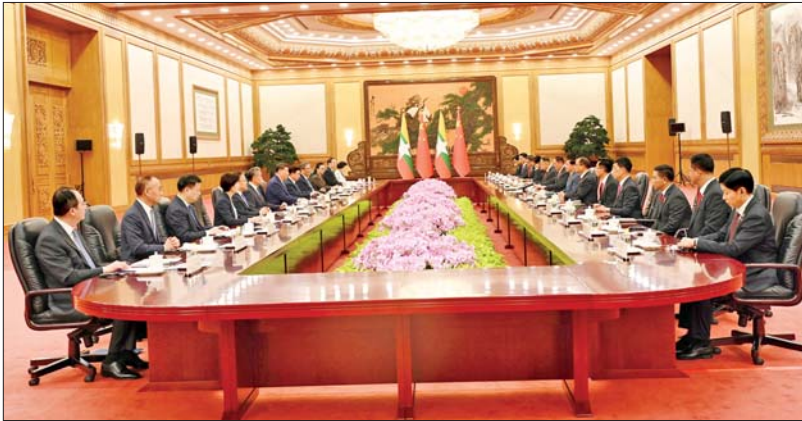
နိုင်ငံတော်သမ္မတ ဦးမင်းအောင်လှိုင်နှင့် တရုတ်ပြည်သူ့သမ္မတနိုင်ငံသမ္မတ မစ္စတာ ရှီကျင့်ဖျင်တို့ နှစ်နိုင်ငံကိုယ်စားလှယ်အဖွဲ့ဝင်များနှင့်အတူ ဇွန် ၁၆ ရက်က ဗူကျွန်ခန်းမဆောင်၌ တွေ့ဆုံဆွေးနွေးကြစဉ်။

တရုတ်နိုင်ငံအနေဖြင့်လည်း မတ်လဆန်းပိုင်းတွင် အရေးကြီးအစည်းအဝေးဖြစ်သည့် (၁၄)ကြိမ်မြောက် အမျိုးသားပြည်သူ့ကွန်ဂရက်အစည်းအဝေးနှင့် (၁၄)ကြိမ်မြောက် တရုတ်ပြည်သူ့နိုင်ငံရေး အတိုင်ပင်ခံကွန်ဖရင့်ကော်မတီအစည်းအဝေး (Two Sessions)ကို ကျင်းပခဲ့ပြီး ချမှတ်ခဲ့သည့် (၁၅)ကြိမ်မြောက် ငါးနှစ်သက်တမ်းအတွက် အရေးကြီးသည့်မူဝါဒများကို ချမှတ်ကျင့်သုံးနေချိန်ဖြစ်သည်။ Two Sessions အစည်းအဝေးတွင် ချမှတ်ခဲ့သည့် မဟာဗျူဟာ ဦးတည်ချက်များသည် တရုတ်နိုင်ငံ၏ ရေရှည်ဖွံ့ဖြိုးတိုးတက်ရေးအတွက်သာမက မြန်မာနိုင်ငံအပါအဝင် အိမ်နီးချင်းနိုင်ငံများအတွက် ဖွံ့ဖြိုးမှုဆိုင်ရာ အခွင့်အလမ်းသစ်များကို ဖန်တီးပေးနိုင်မည်ဟု ယုံကြည်ထားသည်။ ထို့ကြောင့် ယခုအချိန်သည် နှစ်နိုင်ငံအကြား ရှိရင်းစွဲကောင်းမွန်သည့် ဆက်ဆံရေးကို ပိုမိုခိုင်မာစေရန် နှစ်နိုင်ငံဘက်မှစီစဉ်ထားသည့် ဖော်ဆောင်ပေးမည့် ပူးပေါင်းဆောင်ရွက်မှု ပိုမိုမြှင့်တင်သွားရန် အချိန်အခါကောင်းပင်ဖြစ်ပါကြောင်း နိုင်ငံတော်သမ္မတက ပြောကြားခဲ့သည်။