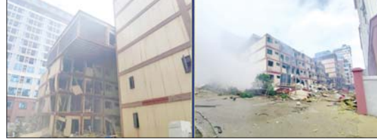
ကရင်ပြည်နယ် မြဝတီမြို့နယ် ရွှေကုက္ကိုလ်နယ်မြေရှိ အွန်လိုင်းလိမ်လည်လောင်းကစားမှု လုပ်ကိုင်ခဲ့သည့် တရားမဝင် ခုနစ်ထပ်လူနေအဆောက်အအုံများအား ယမ်းဖြင့် ဖောက်ခွဲဖျက်ဆီးပြီးစဉ်။

အဆောက်အအုံ ၅၇ လုံးနှင့် ဖောက်ခွဲ၍ ဖျက်ဆီးမည့် အဆောက်အအုံ အလုံး ၂၀ ဟူ၍ အဆောက်အအုံအမျိုးအစားအလိုက် ခွဲခြားသတ်မှတ်ပြီး စနစ်တကျဖြိုချဖျက်ဆီးလျက်ရှိရာ ယနေ့တွင် ဖောက်ခွဲ၍ ဖြိုချဖျက်ဆီးရန် သတ်မှတ်ထားသည့် အဆောက်အအုံ အလုံး ၂၀ အနက် ခုနစ်ထပ် လူနေအဆောက်အအုံတစ်လုံးကို စနစ်တကျ ထပ်မံဖောက်ခွဲဖျက်ဆီးခဲ့ကြောင်း သိရသည်။ ဌာနဆိုင်ရာ ပူးပေါင်းအဖွဲ့များအနေဖြင့် ယနေ့အထိ အွန်လိုင်းလိမ်လည်