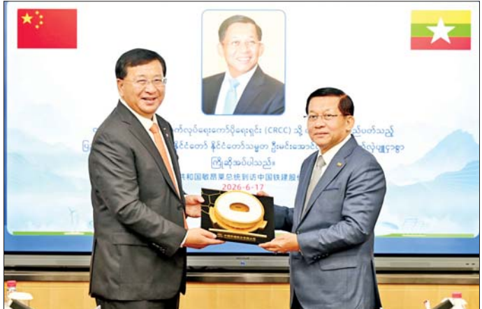
ပြည်ထောင်စုသမ္မတ မြန်မာနိုင်ငံတော် နိုင်ငံတော်သမ္မတ ဦးမင်းအောင်လှိုင်နှင့် China Railway Construction Corporation Limited (CRCC) ဥက္ကဋ္ဌ Mr. Dai Hegen တို့ အမှတ်တရလက်ဆောင်ပစ္စည်းများ အပြန်အလှန်ပေးအပ်စဉ်။

အထားများ၊ အထူးပြုလုပ်ချက် များ၊ ပုံစံငယ်များဖြင့် လိုက်လံ ရှင်းလင်းတင်ပြကြရာ နိုင်ငံတော် သမ္မတက သိရှိလိုသည်များ ပြန်လည်မေးမြန်းဆွေးနွေးသည်။ အဆိုပါ တရုတ်မီးရထားလမ်း တည်ဆောက်ရေးကော်ပိုရေးရှင်း (China Railway Construction Corporation Limited- CRCC) ကို ၁၉၄၈ ခုနှစ်၌ တရုတ်ပြည်သူ့ လွတ်မြောက်ရေး တပ်မတော် အဖြစ် စတင်တည်ထောင်ခဲ့ခြင်း ဖြစ်ကြောင်း၊ ထို့နောက် ၁၉၉၀ ပြည့်နှစ်တွင် CRCC အဖြစ်သို့ ပြောင်းလဲဖွဲ့စည်းခဲ့ပြီး ၂၀၀၃ ခုနှစ်၌ နိုင်ငံပိုင်ပစ္စည်းများ ကြီးကြပ်စစ်ဆေးရေးနှင့် စီမံ ခန့်ခွဲရေးကော်မရှင် (SASAC) ၏ စီမံခန့်ခွဲမှုဖြင့် ဆက်လက်ဆောင် ရွက်ခဲ့ကြောင်း၊ ကုမ္ပဏီကို ၂၀၀၇ ခုနှစ်တွင် အစုရှယ်ယာများဖြင့် ခေတ်မီကော်ပိုရေးရှင်း အသွင်ဖြင့် ပြောင်းလဲဖွဲ့စည်းခဲ့ပြီး ၂၀၀၈ ခုနှစ် တွင် ရှန်ဟိုင်းနှင့် ဟောင်ကောင် စတော့ခရီးစဉ်ကွက်တွင် စာရင်း သွင်းခဲ့ကြောင်း၊ CRCC သည် ယနေ့အချိန်အထိ မီးရထားလမ်း နှင့် အမြန်ရထားလမ်းပေါင်း ၁၃၀၀၀ ကီလိုမီတာကျော်၊ အပေး ပြေးလမ်းမ ၅၀၀၀ ကီလိုမီတာ ကျော်၊ တံတား ၂၀၀၀၀ ကီလို မီတာ ကျော်၊ ဥမင်လိုဏ်ခေါင်း ၂၆၀၀၀ ကီလိုမီတာကျော်နှင့် အဆောက် အအုံပေါင်း ၁၂၀၀၀၀၀၀ စတုရန်း မီတာတို့ကို ကမ္ဘာ့နေရာအများ အပြားတွင် တည်ဆောက်ခဲ့ ကြောင်း၊ ထို့ပြင် CRCC ၏ လုပ်ငန်း ခွဲများသည် အမေရိကတွင် ၂၄ ခု၊ အာဖရိကတွင် ၅၁ ခု၊ ဥရောပတွင် ၁၅ ခု၊ အာရှတွင် ၄၁ ခုနှင့် သမုဒ္ဒရာ နိုင်ငံများတွင် ၁၀ ခု ပြည်ပနိုင်ငံ