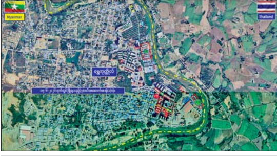
ကရင်ပြည်နယ် မြဝတီမြို့နယ် ရွှေကုက္ကိုလ်နယ်မြေရှိ အွန်လိုင်းလိမ်လည်လောင်းကစားမှုများ လုပ်ကိုင်ခဲ့သည့် တရားမဝင်အဆောက်အအုံများအား ဖောက်ခွဲဖျက်ဆီးမှု။

နေပြည်တော် ဇွန် ၁၇ အွန်လိုင်း လိမ်လည်လောင်းကစားမှုများကို အခြေချလုပ်ကိုင်ခဲ့သည့် ကရင်ပြည်နယ် မြဝတီမြို့နယ် ရွှေကုက္ကိုလ်နယ်မြေနှင့် KK Park နယ်မြေများရှိ တရားမဝင် အဆောက်အအုံများအား အပြီးတိုင် ဖြိုချဖျက်ဆီးခြင်းများနှင့် လုပ်ငန်းလုပ်ဆောင်ရာတွင် အသုံးပြုခဲ့သည့်ပစ္စည်းများအား စနစ်တကျဖျက်ဆီးခြင်းများကို ဌာနဆိုင်ရာပူးပေါင်းအဖွဲ့များဖြင့် ဆောင်ရွက်လျက်ရှိရာ ယနေ့တွင် ရွှေကုက္ကိုလ်နယ်မြေအတွင်းရှိ တရားမဝင် ခုနစ်ထပ်လူနေအဆောက်အအုံတစ်လုံးကို ထပ်မံ၍ စနစ်တကျဖောက်ခွဲဖြိုချဖျက်ဆီးခဲ့ကြောင်း သိရသည်။ ရွှေကုက္ကိုလ်နယ်မြေအတွင်း၌ အွန်လိုင်းလိမ်လည် လောင်းကစားလုပ်ငန်းများကျူးလွန်ရာတွင် အသုံးပြုခဲ့သည့် အဆောက်အအုံ ၇၇ လုံးအနက် ယာဉ်ယန္တရားများဖြင့် ဖြိုချဖျက်ဆီးမည့်