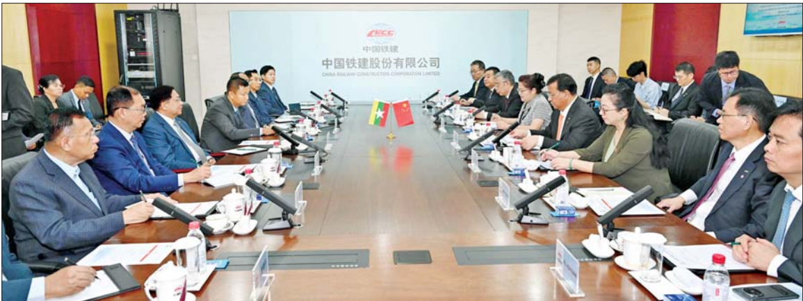
ပြည်ထောင်စုသမ္မတ မြန်မာနိုင်ငံတော် နိုင်ငံတော်သမ္မတ ဦးမင်းအောင်လှိုင် ဦးဆောင်သည့် မြန်မာအဆင့်မြင့်ကိုယ်စားလှယ်အဖွဲ့အား ပေးကျင်းမြို့ရှိ China Railway Construction Corporation Limited (CRCC) ဥက္ကဋ္ဌ Mr. Dai Hegen က CRCC သမိုင်းကြောင်းများနှင့် လက်ရှိဖြစ်ပေါ်တိုးတက်နေမှုအခြေအနေများ၊ စွမ်းဆောင်နိုင်မှုများကို ရှင်းလင်းတင်ပြစဉ်။

ဦးစွာ နိုင်ငံတော်သမ္မတနှင့် အဖွဲ့ဝင်များသည် CRCC သို့ ရောက်ရှိကြရာ CRCC မှ ဥက္ကဋ္ဌ ဖြစ်သူ Mr. Dai Hegen နှင့် အဖွဲ့ ဝင်များက လိုက်လံလှုံ့ဆော်ပေး ရွာ ကြိုဆိုနှုတ်ဆက်ကြသည်။ ယင်းနောက် နိုင်ငံတော်သမ္မတ နှင့်အဖွဲ့သည် CRCC ၏ ပြခန်းကို လေ့လာကြရာ CRCC ဥက္ကဋ္ဌနှင့် တာဝန်ရှိသူများက တရုတ် မီးရထားလမ်း တည်ဆောက်ရေး ကော်ပိုရေးရှင်း (China Railway Construction Corporation Limited - CRCC) အနေဖြင့် ၁၉၄၈ ခုနှစ်၌ တရုတ်ပြည်သူ့ လွတ်မြောက်ရေး တပ်မတော် (PLA) ရထားလမ်းတစ်ဖွဲ့၌ စတင် ပေါ်ပေါက်လာခဲ့ခြင်း ဖြစ်ပြီး ခေတ်အဆက်ဆက် ဖြစ်ပေါ် တိုးတက်ခဲ့မှုများ၊ နိုင်ငံအကြီး အကျယ်များက မီးရထားတစ်ဖွဲ့အား အလေးထားခဲ့ကြပြီး တွေ့ဆုံမှုများ ဆောင်ရွက်ခဲ့ကြသည့် သမိုင်းမှတ် တမ်းဓာတ်ပုံများနှင့် အထောက် အထားများ၊ မြင့်မားသည့် မီးရထားတံတားများ၊ ဥမင်လိုဏ် ခေါင်း မီးရထားလမ်းများ ကို အခက်အခဲများကြားမှ တည်ဆောက် ဖောက်လုပ်ခဲ့သည့်