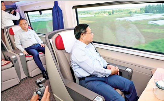
ပြည်ထောင်စုသမ္မတ မြန်မာနိုင်ငံတော် နိုင်ငံတော်သမ္မတ ဦးမင်းအောင်လှိုင် ပေကျင်းမြို့မှ ရှန်ဟိုင်း မြို့သို့ အမြန်ရထားဖြင့်သွားရောက်စဉ် လမ်းခရီးတစ်လျှောက်၌ တရုတ်နိုင်ငံ၏ ရထားပို့ဆောင်ရေးစနစ် ဖွံ့ဖြိုးတိုးတက်မှုများကို ကြည့်ရှုလေ့လာစဉ်။

နိုင်ငံတော်သမ္မတသည် ပေကျင်း မြို့မှ ရှန်ဟိုင်းမြို့သို့ အမြန်ရထား ဖြင့် သွားရောက်စဉ် လမ်းခရီး တစ်လျှောက်၌ တရုတ်နိုင်ငံ၏ ရထားပို့ဆောင်ရေးစနစ်ဖွံ့ဖြိုးတိုး တက်မှုများ၊ ရထားလမ်းနယ်များ စနစ်တကျရှိမှုများ၊ မြို့ပြဖွံ့ဖြိုး