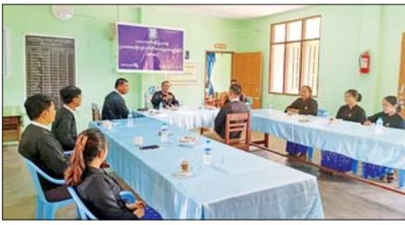
ရို မြို့နယ်ဥပဒေအရာရှိများနှင့် ဒုတိယဥပဒေအရာရှိများ အနေဖြင့် ဥပဒေကျင့်ဝတ်များကို ကောင်းစွာ သိရှိလိုက်နာခြင်းဖြင့် ပြည်သူများ၏ ယုံကြည်အားကိုးမှု ပိုမိုရရှိစေရေးကို ဖော်ဆောင်ကြ

သာယာဝတီ ဇွန် ၁၇ ဥပဒေရေးရာ ဝန်ကြီးဌာန၏ ပြည်သူများအတွက် ကြိုးပမ်းဆောင်ရွက်မှု လုပ်ငန်းစဉ်များတွင် ပါဝင်သော ဥပဒေအရာရှိကျင့်ဝတ်ဆိုင်ရာ တွေ့ဆုံမေးမြန်းခြင်း အခမ်းအနားကို ဇွန် ၁၇ ရက်က သာယာဝတီခရိုင် ဥပဒေရေးအစည်းအဝေးခန်းမ၌ ပြုလုပ်သည်။