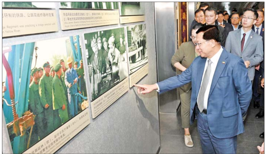
ပြည်ထောင်စုသမ္မတ မြန်မာနိုင်ငံတော် နိုင်ငံတော်သမ္မတ ဦးမင်းအောင်လှိုင် ဦးဆောင်သည့် မြန်မာအဆင့်မြင့်ကိုယ်စားလှယ်အဖွဲ့ ပေးကျင်းမြို့ရှိ China Railway Construction Corporation Limited (CRCC) ၏ ပြခန်းတွင် ကြည့်ရှုလေ့လာစဉ်။

မှတ်တမ်းများ၊ ပေးကျင်းမြို့၏ ပထမဆုံး မြေအောက်မီးရထား လမ်း တည်ဆောက်ခဲ့မှုများ၊ မီးရထားတစ်ဖွဲ့၏ ပြည်ပစစ်မြေ ပြင်များတွင် သွားရောက်တာဝန် ထမ်းဆောင်ခဲ့မှု သမိုင်းမှတ်တမ်း များ၊ သဘာဝဘေးအန္တရာယ် ကြောင့် မီးရထားလမ်းများ ထိခိုက် ပျက်စီးခဲ့ရမှုနှင့် ပြန်လည်ပြုပြင် တည်ဆောက်ခဲ့မှု မှတ်တမ်းများ၊ မီးရထားလမ်း တစ်ဖွဲ့အဖြစ်မှ ကော်ပိုရေးရှင်းအဖြစ် ပြောင်းလဲ ခဲ့မှုများ၊ ကျည်ဆံရထားများ တည်ဆောက်ခဲ့မှုများ၊ မြေအောက် ရထားလမ်း တည်ဆောက်ရေး လုပ်ငန်းများတွင် အသုံးပြုသည့် တရုတ်နိုင်ငံမှ ထုတ်လုပ်ထားသော ယာဉ်ယန္တရား၊ စက်ကိရိယာများ၊ မြန်မာနိုင်ငံအပါအဝင် နိုင်ငံတကာ ၌ CRCC မှ တည်ဆောက်ရေး လုပ်ငန်းများ ဆောင်ရွက်နေမှုများ နှင့်ပတ်သက်၍ ပြခန်းတစ်ခုချင်း စီအလိုက် မှတ်တမ်းအထောက်