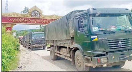
မန္တလေးမြို့မှ မြစ်ကြီးနားမြို့သို့ ကုန်ပစ္စည်းများသွားရောက်ပို့ဆောင်သည့်မော်တော်ယာဉ်များ ပြန်လည်ထွက်ခွာလာစဉ်။

နေပြည်တော် ဇွန် ၁၇ တပ်မတော်အနေဖြင့် အကြမ်းဖက်သောင်းကျန်းသူများ ယာယီစိုးမိုးထားခဲ့သည့် ဒေသများအား ပြန်လည်ထိန်းချုပ်၍ ဒေသဖွံ့ဖြိုးရေးအတွက် အဓိကအရေးပါသည့် ဆက်သွယ်ရေးလမ်းကြောင်းများကို ပြန်လည်ဖွင့်လှစ်ပေးခဲ့ပြီး ပြန်လည်တည်ဆောက်ရေးလုပ်ငန်းများနှင့် ဒေသဖွံ့ဖြိုးတိုးတက်ရေးလုပ်ငန်းများကို နိုင်ငံတော်အစိုးရ၏ လမ်းညွှန်ချက်နှင့်အညီ ဆောင်ရွက်ပေးလျက်ရှိရာ လမ်းပန်းဆက်သွယ်ရေးခက်ခဲပြီး ဝေးလံသည့်ဒေသများမှ ဌာနဆိုင်ရာဝန်ထမ်းများနှင့် မိသားစုများ၊ ဒေသခံပြည်သူများ၏ စားဝတ်နေရေး အဆင်ပြေချောမွေ့စေရေးနှင့် ရုံးလုပ်ငန်းဆိုင်ရာများ အဆင်ပြေချောမွေ့စေရေးအတွက်လည်း တပ်မတော်က မော်တော်ယာဉ်များဖြင့် ကုန်ပစ္စည်းများသယ်ယူပို့ဆောင်ပေးလျက်ရှိသည်။ စာမျက်နှာ ၁၅ ကော်လံ ၁ သို့ ။