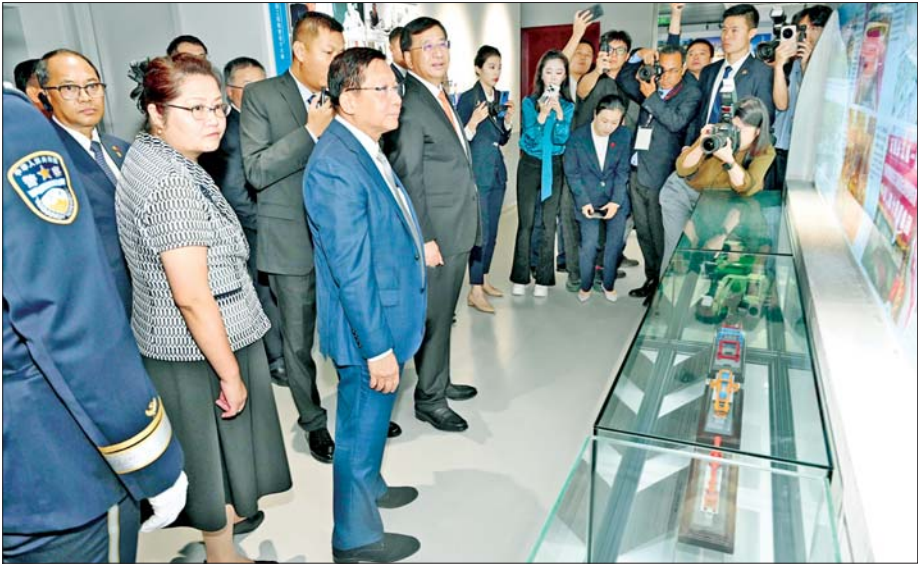
ပြည်ထောင်စုသမ္မတ မြန်မာနိုင်ငံတော် နိုင်ငံတော်သမ္မတ ဦးမင်းအောင်လှိုင် ဦးဆောင်သည့် မြန်မာအဆင့်မြင့်ကိုယ်စားလှယ်အဖွဲ့ ပေကျင်းမြို့ရှိ China Railway Construction Corporation Limited (CRCC) ၏ ပြခန်းတွင် ကြည့်ရှုလေ့လာစဉ်။

တစ်ဖက်မှာ ၄ မှ ကုမင်း-စီယံကျန်း မီးရထား လမ်းနှင့် ပေကျင်းမြေအောက် ရထားလိုင်းအမှတ် (၁) စသည်ဖြင့် နေရာအမျိုးမျိုးတွင် ဖောက်လုပ် ထားသည့် မီးရထားလမ်းများသည် လက်ရှိအချိန်အထိ အသုံးပြုလျက် ရှိကြောင်း၊ ထို့ပြင် နိုင်ငံတကာ နှင့်ပူးပေါင်း၍ မီးရထားလမ်း ထိန်းသိမ်းပြင်ဆင်သည့် လုပ်ငန်း များကိုလည်း လုပ်ကိုင်ဆောင်ရွက်လျက်ရှိကြောင်း သိရသည်။