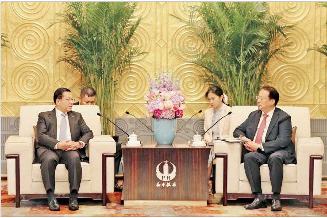
ပြည်ထောင်စုသမ္မတမြန်မာနိုင်ငံတော် နိုင်ငံတော်သမ္မတ ဦးမင်းအောင်လှိုင်နှင့် ရှန်ဟိုင်းမြို့ မြို့တော်ဝန် မစ္စတာ ကုန်းကျွန်းက တွေ့ဆုံဆွေးနွေးစဉ်။

နေပြည်တော် ၅ နှစ် ၁၇ တရုတ်ပြည်သူ့သမ္မတနိုင်ငံ သမ္မတ မစ္စတာရှီကျင့်ဖိုင်၏ ဖိတ်ကြားချက်အရ တရုတ်ပြည်သူ့သမ္မတနိုင်ငံ နိုင်ငံတော်အဆင့် ချစ်ကြည်ရေးခရီးစဉ် (State Visit) ရောက်ရှိနေသည့် ပြည်ထောင်စုသမ္မတမြန်မာနိုင်ငံတော် နိုင်ငံတော်သမ္မတ ဦးမင်းအောင်လှိုင်ထံသို့ ယနေ့မွန်းလွဲပိုင်းတွင် ရှန်ဟိုင်းမြို့ မြို့တော်ဝန် မစ္စတာ ကုန်းကျွန်းက ခေတ္တတည်းခိုလျက်ရှိသည့် Fairmont Peace ဟိုတယ်ရှိ Peace ဧည့်ခန်းမဆောင်၌ လာရောက်ဂါရဝပြုတွေ့ဆုံသည်။ ထိုသို့ တွေ့ဆုံစဉ် ရှန်ဟိုင်းမြို့ မြို့တော်ဝန်က ပြည်ထောင်စုသမ္မတမြန်မာနိုင်ငံတော် နိုင်ငံတော်သမ္မတ အနေဖြင့် တရုတ်ပြည်သူ့သမ္မတနိုင်ငံသို့ နိုင်ငံတော်အဆင့် ခရီးစဉ် (State Visit) လာရောက်မှုအပေါ် လှိုက်လှဲရွေးထွေးစွာ ကြိုဆိုပါကြောင်း ကြိုဆိုနှုတ်ခွန်းဆက်စကား ပြောကြားပြီး ရှန်ဟိုင်းမြို့ဆိုင်ရာ အချက်အလက်များ၊ ရှန်ဟိုင်းမြို့တရုတ်ပြည်သူ့သမ္မတနိုင်ငံ သမ္မတ မစ္စတာရှီကျင့်ဖိုင်၏ လမ်းညွှန်ချက်နှင့်အညီ နိုင်ငံတကာစီးပွားရေးဗဟို၊ အပြည်ပြည်ဆိုင်ရာ ငွေကြေးဗဟို၊ အပြည်ပြည်ဆိုင်ရာကုန်သွယ်ရေးဗဟို၊ အပြည်ပြည်ဆိုင်ရာ စာမျက်နှာ ၃ ကော်လံ ၁ သို့ ။