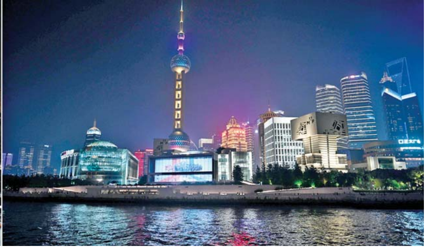
ပြည်ထောင်စုသမ္မတမြန်မာနိုင်ငံတော် နိုင်ငံတော်သမ္မတ ဦးမင်းအောင်လှိုင် ရန်ဟိုင်းမြို့ ဟွမ်းဖုမြစ်အတွင်း Oriental Pearl 2 အမည်ရှိ သင်္ဘောပေါ်မှ ဟွမ်းဖုမြစ်ကြောင်းတစ်လျှောက်ရှိ အဆောက်အအုံများ၏ ဖွံ့ဖြိုးတိုးတက်လာမှုများကို ကြည့်ရှုလေ့လာစဉ်။

★ ရေဖွံ့ဖြိုးမှု ပို့ဆောင်ရေးဗဟိုနှင့် အပြည်ပြည်ဆိုင်ရာ သိပ္ပံနှင့် နည်းပညာ ဆန်းသစ်တီထွင်ရေး ဗဟိုမြို့ အဖြစ် ကြိုးပမ်းတည်ဆောက် လျက်ရှိသည့် အခြေအနေများနှင့် ပတ်သက်၍ ရှင်းလင်းတင်ပြသည်။ ထို့နောက် နိုင်ငံတော်သမ္မတ က မြန်မာနိုင်ငံ ဖွံ့ဖြိုးတိုးတက်ရေး အပါအဝင် နှစ်နိုင်ငံ ဘက်ပေါင်းစုံ ပူးပေါင်းဆောင်ရွက်မှု မြှင့်တင်ရေး၊ မြန်မာနိုင်ငံတွင် ထာဝရငြိမ်းချမ်းရေး ရရှိရန်အတွက် ပူးပေါင်းဆောင်ရွက်မှုများ မြှင့်တင်ရေး၊ တရုတ်နိုင်ငံမှ ရင်းနှီးမြှုပ်နှံမှုများ တိုးမြှင့်ရေးနှင့် နှစ်နိုင်ငံ ကုန်သွယ်မှု ကဏ္ဍ မြှင့်တင်နိုင်ရေးတို့အတွက် ရည်ရွယ်၍ တရုတ်နိုင်ငံသို့ လာရောက်ရခြင်း ဖြစ်ကြောင်း၊ နှစ်နိုင်ငံအကြား ရှည်လျားသည့် နယ်နိမိတ်ထိစပ်နေမှုနှင့် အတူ ကူးလူးဆက်ဆံမှုသမိုင်းကြောင်း ကောင်းများလည်း ရှိပြီးဖြစ်ကြောင်း၊ မြန်မာနိုင်ငံသည် မြေပေါ် မြေအောက် သယ်စာတရားများ