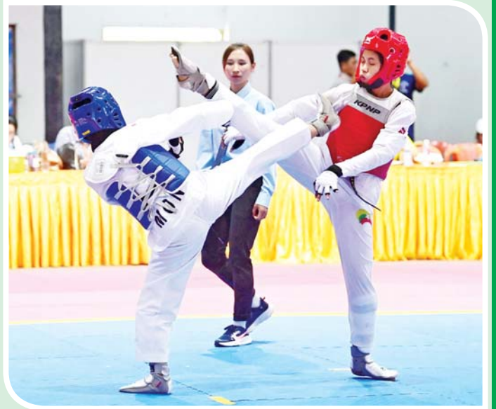
ပြည်နယ်နှင့်တိုင်းဒေသကြီး အမျိုးသမီး တိုက်ကွမ်ဒိုပြိုင်ပွဲတွင် မွန်ပြည်နယ်နှင့် ဧရာဝတီတိုင်းဒေသကြီးတို့မှ ပြိုင်ပွဲဝင်များ ယှဉ်ပြိုင်စဉ်။