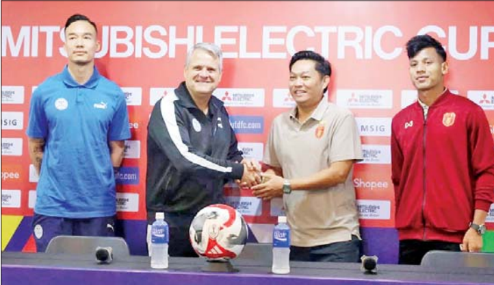
ပွဲကြိုသတင်းစာရှင်းလင်းပွဲတွင် မြန်မာနှင့် ဖိလစ်ပိုင်အသင်း နည်းပြချုပ်များနှင့် ကစားသမားများအား တွေ့ရစဉ်။

ရန်ကုန် ဒီဇင်ဘာ ၁၁ 2024 ASEAN Cup ပြိုင်ပွဲ အုပ်စု(B) ဒုတိယနေ့ကို ဒီဇင်ဘာ ၁၂ ရက်တွင် ဆက်လက်ကျင်းပမည်ဖြစ်ပြီး မြန်မာအသင်းသည် ဖိလစ်ပိုင်အသင်းနှင့် အဝေးကွင်း ယှဉ်ပြိုင်ကစားရမည်ဖြစ်သည်။ အုပ်စု(B) ဒုတိယနေ့အဖြစ် မြန်မာစံတော်ချိန် ညနေ ၅ နာရီတွင် ဖိလစ်ပိုင်နိုင်ငံ မနီလာမြို့ရှိ ရီဇယ်မန်မိုရီရယ်ကွင်း၌ ဖိလစ်ပိုင်အသင်းနှင့် မြန်မာအသင်း၊ မြန်မာစံတော်ချိန် ည ၇ နာရီတွင် အင်ဒိုနီးရှားနိုင်ငံ ဆူရာကာတာမြို့ရှိ မာနာဟန်ကွင်း၌ အင်ဒိုနီးရှားအသင်းနှင့် လာအိုအသင်းတို့ ယှဉ်ပြိုင်ကစားမည်ဖြစ်သည်။ စာမျက်နှာ ၁၂ ကော်လံ ၁ သို့ ❖