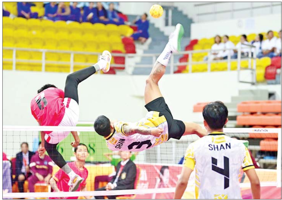
ပြည်နယ်နှင့်တိုင်းဒေသကြီး အမျိုးသား လေးယောက်တွဲ ပိုက်ကျော်ခြင်းပြိုင်ပွဲတွင် မန္တလေးတိုင်း ဒေသကြီးအသင်းနှင့် ရှမ်းပြည်နယ်အသင်းတို့ ယှဉ်ပြိုင်စဉ်။

အားကစားကွင်း(A)ရုံ၌ ကျင်းပရာ မန္တလေးတိုင်းဒေသကြီးအသင်းက မကွေးတိုင်းဒေသကြီးအသင်းကို နှစ်ပွဲပြတ်၊ ရှမ်းပြည်နယ်အသင်း က ရခိုင်ပြည်နယ်အသင်းကို နှစ်ပွဲ တစ်ပွဲ၊ ပဲခူးတိုင်းဒေသကြီးအသင်း က ဧရာဝတီတိုင်းဒေသကြီးအသင်း ကို နှစ်ပွဲပြတ်၊ ကချင်ပြည်နယ် အသင်းက ရန်ကုန်တိုင်းဒေသကြီး အသင်းကို နှစ်ပွဲပြတ်၊ စစ်ကိုင်းတိုင်း ဒေသကြီးအသင်းက တနင်္သာရီ တိုင်းဒေသကြီးအသင်းကို နှစ်ပွဲ ပြတ်၊ မွန်ပြည်နယ်အသင်းက ပြည်ထောင်စုနယ်မြေ နေပြည် တော်အသင်းကို နှစ်ပွဲ တစ်ပွဲ၊ ကယားပြည်နယ်အသင်းက ချင်း ပြည်နယ်အသင်းကို နှစ်ပွဲ တစ်ပွဲ၊ ရှမ်းပြည်နယ်အသင်းက မန္တလေး တိုင်းဒေသကြီးအသင်းကို နှစ်ပွဲ တစ်ပွဲ၊ ရခိုင်ပြည်နယ်အသင်းက မကွေးတိုင်းဒေသကြီးအသင်းကို နှစ်ပွဲပြတ်၊ ရန်ကုန်တိုင်းဒေသကြီး အသင်းက ပဲခူးတိုင်းဒေသကြီး အသင်းကို နှစ်ပွဲပြတ်၊ ကချင်ပြည် နယ်အသင်းက ဧရာဝတီတိုင်း ဒေသကြီးအသင်းကို နှစ်ပွဲပြတ် ဖြင့်လည်းကောင်း၊ ပြည်ထောင်စု နယ်မြေ နေပြည်တော်အသင်းက တနင်္သာရီတိုင်းဒေသကြီးအသင်း ကို နှစ်ပွဲ တစ်ပွဲ၊ စစ်ကိုင်းတိုင်း ဒေသကြီးအသင်းက မွန်ပြည်နယ်