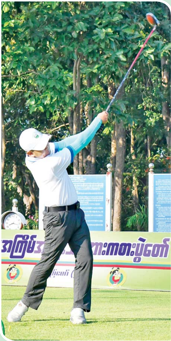
ဝန်ကြီးဌာနပေါင်းစုံ ဂေါက်သီးရိုက်ပြိုင်ပွဲတွင် ပြိုင်ပွဲဝင်တစ်ဦး ယှဉ်ပြိုင်စဉ်။