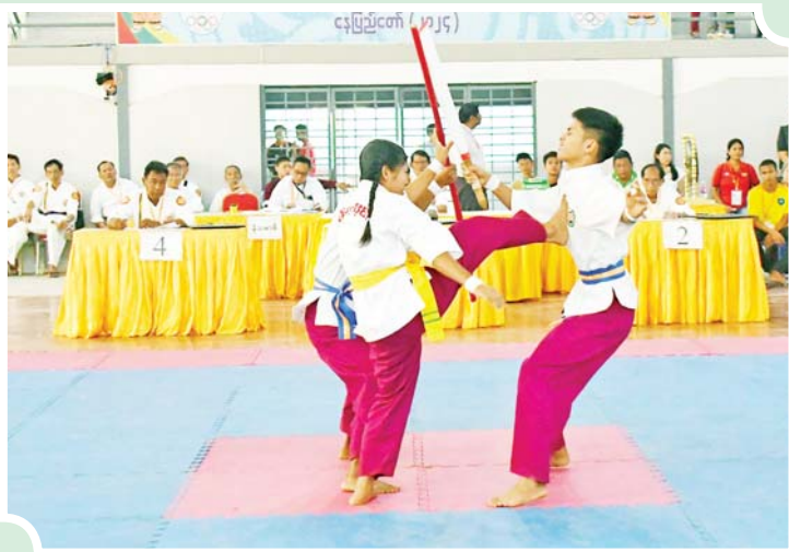
ပြည်နယ်နှင့်တိုင်းဒေသကြီး မြန်မာ့သိုင်းပြိုင်ပွဲ ယှဉ်ပြိုင်စဉ်။