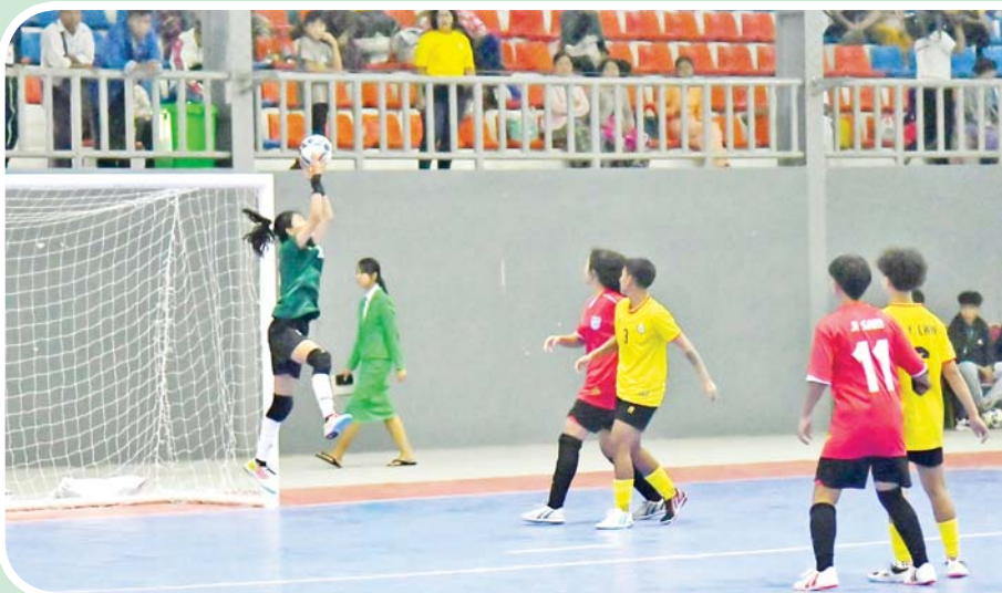
ပြည်နယ်နှင့်တိုင်းဒေသကြီး အမျိုးသမီးဖူဆယ်ပြိုင်ပွဲတွင် ရန်ကုန်တိုင်းဒေသကြီးအသင်းနှင့် ကချင်ပြည်နယ်အသင်းတို့ ယှဉ်ပြိုင်ကစားစဉ်။