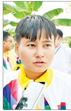
မသဲအိမွန်သောင်း