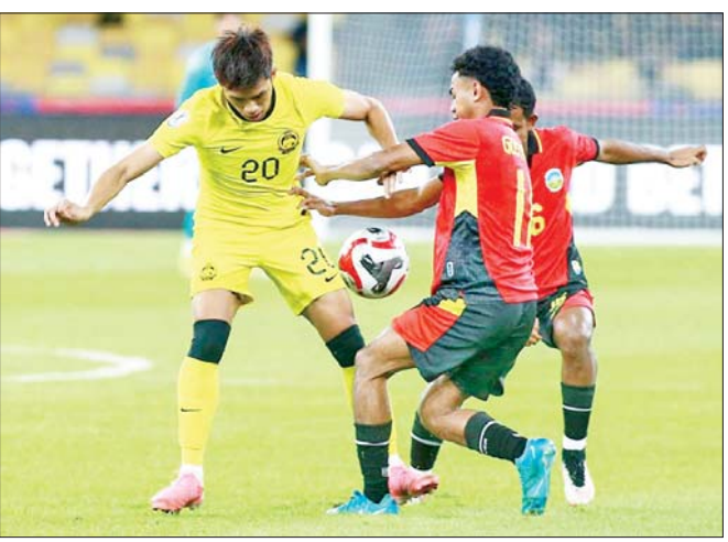
မလေးရှားအသင်းနှင့် တီမောအသင်းတို့ ယှဉ်ပြိုင်နေစဉ်။