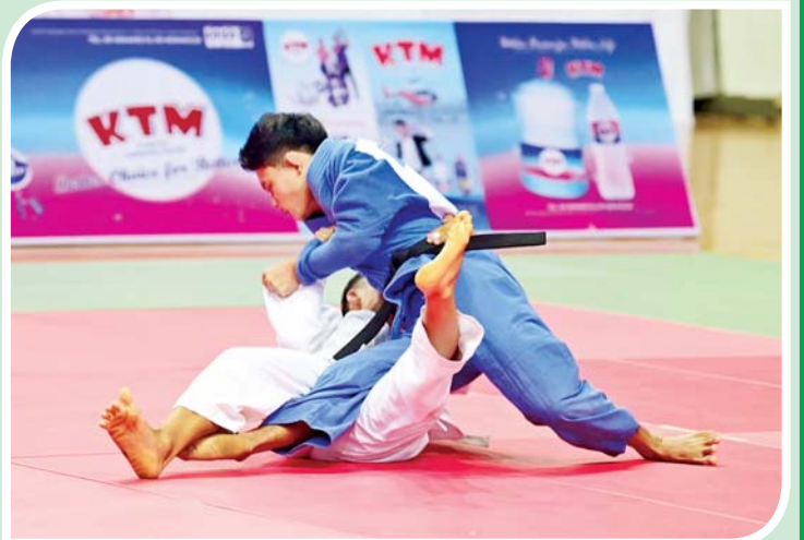
ပြည်နယ်နှင့်တိုင်းဒေသကြီး အမျိုးသား ၅၅ ကီလိုတန်းအောက် ဂျူဒိုပြိုင်ပွဲ တွင် ကယားပြည်နယ်နှင့် ကချင်ပြည်နယ်တို့မှ အားကစားသမားများ ယှဉ်ပြိုင်စဉ်။