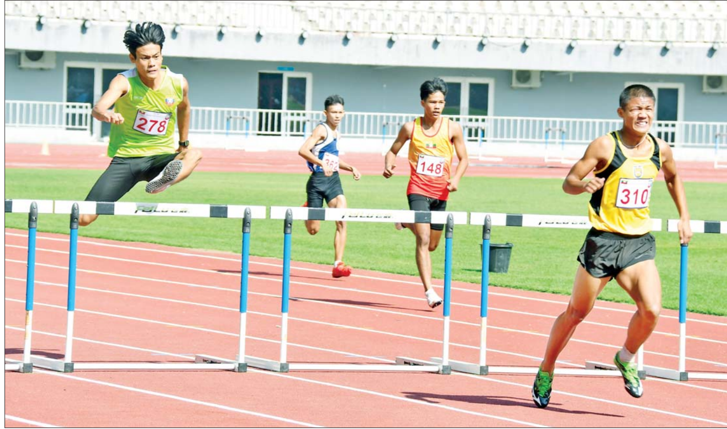
ပြည်နယ်နှင့်တိုင်းဒေသကြီး အမျိုးသား ဗီတာ ၄၀၀ တန်းကျော်အပြေးပြိုင်ပွဲ ဗိုလ်လုပွဲယှဉ်ပြိုင်ကစားစဉ်။

တံတားဦးမြို့နယ်ထွက် ရာသီပေါ်မြစ်များ အရောင်းအဝယ်ကောင်း၍ အကျိုးအမြတ်ရ စာမျက်နှာ » ၂၁