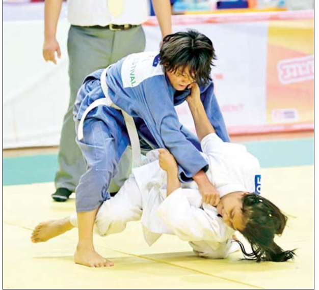
ပြည်နယ်နှင့်တိုင်းဒေသကြီး ဂျူဒိုပြိုင်ပွဲ အမျိုးသမီး ၅၇ ကီလိုတန်းအောက်ပြိုင်ပွဲတွင် အားကစားသမားများ ယှဉ်ပြိုင်စဉ်။

အတွဲလိုက် စွမ်းရည်ပြိုင်ပွဲ (မ-၁/ကျား-၂) လက်နက်မဲ့/ဓားမြောင်/ ဓားရှည်ပြိုင်ပွဲတွင် ရန်ကုန်တိုင်းဒေသကြီးက ပထမ၊ ရှမ်းပြည်နယ်က ဒုတိယ၊ စစ်ကိုင်း