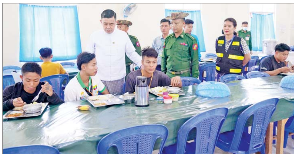
လှည့်လည်ကြည့်ရှုပြီး ချက်ပြုတ် ညနေစာအတွက် သန့်ရှင်းသပ်ရပ် စားရိပ်သာများနှင့် ချက်ပြုတ်ရေး အဆောင်များ သန့်ရှင်းရေး ပြင်ဆင်ချက်ပြုတ်နေမှု အဆောင်များ သန့်ရှင်းရေး

ကျွေးမွေးဧည့်ခံနေမှု အခြေအနေ များကို သွားရောက်ကြည့်ရှုသည်။ ဦးစွာ ဒုတိယဝန်ကြီးသည် ပြိုင်ပွဲဝင်အားကစားသမားများ၊ အုပ်ချုပ်သူများနှင့် နည်းပြများ တည်းခိုရေး အဆောင်များ ပတ်ဝန်းကျင်သန့်ရှင်းရေး ဆောင်ရွက်နေမှု အခြေအနေများကို လှည့်လည်ကြည့်ရှု စစ်ဆေးပြီး လိုအပ်သည်များကို တာဝန်ရှိသူ များအား မှာကြားသည်။ ထို့နောက် ပြိုင်ပွဲဝင်အားကစား သမားများ၊ အုပ်ချုပ်သူများနှင့် နည်းပြများ နေ့လယ်စာစားသုံး နေမှု အခြေအနေများကို