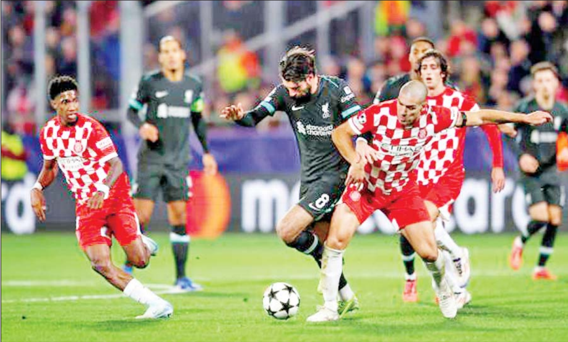
ဂျီရိုနာအသင်းနှင့် လီဗာပူးအသင်းတို့ ယှဉ်ပြိုင်ကစားကြစဉ်။

(နိုင်ငံတော် စီမံအုပ်ချုပ်ရေးကောင်စီ ဥက္ကဋ္ဌ နိုင်ငံတော်ဝန်ကြီးချုပ် ဗိုလ်ချုပ်မှူးကြီး မင်းအောင်လှိုင်၏ ၂၀၂၄ ခုနှစ်၊ မေလ ၂၄ ရက်နေ့တွင် မကွေးတိုင်းဒေသကြီး အစိုးရအဖွဲ့ဝင်များ၊ ခရိုင်အဆင့် ဌာနဆိုင်ရာတာဝန်ရှိသူများ အားတွေ့ဆုံ၍ ဒေသဖွံ့ဖြိုးတိုးတက်ရေးဆိုင်ရာများကို ဆွေးနွေးပြောကြားမှုမှ ကောက်နုတ်ချက်)