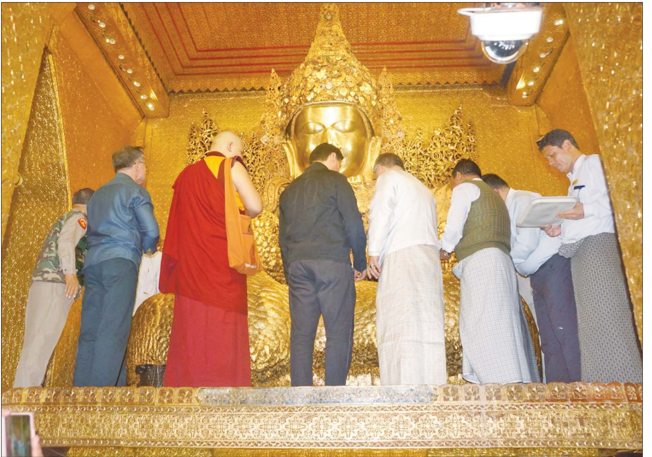
ရုရှားဖက်ဒရေးရှင်းနိုင်ငံ ကာလမီးကိယာပြည်နယ်အကြီးအကဲ H.E. Mr. Batu KHASIKOV ဦးဆောင်သော ကိုယ်စားလှယ်အဖွဲ့ မဟာမုနိရုပ်ရှင်တော်မြတ်ကြီးအား သွားရောက်ဖူးမြော်ကြပြီး ရွှေသင်္ကန်းများ ဆက်ကပ်လှူဒါန်းကြစဉ်။

ဆက်လက်၍ ကာလမီးကိယာ ပြည်နယ်အကြီးအကဲနှင့် အဖွဲ့သည် မန္တလေးမြို့သို့ ပြန်လည်ထွက်ခွာလာပြီး ကုသိုလ်တော်ဘုရား၊ မဟာလောကမာရဇိန်ကျောက်တော်ကြီး ဘုရားနှင့် မန္တလေးတောင်တော်ရှိဆုတောင်းပြည့်စေတီတော်တို့ကို သွားရောက်ဖူးမြော်ကြည့်ကြသည်။ ညနေပိုင်းတွင် မန္တလေးတိုင်းဒေသကြီး ဝန်ကြီးချုပ်သည် ကာလမီးကိယာပြည်နယ် အကြီးအကဲနှင့် အဖွဲ့အား Mingalar Mandalay Hotel ၌ ညစာဖြင့် တည်ခင်းဧည့်ခံခဲ့ကြောင်း သိရသည်။ သတင်းစဉ်