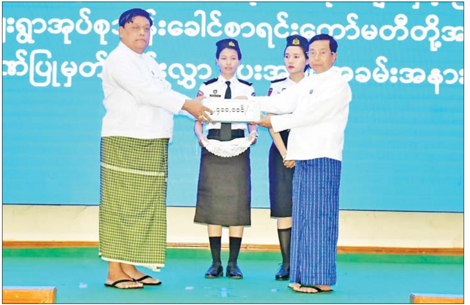
အလိုက်ရှင်းလင်းတင်ပြကြရာ နေပြည်တော်ကောင်စီ နိဂုံးချုပ် အမှာစကားပြောကြားခဲ့ကြောင်း သိရသည်။ ဥက္ကဋ္ဌက လိုအပ်သည်များ ဖြည့်စွက်ဆွေးနွေးပြီး သတင်းစဉ်

အလုပ်သမားညွှန်ကြားရေးဦးစီးဌာနနှင့် နေပြည်တော် အသေးစားစက်မှုလက်မှုလုပ်ငန်းဦးစီးဌာနတို့ပေါင်း ဖွင့်လှစ်သည့် စက်ချုပ်နည်းပညာသင်တန်း ဖွင့်ပွဲ အခမ်းအနားကို ယနေ့နံနက် ၁၀ နာရီတွင် ဝေယျာ သီရိမြို့နယ် ရှားစေးဖိုကျေးရွာ ဘက်စုံသုံးခန်းမ၌ ကျင်းပရာ နေပြည်တော်ကောင်စီဥက္ကဋ္ဌ တက်ရောက် အမှာစကားပြောကြားပြီး စက်ချုပ်နည်းပညာ သင်တန်းအတွက် ချီးမြှင့်ငွေများနှင့် သင်တန်းသုံး ပစ္စည်းများကို တာဝန်ရှိသူများနှင့် သင်တန်းသူများ အား ပေးအပ်သည်။ ဆက်လက်၍ ပြည်ထောင်စုနယ်မြေ နေပြည်တော် အတွင်း ဒေသဖွံ့ဖြိုးတိုးတက်ရေးဆိုင်ရာ လုပ်ငန်း ညှိနှိုင်းအစည်းအဝေးကို နေပြည်တော်ကောင်စီရုံး အစည်းအဝေးခန်းမ(၁)၌ ကျင်းပရာ နေပြည်တော် ကောင်စီဥက္ကဋ္ဌက တက်ရောက်အမှာစကားပြောကြား သည်။ ထို့နောက် တက်ရောက်လာကြသည့် ဌာန ဆိုင်ရာတာဝန်ရှိသူများက သက်ဆိုင်ရာကဏ္ဍများ