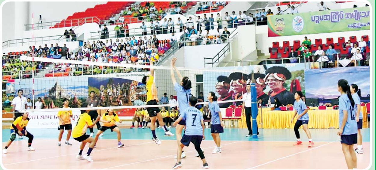
ဝန်ကြီးဌာနပေါင်းစုံ အမျိုးသမီးဘော်လီဘောပြိုင်ပွဲတွင် သမဝါယမနှင့် ကျေးလက်ဖွံ့ဖြိုးရေးဝန်ကြီးဌာနအသင်းနှင့် တိုင်းရင်းသား လူမျိုးများရေးရာဝန်ကြီးဌာနအသင်းတို့ ယှဉ်ပြိုင်ကစားကြစဉ်။