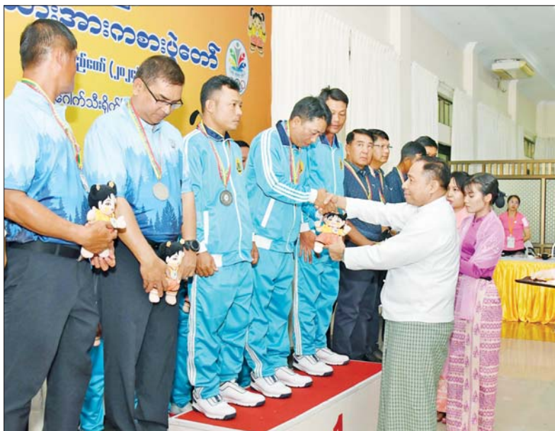
နိုင်ငံတော်စီမံအုပ်ချုပ်ရေးကောင်စီအဖွဲ့ဝင် ပြည်ထောင်စုဝန်ကြီး ဒုတိယဗိုလ်ချုပ် ကြီး ရာပြည့် ဝန်ကြီးဌာနအဆင့် ဂေါက်သီးရိုက်ပြိုင်ပွဲ အသင်းလိုက်(အကျောပေး)ပြိုင်ပွဲတွင် ပထမဆုရရှိသည့် ပို့ဆောင်ရေးနှင့် ဆက်သွယ်ရေးဝန်ကြီးဌာနအသင်းမှ ပြိုင်ပွဲဝင်များအား ဆုပေးအပ်ချီးမြှင့်စဉ်။

အဆိုပါ အခမ်းအနားသို့ နိုင်ငံ တော် စီမံအုပ်ချုပ်ရေးကောင်စီ အဖွဲ့ဝင် ဗိုလ်ချုပ်ကြီးညိုစော၊ နိုင်ငံတော် စီမံအုပ်ချုပ်ရေး ကောင်စီအဖွဲ့ဝင် ပြည်ထဲရေး