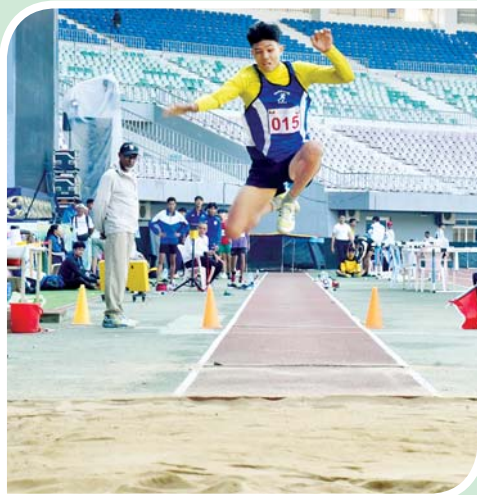
ပြည်နယ်နှင့်တိုင်းဒေသကြီး အမျိုးသား ပြေးခုန် ဖန်ပြိုင်ပွဲတွင် ပြိုင်ပွဲဝင်တစ်ဦး ယှဉ်ပြိုင်ကစားစဉ်။