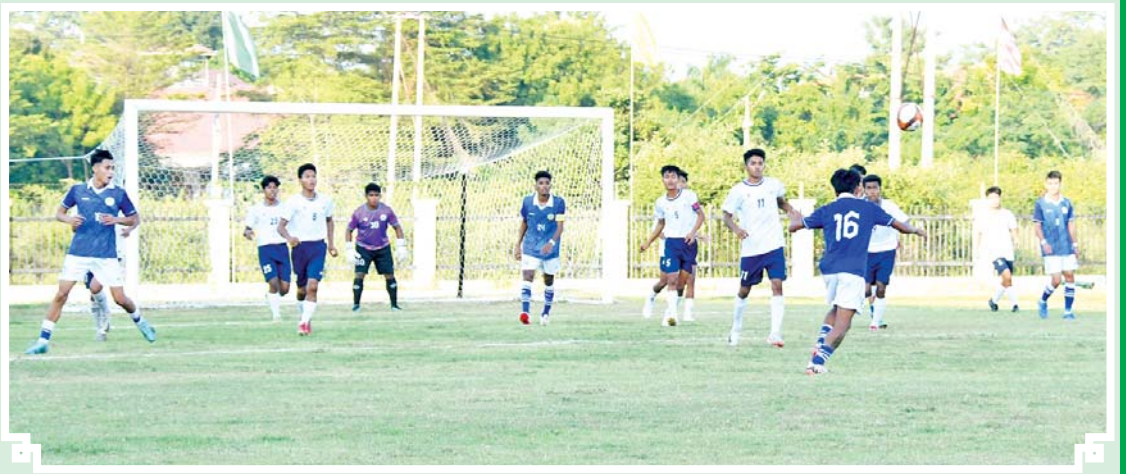
ဝန်ကြီးဌာနပေါင်းစုံ အမျိုးသားဘောလုံးပြိုင်ပွဲ အုပ်စုပွဲစဉ်အဖြစ် သီပေါနှင့်နည်းပညာဝန်ကြီးဌာနအသင်းနှင့် လူမှုဝန်ထမ်း၊ ကယ်ဆယ်ရေးနှင့် ပြန်လည်နေရာချထားရေးဝန်ကြီးဌာနအသင်းတို့ ယှဉ်ပြိုင်ကစားစဉ်။