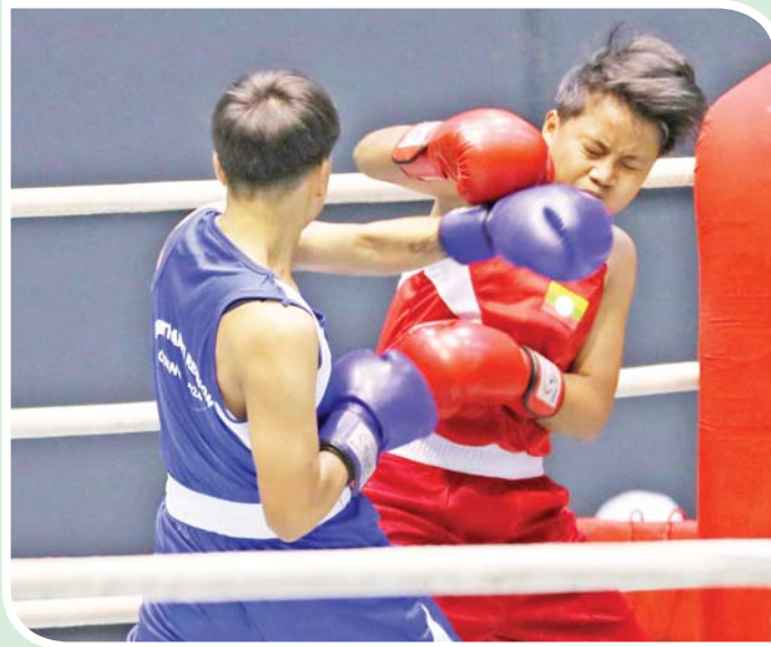
ပြည်နယ်နှင့်တိုင်းဒေသကြီး အမျိုးသမီး လက်ဝှေ့ပြိုင်ပွဲ ၅၄ ကီလိုတန်း တွင် တနင်္သာရီတိုင်းဒေသကြီးနှင့် ရှမ်းပြည်နယ်တို့မှ ပြိုင်ပွဲဝင်များ ယှဉ်ပြိုင်စဉ်။