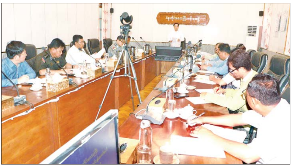
ငွေကျပ် ၄၉၀၉ ဒသမ ၃၄ သန်းရရှိခဲ့၍ ကာလတူ ဝင်ငွေကျပ် ၆၅၁ ဒသမ ၂၅ သန်း ပိုမိုတိုးတက်ခဲ့ နှိုင်းယှဉ်ချက်အရ ပြည်တွင်းခရီးသွား ၁၃၇၅၁ ဦးနှင့် ကြောင်း သိရသည်။ တိုင်းဒေသကြီး(ပြန်/ဆက်)

ပဲခူးတိုင်းဒေသကြီးအတွင်းသို့ ၂၀၂၄ ခုနှစ် ဇန်နဝါရီလမှ နိုဝင်ဘာလအထိ ပြည်တွင်းခရီးသွား ၃၉၉၆၃၇ ဦး၊ ပြည်ပခရီးသွား ၆၃၂၉ ဦးဝင်ရောက်ခဲ့ပြီး