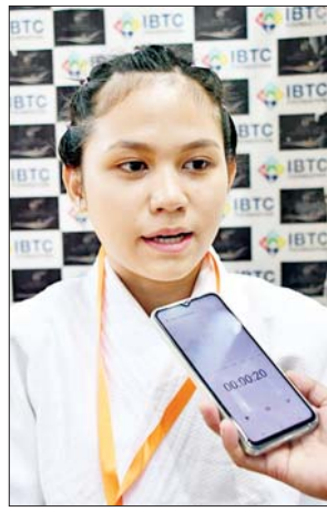
မနေ့မြတ်နိုးရွှေစင်