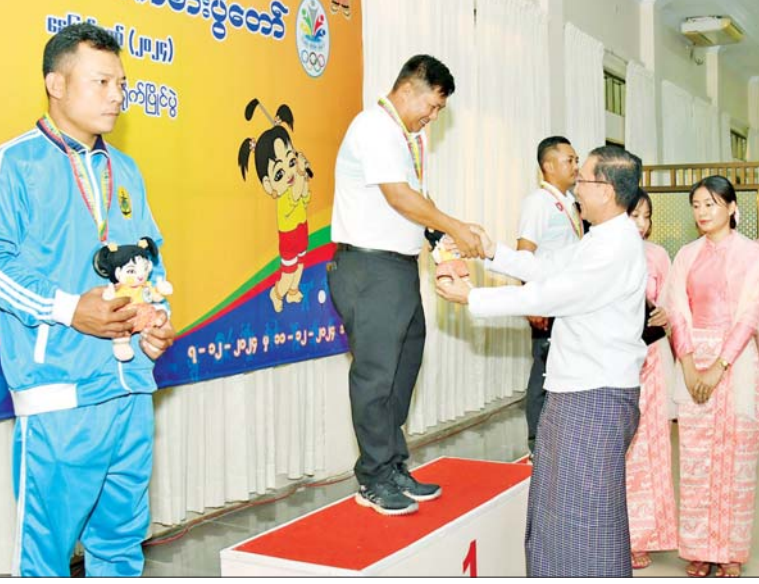
ဒုတိယဝန်ကြီးချုပ်နှင့် ပြည်ထောင်စုဝန်ကြီး ဦးဝင်းရှိန် ဝန်ကြီးဌာနအဆင့် ဂေါက်သီးရိုက်ပြိုင်ပွဲ တစ်ဦးချင်း(အကျောပေး)ပြိုင်ပွဲတွင် ပထမဆုရရှိသည့် ကာကွယ်ရေး ဝန်ကြီးဌာနမှ ပြိုင်ပွဲဝင်အား ဆုပေးအပ်ချီးမြှင့်စဉ်။