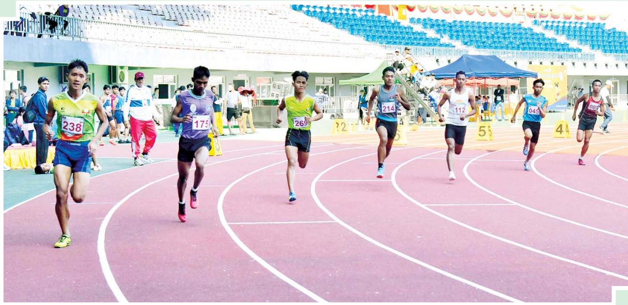
ပြည်နယ်နှင့်တိုင်းဒေသကြီး အမျိုးသား မီတာ ၈၀၀ အပြေးပြိုင်ပွဲတွင် ပါဝင်ယှဉ်ပြိုင်ကြသည့် အားကစားသမားများကို တွေ့ရစဉ်။