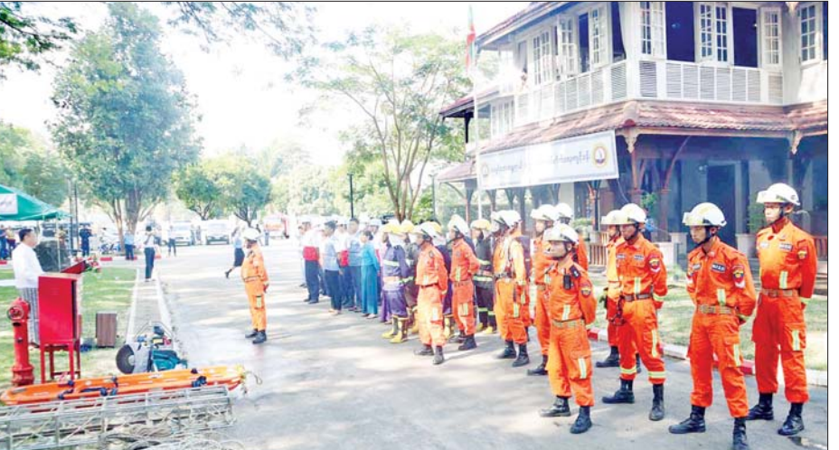
လုပ်ငန်းများ၊ ဖြစ်ပွားပြီးပါက ပြန်လည်ထူထောင်ရေးလုပ်ငန်း များ ဆောင်ရွက်နိုင်ရန်အတွက် ဌာနဆိုင်ရာ/ အဖွဲ့အစည်းများ အနေဖြင့် ပိုင်းဝန်းပူးပေါင်းပြီး ငလျင်ဘေးအန္တရာယ် သဏ္ဍာန်တူ ဇာတ်တိုက်ခြင်းကို လေ့ကျင့်ရ ခြင်းဖြစ်ကြောင်း၊ ဇာတ်တိုက် လေ့ကျင့်မှုများတွင် ပါဝင်သော သက်ဆိုင်ရာ ဌာနဆိုင်ရာများနှင့် တိုင်းဒေသကြီး(ပြန်/ဆက်)

ခြင်းနှင့် ဆေးရုံသို့ ပို့ဆောင်ခြင်း၊ ကျန်ရှိ/ ပျောက်ဆုံးသူများရှိ မရှိ ကို စာရင်းကောက်ယူ စိစစ်ဆောင် ရွက်ခြင်း စသည်တို့ကို အချိန်တို အတွင်း အလျင်အမြန်ပြီးစီး ရန် ဇာတ်တိုက်လေ့ကျင့်ခဲ့ကြ သည်။ ကျေးဇူးတင်ရှိ ဆက်လက်၍ တိုင်းဒေသကြီး ဝန်ကြီးချုပ် ဦးမြတ်ကိုက သဘာဝဘေးနှင့် ပတ်သက်၍ မဖြစ်ခင် ကြိုတင်ကာကွယ်ရမည့် နည်းလမ်းများ၊ ဖြစ်ပွားနေစဉ် ကာလအတွင်း ကယ်ဆယ်ရေး