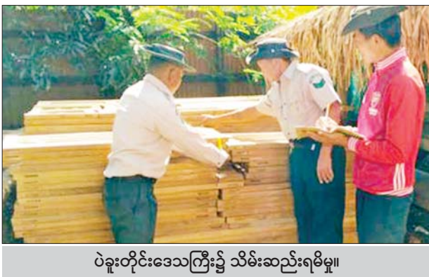
ပဲခူးတိုင်းဒေသကြီး၌ သိမ်းဆည်းရမိမှု။

တရားမဝင် ကုန်သွယ်မှုတိုက် ဖျက်ရေး ဦးဆောင်ကော်မတီ၏ ကြီးကြပ်ကွပ်ကဲမှုဖြင့် တရားမဝင် ကုန်သွယ်မှုများကို ဥပဒေနှင့်အညီ ထိရောက်စွာ တားဆီးအရေးယူ နိုင်ရေး ဆောင်ရွက်လျက်ရှိရာ ဒီဇင်ဘာ ၉ ရက်တွင် အကောက် ခွန်ဦးစီးဌာန၏ စီမံခန့်ခွဲမှုဖြင့် တာဝန်ကျ ပူးပေါင်းအဖွဲ့များက စစ်ဆေးမှုများ ဆောင်ရွက်ခဲ့ရာ မြန်မာ့စက်မှုဆိပ်ကမ်း၌ ကုန် သေတ္တာ ၂၀ အတွင်းမှ တရား ဝင်စာရွက်စာတမ်း အထောက် အထား တင်ပြနိုင်ခြင်းမရှိသည့် လုပ်ငန်းသုံးပစ္စည်း လေးမျိုး၊ လူသုံးကုန်ပစ္စည်း တစ်မျိုး (စုစုပေါင်း ခန့်မှန်းတန်ဖိုးငွေ ၇၃၄၈၂၁၂၈ကျပ်)ကို သိမ်းဆည်း ရမိခဲ့ပြီး အကောက်ခွန်လုပ်ထုံး လုပ်နည်းများနှင့်အညီ အရေးယူ ဆောင်ရွက်လျက်ရှိသည်။