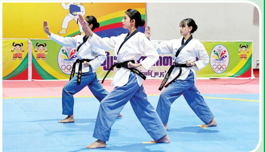
ပြည်နယ်နှင့်တိုင်းဒေသကြီး အမျိုးသမီးအသင်းလိုက် ကကွက်ပြိုင်ပွဲတွင် ပထမဆုရ ရန်ကုန်တိုင်း ဒေသကြီးတိုက်ကွမ်ဒိုအသင်း ယှဉ်ပြိုင်စဉ်။