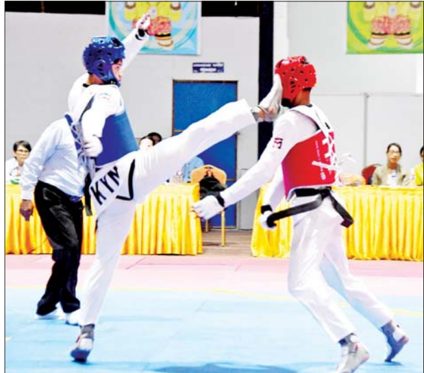
ပြည်နယ်နှင့်တိုင်းဒေသကြီး အမျိုးသား တိုက်ကွမ်ဒို အတိုက် ပြိုင်ပွဲတွင် မွန်ပြည်နယ်နှင့် ကရင်ပြည်နယ်တို့မှ အားကစားသမား များယှဉ်ပြိုင်စဉ်။