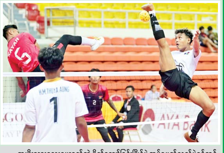
အမျိုးသားလေးယောက်တွဲ ပိုက်ကျော်ခြင်းပြိုင်ပွဲ အုပ်စုပတ်လည်ပွဲစဉ်တွင် ချင်းပြည်နယ်အသင်းနှင့် ကယားပြည်နယ်အသင်းတို့ ယှဉ်ပြိုင်စဉ်။