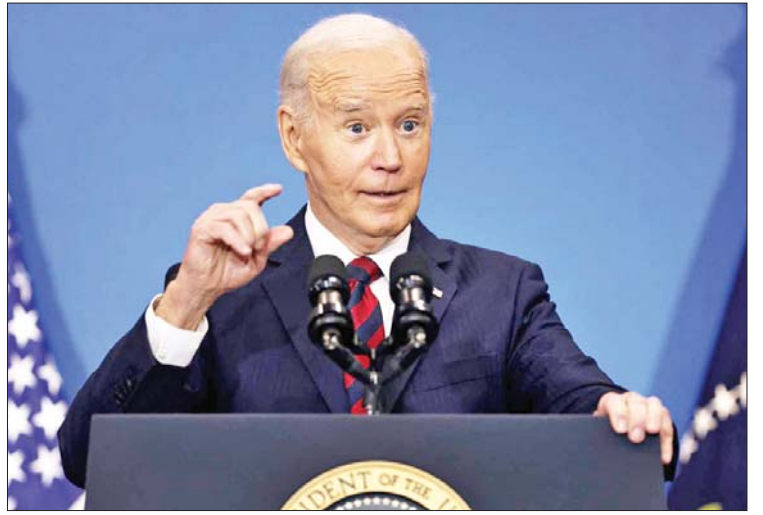
သွင်းကုန်များအပေါ် အကောက်ခွန် ဖြစ်ကြောင်း ပြောကြားသည်။ စည်းကြပ်မည်ဖြစ်ပြီး အမေရိကန်ပြည်သူ ကိုးကား - ဆင်ပွား များအတွက် အခွန်ကင်းလွတ်ခွင့်ပေးမည် ဘာသာပြန် - အောင်ကျော်ကျော်

စည်းကြပ်ရန် ထရမ်၏ အဆိုပြုချက်နှင့်ပတ်သက်၍ စိုးရိမ်ပူပန်မှုများကို ဖော်ပြခဲ့ပြီး ငွေကြေးဖောင်းပွမှုကို လျှော့ချရာတွင် စီးပွားရေးဖွံ့ဖြိုးတိုးတက်မှုကို ထိခိုက်စေနိုင်ပြီး စားသုံးသူများနှင့် စီးပွားရေးလုပ်ငန်းများအတွက် ကုန်ကျစရိတ် ပိုမိုမြင့်မားစေနိုင်ကြောင်း သတိပေးပြောကြားသည်။ ဒီဇင်ဘာ ၈ ရက်က အင်န်ဘီစီ နယူးအေဂျင်စီနှင့် အင်တာဗျူးတွင် ထရမ်သည် သူ၏ခံ့ခယ်စည်းရုံးရေးတွင် ကတိပေးခဲ့သည့်အတိုင်း အမေရိကန်၏အဓိက ကုန်သွယ်ဖက်များမှ တင်သွင်းသည့်