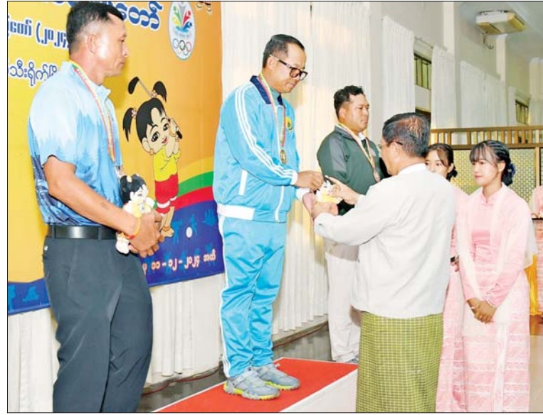
ဒုတိယဝန်ကြီးချုပ်နှင့် ပြည်ထောင်စုဝန်ကြီး ဦးသန်းဆွေ ဝန်ကြီးဌာနအဆင့် ဂေါက်သီးရိုက်ပြိုင်ပွဲ တစ်ဦးချင်း(အကျောပေး)ပြိုင်ပွဲတွင် ပထမဆုရရှိသည့် ပို့ဆောင်ရေး နှင့် ဆက်သွယ်ရေးဝန်ကြီးဌာနမှ ပြိုင်ပွဲဝင်အား ဆုပေးအပ်ချီးမြှင့်စဉ်။

အခမ်းအနားတွင် မြန်မာနိုင်ငံ ဂေါက်သီးအဖွဲ့ချုပ်ဥက္ကဋ္ဌ ဦးကိုကို အေးက Hole in One Prize ဆုရရှိ သည့် ပို့ဆောင်ရေးနှင့် ဆက်သွယ် ရေးဝန်ကြီးဌာန အသင်းမှ ဦးမျိုးလွင်ဦးအား ဂုဏ်ပြုဆုနှင့် အမျိုးသား အားကစားပွဲတော် အထိမ်းအမှတ်အရပ်ကို ပေးအပ် ချီးမြှင့်သည်။