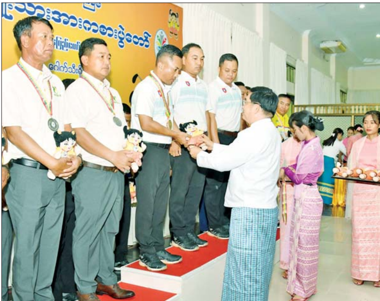
နိုင်ငံတော်စီမံအုပ်ချုပ်ရေးကောင်စီအဖွဲ့ဝင် ဗိုလ်ချုပ်ကြီးညိုစော ဝန်ကြီးဌာန အဆင့် ဂေါက်သီးရိုက်ပြိုင်ပွဲ အသင်းလိုက်(အကျောပေး)ပြိုင်ပွဲတွင် ပထမဆုရရှိသည့် ကာကွယ်ရေးဝန်ကြီးဌာနအသင်းမှ ပြိုင်ပွဲဝင်များအား ဆုပေးအပ်ချီးမြှင့်စဉ်။

နေပြည်တော် ဒီဇင်ဘာ ၁၁ ၂၀၂၄ ခုနှစ် ပဉ္စမအကြိမ် အမျိုးသား အားကစားပွဲတော် ဝန်ကြီးဌာနအဆင့်နှင့် ပြည်နယ် နှင့် တိုင်းဒေသကြီးအဆင့် ပြိုင်ပွဲ များ၏ ဗိုလ်လုပွဲနှင့် ဆုချီးမြှင့်ပွဲ အခမ်းအနားများကို ယနေ့တွင် နေပြည်တော်ရှိ သက်ဆိုင်ရာ အားကစားကွင်းနှင့် အားကစားရုံ များ၌ ကျင်းပရာ နိုင်ငံတော်စီမံ အုပ်ချုပ်ရေး ကောင်စီဝင်များ တက်ရောက် ကြည့်ရှုအားပေးပြီး ဆုများချီးမြှင့်ကြသည်။