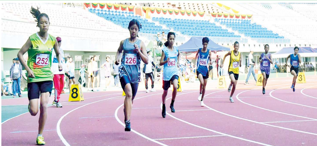
ပြည်နယ်နှင့်တိုင်းဒေသကြီး အမျိုးသမီး မီတာ ၈၀၀ အပြေးပြိုင်ပွဲတွင် ပါဝင်ယှဉ်ပြိုင်ကြသည့် အားကစားသမားများကို တွေ့ရစဉ်။