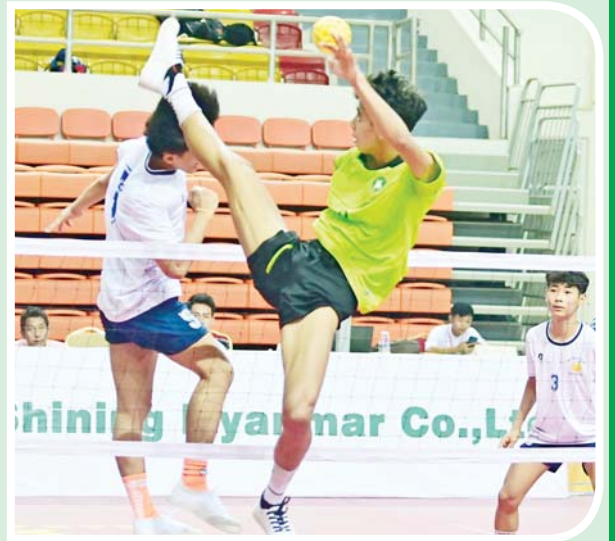
ပြည်နယ်နှင့်တိုင်းဒေသကြီး အမျိုးသား လေးယောက်တွဲ ဝိုက်ကျော်ခြင်းပြိုင်ပွဲတွင် နေပြည်တော်အသင်းနှင့် မွန်ပြည်နယ်အသင်းတို့ ယှဉ်ပြိုင်စဉ်။