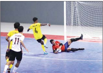
ဝန်ကြီးဌာနပေါင်းစုံ အမျိုးသားဖူဆယ်ဖြိုင်ပွဲ အုပ်စုပွဲစဉ်တွင် ဆောက်လုပ်ရေးဝန်ကြီးဌာနအသင်းနှင့် သာသနာရေးနှင့် ယဉ်ကျေးမှုဝန်ကြီးဌာနအသင်းတို့ ယှဉ်ပြိုင်ကစားစဉ်။