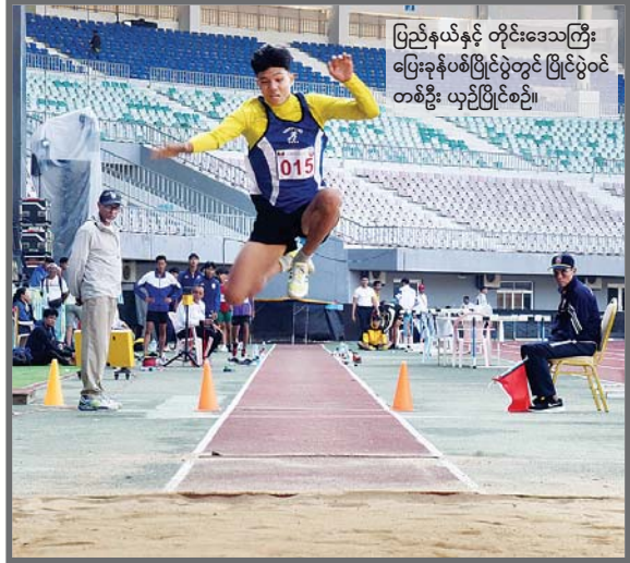
ပြည်နယ်နှင့် တိုင်းဒေသကြီး ပြေးခုန်ပစ်ပြိုင်ပွဲတွင် ပြိုင်ပွဲဝင် တစ်ဦး ယှဉ်ပြိုင်စဉ်။

နေပြည်တော် ဒီဇင်ဘာ ၁၁ ၂၀၂၄ ခုနှစ် ပဉ္စမအကြိမ် အမျိုးသား အားကစားပွဲတော် ဝန်ကြီးဌာနအဆင့်နှင့် ပြည်နယ်နှင့် တိုင်းဒေသကြီးအဆင့်ပြိုင်ပွဲ များ၏ ဗိုလ်လုပွဲနှင့် ဆုချီးမြှင့်ပွဲအခမ်း အနားများကို ယနေ့တွင် နေပြည်တော် ရှိ သက်ဆိုင်ရာ အားကစားကွင်းနှင့် အားကစားရုံများ၌ ကျင်းပရာ နိုင်ငံ တော် စီမံအုပ်ချုပ်ရေးကောင်စီဝင်များ တက်ရောက်ကြည့်ရှုအားပေးပြီး ဆုများ ချီးမြှင့်ကြသည်။ ဦးစွာ ၂၀၂၄ ခုနှစ် ပဉ္စမအကြိမ် အမျိုးသားအားကစားပွဲတော် ဝန်ကြီးဌာန အဆင့် ဂေါက်သီးရိုက်ပြိုင်ပွဲ ဆုပေးပွဲ အခမ်းအနားကို ယနေ့မနန်းလွဲပိုင်းတွင် နေပြည်တော်ရှိ မြို့တော်ဂေါက်ကွင်း၌ ကျင်းပသည်။ အဆိုပါအခမ်းအနားသို့ နိုင်ငံတော်စီမံ အုပ်ချုပ်ရေးကောင်စီအဖွဲ့ဝင် ဗိုလ်ချုပ် ကြီး ညိုစော၊ နိုင်ငံတော်စီမံအုပ်ချုပ်ရေး ကောင်စီအဖွဲ့ဝင် ပြည်ထဲရေးဝန်ကြီးဌာန စာမှတ်နာ ၃ ကော်လံ ၁ ၀