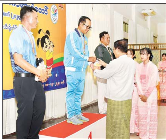
ဒုတိယဝန်ကြီးချုပ်နှင့် ပြည်ထောင်စုဝန်ကြီး ဦးသန်းဆွေ ဝန်ကြီးဌာနအဆင့် ဂေါက်သီးရိုက်ပြိုင်ပွဲ တစ်ဦးချင်း(အကျောပေး)ပြိုင်ပွဲတွင် ပထမဆုရ ပို့ဆောင်ရေး နှင့် ဆက်သွယ်ရေးဝန်ကြီးဌာနမှ ပြိုင်ပွဲဝင်အား ဂုဏ်ပြုဆုနှင့် အမျိုးသားအားကစား ပွဲတော်အထိမ်းအမှတ်အရပ် ပေးအပ်ချီးမြှင့်စဉ်။

က အသင်းလိုက်(အကျောပေး)ပြိုင်ပွဲတွင် ဝန်ကြီးဌာနနှင့် တတိယဆုရရှိသည့် ပထမဆုရရှိသည့် ကာကွယ်ရေးဝန်ကြီး ဌာန၊ ဒုတိယဆုရရှိသည့် ပြည်ထဲရေး