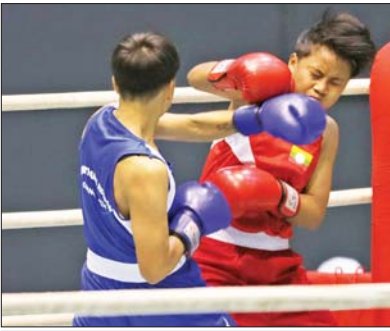
ပြည်နယ်နှင့် တိုင်းဒေသကြီး အမျိုးသမီး ၅၄ ကီလိုတန်းလက်ဝှေ့ ပြိုင်ပွဲတွင် တနင်္သာရီတိုင်းဒေသကြီးနှင့် ရှမ်းပြည်နယ်တို့မှ ပြိုင်ပွဲဝင်များ ယှဉ်ပြိုင်ထိုးသတ်စဉ်။