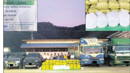
ပြည်တွင်းသတင်း စာ ၂၁

ရွာငုံမြို့နယ်၌ရှမ်းပြည်နယ်(မြောက်ပိုင်း) သို့ တရားမဝင်သယ်ဆောင်မည့် ထိန်းချုပ်စာတုပစ္စည်းကပင်း နှစ်တန်ခန့် ဖမ်းဆီးရမိ