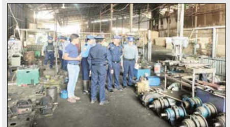
မွန်ပြည်နယ် သံဖြူဇရပ်မြို့နယ် မြို့နယ်အထွေထွေအုပ်ချုပ်ရေးဦးစီးဌာနမှ တာဝန်ရှိသူများ၊ မြို့နယ်မီးဘေးနှင့်သဘာဝဘေးအန္တရာယ်လျော့ချရေးနှင့် တပ်ဖွဲ့ဝင်များ၊ မြို့နယ်လူပုဂ္ဂိုလ်စစ်၊ ရဲတပ်ဖွဲ့ဝင်များ၊ မြို့နယ်စည်ပင်သာယာရေးအဖွဲ့များက ဒီဇင်ဘာ ၁၁ ရက် နံနက်ပိုင်းတွင် သံဖြူဇရပ်မြို့ ဝါခရူကျေးရွာရှိ ကံကောင်းခြင်း ရတနာသစ်ပါးလွှာစက်ရုံအား မီးဘေးအန္တရာယ်ကြိုတင်ကာကွယ်ရေး စစ်ဆေးဆောင်ရွက်စဉ်။ မြို့နယ် (ပြန်/ဆက်)

မုဒုံ ဒီဇင်ဘာ ၁၁ မွန်ပြည်နယ် မုဒုံမြို့နယ်တွင် စာသင်ကျောင်းအခြေပြု မီးဘေးနှင့် သဘာဝဘေးအန္တရာယ်လျော့ချရေး၊ တုံ့ပြန်ဆောင်ရွက်ရေး အသိပညာပေးကို ယနေ့နံနက်ပိုင်းက အာရှစွမ်းကိုယ်ပိုင်စာသင်ကျောင်း၌ ပြုလုပ်သည်။ ဦးစွာ မုဒုံမြို့နယ် မီးဘေးနှင့်သဘာဝဘေးအန္တရာယ်လျော့ချရေးနှင့် တုံ့ပြန်ဆောင်ရွက်ရေးလုပ်ငန်းများကို ကစားနည်းပုံစံဖြင့် မိသားစု၊ သူငယ်ချင်းများနှင့်အတူ လေ့လာဆော့ကစားနိုင်ရန် စီစဉ်ထားကြောင်း ရှင်းလင်းပြောကြားပြီး တပ်ဖွဲ့ဝင် ၁၄ ဦးနှင့်အတူ မီးသတ်ဆေးဘူးအသုံးပြု၍ လက်တွေ့ မီးငြိမ်းသတ်နည်း၊ မီးငြိမ်းသတ်ယာဉ်ဖြင့် သရုပ်ပြလေ့ကျင့် မီးငြိမ်းသတ်နည်း၊ အရေးပေါ်အခြေအနေတွင် ဆောင်ရွက်ရမည့် နည်းလမ်းများကို လက်တွေ့သရုပ်ပြ ဆောင်ရွက်ခဲ့ကြောင်း သိရသည်။ အောင်မျိုးသူ (ပြန်/ဆက်)