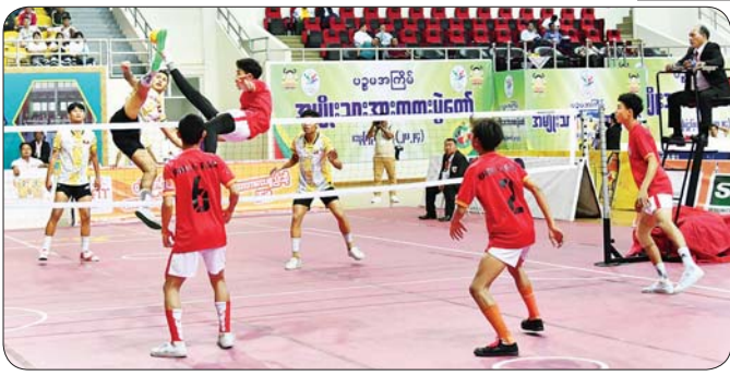
ပြည်နယ်နှင့်တိုင်းဒေသကြီး ဝိုက်ကျော်ခြင်းပြိုင်ပွဲတွင် မန္တလေးတိုင်းဒေသကြီးနှင့် ရှမ်းပြည်နယ်အသင်း တို့ ယှဉ်ပြိုင်ကစားစဉ်။