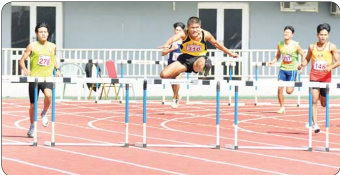
ပြည်နယ်နှင့် တိုင်းဒေသကြီး အမျိုးသား မိတာ ၄၀၀ တန်းကျော်ပြိုင်ပွဲတွင် ပြိုင်ပွဲဝင်များ ယှဉ်ပြိုင် နေမှုကို တွေ့ရစဉ်။