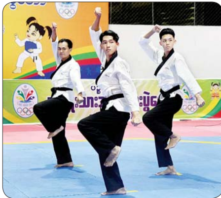
ပြည်နယ်နှင့် တိုင်းဒေသကြီး အမျိုးသားတိုက်ကွမ်ဒိုပြိုင်ပွဲတွင် ပထမဆူရ ရန်ကုန်တိုင်းဒေသကြီးအသင်းမှ ပြိုင်ပွဲဝင်များ၏ ယှဉ်ပြိုင်နေမှုကို တွေ့ရစဉ်။