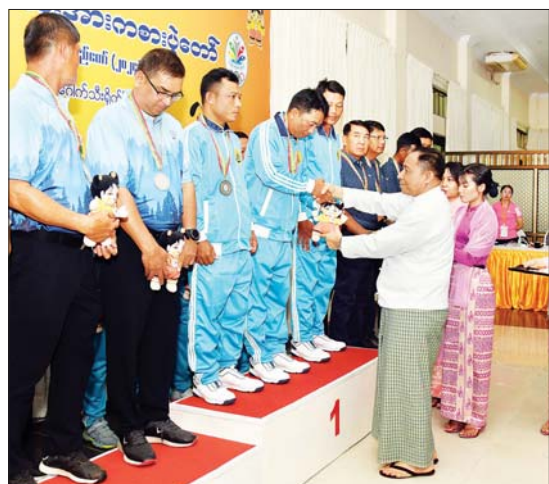
နိုင်ငံတော်စီမံအုပ်ချုပ်ရေးကောင်စီအဖွဲ့ဝင် ပြည်ထောင်စုဝန်ကြီး ဒုတိယဗိုလ်ချုပ်ကြီး ရာပြည့် ဝန်ကြီးဌာနအဆင့် ဂေါက်သီးရိုက်ပြိုင်ပွဲ အသင်းလိုက်(အကျောမဲ့)ပြိုင်ပွဲ တွင် ပထမဆုရ ပို့ဆောင်ရေးနှင့် ဆက်သွယ်ရေးဝန်ကြီးဌာနမှ ပြိုင်ပွဲဝင်များအား ဂုဏ်ပြုဆုနှင့် အမျိုးသားအားကစားပွဲတော်အထိမ်းအမှတ်အရပ် ပေးအပ်ချီးမြှင့်စဉ်။