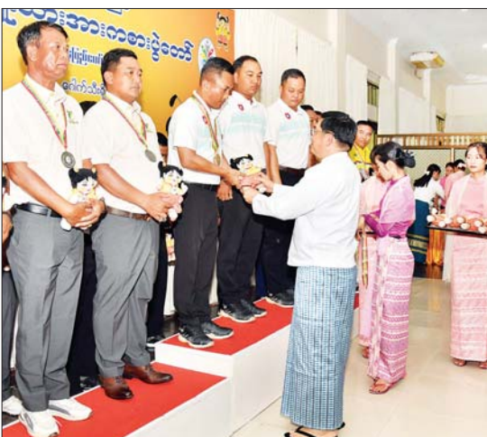
နိုင်ငံတော်စီမံအုပ်ချုပ်ရေးကောင်စီအဖွဲ့ဝင် ဗိုလ်ချုပ်ကြီးညိုစော ဝန်ကြီးဌာနအဆင့် ဂေါက်သီးရိုက်ပြိုင်ပွဲ အသင်းလိုက်(အကျောပေး) ပြိုင်ပွဲတွင် ပထမဆုရ ကာကွယ် ရေးဝန်ကြီးဌာနမှ ပြိုင်ပွဲဝင်များအား ဂုဏ်ပြုဆုနှင့် အမျိုးသားအားကစားပွဲတော် အထိမ်းအမှတ်အရပ် ပေးအပ်ချီးမြှင့်စဉ်။

ယင်းနောက် နိုင်ငံတော်စီမံအုပ်ချုပ် ရေးကောင်စီအဖွဲ့ဝင်ဗိုလ်ချုပ်ကြီးညိုစော