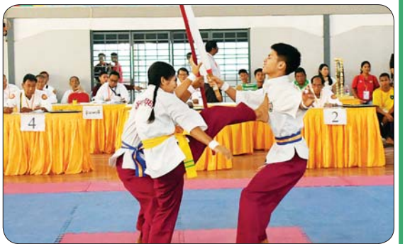
ပြည်နယ်နှင့် တိုင်းဒေသကြီး မြန်မာ့သိုင်းပြိုင်ပွဲ တွဲဖက်နည်းပြအဆင့် ပြိုင်ပွဲတွင် ပြိုင်ပွဲဝင်များ ယှဉ်ပြိုင်နေမှုကို တွေ့ရစဉ်။