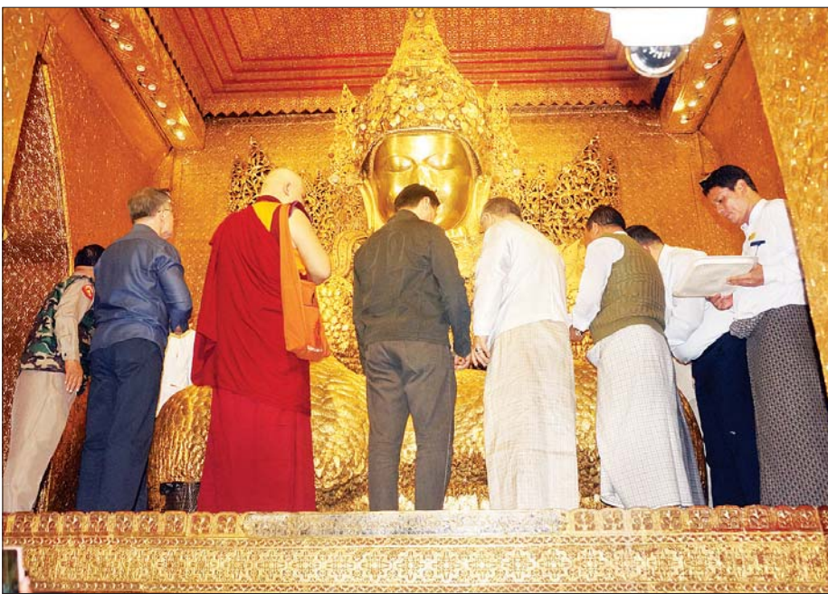
ရုရှားဖက်ဒရေရှင်းနိုင်ငံ ကာလ်မီးကီယာပြည်နယ် အကြီးအကဲ H.E. Mr. Batu KHASIKOV ဦးဆောင်သော ကိုယ်စားလှယ်အဖွဲ့ မဟာမြတ်မုနိရုပ်တော်မြတ်ကြီးအား ဖူးမြော်ပြီး ပန်း၊ ရေချမ်းနှင့် ရွှေသင်္ကန်းများ ဆက်ကပ်လှူဒါန်းစဉ်။

သီတဂူဆေးရုံတော်များ၏ အမိပတိ၊ အဘိဓဇမဟာရဋ္ဌဂုရုအဘိဓဇအဂ္ဂမဟာ သဒ္ဓမ္မဇောတိက မဟာဓမ္မကထိက ဗဟုဇနဟိတရေ သီတဂူဆရာတော် ခေါက်တာ ဘန္တန္တဏီဿရအား သွားရောက်ဖူးမြော်ကြပြီး ဗုဒ္ဓဘာသာပြန့်ပွားရေးလုပ်ငန်းများနှင့် စပ်လျဉ်း၍ အပြန်အလှန် ဆွေးနွေးကြသည်။ (အောက်ပုံ) ဆက်လက်၍ ကာလ်မီးကီယာပြည်နယ် အကြီးအကဲနှင့် အဖွဲ့သည် မန္တလေးမြို့သို့ ပြန်လည်ထွက်ခွာလာပြီး ကုသိုလ်တော်ဘုရား၊ မဟာလောကမာရဇိန်ကျောက်တော်ကြီး ဘုရားနှင့် မန္တလေးတောင်တော်ရှိ ဆူတောင်းပြည့်စေတီတော်တို့ကို သွားရောက်ဖူးမြော်ကြည့်ပါကြသည်။ ညနေပိုင်းတွင် မန္တလေးတိုင်းဒေသကြီး ဝန်ကြီးချုပ်သည် ကာလ်မီးကီယာပြည်နယ် အကြီးအကဲနှင့် အဖွဲ့အား Mingalar Mandalay Hotel ၌ ညစာဖြင့် တည်ခင်းစဉ်ခံခဲ့ကြောင်း သိရသည်။ သတင်းစဉ်