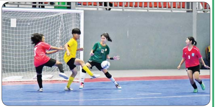
ပြည်နယ်နှင့် တိုင်းဒေသကြီး အမျိုးသမီးဖူဆယ်ပြိုင်ပွဲတွင် ရန်ကုန်တိုင်းဒေသကြီးအသင်းနှင့် ကချင်ပြည်နယ်အသင်းတို့ ယှဉ်ပြိုင်ကစားစဉ်။