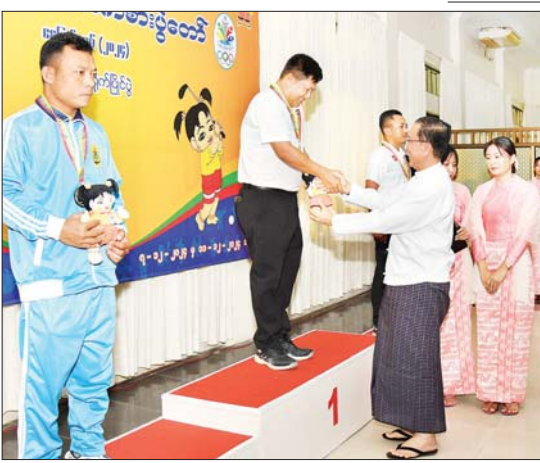
ဒုတိယဝန်ကြီးချုပ်နှင့် ပြည်ထောင်စုဝန်ကြီး ဦးဝင်းရှိန် ဝန်ကြီးဌာနအဆင့် ဂေါက်သီးရိုက်ပြိုင်ပွဲ တစ်ဦးချင်း(အကျောမဲ့)ပြိုင်ပွဲတွင် ပထမဆုရ ကာကွယ်ရေး ဝန်ကြီးဌာနမှ ပြိုင်ပွဲဝင်အား ဂုဏ်ပြုဆုနှင့် အမျိုးသားအားကစားပွဲတော်အထိမ်း အမှတ်အရပ် ပေးအပ်ချီးမြှင့်စဉ်။