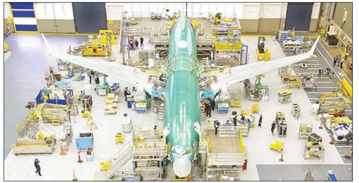
ပိုင်းဆိုင်ရာ ပညာရှင်များ၏ သပိတ်မှောက်မှုစတင်မီ ဩဂုတ်လအတွင်းက အစားရတ်မြို့၌

အတွက်သည် လွန်ခဲ့သည့်နှစ် နိုဝင်ဘာနှင့် နိုင်းယုဉ်လျှင် အရေအတွက် သိသိသာသာကျဆင်းသွားသည်ကိုတွေ့ရသည်။ လွန်ခဲ့သည့်နှစ် နိုဝင်ဘာလက ဘိုအင်းကုမ္ပဏီသည် လေယာဉ် ၅၆ စင်း တင်ပို့နိုင်ခဲ့သည်။ ကုမ္ပဏီသည် ထုတ်လုပ်မှုနှုန်းထားများ ပြန်လည်ရရှိရန် လုပ်ဆောင်နေကြောင်း ပြောကြားခဲ့သည်။ ဘိုအင်းကုမ္ပဏီသည် စက်