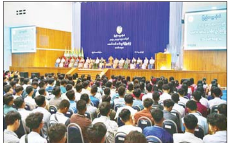
ပြည်တက္ကသိုလ်၌ ၂၀၂၄-၂၀၂၅ ပညာသင်နှစ် မောင်မယ်သစ်လွင်ကြိုဆိုပွဲအခမ်းအနားကျင်းပ