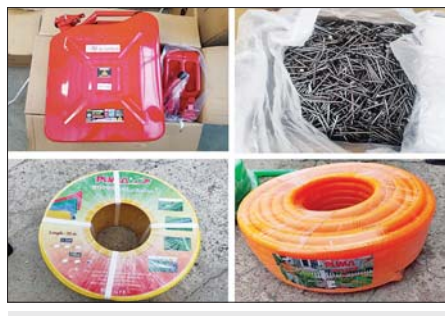
မြန်မာ့စက်မှုဆိပ်ကမ်း၌ ဖမ်းဆီးရမိမှု။

နေပြည်တော် ဒီဇင်ဘာ ၁၁ တရားမဝင်ကုန်သွယ်မှုတိုက်ဖျက်ရေးဦးဆောင်ကော်မတီ၏ ကြီးကြပ်ကွပ်ကဲမှုဖြင့် တရားမဝင်ကုန်သွယ်မှုများကို ဥပဒေနှင့်အညီ ထိရောက်စွာ တားဆီးအရေးယူနိုင်ရေး ဆောင်ရွက်လျက်ရှိရာ ဒီဇင်ဘာ ၉ ရက်တွင် အကောက်ခွန်ဦးစီးဌာန၏ စီမံခန့်ခွဲမှုဖြင့် တာဝန်ကျပေးပေါင်းအဖွဲ့များက စစ်ဆေးမှုများဆောင်ရွက်ခဲ့ရာ မြန်မာ့စက်မှုဆိပ်ကမ်း၌ ကုန်သွေတာ အလုံး ၂၀ အတွင်းမှ တရားဝင်စာရွက်စာတမ်းအထောက်အထား တင်ပြနိုင်ခြင်းမရှိသည့် လုပ်ငန်းသုံးပစ္စည်းလေးမျိုး၊ လူသုံးကုန်ပစ္စည်းတစ်မျိုး စုစုပေါင်း ခန့်မှန်းတန်ဖိုးငွေကျပ် ၇၃၄၈၂၁၂၈ ကို ဖမ်းဆီးရမိခဲ့ပြီး အကောက်ခွန်လုပ်ထုံးလုပ်နည်းများနှင့်အညီ အရေးယူဆောင်ရွက်လျက်ရှိသည်။