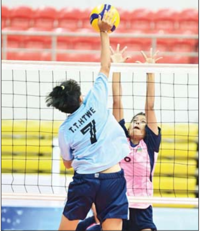
ပြည်နယ်နှင့် တိုင်းဒေသကြီး အမျိုးသမီးဘော်လီဘော ပြိုင်ပွဲတွင် မန္တလေးတိုင်းဒေသကြီးအသင်းနှင့် တနင်္သာရီ တိုင်းဒေသကြီးအသင်းတို့ ယှဉ်ပြိုင်စဉ်။