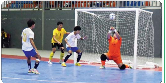
ပြည်နယ်နှင့် တိုင်းဒေသကြီး အမျိုးသားဖူဆယ်ပြိုင်ပွဲတွင် ရန်ကုန်တိုင်းဒေသကြီးအသင်းနှင့် ရှမ်းပြည်နယ်အသင်းတို့ အကြိတ်အနယ် ယှဉ်ပြိုင်ကစားစဉ်။