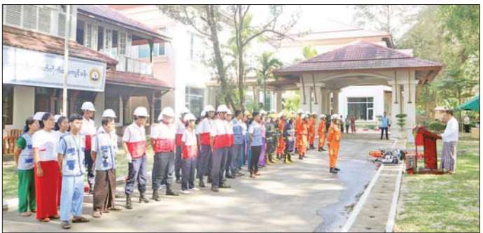
တာဝန်ရှိသူများ၊ ဝန်ထမ်းများနှင့် ဧည့်သည်များ ငလျင်ဘေးအန္တရာယ်နှင့်ပတ်သက်၍ ဆောင်ရွက်/အနေဖြင့် သဘာဝဘေးအန္တရာယ်များဖြစ်ပွားလာပါ ရောင်ရန်များကို ပြောကြားခဲ့ကြောင်း သိရသည်။ က စနစ်တကျတုံ့ပြန်ဆောင်ရွက်နိုင်မည့် နည်းလမ်း၊ တိုင်းဒေသကြီး(ပြန်/ဆက်)

သယ်ဆောင်ရေးယာဉ်များဖြင့် ရှာဖွေကယ်ဆယ်ရေး သုံးပစ္စည်းကိရိယာများကို အသုံးပြု၍ ကယ်ဆယ်ခြင်း၊ ပိတ်မိနေသူများနှင့် ဒဏ်ရာရရှိသူများအား ရှာဖွေကယ်ဆယ်ရေးသုံးပစ္စည်းများ အသုံးပြု၍ ကယ်ဆယ်ခြင်း၊ ကျန်းမားရေးစောင့်ရှောက်မှုပေးခြင်း၊ ဒဏ်ရာရရှိသူများအနက် အရေးပေါ်လူနာ၊ အရေးကြီးလူနာ၊ သာမန်လူနာများခွဲခြား၍ ရှေးဦးသူနာပြုစုခြင်းနှင့် ဆေးရုံသို့ပို့ဆောင်ခြင်း၊ ကျန်ရှိ/ပျောက်ဆုံးသူများရှိ/မရှိကို စာရင်းကောက်ယူစစ်ဆေးခြင်းတို့ကို အချိန်တိုအတွင်း အလျင်အမြန်ပြီးစီးရန် သရုပ်ပြလေ့ကျင့်ခဲ့ကြသည်။ ယင်းနောက် တိုင်းဒေသကြီးဝန်ကြီးချုပ်က ငလျင်ဘေးအန္တရာယ်သဏ္ဍာန်တူ သရုပ်ပြလေ့ကျင့်ခြင်းအန္တရာယ်ဖြစ်သည့်အတွက် ယခုလို လေ့ကျင့်ခြင်းများဆောင်ရွက်ရခြင်းဖြစ်ကြောင်း၊ ဟိုတယ်အတွင်းရှိ