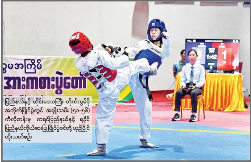
ပဉ္စမအကြိမ် အားကစားပွဲတော် ပြည်နယ်နှင့် တိုင်းဒေသကြီး တိုက်ကွမ်ဒို အတိုက်ပြိုင်ပွဲတွင် အမျိုးသမီး (၅၁-၅၆) ကီလိုတန်းမှ ကရင်ပြည်နယ်နှင့် ရခိုင် ပြည်နယ်တို့ယှဉ်ပြိုင်ပွဲတွင် ယှဉ်ပြိုင် ထိုးသတ်စဉ်။