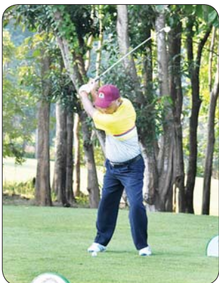
ဝန်ကြီးဌာန အဆင့် ဂေါက်သီး ရိုက်ပြိုင်ပွဲ တွင် ပြိုင်ပွဲ ဝင်များ ယှဉ်ပြိုင် နေမှုကို တွေ့ရစဉ်။