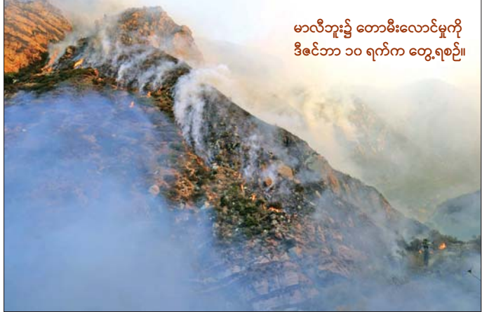
မာလီဘူး၌ တောမီးလောင်မှုကို ဒီဇင်ဘာ ၁၀ ရက်က တွေ့ရစဉ်။

ဖရန်ကလင်း ဖိုင်းယားဟု အမည်ပေးထားသည့် တောမီးသည် ဒီဇင်ဘာ ၉ ရက် ညပိုင်းက စတင်လောင်ခဲ့ခြင်းဖြစ်ပြီး လော့စ်အိန်ဂျလစ် ကောင်တီရှိ မာလီဘူးပြည်နယ် ပန်းခြံမှ စတင်လောင်ခဲ့ခြင်းဖြစ်သည်။