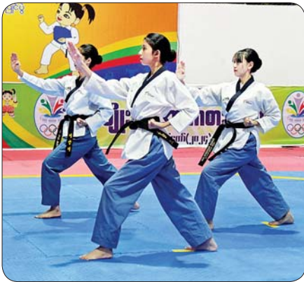
ပြည်နယ်နှင့် တိုင်းဒေသကြီး အမျိုးသမီးတိုက်ကွမ်ဒိုပြိုင်ပွဲတွင် ပထမဆူရ ရန်ကုန်တိုင်းဒေသကြီးအသင်းမှ ပြိုင်ပွဲဝင်များ ပြိုင်ပွဲဝင်ယှဉ်ပြိုင်စဉ်။