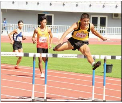
ပြည်နယ်နှင့် တိုင်းဒေသကြီး အမျိုးသား ဗီတာ ၄၀၀ တန်းကျော်ပြိုင်ပွဲ ဗိုလ်လုပွဲစဉ်တွင် ပြိုင်ပွဲဝင်ကစားသမား များ ယှဉ်ပြိုင်နေစဉ်။