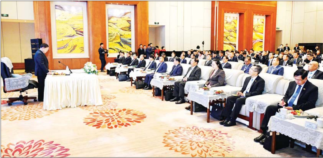
နိုင်ငံတော်စီမံအုပ်ချုပ်ရေးကောင်စီဥက္ကဋ္ဌ နိုင်ငံတော်ဝန်ကြီးချုပ် ဗိုလ်ချုပ်မှူးကြီး မင်းအောင်လှိုင် တရုတ် - မြန်မာ ရင်းနှီးမြှုပ်နှံမှုနှင့်စီးပွားရေးလုပ်ငန်းရှင်များ တွေ့ဆုံပွဲတွင် အမှာစကားပြောကြားစဉ်။ (၅-၁၁-၂၀၂၄ ရက်)

စာရေးသူလုပ်ငန်းခွင်မှ သက်ပြည့် ပင်စင်ယူခဲ့သည်မှာ ဆယ်စုနှစ်တစ်ခုမျှ ကြာမြင့်ခဲ့ပါပြီ။ လျင်မြန်စွာ စီးဆင်းနေသော သတင်းခေတ်ကြီးထဲတွင် မျက်မှောက်ခေတ် ကမ္ဘာ့အရေး၊ နိုင်ငံအရေးများနှင့် မျက်ခြည်မပြတ်စေခြင်းငှာ သတင်းများကို နေ့စဉ်စားသုံးနေရပါသည်။ သတင်းများ စီးဆင်းပုံကလည်း အမျိုးမျိုးဖြစ်သည်။ လူမှုကွန်ရက် မီဒီယာများတွင် သတင်းများက အဆီးအတားမရှိ အရှိန်အဟုန်ပြင်းပြင်းဖြင့် စီးဆင်းနေကြသည်။ သို့သော် တာဝန်ယူမှု၊ တာဝန်ခံမှု ကင်းမဲ့နေတတ်သည်။ သတင်းများ၏ မှန်ကန်စိတ်ချရမှု တန်ဖိုးက အထိန်းအကွပ်မဲ့စွာ ပရမ်းပတာဖြစ်နေတတ်သည်။ တစ်ဖက်တွင် တရားဝင်ထုတ်ဝေနေသည့် ပုံနှိပ်မီဒီယာများရှိသည်။ သတင်းစီးဆင်းမှု အနည်းငယ်ကြန့်ကြာသည်ဟုထင်ရသော်လည်း ၎င်းတို့၏ အားသာချက်မှာ ရာနှုန်းပြည့် မှန်ကန်စိတ်ချရမှု ရှိခြင်းပင်ဖြစ်သည်။ အဆင့်ဆင့်သော နေရာဌာနတိုင်းတွင် တာဝန်ယူမှု၊ တာဝန်ခံမှုအပြည့်ဖြင့် သတင်းစစ်၊ သတင်းမှန်များကို ပြည်သူ့လူထုလက်ဝယ်သို့ ပို့ဆောင်ပေးနေကြခြင်းဖြစ်သည်။ မှန်မှန်ကန်ကန်သုံးသပ်နိုင်ရန် အထောက်အပံ့ကောင်းများရရှိ စာရေးသူတို့အိမ်ထဲ ဖြန့်ဖြူးအလင်း၊ ကြေးမုံနှင့် ဖြတ်တိုသတင်းစာ သုံးစောင်လုံး ယူထားသည်။ ဈေးနှုန်းများကလည်း သင့်တင့်မျှတသည်။ သတင်းစာ သုံးစောင်လုံးအတွက် တစ်လတာကျသင့်ငွေမှာ လက်ရည်ပိုင်းတစ်ပိုင်းစာမျှသာရှိသည်။ ကျေနပ်စရာအကောင်းဆုံးမှာ စာရေးသူအဖို့ လက်ရှိဖြစ်ပျက်နေသော အခြေအနေများကို ခိုင်ခိုင်လုံလုံ၊ တိတိကျကျနှင့် မှန်မှန်ကန်ကန်သုံးသပ်နိုင်ရန်အတွက် အထောက်အပံ့ကောင်းများ ရရှိစေခြင်းပင်ဖြစ်သည်။ ၂၀၂၄ ခုနှစ် နိုဝင်ဘာလ ၄ ရက်တွင် နိုင်ငံတော်အကြီးအကဲ တရုတ်ပြည်သူ့သမ္မတနိုင်ငံသို့ သွားရောက်မည့် အကြောင်း သတင်းစာသုံးစောင်လုံး၏