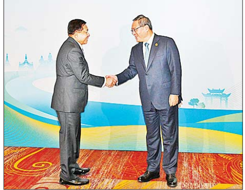
နိုင်ငံတော်စီမံအုပ်ချုပ်ရေးကောင်စီဥက္ကဋ္ဌ နိုင်ငံတော်ဝန်ကြီးချုပ် ဗိုလ်ချုပ်မှူးကြီး မင်းအောင်လှိုင်အား (၈) ကြိမ်မြောက် မဟာမိတ်အဖွဲ့အစည်းအစည်းအဝေး ကြိုဆိုညှာစားပွဲ အခမ်းအနားတွင် တရုတ်ပြည်သူ့သမ္မတနိုင်ငံဝန်ကြီးချုပ် H.E. Mr. Li Qiang က ရင်းရင်းနှီးနှီး ကြိုဆိုနှုတ်ဆက်စဉ်။

2024年11月6-7日 中国·昆明 6-7 November 2024 Kunming