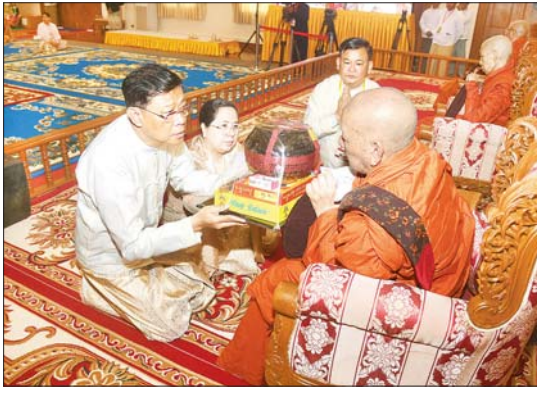
နိုင်ငံတော်စီမံအုပ်ချုပ်ရေး ကောင်စီအဖွဲ့ဝင် ဗိုလ်ချုပ်ကြီး မြထွန်းဦးနှင့်ဇနီး ဆရာတော်အား ကထိန်သင်္ကန်းနှင့် လှူဖွယ်ပစ္စည်းများ ဆက်ကပ် လှူဒါန်းစဉ်။