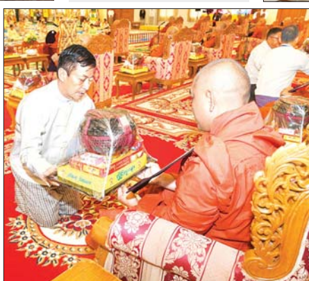
နိုင်ငံတော်စီမံအုပ်ချုပ်ရေးကောင်စီအဖွဲ့ဝင် ခွန်စုံလှိုင် ဆရာတော်အား ကထိန်သင်္ကန်းနှင့် လှူဖွယ်ပစ္စည်းများ ဆက်ကပ်လှူဒါန်းစဉ်။