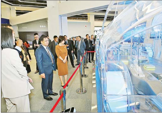
နိုင်ငံတော်စီမံအုပ်ချုပ်ရေးကောင်စီဥက္ကဋ္ဌ နိုင်ငံတော်ဝန်ကြီးချုပ် ဗိုလ်ချုပ်မှူးကြီး မင်းအောင်လှိုင် BYD မော်တော်ကားထုတ်လုပ်ရေးကုမ္ပဏီတွင် ကြည့်ရှုလေ့လာစဉ်။