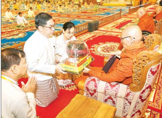
နိုင်ငံတော်စီမံအုပ်ချုပ်ရေး ကောင်စီအဖွဲ့ဝင် ဗိုလ်ချုပ်ကြီး ညိုစောနှင့်ဇနီး ဆရာတော်အား ကထိန်သင်္ကန်းနှင့် လှူဖွယ်ပစ္စည်းများ ဆက်ကပ် လှူဒါန်းစဉ်။