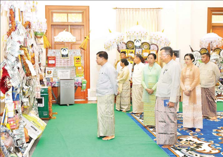
နိုင်ငံတော်စီမံအုပ်ချုပ်ရေးကောင်စီဥက္ကဋ္ဌ နိုင်ငံတော်ဝန်ကြီးချုပ် ဗိုလ်ချုပ်မှူးကြီး မင်းအောင်လှိုင်နှင့် ဇနီး ဒေါ်ကြူကြူလှ အခမ်းအနား တက်ရောက်လာသည့် ဧည့်ပရိသတ်များ ကထိန်ခံ နေပြည်တော် ဥက္ကရသီရိမြို့နယ် ဝဇီရာနန္ဒသုဗောဓာရုံကျောင်းတိုက်သို့ လှူဒါန်းရန် ခင်းကျင်းပြင်ဆင်ထားသည့် ကထိန်လျာသင်္ကန်း၊ လှူဖွယ်ပစ္စည်းများနှင့် ပဒေသာပင်များအား လှည့်လည်ကြည့်ရှုကြစဉ်။

တိုက်သို့ လှူဒါန်းရန် ခင်းကျင်း ပြင်ဆင်ထားသည့် ကထိန်လျာ သင်္ကန်း၊ လှူဖွယ်ပစ္စည်းများနှင့် ပဒေသာပင်များအား လှည့်လည် ကြည့်ရှုကြသည်။ ဧတ္တသုတ် ပရိတ်တရားတော်များ နာယူ ယင်းနောက် အခမ်းအနားကို “နမောတဿ” သုံးကြိမ်ရွတ်ဆို ဘုရားကန်တော့ ဖွင့်လှစ်ပြီး နိုင်ငံတော် စီမံအုပ်ချုပ်ရေး ကောင်စီဥက္ကဋ္ဌ နိုင်ငံတော်ဝန်ကြီး ချုပ်နှင့် အခမ်းအနား တက်ရောက် လာကြသည့် ဧည့်ပရိသတ် အပေါင်းတို့သည် သန်လျင် မင်းကျောင်း ဆရာတော်ကြီးထံမှ ငါးပါးသီလံယူဆောက်တည်၍ သံဃာတော် အရှင်သုမြတ်များ ရွတ်ပွား သရဇ္ဈာယ်တော်မူသော မေတ္တသုတ်ပရိတ်တရားတော်များ ကို နာယူကြသည်။ ကထိန်လျာသင်္ကန်းနှင့် လှူဖွယ်ပစ္စည်းများ ဆက်ကပ်လှူဒါန်း ဆက်လက်၍ နိုင်ငံတော်စီမံ အုပ်ချုပ်ရေးကောင်စီ ဥက္ကဋ္ဌ နိုင်ငံတော်ဝန်ကြီးချုပ်နှင့် ဇနီး တို့သည် သန်လျင်မင်းကျောင်း စာမျက်နှာ ၄ သို့