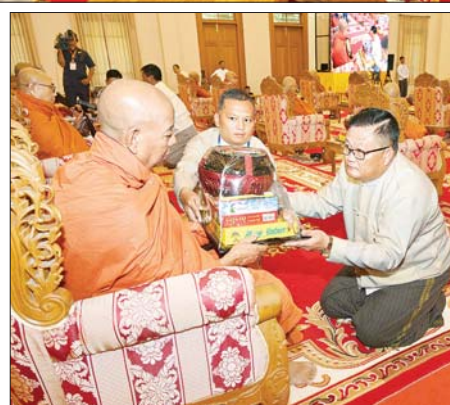
နိုင်ငံတော်စီမံအုပ်ချုပ်ရေးကောင်စီအဖွဲ့ဝင် ဦးရန်ကျော် ဆရာတော် အား ကထိန်သင်္ကန်းနှင့် လှူဖွယ်ပစ္စည်းများ ဆက်ကပ်လှူဒါန်းစဉ်။