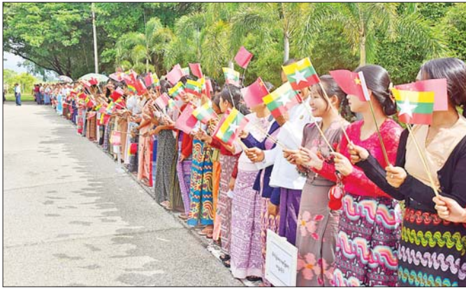
နိုင်ငံတော်စီမံအုပ်ချုပ်ရေးကောင်စီဥက္ကဋ္ဌ နိုင်ငံတော်ဝန်ကြီးချုပ် ဗိုလ်ချုပ်မှူးကြီး မင်းအောင်လှိုင် ဦးဆောင်သော အဆင့်မြင့်ကိုယ်စားလှယ်အဖွဲ့အား နေပြည်တော် တပ်မတော်လေဆိပ်၌ တိုင်းရင်းသား ပြည်သူများက လှိုက်လှဲနွေးထွေးစွာ သောင်းသောင်းဖြူကြိုဆိုနေစဉ်။