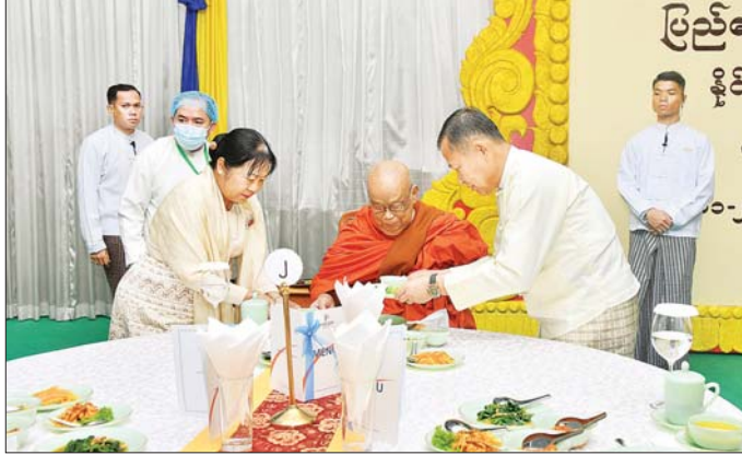
နိုင်ငံတော်စီမံအုပ်ချုပ်ရေးကောင်စီ ဒုတိယဥက္ကဋ္ဌ ဒုတိယဝန်ကြီးချုပ် ဒုတိယဗိုလ်ချုပ်မှူးကြီး စိုးဝင်းနှင့် ဇနီး ဒေါ်သန်းသန်းနွယ် ဆရာတော်၊ သံဃာတော်များအား နေ့ဆွမ်းဆက်ကပ်လှူဒါန်းစဉ်။

စာမျက်နှာ ၄ မှ ဆရာတော်ကြီး အမျိုးပြုသည် ပရိသတ်များက နေ့ဆွမ်း ပြည်ထောင်စုသမ္မတမြန်မာနိုင်ငံ တော်၊ နိုင်ငံတော်စီမံအုပ်ချုပ်ရေး ကောင်စီ ၂၀၂၄ ခုနှစ် ကထိန် သင်္ကန်း ဆက်ကပ်လှူဒါန်းပွဲ အခမ်းအနားတွင် ပဒေသာပင် ၄၉ တန်ဖိုးငွေကျပ် ၁၃၃၉၂၄၁၄၀ ပင်၊ တန်ဖိုးငွေကျပ် ၅၇၂၃၃၄၄၀ ဖြစ်ကြောင်း သတင်းရရှိ နှင့် လှူဒါန်းငွေကျပ် ၈၀၆၉၀၈၀၀ သည်။ သတင်းစဉ်