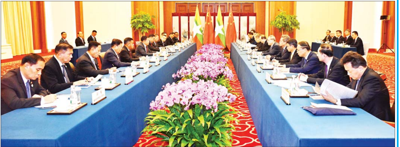
နိုင်ငံတော်စီမံအုပ်ချုပ်ရေးကောင်စီဥက္ကဋ္ဌ နိုင်ငံတော်ဝန်ကြီးချုပ် ဗိုလ်ချုပ်မှူးကြီး မင်းအောင်လှိုင်နှင့် တရုတ်ပြည်သူ့သမ္မတနိုင်ငံဝန်ကြီးချုပ် H.E. Mr. Li Qiang တို့ တွေ့ဆုံဆွေးနွေးစဉ်။(၆-၁၁-၂၀၂၄ ရက်)