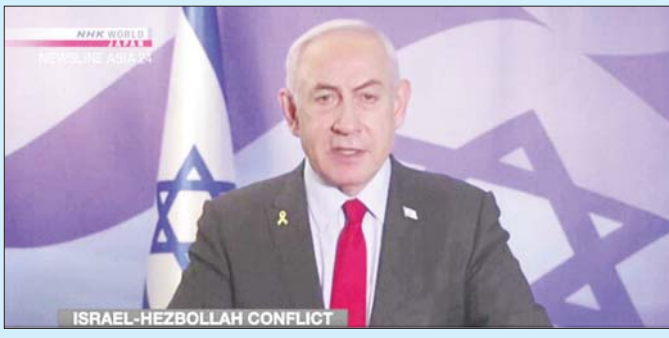
လုပ်ဆောင်လျက်ရှိသည်။ နိုဝင်ဘာ ၁၀ ရက်က လက်ဘနွန်နိုင်ငံအလယ် ပိုင်း၌ အစ္စရေးလေကြောင်းတိုက်ခိုက်မှုတစ်ခု ပြုလုပ်ခဲ့ရာ ကလေး ခုနစ်ဦး အပါအဝင် လူ ၂၃ ဦး သေဆုံးခဲ့သည်။ ၂၀၂၃ ခုနှစ်အောက်တိုဘာနှောင်း ပိုင်းမှစကာ လက်ဘနွန်နိုင်ငံအတွင်း အစ္စရေးတို့၏ တိုက်ခိုက်မှုကြောင့် လူပေါင်း ၃၀၀၀ ကျော် သေဆုံး ခဲ့သည်။ အင်န်အိတ်ချ်ကေ

ပေါက်ကွဲမှုဖြစ်ပွားခဲ့သောကြောင့် လူ ၄၀ ခန့်သေဆုံး ခဲ့ပြီး ၃၄၀၀ ကျော်ဒဏ်ရာရရှိခဲ့သည်။ ယင်းဖြစ်စဉ် တွင် ဟစ်ဇ်ဘိုလာအဖွဲ့ဝင်အချို့ သေဆုံးခဲ့ကြောင်း ဟစ်ဇ်ဘိုလာတို့က ပြောသည်။ အကြီးတန်းလုံခြုံရေးအရာရှိများနှင့် နိုင်ငံရေး သမားများဆန့်ကျင်နေသည့်တိုင် ပေဂျာစစ်ဆင်ရေး နှင့် ဟစ်ဇ်ဘိုလာခေါင်းဆောင် ဟက်ဆန်နာစရယ် လက်ကိုင်သတ်ဖြတ်ခြင်းဖြစ်ကြောင်း နေတန်ယာဟု က ပြောကြားခဲ့သည်။ မစ္စတာ နေတန်ယာဟုသည် ပေဂျာစစ်ဆင်ရေး ကို ခွင့်ပြုခဲ့ကြောင်း ပြင်သစ်သတင်းမီဒီယာတစ်ခု နှင့် အခြားမီဒီယာများက ဖော်ပြခဲ့သည်။ အစ္စရေးတပ်ဖွဲ့များသည် လက်ဘနွန်၌ ဟစ်ဇ်ဘိုလာတို့ကို လေကြောင်းတိုက်ခိုက်မှုများ ပြုလုပ်ခဲ့သည်။ ထို့ပြင် လက်ဘနွန်တောင်ပိုင်း တွင်လည်း မြေပြင်ထိုးစစ်များကို ဆက်လက်