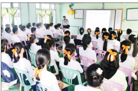
ရာသီဥတုပြောင်းလဲခြင်းကြောင့် သဘာဝ ဘေးအန္တရာယ်များ ဖြစ်ပေါ်လာခြင်းအကြောင်း၊ ရာသီ ဥတုပြောင်းလဲခြင်းအား လျော့ချရ မည့် နည်းလမ်းများနှင့် သစ်ပင် စိုက်ပျိုး ပြုစု ထိန်းသိမ်းခြင်းဖြင့်

ကျိုင်းတုံ နိုဝင်ဘာ ၁၁ ရှမ်းပြည်နယ်(အရှေ့ပိုင်း)ကျိုင်းတုံ- မိုင်းဆတ် သစ်တောဦးစီးဌာနမှ ကြီးမှူးကျင်းပသည့် ရာသီဥတု ပြောင်းလဲမှုလျော့ချရေးနှင့် မီးခိုး မြှူငွေ့လျော့ချရေး အသိပညာပေး ဟောပြောပွဲကို နိုဝင်ဘာ ၁၁ ရက် က ကျိုင်းတုံမြို့ အမှတ်(၄) အခြေခံပညာအထက်တန်းကျောင်း ၌ ကျင်းပသည်။