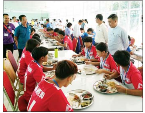
ရေသန့်ရှင်းမှု သပ်ရပ်မှုရှိအောင် ကြောင်း မှာကြားခဲ့ကြောင်း သိရ ပြင်ဆင်ဆောင်ရွက်ကြရန် လိုအပ် သည်။ သတင်းစဉ်

အားကစားသမားများ၏ တည်းခို နေထိုင်ရေးသမားက အားကစား သမားများ စားသုံးမည့် အစား အစာများကို ဧည့်ခံကျွေးမွေး ရာတွင် အာဟာရပြည့်ဝပြီး ကျန်းမာရေးနှင့် ညီညွတ်မှုရှိသော အစားအစာများဖြစ်စေရန် စနစ် တကျ ချက်ပြုတ်ကျွေးမွေးနိုင်ရေး အတွက် ဂရုပြုဆောင်ရွက်ကြရ မည်ဖြစ်ကြောင်း၊ စားရိတ်သာ များတွင် ချက်ပြုတ်ဧည့်ခံကျွေးမွေး ရန် လိုအပ်သော အသုံးအဆောင်