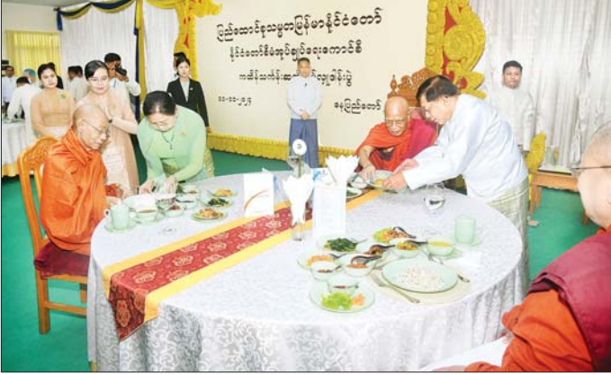
နိုင်ငံတော်စီမံအုပ်ချုပ်ရေးကောင်စီဥက္ကဋ္ဌ နိုင်ငံတော်ဝန်ကြီးချုပ် ဗိုလ်ချုပ်မှူးကြီး မင်းအောင်လှိုင်နှင့် ဇနီး ဒေါ်ကြူကြူလှ ဆရာတော်၊ သံဃာတော်များအား နေ့ဆွမ်းဆက်ကပ်လှူဒါန်းစဉ်။