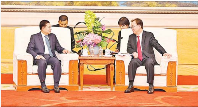
နိုင်ငံတော်စီမံအုပ်ချုပ်ရေးကောင်စီဥက္ကဋ္ဌ နိုင်ငံတော်ဝန်ကြီးချုပ် ဗိုလ်ချုပ်မှူးကြီး မင်းအောင်လှိုင် တရုတ်ကွန်မြူနစ်ပါတီဗဟိုကော်မတီပေါ်လစီဗဟိုအဖွဲ့ဝင်၊ ချီချင်မြို့နယ်ပါတီကော်မတီအတွင်းရေးမှူး Mr. Yuan Jiajun နှင့် တွေ့ဆုံဆွေးနွေးစဉ်။