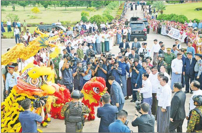
နိုင်ငံတော်စီမံအုပ်ချုပ်ရေးကောင်စီဥက္ကဋ္ဌ နိုင်ငံတော်ဝန်ကြီးချုပ် ဗိုလ်ချုပ်မှူးကြီး မင်းအောင်လှိုင် ဦးဆောင်သော အဆင့်မြင့်ကိုယ်စားလှယ်အဖွဲ့အား နေပြည်တော် တပ်မတော်လေဆိပ်၌ တရုတ်ရိုးရာ နဂါးနှင့်ခြင်္သေ့အကအဖွဲ့တို့ဖြင့် ဂုဏ်ပြုကြိုဆိုနေစဉ်။