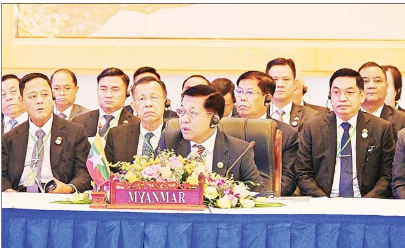
နိုင်ငံတော်စီမံအုပ်ချုပ်ရေးကောင်စီဥက္ကဋ္ဌ နိုင်ငံတော်ဝန်ကြီးချုပ် ဗိုလ်ချုပ်မှူးကြီး မင်းအောင်လှိုင် (၁၀) ကြိမ်မြောက် ဧရာဝတီ- ကျောက်ဖရား- မဲခေါင် စီးပွားရေးပူးပေါင်းဆောင်ရွက်မှုမဟာဗျူဟာ(အက်မက်စ်) ထိပ်သီးအစည်းအဝေးသို့ တက်ရောက်ဆွေးနွေးစဉ်။