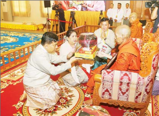
နိုင်ငံတော်စီမံအုပ်ချုပ်ရေး ကောင်စီအဖွဲ့ဝင် ဗိုလ်ချုပ်ကြီး မောင်မောင်အေးနှင့်ဇနီး ဆရာတော်အား ကထိန်သင်္ကန်းနှင့် လှူဖွယ်ပစ္စည်းများ ဆက်ကပ်လှူဒါန်းစဉ်။