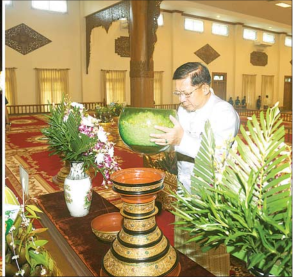
နိုင်ငံတော်စီမံအုပ်ချုပ်ရေးကောင်စီဥက္ကဋ္ဌ နိုင်ငံတော်ဝန်ကြီးချုပ် ဗိုလ်ချုပ်မှူးကြီး မင်းအောင်လှိုင် သာသနာ့မဟာဗိမာန်တော်အတွင်းရှိ ဗုဒ္ဓရုပ်ပွားတော်မြတ်အား မြသပိတ် ဆွမ်းတော်၊ ပန်း၊ ရေချမ်း၊ ဆီမီးနှင့်သစ်သီးတို့ကို ဆက်ကပ်လှူဒါန်းစဉ်။

၎င်းတို့မှ ဂေါပကအဖွဲ့ ဩဝါဒါစရိယ ဆရာတော်ကြီးများ အများပြုသည့် ပင့်ဖိတ်ထားသော ဆရာတော်ကြီး ၂၇ ပါး ကြွရောက်ချီးမြှင့်တော်မူကြပြီး နိုင်ငံတော်စီမံအုပ်ချုပ်ရေးကောင်စီဥက္ကဋ္ဌ နိုင်ငံတော်ဝန်ကြီးချုပ် ဗိုလ်ချုပ်မှူးကြီး မင်းအောင်လှိုင်နှင့် ဇနီး ဒေါ်ကြူကြူလှတို့နှင့်အတူ ကောင်စီဒုတိယဥက္ကဋ္ဌ ဒုတိယဝန်ကြီးချုပ် ဒုတိယဗိုလ်ချုပ်မှူးကြီး စိုးဝင်းနှင့် ဇနီးဒေါ်သန်းသန်းနွယ်၊ ကောင်စီအတွင်းရေးမှူးနှင့် ဇနီး တွဲဖက်အတွင်းရေးမှူးနှင့် ဇနီး ကောင်စီဝင်များနှင့် ဇနီးများ၊ ပြည်ထောင်စုအဆင့် ပုဂ္ဂိုလ်များ၊ ပြည်ထောင်စုဝန်ကြီးများနှင့်ဇနီးများ၊ နေပြည်တော်ကောင်စီဥက္ကဋ္ဌ ကာကွယ်ရေး ဦးစီးချုပ်ရုံးမှ အဆင့်မြင့်တပ်မတော်အရာရှိကြီးများနှင့်ဇနီးများ၊ နေပြည်တော် တိုင်းစစ်ဌာနချုပ် တိုင်းမှူးနှင့် တာဝန်ရှိသူများ တက်ရောက်ကြသည်။ မြသပိတ်ဆွမ်းတော်၊ ပန်း၊ ရေချမ်း၊ ဆီမီးနှင့် သစ်သီးတို့ကို ဆက်ကပ်လှူဒါန်း ဦးစွာ နိုင်ငံတော်စီမံအုပ်ချုပ်ရေးကောင်စီဥက္ကဋ္ဌ နိုင်ငံတော်ဝန်ကြီးချုပ်သည် သာသနာ့မဟာဗိမာန်တော်အတွင်းရှိ ဗုဒ္ဓရုပ်ပွားတော်မြတ်အား ဖူးမြော်ကြည့်လိုက်၍ မြသပိတ်ဆွမ်းတော်၊ ပန်း၊ ရေချမ်း၊ ဆီမီးနှင့် သစ်သီးတို့ကို ဆက်ကပ်လှူဒါန်းသည်။ ထို့နောက် နိုင်ငံတော်စီမံအုပ်ချုပ်ရေးကောင်စီ ဥက္ကဋ္ဌ နိုင်ငံတော်ဝန်ကြီးချုပ်နှင့် အခမ်းအနား တက်ရောက်လာသည့် ဧည့်ပရိသတ်များသည် ကထိန်ခံ နေပြည်တော် ဥက္ကရသီရိမြို့နယ် ဝဇီရာနန္ဒ သုဗောဓာရုံကျောင်း