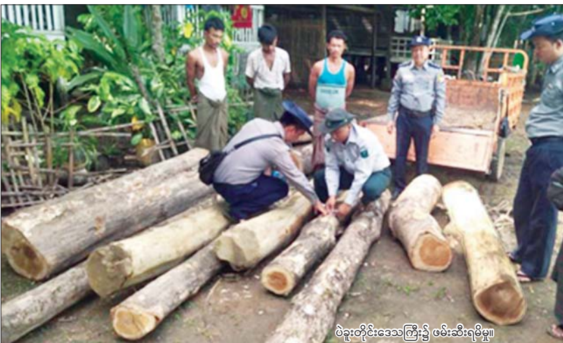
ပဲခူးတိုင်းဒေသကြီး၌ ဖမ်းဆီးရမိမှု။