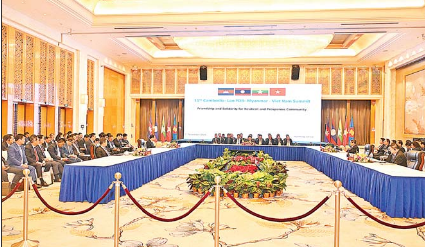
နိုင်ငံတော်စီမံအုပ်ချုပ်ရေးကောင်စီဥက္ကဋ္ဌ နိုင်ငံတော်ဝန်ကြီးချုပ် ဗိုလ်ချုပ်မှူးကြီး မင်းအောင်လှိုင် (၁၁) ကြိမ်မြောက် ကမ္ဘောဒီးယား-လာအို - မြန်မာ - ဗီယက်နမ် ပူးပေါင်းဆောင်ရွက်မှု ထိပ်သီးအစည်းအဝေးသို့ တက်ရောက်အမှာစကားပြောကြားစဉ်။

2024年11月6-7日 中国·昆明 6-7 November 2024 Kunming