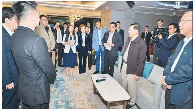
နိုင်ငံတော်စီမံအုပ်ချုပ်ရေးကောင်စီဥက္ကဋ္ဌ နိုင်ငံတော်ဝန်ကြီးချုပ် ဗိုလ်ချုပ်မှူးကြီး မင်းအောင်လှိုင် ချီချင်မြို့မှ စီးပွားရေးလုပ်ငန်းရှင်များနှင့် တွေ့ဆုံဆွေးနွေးစဉ်။