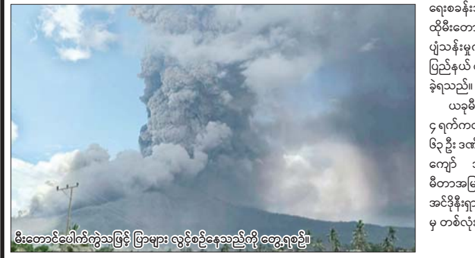
မီးတောင်ပေါက်ကွဲသဖြင့် ပြာများ လွင့်စဉ်နေသည့်ကို တွေ့ရစဉ်။

ကျော် ဘေးလွတ်ရာ ရွှေ့ပြောင်းခဲ့ရပြီး နေကြ ရကြောင်းနှင့် မီးတောင်ဝမှ ၁၂ ကီလိုမီတာ အကွာအဝေးရှိ ရုပ်ရွာအားလုံးကို ဘေးလွတ် ရာသို့ ရွှေ့ပြောင်းရန် အကြံပြုထားကြောင်း ပြည်နယ် သဘာဝဘေးအန္တရာယ် စီမံခန့်ခွဲ ရေးနှင့် လျော့ပါးရေးအေဂျင်စီမှ အကြီးတန်း အရာရှိ ရစ်ချက်ဖိုက်က ဆိုသည်။ အေဂျင်စီနှင့် ဒေသဆိုင်ရာ အာဏာပိုင် များသည် ရွှေ့ပြောင်းနေထိုင်သူများကို မရှိမဖြစ်လိုအပ်သော ထောက်ပံ့ရေးပစ္စည်း များပေးဆောင်နိုင်ရန် အနည်းဆုံးကယ်ဆယ် ရေးစခန်းသုံးခု ထူထောင်ထားသည်။ ထိုမီးတောင်ပေါက်ကွဲမှုသည် လေကြောင်း ပျံသန်းမှုကိုလည်း ထိခိုက်စေခဲ့သဖြင့် ပြည်နယ် လေဆိပ်သုံးခုကို ယာယီပိတ်ထား ခဲ့ရသည်။ ယခုမီးတောင်ပေါက်ကွဲမှုသည် နိုဝင်ဘာ ၄ ရက်ကလည်း ဖြစ်ပွားခဲ့ရာ ၁၀ ဦးသေပြီး ၆၃ ဦး ဒဏ်ရာရရှိမှုနှင့်အတူ လူပေါင်း ၄၀၀၀ ကျော် အိုးမဲ့အိမ်မဲ့ဖြစ်ခဲ့ရသည်။ ၁၅၈၄ မီတာအမြင့်ရှိ လီပိုထိုဘီ မီးတောင်သည် အင်ဒိုနီးရှားနိုင်ငံရှိ မီးတောင် ၁၂၇ လုံးအနက် မှ တစ်လုံးဖြစ်သည်။