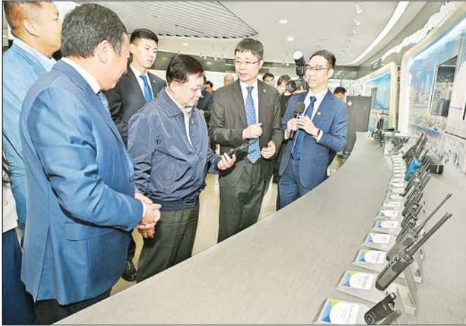
နိုင်ငံတော်စီမံအုပ်ချုပ်ရေးကောင်စီဥက္ကဋ္ဌ နိုင်ငံတော်ဝန်ကြီးချုပ် ဗိုလ်ချုပ်မှူးကြီး မင်းအောင်လှိုင် ရုန်းကျန်မြို့ရှိ Hytera Communications Corporation Limited တွင် ကြည့်ရှုလေ့လာစဉ်။