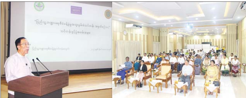
ဒုတိယဝန်ကြီးချုပ်နှင့် ပြည်ထောင်စုဝန်ကြီး ဦးဝင်းရှိန် ပြည်သူ့ဘဏ္ဍာရေး စီမံခန့်ခွဲမှု အထူးမွမ်းမံသင်တန်း အမှတ်စဉ်(၈) သင်တန်းဖွင့်ပွဲအခမ်းအနားတွင် အမှာစကားပြောကြားစဉ်။

နေပြည်တော် နိုဝင်ဘာ ၁၁ ပြည်သူ့ဘဏ္ဍာရေး စီမံခန့်ခွဲမှု အထူး မွမ်းမံသင်တန်း အမှတ်စဉ်(၈) သင်တန်း ဖွင့်ပွဲအခမ်းအနားကို ယနေ့မွန်းလွဲပိုင်း တွင် နေပြည်တော်ရှိ စီမံကိန်းနှင့် ဘဏ္ဍာ ရေးဝန်ကြီးဌာန ရသုံးမုန်းမြေငွေစာရင်း ဦးစီးဌာန ပြည်သူ့ဘဏ္ဍာရေးစီမံခန့်ခွဲမှု သင်တန်းကျောင်း၌ ကျင်းပသည်။