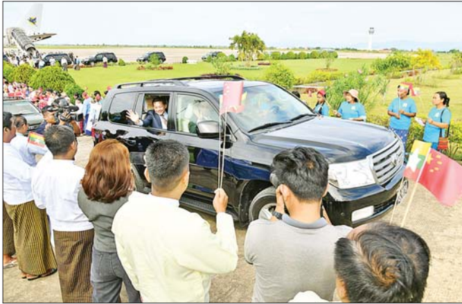
နိုင်ငံတော်စီမံအုပ်ချုပ်ရေးကောင်စီဥက္ကဋ္ဌ နိုင်ငံတော်ဝန်ကြီးချုပ် ဗိုလ်ချုပ်မှူးကြီး မင်းအောင်လှိုင် ဦးဆောင်သော အဆင့်မြင့်ကိုယ်စားလှယ်အဖွဲ့အား နေပြည်တော် တပ်မတော်လေဆိပ်၌ တိုင်းရင်းသား ပြည်သူများက လှိုက်လှဲနွေးထွေးစွာ သောင်းသောင်းဖြူကြိုဆိုနေစဉ်။