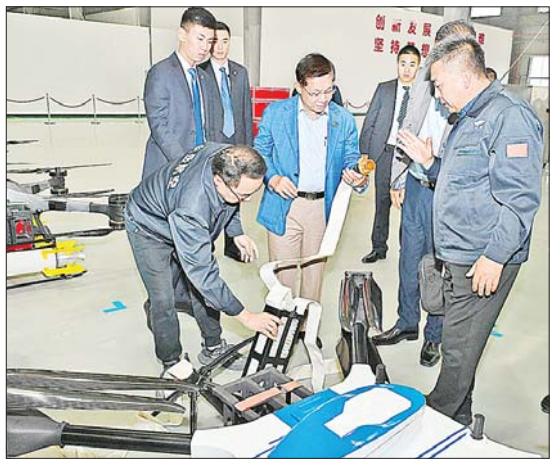
နိုင်ငံတော်စီမံအုပ်ချုပ်ရေးကောင်စီဥက္ကဋ္ဌ နိုင်ငံတော်ဝန်ကြီးချုပ် ဗိုလ်ချုပ်မှူးကြီး မင်းအောင်လှိုင် Zhongyue Aviation UAV Firefighting-Drone Co.,Ltd. မှ ထုတ်လုပ်ထားသော လူမှုကယ်ဆယ်ရေးလုပ်ငန်းများတွင် အသုံးပြုသည့် အဆင့်မြင့်ဒရုန်းများ ခင်းကျင်းပြသထားရှိမှုကို ကြည့်ရှုလေ့လာစဉ်။