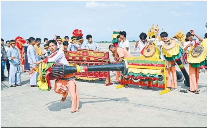
နိုင်ငံတော်စီမံအုပ်ချုပ်ရေးကောင်စီဥက္ကဋ္ဌ နိုင်ငံတော်ဝန်ကြီးချုပ် ဗိုလ်ချုပ်မှူးကြီး မင်းအောင်လှိုင် ဦးဆောင်သော အဆင့်မြင့်ကိုယ်စားလှယ်အဖွဲ့၏ ကြိုးပမ်းဆောင်ရွက်မှုများအပေါ် တိုင်းရင်းသား ပြည်သူများက တိုင်းရင်းသားရိုးရာအကအလှများဖြင့် ဂုဏ်ပြုကြိုဆိုနေစဉ်။