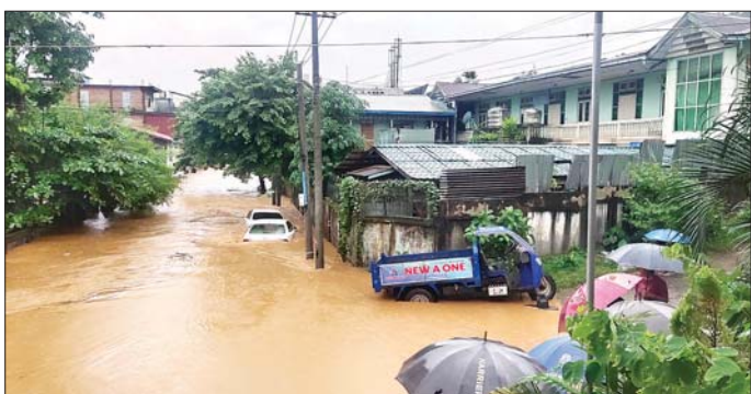
မြို့နယ် (ပြန်/ဆက်)

အထက(ရှုရှုဇွပ်) ကျောင်းဝင်းအတွင်းသို့လည်း ရေဝေပေခန့် ဝင်ရောက်လာသဖြင့် ယာယီပိတ်ထား လျက်ရှိကြောင်း မြို့နယ်ပညာရေးမှူးထံမှ သိရ သည်။ မြို့မရပ်ကွက်အနိမ့်ပိုင်းနေရာများရှိ အိမ်ခြေ ၇၀ ခန့်နှင့် အခြေခံပညာရပ်ကွက်အနိမ့်ပိုင်းနေရာများရှိ အိမ်ခြေ ၄၁ အိမ်ခန့်တွင် ဥရုချောင်းရေဝင်ရောက် လျက်ရှိပြီး ရပ်ကွက်(ငှက်ပျော)ရှိ အိမ်ခြေစုစုပေါင်း ၃၈၆ အိမ်တို့တွင် ဥရုချောင်းရေဝင်ရောက်လျက်ရှိရာ လူဦးရေစုစုပေါင်း ၂၅၅၈ ဦး ရေဘေးသင့်ပြည်သူဖြစ် အဆိုပါ ရေဘေးသင့်ပြည်သူများအား ဖားကန့်မြို့ မြို့မရပ်ကွက်ရှိ မဏိဇေယျ၊ ပရိယတ္တိစာသင်တိုက် တွင် ခေတ္တရွှေ့ပြောင်းထားရှိကြောင်း သိရသည်။ ထို့အတူ ဥရုချောင်းရေ မြင့်တက်မှုကြောင့် လုံးခင်းကျေးရွာအုပ်စု လုံးခင်းရပ်ကွက်များနှင့် နန့်စန်း (၂) ကျေးရွာများသို့ ချောင်းရေဝင်ရောက်သဖြင့် မြေနိမ့်ပိုင်းနေ ပြည်သူများအား လုံးခင်းရပ်ကွက် အတွင်းရှိ လူမှုကယ်ဆယ်ရေးအသင်းအဖွဲ့များက ၎င်းတို့နှင့် နီးစပ်ရာမိဘ/ဆွေမျိုးများ၏ နေအိမ်များ၊ ဘုန်းတော်ကြီးကျောင်းများနှင့် ဘာသာရေးကျောင်း များသို့ ရွှေ့ပြောင်းထားကြောင်း သိရသည်။