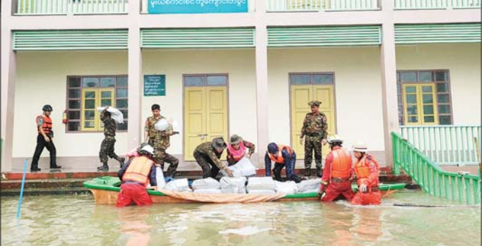
ပြည်နယ် (ပြန်/ဆက်)

ရပ်ကွက်အတွင်း သယ်စာတရားရောက်ရှိပြီး ဦးဆောင် ၍ အစုအဖွဲ့ဖြင့် ရှာဖွေကယ်ဆယ်ရေးနှင့် ကူညီ ထောက်ပံ့ကျေးမွေးရေးဆိုင်ရာများကိုလည်းကောင်း၊ မြို့သစ်ရပ်ကွက်အတွင်း ပြည်ထောင်စုလမ်းနှင့်မဟာ ဗန္ဓုလလမ်းဆုံနေရာမှ ခရိုင်စီမံအုပ်ချုပ်ရေးအဖွဲ့ ဥက္ကဋ္ဌ ဦးဆောင်၍ ရဲတပ်ဖွဲ့ဝင်များ၊ မီးသတ် တပ်ဖွဲ့ဝင်များ စုဖွဲ့၍ ကယ်ဆယ်ရေးလုပ်ငန်းများ ဆောင်ရွက်နေမှု၊ နေအိမ်များသို့ ပြန်လည်ရွှေ့ပြောင်း နေထိုင်မည့်အိမ်ထောင်စုများအား ကူညီဆောင်ရွက် ပေးနေမှုများကိုလည်းကောင်း လှည့်လည်ကြည့်ရှု အားပေးခဲ့ကြပြီး ဌာနဆိုင်ရာများနှင့် လူမှုကူညီရေး အသင်းအဖွဲ့များက ရေဘေးရှောင်ခိုင်းရေးစခန်းများ အတွက် နေ့လယ်စာထမင်းဘူးများကို စက်လှေများ ဖြင့် လိုက်လံထောက်ပံ့ပေးအပ်ကြသည်။ အဆိုပါမြစ်ရေမြင့်တက်လာမှုကြောင့် မြစ်ကြီးနား မြို့နယ်နှင့် ပိုင်းမော်မြို့နယ်များတွင် ရေဝင်ရောက်ခဲ့ ပြီး ပိုင်းမော်မြို့နယ်အတွင်း ပိုင်းမော်မြို့ပေါ်ရပ်ကွက် များအပါအဝင် စန်းကား၊ နောင်တာလော၊ မုတ်လှ၊ မိုင်းနား၊ မခန္တီး၊ နောင်ချိန်၊ ကျေးရွာများတွင်လည်း ရေဝင်ရောက်ခဲ့မှုကြောင့် မြို့နယ်အဆင့်ဌာနဆိုင်ရာ များ၊ မီးသတ်တပ်ဖွဲ့ဝင်များက ရှာဖွေကယ်ဆယ်၍ နီးစပ်ရာ ဘုန်းတော်ကြီးကျောင်းများ၊ ခရစ်ယာန် ဘာသာရေးကျောင်းများနှင့် အခြေခံပညာကျောင်း များတွင် ရေဘေးရှောင်စခန်းပေါင်း ၁၂ ခု ဖွင့်လှစ်၍ ကူညီကယ်ဆယ်ဆောင်ရွက်လျက်ရှိကြောင်း သိရ သည်။