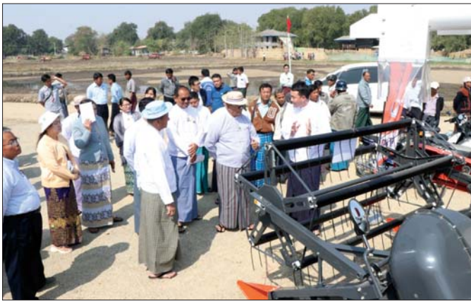
တပ်ကုန်းမြို့နယ်ရှိ အင်ဘက်ကုန်းစိုက်ပျိုးရေးနှင့် အထွေထွေသမဝါယမအသင်း၏ သမဝါယမ လယ်ယာဝန်ဆောင်မှုများကို ပြည်ထောင်စုဝန်ကြီး ဦးလှစိုး ယခုနှစ်ဆန်းပိုင်းက ကြည့်ရှုအားပေးစဉ်။

အရင်းရှင်စနစ်ဆိုတဲ့ တွန်းလှန်မှု အကောင်းဆုံးစနစ်မှာ သမဝါယမစနစ်ပင်ဖြစ် ဒီအရင်းရှင်စနစ်ဆိုတဲ့ တွန်းလှန်မှုကို ဖျက်ဖျက်ပစ် အကောင်းဆုံးစနစ်မှာ သမဝါယမစနစ်ပင်