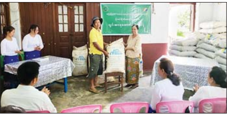
မိုးနဲမြို့နယ်၌ မိုးစပါးစိုက်ပျိုးမည့်သမဝါယမအသင်းများသို့ သွင်းအားစုများထောက်ပံ့

မိုးနဲ ဇူလိုင် ၂ ရှမ်းပြည်နယ်(တောင်ပိုင်း) မိုးနဲမြို့နယ်၌ (၁၀)နှစ်မြောက် အပြည်ပြည်ဆိုင်ရာသမဝါယမအသင်း အား ကြိုဆိုဂုဏ်ပြုသောအားဖြင့် အသင်းအချင်းချင်းပံ့ပိုးငွေနှင့် မြို့နယ်အတွင်းရှိ မိုးစပါးစိုက်ပျိုးမည့် သမဝါယမအသင်းများသို့ သွင်းအားစုမြေဧကထောက်ပံ့ပေးအပ်ခြင်း အခမ်းအနားကို ဇူလိုင် ၁ ရက်က မိုးနဲမြို့နယ်သမဝါယမဦးစီးဌာနရုံးခန်းမ၌ ကျင်းပပါသည်။