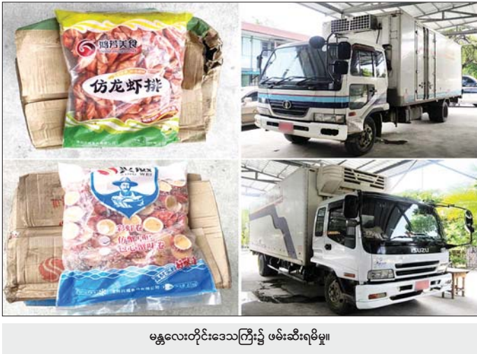
မန္တလေးတိုင်းဒေသကြီး၌ ဖမ်းဆီးရမိမှု။

နေပြည်တော် ဇူလိုင် ၂ တရားမဝင်ကုန်သွယ်မှုတိုက်ဖျက် ရေး ဦးဆောင်ကော်မတီ၏ ကြီးကြပ်ကွပ်ကဲမှုဖြင့် တရားမဝင် ကုန်သွယ်မှုများကို ဥပဒေနှင့်အညီ ထိရောက်စွာ တားဆီးအရေးယူ နိုင်ရေး ဆောင်ရွက်လျက်ရှိရာ ဇွန် ၂၈ ရက်တွင် အကောက်ခွန် ဦးစီးဌာန၏ စီမံခန့်ခွဲမှုဖြင့် တာဝန် ကျပူးပေါင်းအဖွဲ့များက စစ်ဆေး မှုများ ဆောင်ရွက်ခဲ့ရာ ရန်ကုန် အပြည်ပြည်ဆိုင်ရာ လေဆိပ်၌ ခရီးသည်တစ်ဦး၏ ဝန်စည်တစ်ခု အတွင်းမှ တရားဝင်စာရွက် စာတမ်းအထောက်အထား တင်ပြ နိုင်ခြင်းမရှိသည့် Cosmetic မျိုးစုံ ၉၉ ဘူး၊ ခန့်မှန်းတန်ဖိုး စာမျက်နှာ ၁၅ ကော်လံ ၁