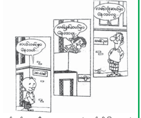
မှတ်ချက်။ ။ ဦး ဟူသော စကားလုံးသည် မျိုးပြစကားလုံး ဖြစ်သော်လည်း အဦး ဟု သုံးရိုးမရှိ။

သာမက။ ။ လူနှစ်ဦး လူဆယ်ဦး လူနှစ်ဆယ် လူသုံးဆယ် ဟု အသုံးရှိသည်။