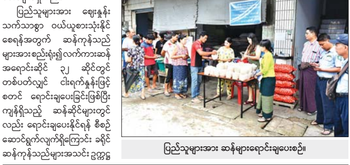
ပြည်သူများအား ဆန်များရောင်းချပေးစဉ်။

အဆိုပါ ဆွေးနွေးဟောပြောချက်များကို အင်းစိန်ခရိုင် ပြန်/ဆက်ဦးစီးဌာန၏ အဖွဲ့ဝင် မီဒီယာတွင်လည်း အများပြည်သူ ကြည့်ရှုနားထောင်နိုင်ရန် ထုတ်လွှင့်ပေးထားကြောင်း သိရသည်။ ခရိုင်(ပြန်/ဆက်)