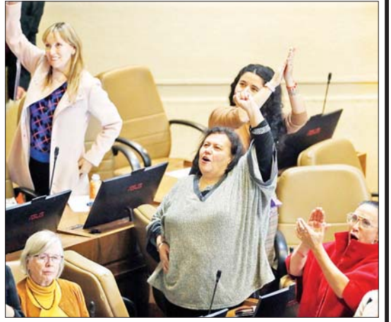
ချိုလီတွင် ဝင်ငွေကုန်ဆင်းဆုံးရန် ဖြည့်ဆည်းရန် ဝင်ငွေလောက်ငမူ မှုနှုန်းသည် ၆ ဒသမ ၅ ရာခိုင်နှုန်းဖြစ် မရှိဘဲ ဆင်းရဲစွာဖြင့် နေထိုင်ကြရ သည့်အတွက် လူပေါင်း ၁၂၉၂၅၂၅ ဦး သည် အခြေခံလိုအပ်ချက်များကို ဆင်ယင်

၃၅၀၀၀ ပီဆိုဖြစ်သည်။ နှစ်နှစ်ကျော် ပြီးစေချိန် ယခု ၂၀၂၄ ခုနှစ်တွင် နိုင်ငံ၏ အနိမ့်ဆုံးလုပ်ခလစာကို နောက်ထပ် ၁၅၀၀၀ ပီဆိုအထိ တိုးမြှင့်ပေးနိုင်ခဲ့ ကြောင်း ၎င်းက ဆက်ပြောသည်။ သက်ဆိုင်ရာ တာဝန်ရှိသူများ၊ အလုပ်သမားဌာနနှင့် စီးပွားရေးအဖွဲ့ အစည်းများကြား သဘောတူညီချက်ရရှိ ပြီးနောက် အနိမ့်ဆုံးလုပ်ခလစာတိုးမြှင့် ရန် အဆိုပြုချက်ကို ၂၀၂၃ ခုနှစ် ဧပြီလ တွင် လွှတ်တော်သို့ ပေးပို့ခဲ့သည်။