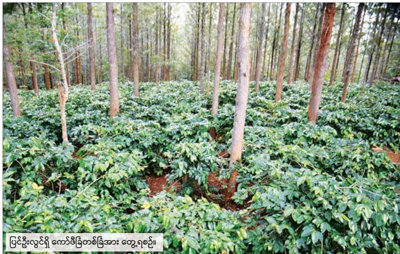
ပြင်ဦးလွင်ရှိ ကော်ဖီခြံတစ်ခြံအား တွေ့ရစဉ်။