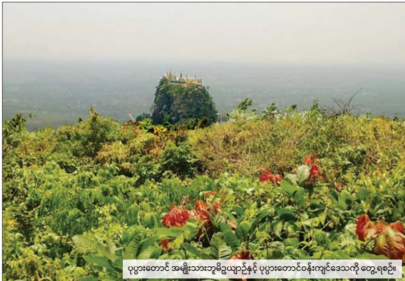
ပုပ္ပားတောင် အမျိုးသားဘူမိဥယျာဉ်နှင့် ပုပ္ပားတောင်ဝန်းကျင်ဒေသကို တွေ့ရစဉ်။