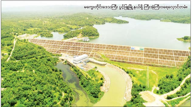
မကွေးတိုင်းဒေသကြီး ပွင့်ဖြူမြို့နယ်ရှိ ကြီးအုံကြီးဝရေလှောင်တံခါး။

မြန်မာဟာ မြေအရင်းအမြစ်၊ ရေအရင်းအမြစ်ပေါ့တွဲ နိုင်ငံတစ်ခုပါ။ ရှေးက ဘိုးတော် အနော်ရထာမင်းကြီး လက်ထက်ကစလို့ နိုင်ငံတည်ဆောက်ရေး တည်ငြိမ်အေးချမ်းရေးအဖို့ ရာမှာ စိုက်ပျိုးရေး၊ စားနပ်ရိက္ခာဖူလုံရေး အလေးအနက်ထားလုပ်ခဲ့တာပါ။ ငတ်ရင်၊ စားနပ်ရိက္ခာ မလုံလောက်ရင် ပြည်ပျက်မယ်။ ရိုးရိုးလေးပဲ။ ခေတ်အဆက်ဆက် စိုက်ပျိုးရေး၊ ဆည်ဆောက်ရေးကို အလေးထားလုပ်ခဲ့ကြတာကြောင့်လည်း မြန်မာဟာ သမိုင်းမှာ အငတ်ဘေး ဆိုက်ရောက်တဲ့ဖြစ်ရပ်မျိုး ကြီးကြီးမားမား မကြုံဖူးဘူး။