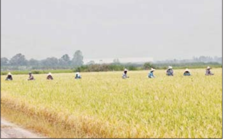
ဆူယန်ဘူရီပြည်နယ်ရှိ လယ်ကွင်းတစ်ခုအတွင်း လုပ်ငန်းခွင်ဝင်နေကြ သူများ။

စိုက်ပျိုးရေး လုံလောက်စွာရရှိမှုနှင့် အဓိကဈေးကွက်များတွင် ထိုင်းဆန်ဝယ်လိုအားမြင့်မားခြင်း၊ စပါးအထွက်နှုန်းတိုးလာခြင်းနှင့် အရည်အသွေးမြင့်ဆန်များ ဝယ်ယူရေး အမှာစာများ အဆက်မပြတ် ရရှိလာခြင်းတို့ကြောင့် ဆန်တင်ပို့မှုနှုန်း မြင့်တက်လာခြင်းဖြစ်ကြောင်း ဝန်ကြီးဌာန၏ ထုတ်ပြန်ချက်တွင် ဖော်ပြသည်။ ဆင်ပွာ