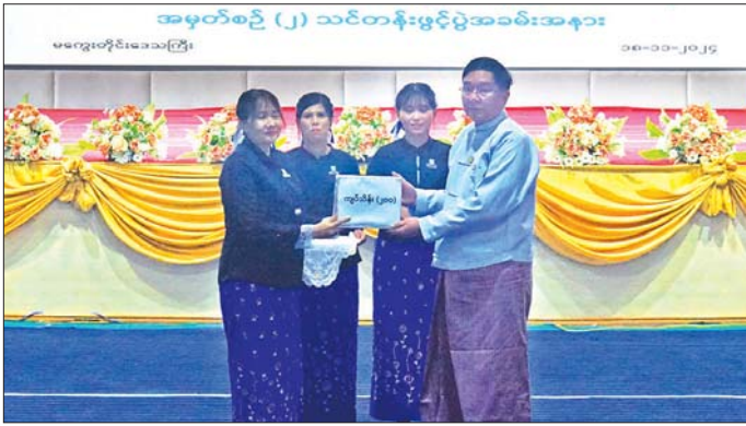
သင်တန်းပေးခြင်းနှင့် ကျောင်းသား ကျောင်းသူများ အား သင်ရိုးညွှန်းတမ်းဖြင့် ပြန်လည်သင်ကြားပေးရ မည်ဖြစ်ကြောင်း၊ သင်တန်းတက်ရောက်ကြသည့် ဆရာ ဆရာမများအနေဖြင့် မိမိကိုယ်တိုင် ဥပဒေ ပညာကို သိရှိနားလည်ပြီး ပြန်လည်သင်ကြားပို့ချ ပေးနိုင်သည်အထိ ကြိုးစားသင်ယူကြစေလိုကြောင်း၊ ယခုကဲ့သို့ ဥပဒေအသိပညာကို ကျောင်းသင်ခန်းစာ တွင် သင်ရိုးညွှန်းတမ်းအဖြစ် ထည့်သွင်းသင်ကြား ပေးခြင်းအားဖြင့် ကျောင်းသား ကျောင်းသူများသည် ဥပဒေ၏ အခြေခံသဘောတရားများကို နားလည်

မကွေး နိုဝင်ဘာ ၁၈ ဥပဒေရေးရာဝန်ကြီးဌာနနှင့် ပညာရေးဝန်ကြီးဌာနတို့ ပေါင်းစပ်ညှိနှိုင်းပြီး မကွေးတိုင်းဒေသကြီးအစိုးရ အဖွဲ့၏ ကြီးကြပ်မှုဖြင့် ဖွင့်လှစ်သည့် Grade 11 နှင့် Grade 12 တွင် သင်ကြားနေသော ကျောင်းသား ကျောင်းသူများအား ဥပဒေဘာသာရပ် သင်ကြား ပေးနိုင်ရန် ဆရာ ဆရာမများအား ဥပဒေ အသိပညာ ပြန့်ပွားရေး ဆရာဖြစ်သင်တန်း အမှတ်စဉ် (၂) ဖွင့်ပွဲ အခမ်းအနားကို ယနေ့နံနက် ၉ နာရီက မကွေးမြို့၊ မြို့တော်ခန်းမ၌ ကျင်းပရာ တိုင်းဒေသကြီး ဝန်ကြီး ချုပ် ဦးတင်လွင်၊ တိုင်းဒေသကြီး ဝန်ကြီးများ၊ တိုင်းဒေသကြီးဥပဒေချုပ်၊ တရားလွှတ်တော် တရားသူကြီးများ၊ ဌာနဆိုင်ရာ တာဝန်ရှိသူများ၊ သင်တန်းပို့ချမည့် ဥပဒေအရာရှိများ၊ သင်တန်းသား သင်တန်းသူ ဆရာ ဆရာမများ တက်ရောက်ခဲ့ ကြသည်။