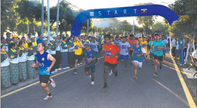
ကောလိပ်များ အားကစားပြိုင်ပွဲ အမျိုးသမီး ထုပ်ဆီး ကြည့်ရှုအားပေးပြီး လိုအပ်သည်များကို တာဝန် တိုးပြိုင်ပွဲ ယှဉ်ပြိုင်နေမှုများနှင့် အမျိုးသား အမျိုး သမီး မိတာ ၈၀၀၊ မိတာ ၄၀၀၊ မိတာ ၂၀၀၊ မိတာ ၁၀၀ ပြေးခုန်ပစ်ပြိုင်ပွဲများ ယှဉ်ပြိုင်နေမှုများအား တိုင်းဒေသကြီး(ပြန်/ဆက်)

ဒေသကြီးဝန်ကြီးချုပ်နှင့် တာဝန်ရှိသူများက ကြည့်ရှုအားပေးကာ အနောက်ဘက်ကန်သာယာ တစ်လျှောက်မှ အရာထမ်း၊ အမှုထမ်းများက တစ်ပျော် တစ်ပါး အားပေးကြပြီး မိနိမာရသွန်အားကစားသမား များ ပန်းဝင်လာမှုတို့အား ဝန်ကြီးချုပ်နှင့်အဖွဲ့က အားပေးကြသည်။ ဆက်လက်ပြီး တိုင်းဒေသကြီး ဝန်ကြီးချုပ်နှင့် တာဝန်ရှိသူများက အဆိုပါမုခ်ဦးတွင် အမျိုးသား အမျိုးသမီးစက်ဘီးပြိုင်ပွဲ ယှဉ်ပြိုင်နေမှုများကို ကြည့်ရှုအားပေးကြပြီး တိုင်းဒေသကြီး၊ ခရိုင်၊ မြို့နယ် အဆင့်ဌာနဆိုင်ရာများမှ အရာထမ်း၊ အမှုထမ်းများက ပန်းဝင်လာသည့် စက်ဘီးပြိုင်ပွဲဝင် အားကစားသမား များအား သောင်းသောင်းဖြဖြ ကြိုဆိုအားပေးခဲ့ကြ သည်။ ထို့နောက် တိုင်းဒေသကြီး ဝန်ကြီးချုပ်နှင့် တာဝန်ရှိသူများသည် မုံရွာမြို့ ပြည်သူ့အားကစား ကွင်းအတွင်း ၂၀၂၄ ခုနှစ် တိုင်းဒေသကြီးဝန်ကြီးချုပ် ဖလား ဝန်ကြီးဌာနများနှင့် တက္ကသိုလ်၊ ဒီဂရီ