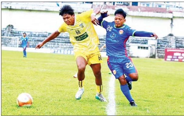
ရာမညယူနိုက်တက်နှင့် ဧရာဝတီရိုန်းဂျားအသင်း ယှဉ်ပြိုင်စဉ်။

ရန်ကုန် နိုဝင်ဘာ ၁၈ ၂၀၂၄ ရာသီ MNL-2 (ပထမတန်း) အမှတ်ပေး ပြိုင်ပွဲ ပွဲစဉ် (၁၂) ဒုတိယနေ့ကို နိုဝင်ဘာ ၁၈ ရက်က ဆက်လက်ကျင်းပရာ ရာမည ယူနိုက်တက်နှင့် ကချင်ယူနိုက်တက်အသင်း အမှတ်ပြည့်ရရှိခဲ့သည်။