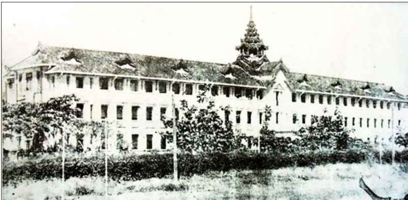
မြန်မာပြည်အရပ်ရပ်တွင် အမျိုးသားကျောင်းများပေါ်ပေါက်ခဲ့ရာ အမျိုးသားကျောင်းများ၏အစ ရန်ကုန်မြို့၊ ဖြူမကျောင်းမှတ်တမ်းဓာတ်ပုံကို တွေ့ရစဉ်။

မြန်မာသက္ကရာဇ် ၁၂၈၂ ခုနှစ် တန်ဆောင်မုန်းလဆုတ် ၁၀ ရက်၊ ခရစ်နှစ် ၁၉၂၀ ပြည့်နှစ် ဒီဇင်ဘာလ ၅ ရက်နေ့။ ထိုနေ့တွင် ရန်ကုန်ကောလိပ်နှင့် ယခုသန်ကောလိပ်ကျောင်းသားတို့သည် အင်္ဂလိပ်ဗျူရိုကရက်တို့က မြန်မာနိုင်ငံနှင့် မြန်မာလူမျိုးတို့အတွက် ပြဋ္ဌာန်းလိုက်သော ရန်ကုန်တက္ကသိုလ်အက်ဥပဒေကို ကန့်ကွက်သည့်အနေဖြင့် သပိတ်မှောက်သောနေ့ဖြစ်သည်။ တစ်နည်းဆိုသော် မြန်မာ့သမိုင်းတွင် ရန်ကုန်တက္ကသိုလ်ကျောင်းသားများက နယ်ချဲ့ဗြိတိသျှအစိုးရကို ပထမဆုံးဆန့်ကျင်တိုက်ပွဲဝင်သော နေ့ဖြစ်သည်။