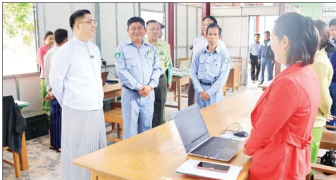
များအလိုက် ဝန်ထမ်းများ တာဝန်ထမ်းဆောင်နေမှု ဖြစ်စေရေး၊ ရုံးပတ်ဝန်းကျင်သန့်ရှင်းသာယာလှပရေးနှင့် ဝန်ထမ်းများ အလုပ်ခွင်မပျက် ဖျက်စီးမှုတို့ကို ကြည့်ရှုစစ်ဆေးပြီး ပြည်နယ်ဝန်ကြီးချုပ်က ပြင်ဆင်ထိန်းသိမ်းခြင်းလုပ်ငန်းများ သတ်မှတ်ကာလအတွင်း စံချိန်စံညွှန်းများနှင့်အညီ ပြီးစီးရေး၊ ယာဉ်ရပ်နားရန် သတ်မှတ်ထားသည့်နေရာများ စနစ်တကျ ပြင်ဆင်ခြင်း (ပြန်/ဆက်)

ဆောင် မျက်နှာကြက်၊ ပြတင်းမှန်နှင့် လေကာမှန်များ ထပ်မံပြုပြင်ပေးရန်နှင့် ဆရာတော် သံဃာတော်များ ပြန်လည်ဝင်ရောက်သီတင်းသုံးချိန်တွင် အဆင်ပြေချောမွေ့စေရေးအတွက် လုပ်ငန်းအား သတ်မှတ်စံချိန်စံညွှန်းပြည့်စီရေး၊ သတ်မှတ်ကာလအတွင်း ပြီးစီးရေး အလေးထားဆောင်ရွက်ရန် မှာကြားပြီး လိုအပ်သည်များကို ပေါင်းစပ်ညှိနှိုင်းပေးသည်။ ထို့နောက် ပြည်နယ်နှင့် မြို့နယ်စည်ပင်သာယာရေးအဖွဲ့ရုံးများ ပြန်လည်ဖွင့်လှစ်လျက်ရှိသည့် အခြေအနေနှင့် ရုံးအဆောက်အအုံများ၊ ဝန်ထမ်းအိမ်ရာများ ပြန်လည်ပြုပြင်ဆောင်ရွက်နေမှုနှင့် ဌာနခွဲ၊ ဌာနစိတ်