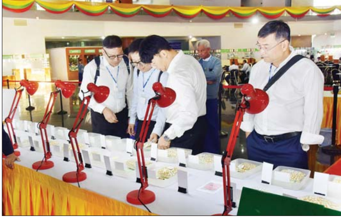
ပြည်တွင်း ပြည်ပရတနာကုန်သည်များ မဏိရတနာကျောက်စိမ်းခန်းမအတွင်း၌ ခင်းကျင်းပြသထား သည့် ပုလဲအတွဲများကို လေ့လာကြည့်ရှုစဉ်။