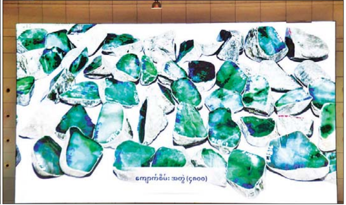
နိုင်ငံတော်စီမံအုပ်ချုပ်ရေးကောင်စီဥက္ကဋ္ဌ နိုင်ငံတော်ဝန်ကြီးချုပ် ဗိုလ်ချုပ်မှူးကြီး မင်းအောင်လှိုင်နှင့် အခမ်းအနားတက်ရောက်လာကြသူများ မြန်မာ့ပုလဲများထုတ်လုပ်မှုနှင့် ရောင်းချနိုင်မှု၊ ကျောက်မျက်ရတနာပစ္စည်းများ ထုတ်လုပ်မှုနှင့် ၂၀၂၄ ခုနှစ် နှစ်လယ်မြန်မာ့ကျောက်မျက်ရတနာပြပွဲအခမ်းအနားကျင်းပနိုင်ရေး ပြင်ဆင်ဆောင်ရွက်ခဲ့မှု စီဒီယိုမှတ်တမ်းကို ကြည့်ရှုကြစဉ်။