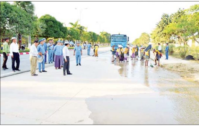
တွေ့ဆုံ၍ တောင်သူများအနေဖြင့် သီးနှံများကို ပန်းတိုင်အထွက်နှုန်း ထွက်ရှိစေရေးနှင့် ဆီထွက် သီးနှံများကို တိုးချဲ့စိုက်ပျိုးစေလိုကြောင်း ပြောကြား ကာ တောင်သူများအား ဆောင်းသီးနှံ မတ်ပဲ၊ ပဲပုပ် နှင့် နေကြာပျိုးစေ့များကို ထောက်ပံ့ပေးအပ်ကြပြီး တောင်သူများ၏ လိုအပ်ချက်များကို ပေါင်းစပ်ညှိနှိုင်း

ဆက်လက်၍ ကွင်းအမှတ်(၁၇၄၃)တွင် ရေကြီး နှစ်မြုပ်မှုကြောင့် မိုးစပါးပျက်စီးကေများကို နေပြည်တော် စက်မှုလယ်ယာဦးစီးဌာနမှ စက်ယန္တရားများဖြင့် ဆောင်းသီးနှံစိုက်ပျိုးနိုင်ရေး အတွက် မြေပြန်လည်ပြုပြင်ဆောင်ရွက်ပေးနေမှု အခြေအနေများကို ကြည့်ရှုအားပေးပြီး အဆိုပါကွင်း အတွင်းရှိ ယာယီရင်းလင်းဆောင်၌ တောင်သူများနှင့်