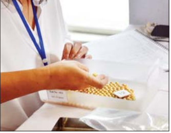
အိတ်ဖွင့်တင်ဒါစနစ်ဖြင့် ရောင်းချမည့် ပုလဲ အတွဲများ။

ပြည်တွင်း ပြည်ပရတနာကုန်သည်များ မဏိရတနာကျောက်စိမ်းခန်းမအပြင်ဘက်၌ ခင်းကျင်းပြသထား သည့် ကျောက်စိမ်းအတွဲများကို စိတ်ကြိုက်လေ့လာကြည့်ရှုစဉ်။