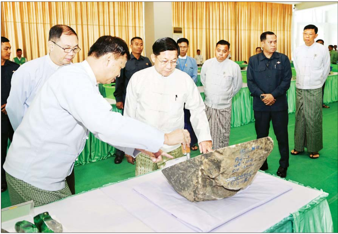
နိုင်ငံတော်စီမံအုပ်ချုပ်ရေးကောင်စီဥက္ကဋ္ဌ နိုင်ငံတော်ဝန်ကြီးချုပ် ဗိုလ်ချုပ်မှူးကြီး မင်းအောင်လှိုင် ၂၀၂၄ ခုနှစ် နှစ်လယ်မြန်မာ့ကျောက်မျက်ရတနာပြပွဲ ရောင်းချရန်ပြသထား သော ကျောက်စိမ်းအတွဲများကို ကြည့်ရှုစစ်ဆေးစဉ်။

ပုလဲအတွဲပေါင်း ၂၈၀ ၊ ကျောက်မျက် အတွဲပေါင်း ၁၆၀ နှင့် ကျောက်စိမ်းအတွဲပေါင်း ၄၈၀၀ ရောင်းချပေးသွားမည်