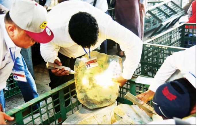
ပြည်တွင်း ပြည်ပရတနာကုန်သည်များ မဏိရတနာကျောက်စိမ်းခန်းမအပြင်ဘက်၌ ခင်းကျင်းပြသထား သည့် ကျောက်စိမ်းအတွဲများကို လေ့လာကြည့်ရှုစဉ်။

ရက်အထိလည်းကောင်း အိတ်ဖွင့်တင်ဒါစနစ်ဖြင့် ရောင်းချပေးသွားမည်ဖြစ်သည်။ ယခုပြပွဲတွင် ပုလဲအတွဲနှင့် ကျောက်မျက်အတွဲ များကို အမေရိကန်ဒေါ်လာဖြင့် ကြမ်းခင်းဈေး သတ်မှတ်ထားပြီး ဝယ်ယူခွင့်ရရှိသည့် ပြည်ပရတနာ ကုန်သည်များအနေဖြင့် အမေရိကန်ဒေါ်လာ၊ ယူရိုငွေ၊ ယွမ်ငွေ၊ ထိုင်းဘတ်ငွေနှင့် မြန်မာနိုင်ငံတော်ဗဟိုဘဏ် ကလက်ခံသည့် နိုင်ငံခြားငွေ အမျိုးအစားဖြင့် လည်းကောင်း၊ ပြည်တွင်း ရတနာကုန်သည်များ အနေဖြင့် နိုင်ငံခြားငွေ သို့မဟုတ် ကျပ်ငွေဖြင့်လည်း ကောင်း ပေးချေဝယ်ယူနိုင်မည်ဖြစ်သည်။ အုပ်စု(အေ)နှင့် အုပ်စု(ဘီ)တို့မှ ကျောက်စိမ်း အတွဲများကို အမေရိကန်ဒေါ်လာဖြင့် ကြမ်းခင်း ဈေးသတ်မှတ်ထားရှိပြီး ပြည်တွင်း ပြည်ပ ရတနာ