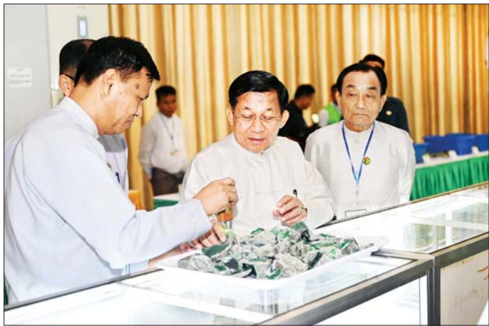
နိုင်ငံတော်စီမံအုပ်ချုပ်ရေးကောင်စီဥက္ကဋ္ဌ နိုင်ငံတော်ဝန်ကြီးချုပ် ဗိုလ်ချုပ်မှူးကြီး မင်းအောင်လှိုင် ၂၀၂၄ ခုနှစ် နှစ်လယ်မြန်မာ့ကျောက်မျက်ရတနာပြပွဲ၌ ရောင်းချရန်ပြသထားသော ကျောက်စိမ်း၊ ကျောက်မျက် အတွဲများနှင့် ပုလဲအတွဲများကို ကြည့်ရှုစစ်ဆေးစဉ်။