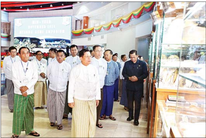
နိုင်ငံတော်စီမံအုပ်ချုပ်ရေးကောင်စီဥက္ကဋ္ဌ နိုင်ငံတော်ဝန်ကြီးချုပ် ဗိုလ်ချုပ်မှူးကြီး မင်းအောင်လှိုင် ပုဂ္ဂလိကကျောက်မျက်ရတနာအချောထည် အရောင်းပြခန်းများ ဖွင့်လှစ်ရောင်းချနေမှုကို ကြည့်ရှု စစ်ဆေးစဉ်။