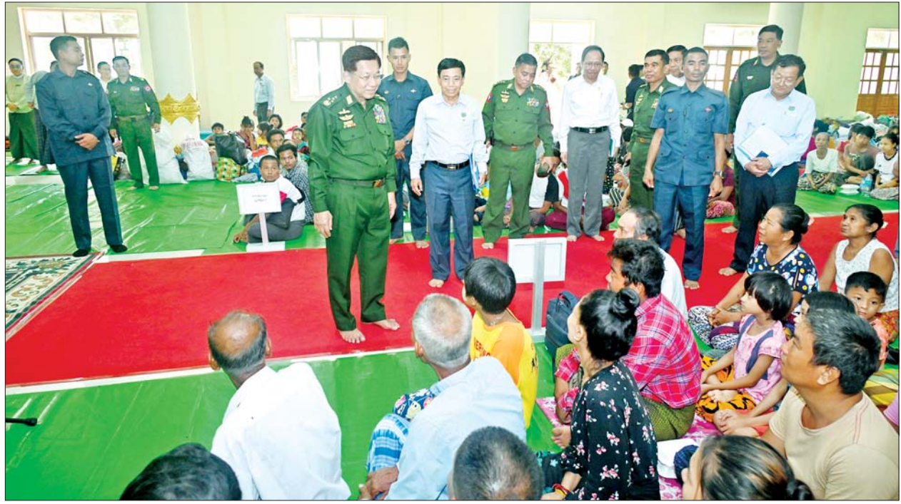
နိုင်ငံတော်စီမံအုပ်ချုပ်ရေးကောင်စီဥက္ကဋ္ဌ တပ်မတော်ကာကွယ်ရေးဦးစီးချုပ် ဗိုလ်ချုပ်မှူးကြီး မင်းအောင်လှိုင် ရေဘေးရှောင်ကယ်ဆယ်ရေး စခန်းအတွင်းရှိ ပြည်သူများအား ရင်းရင်းနှီးနှီးနူးနူးဆက်ဆံအားပေးစကားပြောကြားစဉ်။

သဘာဝဘေးအန္တရာယ် တစ်ကမ္ဘာလုံးမှာ ဖြစ်နေကြတာဖြစ်တော့ ဒီအပေါ်မှာ ကျွန်တော်တို့က ကြံကြံခံပြီး တော့မှ လူထုရဲ့ကြံစည်မှုနဲ့၊ လုံ့လ၊ ဝီရိယနဲ့ အားထုတ်သွားမယ်ဆိုလို့ရှိရင်တော့ ကျွန်တော်တို့ကျော်လွှားလို့ ရမယ်ဆိုတာလေး ပြောချင်ပါတယ်။ ဒီအတွက် မလျှော့တဲ့ ဇွဲလုံ့လနဲ့ ဆက်ပြီးလုပ်သွားကြဖို့လည်း အားမွေးသွားကြဖို့လည်း ပြောလိုပါတယ်။ ဒီမှာ အားမွေးသွားကြပါ။ ပြန်ရောက်လို့ရှိရင်လည်း ထိုက်သင့်တဲ့နေဖို့ ထိုင်ဖို့ စားဖို့သောက်ဖို့ ကျွန်တော်တို့ ထောက်ပံ့ပေးပါမယ်။ ကျွန်တော်တို့ပြီးပြီးရော မလွတ်ပါဘူး။ အကုန်လုံး စီစဉ်ပေးပါမယ်။