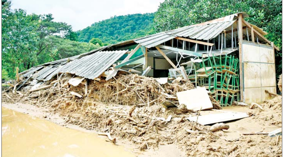
နယ်မြေခံတပ်ဌာနချုပ်ရှိ အထက်တန်းကျောင်းအဆောက်အအုံ ထိခိုက်ပျက်စီးမှုကို တွေ့ရစဉ်။

လိုက်လံ ကြည့်ရှုစစ်ဆေးခဲ့ပြီး မိသားစုဝင်များအား ရင်းရင်းနှီးနှီး လိုက်လံနှုတ်ဆက် အားပေးစကားပြောကြားသည်။