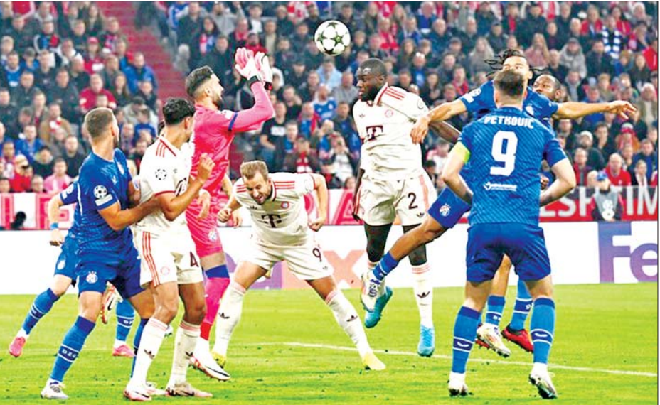
ဘိုင်ယန်မြူးနစ်အသင်းနှင့် ဒိုင်နမိုဇာဂရက်အသင်းတို့ ယှဉ်ပြိုင်ကစားကြစဉ်။

နေပြည်တော် စက်တင်ဘာ ၁၈ သင်္ချာပုံစံပြုမော်ဒယ်လ်များ၏ ခန့်မှန်းချက်များအရ တောင်တရုတ်ပင်လယ်ပြင်တွင် ဖြစ်ပေါ်နေသော အပူပိုင်းမုန်တိုင်းငယ်သည် ပိုမိုအားကောင်းလာနိုင်ကာ စက်တင်ဘာ ၂၀ ရက်တွင် ဗီယက်နမ်နိုင်ငံ ကုန်းတွင်းပိုင်းဒေသများသို့ ဖြတ်ကျော်နိုင်ပြီး စက်တင်ဘာ ၂၀ ရက် ညနေပိုင်းတွင် မြန်မာနိုင်ငံအရှေ့တောင်ပိုင်းဒေသများသို့ စတင်ဖြတ်ကျော် ရောက်ရှိနိုင်သည်။ အဆိုပါ အပူပိုင်းမုန်တိုင်းငယ်၏ အကြွင်းအကျန်တိမ်တိုက်များနှင့် လေပွေလှိုင်းသည် မြန်မာနိုင်ငံသို့ ဖြတ်ကျော်ပြီးနောက် ကပ္ပလီပင်လယ်ပြင်နှင့် ဘင်္ဂလားပင်လယ်အော်တို့တွင် လေဖိအားနည်းရပ်ဝန်းအဖြစ်သို့ ပြန်လည်အစပျိုးအားကောင်းလာနိုင်သည်။ အဆိုပါ ဖြတ်ကျော်လာနိုင်သည့် လေပွေလှိုင်း၏အရှိန်ကြောင့် စက်တင်ဘာ ၂၁ ရက်မှ စက်တင်ဘာ ၂၅ ရက်အတွင်း နေပြည်တော်၊ မန္တလေးတိုင်းဒေသကြီး၊ မကွေးတိုင်းဒေသကြီး၊ ပဲခူးတိုင်းဒေသကြီး၊ ရန်ကုန်တိုင်းဒေသကြီး၊ ဧရာဝတီတိုင်းဒေသကြီး၊ တနင်္သာရီတိုင်းဒေသကြီး၊ စာမျက်နှာ ၂၀ ကော်လံ ၁ သို့ ❖