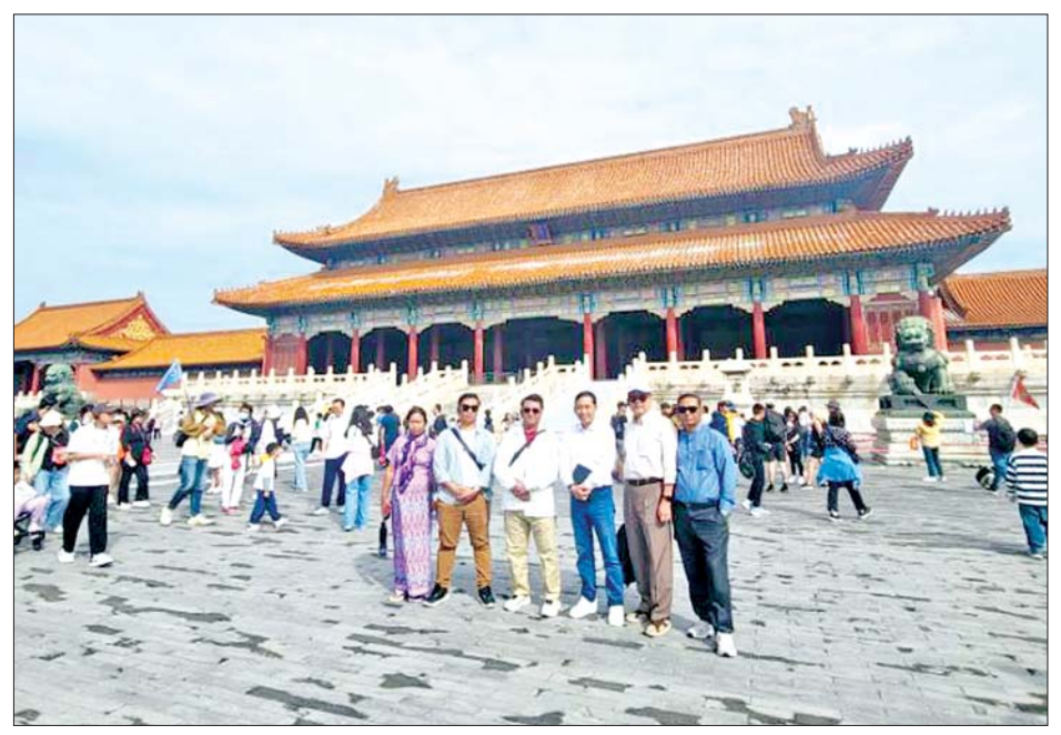
ပြည်ထောင်စုဝန်ကြီး ဦးမောင်မောင်အုန်းနှင့်အဖွဲ့ မော်စကိုမြို့ရှိ ရင်ပြင်နီတွင် ကြည့်ရှုလေ့လာစဉ်။

စေလွှတ်ကြရန် ညှိနှိုင်းခြင်း၊ တရုတ်တိုင်းရင်းသား အချို့၏ ဓလေ့ထုံးစံများ၊ ရိုးရာကဗျာများ၊ မီးပုံပွဲများတွင် သွားရောက်ကြည့်ရှုလေ့လာကာ ပါဝင်ဆင်နွှဲခြင်း၊ ကမ္ဘာ့ထုထည်အကြီးဆုံး ရေကာတာကြီးဖြစ်သည့် ယန်စီမြစ်ပေါ်ရှိ မြစ်ကျဉ်းသုံးသွယ် ရေကာတာကြီး၊ တရုတ်ရှေးဟောင်းနန်းတော်ကြီးနှင့် မဟာတံတိုင်းကြီးတို့ကို သွားရောက်လေ့လာ ကြည့်ရှုခဲ့သည်။ ထို့နောက် မြန်မာစာရေးဆရာအဖွဲ့သည် စက်တင်ဘာ ၁၆ ရက် မွန်းလွဲပိုင်းတွင် ပေကျင်းမြို့မှ ပြန်လည်ထွက်ခွာလာခဲ့ရာ ရန်ကုန်အပြည်ပြည်ဆိုင်ရာ လေဆိပ်သို့ ညရောက်ရှိပြီး ပြန်လည်ရောက်ရှိခဲ့