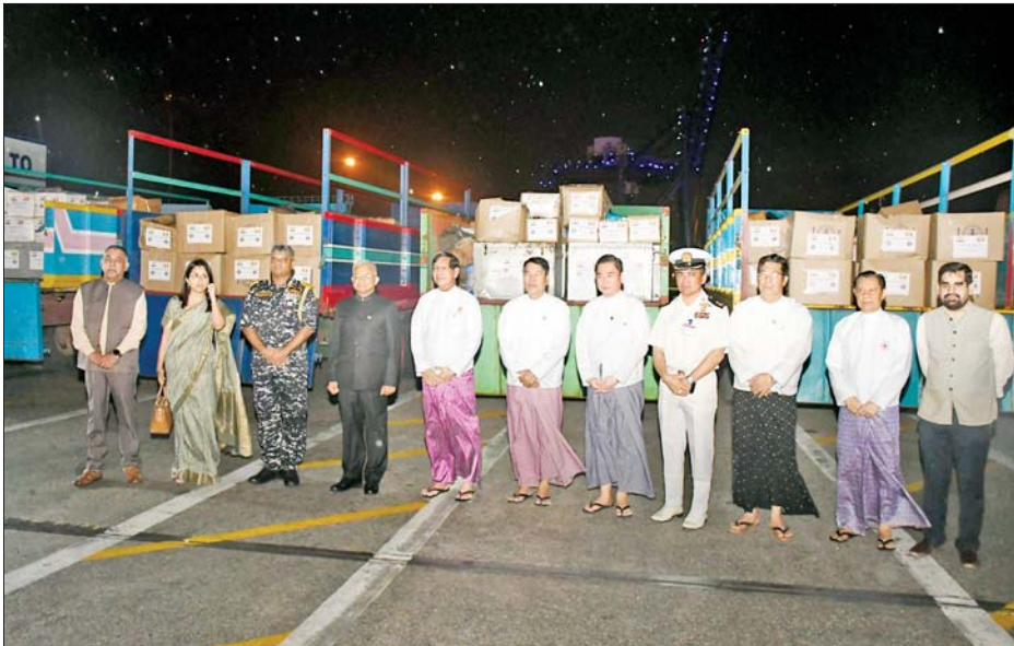
သို့ရောက်ရှိလာရာ တပ်မတော် (ရေ)မှ အရာရှိကြီးများနှင့် တာဝန်ရှိသူများက ဝမ်းပန်းတဘာကြိုဆိုကြသည်။ ထို့နောက် အိန္ဒိယစစ်ရေယာဉ်ဖြင့် ရောက်ရှိလာသည့် လူသားချင်းစာနာမှုအကူအညီနှင့် သဘာဝဘေးအန္တရာယ် ကယ်ဆယ်ရေးဆိုင်ရာပစ္စည်းများကို ညှိနှိုင်းတွင်

နေပြည်တော် စက်တင်ဘာ ၁၈ တောင်တရုတ် ပင်လယ်တွင် ဖြစ်ပွားခဲ့သော တိုင်းပွန်းမုန်တိုင်း ရာဂီ၏သက်ရောက်မှုကြောင့် ရေကြီးရေလျှံမှုများ ဖြစ်ပေါ်ခဲ့သော မြန်မာနိုင်ငံအတွင်းရှိ နေပြည်တော် ကောင်စီနယ်မြေအပါအဝင် တိုင်းဒေသကြီး၊ ပြည်နယ်များရှိ ရပ်ကွက်/ကျေးရွာများမှ ရေဘေးသင့် ပြည်သူများအား ကူညီကယ်ဆယ်ရေးနှင့် ပြန်လည်ထူထောင်ရေး လုပ်ငန်းများ ဆောင်ရွက်ရာတွင် အသုံးပြုနိုင်ရေးအတွက် သဘာဝဘေးအန္တရာယ်ကယ်ဆယ်ရေးဆိုင်ရာပစ္စည်းများကို အိန္ဒိယနိုင်ငံမှ စစ်ရေယာဉ် INS Satpura (F-48) သည် စက်တင်ဘာ ၁၇ ရက် မွန်းလွဲပိုင်းတွင် ရန်ကုန်မြို့ရှိ သီလဝါဆိပ်ကမ်း