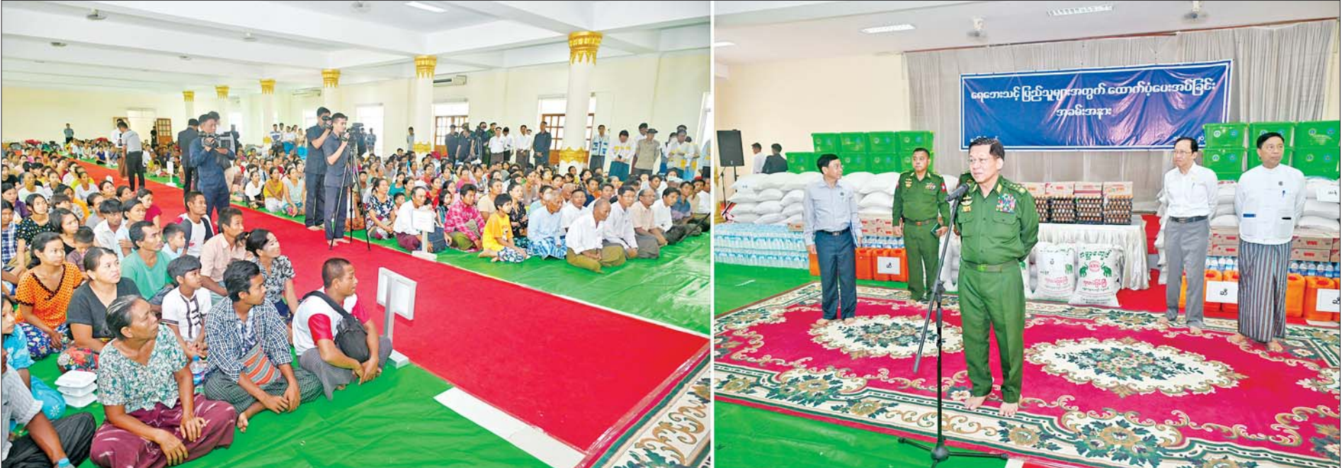
နိုင်ငံတော်စီမံအုပ်ချုပ်ရေးကောင်စီဥက္ကဋ္ဌ တပ်မတော်ကာကွယ်ရေးဦးစီးချုပ် ဗိုလ်ချုပ်မှူးကြီးမင်းအောင်လှိုင် ပျဉ်းမနားမြို့နယ် မင်္ဂလာဗျူဟာသာသနာ့ဗိမာန် ရေဘေးရှောင်ကယ်ဆယ်ရေးစခန်းရှိ ရေဘေးရှောင် ပြည်သူများကို အားပေးစကား ပြောကြားစဉ်။

နေပြည်တော် စက်တင်ဘာ ၁၈ နိုင်ငံတော်စီမံအုပ်ချုပ်ရေးကောင်စီဥက္ကဋ္ဌ တပ်မတော်ကာကွယ်ရေးဦးစီးချုပ် ဗိုလ်ချုပ်မှူးကြီး မင်းအောင်လှိုင်သည် ယနေ့နံနက်ပိုင်းတွင် ကောင်စီတွဲဖက်အတွင်းရေးမှူး ဗိုလ်ချုပ်ကြီး ရဲဝင်းဦး၊ ပြည်ထောင်စုဝန်ကြီးများ၊ နေပြည်တော်ကောင်စီဥက္ကဋ္ဌ၊ ကာကွယ်ရေးဦးစီးချုပ်ရုံးမှ အဆင့်မြင့်တပ်မတော် အရာရှိကြီးများနှင့် တာဝန်ရှိသူများလိုက်ပါ၍ ပျဉ်းမနားမြို့နယ် မင်္ဂလာဗျူဟာသာသနာ့ဗိမာန် ရေဘေးရှောင် ကယ်ဆယ်ရေးစခန်းရှိ ရေဘေးရှောင်ပြည်သူများအား သွားရောက်အားပေး စကားပြောကြားပြီး ထောက်ပံ့ ရေးပစ္စည်းများ ပေးအပ်သည်။ စာမျက်နှာ ၃ ကော်လံ ၁ သို့ *