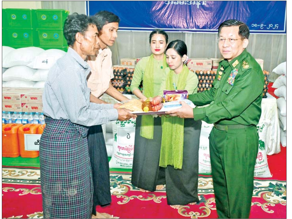
နိုင်ငံတော်စီမံအုပ်ချုပ်ရေးကောင်စီဥက္ကဋ္ဌ တပ်မတော်ကာကွယ်ရေးဦးစီးချုပ် ဗိုလ်ချုပ်မှူးကြီးမင်းအောင်လှိုင် ရေဘေးသင့်ပြည်သူများအတွက် ထောက်ပံ့ငွေနှင့် စားသောက်ဖွယ်ရာပစ္စည်းများ ပေးအပ်စဉ်။

* ရှေးဦးစွာ ဦးစွာ နိုင်ငံတော်စီမံအုပ်ချုပ်ရေးကောင်စီဥက္ကဋ္ဌ တပ်မတော်ကာကွယ်ရေးဦးစီးချုပ်က ရေဘေးရှောင်ပြည်သူများအား အားပေးစကားပြောကြားရာတွင် မြန်မာနိုင်ငံ၏ သမိုင်းတစ်လျှောက် မိုးသည်းထန်စွာ ရွာသွန်းမှုကြောင့် ဖြစ်ပေါ်ခဲ့သည့် သဘာဝဘေးအန္တရာယ်များတွင် ယခုတစ်ကြိမ်တွေ့ကြုံရမှုသည် အကြီးမားဆုံးဖြစ်ကြောင်း၊ မိမိပုဂံ-ညောင်ဦးခရီးစဉ်မှအပြန်တွင် ရဟတ်ယာဉ်ဖြင့် ရေကြီးမှုဖြစ်ပေါ်ခဲ့သည့် နေရာများသို့ ကြည့်ရှုခဲ့ရာ တောင်ကျချောင်းရေများကြောင့် သစ်ပင်နှင့် သစ်တုံးကြီးများ ရေနှင့်အတူမျောပါလာခဲ့သည်ကို တွေ့ခဲ့ရကြောင်း၊ ယနေ့နံနက်ပိုင်းတွင်လည်း တပ်ကုန်းမြို့အနီး တစ်ဝိုက်သို့ သွားရောက်ကြည့်ရှုခဲ့ကြောင်း၊ မိုးသည်းထန်စွာရွာသွန်းမှုကြောင့် တောင်ကျချောင်းရေများမှာ အလုံးအရင်းလိုက်ဖြင့် စီးဆင်းခဲ့မှုကြောင့် ထိခိုက်ပျက်စီးဆုံးရှုံးမှု များစွာဖြစ်ပေါ်ခဲ့ကြောင်း။