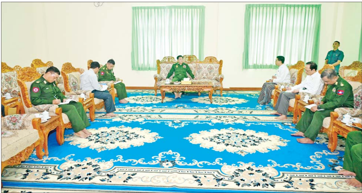
နိုင်ငံတော်စီမံအုပ်ချုပ်ရေးကောင်စီဥက္ကဋ္ဌ တပ်မတော်ကာကွယ်ရေးဦးစီးချုပ် ဗိုလ်ချုပ်မှူးကြီး မင်းအောင်လှိုင် မင်္ဂလာဗျူဟာ သာသနာ့ဗိမာန်ဧည့်ခန်းမဆောင်၌ တာဝန်ရှိသူများအား တွေ့ဆုံမှာကြားစဉ်။

တို့နိုင်ငံတင် မဟုတ်ပါဘူး။ ကျွန်တော်တို့ အာရှတင်ပဲလားဆိုတော့ မဟုတ်ဘူး။ ဟိုဥရောပနိုင်ငံတွေလည်း ရေကြီးနေကြတာပဲ။ သဘာဝကြီးက ဖြစ်လာတာဖြစ်ပါတယ်။ သဘာဝဘေးအန္တရာယ် တစ်ကမ္ဘာလုံးမှာ ဖြစ်နေကြတာဖြစ်တော့ ဒီအပေါ်မှာ ကျွန်တော်တို့က ကြံကြံခံပြီးတော့မှ လူထုရဲ့ ကြံစည်မှုနဲ့၊ လုံ့လ၊ ဝီရိယနဲ့ အားထုတ်သွားမယ်ဆိုလို့ရှိရင်တော့ ကျွန်တော်တို့ကျော်လွှားလို့ရမယ်ဆိုတာလေး ပြောချင်ပါတယ်။ ဒီအတွက် မလျှော့တဲ့ ဇွဲလုံ့လနဲ့ ဆက်ပြီးလုပ်သွားကြဖို့လည်း အားမွေးသွားကြဖို့လည်း ပြောလိုပါတယ်။ ဒီမှာ အားမွေးသွားကြပါ။ ပြန်ရောက်လို့ရှိရင်လည်း ထိုက်သင့်တဲ့ နေဖို့ထိုင်ဖို့ စားဖို့သောက်ဖို့ ကျွန်တော်တို့ ထောက်ပံ့ပေးပါမယ်။ ကျွန်တော်တို့ ပြီးပြီးရော မလွတ်ပါဘူး။ အကုန်လုံးစီစဉ်ပေးပါမယ်။”