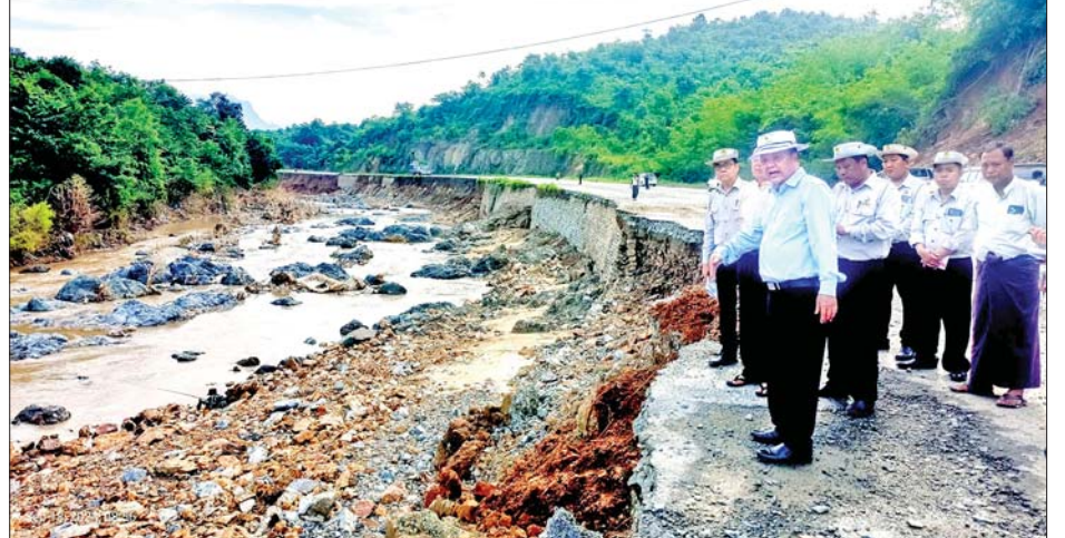
၆၀၀ လမ်းသားပွဲကျနေမှုကိုလည်းကောင်း၊ မိုင်တိုင်အမှတ်(၅၇/၆)တွင် ရေတိုက်စားသဖြင့် ဖြစ်ပေါ်ခဲ့သည့် ပျက်စီးမှုများ ပြုပြင်ဆောင်ရွက်နေမှုကိုလည်းကောင်း၊ မိုင်တိုင်အမှတ်(၆၂/၂-၆၂/၃)ကြား မြေထိန်းနံရံတည်ဆောက်ထားရှိမှုကိုလည်းကောင်း၊ မိုင်တိုင်အမှတ်(၆၆/၀)တွင် ကျောက်ရောမြေဖွဲ့၍ ပြင်ဆင်ဆောင်ရွက်နေမှုကိုလည်းကောင်း၊ ကလေးမြို့အဝင် မိုင်တိုင်အမှတ်(၇၁/၁-၇၁/၃)ကြား နှစ်ထပ်လမ်းအောက်ဘက်အခြမ်း ပြင်ဆင်ဆောင်ရွက်နေမှုကို

အချိန်မီပြီးစီးရေး ဆောင်ရွက်သွားရန် မှာကြားသည်။ ထို့နောက် မိတ္ထီလာ-တောင်ကြီးလမ်းပိုင်း ဖြစ်သည့် မိုင်တိုင်အမှတ်(၄၀/၀-၄၀/၃) ကတ္တရာလမ်း သားပွဲကျနေမှုကိုလည်းကောင်း၊ မိုင်တိုင်အမှတ် (၄၅/၃-၄၅/၄)ကြား ရေကျော်သဖြင့် လမ်းပေါ်တွင် တင်ကျန်နေသည့် ရွှံ့နုန်းမြေများကို စက်၊ ယာဉ်၊ ယန္တရားများဖြင့် ဖယ်ရှားနေမှုနှင့် မိုင်တိုင်အမှတ် (၄၇/၁-၄၇/၃)ကြား မြစ်ဆုံကျွန်းတွင် ရေတိုက်စားပြီး အကျယ် ၁၄ ပေ၊ အလျားပေ ၃၀၀၊ လမ်းတာပေါင်နှင့် ကတ္တရာလမ်းသားပွဲကျနေမှုကိုလည်းကောင်း ကြည့်ရှုစစ်ဆေးပြီး မိတ္ထီလာ-တောင်ကြီးလမ်းပိုင်းဘေးရှိ ချောင်းအတွင်း ကျောက်နံရံဖျက်ခြင်း ကျူးကျော်ထားခြင်းကြောင့် ချောင်းရေစီးကြောင်း ထိခိုက်နိုင်သဖြင့် သက်ဆိုင်ရာဌာနများနှင့်ပေါင်းစပ်ပြီး ကျူးကျော်မှုကို ဖယ်ရှားရှင်းလင်းရန်နှင့်လိုအပ်သည်များ မှာကြားသည်။ ယင်းနောက် ဒုတိယဝန်ကြီးသည် မိုင်တိုင်အမှတ် (၅၄/၄-၅၄/၅)ကြား အကျယ် ၁၂ ပေ၊ အလျား ပေ