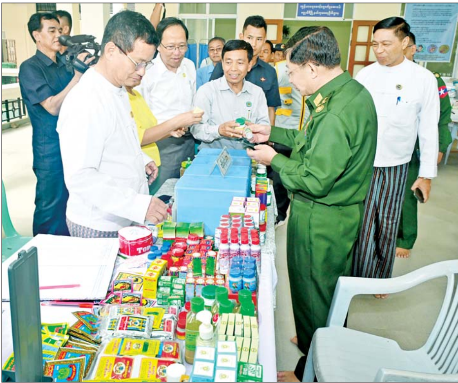
နိုင်ငံတော်စီမံအုပ်ချုပ်ရေးကောင်စီဥက္ကဋ္ဌ တပ်မတော်ကာကွယ်ရေးဦးစီးချုပ် ဗိုလ်ချုပ်မှူးကြီးမင်းအောင်လှိုင် ရေဘေးသင့်ပြည်သူများအတွက် ကျန်းမာရေးစောင့်ရှောက်မှုဆေးခန်း ဖွင့်လှစ်ထားရှိမှုကို ကြည့်ရှုစစ်ဆေးစဉ်။

* ရှေးဦးစွာ ဦးစွာ နိုင်ငံတော်စီမံအုပ်ချုပ်ရေးကောင်စီဥက္ကဋ္ဌ တပ်မတော်ကာကွယ်ရေးဦးစီးချုပ်က ရေဘေးရှောင်ပြည်သူများအား အားပေးစကားပြောကြားရာတွင် မြန်မာနိုင်ငံ၏ သမိုင်းတစ်လျှောက် မိုးသည်းထန်စွာ ရွာသွန်းမှုကြောင့် ဖြစ်ပေါ်ခဲ့သည့် သဘာဝဘေးအန္တရာယ်များတွင် ယခုတစ်ကြိမ်တွေ့ကြုံရမှုသည် အကြီးမားဆုံးဖြစ်ကြောင်း၊ မိမိပုဂံ-ညောင်ဦးခရီးစဉ်မှအပြန်တွင် ရဟတ်ယာဉ်ဖြင့် ရေကြီးမှုဖြစ်ပေါ်ခဲ့သည့် နေရာများသို့ ကြည့်ရှုခဲ့ရာ တောင်ကျချောင်းရေများကြောင့် သစ်ပင်နှင့် သစ်တုံးကြီးများ ရေနှင့်အတူမျောပါလာခဲ့သည်ကို တွေ့ခဲ့ရကြောင်း၊ ယနေ့နံနက်ပိုင်းတွင်လည်း တပ်ကုန်းမြို့အနီး တစ်ဝိုက်သို့ သွားရောက်ကြည့်ရှုခဲ့ကြောင်း၊ မိုးသည်းထန်စွာရွာသွန်းမှုကြောင့် တောင်ကျချောင်းရေများမှာ အလုံးအရင်းလိုက်ဖြင့် စီးဆင်းခဲ့မှုကြောင့် ထိခိုက်ပျက်စီးဆုံးရှုံးမှု များစွာဖြစ်ပေါ်ခဲ့ကြောင်း။