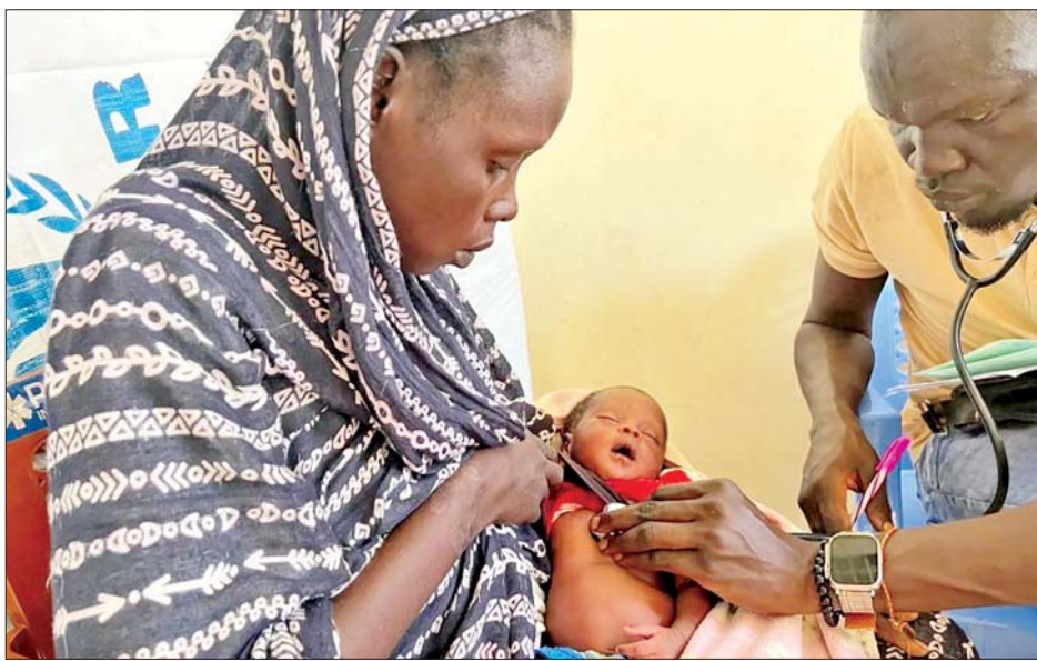
ကုလသမဂ္ဂကလေးများရန်ပုံငွေအဖွဲ့က ဆူဒန်နိုင်ငံအတွက် ကာလဝမ်းရောဂါကာကွယ်ဆေး ၄၀၄၀၀၀ ကို စက်တင်ဘာ ၉ ရက်တွင် ထောက်ပံ့ပေးခဲ့ကြောင်းလည်း ထုတ်ပြန်ချက်တွင် ဖော်ပြထားသည်။

နိုင်ငံအတွင်း၌ လက်ရှိဖြစ်ပွားနေသော ပဋိပက္ခများကြောင့် ကာကွယ်ဆေးထိုးမှု ကျန်းမာရေးစောင့်ရှောက်မှု ရေထောက်ပံ့မှုလျော့နည်းခြင်းနှင့် ကျန်းမာရေးဆိုင်ရာ အခြေခံအဆောက်အအုံများ ပျက်စီးခြင်းတို့အပါအဝင် ကလေးငယ်များ အာဟာရချို့တဲ့မှုတို့သည် ကူးစက်ရောဂါဖြစ်နိုင်ခြေကို ပိုမိုများပြားစေကြောင်း ၎င်းကပြောကြားသည်။