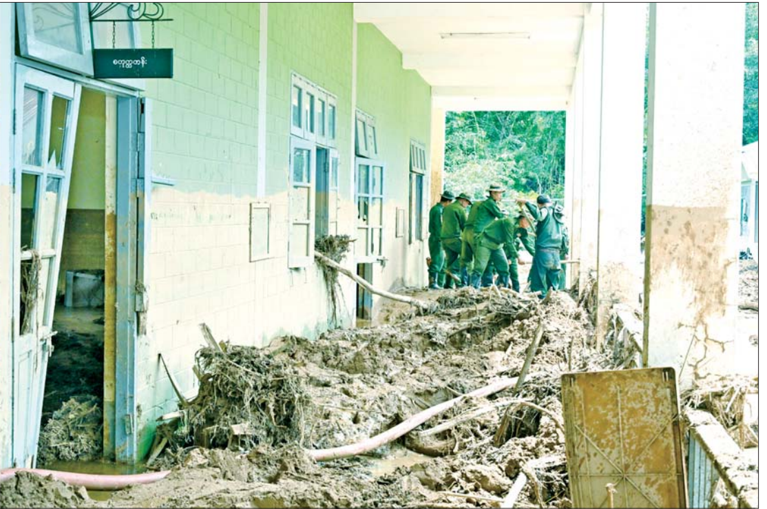
နိုင်ငံတော်စီမံအုပ်ချုပ်ရေးကောင်စီဥက္ကဋ္ဌ တပ်မတော်ကာကွယ်ရေးဦးစီးချုပ် ဗိုလ်ချုပ်မှူးကြီး မင်းအောင်လှိုင် နယ်မြေခံတပ်ဌာနချုပ်ရှိ အထက်တန်းကျောင်း၌ နန်းများ ဖယ်ရှားရှင်းလင်းခြင်းနှင့် သန့်ရှင်းရေးလုပ်ငန်း ဆောင်ရွက်နေမှုကို ကြည့်ရှုစစ်ဆေးစဉ်။

အားပေးစကားပြောကြား ယင်းနောက် နိုင်ငံတော်စီမံအုပ်ချုပ်ရေးကောင်စီ ဥက္ကဋ္ဌ တပ်မတော် ကာကွယ်ရေးဦးစီးချုပ်သည် မိုးသည်းထန်စွာရွာသွန်းမှုကြောင့် ရုတ်တရက် ရေကြီးရေလျှံမှုဖြစ်ပေါ်ခဲ့စဉ် ထိခိုက်ဒဏ်ရာရရှိခဲ့ပြီး နယ်မြေခံတပ်ဌာနချုပ်ဆေးခန်း၌ ဆေးကုသမှုခံယူ