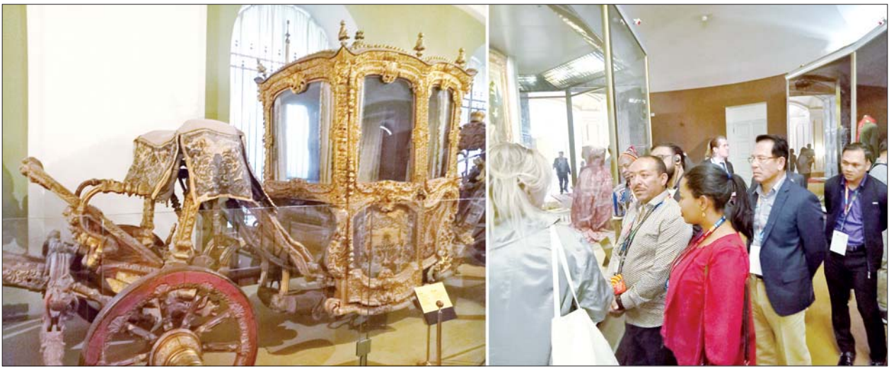
ပြည်ထောင်စုဝန်ကြီး ဦးမောင်မောင်အုန်းနှင့်အဖွဲ့ မော်စကိုမြို့ရှိ ရှေးဟောင်းပြတိုက်တွင် ကြည့်ရှုလေ့လာစဉ်။

ရန်ကုန် စက်တင်ဘာ ၁၈ ပြန်ကြားရေး ဝန်ကြီးဌာန ပြည်ထောင်စုဝန်ကြီး ဦးမောင်မောင်အုန်း၊ ရုရှားနိုင်ငံဆိုင်ရာ မြန်မာသံအမတ်ကြီး ဦးသစ်လင်းအုန်းနှင့်အဖွဲ့သည် BRICS Media Summit သို့ တက်ရောက်ရန် မော်စကိုမြို့၌ ရောက်ရှိနေကြသည့်မီဒီယာဆိုင်ရာကိုယ်စားလှယ်များနှင့်အတူ စက်တင်ဘာ ၁၆ ရက် နံနက်ပိုင်းတွင် မော်စကိုမြို့ရှိ အထင်ကရနေရာများဖြစ်သော ကရင်မလင်နန်းတော်နှင့် ရှေးဟောင်းပြတိုက်များ၊ အညတရ သူရဲကောင်းတစ်ဦး၏ ဂူဗိမာန်၊ ရင်ပြင်နီ ဗာစီလီး ဘလာရမ်းနီရီ ဘုရားကျောင်း၊ ဘာသာရေးဆိုင်ရာ အဓိကဘုရားကျောင်း နေရာများသို့ သွားရောက်ပြီး ကြည့်ရှုလေ့လာကြသည်။ မော်စကိုမြို့သည် Moskva မြစ်ပေါ်တွင် တည်ရှိပြီး လူဦးရေ ၁၃ သန်းကျော် နေထိုင်ကြောင်း သိရသည်။ မော်စကိုမြို့သည် ကမ္ဘာပေါ်ရှိ အကြီးဆုံးမြို့များထဲမှ