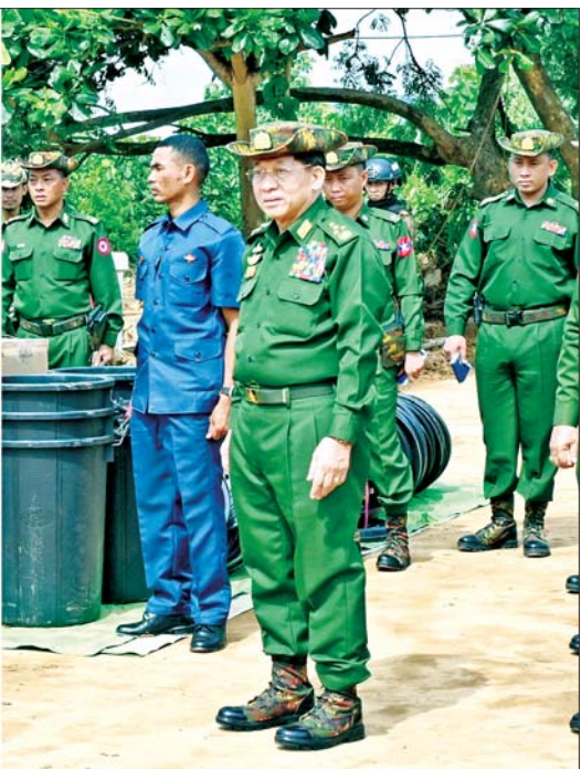
နိုင်ငံတော်စီမံအုပ်ချုပ်ရေးကောင်စီဥက္ကဋ္ဌ တပ်မတော်ကာကွယ်ရေးဦးစီးချုပ် ဗိုလ်ချုပ်မှူးကြီးမင်းအောင်လှိုင် နယ်မြေခံတပ်ဌာနချုပ်တွင် ထိခိုက်ပျက်စီးမှုများကို ကြည့်ရှု စစ်ဆေးစဉ်။