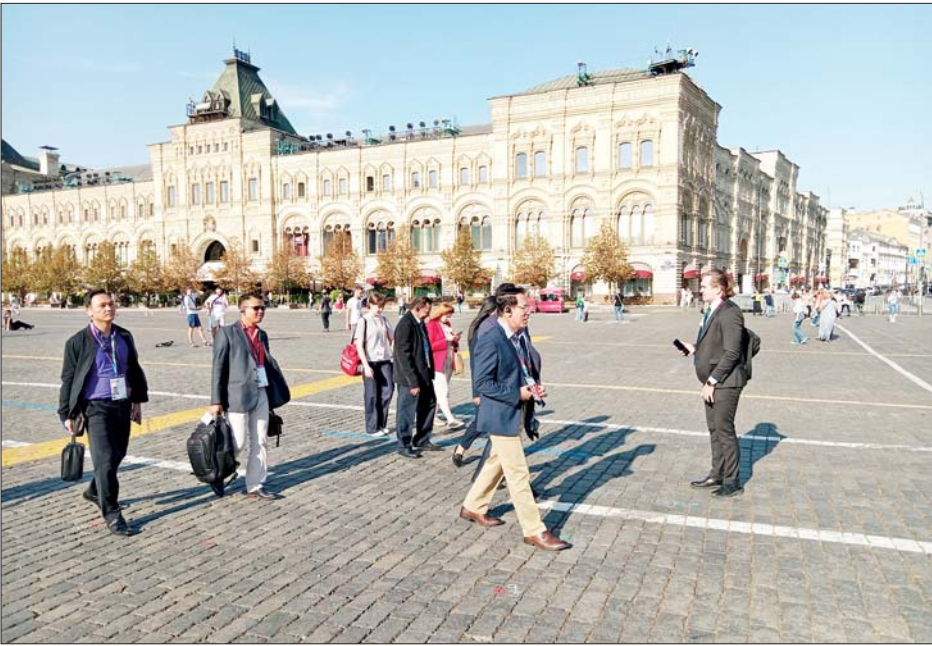
ပြည်ထောင်စုဝန်ကြီး ဦးမောင်မောင်အုန်းနှင့်အဖွဲ့ မော်စကိုမြို့ရှိ ရင်ပြင်နီတွင် ကြည့်ရှုလေ့လာစဉ်။

ခုနှစ်တွင် ဘုရားကျောင်း ပြုပြင်မွမ်းမံရေး လုပ်ငန်းများကို စတင်ခဲ့ပြီး ၁၉၉၉ ခုနှစ် ဒီဇင်ဘာလတွင် ဆေးချယ်အလှဆင်မှုများ ပြီးစီးသည်။ ၂၀၀၀ ပြည့်နှစ် ဩဂုတ် ၁၉ ရက်တွင် ခရစ်စတယ်စပါစီးကျေးလ်ဘုရားရှိခိုးကျောင်းကြီးကို ဖွင့်လှစ်ခဲ့ခြင်းဖြစ်သည်။