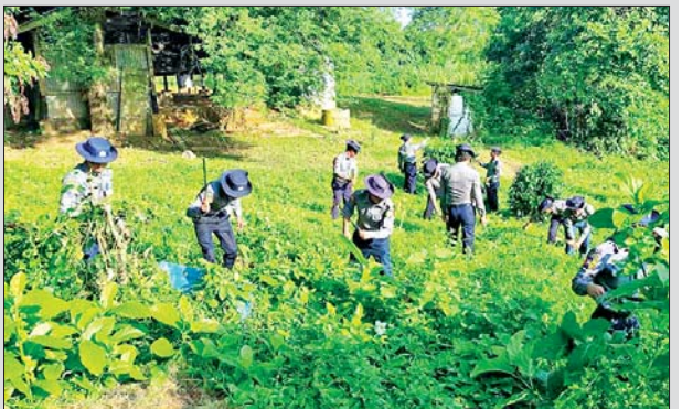
ခရိုင်(ပြန်/ဆက်)

နှစ်(၆၀)ပြည့် မြန်မာနိုင်ငံရဲတပ်ဖွဲ့နေ့ကို ကြိုဆိုရက်ပြုသော အားဖြင့် စက်တင်ဘာ ၁၈ ရက်နံနက်ပိုင်းက ခန္တီးခရိုင်ရဲတပ်ဖွဲ့မှူး ဒုတိယရဲမှူးကြီး သက်ထွဋ်နှင့် မြို့နယ်ရဲတပ်ဖွဲ့မှူး ရဲမှူးညွှန်ကြားမှုဦးစီးဌာနမှ နယ်မြေခံရဲတပ်ဖွဲ့နှင့် လေကြောင်းရဲတပ်ဖွဲ့ဝင် အင်အား ၄၀ တို့က ခန္တီးမြို့၊ ဇီးဖြူကုန်းရပ်ကွက်ရှိ ခရိုင်ပြည်သူ့ဆေးရုံဝင်းအတွင်း သစ်ပင်ချွန်များနှင့် အမှိုက်များအား ခုတ်ထွင်ရှင်းလင်းစဉ်။