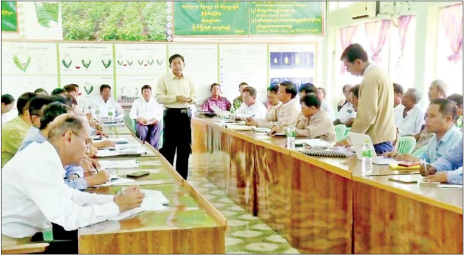
ပြီးနောက် ပြန်လည်ကုစားနိုင်မည့် အစီအမံများ၊ မြေပြင်အခြေအနေ မှန် သိရှိရေးအတွက် တောင်သူ များနှင့်ချိတ်ဆက်မှု လျင်မြန် ချောမွေ့ စေရန် Viber group များ ကို ဒေသအလိုက် ဖွဲ့စည်းထားရှိ ရေး၊ နန်းဖုံးလွှမ်းခဲ့သည့်စိုက်ရေယာ များ ပြန်လည်စိုက်ပျိုးနိုင်မှုနှင့် ရေကြီးရေလွှမ်းပြီးနောက် ကြုံ ရှိနေသည့် သီးနှံပိုးမွှား ရောဂါ ကာကွယ်နှိမ်နင်းရေး လုပ်ငန်းများ စနစ်တကျစီမံဆောင် လုပ်ငန်းများ စနစ်တကျစီမံဆောင် ရွက်ရေးဆိုင်ရာ ကိစ္စရပ်များကို ဆွေးနွေးမှာကြားသည်။ ယခုကြိုတွေ့ခဲ့ရသည့် မိုးသည်း ထန်စွာရွာသွန်းမှုနှင့် ရေကြီးရေလျှံ မှုကြောင့် သီးနှံစိုက်ခင်းများ ထိခိုက် ပျက်စီးခဲ့ရာတွင် မိတ္ထီလာခရိုင်၌ ဧကသုံးသောင်းငါးထောင်ကျော်၊ ရမည်းသင်းခရိုင်တွင် ဧက ငါးသောင်းခြောက်ထောင်ကျော်၊ ကျောက်ဆည်ခရိုင်၌ ဧကတစ်သိန်း တစ်သောင်းကျော် ရေကြီးနစ်မြုပ် ခဲ့ကြောင်း သိရသည်။ သတင်းစဉ်

အစည်းအဝေးသို့ စိုက်ပျိုးရေး၊ မွေးမြူရေးနှင့် ဆည်မြောင်းဝန်ကြီး ဌာန ဒုတိယဝန်ကြီး ဒေါက်တာ တင်ထွဋ်နှင့် စိုက်ပျိုးရေးဦးစီးဌာန၊ ကြေးတိုင်နှင့် မြေစာရင်းဦးစီးဌာန၊ စက်မှုလယ်ယာ ဦးစီးဌာနတို့မှ ဒုတိယညွှန်ကြားရေးမှူးချုပ်များ၊ စိုက်ပျိုးရေးသုတေသန ဦးစီးဌာန မှ သီးနှံအလိုက် ပညာရှင်များ၊ ခရိုင်နှင့် မြို့နယ်အဆင့် လယ်ယာ ကဏ္ဍဆိုင်ရာ တာဝန်ရှိသူများ၊ မြို့နယ်အလိုက်တောင်သူ ကိုယ်စား လှယ်များ တက်ရောက်ကြသည်။ အစည်းအဝေးတွင် မြို့နယ် တာဝန်ခံများက သီးနှံများအလိုက် ရေကြီးနစ်မြုပ် ထိခိုက်ပျက်စီးမှု အခြေအနေများကို ရှင်းလင်း တင်ပြကြပြီး တောင်သူများက