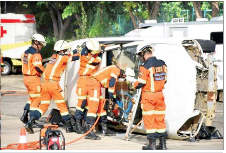
နိုင်ငံတော်စီမံ အုပ်ချုပ်ရေးကောင်စီအဖွဲ့ဝင် ပြည်ထောင်စုဝန်ကြီး ဒုတိယဗိုလ်ချုပ်ကြီး ရာပြည့် မော်တော်ယာဉ်မတော်တဆမှုဖြစ်စဉ် ကယ်ဆယ်ရေးသင်တန်းဆင်းပွဲတွင် အသင်းလိုက်ကယ်ဆယ်ခြင်း ပြိုင်ပွဲများကျင်းပနေမှုအား ကြည့်ရှုအားပေးစဉ်။