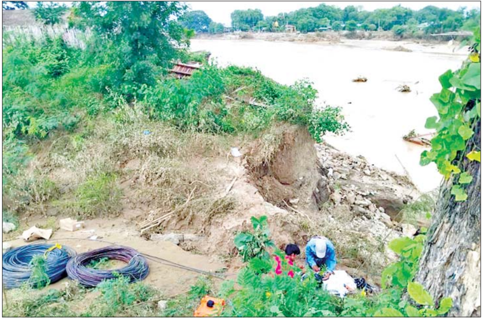
အဆိုတံတားအနီး ဖိုင်ဘာကေဘယ်လ်များ အစားထိုးပြုပြင်နေသည်ကို တွေ့ရစဉ်။

(အဆိုတံတား)တွင် ပြတ်တောက်သွားသည့် နေပြည်တော် - တပ်ကုန်း - ရမည်းသင်း ဖိုင်ဘာကေဘယ်လ်ဆက်ကြောင်းနှင့် တပ်ကုန်း - ပင်လောင်းအကြားရှိ ဖိုင်ဘာကေဘယ်လ် ပြတ်တောက်နေမှုများကို စက်တင်ဘာ ၁၅ ရက် နံနက်ပိုင်းတွင် မြန်မာ့ဆက်သွယ်ရေးလုပ်ငန်း ဦးဆောင်ညွှန်ကြားရေးမှူး ဦးမျိုးသန်းနှင့် တာဝန်ရှိသူများက သွားရောက်ကြည့်ရှု၍ ဖိုင်ဘာကေဘယ်လ်များ စနစ်တကျပြန်လည်ဆက်သွယ်နိုင်ရေး၊ ဆက်သွယ်မှုအမြန်ဆုံး ပြန်လည်ရရှိစေရေး သက်ဆိုင်ရာတာဝန်ရှိသူများနှင့် ညှိနှိုင်းဆောင်ရွက်ခဲ့ကြောင်း သိရသည်။