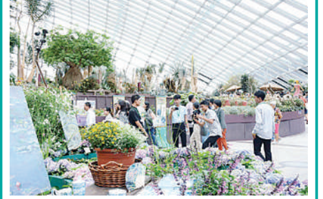
၂၀၂၄ ခုနှစ် တက္ကသိုလ်ဝင် စာမေးပွဲ ထူးချွန်ကျောင်းသား၊ ကျောင်းသူများ နိုင်ငံတော် အစီအစဉ်ဖြင့် ပြည်ပလေ့လာရေးခရီးစဉ်များ လှည့်လည်လေ့လာ စာမျက်နှာ-၁၈

နေပြည်တော် ဩဂုတ် ၁၃ ၂၀၂၄ ခုနှစ် ပြည်နယ်နှင့်တိုင်းဒေသကြီး ဖူဆယ်ပြိုင်ပွဲ ဖွင့်ပွဲအခမ်းအနားကို ယနေ့မွန်းလွဲပိုင်းတွင် နေပြည်တော်ရှိ ဝဏ္ဏသိဒ္ဓိအားကစားကွင်း ဖူဆယ်အားကစားရုံ၌ ကျင်းပရာ နိုင်ငံတော်စီမံအုပ်ချုပ်ရေးကောင်စီအဖွဲ့ဝင်များ တက်ရောက်ကြည့်ရှုအားပေးကြသည်။ အခမ်းအနားသို့ နိုင်ငံတော်စီမံအုပ်ချုပ်ရေးကောင်စီအဖွဲ့ဝင်များဖြစ်ကြသည့် ဒေါ်ဒွဲဘူ၊ ပိုးရယ်အောင်သိန်း၊ မန်းငြိမ်းမောင်၊ ဒေါက်တာမူထန်၊ ဒေါက်တာဘရွှေခွန်စံလွင်ဦးရွှေကြိမ်းနှင့်ဦးရန်ကျော်၊ ပြည်ထောင်စုဝန်ကြီးများ၊ ဒုတိယဝန်ကြီးများ၊ ဌာနဆိုင်ရာတာဝန်ရှိသူများ၊ မြန်မာနိုင်ငံဘေးလုံးအဖွဲ့ချုပ်မှ တာဝန်ရှိသူများ၊ ဖိတ်ကြားထားသည့်ဧည့်သည်တော်များ၊ စာမျက်နှာ ၁၆ ကော်လံ ၁