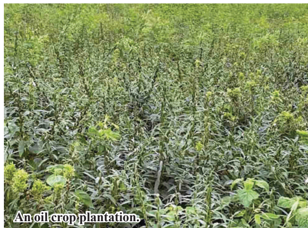
An oil crop plantation.