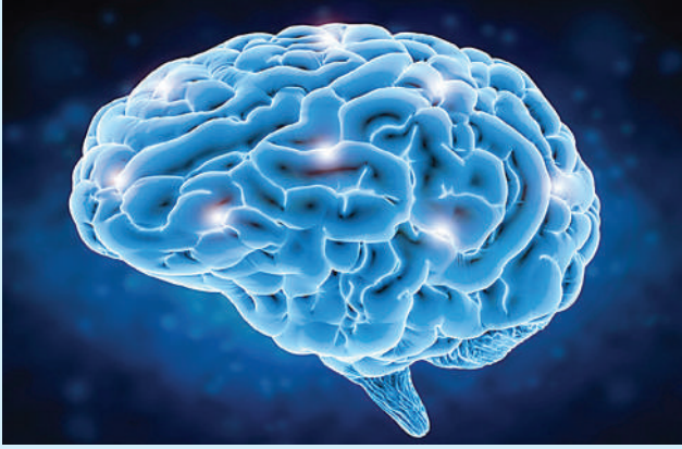
လမ်းလျှောက်ခြင်းဟာ မိမိ တို့ရဲ့ ဦးနှောက်တွေအတွက်

အကျိုးကျေးဇူးများစွာ ပေးစွမ်း ရှိတဲ့ စိတ်ဖိစီးမှုတွေ လျော့ကျ တယ်လို့ သုတေသနတစ်ခုမှာ လေ့လာတွေ့ရှိရပါတယ်။ ဖော်ပြထားပါတယ်။ ဒါ့အပြင် အဲဒီဟော်မုန်းက လမ်းလျှောက်တဲ့ အခါမှာ ဦးနှောက်ရဲ့ အလုံးစုံကျန်းမာရေး အန်ဒေါဖင်လိုခေါ်တဲ့ ဟော် ကို အထောက်အပံ့ဖြစ်စေတဲ့ မုန်းတစ်မျိုးထွက်ရှိမှု မြင့်တက် အပြင် ဒီမန်းရှားလို့ခေါ်တဲ့ လာပါတယ်။ အဲဒီဟော်မုန်းက မှတ်ဉာဏ်ချို့ယွင်းရှားသွပ်ခြင်း နာကျင်မှုဝေဒနာကို သက်သာ ရောဂါနဲ့ အယ်ဇိုင်းမားရောဂါ စေတဲ့ဟော်မုန်းပါ။ အန်ဒေါဖင် တို့ ဖြစ်ပွားနိုင်ခြေကိုတောင်မှ ဟော်မုန်းထွက်ရှိလေ မိမိတို့မှာ လျော့ချပေးနိုင်ပါတယ်။