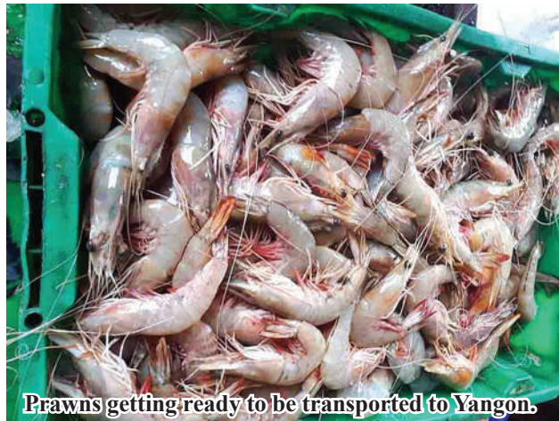
Prawns getting ready to be transported to Yangon.

“We are currently transporting and selling fishery products from Bogalay Township to the Yangon market. Last July, we managed to transport and sell up to 87,000 viss of assorted prawns. Due to the high demand for prawns in the Yangon market, our sales have increased. The active trading of fishery products, including prawns, has created better employment opportunities for those involved in this business. Most of the products were transported and sold using cargo trucks, and there were no difficulties in the process,” said Daw Aye Aye Moe.