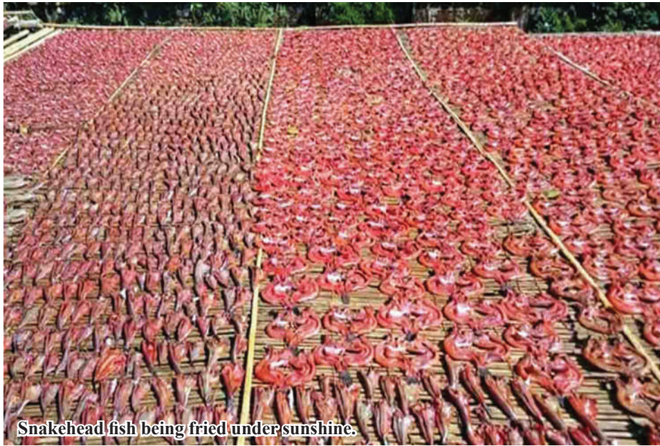
Snakehead fish being dried under sunshine.