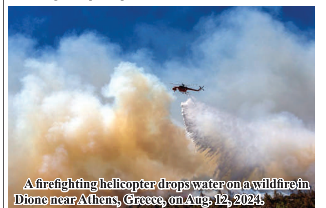
A firefighting helicopter drops water on a wildfire in Dione near Athens, Greece, on Aug. 12, 2024.