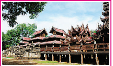
ရတနာပုံခေတ်နှောင်းပိုင်းလက်ရာ စလေရုပ်စုံကျောင်း ဆောင်းပါး စာမျက်နှာ-၄