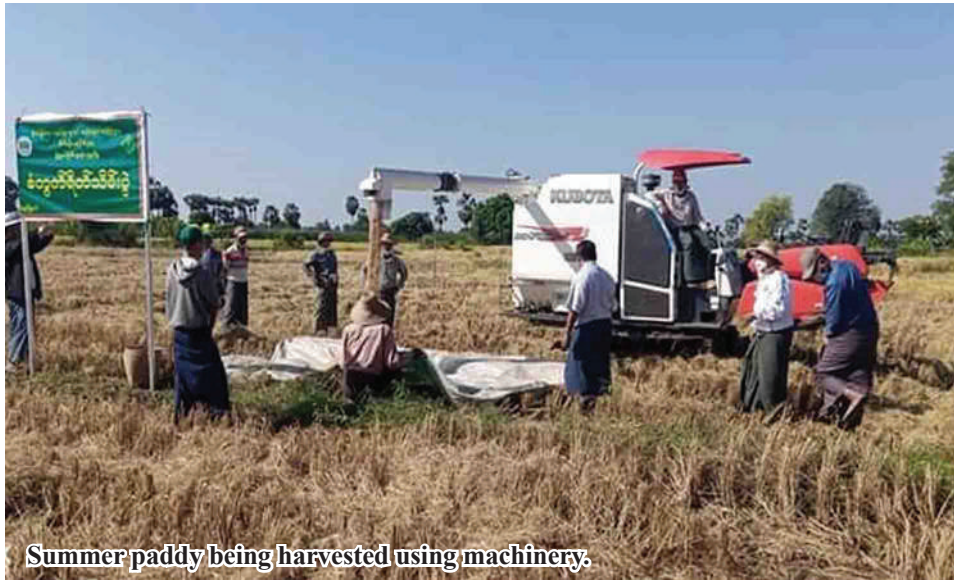
Summer paddy being harvested using machinery.

Dabayin August 13 Statistics of YeU District Agriculture Department stated that a total of 17,262 acres of summer paddy has been harvested in Dabayin Township of Sagaing Region.