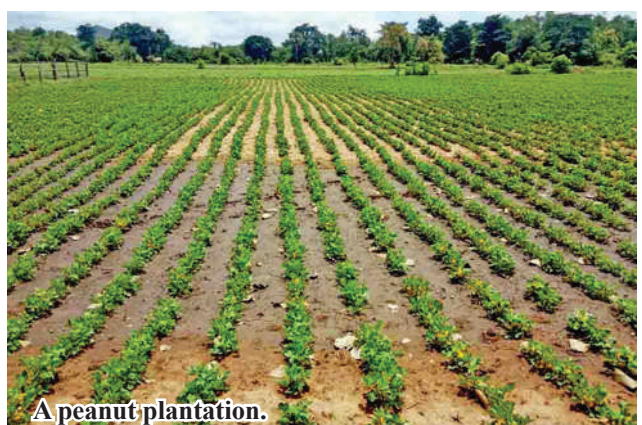
A peanut plantation.

In this year's rain crops planting season, in order to increase the amount of oil for consumption and to increase the crop cultivation power, 1,661 acres of oilseed peanuts have been planted in Pwintbyu Township, Magway Region in this year rain crops planting season, according to the office of the Department of Agriculture for Pwintbyu Township.