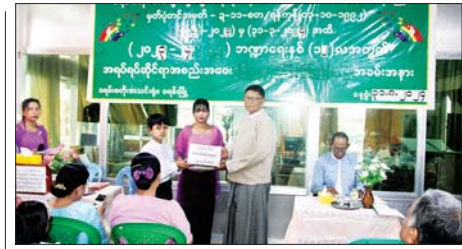
ခရမ်းစတိုးအထွေထွေစီးပွားရေးလုပ်ငန်း သမအသင်း လီမိတက် အရပ်ရပ်ဆိုင်ရာ အစည်းအဝေးကျင်းပ

ထိုကဲ့သို့ CRPH၊ NUG နှင့် ယင်းတို့၏ လက်ဝေခံအဖွဲ့အစည်းများ၊ ယင်းတို့နှင့် ဆက်သွယ်နေသော အဖွဲ့အစည်းများ၊ လူပုဂ္ဂိုလ်များသည် နိုင်ငံတော်တည်ငြိမ်အေးချမ်းရေးကို ပျက်ပြားစေရန်နှင့် အစိုးရ ယန္တရားများပျက်ပြားစေရန် ရည်ရွယ်လျက် လှုံ့ဆော်ခြင်း၊ ဝါဒ ဖြန့်ခြင်းများပြုလုပ်ခဲ့မှုအပေါ် ဥပဒေနှင့်အညီ ထိရောက်စွာ အရေးယူ သွားမည်ဖြစ်ကြောင်းနှင့် ထိုသို့လှုံ့ဆော်သူ၊ ဝါဒဖြန့်သူများအား ဆက်လက်ဖော်ထုတ်အရေးယူသွားမည်ဖြစ်ကြောင်း သိရသည်။ သတင်းစဉ်