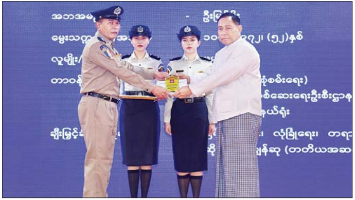
ပေးအပ်ချီးမြှင့်ကြသည်။ ယင်းနောက် ပြည်ထောင်စုဝန်ကြီး၊ ဒုတိယဝန်ကြီးနှင့် နေပြည်တော်များသည် တပ်ဖွဲ့၊ ဦးစီးဌာနများမှ အရာရှိကြီးများ၊ ဆုရရှိသူများနှင့်အတူ စုပေါင်းမှတ်တမ်းတင်ဓာတ်ပုံရိုက်ပြီး အခမ်းအနားကို ရုပ်သိမ်းလိုက်ကြောင်း သတင်းရရှိသည်။ သတင်းစဉ်

အခမ်းအနားတွင် ပြည်ထောင်စုဝန်ကြီး ဒုတိယဗိုလ်ချုပ်ကြီးရာပြည့်က ဂုဏ်ပြုအမှာစကား ပြောကြားပြီး နေပြည်တော်များနှင့်အတူ အထူးစုံစမ်းစစ်ဆေးရေးဦးစီးဌာန၏ လှုပ်ရှားဆောင်ရွက်ခဲ့မှုမှတ်တမ်း Video Clip ကို ကြည့်ရှုအားပေးကာ ဝန်ထမ်းများအတွက် ထောက်ပံ့ပစ္စည်းများကိုလည်းကောင်း၊ ဒုတိယရဲအုပ်လောင်း သင်တန်းအမှတ်စဉ် (၁၁၄/၂၀၂၃) တွင် အကောင်းဆုံး သင်တန်းသားထူးချွန်ဆုရရှိသူ တစ်ဦးနှင့် လုပ်ငန်းထူးချွန်ဆုရရှိသူ သုံးဦးတို့အား ဂုဏ်ပြုဆုများကိုလည်းကောင်း ပေးအပ်ချီးမြှင့်သည်။ (အပေါ်ယာပုံ)