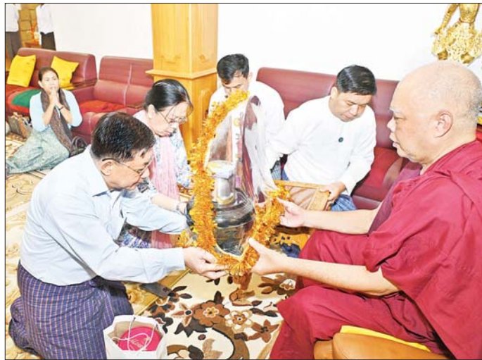
နိုင်ငံတော်စီမံအုပ်ချုပ်ရေးကောင်စီဥက္ကဋ္ဌ နိုင်ငံတော်ဝန်ကြီးချုပ် ဗိုလ်ချုပ်မှူးကြီး မင်းအောင်လှိုင် နှင့် ဇနီး ဒေါ်ကြူကြူလှ စေတီတော်ကြီး ဘက်စုံပြုပြင်မွမ်းမံရန် တပ်မတော် (ကြည်း၊ ရေ၊ လေ) မိသားစုများမှ လှူဒါန်းသည့် အလှူငွေများနှင့် စုပေါင်းအလှူတော်ငွေများ ပေးအပ်လှူဒါန်းစဉ်။