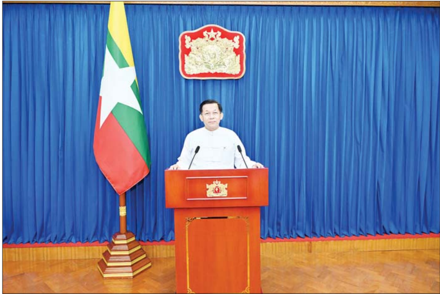
နိုင်ငံတော်စီမံအုပ်ချုပ်ရေးကောင်စီဥက္ကဋ္ဌ နိုင်ငံတော်ဝန်ကြီးချုပ် ဦးလှချုပ်မှူးကြီး မင်းအောင်လှိုင် ၂၀၂၄ ခုနှစ် လူဦးရေနှင့် အိမ်အကြောင်းအရာ သန်းခေါင်စာရင်းကောက်ယူခြင်းအထိမ်းအမှတ် ပြည်သူ့သို့ မိန့်ခွန်းပြောကြားစဉ်။

ချစ်ကြည်လေးစားရပါသော မြန်မာနိုင်ငံသူ နိုင်ငံသားများခင်ဗျာ နိုင်ငံတစ်နိုင်ငံရဲ့ ဖွံ့ဖြိုးတိုးတက်မှုကို လေ့လာမယ်ဆိုရင် အဲဒီနိုင်ငံက ထုတ်ပြန်တဲ့ လူဦးရေနဲ့ လူမှုစီးပွားဆိုင်ရာ စာရင်းအင်းအချက်အလက်တွေကို ဆန်းစစ်လေ့လာခြင်းဖြင့် သိရှိနိုင်ပါတယ်။ ဒါ့ကြောင့်လည်း တစ်နိုင်ငံလုံးရဲ့ စာရင်းအင်းဆိုင်ရာ ကိန်းဂဏန်းအချက်အလက်တွေ တိတိကျကျ မှန်မှန်ကန်ကန်ရရှိနိုင်ရေးဟာ အလွန်ပဲအရေးကြီးပါတယ်။ စာရင်းအင်းအချက်အလက်တွေဟာ