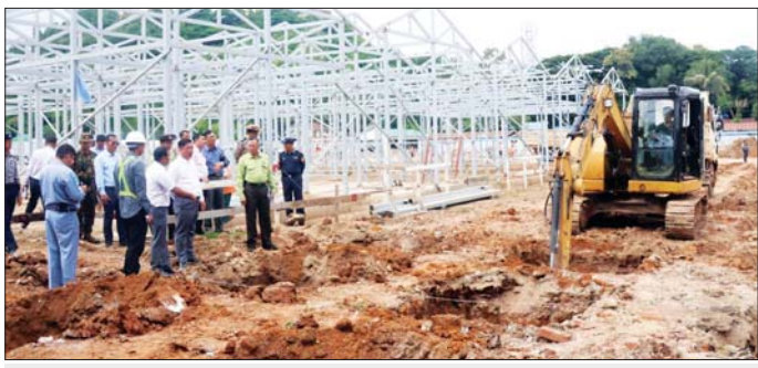
ကယားပြည်နယ်ဝန်ကြီးချုပ် ဦးဇော်မျိုးတင် သီရိမင်္ဂလာဈေးအသစ် တည်ဆောက်ရေးလုပ်ငန်းခွင်သို့ သွားရောက်ကြည့်ရှုစစ်ဆေးစဉ်။

အမြန်ဆုံးရောင်းဝယ်နိုင်ရေး၊ ဈေးကောက်နှုန်းထားများ သတ်မှတ်ချက်နှင့်အညီ ကောက်ခံရေတို့ကို ကြည့်ရှုစစ်ဆေးခဲ့ပြီး လုပ်ငန်းများပြီးစီးနိုင်မည့် အခြေအနေများနှင့်စပ်လျဉ်း၍ သက်ဆိုင်ရာတာဝန်ရှိသူများက ရှင်းလင်းတင်ပြခဲ့ပြီး တင်ပြမှုများအပေါ် ပြည်နယ်ဝန်ကြီးချုပ်က ဈေးတည်ဆောက်မှု လုပ်ငန်းများ သတ်မှတ်ကာလအတွင်း အချိန်မီပြီးစီးရေးနှင့် ဆောက်လုပ်ရေးသုံးပစ္စည်းများ သတ်မှတ်အရည်အသွေးပြည့်မီစေရေးတို့ကို သက်ဆိုင်ရာတာဝန်ရှိသူများက စစ်ဆေးကြပ်မတ်သွားရန် မှာကြားသည်။