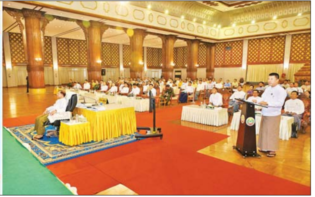
နိုင်ငံတော်စီမံအုပ်ချုပ်ရေးကောင်စီဥက္ကဋ္ဌ နိုင်ငံတော်ဝန်ကြီးချုပ် ဗိုလ်ချုပ်မှူးကြီး မင်းအောင်လှိုင် အား ရောဂါတိုင်းဒေသကြီး ဝန်ကြီးချုပ်က ရှင်းလင်းတင်ပြစဉ်။