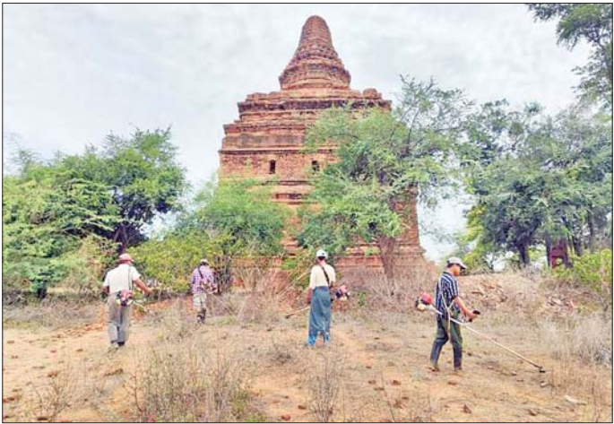
ထို့အပြင် ခရီးသွားဧည့်သည်များ၊ လေ့လာသူများ စိတ်ဝင်စားရာဒေသဖြစ်၍ လာရောက်သော ဧည့်သည်များ ပုဂံ၏ အလှသဘာဝကို ကောင်းစွာခံစားနိုင်ရန်၊ ဘေးအန္တရာယ်ကင်းစေရန်နှင့် အမွေအနှစ် အဆောက်အအုံများ သန့်ရှင်းသပ်ရပ်၍ ရေရှည်တည်တံ့စေရန် ရည်ရွယ်ပြီး နှစ်ပတ်လည် ပုံမှန် ဆောင်ရွက်ရန် စီမံချက်ရေးဆွဲပြီး ရေိယာ (၁၁) ပိုင်း သတ်မှတ်၍ ရှေးဟောင်းအဆောက်အအုံများ

ရန်ကုန် စက်တင်ဘာ ၁ ပုဂံကမ္ဘာ့အမွေအနှစ်ဒေသအတွင်း ရေိယာ(၁၁) ပိုင်း သန့်ရှင်းရေးလုပ်ငန်း တစ်ပတ်လည် ပြီးစီး၍ ရေိယာ (C နှင့် E) ကိုစတင်ဆောင်ရွက်ရာတွင် ဘုရားအစုများကို မြင်ကွင်းကွယ်စေသော ချွန်နယ် ပိတ်ပေါင်းများရှင်းလင်းခြင်းနှင့် ငှက်များ တူးထုတ်ခြင်းလုပ်ငန်းများကိုပါ ထပ်ဖြည့်ဆောင်ရွက်နေကြောင်း Bagan Archip သိရသည်။ ပုဂံဘုရားများ၏ မြင်ကွင်းကို နှောင့်ယှက်လျက် ရှိသော ဒေသမျိုးရင်း မဟုတ်သည့် ကမ္ဘာ့ရေပင်နှင့် သစ်တောများကို ကြီးစားရှင်းလင်းနေ၍ ယခင်က မမြင်မတွေ့ရဖူးသည့် ပုဂံ၏ရှုခင်းများကိုကြာစီဖူးမြော်ခွင့်ရကြတော့မည်ဖြစ်ကြောင်း ရှေးဟောင်း သုတေသနနှင့် အမျိုးသားပြုတိုက်ဦးစီးဌာနမှ ညွှန်ကြားရေးမှူး ဦးကျော်မျိုးဝင်းက ၎င်း၏ လူမှုကွန်ရက် စာမျက်နှာမှတစ်ဆင့် ပြီးခဲ့သည့်ရက်ပိုင်းက အသိပေး ရေးသားခဲ့သည်။ ပုဂံဒေသသည်ဇေတီပုထိုး၊ဂူကျောင်းများပေါများပြီး ရေိယာအားဖြင့်လည်း ကျယ်ပြန့်သော အမွေအနှစ်များ ပေါကြွယ်ဝသည့် ဒေသတစ်ခုဖြစ်၍ ကမ္ဘာ့အမွေအနှစ်စာရင်းဝင် ဒေသတစ်ခုဖြစ်သည်။