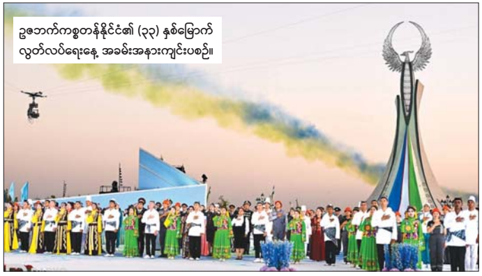
ဥဇောက်ကစွတန်နိုင်ငံ၏ (၃၃) နှစ်မြောက် လွတ်လပ်ရေးနေ့ အခမ်းအနားကျင်းပစဉ်။

ပြည်တွင်းအသားတင် ထုတ်ကုန် (ဂျီဒီပီ) သည် ၂၀၂၃ ခုနှစ်တွင် ပထမဆုံးအကြိမ် အမေရိကန်ဒေါ်လာဘီလီယံ ၁၀၀ ကျော်သွားခဲ့ကြောင်း သိရသည်။ ထို့အပြင် ကမ္ဘာ့ဘဏ်ကလည်း ယခုနှစ်တွင် အဆိုပါနိုင်ငံ၏ ဂျီဒီပီ ၅ ဒသမ ၃ ရာခိုင်နှုန်း တိုးတက်မည်ဟု ခန့်မှန်းထားသည်။ ယင်းသည် လူမှုကဏ္ဍတိုးတက် မြှင့်တင်ရေးနှင့် အရည်အသွေးမြင့် ပညာရေးစနစ် ထူထောင်နိုင်ရေး ကြိုးပမ်းအားထုတ်မှုများကို ထပ်ဟပ်စေခဲ့ကြောင်း၊ ထို့အတူတိုင်းပြည်၏ အနာဂတ်နှင့်ကောင်းမွန်သော စိတ်ကူးစိတ်သန်းများကို အကောင်အထည်ဖော်နိုင်ရေးသည် လူငယ်များ၏အသိပညာနှင့် အလားအလာများအပေါ်တွင် များစွာမူတည်သည်ဟု ၎င်းက ဆိုသည်။ ဆင်ဟွာ