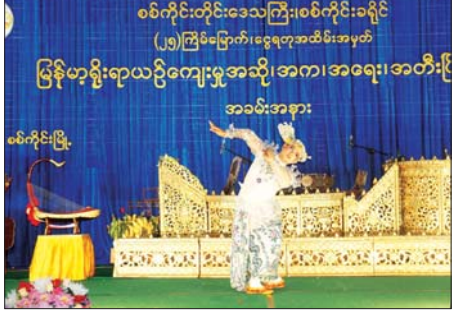
စစ်ကိုင်းတိုင်းဒေသကြီး၊ စစ်ကိုင်းခရိုင် (၂၅)ကြိမ်မြောက် ငွေရတု အဆို၊ အက၊ အရေး၊ အတီးပြိုင်ပွဲ ဖြစ်ပွားနေသည့် အခမ်းအနား

အောင်မြင်ရေး ကြိုးပမ်းကြရာမှာ ပြိုင်ပွဲဝင်အနုပညာရှင်များ ဖြစ်ကြောင်း ခရိုင်/တိုင်းဒေသကြီး နိုင်ငံ့ဂုဏ်ဆောင်သည့် အနုပညာရှင်များဖြစ်အောင် ကြိုးစားကြရန် ပြောကြားခဲ့ပြီး တာဝန်ရှိသူများနှင့်အတူ ပြိုင်ပွဲအား ဖဲကြီးဖြတ်ဖွင့်လှစ်ပေးခဲ့သည်။