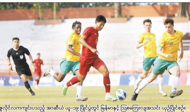
ရူလိုင်လကကျင်းပသည့် အာဆီယံ ယူ-၁၉ ဖြိုင်ပွဲတွင် မြန်မာနှင့် သြစတြေးလျအသင်း ယှဉ်ပြိုင်စဉ်။

ရန်ကုန် စက်တင်ဘာ ၁ မြန်မာ ယူ-၁၉ အသင်းသည် စက်တင်ဘာနေ့က ဆုံးပတ်တွင် ယှဉ်ပြိုင်ရမည့် ၂၀၂၅ အာရှဖလား ယူ-၂၀ ခြေစစ်ပွဲအကြိုပြိုင်ဆင်မှု အဖြစ် ထိုင်းနိုင်ငံ၌ ခြေစမ်းပွဲများ ယှဉ်ပြိုင်ကစားမည်ဖြစ်သည်။ မြန်မာ ယူ-၁၉ အသင်းသည် စက်တင်ဘာ ၁ ရက်မှ ၁၄ ရက် အထိ နှစ်ပတ်ကြာ ထိုင်းနိုင်ငံ၌ လေ့ကျင့်မည်ဖြစ်ပြီး ခြေစမ်းပွဲ ငါးပွဲ ယှဉ်ပြိုင်ကစားမည်ဖြစ် သည်။ မြန်မာ ယူ-၁၉ အသင်းသည် စာမျက်နှာ ၈ ကော်လံ ၄ ❖