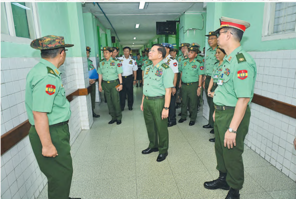
နိုင်ငံတော်စီမံအုပ်ချုပ်ရေးကောင်စီဥက္ကဋ္ဌ တပ်မတော်ကာကွယ်ရေးဦးစီးချုပ် ဗိုလ်ချုပ်မှူးကြီးမင်းအောင်လှိုင် ရန်ကုန်မြို့ရှိ တပ်မတော်အရုံးရောဂါ အထူးကုဆေးရုံကြီးအတွင်း လှည့်လည်ကြည့်ရှုစဉ်။

ဦးစာမျက်နှာ ၁၁ မှအဆက် သင်တန်းသားများအနေဖြင့် ကြိုးစား အားထုတ်မှုအပြည့်ဖြင့် လေ့ကျင့်သင်ကြား ကြရန်လိုကြောင်း။