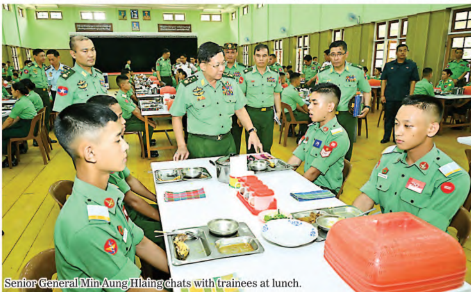
Senior General Min Aung Hlaing chats with trainees at lunch.

Doctors provide medical treatment and nurses, medical care. Everyone loves kindness and people with ill health want medical treatment that comes together with kindness. Trainees of DSINPS already have