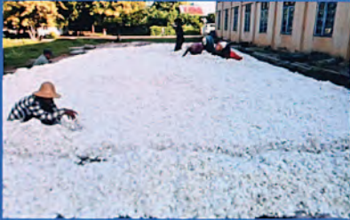
ဝါလှန်ခြင်း မှတ်တမ်းတင်ပုံ