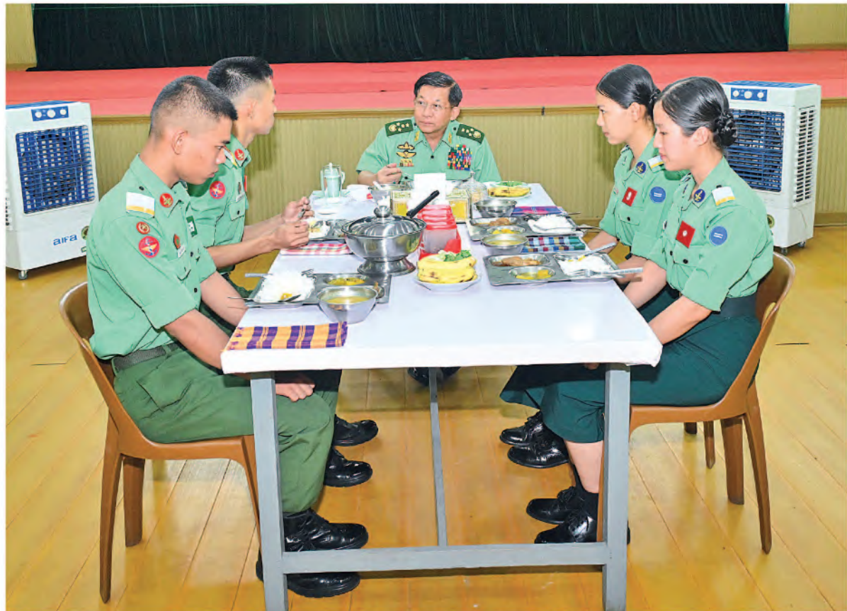
နိုင်ငံတော်စီမံအုပ်ချုပ်ရေးကောင်စီဥက္ကဋ္ဌ တပ်မတော်ကာကွယ်ရေးဦးစီးချုပ် ဗိုလ်ချုပ်မှူးကြီးမင်းအောင်လှိုင် တပ်မတော်ဆေးတက္ကသိုလ်မှ ဗိုလ်လောင်းများနှင့်အတူ နေ့လယ်စာကိုအတူတကွသုံးဆောင်စဉ်။

ကျွမ်းကျင်သည့်ဆေးဘက်ဆိုင်ရာ အရာရှိကောင်းများ၊ သူ့မှာပြုများ၊ ဆေးဝါးကျွမ်းကျင်သူများ၊ ဆေးဘက်ပညာသည်များ၊ မွေးထုတ်ပေးနိုင်ရမည့် ဦးစွာ နိုင်ငံတော်စီမံအုပ်ချုပ်ရေးကောင်စီ