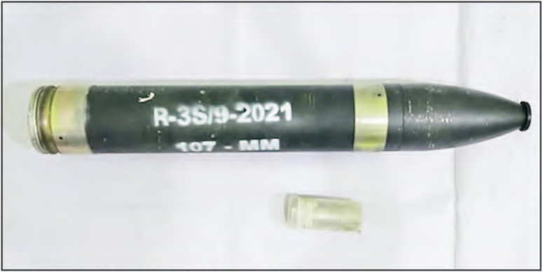
၂၀၂၄ ခုနှစ်၊ ဇွန်လ ၈ ရက်တွင် သိမ်းဆည်းရမိ။