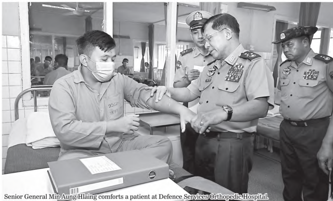
Senior General Min Aung Hlaing comforts a patient at Defence Services Orthopaedic Hospital.

Afterward, the Senior General heard reports on health-care services and operations of the hospital presented by the commandant of the hospital at the meeting hall of the hospital. After hearing the reports, the Senior General discussed measures for the clear-