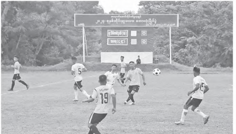
အနောက်တောင်တိုင်းစစ်ဌာနချုပ်၌ ၂၀၂၄ ခုနှစ်၊ တိုင်းမှူးဒိုင်းဘောလုံးပြိုင်ပွဲ ပထမနေပွဲစဉ် ယှဉ်ပြိုင်နေမှုကိုတွေ့ရစဉ်။