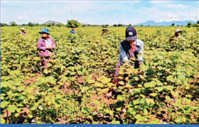
ဝါကောက်ယူနေမှု မှတ်တမ်းတင်ပုံ