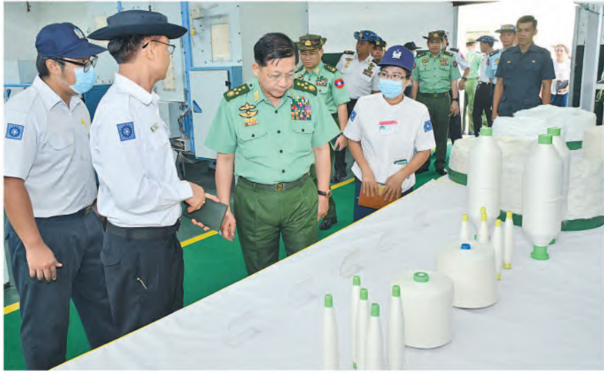
နိုင်ငံတော်စီမံအုပ်ချုပ်ရေးကောင်စီဥက္ကဋ္ဌ တပ်မတော်ကာကွယ်ရေးဦးစီးချုပ် ဗိုလ်ချုပ်မှူးကြီးမင်းအောင်လှိုင် တပ်မတော်ချည်မျှင်နှင့်အထည်စက်ရုံ(သမိုင်း)အတွင်း ကြည့်ရှုစစ်ဆေးစဉ်။

ပိတ်ညှိ၊ စွပ်ကျယ်ပိတ်ညှိ၊ ပဝါပိတ်ညှိ၊ သက်န်းများ၊ တက်ထရက်ပိတ်ရောင်စုံ၊ စွပ်ကျယ်ပိတ်ရောင်စုံ၊ ပဝါရောင်စုံ၊ တီရှပ်မျိုးစုံ၊ စပိရပ်မျိုးစုံ၊ နိုင်လွန်တာဖက်တာများ၊ ဆေးဝှမ်းလိပ်များ၊ အိပ်ရာခင်းရောင်စုံတို့အပြင် အဝတ်အထည်နှင့်အသုံးအဆောင်ပစ္စည်းအမျိုးမျိုးတို့ကို အရည်အသွေးပြည့်မီစွာထုတ်လုပ်၍ တပ်မတော်၏လိုအပ်ချက်နှင့် ပြည်တွင်းဈေးကွက်လိုအပ်ချက်အား ဈေးနှုန်းသက်သာစွာဖြင့် တစ်ဖက်တစ်လမ်းမှ ဖြည့်ဆည်းဆောင်ရွက်ပေးလျက်ရှိကြောင်း သတင်းရရှိသည်။ (၁၀၀)