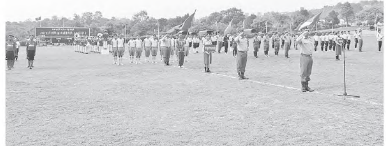
အရှေ့ပိုင်းတိုင်းစစ်ဌာနချုပ်၌ ၂၀၂၄ ခုနှစ်၊ တိုင်းမှူးဒိုင်းဘောလုံးပြိုင်ပွဲဖွင့်ပွဲကျင်းပစဉ်။

အရှေ့ပိုင်းတိုင်းစစ်ဌာနချုပ်၊ အရှေ့အလယ်ပိုင်းတိုင်းစစ်ဌာနချုပ်နှင့် အနောက်တောင်တိုင်းစစ်ဌာနချုပ်တို့၏ ၂၀၂၄ ခုနှစ်၊ တိုင်းမှူးဒိုင်းဘောလုံးပြိုင်ပွဲ ဖွင့်ပွဲများကို ယနေ့ညနေပိုင်းတွင် တိုင်းစစ်ဌာနချုပ်အသီးသီးရှိ အားကစားကွင်းများ၌ ပြုလုပ်ရာ သက်ဆိုင်ရာတိုင်းစစ်ဌာနချုပ်များမှ တိုင်းမှူးများနှင့်တပ်မတော်အရာရှိကြီးများ၊ အရာရှိ၊ စစ်သည်၊ မိသားစုဝင်များ၊ ပြိုင်ပွဲဝင်အားကစားသမားများ၊ ဒိုင်အဖွဲ့ဝင်များ၊ အားကစားဝါသနာရှင်များနှင့် ဖိတ်ကြားထားသူများ တက်ရောက်ကြသည်။