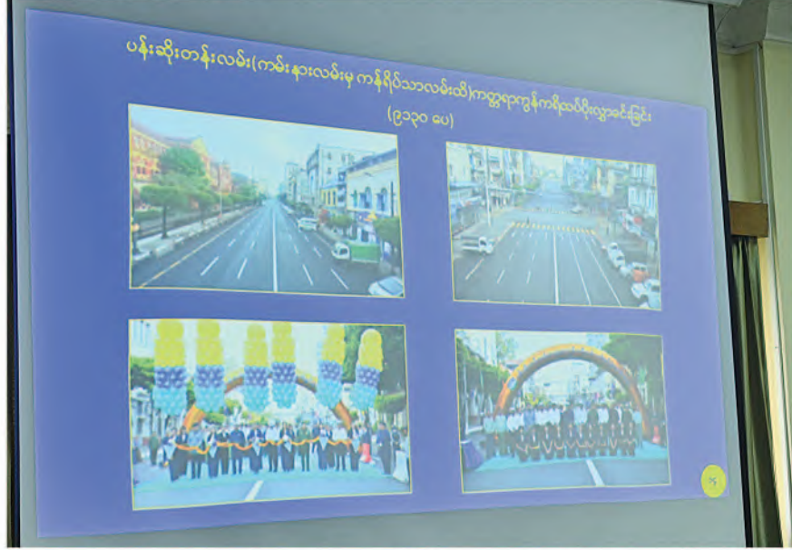
နိုင်ငံတော်စီမံအုပ်ချုပ်ရေးကောင်စီဥက္ကဋ္ဌ နိုင်ငံတော်ဝန်ကြီးချုပ် ဗိုလ်ချုပ်မှူးကြီးမင်းအောင်လှိုင်အား ရန်ကုန်တိုင်းဒေသကြီးဝန်ကြီးချုပ် ဦးစိုးသိန်းက ရန်ကုန်တိုင်းဒေသကြီး ဖွံ့ဖြိုးတိုးတက်ရေးဆောင်ရွက်လျက်ရှိမှု၊ လမ်းပန်းဆက်သွယ်မှုများ တိုးတက်ကောင်းမွန်စေရေးဆောင်ရွက်လျက်ရှိမှု အခြေအနေများနှင့်ပတ်သက်၍ ရှင်းလင်းတင်ပြစဉ်။