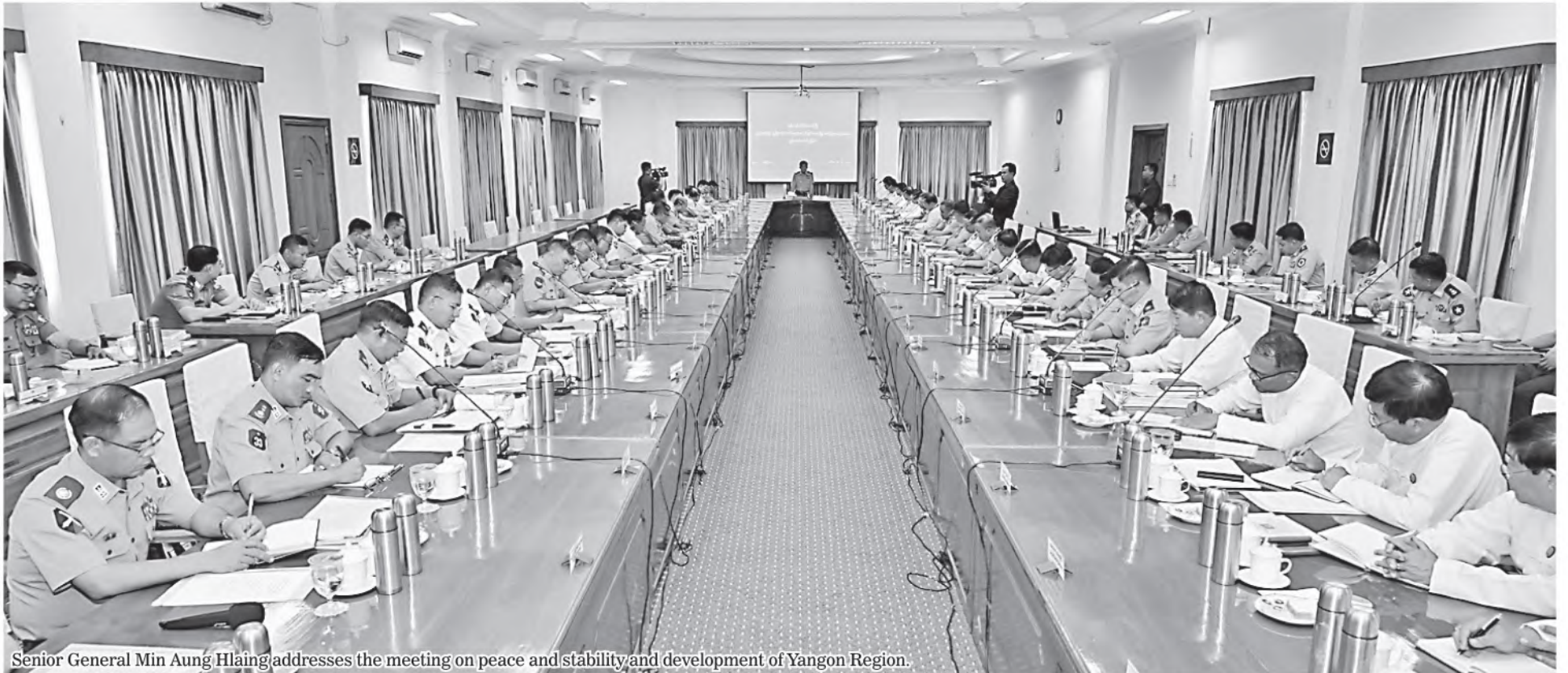
Senior General Min Aung Hlaing addresses the meeting on peace and stability and development of Yangon Region.

Chairman of the State Administration Council Prime Minister Senior General Min Aung Hlaing delivered a speech at the meeting on peace and stability and development of Yangon Region at the meeting hall of Konmyinthathar in Yangon Region this afternoon.