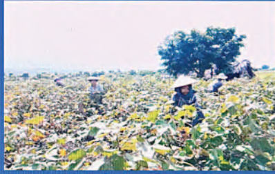
ဝါကောက်ယူနေမှု မှတ်တမ်းတင်ပုံ