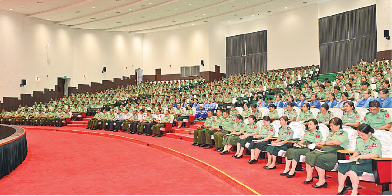
နိုင်ငံတော်စီမံအုပ်ချုပ်ရေးကောင်စီဥက္ကဋ္ဌ တပ်မတော်ကာကွယ်ရေးဦးစီးချုပ် ဗိုလ်ချုပ်မှူးကြီးမင်းအောင်လှိုင် တပ်မတော်သူနာပြုနှင့်ဆေးဘက်ပညာတက္ကသိုလ်၌ ကျောင်းအုပ်ကြီး၊ နည်းပြအရာရှိကြီးများ၊ ကထိကအရာရှိကြီးများ၊ ဆရာ၊ ဆရာမကြီးများ၊ သန္ဓေအရာရှိများနှင့် သင်တန်းသား၊ သင်တန်းသူများအား တွေ့ဆုံအမှာစကားပြောကြားစဉ်။

နေပြည်တော် ၉ နံ ၁၀ နိုင်ငံတော်စီမံအုပ်ချုပ်ရေးကောင်စီဥက္ကဋ္ဌ တပ်မတော်ကာကွယ်ရေးဦးစီးချုပ် ဗိုလ်ချုပ်မှူးကြီးမင်းအောင်လှိုင်သည် ယနေ့မွန်းလွဲပိုင်းတွင် တပ်မတော်ဆေးတက္ကသိုလ်နှင့် တပ်မတော်သူနာပြုနှင့်ဆေးဘက်ပညာတက္ကသိုလ်တို့မှ ကျောင်းအုပ်ကြီးများ၊ နည်းပြအရာရှိကြီးများ၊ ကထိကအရာရှိကြီးများ၊ ဆရာ၊ ဆရာမကြီးများ၊ သန္ဓေအရာရှိများနှင့် မဟာဘွဲ့လွန်သင်တန်းသားများ၊ ဗိုလ်လောင်းများ၊ သင်တန်းသား၊ သင်တန်းသူများအား တက္ကသိုလ်အလိုက် ဘွဲ့နှင့်သဘင်ခန်းမများ၌ သီးခြားစီတွေ့ဆုံ၍ အမှာစကားပြောကြားသည်။ အဆိုပါတွေ့ဆုံပွဲများသို့ နိုင်ငံတော်စီမံအုပ်ချုပ်ရေးကောင်စီဥက္ကဋ္ဌ တပ်မတော်ကာကွယ်ရေးဦးစီးချုပ်နှင့်အတူ ကာကွယ်ရေးဦးစီးချုပ်(ရေ) ဒုတိယဗိုလ်ချုပ်ကြီးဖွဲ့ဝင်းမြင့်၊ စာမျက်နှာ ၁၆ ကော်လံ ၁ ခု