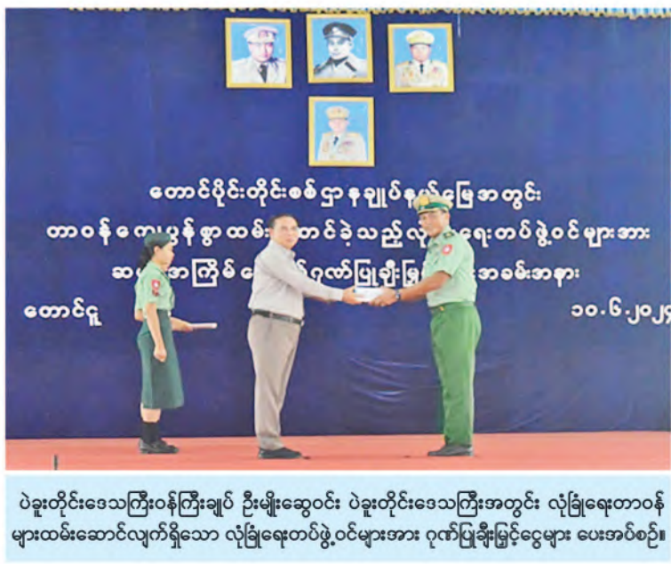
ပဲခူးတိုင်းဒေသကြီးဝန်ကြီးချုပ် ဦးမျိုးဆွေဝင်း၊ ပဲခူးတိုင်းဒေသကြီးအတွင်း လုံခြုံရေးတာဝန် များထမ်းဆောင်လျက်ရှိသော လုံခြုံရေးတပ်ဖွဲ့ဝင်များအား ဂုဏ်ပြုချီးမြှင့်ငွေများ ပေးအပ်စဉ်။

အဖြစ် ခန့်အပ်တာဝန်ပေးခြင်းခံရသည့် အတွက် ဂုဏ်ယူခံမြှောက်ကြောင်းပြော ကြားခဲ့ပြီး မြန်မာ-သီရိလင်္ကာ နှစ်နိုင်ငံ အကြား ရှိရင်းစွဲချစ်ကြည်ရင်းနှီးသော ဆက်ဆံရေးနှင့်အကျိုးတူပူးပေါင်းဆောင်ရွက် မှုများ ပိုမိုမြှင့်တင်ရေး၊ မြန်မာနိုင်ငံရောက် သီရိလင်္ကာနိုင်ငံသားများအတွက် ကောင်စစ် ဆိုင်ရာ အကူအညီပေးနိုင်ရေးကိစ္စရပ်များ အပေါ် ရင်းနှီးပွင့်လင်းစွာ အမြင်ချင်းဖလှယ် ဆွေးနွေးကြသည်။ (သတင်းစဉ်)