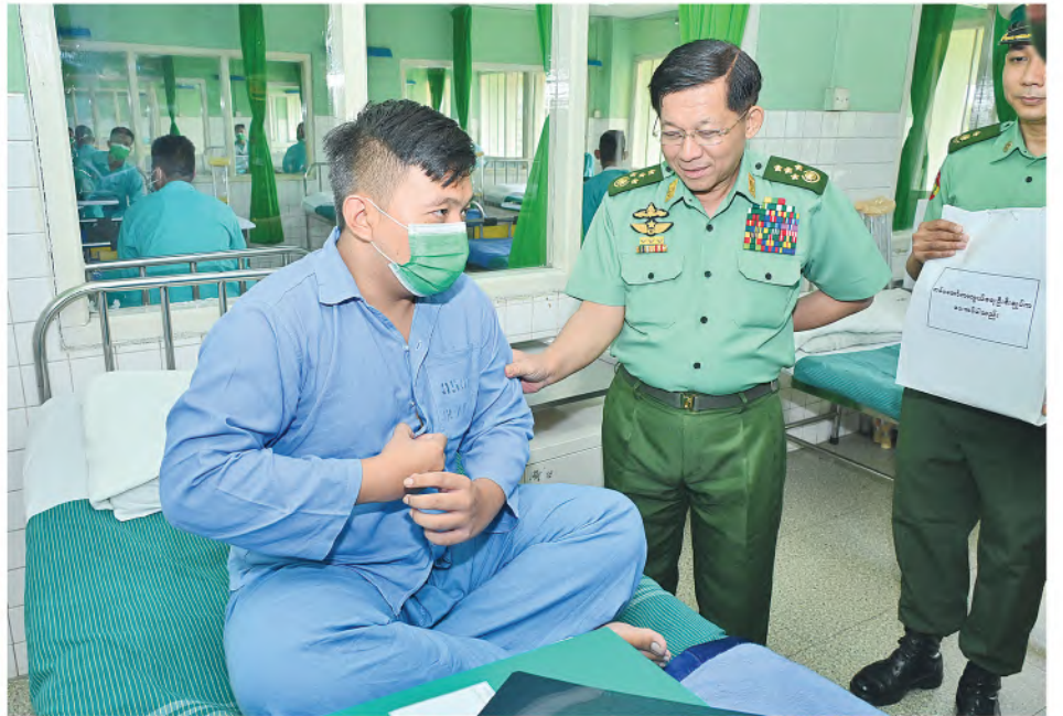
နိုင်ငံတော်စီမံအုပ်ချုပ်ရေးကောင်စီဥက္ကဋ္ဌ တပ်မတော်ကာကွယ်ရေးဦးစီးချုပ် ဗိုလ်ချုပ်မှူးကြီးမင်းအောင်လှိုင် ဆေးရုံတက်ရောက်ကုသမှုခံယူလျက်ရှိသည့် နိုင်ငံတော်ကာကွယ်ရေးနှင့်လုံခြုံရေးတာဝန်များထမ်းဆောင်စဉ် ထိခိုက်ဒဏ်ရာ ရရှိခဲ့သော အရာရှိ၊ စစ်သည်များ၏ထိခိုက်ဒဏ်ရာရရှိခဲ့မှုအခြေအနေများ၊ ရောဂါကုသပျောက်ကင်းမှုအခြေအနေများကို တစ်ဦးချင်းလိုက်လံတွေ့ဆုံ၍ ရင်းနှီးနှေးထွေးစွာမေးမြန်းပြီး အားပေးစကားပြောကြားစဉ်။