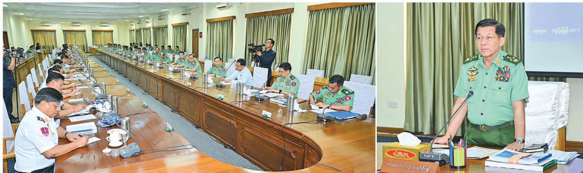
နိုင်ငံတော်စီမံအုပ်ချုပ်ရေးကောင်စီဥက္ကဋ္ဌ နိုင်ငံတော်ဝန်ကြီးချုပ် ဗိုလ်ချုပ်မှူးကြီးမင်းအောင်လှိုင် ရန်ကုန်တိုင်းဒေသကြီး တည်ငြိမ်အေးချမ်းရေးနှင့်ဖွံ့ဖြိုးတိုးတက်ရေးအစည်းအဝေးတွင် အဖွင့်အမှာစကားပြောကြားစဉ်။

ရန်ကုန်တိုင်းဒေသကြီးတည်ငြိမ်အေးချမ်းရေးနှင့်ဖွံ့ဖြိုးတိုးတက်ရေးအစည်းအဝေးကို ယနေ့ညနေပိုင်းတွင် ရန်ကုန်တိုင်းဒေသကြီး၊ ကုန်းမြင့်သာရှိ အစည်းအဝေးခန်းမ၌ကျင်းပရာ နိုင်ငံတော်စီမံအုပ်ချုပ်ရေးကောင်စီဥက္ကဋ္ဌ နိုင်ငံတော်ဝန်ကြီးချုပ် ဗိုလ်ချုပ်မှူးကြီးမင်းအောင်လှိုင် တက်ရောက်အမှာစကားပြောကြားသည်။