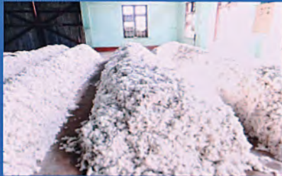
ဝါများလိုလှောင်ထားခြင်း မှတ်တမ်းတင်ပုံ