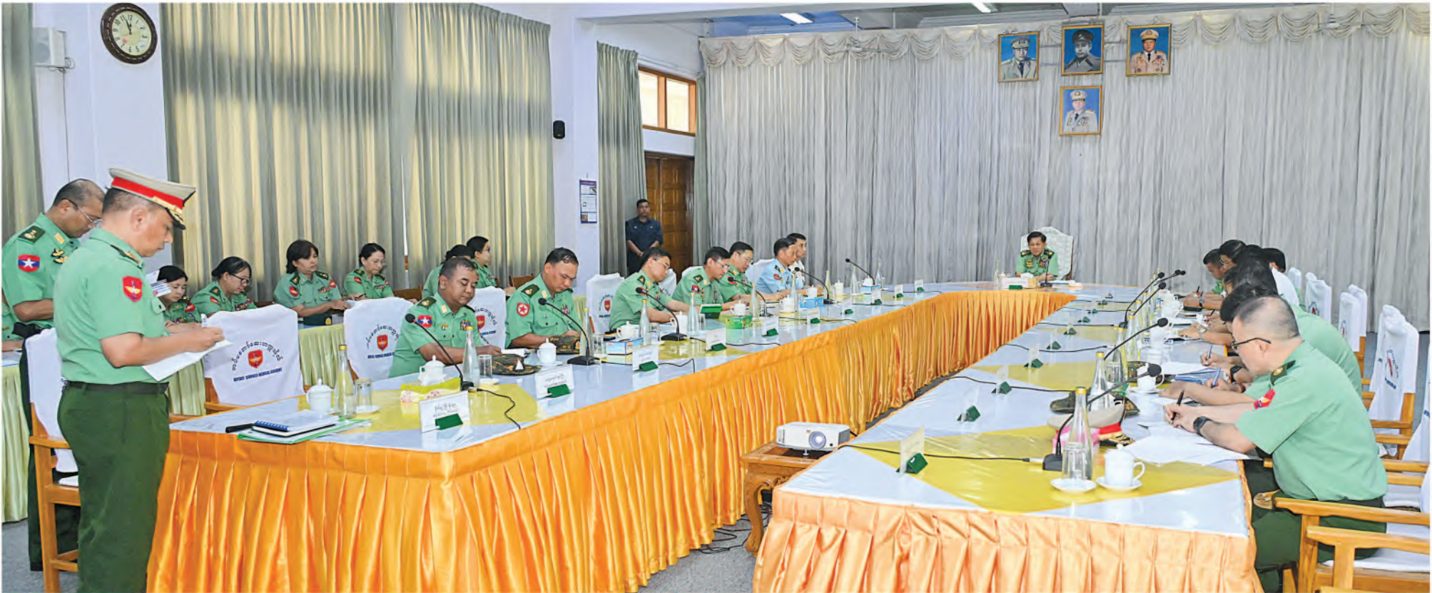
နိုင်ငံတော်စီမံအုပ်ချုပ်ရေးကောင်စီဥက္ကဋ္ဌ တပ်မတော်ကာကွယ်ရေးဦးစီးချုပ် ဗိုလ်ချုပ်မှူးကြီးမင်းအောင်လှိုင်အား တပ်မတော်ဆေးတက္ကသိုလ် ခေတ္တကျောင်းအုပ်ကြီးက လေ့ကျင့်ရေးပိုင်းဆိုင်ရာဆောင်ရွက်နေမှုအခြေအနေများကို ရှင်းလင်းတင်ပြစဉ်။