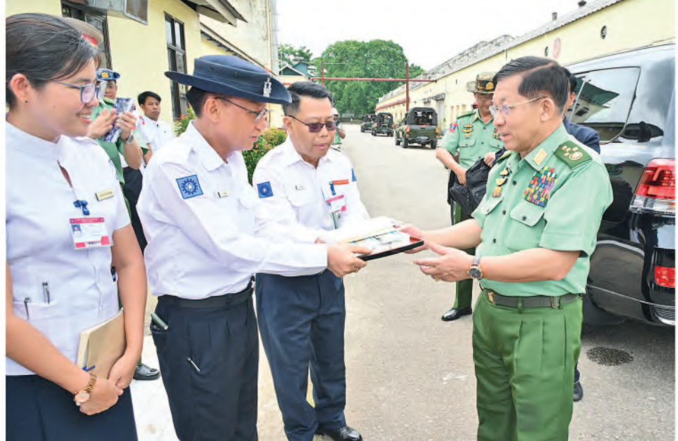
နိုင်ငံတော်စီမံအုပ်ချုပ်ရေးကောင်စီဥက္ကဋ္ဌ တပ်မတော်ကာကွယ်ရေးဦးစီးချုပ် ဗိုလ်ချုပ်မှူးကြီးမင်းအောင်လှိုင် တပ်မတော်ချည်မျှင်နှင့်အထည်စက်ရုံ(သမိုင်း)အတွင်း ချည်မျှင်နှင့်အထည်များအား အဆင့်ဆင့်ထုတ်လုပ်နေမှုအခြေအနေများကိုလှည့်လည်ကြည့်ရှုစစ်ဆေးစဉ်။