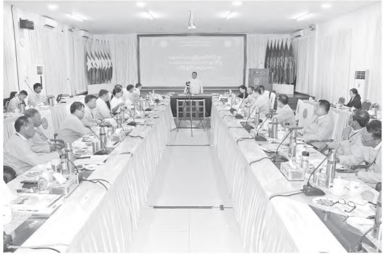
သန်းကို အကျိုးပြုနိုင်ခဲ့ကြောင်း။ ဆီထွက်သီးနှံနှင့်ဝါအပါအဝင် စီမံကိန်းဝင် သီးနှံများ စိုက်ပျိုးထုတ်လုပ်ရေးဆောင်ရွက် ရာတွင် လိုအပ်သည့်သွင်းအားစုနှင့် ငွေကြေး အရင်းအနှီးများအား မြစ်စိမ်းရောင်ကျေးရွာ စီမံကိန်း၊ ကျေးလက်စီးပွားမြှင့်တင်ရေး

မီးလင်းရေးကျေးရွာ ၉၄၀၊ ဆိုလာစိုက်ပျိုး ရေတင်စနစ်လုပ်ငန်း ၉၈ ခု၊ ကျေးလက် ကုန်ထုတ်လမ်း ၅၃၂ မိုင်၊ ကုန်ထုတ် တံတား ၁၁၅၉ စင်း၊ ကျေးလက်အိမ်ရာ ၃၂ လုံး၊ မြစ်စိမ်းရောင်ကျေးရွာစီမံကိန်း ကျေးရွာ ၂၄၃ ယူနစ်၊ ကျေးရွာဖွံ့ဖြိုးတိုးတက် ရေးလုပ်ငန်းစီမံကိန်း ၁၈၆၄ ရွာ၊ ခေတ်မီ စံပြကျေးရွာထူထောင်ရေးစီမံကိန်း ၄၅ ရွာ၊ ကျေးလက် စီးပွားမြှင့်တင်ရေးရန်ပုံငွေ ထူထောင်ခြင်းလုပ်ငန်း ၅၂ ယူနစ်၊ Cash for Work စီမံကိန်းကျေးရွာ ၉၈ ရွာ၊ အသက် မွေးဝမ်းကျောင်းသင်တန်း ၄၁၂ ကြိမ်တို့ကို အောင်မြင်စွာအကောင်အထည်ဖော်ဆောင် ရွက်နိုင်ခဲ့ကြောင်း၊ ဒေသဖွံ့ဖြိုးရေးစီမံကိန်းများ မှ ကျေးရွာပေါင်း ၅၅၃၈ ရွာ၊ အိမ်ထောင်စု ၂ ဒသမ ၄၄ သန်း၊ လူဦးရေ ၁၂ ဒသမ ၉