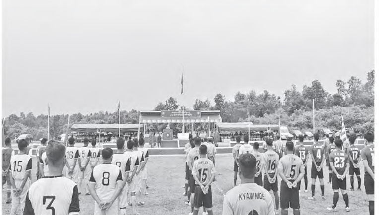
အရှေ့အလယ်ပိုင်းတိုင်းစစ်ဌာနချုပ် တိုင်းမှူး ဗိုလ်ချုပ်မျိုးမင်းထွန်း ၂၀၂၄ ခုနှစ်၊ တိုင်းမှူးဒိုင်းဘောလုံးပြိုင်ပွဲဖွင့်ပွဲတွင် အမှာစကားပြောကြားစဉ်။

ဦးစွာ တိုင်းမှူးများနှင့် တာဝန်ရှိသူများက အဖွင့်အမှာစကားများ အသီးသီးပြောကြားကြသည်။ ထို့နောက် တိုင်းမှူးများနှင့် တက်ရောက်လာကြသူများက ပြိုင်ပွဲဝင်အသင်းများ၏ ပထမနေပွဲစဉ်ယှဉ်ပြိုင်နေမှုများကို ကြည့်ရှုအားပေးကြသည်။ အဆိုပါဘောလုံးပြိုင်ပွဲကို တိုင်းစစ်ဌာနချုပ်များနှင့် ကွပ်ကဲမှုအောက်ရှိ တပ်နယ်အသီးသီးမှ ပြိုင်ပွဲဝင်အသင်း ၉ သင်းစီဖြင့် ယှဉ်ပြိုင်ကစားသွားမည်ဖြစ်ကြောင်း သတင်းရရှိသည်။ (၁၀၀)