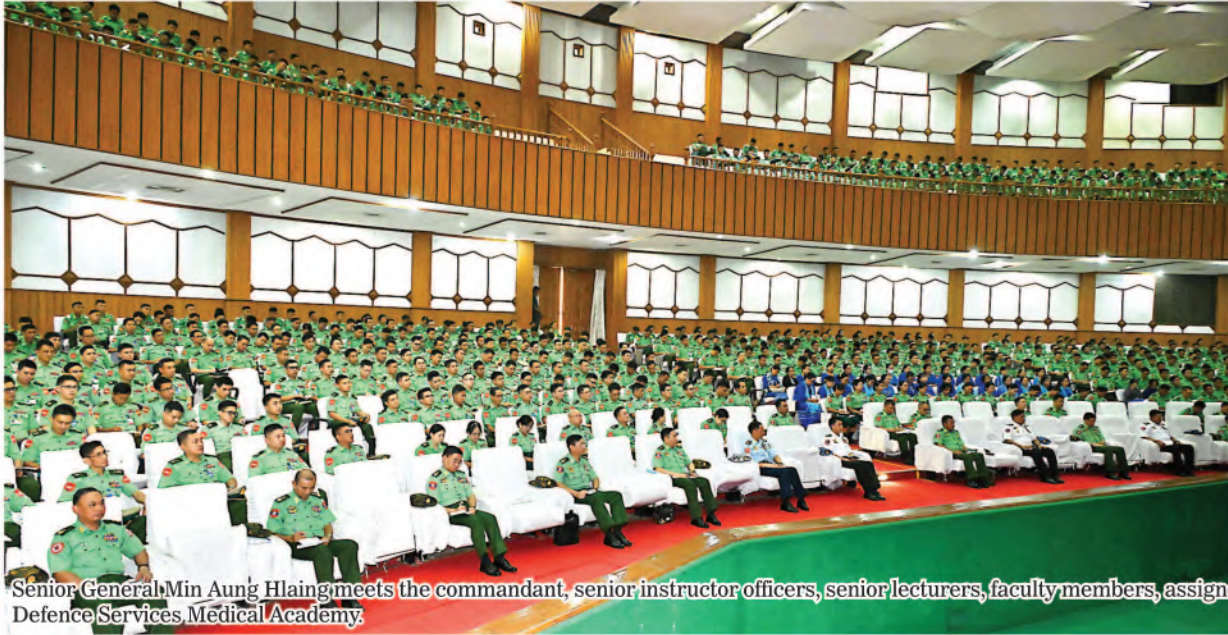
Senior General Min Aung Hlaing meets the commandant, senior instructor officers, senior lecturers, faculty members, assigned officers, students of master's degree courses, cadets, and trainees of Defence Services Medical Academy.