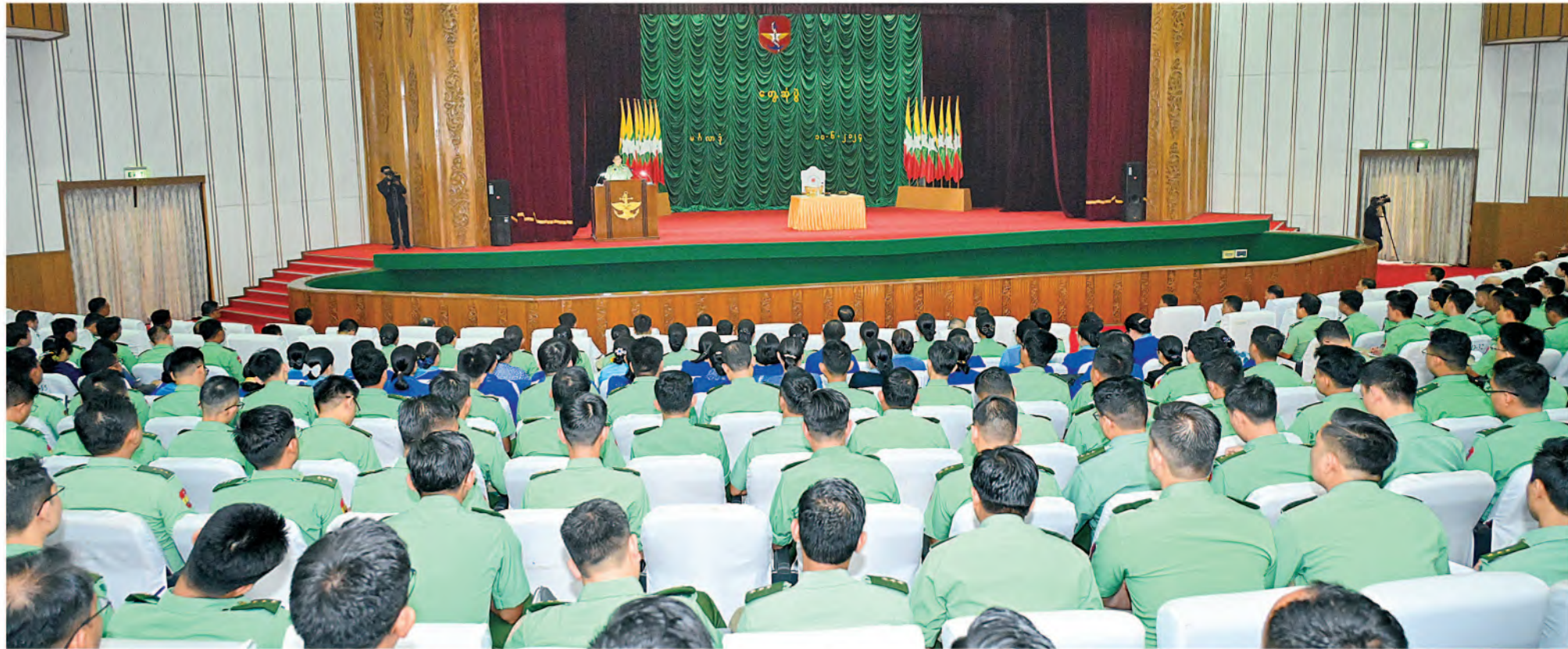
နိုင်ငံတော်စီမံအုပ်ချုပ်ရေးကောင်စီဥက္ကဋ္ဌ တပ်မတော်ကာကွယ်ရေးဦးစီးချုပ် ဗိုလ်ချုပ်မှူးကြီးမင်းအောင်လှိုင် တပ်မတော်ဆေးတက္ကသိုလ်၌ ကျောင်းအုပ်ကြီး၊ နည်းပြအရာရှိကြီးများ၊ တထိတအရာရှိကြီးများ၊ ဆရာ၊ ဆရာမကြီးများ၊ သန္ဓေအရာရှိများနှင့် မဟာဘွဲ့လွန်သင်တန်းသားများ၊ ဗိုလ်လောင်းများအား တွေ့ဆုံအမှာစကားပြောကြားစဉ်။