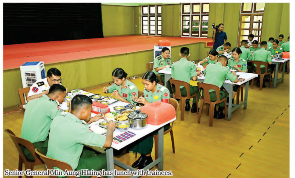
Senior General Min Aung Hlaing has lunch with trainees.

Academy and Military Institute of Nursing and Paramedical Sciences at the convocation halls of the respective universities this afternoon.