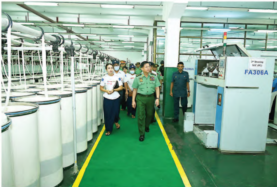
Senior General Min Aung Hlaing goes round in the Tatmadaw Textile and Garment Factory (Thamaing).

duce sufficient quantities. Basic clothing items like t-shirts and undershirts, which are used daily, should be produced locally in sufficient quantities and sold See Page - 20 ●●