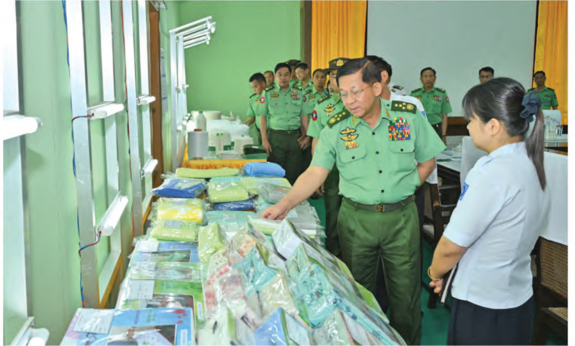
Senior General Min Aung Hlaing views garments and textile products.

Regarding the briefings, the Senior General emphasized the importance of conducting soil quality tests and research activities to ensure the success and productivity of cotton cultivation. He stated that proper land preparation should be done according to soil types, necessary nutrients should be fully provided, and adequate irrigation should be ensured. He also mentioned the need to study and achieve expected yield rates based on soil types. The Tatmadaw should strive to set a good example in cotton cultivation and aim to produce A-grade cotton. Instead of cultivating multiple varieties, the focus should be on cultivating a single variety to produce high-quality cotton. Since good