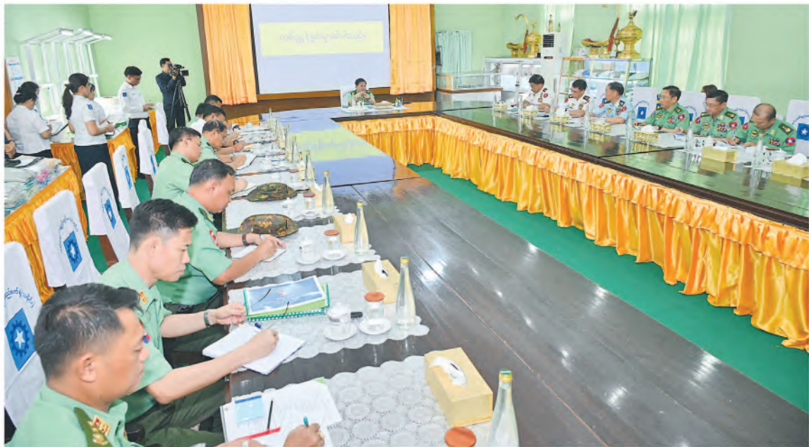
နိုင်ငံတော်စီမံအုပ်ချုပ်ရေးကောင်စီဥက္ကဋ္ဌ တပ်မတော်ကာကွယ်ရေးဦးစီးချုပ် ဗိုလ်ချုပ်မှူးကြီးမင်းအောင်လှိုင် ရှင်းလင်းတင်ပြမှုများအပေါ် လမ်းညွှန်မှာကြားစဉ်။

အဆင့်ဆင့်ဆောင်ရွက်ခဲ့မှုနှင့် ဆက်လက်စိုက်ပျိုးသွားရန် လျာထားဆောင်ရွက်လျက်ရှိမှုအခြေအနေများကိုလည်းကောင်း၊ စက်ရုံများ ဦးခိုင်ရွှေက တပ်မတော်ချည်မျှင်နှင့် အထည်စက်ရုံ(သမိုင်း)အနေဖြင့် နိုင်ငံတော်စီမံအုပ်ချုပ်ရေးကောင်စီဥက္ကဋ္ဌ တပ်မတော်ကာကွယ်ရေးဦးစီးချုပ်၏ လမ်းညွှန်မှာကြားချက်များအပေါ် အကောင်အထည်ဖော်ဆောင်ရွက်လျက်ရှိမှု အခြေအနေများ၊ စက်ရုံသမိုင်းအကျဉ်းနှင့် လုပ်ငန်းလည်ပတ်ဆောင်ရွက်နေမှုအခြေအနေများ၊ ဝန်ထမ်းများခန့်အပ်ထားရှိမှုနှင့် ဝန်ထမ်းများ၏ သက်သာချောင်ချိရေးအတွက် ဆောင်ရွက်ပေးလျက်ရှိမှုအခြေအနေများနှင့် ပတ်သက်၍ လည်းကောင်း အသီးသီးရှင်းလင်းတင်ပြကြသည်။