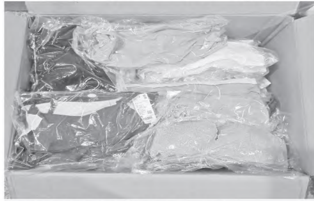
ရန်ကုန်အပြည်ပြည်ဆိုင်ရာလေဆိပ်၌ ဖမ်းဆီးရမိမှု။