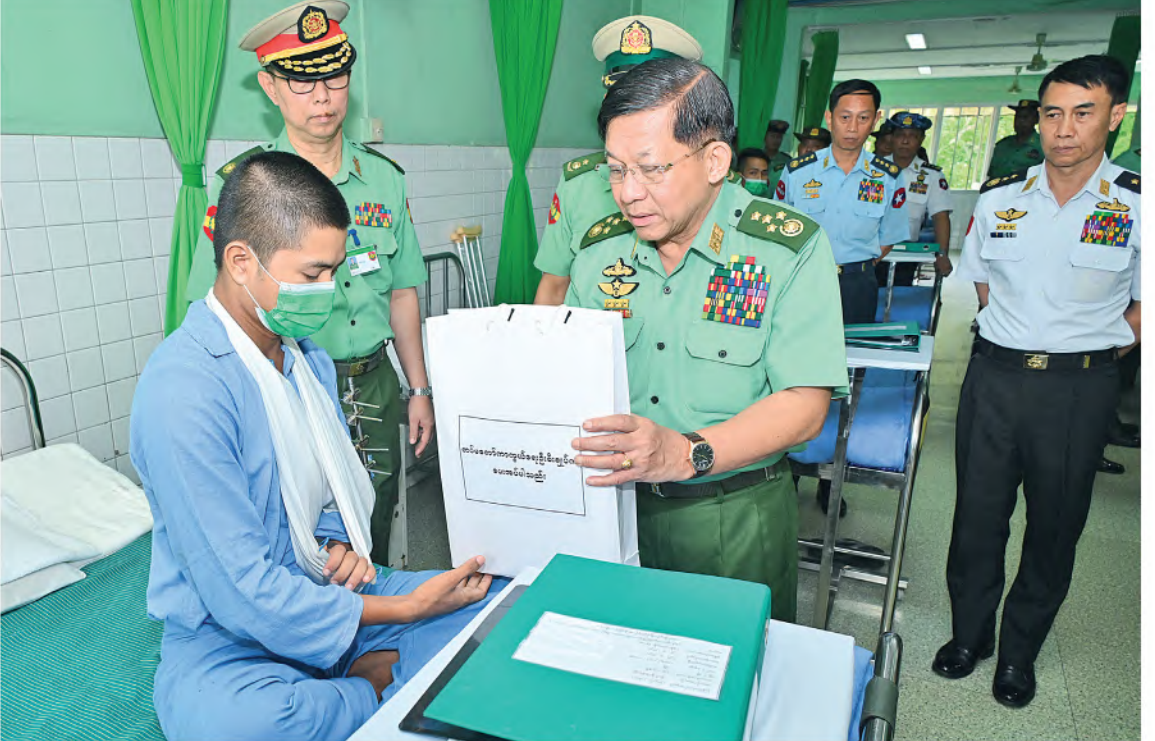
နိုင်ငံတော်စီမံအုပ်ချုပ်ရေးကောင်စီဥက္ကဋ္ဌ တပ်မတော်ကာကွယ်ရေးဦးစီးချုပ် ဗိုလ်ချုပ်မှူးကြီးမင်းအောင်လှိုင် ဆေးရုံတက်ရောက်ကုသမှု ခံယူလျက်ရှိသည့် နိုင်ငံတော်ကာကွယ်ရေးနှင့်လုံခြုံရေးတာဝန်များထမ်းဆောင်စဉ် ထိခိုက်ဒဏ်ရာရရှိခဲ့သော အရာရှိ၊ စစ်သည်များ၏ထိခိုက် ဒဏ်ရာရရှိခဲ့မှုအခြေအနေများ၊ ရောဂါကုသပျောက်ကင်းမှုအခြေအနေများကို တစ်ဦးချင်းလိုက်လံတွေ့ဆုံ၍ ရင်းနှီးနှေးထွေးစွာမေးမြန်းပြီး အားပေးစကားပြောကြားကာ လက်ဆောင်ပစ္စည်းပေးအပ်စဉ်။