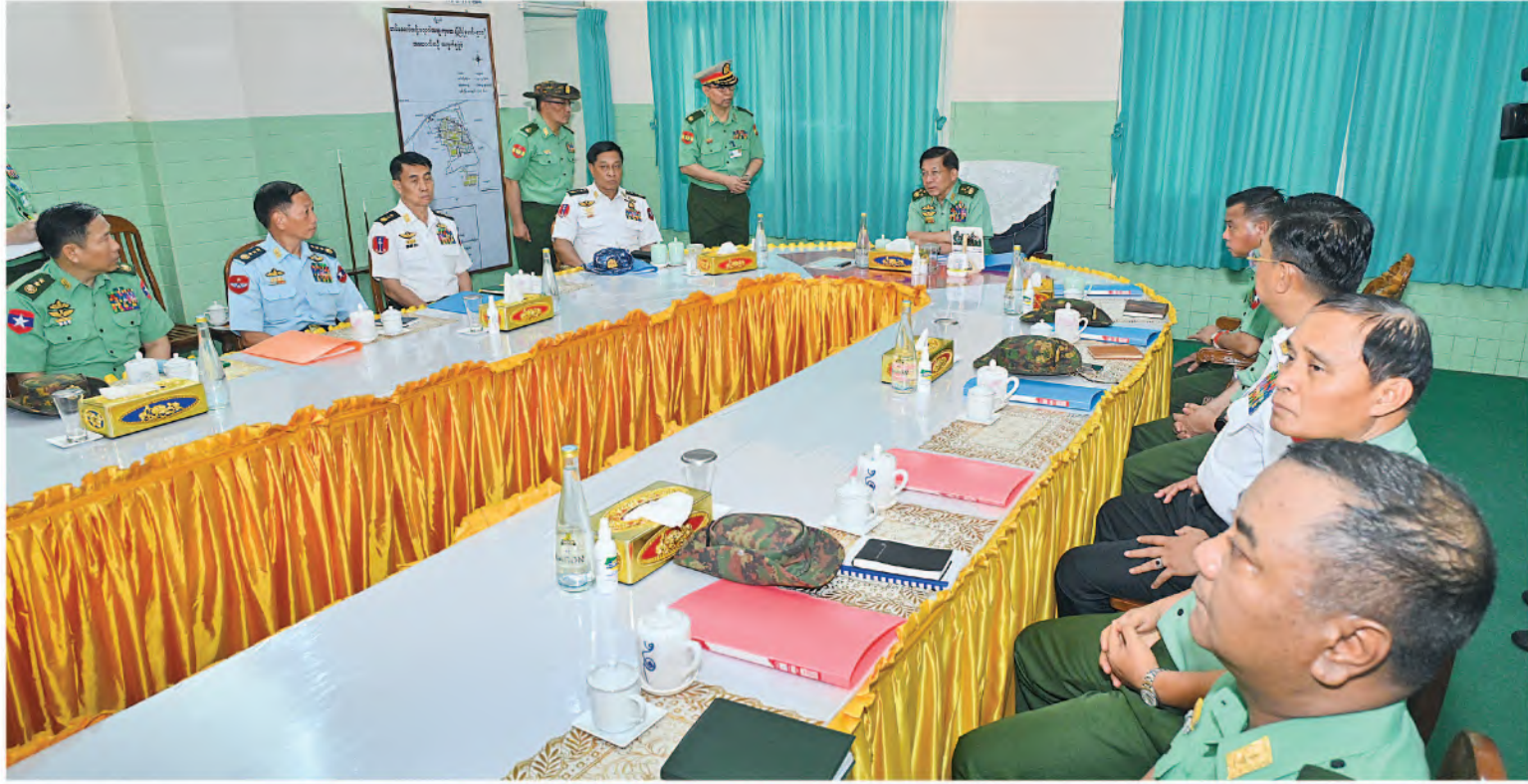
နိုင်ငံတော်စီမံအုပ်ချုပ်ရေးကောင်စီဥက္ကဋ္ဌ တပ်မတော်ကာကွယ်ရေးဦးစီးချုပ် ဗိုလ်ချုပ်မှူးကြီးမင်းအောင်လှိုင်အား ဆေးရုံတပ်မှူးက ကျန်းမာရေးစောင့်ရှောက်မှုပေးထားသည့်အခြေအနေ များနှင့် လုပ်ငန်းဆောင်ရွက်မှုအခြေအနေများကို ရှင်းလင်းတင်ပြစဉ်။

အခြေခံပညာအထက်တန်းပညာကို မြင့်မားသောရမှတ်များဖြင့် အောင်မြင်ခဲ့ သည့်အခြေခံကောင်းများကို ယခုတက္ကသိုလ် ပညာရပ်များ ဆည်းပူးရာတွင်လည်း ဆက်လက်ထိန်းသိမ်း၍ ကြိုးစားသင်ယူ သွားရန်လိုအပ်သကဲ့သို့ ရှေ့ဆက်လက် လျှောက်လှမ်းရမည့် ဘဝခရီးတစ်လျှောက် တွင်လည်း မိမိတို့၏ရည်မှန်းချက်များ မပျောက်ပျက်၊ မယိမ်းယိုင်စေရေးအတွက် ရှိပြီးဖြစ်သည့် အခြေခံကောင်းများကို ဆက်လက်ထိန်းသိမ်းဆောင်ရွက်သွားရ မည်ဖြစ်ကြောင်း၊ မိမိဘဝတိုးတက်ရေးကို အထောက်အကူဖြစ်စေမည့် စာပေဖတ်မှတ် လေ့လာခြင်းများကို ဆောင်ရွက်တတ်သည့် အလေ့အကျင့်ကောင်းကို မွေးမြူဆောင်ရွက် သွားရန်လိုကြောင်း၊ စာပေဗဟုသုတ၊ ပညာ ရပ်ဆိုင်ရာဗဟုသုတ၊ နိုင်ငံရေးဆိုင်ရာဗဟု သုတ စသည်ဖြင့် နယ်ပယ်အလိုက် အသိ ပညာ ဗဟုသုတကြွယ်ဝစေရေး စာပေဖတ် မှတ်လေ့လာနေရမည်ဖြစ်ကြောင်း။