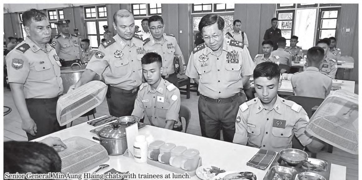
Senior General Min Aung Hlaing chats with trainees at lunch.

people can rely upon. As there are various advanced branches of medical science, instructor officers, post-graduate trainees, cadets, medical trainees are urged to exert efforts consistently to study new fields in medical science that emerge