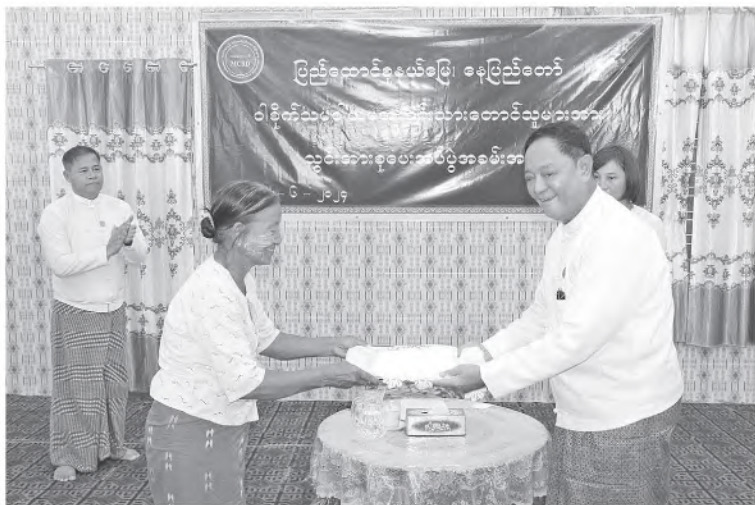
သမဝါယမနှင့်ကျေးလက်ဖွံ့ဖြိုးရေးဝန်ကြီးဌာန ပြည်ထောင်စုဝန်ကြီး ဦးလှမိုးသည် ယနေ့နံနက်ပိုင်းတွင် အမြဲတမ်းအတွင်းဝန် ဦးခန့်ဇော်၊ တာဝန်ရှိသူများနှင့်အတူ နေပြည်တော်ကောင်စီနယ်မြေ တပ်ကုန်းမြို့နယ် ကံလှကျေးရွာအုပ်စု တံခွန်တိုင်ကျေးရွာသို့ သွားရောက်ပြီး တံခွန်တိုင်စိုက်ပျိုးရေးနှင့် အထွေထွေစီးပွားရေးသမဝါယမအသင်းမှ အသင်းသားတောင်သူများထံ စိုက်ပျိုးရေး သွင်းအားစုများ ပေးအပ်ပွဲအခမ်းအနားသို့ တက်ရောက်သည်။

တော်ကောင်စီနယ်မြေ တပ်ကုန်းမြို့နယ် ကံလှကျေးရွာအုပ်စု တံခွန်တိုင်ကျေးရွာသို့ သွားရောက်ပြီး တံခွန်တိုင်စိုက်ပျိုးရေးနှင့် အထွေထွေစီးပွားရေးသမဝါယမအသင်းမှ အသင်းသားတောင်သူများထံ စိုက်ပျိုးရေး သွင်းအားစုများ ပေးအပ်ပွဲအခမ်းအနားသို့ တက်ရောက်သည်။