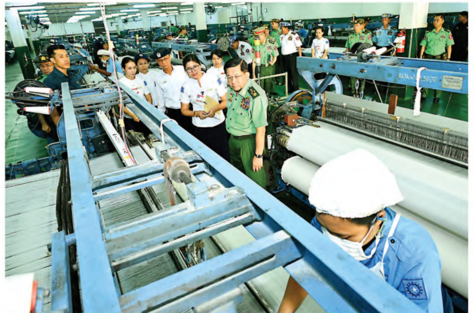
Senior General Min Aung Hlaing views production process.