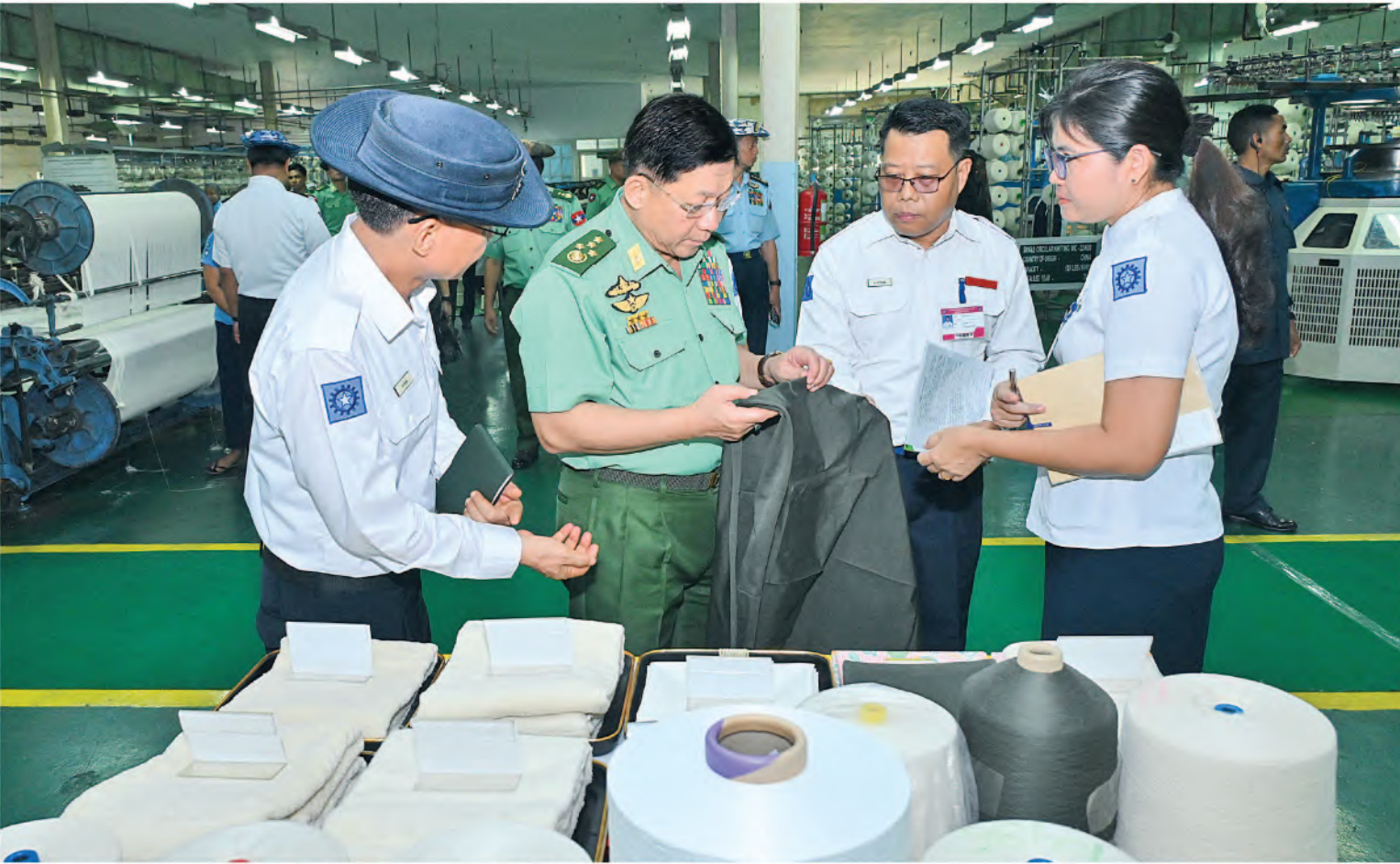
နိုင်ငံတော်စီမံအုပ်ချုပ်ရေးကောင်စီဥက္ကဋ္ဌ တပ်မတော်ကာကွယ်ရေးဦးစီးချုပ် ပိုလ်ချုပ်မှူးကြီးမင်းအောင်လှိုင် တပ်မတော်ချည်မျှင်နှင့်အထည်စက်ရုံ(သမိုင်း)အတွင်း ချည်မျှင်နှင့်အထည်များအား အဆင့်ဆင့်ထုတ်လုပ်နေမှုအခြေအနေများကို လှည့်လည်ကြည့်ရှုစစ်ဆေးစဉ်။

နေပြည်တော် ဇွန် ၁၀ နိုင်ငံတော်စီမံအုပ်ချုပ်ရေးကောင်စီ ဥက္ကဋ္ဌ တပ်မတော်ကာကွယ်ရေးဦးစီးချုပ် ပိုလ်ချုပ်မှူးကြီးမင်းအောင်လှိုင်သည် ခန့်စဉ်တွင်လိုက်ပါလာသည့်အဖွဲ့ဝင်များ၊ ရန်ကုန်တိုင်းစစ်ဌာနချုပ် တိုင်းမှူးနှင့်အဖွဲ့ဝင်များ လိုက်ပါ၍ ယနေ့နံနက်ပိုင်းတွင် ရန်ကုန်တိုင်းဒေသကြီး၊ လှိုင်မြို့နယ်၊ အမှတ်(၁၂) ရပ်ကွက်ရှိ တပ်မတော်ချည်မျှင်နှင့် အထည်စက်ရုံ(သမိုင်း)သို့ သွားရောက်ကြည့်ရှုစစ်ဆေးသည်။ ဦးစွာ နိုင်ငံတော်စီမံအုပ်ချုပ်ရေးကောင်စီ ဥက္ကဋ္ဌ တပ်မတော်ကာကွယ်ရေးဦးစီးချုပ် အား တပ်မတော်ချည်မျှင်နှင့်အထည်စက်ရုံ (သမိုင်း) စက်ရုံအစည်းအဝေးခန်းမတွင် စစ်ထောက်ချုပ် ဒုတိယပိုလ်ချုပ်ကြီး ကျော်စွာလင်းက တပ်မတော်ဝါစိုက်ပျိုးရေး တပ်များက ဝါစိုက်ပျိုးရေးလုပ်ငန်း အကောင်အထည်ဖော်ဆောင်ရွက်လျက်ရှိမှုအခြေအနေများ၊ နိုင်ငံတော်စီမံအုပ်ချုပ်ရေးကောင်စီဥက္ကဋ္ဌ တပ်မတော်ကာကွယ်ရေးဦးစီးချုပ် တပ်မတော်ဝါစိုက်ပျိုးရေးတပ်များ သို့ရောက်ရှိစစ်ဆေးစဉ် လမ်းညွှန်မှာကြားချက်များအား လိုက်နာဆောင်ရွက်ပြီးစီးမှုအခြေအနေများ၊ စိုက်ပျိုးရာသီအလိုက် လုပ်ငန်းများ စာမျက်နှာ ၅ ကော်လံ ၁ ★