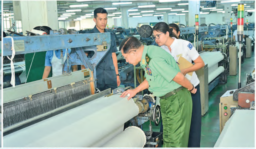
နိုင်ငံတော်စီမံအုပ်ချုပ်ရေးကောင်စီဥက္ကဋ္ဌ တပ်မတော်ကာကွယ်ရေးဦးစီးချုပ် ဗိုလ်ချုပ်မှူးကြီးမင်းအောင်လှိုင် တပ်မတော်ချည်မျှင်နှင့်အထည်စက်ရုံ(သမိုင်း)အတွင်း ချည်မျှင်နှင့်အထည်များအား အဆင့်ဆင့်ထုတ်လုပ်နေမှုအခြေအနေများကို လှည့်လည်ကြည့်ရှုစစ်ဆေးစဉ်။