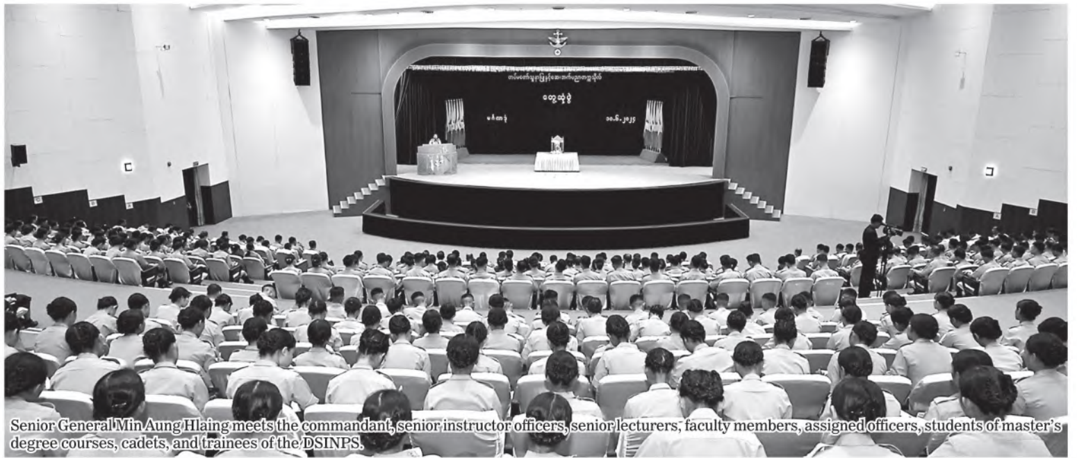
Senior General Min Aung Hlaing meets the commandant, senior instructor officers, senior lecturers, faculty members, assigned officers, students of master's degree courses, cadets, and trainees of the DSINPS.

The teaching sector must conduct academic science and military science classes in all seriousness as a proper ratio between instructors and trainees was reached through careful calculations. Instructors must concentrate more on generating qualified soldiers, rather than quality. In practicing stage-by-stage supervisory procedure through the guardianship system, instructors must conduct close individual training to improve the morale, discipline and knowledge of the trainees and solve their problems to the most possible degree through parental and brethren spirit. As only the professionals are