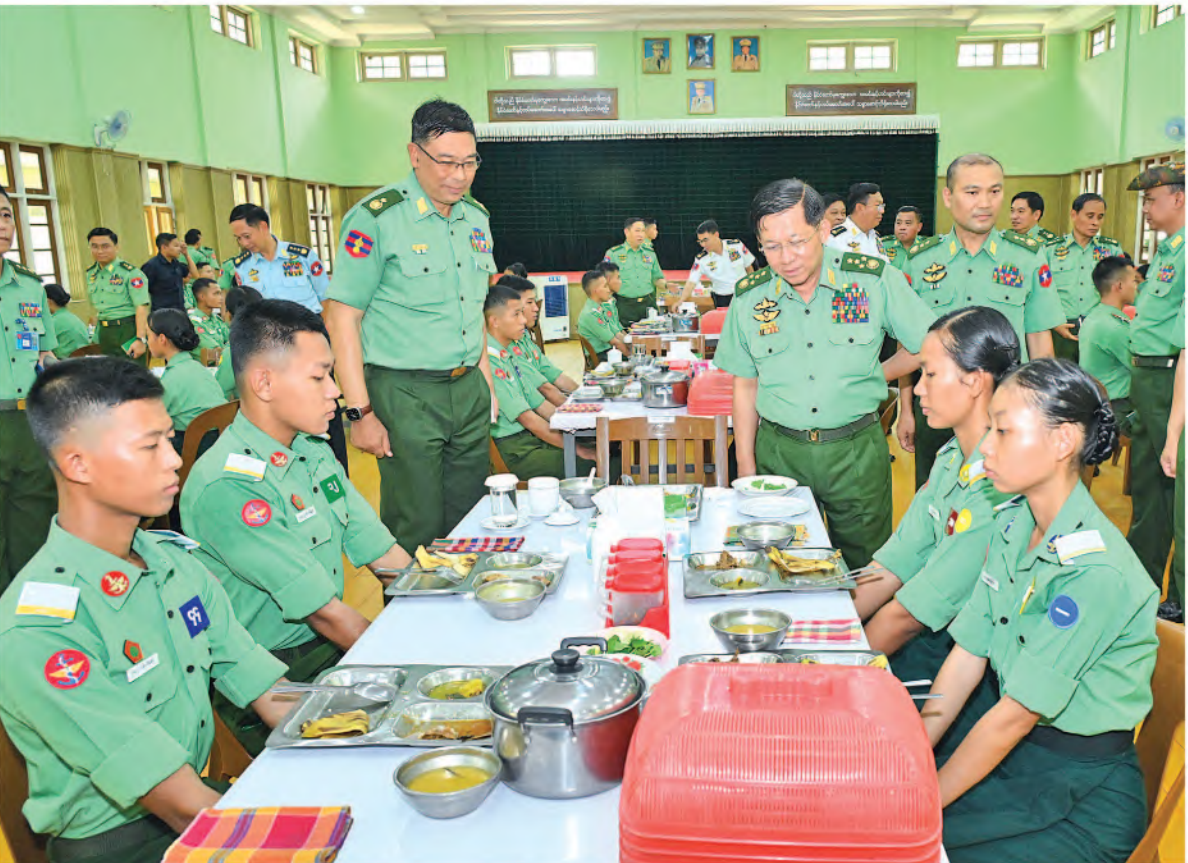
နိုင်ငံတော်စီမံအုပ်ချုပ်ရေးကောင်စီဥက္ကဋ္ဌ တပ်မတော်ကာကွယ်ရေးဦးစီးချုပ် ဗိုလ်ချုပ်မှူးကြီးမင်းအောင်လှိုင်မှ ဗိုလ်လောင်းများအား ရင်းရင်းနှီးနှီးနှုတ်ဆက်စဉ်။

ရှိထိုက်သည့် ကိုယ်ခန္ဓာအချိုးအစား၊ ကိုယ်ကာယကြံ့ခိုင်မှုနှင့် ကြံ့ခိုင်သန်စွမ်းမှုများရှိရမည်ဖြစ်ကြောင်း၊ ဗိုလ်လောင်းများအနေဖြင့် နေ့စဉ်လေ့ကျင့်ရေးပိုင်းဆိုင်ရာများ၊ စာပေပညာရပ်ဆိုင်ရာများကို စဉ်ဆက်မပြတ်ဆောင်ရွက်ရမည်ဖြစ်သဖြင့် အာဟာရပြည့်ပြည့်ဝဝစားသုံးမှသာ ကိုယ်ခန္ဓာအားကောင်းမွန်စွာဖြင့် လိုက်ပါလုပ်ဆောင်နိုင်မည်ဖြစ်ကြောင်း၊ ထို့ကြောင့် သင်တန်းသားများအတွက် စနစ်တကျတက်ချက်ပြီး တွေးခေါ်လျက်ရှိသည့်ကိစ္စများကို ပြည့်စုံစွာစားသောက်ကြရန်လိုကြောင်း၊ နိုင်ငံတော်နှင့်တပ်မတော်အတွက် လိုအပ်ချက်ရှိသည့်အတွက် တပ်မတော်ဆေးတက္ကသိုလ်ကို ဖွင့်လှစ်သင်ကြားပေးနေခြင်းဖြစ်သည့်အတွက် သက်ဆိုင်ရာဘာသာရပ်အလိုက် ကျွမ်းကျင်သည့်ဆေးဘက်ဆိုင်ရာအရာရှိကောင်းများဖြစ်စေရေး ကြိုးပမ်းဆောင်ရွက်ကြရမည်ဖြစ်ကြောင်း၊ ဆေးဘက်ဆိုင်ရာပညာရှင်များသာမက စစ်ပညာကိုလည်း သင်ကြားပေးလျက်ရှိသဖြင့် ခန္ဓာကိုယ်ကြံ့ခိုင်သန်စွမ်းမှုမှစ၍ စစ်အတတ်