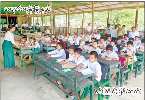
ကျောင်းကုန်းမြို့နယ်