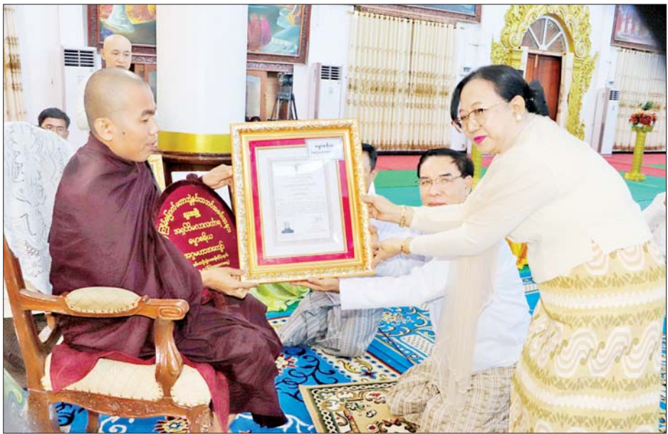
အောင်မြင်ခဲ့ကြသည့်အတွက် ပဲခူးတိုင်းဒေသကြီး အစိုးရအဖွဲ့က စာအောင်ဆုအလှူငွေကျပ် ၈၃၁၅၀၀၀ ကို ဆက်ကပ်လှူဒါန်းခဲ့ကြောင်း သိရသည်။ တိုင်းဒေသကြီး(ပြန်/ဆက်)