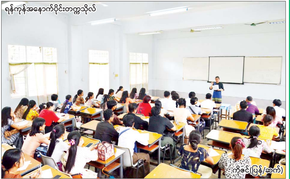
ရန်ကုန်အနောက်ပိုင်းတက္ကသိုလ်