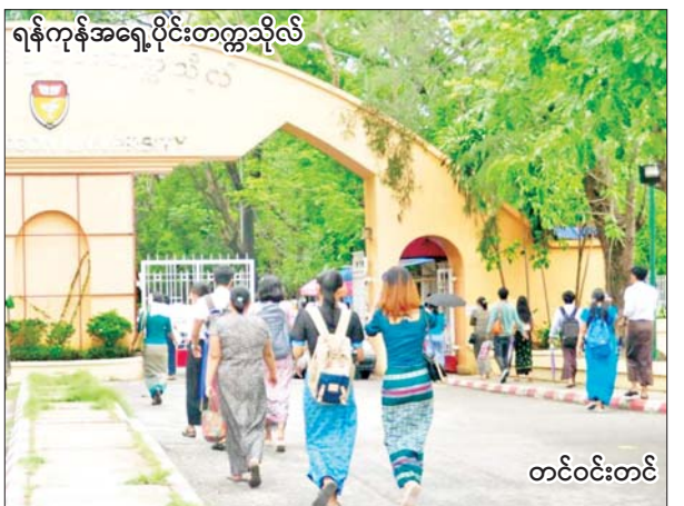
ရန်ကုန်အရှေ့ပိုင်းတက္ကသိုလ်