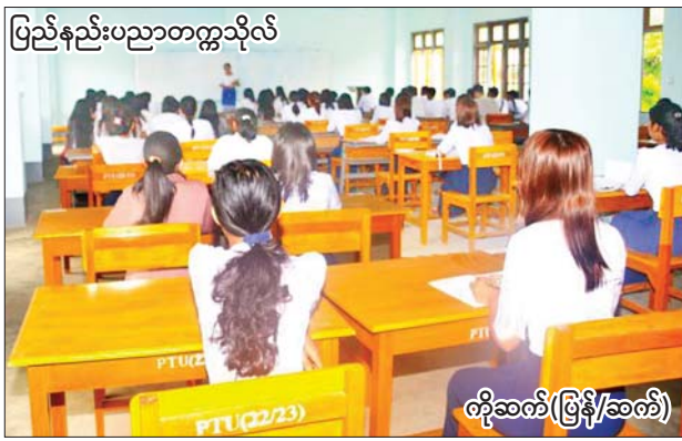
ပြည်နည်းပညာတက္ကသိုလ်