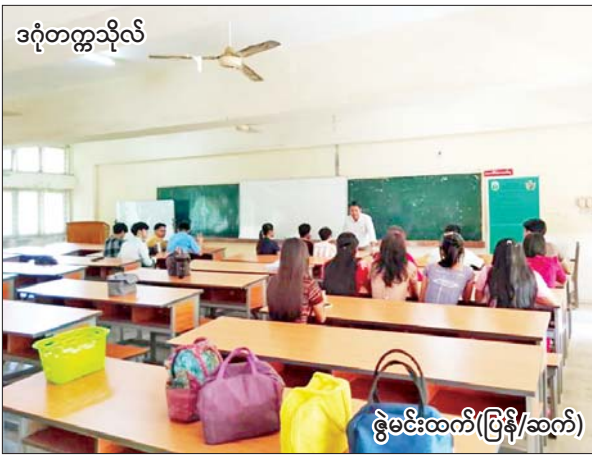
ဒဂုံတက္ကသိုလ်