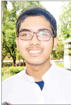
မောင်မင်းခန့်ညီညီ

အစိုးရအဖွဲ့ရဲ့ ကူညီပံ့ပိုးမှုနဲ့ ကျောင်းအားလုံးပတ်ဝန်းကျင်နဲ့ ကျောင်းတွင်း၊ ကျောင်းပြင် သန့်ရှင်းရေး၊ စာသင်ခန်းအလင်းဖွင့်ဆောင်ရွက်ခြင်း၊ စာသင်ခန်းနဲ့ စာသင်ခန်းများ သန့်ရှင်းသပ်ရပ်နေအောင်ဆောင်ရွက်ခြင်း စတဲ့လုပ်ငန်းစဉ်တွေမှာ တာဝန်ရှိသူများ ပြည့်စုံအောင် ဝိုင်းဝန်းပူးပေါင်းဆောင်ရွက်ခဲ့ကြပါတယ်” ဟု ပြောသည်။