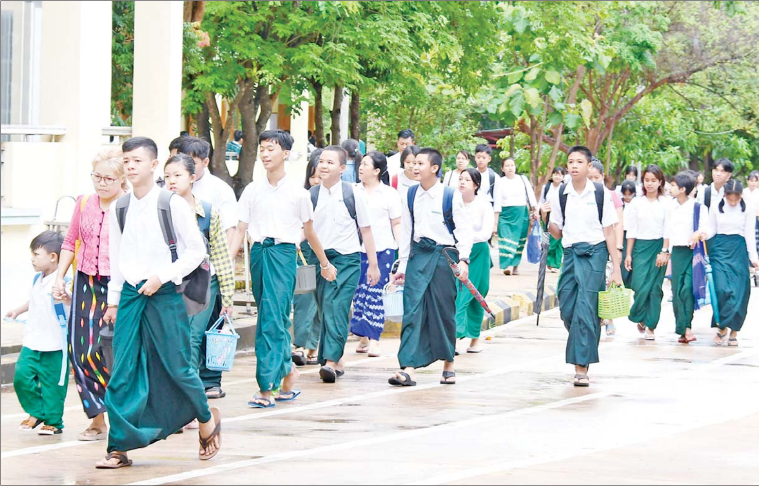
ပြည်ထောင်စုနယ်မြေ နေပြည်တော် အမှတ်(၅)အခြေခံပညာအထက်တန်းကျောင်း၌ ပညာသင်ကြားရန်လာရောက်ကြသည့် ကျောင်းသား ကျောင်းသူများကို တွေ့ရစဉ်။