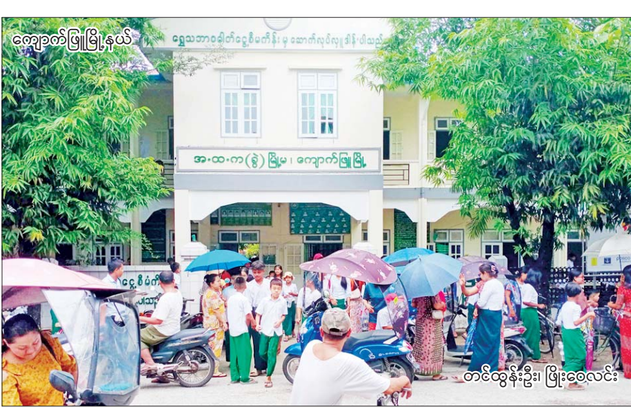
ကျောက်မြို့မြို့နယ်