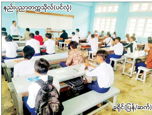
နည်းပညာတက္ကသိုလ်(ပင်လုံ)