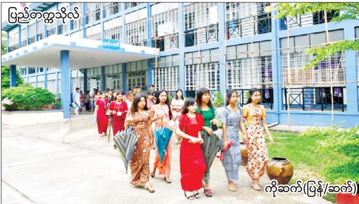
ပြည်တက္ကသိုလ်