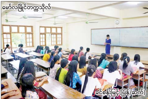
မော်လမြိုင်တက္ကသိုလ်