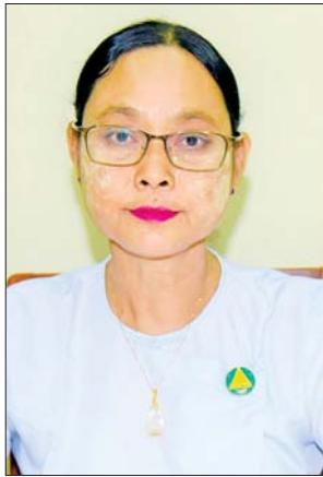
ဒေါက်တာ ချိုမြတ်အောင်

ရန်ကုန်တိုင်းဒေသကြီးအတွင်းရှိ အခြေခံပညာကျောင်းများတွင် ကျောင်းဖွင့်ချိန်၌ ကျောင်းသားကျောင်းသူများ အဆင်ပြေချောမွေ့စွာ ပညာသင်ကြားနိုင်ရန် ကြိုတင်ပြင်ဆင်ဆောင်ရွက်ခဲ့မှုနှင့် စပ်လျဉ်း၍ ရန်ကုန်တိုင်းဒေသကြီး ပညာရေးမှူး ဒေါက်တာချိုမြတ်အောင်က “ဇွန် ၃ ရက် ကျောင်းဖွင့်ချိန်မှာ စာသင်ကြားနိုင်ဖို့ နိုင်ငံတော်အကြီးအကဲရဲ့ လမ်းညွှန်မှုနဲ့အညီ တိုင်းဒေသကြီး