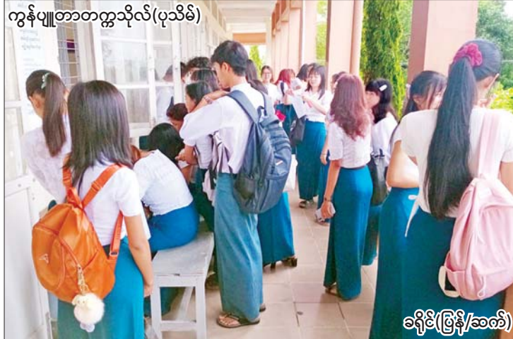
ကွန်ပျူတာတက္ကသိုလ်(ပုသိမ်)