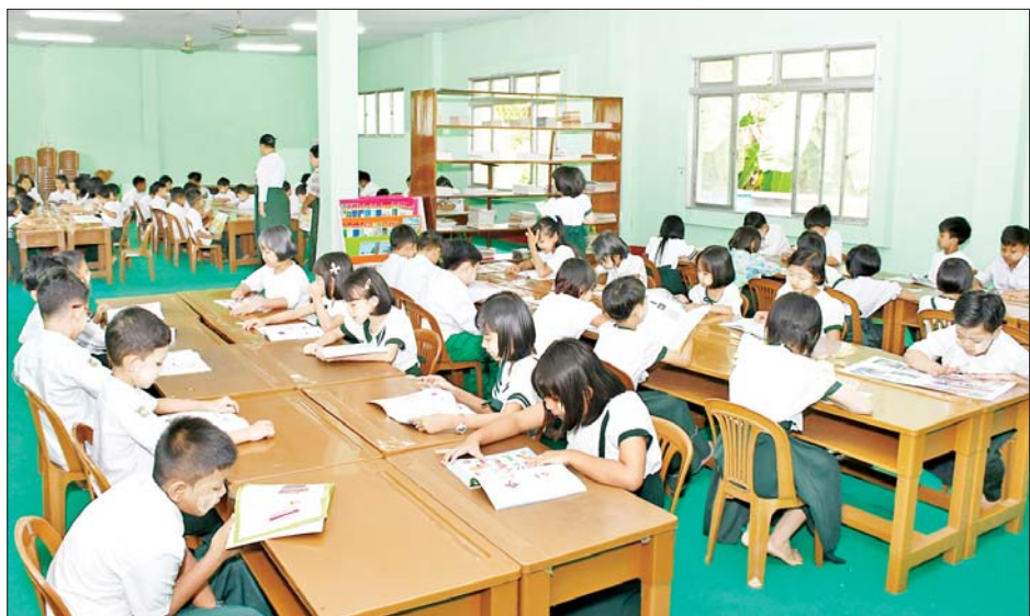
ပြည်ထောင်စုနယ်မြေ နေပြည်တော် အမှတ်(၅) အခြေခံပညာအထက်တန်းကျောင်း၌ ပညာသင်ကြား လျက်ရှိသည့် ကျောင်းသား ကျောင်းသူများကို တွေ့ရစဉ်။