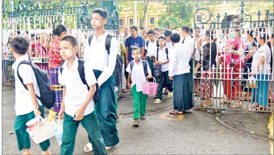
ဗိုလ်တထောင် အမှတ်(၆) အခြေခံပညာအထက်တန်းကျောင်းသို့ တက်ရောက်လာကြသော ကျောင်းသားများကို တွေ့ရစဉ်။