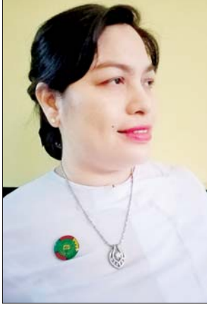
ဒေါ်အေးမြသီတာ