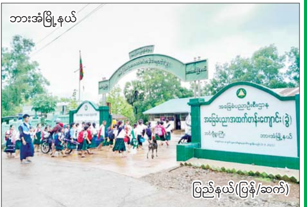
ဘားအံမြို့နယ်