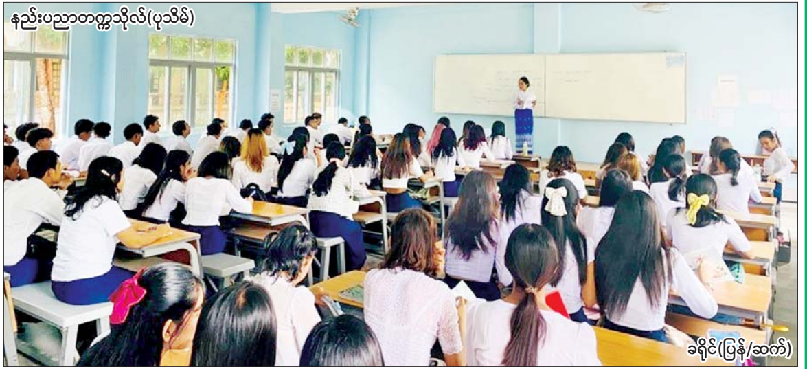
နည်းပညာတက္ကသိုလ်(ပုသိမ်)

နေပြည်တော် ဇွန် ၃ ပညာရေးဝန်ကြီးဌာန အဆင့်မြင့်ပညာဦးစီးဌာန တက္ကသိုလ်၊ ဒီဂရီ ကောလိပ်များ၏ ၂၀၂၃-၂၀၂၄ ပညာသင်နှစ် ဒုတိယနှစ်ဝက်နှင့် ၂၀၂၄-၂၀၂၅ ပညာသင်နှစ် ပထမနှစ်ဝက်သင်တန်းများကို ယနေ့စတင်ဖွင့်လှစ်ရာ ကျောင်းသား ကျောင်းသူများ အေးချမ်းပျော်ရွှင်စွာ ပညာသင်ကြားနေမှုများကို ဖော်ပြလိုက်ပါသည်-