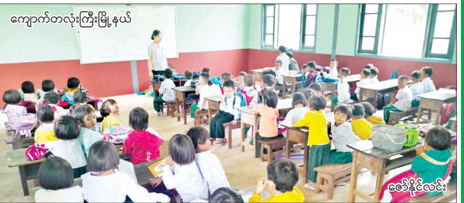
ကျောက်တလုံးကြီးမြို့နယ်