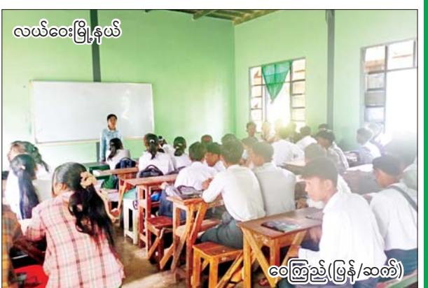
လယ်ဝေးမြို့နယ်