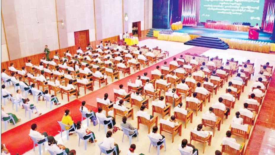
တာဝန်ထမ်းဆောင်လျက်ရှိသော ဝန်ထမ်းများနှင့် မိသားစုဝင် သားငယ် သမီးငယ်များ၏ ပညာရေးအတွက် တစ်ဖက်တစ်လမ်းမှ အထောက်အပံ့ဖြစ်စေရန် ရည်ရွယ်ပြီး ယခုကဲ့သို့ အသိအမှတ်ပြု ထောက်ပံ့ပေးခြင်းဖြစ်ကြောင်း၊ ပြည်နယ်အစိုးရအဖွဲ့ အနေဖြင့် လည်း ပြည်နယ်အတွင်း ဗလငါးတန်ပြည့်စုံသော လူ့စွမ်းအား အရင်းအမြစ်ကောင်းများ ပေါ်ထွက်လာစေရေးနှင့် ကျောင်းနေအရွယ်

ကယားပြည်နယ် အစိုးရအဖွဲ့က ၂၀၂၄ - ၂၀၂၅ ပညာသင်နှစ် အတွက် အခြေခံပညာအဆင့် ဆရာ ဆရာမများ၊ တက္ကသိုလ်တက်ရောက်နေသည့် ကျောင်းသား ကျောင်းသူများနှင့် ဝန်ထမ်းများ၊ အခြေခံပညာအဆင့် သင်ကြားနေသော ဝန်ထမ်းများ၏သားသမီးများအား ပညာသင်စရိတ်၊ ကျောင်းဝတ်စုံ၊ ကျောင်းသုံးပစ္စည်းများ ထောက်ပံ့ပေးအပ်ခြင်းအခမ်းအနားကို ယမန်နေ့ မွန်းလွဲပိုင်းက ပြည်နယ်ခန်းမ၌ ကျင်းပသည်။ အခမ်းအနားတွင် ပြည်နယ်ဝန်ကြီးချုပ် ဦးဇော်မျိုးတင်က ပြည်နယ်အတွင်း သစ္စာရှိရှိဖြင့်