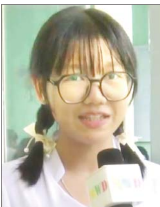
ကျောင်းသူ