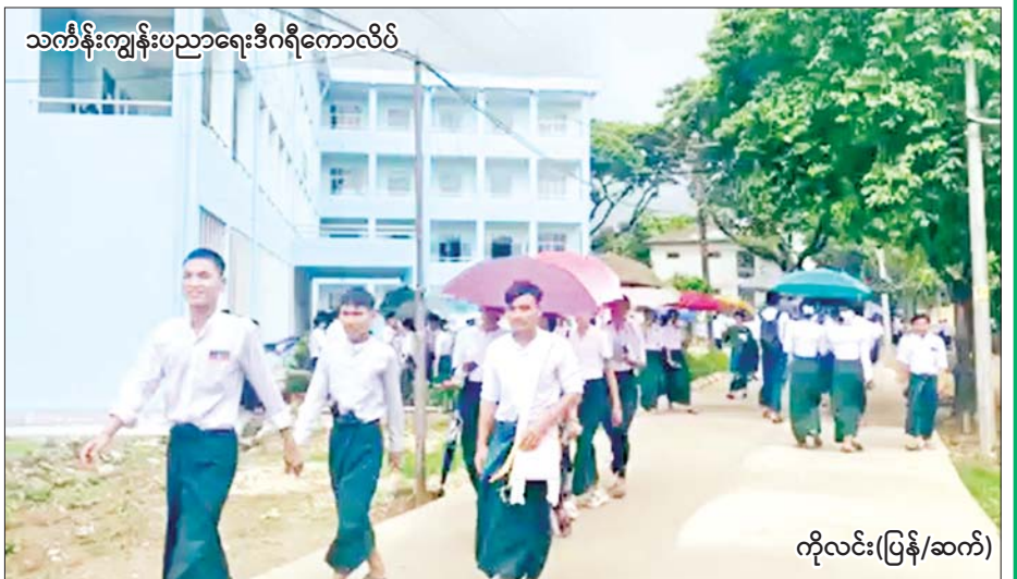
သင်္ကြန်းကျွန်းပညာရေးဒီဂရီကောလိပ်