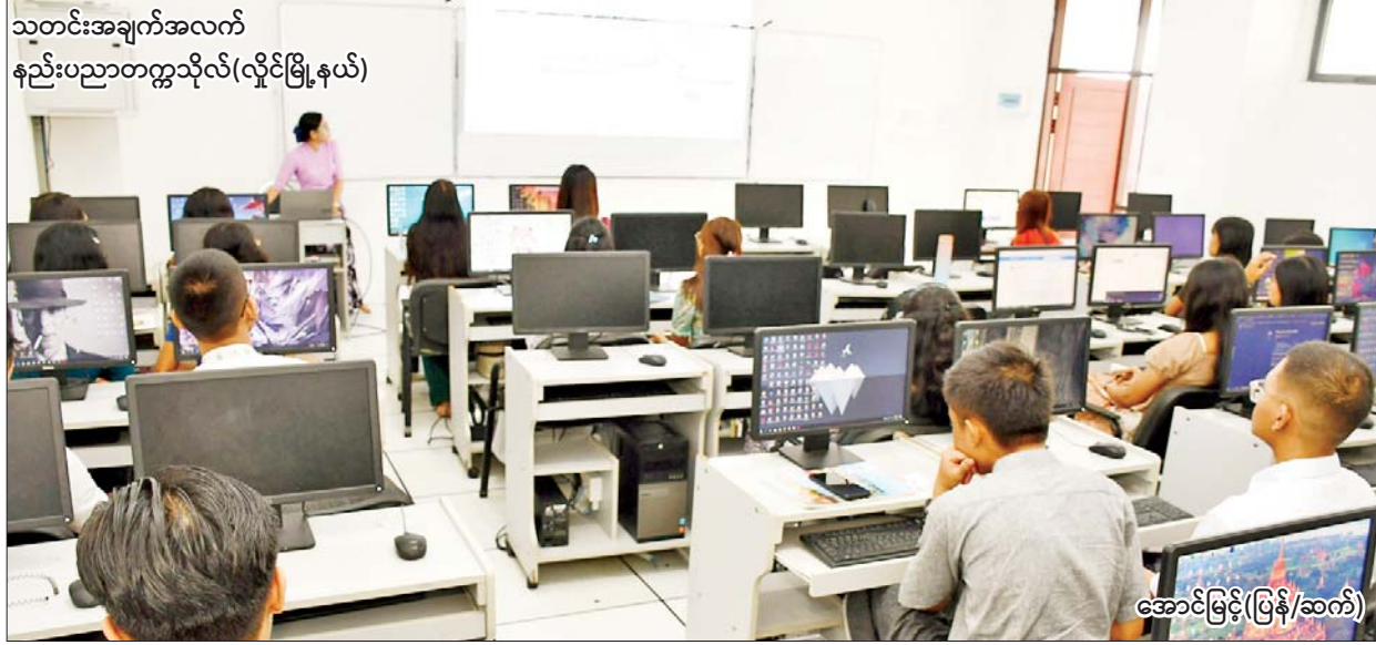
သုတင်းအချက်အလက် နည်းပညာတက္ကသိုလ်(လှိုင်မြို့နယ်)

ပညာရေးဝန်ကြီးဌာန အဆင့်မြင့်ပညာဦးစီးဌာန တက္ကသိုလ်၊ ဒီဂရီကောလိပ်များ၏ ၂၀၂၃-၂၀၂၄ ပညာသင်နှစ် ဒုတိယနှစ်ဝက်နှင့် ၂၀၂၄-၂၀၂၅ ပညာသင်နှစ် ပထမနှစ်ဝက်သင်တန်းများကို ဇွန် ၃ ရက်က စတင်ဖွင့်လှစ်ရာ ကျောင်းသား ကျောင်းသူများ အေးချမ်းပျော်ရွှင်စွာ ပညာသင်ကြားနေမှုများကို ဖော်ပြလိုက်ပါသည်-