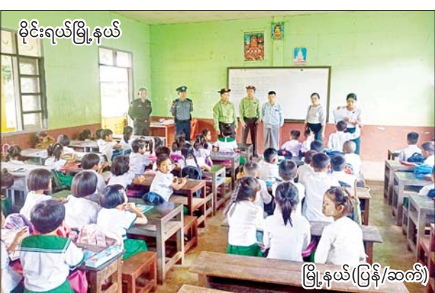
မိုင်းရယ်မြို့နယ်