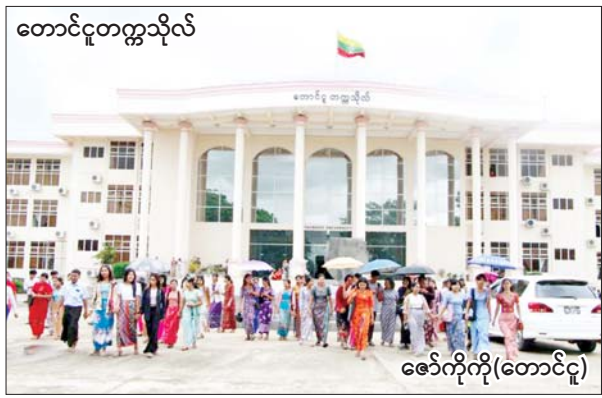
တောင်ငူတက္ကသိုလ်