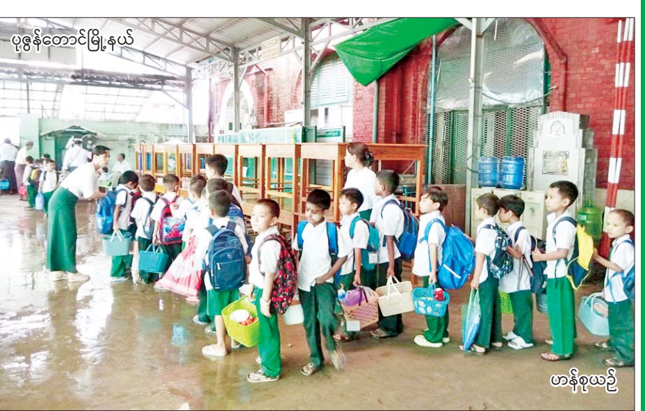
ပုဇွန်တောင်မြို့နယ်