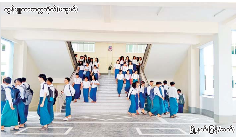
ကွန်ပျူတာတက္ကသိုလ်(မအူပင်)