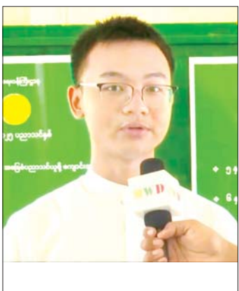
ကျောင်းသား