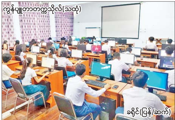
ကွန်ပျူတာတက္ကသိုလ်(သထုံ)