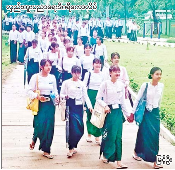
လှည်းကူးပညာရေးဒီဂရီကောလိပ်