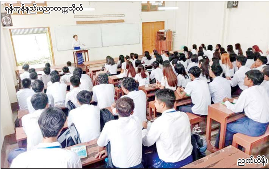
ရန်ကုန်နည်းပညာတက္ကသိုလ်