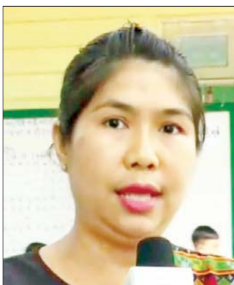
ကျောင်းသားမိဘ