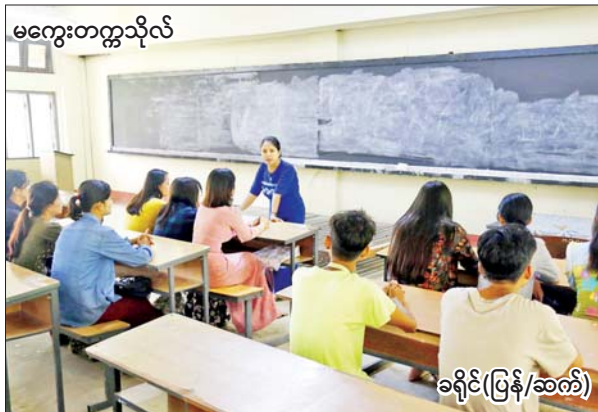
မကွေးတက္ကသိုလ်