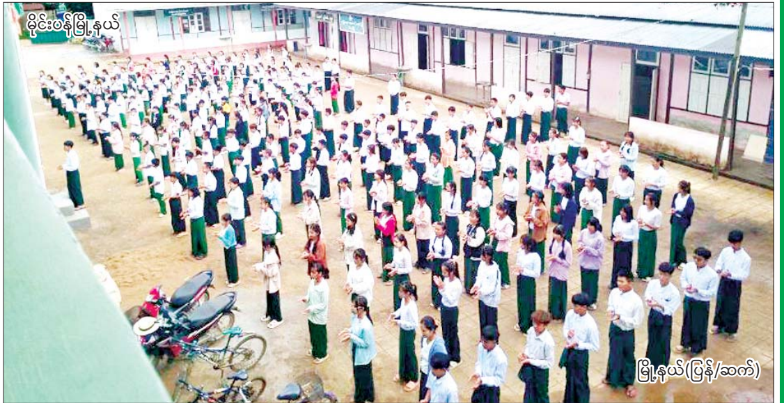
မိုင်းတန်မြို့နယ်

၂၀၂၄-၂၀၂၅ ပညာသင်နှစ်အတွက် အခြေခံပညာကျောင်းများအားလုံးကို နိုင်ငံတစ်ဝန်း၌ ယနေ့မှစတင်၍ ဖွင့်လှစ်သင်ကြားလျက်ရှိရာ ကျောင်းသား ကျောင်းသူများ အေးချမ်းပျော်ရွှင်စွာ ပညာသင်ကြားလျက်ရှိသည့် ပုံရိပ်များကို စုစည်းဖော်ပြလိုက်ပါသည်။