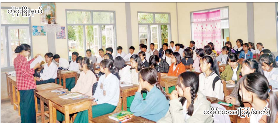
ဟိုပိုးမြို့နယ်