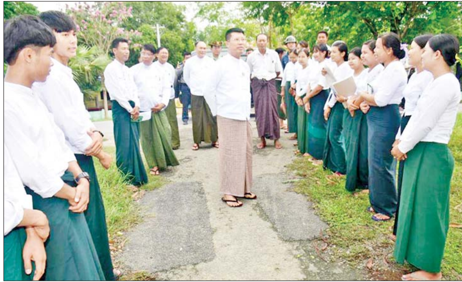
ကျောင်းတက်ရောက်မှုအခြေအနေများကို ကြည့်ရှုစစ်ဆေးခဲ့သည်။ ယင်းနောက် တိုင်းဒေသကြီးဝန်ကြီးချုပ်နှင့်အဖွဲ့သည် ကျိုပျော်မြို့အမှတ်(၂) အခြေခံပညာနှင့် စက်မှု၊ စိုက်ပျိုး၊ မွေးမြူရေးအထက်တန်း

ရောဝတီတိုင်းဒေသကြီးဝန်ကြီးချုပ် ဦးတင်မောင်ဝင်းသည် အစိုးရအဖွဲ့ဝန်ကြီးများနှင့်အတူ ကျောင်းနေရွယ်ကလေးများအားလုံး ရာနှုန်းပြည့်ကျောင်းတက်ရောက်နိုင်ရေးနှင့် စဉ်ဆက်မပြတ်အတန်းကျေးပြောင်း ပညာသင်ကြားနိုင်ရေးအတွက် ယနေ့နံနက်ပိုင်းက ကျိုပျော်ခရိုင်နှင့် မြန်အောင်ခရိုင်တို့ရှိ အခြေခံပညာကျောင်းများတွင် ကျောင်းသားကျောင်းသူများ အေးချမ်းစွာ ပညာသင်ကြားနေမှုများကို လှည့်လည်ကြည့်ရှုအားပေးခဲ့ပြီး စာရေးကိရိယာများ ထောက်ပံ့ပေးအပ်ခဲ့သည်။