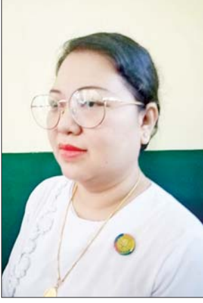
ဒေါ်နီလာဝင်းမောင်