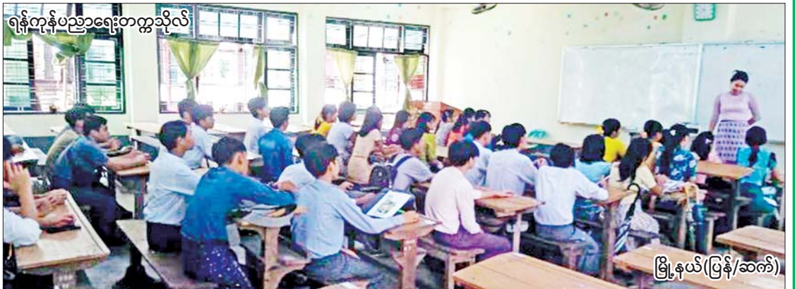
ရန်ကုန်ပညာရေးတက္ကသိုလ်