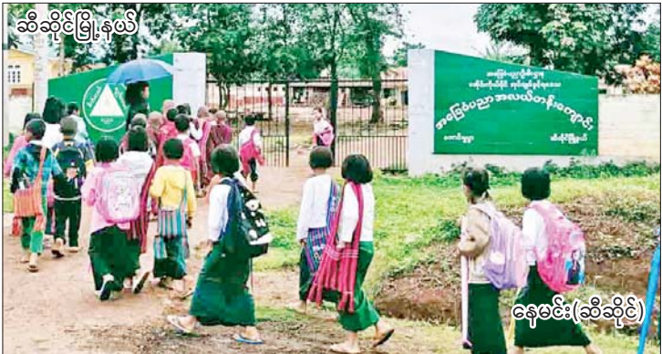
ဆီဆိုင်မြို့နယ်