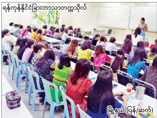
ရန်ကုန်နိုင်ငံခြားဘာသာတက္ကသိုလ်