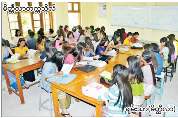
မိတ္ထီလာတက္ကသိုလ်