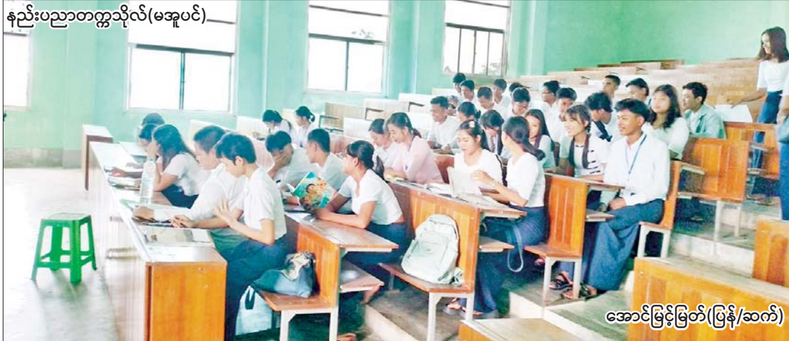
နည်းပညာတက္ကသိုလ်(မအူပင်)