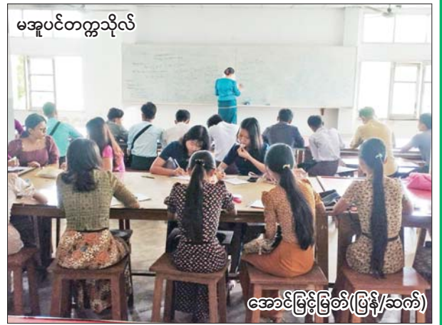
မအူပင်တက္ကသိုလ်