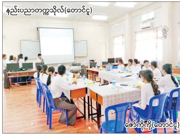
နည်းပညာတက္ကသိုလ်(တောင်ငူ)