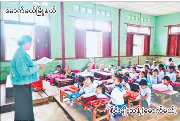
မောက်မယ်မြို့နယ်