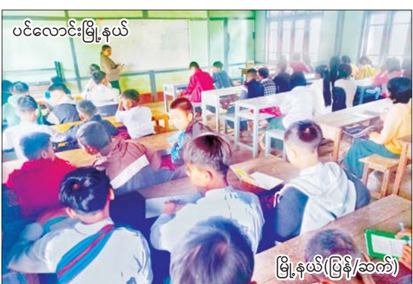
ပင်လောင်းမြို့နယ်