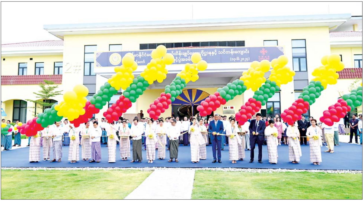
နိုင်ငံတော်စီမံအုပ်ချုပ်ရေးကောင်စီအဖွဲ့ဝင် ဒေါက်တာမူထန်၊ ပြည်ထောင်စုဝန်ကြီး ဒေါက်တာသက်ခိုင်ဝင်း၊ နေပြည်တော်ကောင်စီဥက္ကဋ္ဌ ဦးသန်းထွန်းဦး၊ ဒုတိယဝန်ကြီး ဒေါက်တာအေးထွန်း၊ မြန်မာနိုင်ငံဆိုင်ရာ တရုတ်ပြည်သူ့သမ္မတနိုင်ငံ သံအမတ်ကြီး မစ္စတာချန်းဟိုင်၊ China CDC မှ Deputy Director General ဒေါက်တာလီချင်နှင့် ပြည်သူ့ကျန်းမာရေးဦးစီးဌာန ညွှန်ကြားရေးမှူးချုပ် ဒေါက်တာမြင့်မြင့်သန်းတို့က မြန်မာနိုင်ငံ ရောဂါကာကွယ်ထိန်းချုပ်ရေးဗဟိုဌာနနှင့် သင်တန်းကျောင်းဖွင့်ပွဲအခမ်းအနားကို ဖဲကြိုးဖြတ်ဖွင့်လှစ်ပေးကြစဉ်။

ဖဲကြိုးဖြတ်ဖွင့်လှစ် ဦးစွာ နိုင်ငံတော်စီမံအုပ်ချုပ်ရေးကောင်စီအဖွဲ့ဝင် ဒေါက်တာမူထန်၊ ကျန်းမာရေးဝန်ကြီးဌာန ပြည်ထောင်စုဝန်ကြီး ဒေါက်တာသက်ခိုင်ဝင်း၊ နေပြည်တော်ကောင်စီဥက္ကဋ္ဌ ဦးသန်းထွန်းဦး၊ ဒုတိယဝန်ကြီး ဒေါက်တာအေးထွန်း၊ မြန်မာနိုင်ငံဆိုင်ရာ တရုတ်ပြည်သူ့သမ္မတနိုင်ငံ သံအမတ်ကြီး မစ္စတာချန်းဟိုင်၊ China CDC မှ Deputy Director General ဒေါက်တာလီချင်နှင့် ပြည်သူ့ကျန်းမာရေး ဦးစီးဌာန ညွှန်ကြားရေးမှူးချုပ် ဒေါက်တာမြင့်မြင့်သန်းတို့က မြန်မာနိုင်ငံ ရောဂါကာကွယ်ထိန်းချုပ်ရေး ဗဟိုဌာနနှင့် သင်တန်းကျောင်း ဖွင့်ပွဲအခမ်းအနားကို ဖဲကြိုးဖြတ်ဖွင့်လှစ်ပေးကြသည်။