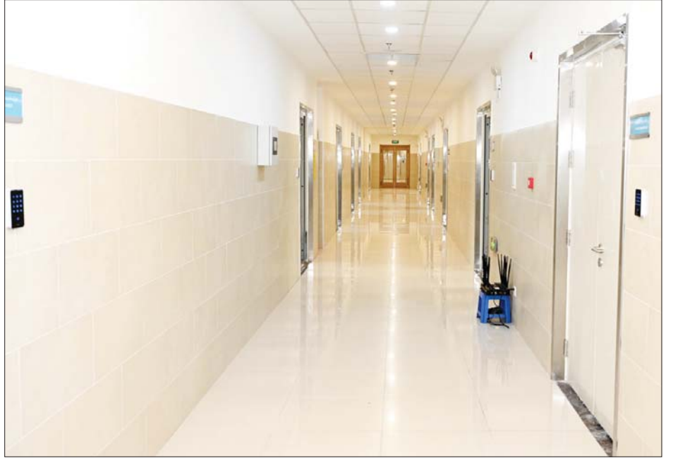
မြန်မာနိုင်ငံ ရောဂါကာကွယ်ထိန်းချုပ်ရေးဗဟိုဌာနနှင့် သင်တန်းကျောင်းအတွင်း ပြင်ဆင်ထားရှိမှုများကို တွေ့ရစဉ်။