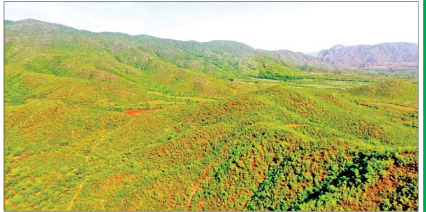
ကေလာသတောင်ကြိုးပြင်ကာကွယ်တော၏ သဘာဝရှုခင်းကို တွေ့ရစဉ်။

သယံဇာတနှင့် သဘာဝပတ်ဝန်းကျင်ထိန်း သိမ်းရေးဝန်ကြီးဌာနသည် သဘာဝဝန်းကျင် နှင့် ဇီဝမျိုးစုံမျိုးကွဲပေါကြွယ်ဝမှုကို ထိန်း သိမ်းရန်၊ တားမြစ်သစ်ပင်များနှင့် အခြားသစ် မျိုးများ ရေရှည်တည်တံ့အောင် ထိန်းသိမ်း ကာကွယ်ရန်၊ သဘာဝပတ်ဝန်းကျင် စိမ်းလန်းစိုပြည်လာစေရန်နှင့် ရာသီဥတု သာယာမျှတစေပြီး စိမ့်စမ်းရေထွက်များအား ထိန်းသိမ်းကာကွယ်ရန် ရည်ရွယ်၍ ကြိုးပိုင်း/ ကြိုးပြင်ကာကွယ်တောများ ဖွဲ့စည်းသတ်မှတ်ခြင်း ဖြစ်ပါသည်။ ကေလာသတောင်ကြိုးပြင်ကာကွယ် တောသတ်မှတ်ခြင်းအားဖြင့် တန်ဖိုးရှိသစ် မျိုးများဖြစ်သည့် အင်ကြင်း၊ ပျဉ်းကတိုး၊ ထောက်ကြံ့၊ ပိတောက်၊ တမလန်းပင်များနှင့် အခြားဒေသ မျိုးရင်းသစ်မျိုးများ ဖြစ်သည့် ယမနေ၊ ဒဟာ၊ မျောက်ချော၊ သပြေ စသည့် တို့အား ထိန်းသိမ်းကာကွယ်နိုင်မည်ဖြစ်