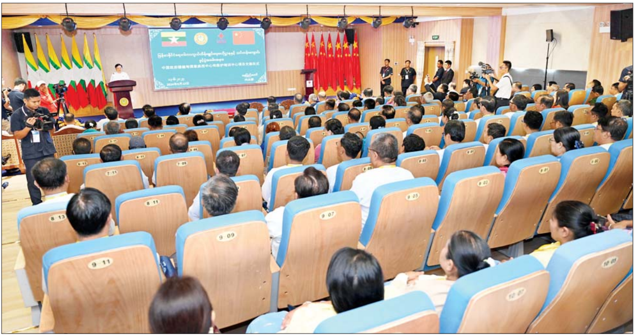
နိုင်ငံတော်စီမံအုပ်ချုပ်ရေးကောင်စီဥက္ကဋ္ဌ နိုင်ငံတော်ဝန်ကြီးချုပ်ကိုယ်စား နိုင်ငံတော်စီမံအုပ်ချုပ်ရေးကောင်စီ အတွင်းရေးမှူး ဒုတိယဗိုလ်ချုပ်ကြီး အောင်လင်းဒွေး မြန်မာနိုင်ငံ ရောဂါကာကွယ်ထိန်းချုပ်ရေးဗဟိုဌာနနှင့် သင်တန်းကျောင်းဖွင့်ပွဲ အခမ်းအနားတွင် အမှာစကားပြောကြားစဉ်။

ရောဂါထိန်းချုပ်ရေး ဗဟိုဌာနများ ဖွင့်လှစ်တည်ထောင်ကြပြီး ရောဂါ နှိမ်နင်းရေး လုပ်ငန်းများကို ထိထိရောက်ရောက် ဆောင်ရွက် လာကြကြောင်း၊ မိမိတို့ မြန်မာ နိုင်ငံတွင် နိုင်ငံတကာအဆင့်မီ ရောဂါ ကာကွယ်ထိန်းချုပ် ရေး၊ သုတေသနပြုလုပ်ရေးနှင့် ကျန်းမာရေး လူ့စွမ်းအား အရင်း အမြစ်များ ဖွံ့ဖြိုးရေးဗဟိုဌာန တစ်ခု ထူထောင်နိုင်ရန်အတွက် မြန်မာနိုင်ငံနှင့် တရုတ်ပြည်သူ့ သမ္မတနိုင်ငံတို့၏ နှစ်နိုင်ငံ ချစ်ကြည်ရေး သင်္ကေတအဖြစ် တရုတ်ပြည်သူ့သမ္မတနိုင်ငံ အစိုးရ က ကူညီတည်ဆောက်ထူထောင် ပေးခြင်းဖြစ်ကြောင်း၊ မြန်မာနိုင်ငံ ရောဂါကာကွယ် ထိန်းချုပ်ရေး ဗဟိုဌာနနှင့် သင်တန်းကျောင်း စီမံကိန်းကို တရုတ်ယူမ်ဂေ့ သန်း ၃၃၀ ခန့်ဖြင့် ပြည်ထောင်စုနယ်မြေ နေပြည်တော် ဒက္ခိဏာဒီရီမြို့နယ် တွင် ယခုကဲ့သို့ အကောင်အထည် ဖော် တည်ဆောက်ခဲ့ခြင်းဖြစ် ကြောင်း၊ Myanmar CDC Center ထူထောင်နိုင်ခြင်းဖြင့် မြန်မာနိုင်ငံ