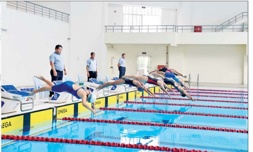
နိုင်ငံတော်စီမံအုပ်ချုပ်ရေးကောင်စီအဖွဲ့ဝင်များ ၂၀၂၄ ခုနှစ် ပြည်နယ်နှင့် တိုင်းဒေသကြီးရေကူးပြိုင်ပွဲ အမျိုးသမီး မိတာ ၂၀၀ လွန်းပျံအလွတ်ကူးပြိုင်ပွဲ ဗိုလ်လုပွဲ ယှဉ်ပြိုင်နေမှုကို ကြည့်ရှုအားပေးစဉ်။

ဦးစွာ ၂၀၂၄ ခုနှစ် ပြည်နယ်နှင့် တိုင်းဒေသကြီး အမျိုးသား မိတာ ၂၀၀ လွန်းပျံ အလွတ်ကူး ဗိုလ်လုပွဲယှဉ်ပြိုင်နေမှုနှင့် အမျိုးသမီး မိတာ ၂၀၀ လွန်းပျံအလွတ်ကူး ဗိုလ်လုပွဲ ယှဉ်ပြိုင်နေမှုကို ကြည့်ရှုအားပေးကြသည်။ ထို့နောက် ဆုချီးမြှင့်ပွဲကို