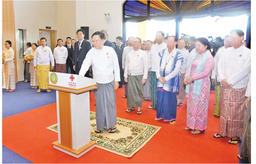
နိုင်ငံတော်စီမံအုပ်ချုပ်ရေးကောင်စီဥက္ကဋ္ဌ နိုင်ငံတော်ဝန်ကြီးချုပ်ကိုယ်စား နိုင်ငံတော်စီမံအုပ်ချုပ်ရေးကောင်စီ အတွင်းရေးမှူး ဒုတိယဗိုလ်ချုပ်ကြီး အောင်လင်းဒွေး မြန်မာနိုင်ငံ ရောဂါကာကွယ်ထိန်းချုပ်ရေးဗဟိုဌာနနှင့် သင်တန်းကျောင်းအဆောက်အအုံကို စက်ခလုတ်နှိပ်ဖွင့်လှစ်ပေးစဉ်။

* ရှေ့ဖို့မှ တာဝန်ရှိသူများ၊ အာဆီယံအဖွဲ့ဝင်နိုင်ငံများမှ ကိုယ်စားလှယ်များနှင့် ဖိတ်ကြားထားသူများ တက်ရောက်ကြသည်။