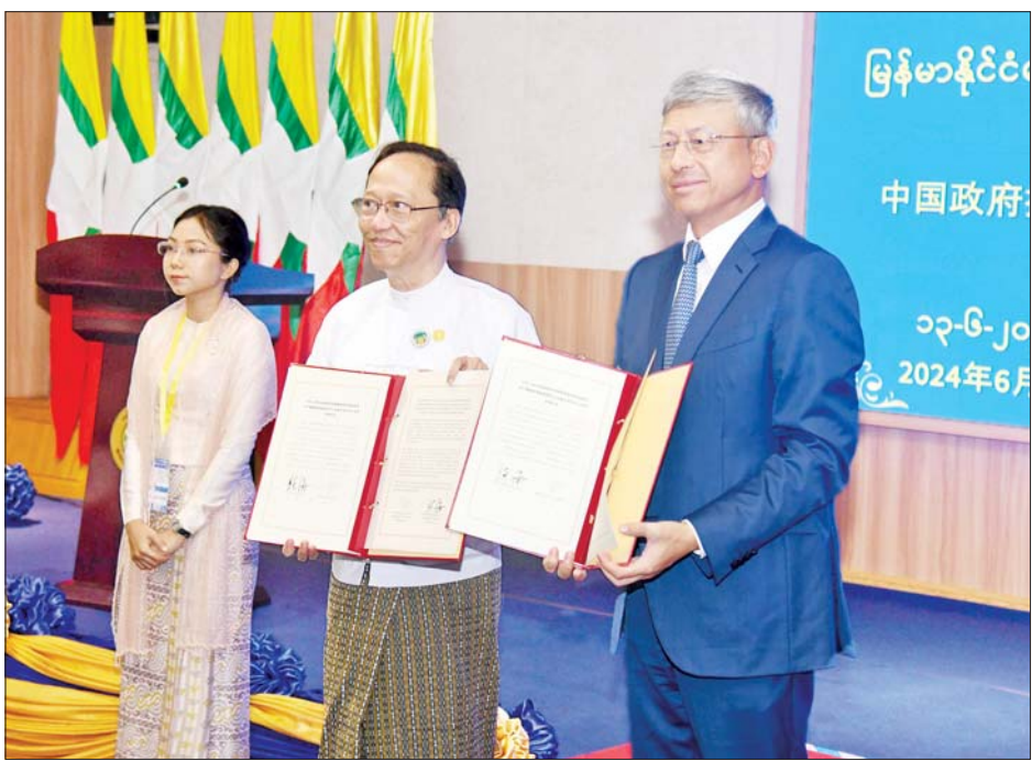
တရုတ်ပြည်သူ့သမ္မတနိုင်ငံ သံအမတ်ကြီး မစ္စတာချန်းဟိုင် မြန်မာနိုင်ငံ ရောဂါကာကွယ်ထိန်းချုပ်ရေးဗဟိုဌာနနှင့် သင်တန်းကျောင်းအဆောက်အအုံနှင့်ပတ်သက်သည့် စာရွက်စာတမ်းများအား ကျန်းမာရေးဝန်ကြီးဌာန ပြည်ထောင်စုဝန်ကြီး ဒေါက်တာသက်ခိုင်ဝင်းထံ လွှဲပြောင်းပေးအပ်စဉ်။

ပြည်သူ့ကျန်းမာရေးလုံခြုံမှုနှင့် ပြည်သူ့ကျန်းမာရေး အရေးပေါ်အခြေအနေများကို ပိုမိုထိရောက်စွာ စီမံခန့်ခွဲ ကိုင်တွယ်ဖြေရှင်းနိုင်ရန် ကမ္ဘာ့နိုင်ငံများအနေဖြင့် အားကောင်းခိုင်မာပြီး အရည်အသွေးပြည့်ဝသည့် ကျန်းမာရေးအဖွဲ့အစည်းများရှိရန် အရေးကြီးသည်ကို သတိပြုမိခဲ့ကြကြောင်း၊ ထို့ကြောင့် ကျန်းမာရေးအဖွဲ့အစည်းများကို ပိုမိုထိရောက်စွာ ပံ့ပိုးကူညီနိုင်ရန်အတွက် ကမ္ဘာ့နိုင်ငံများတွင် Centers for Disease Control and Prevention-CDC ဟု ခေါ်သည့် စာမျက်နှာ ၄ သို့ *