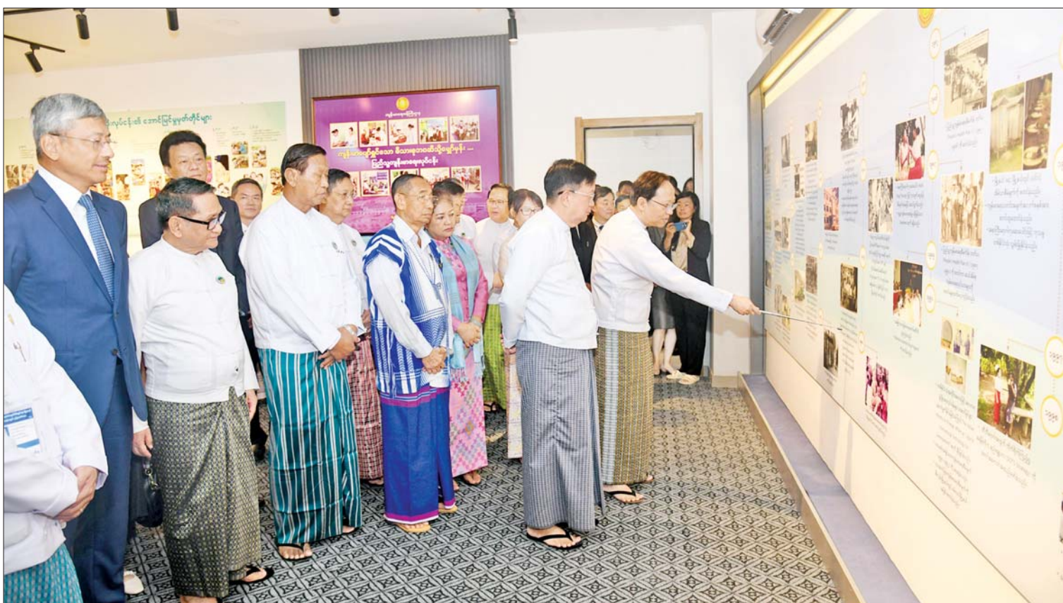
နိုင်ငံတော်စီမံအုပ်ချုပ်ရေးကောင်စီဥက္ကဋ္ဌ နိုင်ငံတော်ဝန်ကြီးချုပ်ကိုယ်စား နိုင်ငံတော်စီမံအုပ်ချုပ်ရေးကောင်စီအတွင်းရေးမှူး ဒုတိယဗိုလ်ချုပ်ကြီး အောင်လင်းဒွေး မြန်မာနိုင်ငံ ရောဂါကာကွယ်ထိန်းချုပ်ရေးဗဟိုဌာနနှင့် သင်တန်းကျောင်းရှိ CDC ပြခန်းငယ်ကို လှည့်လည်ကြည့်ရှုစဉ်။

မြန်မာနိုင်ငံ၏ ကျန်းမာရေးအဆင့်အတန်းကို နိုင်ငံတကာနှင့်ရင်ပေါင်တန်းပြီး တိုးတက်အောင်ဆောင်ရွက်နိုင်စေမည်ဖြစ်ပြီး အပြည်ပြည်ဆိုင်ရာ ကျန်းမာရေးပြဋ္ဌာန်းချက်နှင့် ကမ္ဘာလုံးဆိုင်ရာ ကျန်းမာရေးလုံခြုံမှုဆိုင်ရာ အစီအမံများကိုလည်း ပိုမိုထိရောက်စွာ ဆောင်ရွက်လာနိုင်မည်