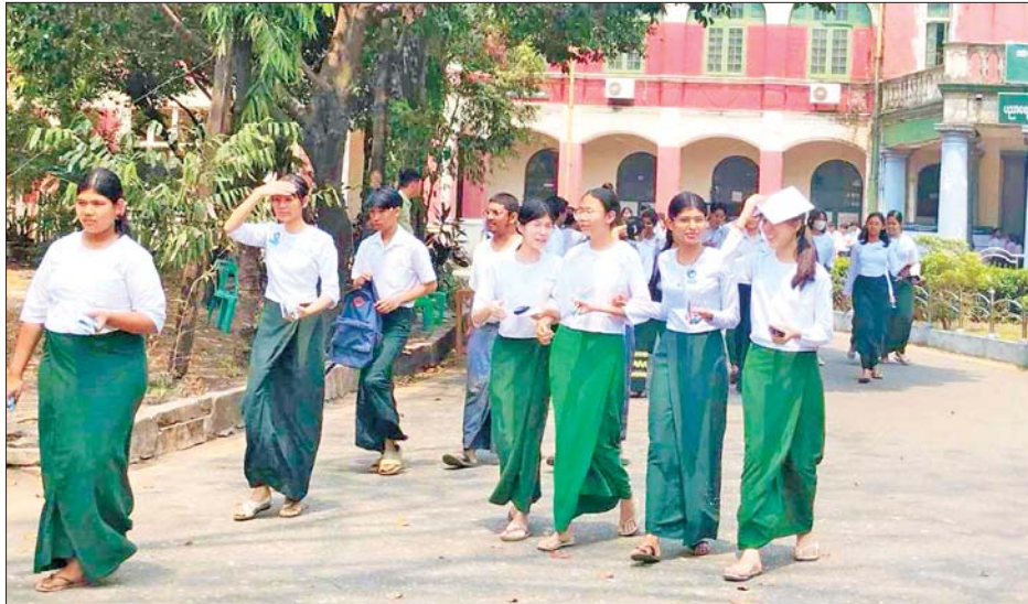
ဗိုလ်တထောင်အမှတ်(၆) အထက်တန်းကျောင်းစာစစ်ဌာနတွင် စနစ်သစ်ဘာသာရပ်များကို ဖြေဆိုခဲ့ကြစဉ်။

“၂၀၂၄ ခုနှစ် တက္ကသိုလ်ဝင်စာမေးပွဲ အောင်မြင်