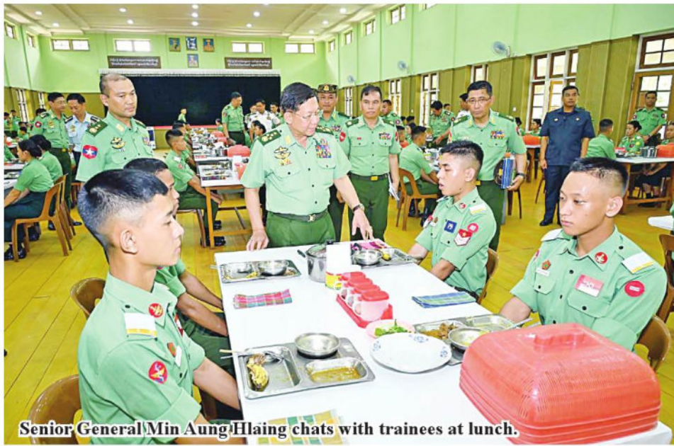
Senior General Min Aung Hlaing chats with trainees at lunch.

level. As the DSMA was set up to fulfill the needs of the country and Tatmadaw, cadets must try to be good medical officers skilled in