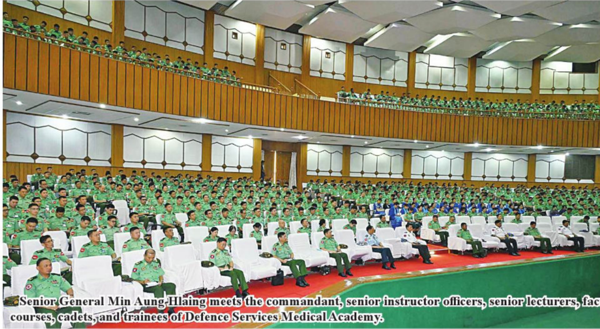
Senior General Min Aung Hlaing meets the commandant, senior instructor officers, senior lecturers, faculty members, assigned officers, students of master's degree courses, cadets, and trainees of Defence Services Medical Academy.