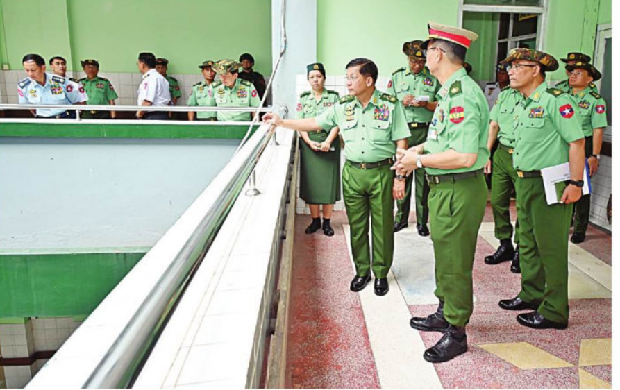
နိုင်ငံတော်စီမံအုပ်ချုပ်ရေးကောင်စီဥက္ကဋ္ဌ တပ်မတော်ကာကွယ်ရေးဦးစီးချုပ် ဗိုလ်ချုပ်မှူးကြီးမင်းအောင်လှိုင် ရန်ကုန်မြို့ရှိ တပ်မတော်အရိုးရောဂါအထူးကုဆေးရုံကြီးအတွင်း လှည့်လည်ကြည့်ရှုစဉ်။

စာမျက်နှာ ၁၈ မှအဆက် ထို့နောက် နိုင်ငံတော်စီမံအုပ်ချုပ်ရေးကောင်စီဥက္ကဋ္ဌ နိုင်ငံတော်ဝန်ကြီးချုပ်က နိဂုံးချုပ်အမှာစကား ပြောကြားရာတွင် တိုင်းဒေသကြီးအတွင်း တိုက်တွန်းချက်၊ နှိုးဆော်ချက်များကို ပြည်သူများသိရှိစေရေး သတင်းမီဒီယာများမှတစ်ဆင့်