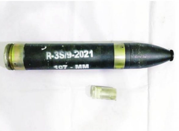
ဇွန် ၈ ရက်နှင့် ၉ ရက်တို့တွင် သန်လျင်တံတား အမှတ်(၃)ဖွင့်ပွဲအခမ်းအနား ပစ်ခတ်မည့် ၁၀၇မမ ရှော့တိုက်ခွဲနှင့်ဆက်စပ် ပစ္စည်းများ သိမ်းဆည်းရမိမှု မှတ်တမ်းဓာတ်ပုံ။