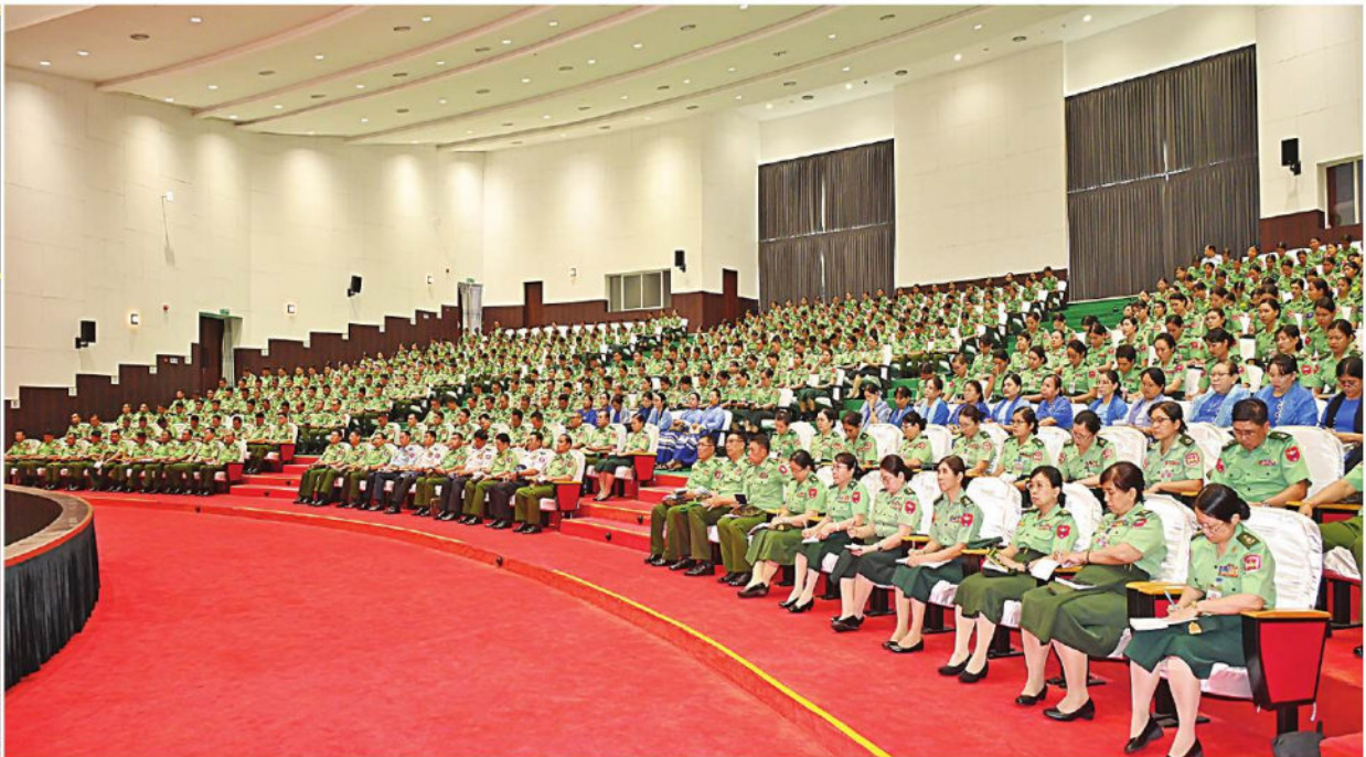
နိုင်ငံတော်စီမံအုပ်ချုပ်ရေးကောင်စီဥက္ကဋ္ဌ တပ်မတော်ကာကွယ်ရေးဦးစီးချုပ် ဗိုလ်ချုပ်မှူးကြီးမင်းအောင်လှိုင် တပ်မတော်သူနာပြုနှင့် ဆေးဘက်ပညာတက္ကသိုလ်၌ ကျောင်းအုပ်ကြီး၊ နည်းပြအရာရှိကြီးများ၊ ကထိကအရာရှိကြီးများ၊ ဆရာ၊ ဆရာမကြီးများ၊ သန္ဓေအရာရှိများနှင့် သင်တန်းသား၊ သင်တန်းသူများကို တွေ့ဆုံအမှာစကားပြောကြားစဉ်။

နေပြည်တော် ဇွန် ၁၀ တက္ကသိုလ်နှင့် တပ်မတော်သူနာပြုနှင့် လွန်သင်တန်းသားများ၊ ဗိုလ်လောင်း အဆိုပါတွေ့ဆုံပွဲများသို့ နိုင်ငံ ရေးဦးစီးချုပ်(လေ) ဗိုလ်ချုပ်ကြီး နိုင်ငံတော်စီမံအုပ်ချုပ်ရေးကောင်စီ ဥက္ကဋ္ဌ ထွန်းအောင်၊ ပြည်ထောင်စုအဆင့် ပြည်ထောင်စုအဆင့် ဥက္ကဋ္ဌ တပ်မတော်ကာကွယ်ရေးဦးစီးချုပ် အုပ်ကြီးများ၊ နည်းပြအရာရှိကြီးများ၊ တက္ကသိုလ်အလိုက် ဘွဲ့နှင့်သဘင်ခန်းမ များ၌ သီးခြားစီတွေ့ဆုံ၍ အမှာစကား ပြောကြားသည်။ အတူ ကာကွယ်ရေးဦးစီးချုပ်(ရေ) ဒုတိယဗိုလ်ချုပ်ကြီးဝင်းမြင့်၊ ကာကွယ် စာမျက်နှာ ၁၉ ကော်လံ ၁ ☆