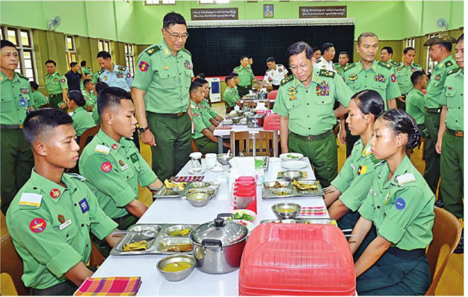
နိုင်ငံတော်စီမံအုပ်ချုပ်ရေးကောင်စီဥက္ကဋ္ဌ တပ်မတော်ကာကွယ်ရေးဦးစီးချုပ် ဗိုလ်ချုပ်မှူးကြီးမင်းအောင်လှိုင် တပ်မတော်ဆေးတက္ကသိုလ်မှ ဗိုလ်လောင်းများအား ရင်းရင်းနှီးနှီးဆက်စဉ်။