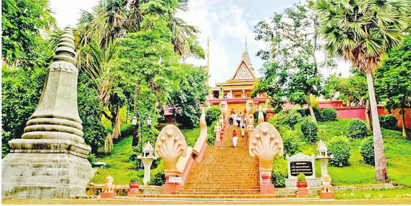
ကမ္ဘောဒီးယားနိုင်ငံ ဖနောင်းပင်မြို့ရှိ အထင်ကရနေရာတစ်ခုဖြစ်သည့် Wat Phnom ကို တွေ့ရစဉ်။