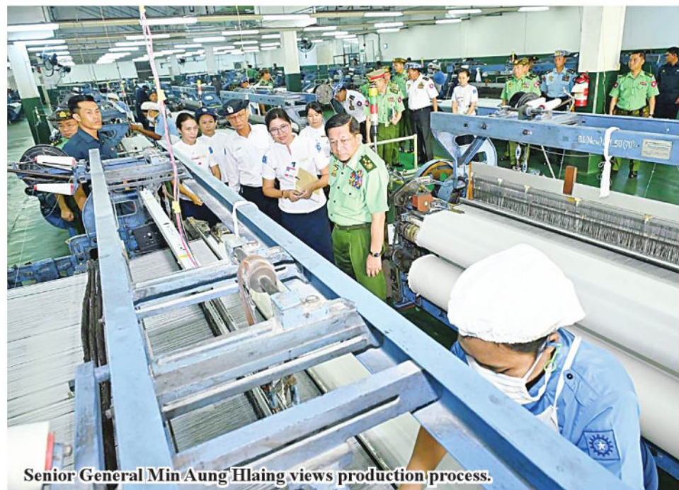
Senior General Min Aung Hlaing views production process.

The Tatmadaw Textile and Garment Factory (Thamaing) is known for producing high-quality items such as brown textile, tetron