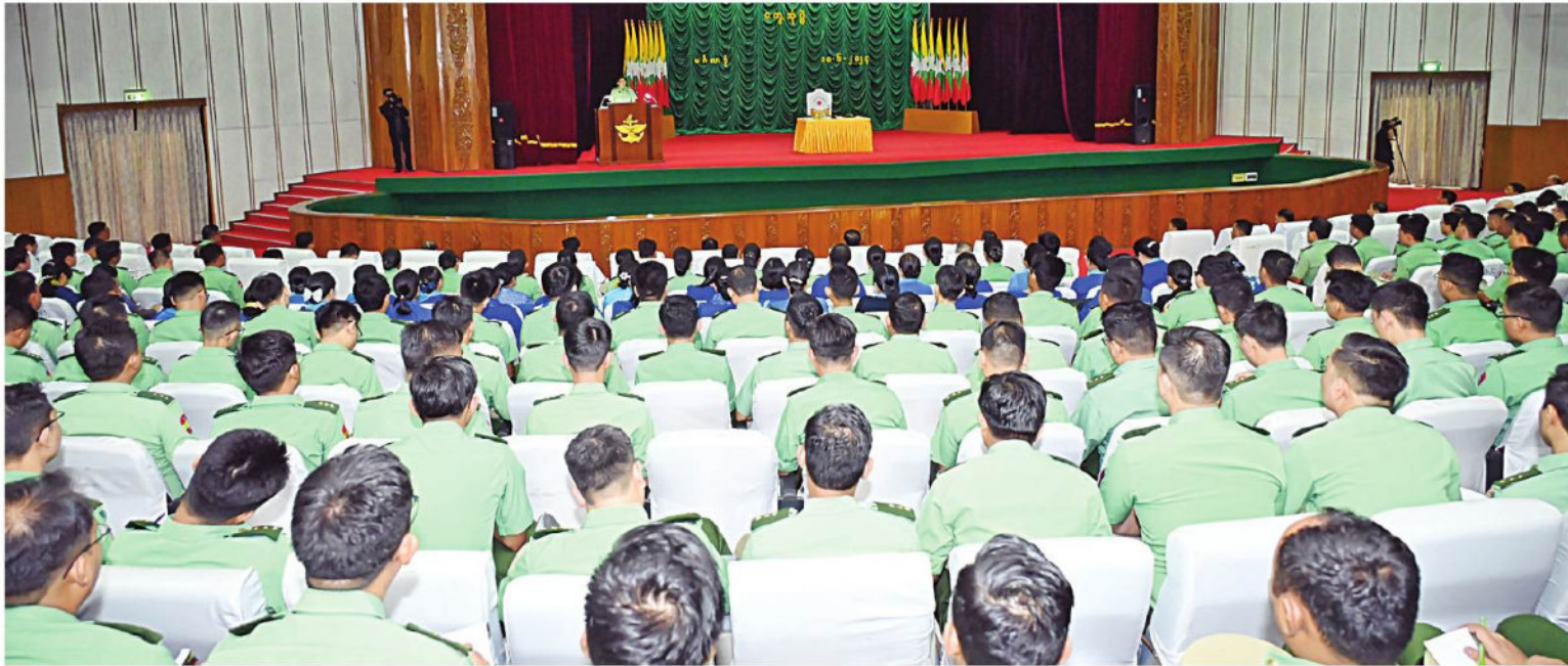
နိုင်ငံတော်စီမံအုပ်ချုပ်ရေးကောင်စီဥက္ကဋ္ဌ တပ်မတော်ကာကွယ်ရေးဦးစီးချုပ် ဗိုလ်ချုပ်မှူးကြီးမင်းအောင်လှိုင် တပ်မတော်ဆေးတက္ကသိုလ်၌ ကျောင်းအုပ်ကြီး၊ နည်းပြ အရာရှိကြီးများ၊ ကထိကအရာရှိကြီးများ၊ ဆရာ၊ ဆရာမကြီးများ၊ သန္ဓေအရာရှိများနှင့် မဟာဘွဲ့လွန်သင်တန်းသားများ၊ ဗိုလ်လောင်းများအား တွေ့ဆုံအမှာစကားပြောကြားစဉ်။

★ ကျော့မှူးမှအဆက် ရန်ကုန်တိုင်းစစ်ဌာနချုပ် တိုင်းမှူး၊ ကျောင်းအုပ်ကြီးများ၊ နည်းပြအရာရှိကြီး များ၊ ကထိကအရာရှိကြီးများ၊ ဆရာ၊ ဆရာမကြီးများ၊ သန္ဓေအရာရှိများ နှင့် မဟာဘွဲ့လွန်သင်တန်းသားများ၊ ဗိုလ်လောင်းများ၊ သင်တန်းသား၊ သင်တန်းသူ များ တက်ရောက်ကြသည်။