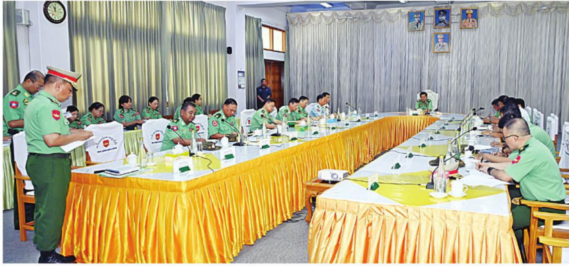
နိုင်ငံတော်စီမံအုပ်ချုပ်ရေးကောင်စီဥက္ကဋ္ဌ တပ်မတော်ကာကွယ်ရေးဦးစီးချုပ် ဗိုလ်ချုပ်မှူးကြီးမင်းအောင်လှိုင်အား တပ်မတော် ဆေးတက္ကသိုလ် ဝေကြွကျောင်းအုပ်ကြီးက လေ့ကျင့်ရေးပိုင်းဆိုင်ရာ ဆောင်ရွက်နေမှုအခြေအနေများကို ရင်းလင်းတင်ပြစဉ်။

သည့်တက္ကသိုလ်အတွက် ဂုဏ်ယူကြရန် လိုကြောင်း၊ ယခင်က သင်တန်းသားများကို သာ ခေါ်ယူလေ့ကျင့်ပေးလျက်ရှိသော် လည်း လက်ရှိအချိန်တွင် အမျိုးသမီး သင်တန်းသူများကိုလည်း ခေါ်ယူလေ့ကျင့် သင်ကြားပေးလျက်ရှိကြောင်း၊ ဆေးပညာ ရပ်သည် အရေးကြီးသည့်ဘာသာရပ်ဖြစ် သဖြင့် စနစ်တကျသင်ယူလေ့လာကြရန် မှာကြားလိုကြောင်း၊ ထို့ပြင် အဆင့်မြင့် ဆေးပညာရပ်များကို သင်ယူလျက်ရှိသည့် မဟာဘွဲ့လွန် သင်တန်းသားများအနေဖြင့် လည်း မိမိတို့သင်ယူနေရသည့် ဘာသာရပ် အလိုက် အလေးထားသင်ယူလေ့လာ သွားကြရန်လိုကြောင်း၊ နိုင်ငံတော်နှင့် တပ်မတော်က အချိန်နှင့် ငွေကြေးအရင်း