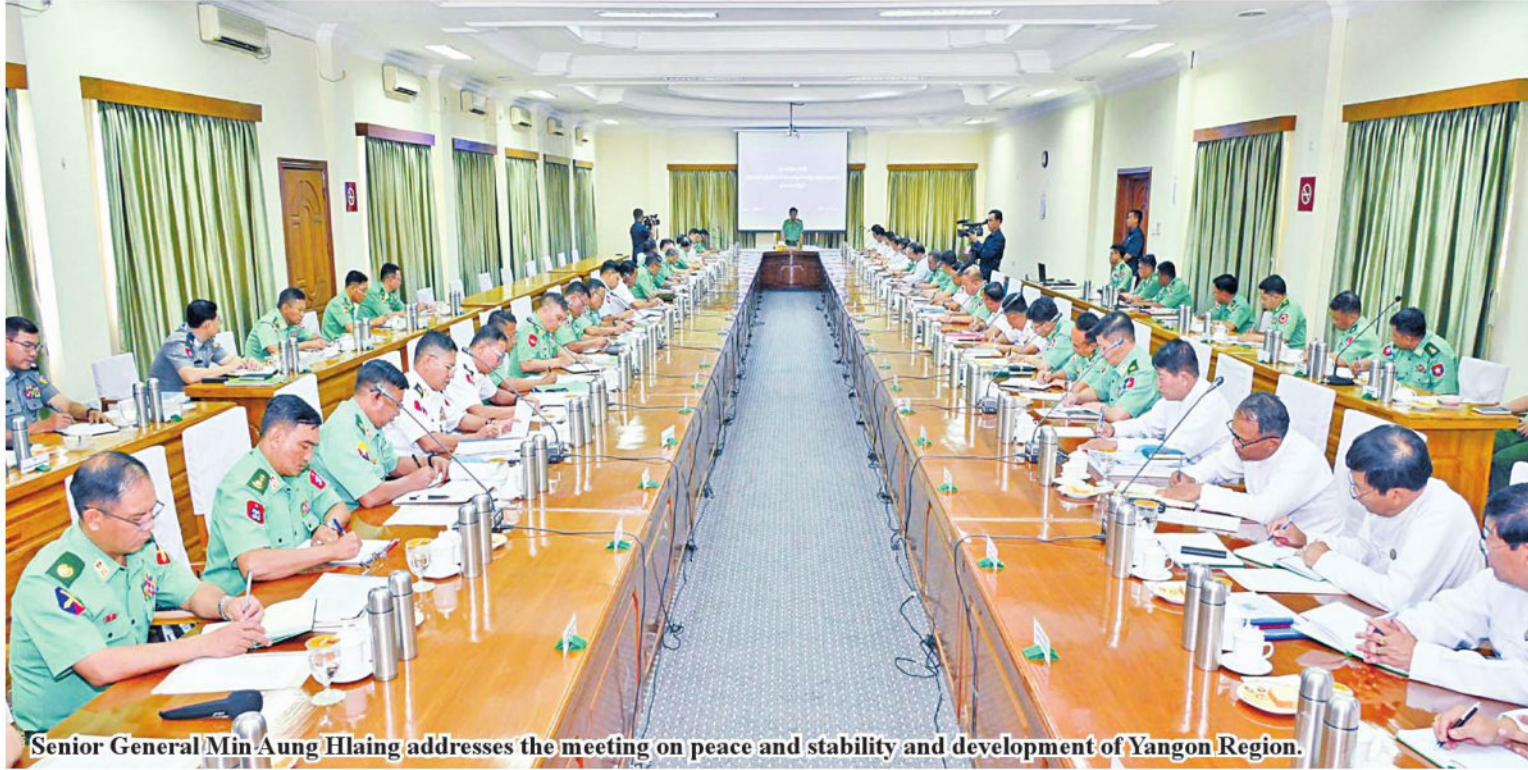
Senior General Min Aung Hlaing addresses the meeting on peace and stability and development of Yangon Region.