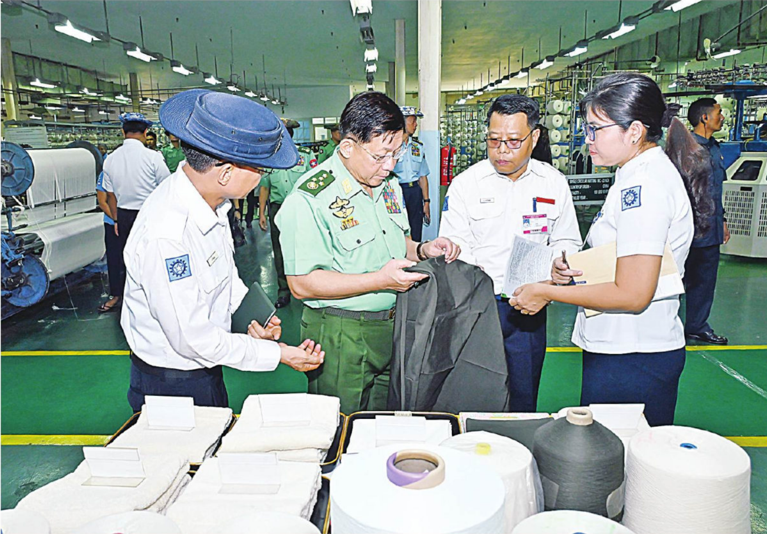
နိုင်ငံတော်စီမံအုပ်ချုပ်ရေးကောင်စီဥက္ကဋ္ဌ တပ်မတော်ကာကွယ်ရေးဦးစီးချုပ် ပိုလ်ချုပ်မှူးကြီးမင်းအောင်လှိုင် တပ်မတော်ချည်မျှင်နှင့် အထည်စက်ရုံ(သမိုင်း) အတွင်း ချည်မျှင်နှင့်အထည်များကို အဆင့်ဆင့်ထုတ်လုပ်နေမှုအခြေအနေများအား လှည့်လည်ကြည့်ရှုစစ်ဆေးစဉ်။

နေပြည်တော် ၉ ဇွန် ၁၀ နိုင်ငံတော်စီမံအုပ်ချုပ်ရေးကောင်စီ ဥက္ကဋ္ဌ တပ်မတော်ကာကွယ်ရေးဦးစီးချုပ် ပိုလ်ချုပ်မှူးကြီး မင်းအောင်လှိုင်သည် ခရီးစဉ်တွင် လိုက်ပါလာသည့် အဖွဲ့ဝင်များ၊ ရန်ကုန်တိုင်းစစ်ဌာနချုပ် တိုင်းမှူးနှင့် အဖွဲ့ဝင်များလိုက်ပါ၍ ယနေ့နံနက်ပိုင်းတွင် ရန်ကုန်တိုင်းဒေသကြီးလှိုင်မြို့နယ် အမှတ်(၁၂)ရပ်ကွက်ရှိ တပ်မတော်ချည်မျှင်နှင့် အထည်စက်ရုံ(သမိုင်း)သို့ သွားရောက်ကြည့်ရှုစစ်ဆေးသည်။ ဦးစွာ နိုင်ငံတော်စီမံအုပ်ချုပ်ရေးကောင်စီဥက္ကဋ္ဌ တပ်မတော်ကာကွယ်ရေးဦးစီးချုပ်အား တပ်မတော်ချည်မျှင်နှင့် အထည်စက်ရုံ(သမိုင်း) စက်ရုံအစည်းအဝေးခန်းမတွင် စစ်ထောက်ချုပ် ဒုတိယပိုလ်ချုပ်ကြီး ကျော်စွာလင်းက တပ်မတော် ဝါစိုက်ပျိုးရေးတပ်များက ဝါစိုက်ပျိုးရေးလုပ်ငန်းအကောင်အထည်ဖော်ဆောင်ရွက်လျက်ရှိမှု အခြေအနေများ၊ နိုင်ငံတော်စီမံအုပ်ချုပ်ရေးကောင်စီဥက္ကဋ္ဌ တပ်မတော်ကာကွယ်ရေးဦးစီးချုပ် တပ်မတော် ဝါစိုက်ပျိုးရေးတပ်များသို့ ရောက်ရှိစစ်ဆေးစဉ် လမ်းညွှန်မှာကြားချက်များကို လိုက်နာဆောင်ရွက်ပြီးစီးမှု အခြေအနေများ၊ စိုက်ပျိုးရာသီအလိုက် လုပ်ငန်းများ အဆင့်ဆင့်ဆောင်ရွက်ခဲ့မှုနှင့် စာမျက်နှာ ၁၇ ကော်လံ ၁၂။