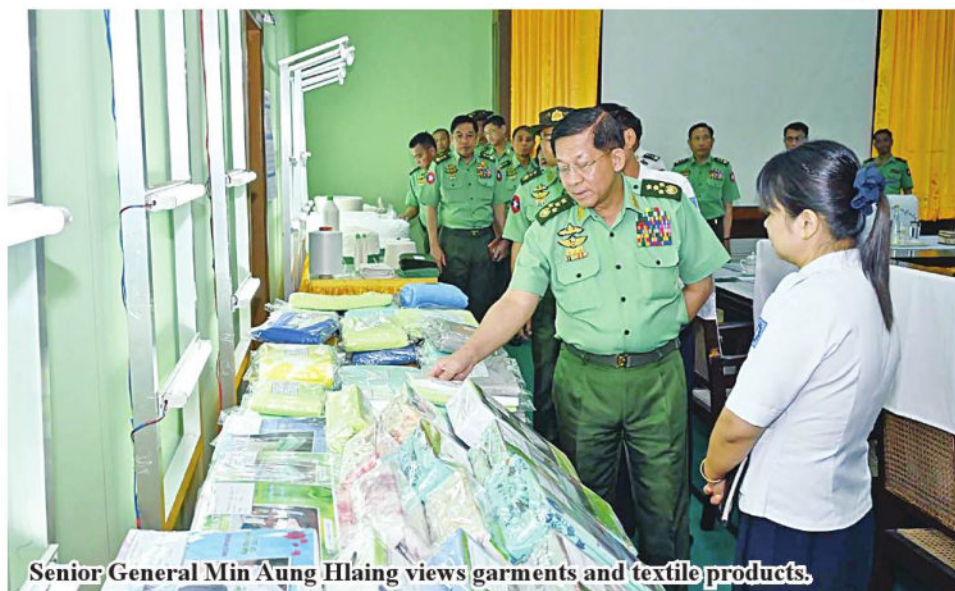
Senior General Min Aung Hlaing views garments and textile products.

quality cotton, it is essential to produce high-quality cotton. The Tatmadaw Textile and Garment Factory (Thamaing) is responsible for producing necessary garments and textile items at affordable prices. Proper planning and consideration should be given to ensure this. He then viewed the textile products displayed in the factory.