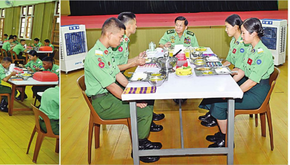
နိုင်ငံတော်စီမံအုပ်ချုပ်ရေးကောင်စီဥက္ကဋ္ဌ တပ်မတော်ကာကွယ်ရေးဦးစီးချုပ် ဗိုလ်ချုပ်မှူးကြီးမင်းအောင်လှိုင် တပ်မတော်ဆေးတက္ကသိုလ်မှ ဗိုလ်လောင်းများနှင့်အတူ နေ့လယ်စာကို အတူတကွသုံးဆောင်စဉ်။