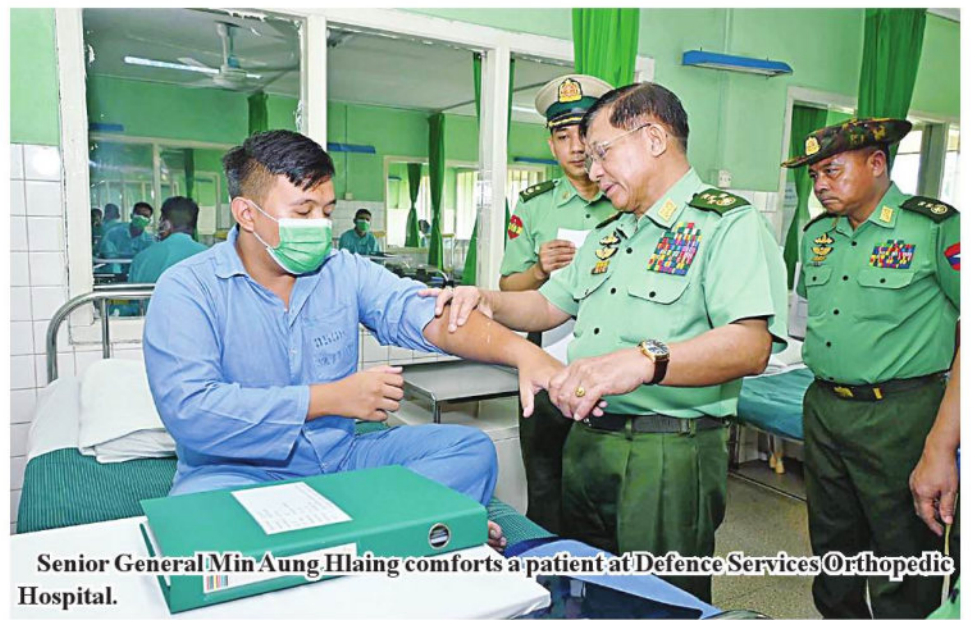
Senior General Min Aung Hlaing comforts a patient at Defence Services Orthopaedic Hospital.

Afterward, the Senior General heard reports on healthcare services and operations of the hospital presented by the commandant of the hospital at the meeting hall of the hospital. After hearing the reports, the Senior General discussed measures for the cleanliness and pleasantness of the hospital and its upgrading tasks.