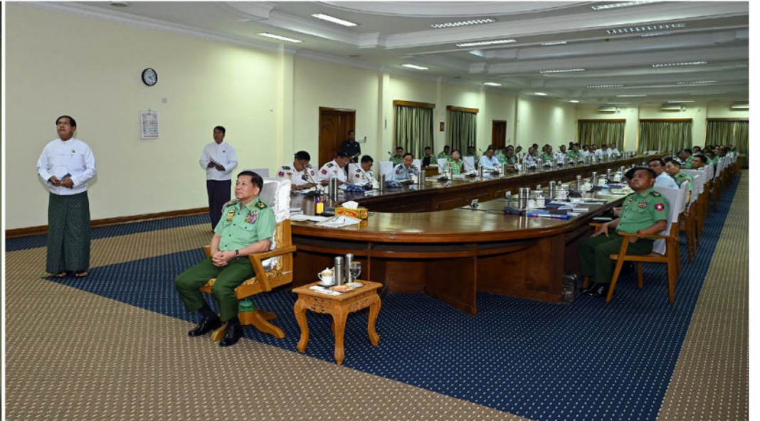
နိုင်ငံတော်စီမံအုပ်ချုပ်ရေးကောင်စီဥက္ကဋ္ဌ နိုင်ငံတော်ဝန်ကြီးချုပ် ဗိုလ်ချုပ်မှူးကြီးမင်းအောင်လှိုင်အား ရန်ကုန်တိုင်းဒေသကြီးဝန်ကြီးချုပ် ဦးစိုးသိန်းက ရန်ကုန်တိုင်းဒေသကြီးဖွံ့ဖြိုးတိုးတက်ရေးဆောင်ရွက်လျက်ရှိမှု၊ လမ်းပန်းဆက်သွယ်မှုများ တိုးတက်ကောင်းမွန်စေရေးဆောင်ရွက်လျက်ရှိမှုအခြေအနေများနှင့်ပတ်သက်၍ ရှင်းလင်းတင်ပြစဉ်။