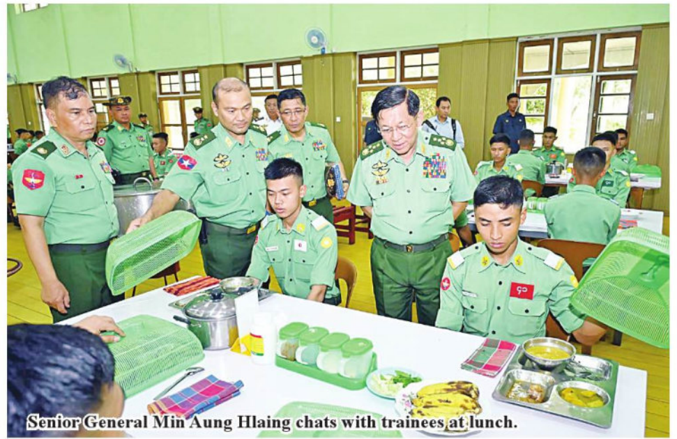
Senior General Min Aung Hlaing chats with trainees at lunch.

meetings with the commandants, senior instructor officers, senior lecturers, faculty members, assigned