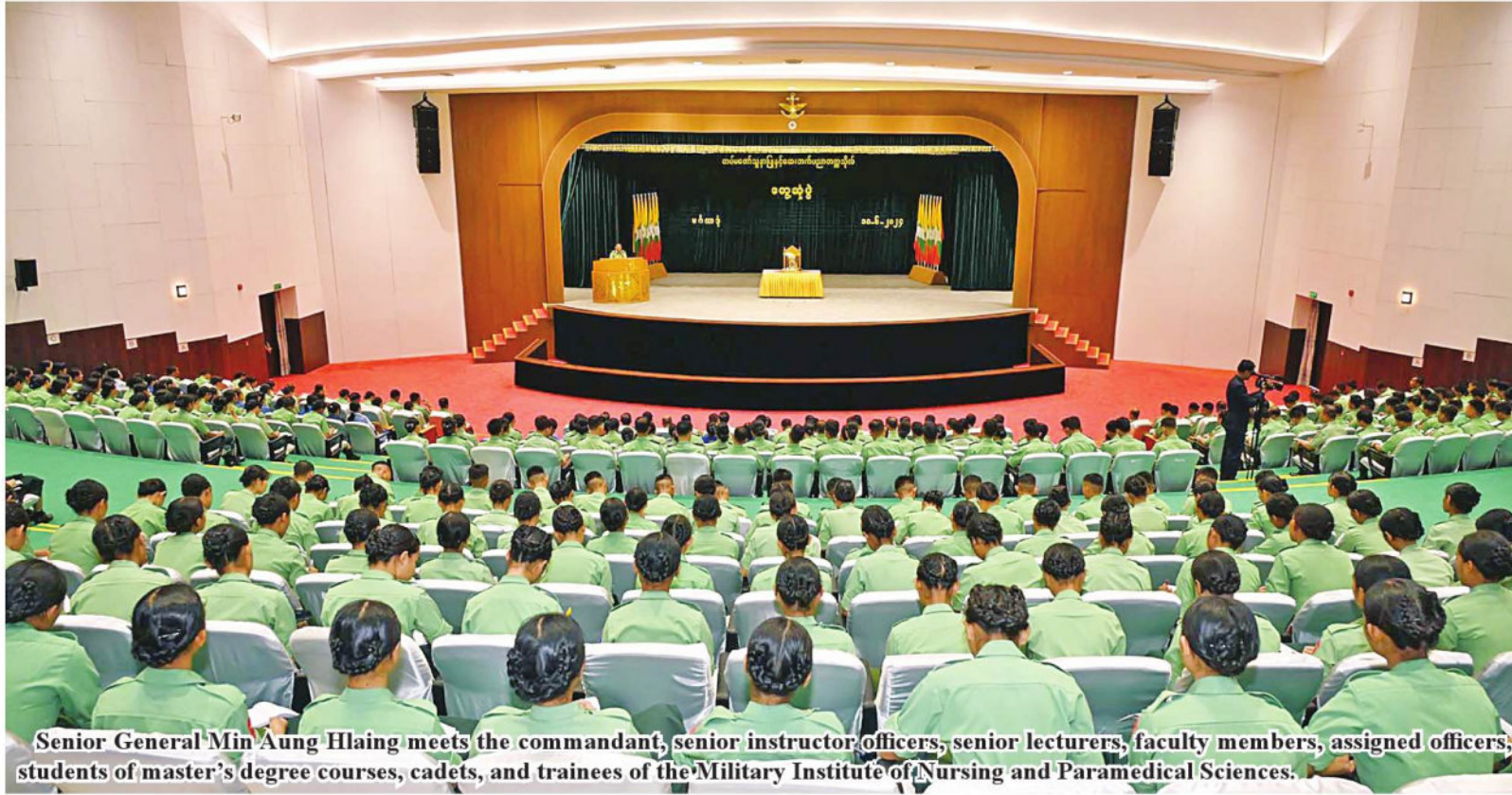
Senior General Min Aung Hlaing meets the commandant, senior instructor, officers, senior lecturers, faculty members, assigned officers, students of master's degree courses, cadets, and trainees of the Military Institute of Nursing and Paramedical Sciences.