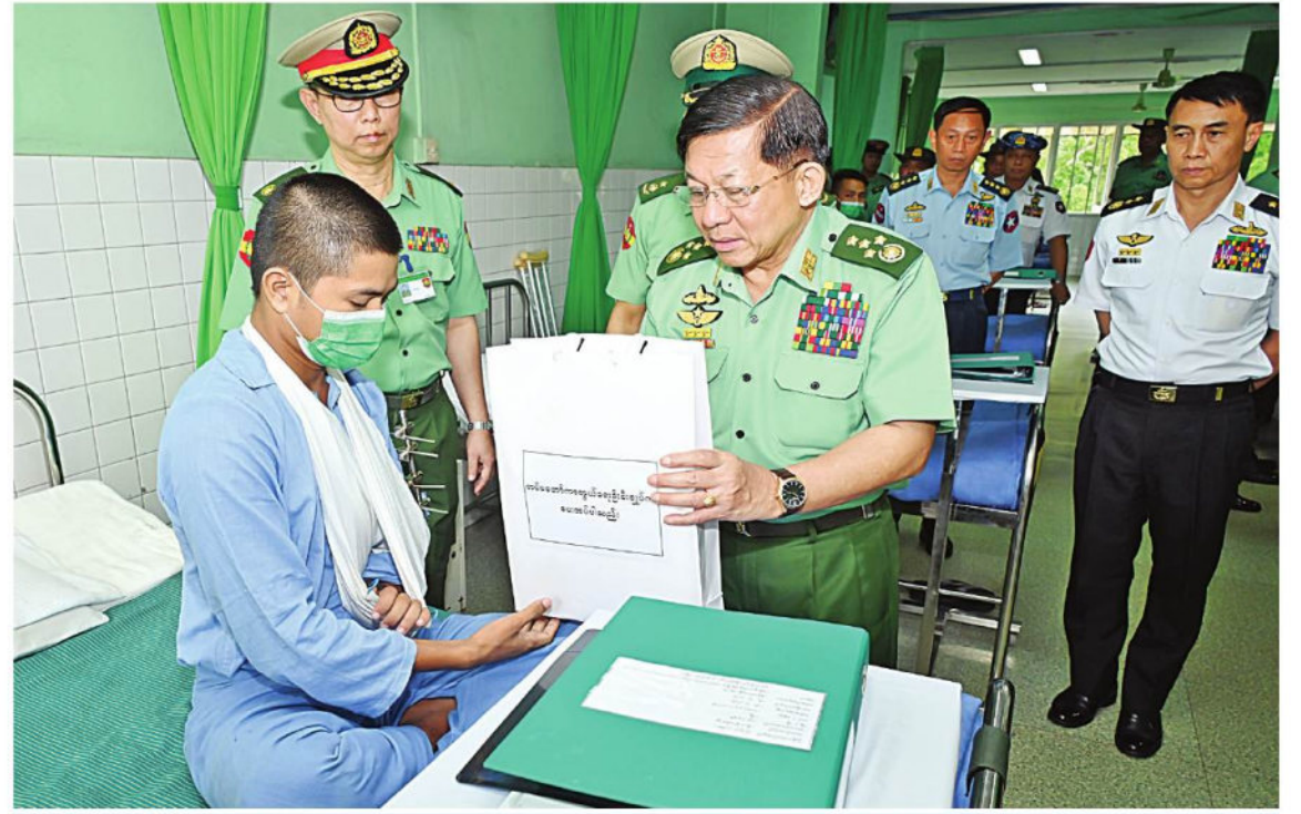
နိုင်ငံတော်စီမံအုပ်ချုပ်ရေးကောင်စီဥက္ကဋ္ဌ တပ်မတော်ကာကွယ်ရေးဦးစီးချုပ် ဗိုလ်ချုပ်မှူးကြီးမင်းအောင်လှိုင် ဆေးရုံတက်ရောက် ကုသမှုခံယူလျက်ရှိသည့် နိုင်ငံတော်ကာကွယ်ရေးနှင့် လုံခြုံရေးတာဝန်များ ထမ်းဆောင်စဉ် ထိခိုက်ဒဏ်ရာရရှိခဲ့သော အရာရှိ၊ စစ်သည် များ၏ ထိခိုက်ဒဏ်ရာရရှိခဲ့မှုအခြေအနေများ၊ ရောဂါကုသပျောက်ကင်းမှုအခြေအနေများကို တစ်ဦးချင်းလိုက်လံတွေ့ဆုံ၍ ရင်းနှီး နှေးနှေးစွာမေးမြန်းပြီး အားပေးစကားပြောကြားကာ လက်ဆောင်ပစ္စည်းများ ပေးအပ်စဉ်။

ခြင်းဖြစ်သဖြင့် စာပေပညာနှင့် စစ်ပညာ သင်ကြားမှုများကို ဖိစိစီးစီးဆောင်ရွက်ကြ ရန်လိုကြောင်း၊ လေ့ကျင့်သင်ကြားပေးနေသူ နည်းပြများအနေဖြင့် သင်တန်းသားများကို လေ့ကျင့်ပေးရာတွင် အရေအတွက်ထက် အရည်အချင်းပြည့်ဝသည့် သင်တန်းသား များဖြစ်လာစေရေးနှင့် စစ်သားကောင်း ဖြစ်အောင် လေ့ကျင့်ပေးရန်လိုကြောင်း၊ Guardian စနစ်ဖြင့် အဆင့်ဆင့်ကြပ်မတ် ကွပ်ကဲဆောင်ရွက်ရာတွင် သင်တန်းသား များ၏ စိတ်ဓာတ်၊ စည်းကမ်း၊ စာပေပညာ ဆိုင်ရာများ ကောင်းမွန်စေရေး အနီးကပ် တစ်ဦးချင်း ကြပ်မတ်ကွပ်ကဲလေ့ကျင့် သင်ကြား ဆောင်ရွက်နိုင်ရမည်ဖြစ်ပြီး ၎င်းတို့၏အခက်အခဲများအပေါ် မိဘသဖွယ်၊ ညီရင်းအစ်ကိုသဖွယ် သဘောထား၍ တတ်နိုင်သရွေ့ ဖြေရှင်းဆောင်ရွက်ပေးရန် လိုကြောင်း၊ အရည်အချင်းပြည့်ဝသည့် နည်းပြများ၊ ဆရာ၊ ဆရာမများကို ရွေးချယ် ခန့်အပ်ထားခြင်းဖြစ်သဖြင့် မိမိတို့ ဖြတ်သန်းလာရသည့် ဘဝအတွေ့အကြုံ၊ တတ်ကျွမ်းထားသည့် ဘာသာရပ်များ အလိုက် စာပေပညာရပ်များကို အသုံးပြု၍ လေ့ကျင့်သင်ကြားပေးရန်လိုပြီး ဆေးဘက် ပညာဆိုင်ရာ အရာရှိကောင်းများကို မွေးထုတ်ပေးရန်လိုကြောင်း၊ ရုပ်ပိုင်း၊ စိတ်ပိုင်းဆိုင်ရာ ကြံ့ခိုင်ကောင်းမွန်ပြီး အရည် အသွေးရှိသည့် ဆေးဘက်ဆိုင်ရာ အရာရှိ ကောင်းများ မွေးထုတ်ပေးနိုင်ရေး ကြပ်မတ် ဆောင်ရွက်ကြရန်လိုကြောင်း၊ တပ်မတော် ဆေးတက္ကသိုလ်က မွေးထုတ်ပေးလိုက်သည့် ဆေးဘက်ဆိုင်ရာ အရာရှိများအနေဖြင့် အခြေခံအားဖြင့် ကျန်းမာရေးစောင့်ရှောက် မှုများ ဆောင်ရွက်ပေးနိုင်သူများဖြစ်ပြီး