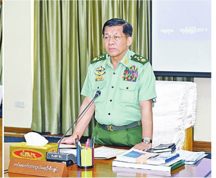
နိုင်ငံတော်စီမံအုပ်ချုပ်ရေးကောင်စီဥက္ကဋ္ဌ နိုင်ငံတော်ဝန်ကြီးချုပ် ဗိုလ်ချုပ်မှူးကြီးမင်းအောင်လှိုင် ရန်ကုန်တိုင်းဒေသကြီး တည်ငြိမ်အေးချမ်းရေးနှင့်ဖွံ့ဖြိုးတိုးတက်ရေးအစည်းအဝေးတွင် အဖွင့်အမှာစကားပြောကြားစဉ်။

နေပြည်တော် ၉ နံနက် ၁၀ ရန်ကုန်တိုင်းဒေသကြီး တည်ငြိမ်အေးချမ်းရေးနှင့် ဖွံ့ဖြိုးတိုးတက်ရေးအစည်းအဝေးကို ယနေ့ညနေပိုင်းတွင် ရန်ကုန်တိုင်းဒေသကြီး ကုန်းမြင့်သာရှိ အစည်းအဝေးခန်းမ၌ ကျင်းပရာ နိုင်ငံတော်စီမံအုပ်ချုပ်ရေးကောင်စီ ဥက္ကဋ္ဌ နိုင်ငံတော်ဝန်ကြီးချုပ် ဗိုလ်ချုပ်မှူးကြီးမင်းအောင်လှိုင် တက်ရောက်အမှာစကားပြောကြားသည်။ အစည်းအဝေးသို့ ကောင်စီတွဲဖက်အတွင်းရေးမှူး ဒုတိယဗိုလ်ချုပ်ကြီးရဲဝင်းဦး၊ ကောင်စီဝင်များဖြစ်ကြသည့် ဗိုလ်ချုပ်ကြီးတင်အောင်စန်း၊ ဒုတိယဗိုလ်ချုပ်ကြီးညိုစော၊ပြည်ထောင်စုဝန်ကြီး