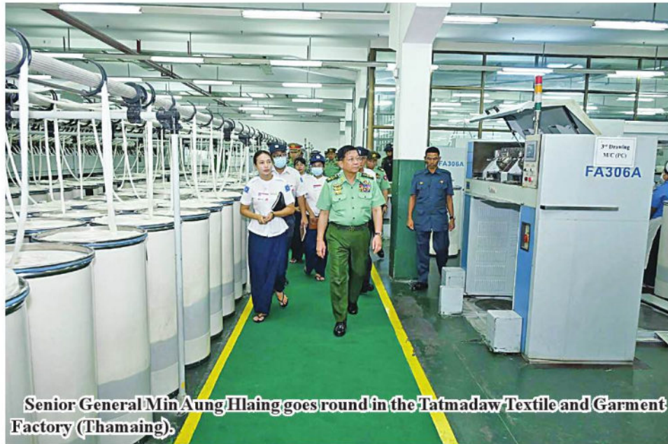
Senior General Min Aung Hlaing goes round in the Tatmadaw Textile and Garment Factory (Thamaing).

Nay Pyi Taw June 10 Chairman of the State Administration Council Commander-in-Chief of Defence Services Senior General Min Aung Hlaing, accompanied by his entourage members, the Yangon Command Commander and members, visited the Tatmadaw Textile and Garment Factory (Thamaing) located in Hlaing Township, Yangon Region, Ward (12), this morning to inspect it.