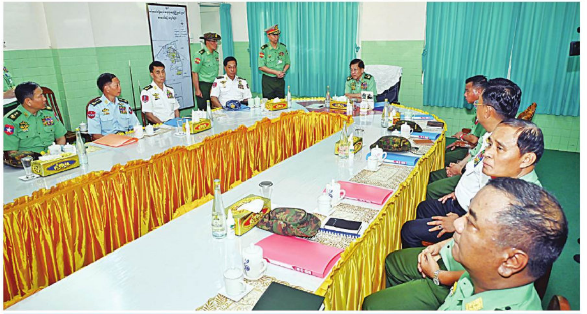
နိုင်ငံတော်စီမံအုပ်ချုပ်ရေးကောင်စီဥက္ကဋ္ဌ တပ်မတော်ကာကွယ်ရေးဦးစီးချုပ် ဗိုလ်ချုပ်မှူးကြီးမင်းအောင်လှိုင်အား ဆေးရုံတပ်မှူးက ကျန်းမာရေးစောင့်ရှောက်မှုပေးထားသည့် အခြေအနေများနှင့် လုပ်ငန်းဆောင်ရွက်မှုအခြေအနေများကို ရှင်းလင်းတင်ပြစဉ်။

ကြောင်းဖြင့် မှာကြားပြီး လိုအပ်ချက်များကို မေးမြန်းဖြည့်ဆည်းဆောင်ရွက်ပေးသည်။ ထို့နောက် နိုင်ငံတော်စီမံအုပ်ချုပ်ရေးကောင်စီဥက္ကဋ္ဌ တပ်မတော်ကာကွယ်ရေးဦးစီးချုပ်နှင့် အဖွဲ့ဝင်များသည် တပ်မတော်ဆေးတက္ကသိုလ်မှ ဝန်ထမ်းများနှင့်အတူ နေ့လယ်စာကို အတူတကွသုံးဆောင်