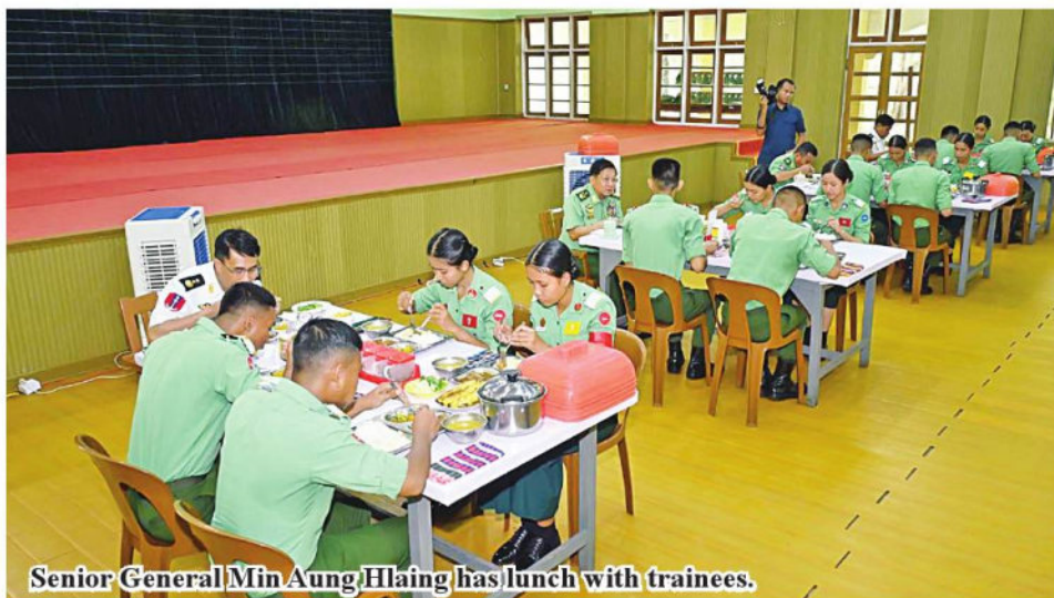
Senior General Min Aung Hlaing has lunch with trainees.

nurses is important in the Tatmadaw. Tatmadaw's duty is to defend the country. But the country is still on a mission to achieve perpetual peace and end internal armed strife that broke out soon after the country regained independence. The role of the medical corps is vital in providing physical and mental treatment for the persons who suffer wounds while serving national defence duty and the persons with ill health.