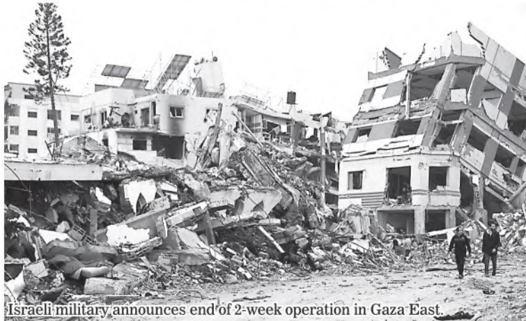
Israeli military announces end of 2-week operation in Gaza East.

The Israel Defence Forces (IDF) announced on Wednesday the end of a two-week military operation in Gaza City's eastern Shejaiya District, where it claimed to have eliminated dozens