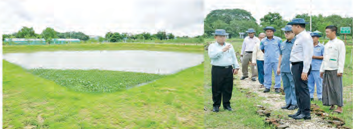
အတွက် ကြိုတင်ပြင်ဆင်ထားရှိသည့် များနှင့် စိုက်ပျိုးမွေးမြူရေး ဆောင်ရွက်မှု ဖြည့်ဆည်းဆောင်ရွက်ပေးသည်။ စာသင်ခန်းများ၊ အိမ်ဆောင်များ၊ စားရိပ်သာ များကိုကြည့်ရှုစစ်ဆေး၍ လိုအပ်သည်များ ဆက်လက်၍ ပြည်ထောင်စုဝန်ကြီး

နယ်စပ်ရေးရာဝန်ကြီးဌာန ပြည်ထောင်စု ဝန်ကြီး ဒုတိယပိုလ်ချုပ်ကြီးထွန်းထွန်းနောင် သည် ယနေ့နံနက်ပိုင်းတွင် ဒဂုံမြို့သစ် (မြောက်ပိုင်း)ရှိ ဗဟိုလေ့ကျင့်ရေးကျောင်းသို့ ရောက်ရှိရာ ကျောင်းအုပ်ကြီးက သင်တန်း ကျောင်းဆိုင်ရာအချက်အလက်များ၊ နယ်စပ် ရေးရာဝန်ကြီးဌာနနှင့် Japan Myanmar Association (JMA) တို့ ပူးပေါင်းဖွင့်လှစ် မည်သင်တန်းများအတွက် ကြိုတင်ပြင်ဆင် ထားရှိမှု၊ စိုက်ပျိုးမွေးမြူရေး ဆောင်ရွက် ထားရှိမှုအခြေအနေများနှင့် စပ်လျဉ်း၍ တင်ပြမှုအပေါ် ပြည်ထောင်စုဝန်ကြီးက လိုအပ်သည်များမှာကြားကာ သင်တန်းများ