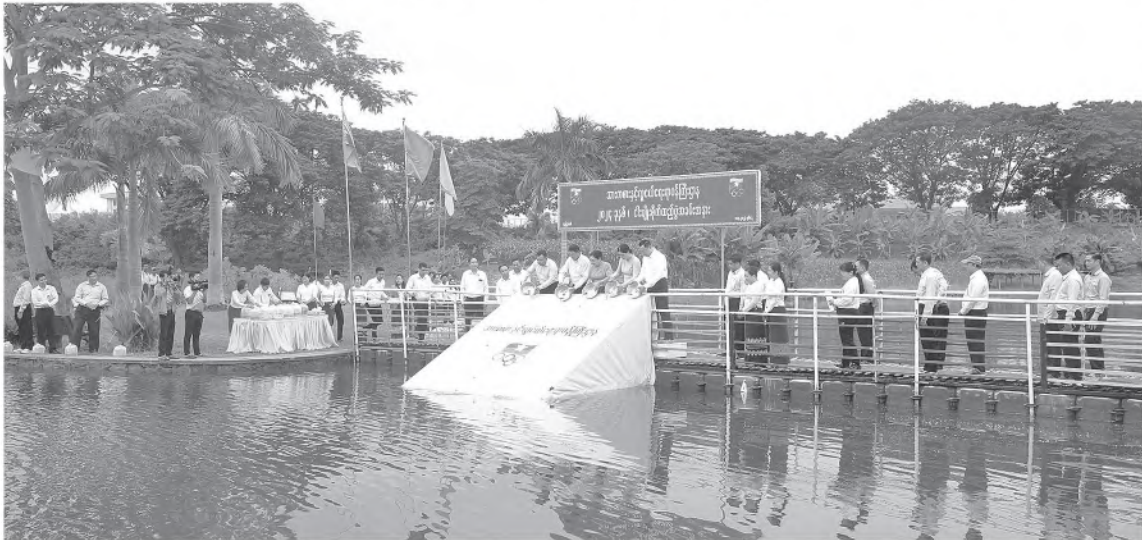
နေပြည်တော် ဇူလိုင် ၁၁ - အားကစားနှင့်လူငယ်ရေးရာဝန်ကြီးဌာန မိုးရာသီသစ်ပင်စိုက်ပျိုးပွဲအခမ်းအနားကို ဝဏ္ဏသိဒ္ဓိအားကစားကွင်းပရိဝုဏ်အတွင်း ယနေ့နံနက် ၈ နာရီတွင် နေပြည်တော်

၌ ကျင်းပသည်။ ဦးစွာ ဝဏ္ဏသိဒ္ဓိအားကစားကွင်းရှိ ကန် အမှတ်(၁)၌ ငါးမြစ်ချင်းသားပေါက်ကောင်ရေ ၇၅၀၀ နှင့် ထိုင်းငါးခုံးမသားပေါက်ကောင်ရေ ၇၅၀၀ စုစုပေါင်းငါးသားပေါက်ကောင်ရေ ၁၅၀၀၀ ခန့် စိုက်ထည့်ခြင်းအခမ်းအနားကို ကျင်းပရာ ပြည်ထောင်စုဝန်ကြီး ဦးမင်းသိန်းလှနှင့် ဒုတိယဝန်ကြီးများက ငါးသားပေါက်များစိုက်ထည့်ပြီး ညွှန်ကြားရေးမှူးချုပ်များနှင့် တာဝန်ရှိသူများက ငါးသားပေါက်များ ဆက်လက်စိုက်ထည့်ခဲ့ကြသည်။ ထို့နောက် ၂၀၂၄ ခုနှစ် မိုးရာသီသစ်ပင်စိုက်ပျိုးပွဲအခမ်းအနားအား ဆက်လက်ကျင်းပရာ ဝဏ္ဏသိဒ္ဓိအားကစားရုံ (A)၊ (B)၊ (C) ရှေ့၌ ရတနာတန်းဝင်အပင်များဖြစ်သည့် ကျွန်းနှင့်ပျဉ်းကတိုးပျိုးပင် ၁၀၀၀ ကို ပြည်ထောင်စုဝန်ကြီး၊ ဒုတိယဝန်ကြီးများနှင့် ညွှန်ကြားရေးမှူးချုပ်များ၊ ဒုတိယညွှန်ကြားရေးမှူးချုပ်များ၊ ညွှန်ကြားရေးမှူးများက ပျိုးပင်များဦးဆောင်စိုက်ပျိုးပြီးအားကစားဝန်ကြီးဌာန အရာထမ်း/အမှုထမ်းများ စုပေါင်းသစ်ပင်စိုက်ပျိုးနေမှုများကို လှည့်လည်ကြည့်ရှုအားပေးကြသည်။ အားကစားနှင့်လူငယ်ရေးရာဝန်ကြီးဌာန အနေဖြင့် သစ်တောသယံဇာတများ ရေရှည်တည်တံ့စေရန်၊ သစ်ပင်သစ်တောများမပြုန်းတီးစေရန်နှင့် ရာသီဥတုကို မျှတကောင်းမွန်စေရန်ရည်ရွယ်၍ WUNNA THEIKDI SPORTS COMPLEX အတွင်း ၂၀၂၄ ခုနှစ်တွင် ပထမအကြိမ်အဖြစ် စိန်တစ်လုံးသရက်ပင် ၅၀၀၊ ၂၀၂၂ ခုနှစ်တွင် ဒုတိယအကြိမ်အဖြစ် စိန်တစ်လုံးသရက်ပင် ၆၀၀၊ ၂၀၂၃ ခုနှစ်တွင် တတိယအကြိမ်အဖြစ် စိန်တစ်လုံးသရက်ပင် ၁၃၀၀၊ ယခု ၂၀၂၄ ခုနှစ်တွင် စတုတ္ထအကြိမ်အဖြစ် ကျွန်းပင် ၅၀၀ နှင့်ပျဉ်းကတိုးပင် ၅၀၀ စုစုပေါင်းပျိုးပင် ၁၀၀၀ စိုက်ပျိုးခဲ့ကြောင်း သိရသည်။ (သတင်းစဉ်)