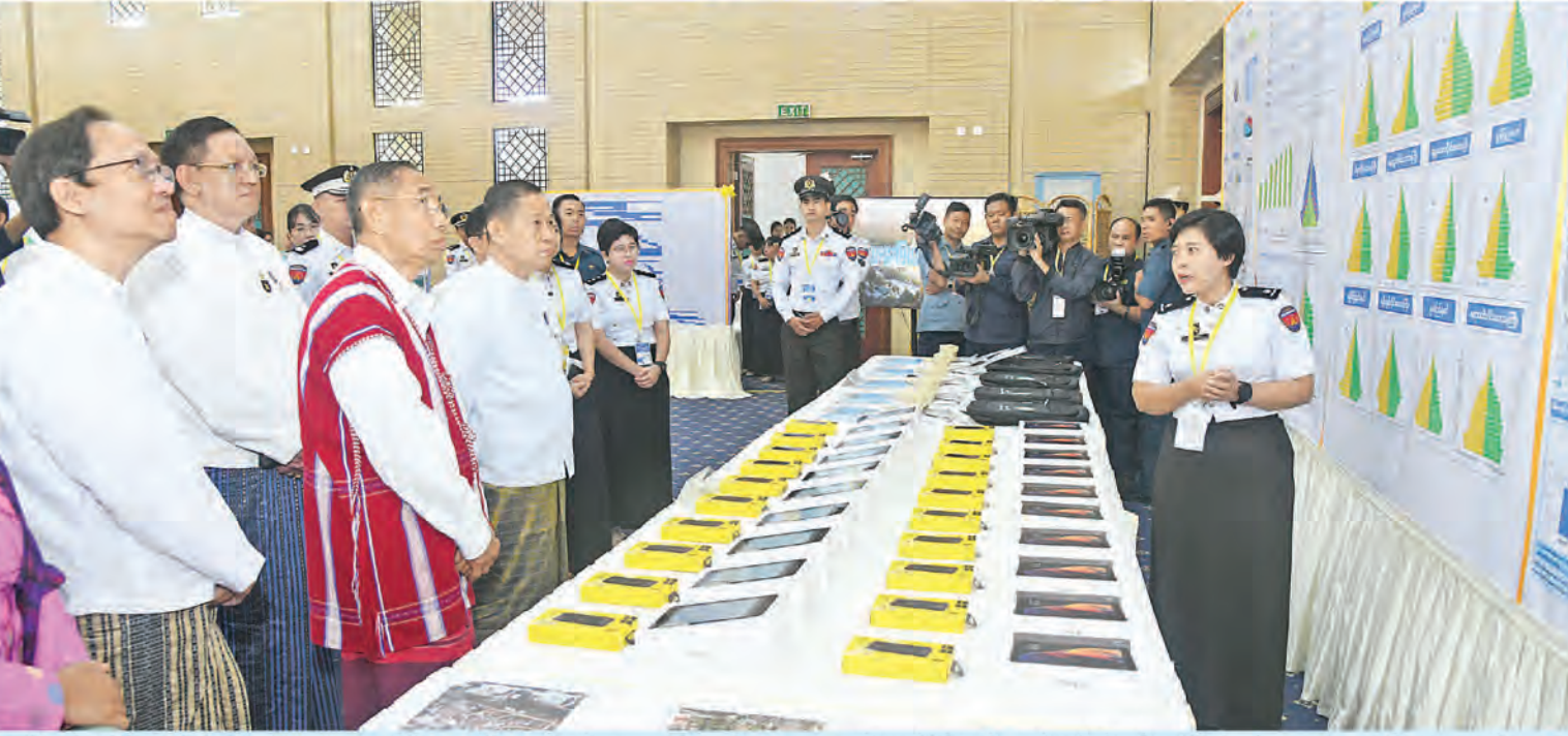
ဗဟိုသန်းခေါင်စာရင်းကော်မရှင်နာယက နိုင်ငံတော်စီမံအုပ်ချုပ်ရေးကောင်စီဒုတိယဥက္ကဋ္ဌ ဒုတိယဝန်ကြီးချုပ် ဒုတိယဗိုလ်ချုပ်မှူးကြီးစိုးဝင်း ၂၀၂၄ ခုနှစ် ကမ္ဘာ့လူဦးရေနေ့ အထိမ်းအမှတ်ခင်းကျင်းပြုသထားသည့် ပြခန်းများကို လှည့်လည်ကြည့်ရှုစဉ်။

နေပြည်တော် ဇူလိုင် ၁၁ အပြည်ပြည်ဆိုင်ရာ ကွန်ဗင်းရှင်းဗဟိုဌာန-၂ (MIICC-2) ဝန်ကြီးချုပ် ဒုတိယဗိုလ်ချုပ်မှူးကြီးစိုးဝင်း တက်ရောက် ၂၀၂၄ ခုနှစ် ကမ္ဘာ့လူဦးရေနေ့အထိမ်းအမှတ်အခမ်းအနားကို ယနေ့နံနက်ပိုင်းတွင် နေပြည်တော်ရှိ မြန်မာ ဌာန၌ ကျင်းပရာ ဗဟိုသန်းခေါင်စာရင်းကော်မရှင်နာယက ဒုတိယ နိုင်ငံတော်စီမံအုပ်ချုပ်ရေးကောင်စီဒုတိယဥက္ကဋ္ဌ ဒုတိယ စာမျက်နှာ ၅ ကော်လံ ၁ ✦