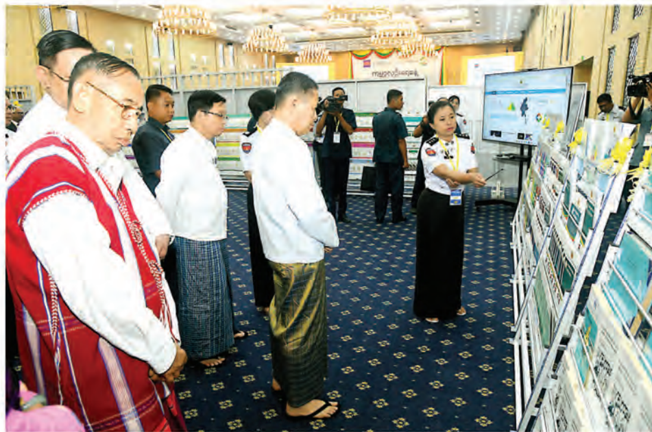
Vice-Senior General Soe Win views publications at the exhibition of World Population Day 2024.