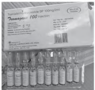
မြန်မာ့စက်မှုဆိပ်ကမ်း၌ ပမ်းဆီးရမိမှု။