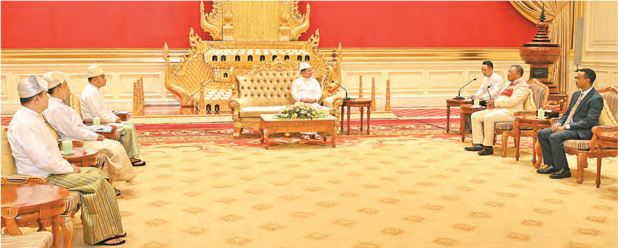
နိုင်ငံတော်စီမံအုပ်ချုပ်ရေးကောင်စီဥက္ကဋ္ဌ နိုင်ငံတော်ဝန်ကြီးချုပ် ဗိုလ်ချုပ်မှူးကြီးမင်းအောင်လှိုင် မြန်မာနိုင်ငံဆိုင်ရာ အီသီယိုးပီးယားဖက်ဒရယ်ဒီမိုကရက်တစ်သမ္မတနိုင်ငံ သံအမတ်ကြီး H.E. Mr. Daba Debele Hunde အား လက်ခံတွေ့ဆုံစဉ်။