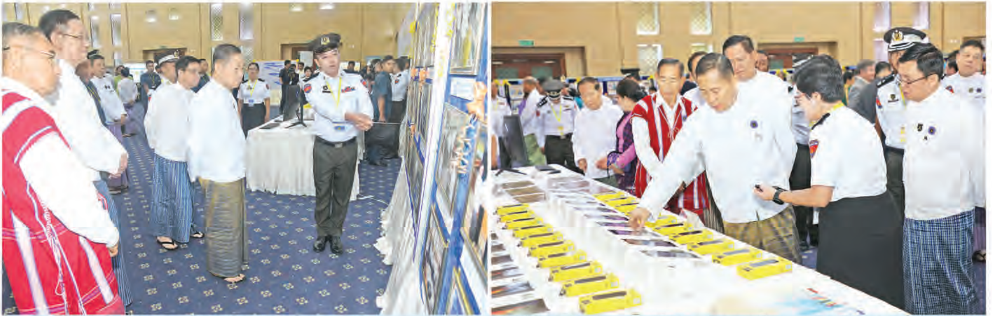
ဗဟိုသန်းခေါင်စာရင်းကော်မရှင်နာယက နိုင်ငံတော်စီမံအုပ်ချုပ်ရေးကောင်စီဒုတိယဥက္ကဋ္ဌ ဒုတိယဝန်ကြီးချုပ် ဒုတိယဗိုလ်ချုပ်မှူးကြီးစိုးဝင်း ၂၀၂၄ ခုနှစ် ကမ္ဘာ့လူဦးရေနေ့အထိမ်းအမှတ်ခင်းကျင်းပြုသထားသည့် ပြခန်းများကို လှည့်လည်ကြည့်ရှုစဉ်။