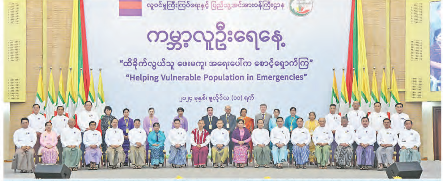
ဗဟိုသန်းခေါင်စာရင်းကော်မရှင်နာယက နိုင်ငံတော်စီမံအုပ်ချုပ်ရေးကောင်စီဒုတိယဥက္ကဋ္ဌ ဒုတိယဝန်ကြီးချုပ် ဒုတိယဗိုလ်ချုပ်မှူးကြီးစိုးဝင်း အခမ်းအနားတက်ရောက်လာကြသူများနှင့်အတူ မှတ်တမ်းတင်ဓာတ်ပုံရိုက်စဉ်။

ဦးစွာ ဗဟိုသန်းခေါင်စာရင်းကော်မရှင်နာယက နိုင်ငံတော်စီမံအုပ်ချုပ်ရေးကောင်စီဒုတိယဥက္ကဋ္ဌ ဒုတိယဝန်ကြီးချုပ်က အမှာစကားပြောကြားရာတွင် ကမ္ဘာ့လူဦးရေနေ့ဖြစ်ပေါ်လာသည့် အကြောင်းရင်းသည် ကမ္ဘာ့နိုင်ငံအသီးသီးတွင် အရေးတကြီးဖြေရှင်းရမည့် မိသားစုစိမ့်ကိန်း၊ ကျားမတန်းတူညီမျှမှု ဆင်းရဲနွမ်းပါးမှု၊ ကိုယ်ဝန်ဆောင်မခင်ကျန်းမာရေးနှင့် လူ့အခွင့်အရေးများ၏ အရေးပါမှုစသည့် လူဦးရေဆိုင်ရာပြဿနာများကို ပြည့်လုံထူထောင်သည့်ပညာပေးလုပ်ငန်းများ ကျယ်ကျယ်ပြန့်ပြန့်တိုးမြှင့်ဆောင်ရွက်နိုင်ရန်ရည်ရွယ်ပြီး ကမ္ဘာ့လူဦးရေသန်းငါးထောင်ပြည့်ခဲ့သည့် ၁၉၈၇ ခုနှစ် ဇူလိုင်လ (၁၁) ရက်နေ့ကို အဖွဲ့ပြုပြီး ကမ္ဘာ့လူဦးရေနေ့အဖြစ် သတ်မှတ်ခဲ့ခြင်း