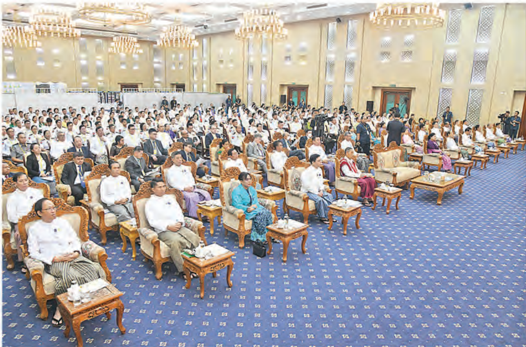
ဗဟိုသန်းခေါင်စာရင်းကော်မရှင်နာယက နိုင်ငံတော်စီမံအုပ်ချုပ်ရေးကောင်စီဒုတိယဥက္ကဋ္ဌ ဒုတိယဝန်ကြီးချုပ် ဒုတိယဗိုလ်ချုပ်မှူးကြီးစိုးဝင်း ၂၀၂၄ ခုနှစ် ကမ္ဘာ့လူဦးရေနေ့အထိမ်းအမှတ်အခမ်းအနားတွင် အမှာစကားပြောကြားစဉ်။