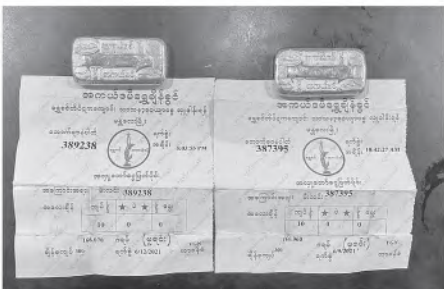
ရန်ကုန်အပြည်ပြည်ဆိုင်ရာလေဆိပ်၌ ပမ်းဆီးရမိမှု။

တရားမဝင်ကုန်သွယ်မှုတိုက်ဖျက်ရေးဦးဆောင်ကော်မတီ၏ ကြီးကြပ်ကွပ်ကဲမှုဖြင့် တရားမဝင်ကုန်သွယ်မှုများကို ဥပဒေနှင့်အညီ ထိရောက်စွာ တားဆီးအရေးယူနိုင်ရေး ဆောင်ရွက်လျက်ရှိရာ ဇူလိုင်လ ၉ ရက်တွင် အကောက်ခွန်ဦးစီးဌာန၏ စီမံခန့်ခွဲမှုဖြင့် တာဝန်ကျူးပေါင်းအဖွဲ့များက စစ်ဆေးမှုများ ဆောင်ရွက်ခဲ့ရာ မြန်မာ့စက်မှုဆိပ်ကမ်း၌ ကုန်သေတ္တာ(၁)လုံးအတွင်းမှ သွင်းကုန်