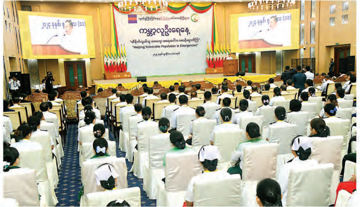
Vice-Senior General Soe Win addresses World Population Day 2024.

People are suffering more from food insufficiency, clean water shortages, climate change, pandemics, and natural disasters such as floods and gales and storms as a consequence of global population increase. In addition, they have to face