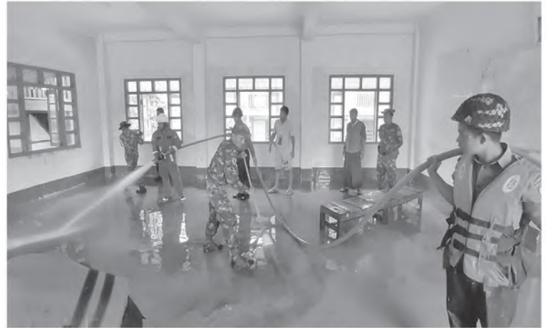
အနောက်မြောက်တိုင်းစစ်ဌာနချုပ်မှ နယ်မြေခံတပ်မတော်သားများနှင့် ဌာနဆိုင်ရာတာဝန်ရှိသူများက စာသင်ကျောင်းအတွင်းရှိ နှမ်း၊ သဲနှင့်အမှုက်များအား ဖယ်ရှားရှင်းလင်းကာ သန့်ရှင်းရေးလုပ်ငန်းများ ဆောင်ရွက်ပေးစဉ်။

များထောက်ပံ့ပေးအပ်ခဲ့သည်။ ထို့နောက် အခြေခံပညာအထက်တန်းကျောင်း(ခန္တီး) အတွင်း/အပြင်၌ မြစ်ရေကြီးမှုနှင့်အတူ ပါရှိလာသည့် နှမ်း၊ သဲနှင့် အမှုက်များအား ဖယ်ရှားရှင်းလင်းကာ စုပေါင်းသန့်ရှင်းရေးလုပ်ငန်းများ ဆောင်ရွက်ပေးခဲ့ကြောင်း သတင်းရရှိသည်။ (၁၀၀)