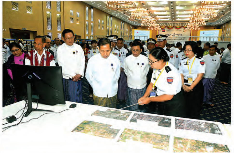
Vice-Senior General Soe Win visits the exhibition of World Population Day 2024.