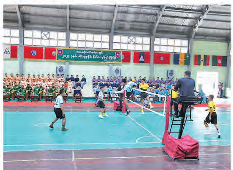
အလယ်ပိုင်းတိုင်းစစ်ဌာနချုပ်၏ တိုင်းမှူးခိုင်း ပိုက်ကျော်ခြင်းပြိုင်ပွဲ ပထမနေ့ပွဲစဉ်ယှဉ်ပြိုင်ကစားစဉ်။

အဆိုပါ တိုင်းမှူးခိုင်း ပိုက်ကျော်ခြင်းပြိုင်ပွဲကို တိုင်းစစ်ဌာနချုပ်ကွပ်ကဲမှုအောက် တပ်ရင်း/တပ်ဖွဲ့များမှ ပြိုင်ပွဲဝင်အသင်း ၁၂ သင်းဖြင့် ဇူလိုင်လ ၁၅ ရက်အထိ ယှဉ်ပြိုင်ကစားသွားမည်ဖြစ်ကြောင်း သတင်းရရှိသည်။ (၁၀၀)