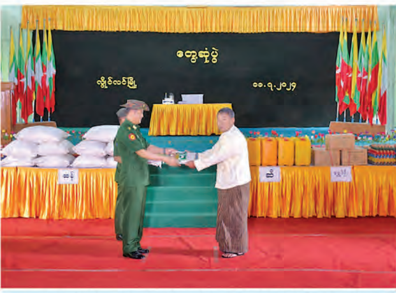
အရှေ့အလယ်ပိုင်းတိုင်းစစ်ဌာနချုပ် တိုင်းမှူး ဗိုလ်ချုပ်မှူးမင်းထွန်း လွိုင်လင်မြို့ရှိ စစ်မှုထမ်းဟောင်းအဖွဲ့ဝင်များနှင့်မိသားစုဝင်များအတွက် ဆန်၊ ဆီ၊ ဆား၊ ပဲ အမယ်(၄)မျိုးနှင့် စားသောက်ဖွယ်ရာများထောက်ပံ့ပေးအပ်စဉ်။

ရှမ်းပြည်နယ်(တောင်ပိုင်း) လွိုင်လင်မြို့ရှိ စစ်မှုထမ်းဟောင်းအဖွဲ့ဝင်များနှင့် မိသားစုဝင်များအား ယနေ့နံနက်ပိုင်းတွင် အရှေ့အလယ်ပိုင်းတိုင်းစစ်ဌာနချုပ် တိုင်းမှူး ဗိုလ်ချုပ်မှူးမင်းထွန်းနှင့် အဖွဲ့ဝင်များက လွိုင်လင်မြို့ရှိ နယ်မြေခံတပ်ရင်းခန်းမ၌ တွေ့ဆုံသည်။ ဦးစွာ တိုင်းမှူးက အမှာစကားပြောကြားသည်။ ထို့နောက် စစ်မှုထမ်းဟောင်းအဖွဲ့ဝင်များနှင့် မိသားစုဝင်များ၏တင်ပြချက်များအပေါ် လိုအပ်သည်များ ပေါင်းစပ်ညှိနှိုင်းဆောင်ရွက်ပေးကာ စစ်မှုထမ်းဟောင်းအဖွဲ့ဝင်များနှင့် မိသားစုဝင်များအတွက် ဆန်၊ ဆီ၊ ဆား၊ ပဲ အမယ်(၄)မျိုးနှင့် အာဟာရဖြည့်စားသောက်ဖွယ်ရာများ ထောက်ပံ့ပေးအပ်သည်။ ထို့ပြင် နယ်မြေခံဆေးကုသရေးအဖွဲ့က စစ်မှုထမ်းဟောင်းအဖွဲ့ဝင်များနှင့် မိသားစုဝင်များအား ကျန်းမာရေးစစ်ဆေးကုသပေးခြင်းများဆောင်ရွက်နေမှုများကို တိုင်းမှူးနှင့်အဖွဲ့ဝင်များက လိုက်လံကြည့်ရှုအားပေးပြီး ဆေးရုံတက်ရောက်ကုသရန် လိုအပ်သူများကို နယ်မြေခံတပ်မတော်ဆေးရုံသို့ တက်ရောက်ကုသနိုင်ရေး လိုအပ်သည်များ ပေါင်းစပ်ညှိနှိုင်းဆောင်ရွက်ပေးခဲ့ကြောင်း သတင်းရရှိသည်။ (၁၀၀)