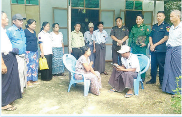
ဆိပ်ဖြူမြို့နယ်၌ ၂၀၂၄ ခုနှစ် လူဦးရေနှင့် အိမ်အကြောင်းအရာ သန်းခေါင်စာရင်းကောက်ယူစဉ်။