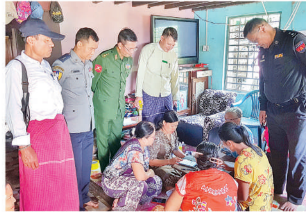
သထုံမြို့နယ်၌ ၂၀၂၄ ခုနှစ် လူဦးရေနှင့်အိမ်အကြောင်းအရာ သန်းခေါင်စာရင်းကောက်ယူစဉ်။