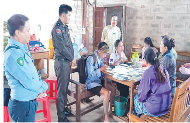
မိုလမ်မြို့၌ ၂၀၂၄ ခုနှစ် လူဦးရေနှင့်အိမ်အကြောင်းအရာ သန်းခေါင်စာရင်းကောက်ယူစဉ်။