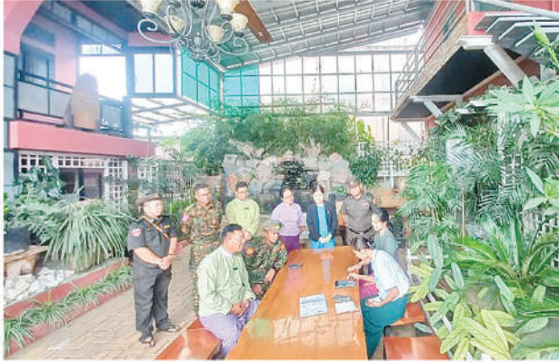
မိုင်းရှူးမြို့၌ ၂၀၂၄ ခုနှစ် လူဦးရေနှင့်အိမ်အကြောင်းအရာ သန်းခေါင်စာရင်းကောက်ယူစဉ်။