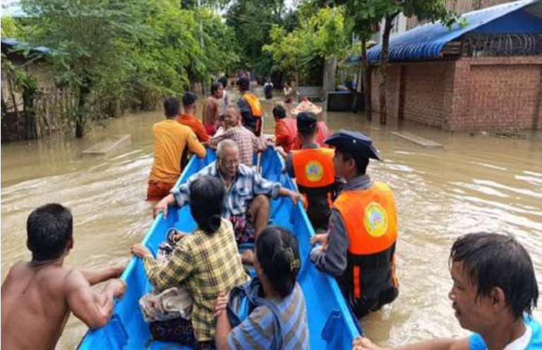
နယ်မြေခံတပ်မတော်သားများ၊ မြန်မာနိုင်ငံရဲတပ်ဖွဲ့ဝင်များ၊ မီးသတ်တပ်ဖွဲ့ဝင်များ၊ ဌာနဆိုင်ရာအဖွဲ့အစည်းများနှင့် ပရဟိတအသင်းအဖွဲ့များက မြစ်သားမြို့နယ်အတွင်းရှိ ရေဘေးသင့်ဒေသခံပြည်သူများကို ရေဘေးလွတ်ရာသို့ ကူညီရွှေ့ပြောင်းပေးစဉ်။

နေပြည်တော် အောက်တိုဘာ ၃ မြန်မာနိုင်ငံအနောက်ဘက်မှ ရွှေလျားလာသော လေပေလှိုင်းများ၏အရှိန်ကြောင့်လည်းကောင်း၊ အပူပျံတတ်တိမ်များ ဖြစ်ထွန်းမှုအားကောင်းခြင်းကြောင့်လည်းကောင်း၊ ကပ္ပလီပင်လယ်ပြင်နှင့် ဘင်္ဂလားပင်လယ်အော်တို့မှ လေနှွေးများနှင့် တရုတ်ပြည်မကြီးပေါ်ရှိ လေဖိအားကြီးရပ်ဝန်းဒေသမှ ရွှေလျားလာသော လေအေးများ တွေ့ဆုံမှုကြောင့်လည်းကောင်း၊ စက်တင်ဘာ ၃၀ ရက် မွန်းလွဲပိုင်းမှစ၍ နေပြည်တော်ကောင်စီနယ်မြေ အပါအဝင် တိုင်းဒေသကြီးနှင့်ပြည်နယ်အချို့တွင်နေရာအနှံ့အပြား မိုးထစ်ချုန်းရွာခြင်းနှင့် အချို့သောဒေသများတွင် ဒေသအလိုက် နေရာ