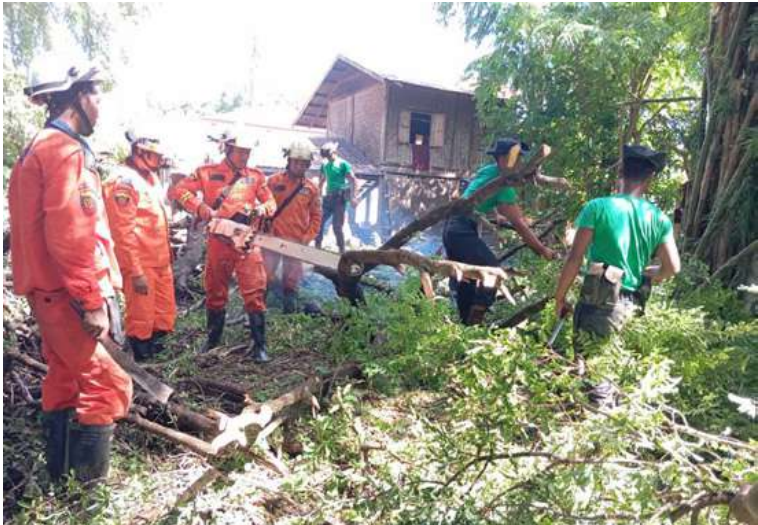
နယ်မြေခံတပ်မတော်သားများ၊ မြန်မာနိုင်ငံရဲတပ်ဖွဲ့ဝင်များ၊ ဌာနဆိုင်ရာဝန်ထမ်းများနှင့် လူမှုဝန်ထမ်းကယ်ဆယ်ရေးအဖွဲ့များက သစ်ပင်သစ်ကိုင်းများကို ခုတ်ထွင်ရှင်းလင်းပေးစဉ်။

ကယ်ဆယ်ရေးအဖွဲ့များက ဒေသခံပြည်သူများနှင့်ပူးပေါင်း၍ တက်ကြွစွာဆောင်ရွက်ပေးလျက်ရှိသည်။ ထို့ပြင် ယာယီရေဘေးရှောင်စခန်းများတွင် ရေဘေးသင့်ပြည်သူများကို ကျန်းမာရေးအဖွဲ့များက လိုအပ်သည့် ကျန်းမာရေးစောင့်ရှောက်မှုလုပ်ငန်းများနှင့် ကျန်းမာရေးအသိပညာပေး ဟောပြောဆွေးနွေးခြင်းများ ဆောင်ရွက်ပေးပြီး ထောက်ပံ့ပစ္စည်းများ၊ အဝတ်အထည်များ၊ အသုံးအဆောင်ပစ္စည်းများ၊ စားသောက်ဖွယ်ရာများနှင့် အလှူငွေများကို