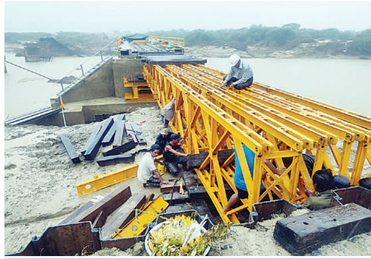
စမ့်-သပြေတောင်းကြား တံတားအမှတ်(၆၉၁)အဆန်လမ်း မန္တလေးဘက်ခြမ်း ရေတိုက်စား၍ ပျက်စီးမှုနှင့် ပြန်လည်ပြုပြင်ပြီးစီးမှုကို တွေ့ရစဉ်။

၂။ ရှေ့မှအဆက် ရန်ကုန်-မန္တလေးလမ်းပိုင်း၌ ရန်ကုန်-သာစည်-ရန်ကုန် ခရီးစဉ်အဖြစ် အမှတ်(၁၁)အဆန်၊ အမှတ်(၁၂) အစုန်လူစီးအမြန်ရထားကို စတင်ပြေးဆွဲပေးနိုင်ခဲ့သည်။ ရေတိုက်စားမှုကြောင့် ပျက်စီးသွားသည့် ဝမ်းတွင်းမြို့နယ် သဲတောနှင့်သပြေတောင်းကြား ရထားလမ်းပိုင်းနှင့် မိုင်တိုင် (၃၃၃/၁)ရှိ အဆန်လမ်းတံတားအမှတ် (၆၉၁)၏ ကမ်းကပ်ခုံရေတိုက်စားခံရခြင်း၊ အစုန်လမ်းတံတားအမှတ်(၆၉၁)၏ ပေ ၄၀ သံပေါင်လေးခု ရေထဲပြုတ်ကျခြင်း၊ အဆန်လမ်း၊ အစုန်လမ်းရထားလမ်းတာပေါင်ရေတိုက်စားခံရခြင်းများတွင် အဆန်လမ်းတံတားအမှတ်(၆၉၁)ကို ယာယီတံတားဘေလီသံပေါင်နှင့် Steel Girder များ ထည့်သွင်းခြင်း၊ ရေတိုက်စားတာပေါင်များကို သံလမ်းဖြုတ်သိမ်း၍ သဲအိတ်စီထုပ်ခြင်း၊ ၆"x ၉" လက်မကျောက်ကြီးများ ထည့်သွင်းခြင်း၊ မြေဖို့ခြင်းများဆောင်ရွက်ပြီးနောက် သံလမ်းပြန်လည်ခင်းခြင်း၊ ရေတိုက်စားနေရာများတွင် သစ်သားဖားထပ်ရွေယာယီဆောင်ရွက်ခြင်းစသည့် အကြီးစားပြင်ဆင်