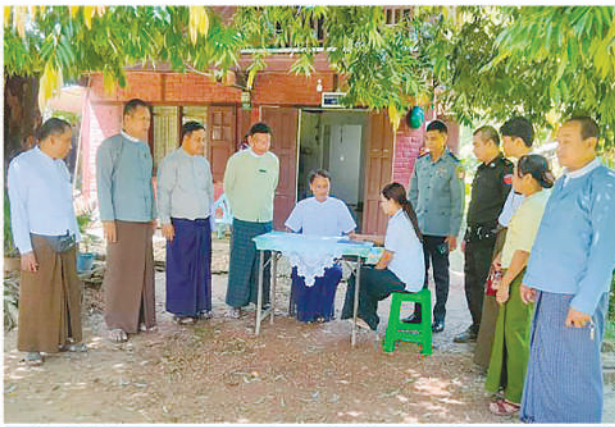
မြောင်းမြမြို့၌ ၂၀၂၄ ခုနှစ် လူဦးရေနှင့်အိမ်အကြောင်းအရာ သန်းခေါင်စာရင်းကောက်ယူစဉ်။