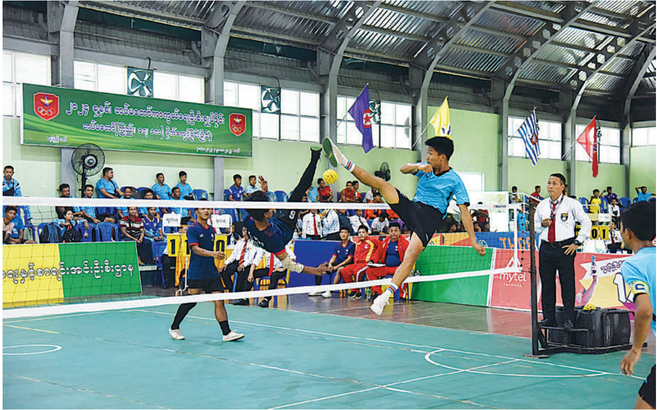
၂၀၂၄ ခုနှစ် တပ်မတော်(ကြည်း၊ ရေ၊ လေ) အားကစားပြိုင်ပွဲများ ပြိုင်ပွဲအမျိုးအစားအလိုက် ယှဉ်ပြိုင်ကစားနေမှုကို တွေ့ရစဉ်။

နေပြည်တော် အောက်တိုဘာ ၃ ၂၀၂၄ ခုနှစ် တပ်မတော်(ကြည်း၊ ရေ၊ လေ) အားကစားပြိုင်ပွဲများကို ယနေ့နံနက်ပိုင်းတွင် သက်ဆိုင်ရာ အားကစားနည်းများအလိုက် သတ်မှတ်ထားသော အားကစားကွင်း၊ ရုံများ တွင် ဆက်လက်ယှဉ်ပြိုင်ကစားကြသည်။ ၂၀၂၄ ခုနှစ် တပ်မတော်(ကြည်း၊ရေ၊လေ) အားကစားပြိုင်ပွဲများဖြစ်သည့် တပ်မတော် အမျိုးသား၊ အမျိုးသမီး မိတာ - ၁၅၀၀ ပြေးပြိုင်ပွဲ၊ အမျိုးသား၊ အမျိုးသမီး မိတာ-၁၀၀ ပြေးပြိုင်ပွဲများ ယှဉ်ပြိုင်ကစားပြီး ဆုပေးပွဲအခမ်းအနားကို ဆက်လက်ကျင်းပပြုလုပ်ရာ အားကစားအမျိုးအစားအလိုက် ပထမ၊ဒုတိယ၊ တတိယရရှိသော အားကစားသမားများအား စာမျက်နှာ ၁၆ ကော်လံ ၁ ☆