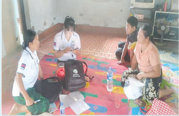
ရှမ်းပြည်နယ်(အရှေ့ပိုင်း) မိုင်းယန်းမြို့၌ ၂၀၂၄ ခုနှစ် လူဦးရေနှင့် အိမ်အကြောင်းအရာ သန်းခေါင်စာရင်းကောက်ယူစဉ်။

ဒေသကြီး၊ ပဲခူးတိုင်းဒေသကြီး၊ မကွေးတိုင်းဒေသကြီး၊ မန္တလေးတိုင်းဒေသကြီး၊ မွန်ပြည်နယ်၊ ရခိုင်ပြည်နယ်၊ ရန်ကုန်တိုင်းဒေသကြီး၊ ရှမ်းပြည်နယ်နှင့် ဧရာဝတီတိုင်းဒေသကြီးတို့တွင် ဆက်လက်မေးမြန်းကောက်ယူလျက်ရှိပြီး ၂၀၂၄ ခုနှစ် သန်းခေါင်စာရင်း၏ ရှေ့ပြေးလူဦးရေစာရင်းကို ဒီဇင်ဘာလကုန်တွင် ထုတ်ပြန်နိုင်ရေး ကြိုးပမ်းဆောင်ရွက်သွားမည်ဖြစ်ကြောင်း သိရသည်။ (၅၀၁)