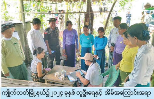
ကျိုက်လတ်မြို့နယ်၌ ၂၀၂၄ ခုနှစ် လူဦးရေနှင့် အိမ်အကြောင်းအရာ သန်းခေါင်စာရင်းကောက်ယူစဉ်။