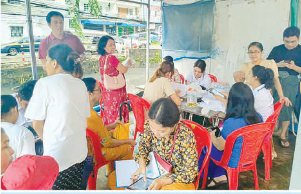
တာမွေမြို့နယ်၌ ၂၀၂၄ ခုနှစ် လူဦးရေနှင့်အိမ်အကြောင်းအရာ သန်းခေါင်စာရင်းကောက်ယူစဉ်။