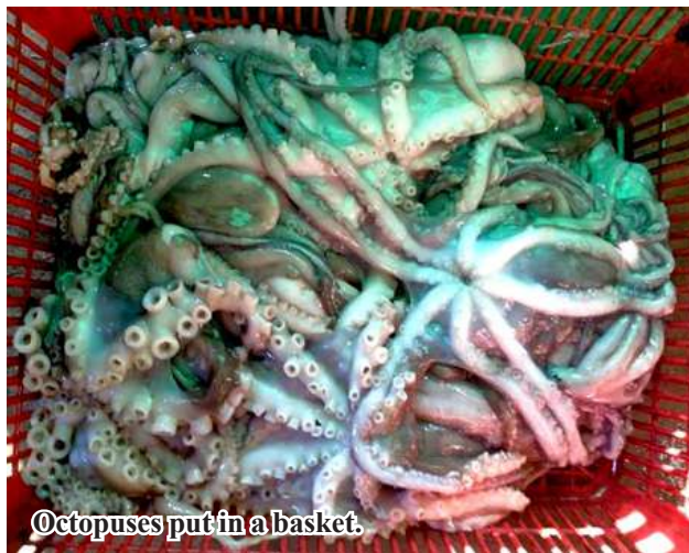
Octopuses put in a basket.

of octopus from Labutta Township to Yangon market, local fishermen and those in production chains can earn