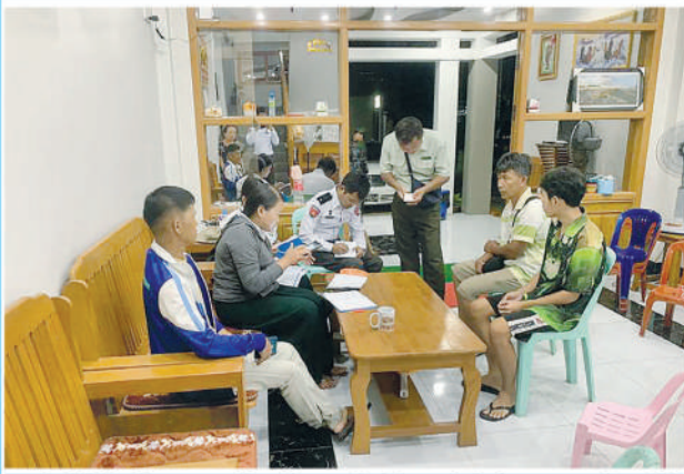
ကွန်ဟိန်းမြို့၌ ၂၀၂၄ ခုနှစ် လူဦးရေနှင့်အိမ်အကြောင်းအရာ သန်းခေါင်စာရင်းကောက်ယူစဉ်။