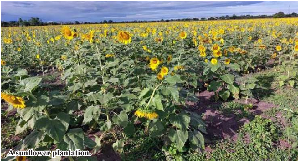
A sunflower plantation.

Depayin October 3 According to reports from the Department of Agriculture in Ye-U District, Sagaing Region, 4,928 acres of sunflower crops have already been planted in the Depayin Township during this year's monsoon planting season.