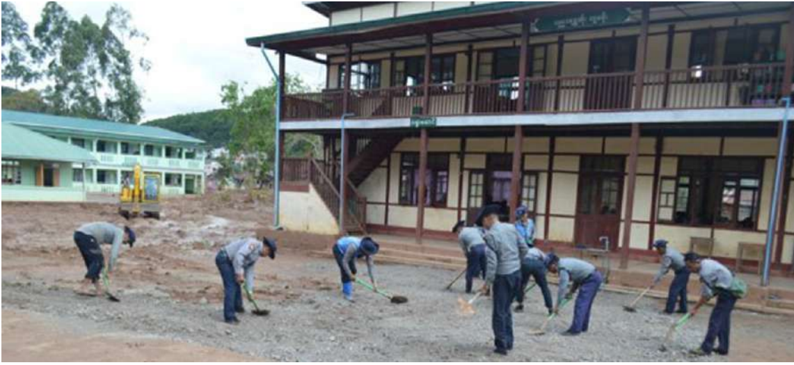
နယ်မြေခံတပ်မတော်သားများ၊ မြန်မာနိုင်ငံရဲတပ်ဖွဲ့ဝင်များ၊ ဌာနဆိုင်ရာဝန်ထမ်းများနှင့် လူမှုဝန်ထမ်းကယ်ဆယ်ရေးအဖွဲ့များက အခြေခံပညာကျောင်းအတွင်း စုပေါင်းသန့်ရှင်းရေးလုပ်ငန်းများ ဆောင်ရွက်ကြစဉ်။

နေပြည်တော် အောက်တိုဘာ ၃ နေပြည်တော်ကောင်စီနယ်မြေ အပါအဝင် တိုင်းဒေသကြီးနှင့် ပြည်နယ်များရှိ ရေကြီးရေလျှံမှုဖြစ်ပေါ်ခဲ့သည့် ရပ်ကွက်၊ ကျေးရွာများတွင် ကူညီကယ်ဆယ်ရေးလုပ်ငန်းများနှင့် ပြန်လည်ထူထောင်ရေးလုပ်ငန်းများကို အင်တိုက်အားတိုက် တက်ကြွစွာပူးပေါင်းဆောင်ရွက်ပေးလျက်ရှိရာ ယနေ့တွင်လည်း နေပြည်တော်ကောင်စီနယ်မြေအတွင်းတွင်လည်းကောင်း၊ ရှမ်းပြည်နယ်(တောင်ပိုင်း)၊ ကလေးမြို့နယ်တွင်လည်းကောင်း၊ ကယားပြည်နယ် လွိုင်ကော်