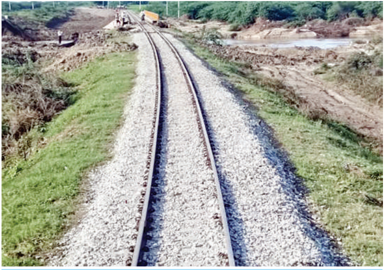
စမ့်-သပြေတောင်းကြား ရေတိုက်စား၍ ပျက်စီးခဲ့သော ရထားလမ်းပိုင်းနေရာများ ပြန်လည်ပြုပြင်ပြီးစီးမှုကို တွေ့ရစဉ်။

မွမ်းမံမှုများကို ဆောင်ရွက်ခဲ့ ပြုပြင် ဆောင်ရွက်ပေးခဲ့မှုများကြောင့် အောက်တိုဘာ ၂ ရက် ၂၄ နာရီ ၂၆ မိနစ်အချိန်တွင် သဲတော-သပြေတောင်းကြား အဆန်လမ်း ပြန်လည်ဖွင့်လှစ်နိုင်ခဲ့ပြီဖြစ်၍ ရန်ကုန်-မန္တလေးအမှတ်(၁၁)အဆန်နှင့် မန္တလေး-ရန်ကုန် အမှတ်(၁၂)အစုန်လူစီးအမြန်ရထားများရန်ကုန်-မန္တလေးအမှတ် (၁)အဆန်၊ မန္တလေး-ရန်ကုန် အမှတ်(၂)အစုန်စာပို့ရထားခရီးစဉ်များကို ယနေ့မှ စတင် ပြေးဆွဲပေးလျက်ရှိကြောင်းနှင့် ဝန်ထမ်းများ၏ အားထုတ်ကြိုးပမ်း