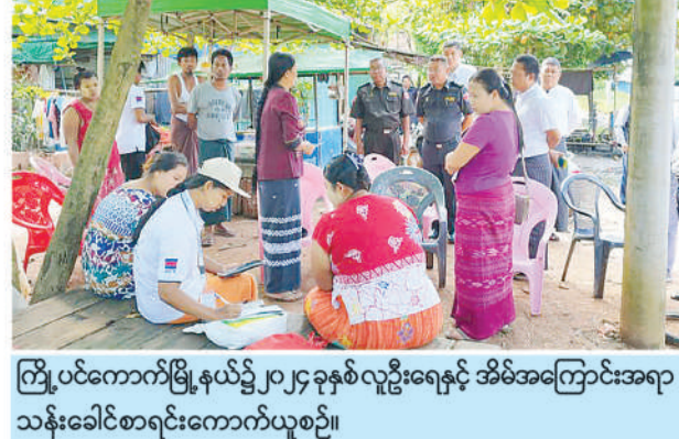
ကြို့ပင်ကောက်မြို့နယ်၌ ၂၀၂၄ ခုနှစ် လူဦးရေနှင့် အိမ်အကြောင်းအရာ သန်းခေါင်စာရင်းကောက်ယူစဉ်။