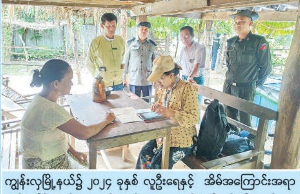
ကျွန်းလှမြို့နယ်၌ ၂၀၂၄ ခုနှစ် လူဦးရေနှင့် အိမ်အကြောင်းအရာ သန်းခေါင်စာရင်းကောက်ယူစဉ်။