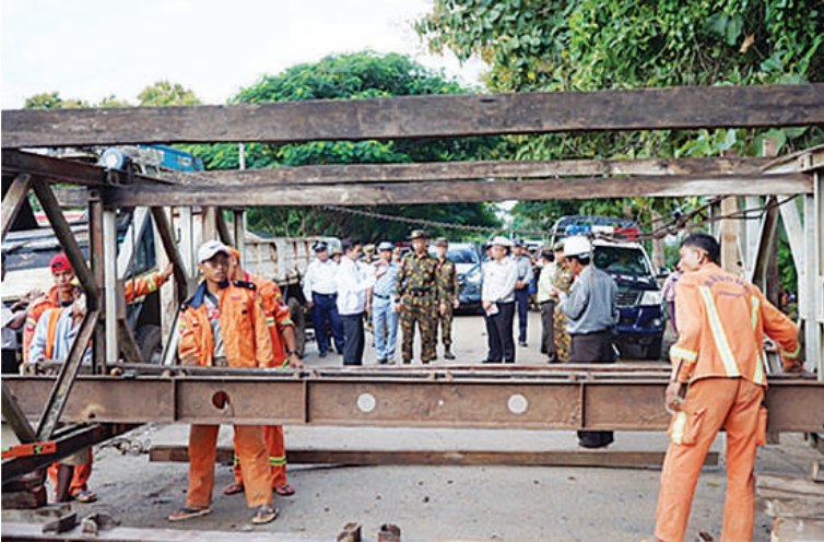
တြိဂံဒေသတိုင်းစစ်ဌာနချုပ် တိုင်းမှူး ဗိုလ်မှူးချုပ်စိုးလှိုင် တာချီလိတ်-မိုင်းတွမ်း-မိုင်းဆတ်မြို့သွား ပြည်ထောင်စုလမ်းမပေါ်ရှိ နမ့်ခတ်ချောင်းကူး နမ့်ခတ်ငြိမ်းချမ်းရေး (ဆိုက်ခေါင်) သံကူကွန်ကရစ်တံတားပြင်ဆင်နေမှုကို

နေပြည်တော် အောက်တိုဘာ ၃ ရှမ်းပြည်နယ်(အရှေ့ပိုင်း) မိုင်းဆတ်မြို့နယ်အတွင်း မိုးသည်းထန်စွာရွာသွန်းမှုကြောင့် နမ့်ခတ်ချောင်းရေ မြင့်တက်လာ