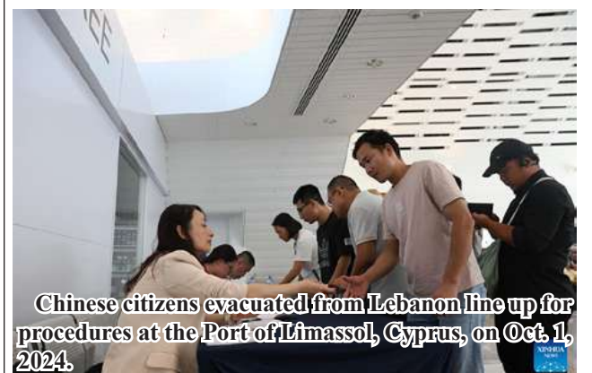
Chinese citizens evacuated from Lebanon line up for procedures at the Port of Limassol, Cyprus, on Oct. 1, 2024.