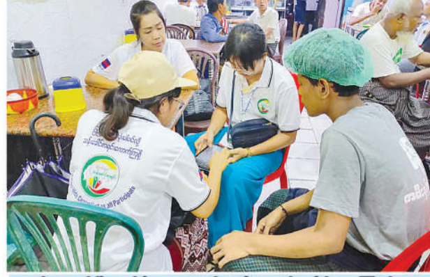
ပုဇွန်တောင်မြို့နယ်၌ ၂၀၂၄ ခုနှစ် လူဦးရေနှင့် အိမ်အကြောင်းအရာ သန်းခေါင်စာရင်းကောက်ယူစဉ်။