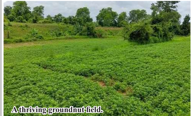
A thriving groundnut field.