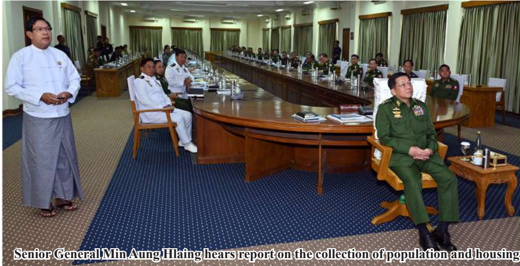
Senior General Min Aung Hlaing hears report on the collection of population and housing census 2024 in various townships.