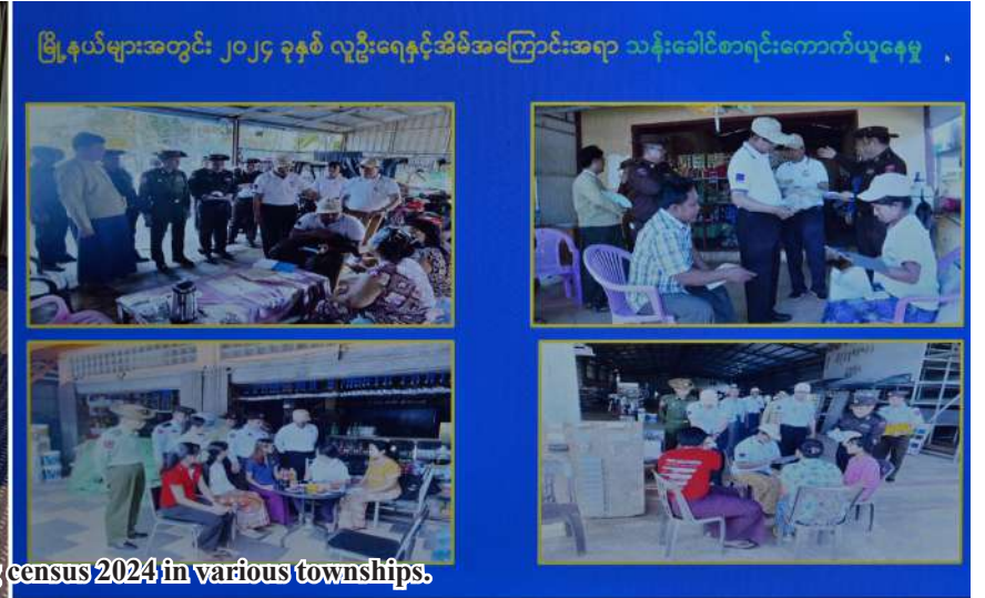
မြို့နယ်များအတွင်း ၂၀၂၄ ခုနှစ် လူဦးရေနှင့်အိမ်အကြောင်းအရာ သန်းခေါင်စာရင်းကောက်ယူနေမှု

Nay Pyi Taw October 8 Chairman of the State Administration Council Prime Minister Senior General Min Aung Hlaing delivered an address at the Yangon Region Security and Development meeting held at the meeting hall in Kone Myint Tha in Yangon Region this morning.