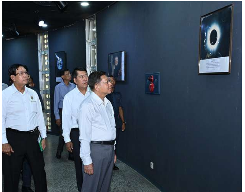
နက္ခတ်တာရာပြခန်းအတွင်း ပြကွက်အလိုက်ပြသထားရှိမှုများကို တွေ့ရစဉ်။

၂၆ ရှေးဦးမှအဆက် နိုင်ငံတော်စီမံအုပ်ချုပ်ရေးကောင်စီ ဥက္ကဋ္ဌ ကောင်စီဥက္ကဋ္ဌ နိုင်ငံတော်ဝန်ကြီးချုပ်နှင့် နက္ခတ်တာရာပြခန်းကို အာကာသပြခန်း နိုင်ငံတော်ဝန်ကြီးချုပ်က လိုအပ်သည်များ အဖွဲ့ဝင်များသည် နက္ခတ်တာရာပြခန်း အဖြစ် အဆင့်မြှင့်တင်ရန် ဆောင်ရွက်နေမှု လမ်းညွှန်မှာကြားသည်။ အတွင်းရှိ ပြကွက်အလိုက်ပြသထားရှိမှုများ အခြေအနေကို ရှင်းလင်းတင်ပြရာ ယင်းနောက် နိုင်ငံတော်စီမံအုပ်ချုပ်ရေး နှင့် ကြယ်နက္ခတ်တာရာများကို လေ့လာခြင်း