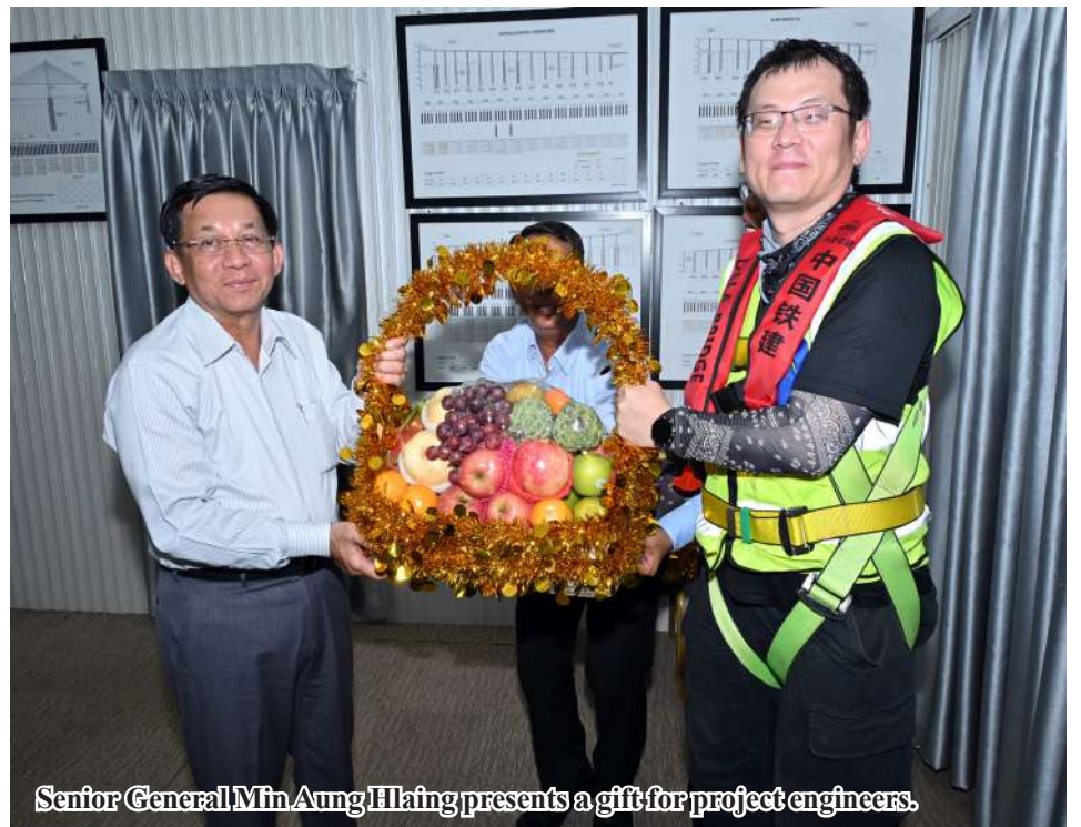
Senior General Min Aung Hlaing presents a gift for project engineers.

phase-by-phase completion of the bridge in time and for its durability as the facility will benefit the people. Traffic safety must be ensured. The connection of parts of the bridge must be perfect, clearance area must be systematically marked and