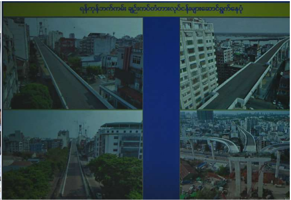
နိုင်ငံတော်စီမံအုပ်ချုပ်ရေးကောင်စီဥက္ကဋ္ဌ နိုင်ငံတော်ဝန်ကြီးချုပ် ဗိုလ်ချုပ်မှူးကြီးမင်းအောင်လှိုင်အား ဆောက်လုပ်ရေးဝန်ကြီးဌာန ပြည်ထောင်စုဝန်ကြီး ဦးမျိုးသန့်က မြန်မာ-ကိုရီးယားချစ်ကြည်ရေး(ဒလ)တံတား တည်ဆောက်ရေးစီမံကိန်းလုပ်ငန်းဆောင်ရွက်နေမှုအခြေအနေများနှင့်ပတ်သက်၍ ရှင်းလင်းတင်ပြစဉ်။

ဆောင်ရွက်နေမှုကို ကြည့်ရှုစစ်ဆေးပြီး တာဝန်ရှိသူများ၏ တင်ပြချက်များအပေါ် လိုအပ်သည်များ လမ်းညွှန်မှာကြားခဲ့သည်။ ထို့နောက် နိုင်ငံတော်စီမံအုပ်ချုပ်ရေး ကောင်စီဥက္ကဋ္ဌ နိုင်ငံတော်ဝန်ကြီးချုပ်နှင့် အဖွဲ့ဝင်များသည် ရန်ကုန်မြို့နှင့်ဒလမြို့တို့ ကို ဆက်သွယ်ဖောက်လုပ်လျက်ရှိသည့် မြန်မာ-ကိုရီးယားချစ်ကြည်ရေး(ဒလ)တံတား စီမံကိန်းသို့ရောက်ရှိကြရာ အစည်းအဝေး ခန်းမတွင် ဆောက်လုပ်ရေးဝန်ကြီးဌာန ပြည်ထောင်စုဝန်ကြီး ဦးမျိုးသန့်က တံတား တည်ဆောက်ရေးစီမံကိန်းဖြစ်ပေါ်လာပုံနှင့် တံတားဆိုင်ရာအချက်အလက်များ၊ စီမံကိန်း ၏ အကျိုးကျေးဇူးများ၊ ၂၀၂၃ ခုနှစ် မေလ အတွင်း နိုင်ငံတော်စီမံအုပ်ချုပ်ရေးကောင်စီ ဥက္ကဋ္ဌ နိုင်ငံတော်ဝန်ကြီးချုပ် လာရောက် စစ်ဆေးစဉ် လမ်းညွှန်မှာကြားချက်များကို အကောင်အထည်ဖော် ဆောင်ရွက်ပြီးစီးမှု၊