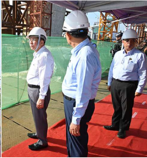
နိုင်ငံတော်စီမံအုပ်ချုပ်ရေးကောင်စီဥက္ကဋ္ဌ နိုင်ငံတော်ဝန်ကြီးချုပ် ဗိုလ်ချုပ်မှူးကြီးမင်းအောင်လှိုင် မြန်မာ-ကိုရီးယား ချစ်ကြည်ရေး(ဒလ)တံတားတည်ဆောက်ရေးစီမံကိန်း လုပ်ငန်းဆောင်ရွက်နေမှုအခြေအနေများကို ကြည့်ရှုစစ်ဆေးစဉ်။