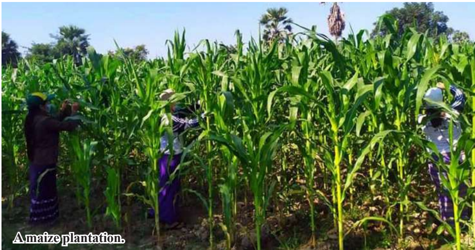
A maize plantation.