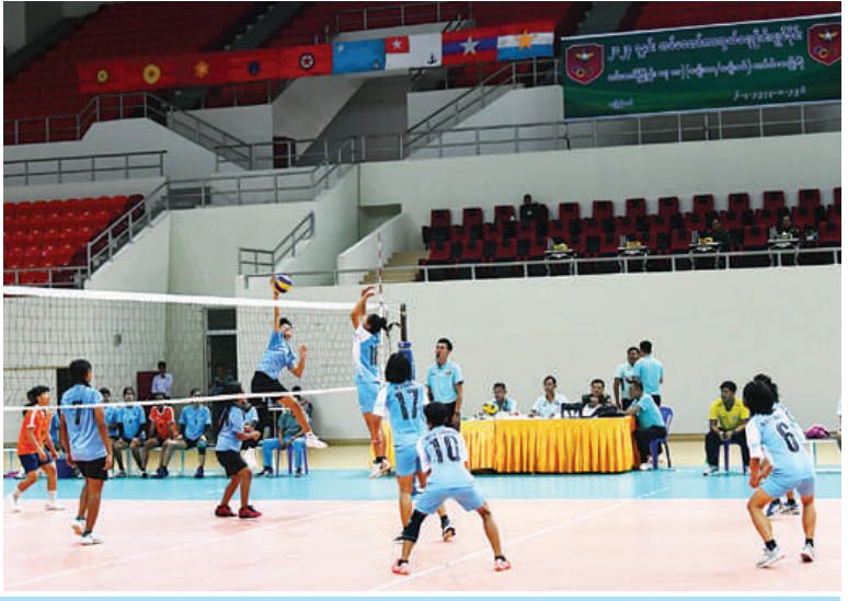
၂၀၂၄ ခုနှစ် တပ်မတော်(ကြည်း၊ ရေ၊ လေ)အားကစားပြိုင်ပွဲများ ပြိုင်ပွဲအမျိုးအစားအလိုက် ယှဉ်ပြိုင်ကစားနေမှုကိုတွေ့ရစဉ်။