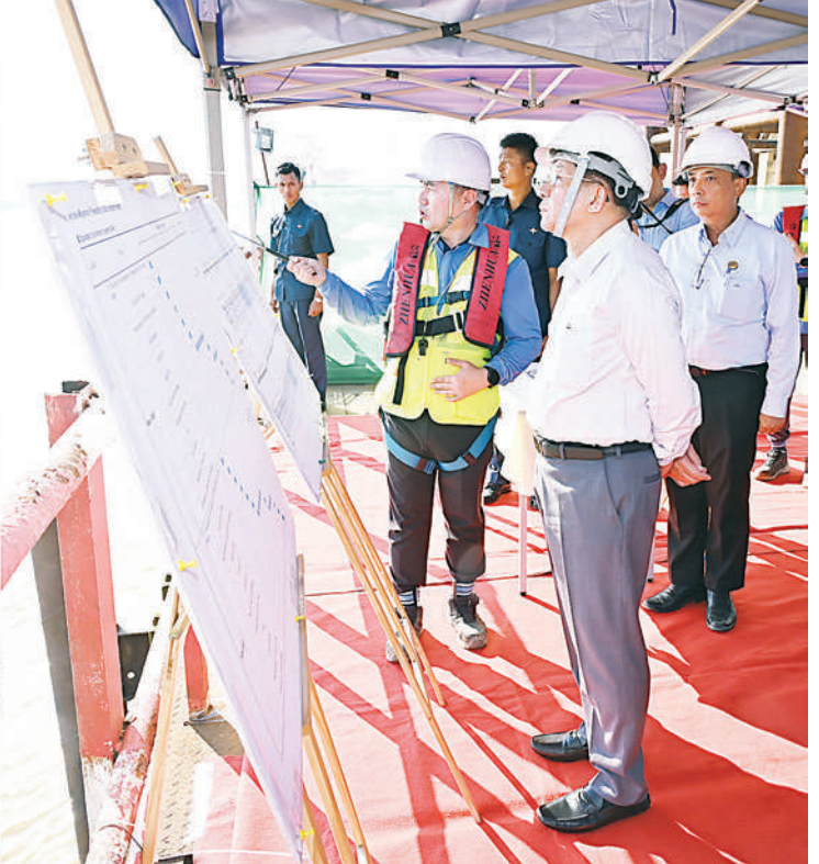
နိုင်ငံတော်စီမံအုပ်ချုပ်ရေးကောင်စီဥက္ကဋ္ဌ နိုင်ငံတော်ဝန်ကြီးချုပ် ဗိုလ်ချုပ်မှူးကြီးမင်းအောင်လှိုင် မြန်မာ-ကိုရီးယားချစ်ကြည်ရေး(ဒလ)တံတားတည်ဆောက်ရေးစီမံကိန်း လုပ်ငန်းဆောင်ရွက်နေမှုအခြေအနေ များကို ကြည့်ရှုစစ်ဆေးစဉ်။