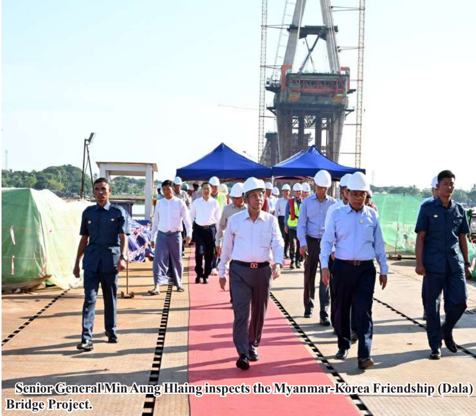
Senior General Min Aung Hlaing inspects the Myanmar-Korea Friendship (Dala) Bridge Project.

Nay Pyi Taw October 8 This afternoon, along with Chairman of State Administration Council Prime Minister Senior General Min Aung Hlaing, members of the entourage, including the Yangon Region chief minister, the Yangon Command commander, and officials, inspected the planetarium, which is being upgraded into a space gallery located in People's Square and Park, Dagon Township, Yangon Region, as well as the My-