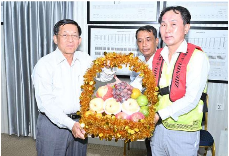
နိုင်ငံတော်စီမံအုပ်ချုပ်ရေးကောင်စီဥက္ကဋ္ဌ နိုင်ငံတော်ဝန်ကြီးချုပ် ဗိုလ်ချုပ်မှူးကြီး မင်းအောင်လှိုင် မြန်မာ-ကိုရီးယား ချစ်ကြည်ရေး(ဒလ)တံတားစီမံကိန်းတွင် လုပ်ငန်း ဆောင်ရွက်လျက်ရှိသည့် အင်ဂျင်နီယာများအတွက် ဂုဏ်ပြုသစ်သီးခြင်းများ ပေးအပ် ချီးမြှင့်စဉ်။

တည်ဆောက်မှုလုပ်ငန်းများကို သတ်မှတ် ကာလအတွင်း အပိုင်းအလိုက်ပြီးစီးစေရေး နှင့် တံတားကြံ့ခိုင်မှုကောင်းမွန်စေရေး စနစ်တကျ ဆောင်ရွက်သွားရန်လိုကြောင်း၊ မော်တော်ယာဉ်များ အန္တရာယ်ကင်းရှင်းစွာ ဖြင့်သွားလာနိုင်ရေး ဆောင်ရွက်သွားရန် လိုကြောင်း၊ တံတားတွဲဆက်ခြင်းလုပ်ငန်း များစနစ်တကျဖြစ်ရန်လိုကြောင်း၊ သင်္ဘော တကျဆောင်ရွက်သွားရန်နှင့် ရေလယ် တာဝါတိုင်များ အန္တရာယ်ကင်းရှင်းရေး အတွက်လည်း ကြိုတင်စဉ်းစားဆောင်ရွက် သွားရန်လိုကြောင်းဖြင့် မှာကြားသည်။ ထို့နောက် နိုင်ငံတော်စီမံအုပ်ချုပ်ရေး ကောင်စီဥက္ကဋ္ဌ နိုင်ငံတော်ဝန်ကြီးချုပ်က မြန်မာ-ကိုရီးယား ချစ်ကြည်ရေး(ဒလ)တံတား စီမံကိန်းတွင် လုပ်ငန်းဆောင်ရွက်လျက်ရှိ သည့် အင်ဂျင်နီယာများအတွက် ဂုဏ်ပြု