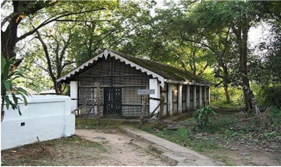
ပဲခူးမြို့ရှိ ကလျာဏီကျောက်စာတိုက်ကို တွေ့ရစဉ်။

လေးမျက်နှာ၌ဖြစ်စေ၊ ရှစ်မျက်နှာ၌ဖြစ်စေ သိမ်နိမိတ်အဖြစ် ကျောက်တုံး၊ ရေ စသော အမှတ်နိမိတ်များကို ထားရှိရသည်။ ရှေးဦးဆောင်ရွက်ရသည့် ပုဗ္ဗကိစ္စများ ပြည့်စုံသောအခါ စွမ်းနိုင်သောရဟန်းတစ်ပါးက ယခု သမုတ်မည့်သိမ်၏ အရှေ့အရပ်၌ အမှတ်အသား နိမိတ်ကားအဘယ်ပါနည်းဟု မေးရသည်။ အခြား ရဟန်းတစ်ပါးက ထိုအရပ်၌ တည်ရှိနေသောနိမိတ်အားလျော်စွာ ကျောက်တုံးပါဘုရား၊ ရေပါဘုရား စသည်ဖြင့် ဖြေကြားလျှောက်ထားရသည်။ ထိုအခါ ပထမရဟန်းက ဤကျောက်တုံးသည် ယခုသမုတ်မည့် သိမ်၏အမှတ်နိမိတ်ဖြစ်ကြောင်းကို သံဃာတော်များအား ပြောကြားကြေညာရသည်။