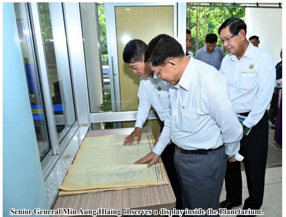
Senior General Min Aung Hlaing observes a display inside the Planetarium.