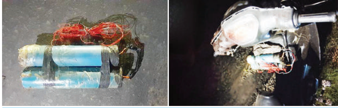
ပုဂံရှေးဟောင်းယဉ်ကျေးမှုနယ်မြေအတွင်း ဖောက်ခွဲဖျက်ဆီးရန်လာရောက်သည့် အကြမ်းဖက်သမားတစ်ဦးထံမှ သိမ်းဆည်း ရမိသည့် လက်လုပ်မိုင်းများကိုတွေ့ရစဉ်။

နေပြည်တော် အောက်တိုဘာ ၈ - မန္တလေးတိုင်းဒေသကြီး ညောင်ဦး မြို့နယ် ညောင်ဦး-ပုဂံသွား ကားလမ်းပေါ် ဌာန အကြမ်းဖက်လုပ်ရပ်များကျူးလွန်ရန် ကြောင်း သိရှိရသည်။ လက်လုပ်မိုင်းများ သယ်ဆောင်လာသည့် ဖြစ်စဉ်မှာ လုံခြုံရေးတပ်ဖွဲ့ဝင်များ သည် ပုဂံရှေးဟောင်းယဉ်ကျေးမှုနယ်မြေ အတွင်း အကြမ်းဖက်သမားများ ခိုအောင်း နေထိုင်မှုမရှိစေရေး၊ ရှေးဟောင်း