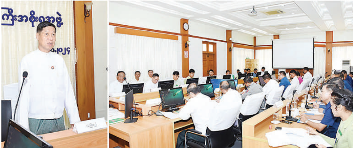
နေပြည်တော် အောက်တိုဘာ ၈ မြန်မာ့ရိုးရာ သီတင်းကျွတ်မီးထွန်းပွဲတော်တွင် ပြည်သူများပျော်ရွှင်စွာပါဝင်ဆင်နွှဲနိုင်ရေးနှင့် စည်ကားသိုက်မြိုက်စွာကျင်းပနိုင်ရေး လုပ်ငန်းညှိနှိုင်းအစည်းအဝေးကို ယနေ့ နံနက်ပိုင်းက မန္တလေးတိုင်းဒေသကြီးအစိုးရအဖွဲ့ရုံးအစည်းအဝေးခန်းမ၌ကျင်းပရာ တိုင်းဒေသကြီးဝန်ကြီးချုပ် ဦးမျိုးအောင်၊ တိုင်းဒေသကြီးဝန်ကြီးများနှင့် တာဝန်ရှိသူများ တက်ရောက်ကြသည်။

များနှင့် တာဝန်ရှိသူများ တက်ရောက်ကြသည်။ အစည်းအဝေး၌ တိုင်းဒေသကြီးဝန်ကြီးချုပ်က အဖွင့်အမှာစကားပြောကြားရာတွင် မန္တလေးကျွန်းဘေးတစ်လျှောက်တွင် မြန်မာ့ရိုးရာသီတင်းကျွတ်မီးထွန်းပွဲတော်ကို သီတင်းကျွတ်လပြည့်နေ့၌ ကျင်းပသွားမည်ဖြစ်ကြောင်း၊ ပြည်သူများစိတ်ပျော်ရွှင်ချမ်းမြေ့စွာကြည့်ရှုနိုင်ရန် တေးသီချင်းများဖြင့် ညွှန်ပေးပေးခြင်း၊ မြန်မာ့ရိုးရာအစားအစာများဖြင့် စတုဒိသာကျွေးမွေးဧည့်ခံခြင်းများအပါအဝင် အခြားအစီအစဉ်များကိုလည်း စည်ကားသိုက်မြိုက်စွာထည့်သွင်းကျင်းပသွားမည်ဖြစ်ကြောင်း၊ ကဏ္ဍများအလိုက် လုပ်ငန်းများဆောင်ရွက်ရာတွင် ယခင်နှစ်ဆောင်ရွက်ခဲ့မှု၏အားနည်းချက်၊ အားသာချက်များအပေါ် သုံးသပ်ကာ ပိုမိုကောင်းမွန်စေရေး အားလုံးပူးပေါင်း၍ စနစ်တကျကြပ်မတ်ဆောင်ရွက်သွားကြရမည် ဖြစ်ကြောင်းဖြင့် ပြောကြားသည်။ ထို့နောက် တိုင်းဒေသကြီးဝန်ကြီးများနှင့် တာဝန်ရှိသူများက ဦးစီးကော်မတီ၊ လုပ်ငန်းကော်မတီနှင့် ဆပ်ကော်မတီအလိုက် ဆွေးနွေးအကြံပြုတင်ပြကြရာ တိုင်းဒေသကြီးဝန်ကြီးချုပ်က လိုအပ်သည်များ ပေါင်းစပ်ညှိနှိုင်းဆောင်ရွက်ပေးပြီး နိဂုံးချုပ်အမှာစကားပြောကြားခဲ့ကြောင်း သတင်းရရှိသည်။ မျိုးကျော်