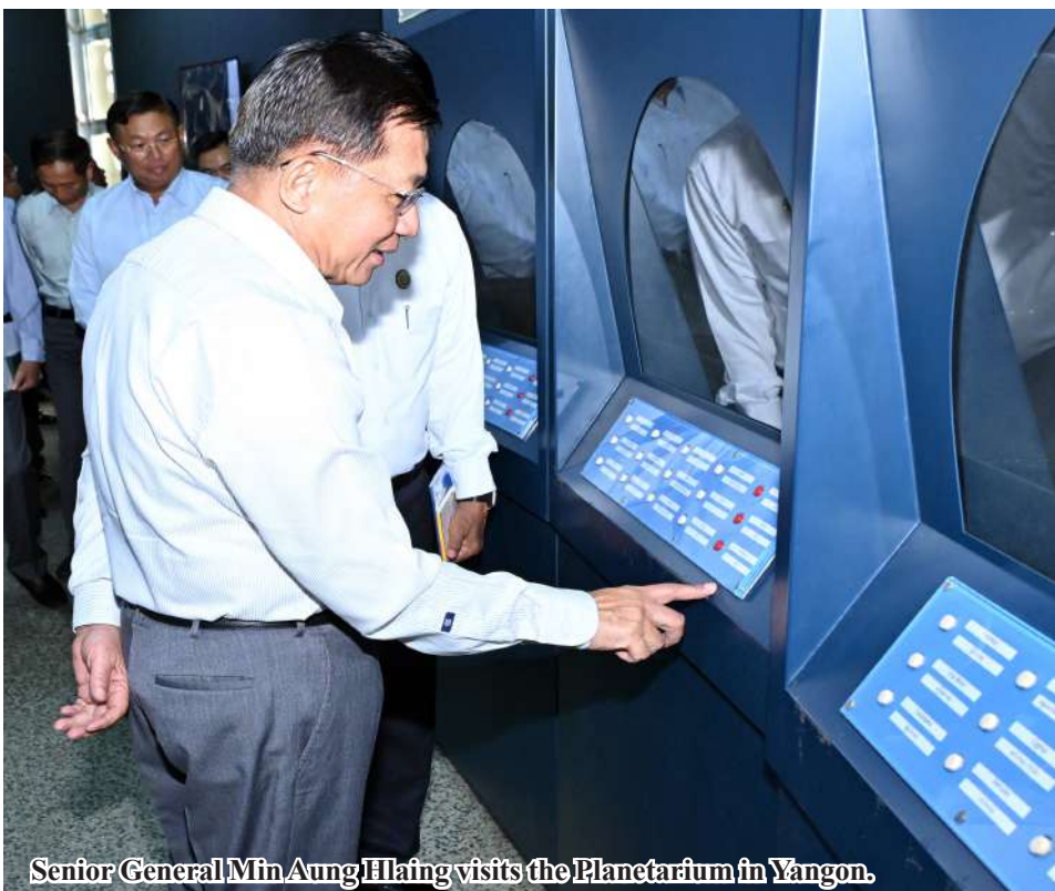
Senior General Min Aung Hlaing visits the Planetarium in Yangon.

safety of the mid piers must be taken into account. The Senior General presented basket of fruits for engineers of the project through officials. The Senior General and party inspected the functions of the bridge project and looked into the requirements. See Page 14