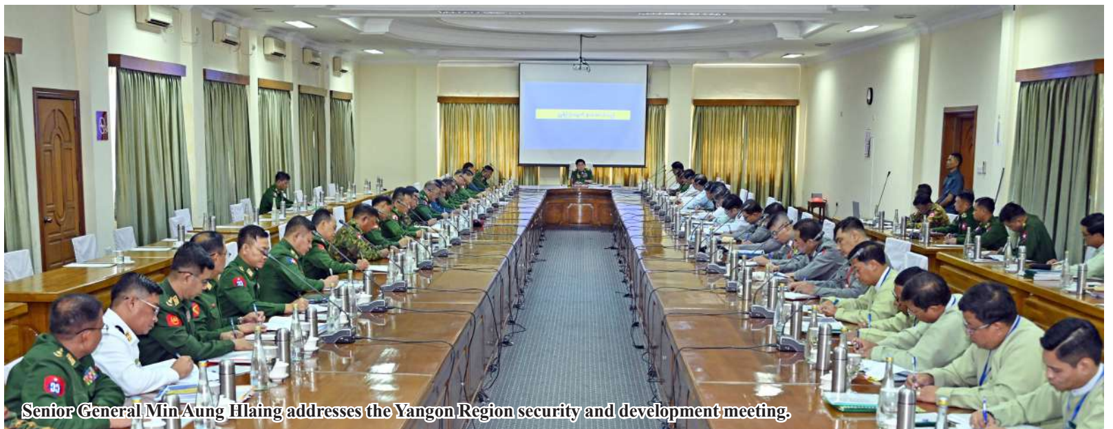
Senior General Min Aung Hlaing addresses the Yangon Region security and development meeting.