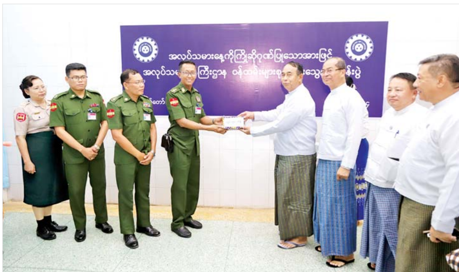
ပြည်ထောင်စုဝန်ကြီး ဦးမြင့်နောင် အမှတ်(၂) တပ်မတော် ဆေးရုံကြီး(ခုတင်-၁၀၀၀)၊ နေပြည်တော်တွင် တက်ရောက်ဆေးကုသမှုခံယူနေသော တပ်မတော်သားများအတွက် ထောက်ပံ့ငွေ ပေးအပ်လှူဒါန်းစဉ်။

နေပြည်တော် ဧပြီ ၂၅ မေ ၁ ရက်တွင် ကျရောက်မည့် အပြည်ပြည်ဆိုင်ရာ အလုပ်သမားနေ့ကို ကြိုဆိုဂုဏ်ပြုသော အားဖြင့် အလုပ်သမားဝန်ကြီးဌာနမှ ဝန်ထမ်းများ စုပေါင်းသွေးလှူဒါန်းပွဲအခမ်းအနားကို ယနေ့ နံနက်ပိုင်းတွင် နေပြည်တော် ပြည်သူ့ဆေးရုံကြီး (ခုတင်-၁၀၀၀)နှင့် အမှတ်(၂) တပ်မတော်ဆေးရုံကြီး (ခုတင်-၁၀၀၀) တို့၌ကျင်းပရာ ပြည်ထောင်စုဝန်ကြီး ဦးမြင့်နောင်၊ ဒုတိယဝန်ကြီး ဦးဝင်းရှိန်၊ အမြဲတမ်းအတွင်းဝန်၊ ညွှန်ကြားရေးမှူးချုပ်များနှင့် ဌာနဆိုင်ရာတာဝန်ရှိသူများ တက်ရောက်အားပေးကြသည်။