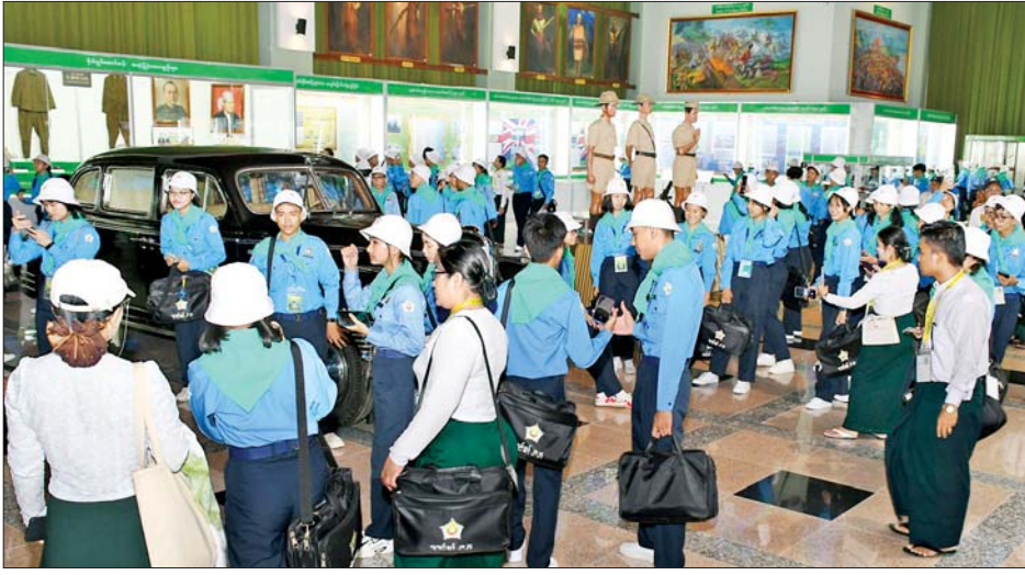
လူရည်ချွန်ကျောင်းသား ကျောင်းသူများ တပ်မတော်စစ်သမိုင်းပြတိုက်အတွင်း လေ့လာကြည့်ရှုကြစဉ်။

နေပြည်တော် ဧပြီ ၂၅ ၂၀၂၃-၂၀၂၄ ပညာသင်နှစ် အတွက် ရွေးချယ်ခံရသည့် နေပြည်တော်အပါအဝင် တိုင်းဒေသကြီးနှင့် ပြည်နယ်အသီးသီး တို့မှ လူရည်ချွန်ကျောင်းသား ကျောင်းသူများသည် ယနေ့နံနက်ပိုင်းတွင် နေပြည်တော်ရှိ တပ်မတော် စစ်သမိုင်းပြတိုက်နှင့် အမျိုးသားပြတိုက်တို့ကို သွားရောက်လေ့လာကြသည်။