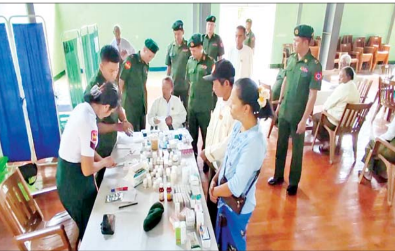
လှူဖွယ်ပစ္စည်းများနှင့် နေ့ဆွမ်း ဆက်ကပ်လှူဒါန်းသည်။ အလားတူ စစ်ကိုင်းတိုင်းဒေသကြီး ခန္တီးမြို့နယ်ရှိ စစ်မှုထမ်းဟောင်းအဖွဲ့ဝင် ၆၅ ဦးကိုလည်း အနောက်မြောက်တိုင်းစစ်ဌာနချုပ် နယ်မြေခံဆေးကုသရေးအဖွဲ့က နယ်မြေခံတပ်နယ်ခန်းမ၌ သွေးတိုးရောဂါ၊ သွားနှင့်ခံတွင်းရောဂါ၊ နှလုံးရောဂါ၊ အရိုးအကြောရောဂါ၊ အစာအိမ်နှင့် အူလမ်းကြောင်းဆိုင်ရာရောဂါ၊ အသည်းရောဂါ၊ အထွေထွေရောဂါတို့နှင့် ပတ်သက်၍ လိုအပ်သည့် ကျန်းမာရေးစစ်ဆေးပေးခြင်းများ ဆောင်ရွက်ပေးနေမှုများကို နယ်မြေခံတပ်နယ်မှ တာဝန်ရှိသူများက သွားရောက် ကြည့်ရှုအားပေးစကားပြောကြားပြီး စားသောက်ဖွယ်ရာများ ထောက်ပံ့ပေးအပ်ခဲ့ကြောင်း သိရသည်။

ထိုသို့ဆောင်ရွက်ပေးရာတွင် ဆေးကုသရေးအဖွဲ့က သံဃာတော် ၃၇ ပါးနှင့် သာသနာ့နယ်ဝင်သီလရှင် သုံးပါးတို့အား ခွဲစိတ်ကုသမှုရောဂါ၊ အရိုးအကြောရောဂါ၊ အာရုံကြောအားနည်းရောဂါ၊ အထွေထွေရောဂါတို့နှင့် ပတ်သက်၍ လိုအပ်သည့် ကျန်းမာရေးစစ်ဆေးကုသပေးခြင်းများ ဆောင်ရွက်ခြင်း၊ ECG စက်ဖြင့် နှလုံးစမ်းသပ်စစ်ဆေးပေးခြင်း၊ ဓာတ်မှန်ရိုက်ကူး၍ ရောဂါရှာဖွေပေးခြင်းများ ဆောင်ရွက်ပေးသည်။ ယင်းသို့ ဆောင်ရွက်ပေးနေမှုများကို တိုင်းမှူး၊ ဗိုလ်မှူးချုပ်အောင်ဇော်ထွေးနှင့် တာဝန်ရှိသူများက သွားရောက်ကြည့်ရှုအားပေးပြီး အဘယရာမပရိယတ္တိစာသင်တိုက်ဆရာတော်အမှူးပြုသောသံဃာတော်များအား