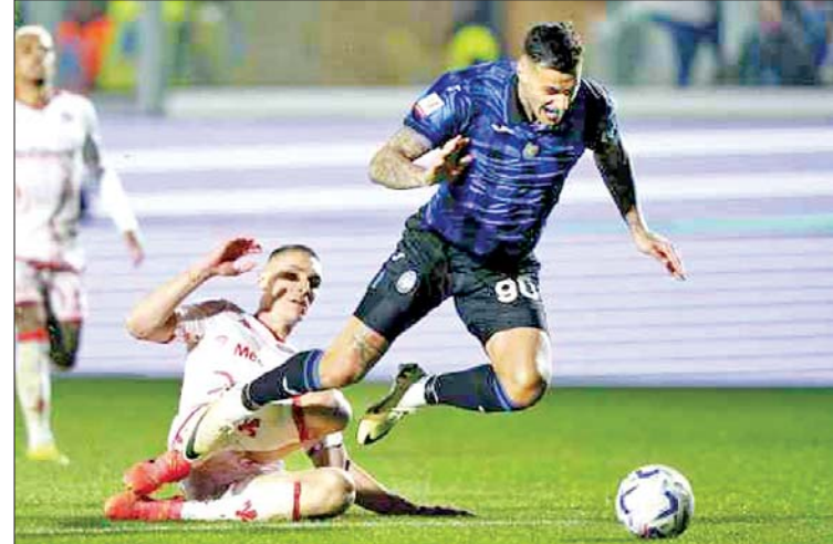
ဖီအိုရင်တီးနားအသင်းနှင့်အတ္တလန္တာအသင်းတို့ ယှဉ်ပြိုင်ကစားကြစဉ်။

အတ္တလန္တာအသင်းနဲ့ ဖီအိုရင်တီးနားအသင်းတို့ ဧပြီ ၂၄ ရက်ညပိုင်းက ယှဉ်ပြိုင်ကစားခဲ့တဲ့ ကိုပါအီတာလီယာဖလားဆီမီးဖိုင်နယ် ဒုတိယအကျော့ပွဲစဉ်မှာ အတ္တလန္တာအသင်းက ဖီအိုရင်တီးနားအသင်းကို လေးဂိုး-တစ်ဂိုးနဲ့ အနိုင်ရရှိခဲ့တာကြောင့် နှစ်ကျော့ပေါင်းရလဒ် လေးဂိုး-နှစ်ဂိုးဖြင့် အတ္တလန္တာအသင်း နောက်ဆုံးပိုလ်လုပွဲတက်လှမ်းခဲ့ပါတယ်။ စာမျက်နှာ ၁၆ ကော်လံ ၁ သို့