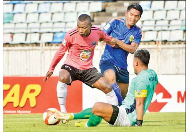
မဟာယူနိုက်တက်နှင့် တက္ကသိုလ်အသင်းတို့ ယှဉ်ပြိုင်ကစားစဉ်။