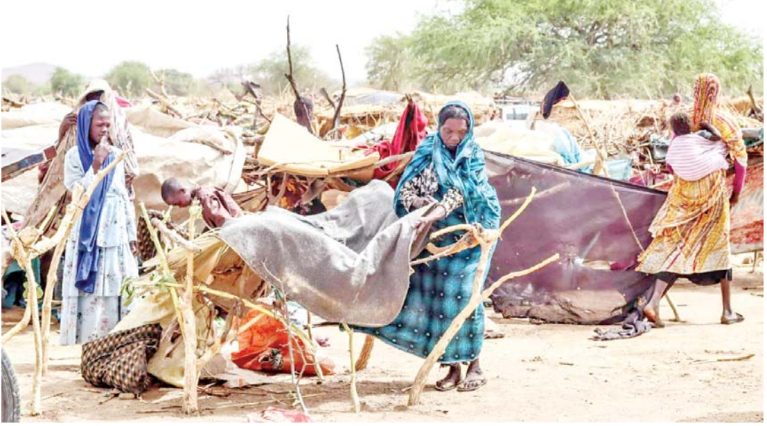
ဆူဒန်နိုင်ငံ ပြည်တွင်းပဋိပက္ခကြောင့် ခိုကိုးရာမဲ့နေရပ်စွန့်ခွာသူများကို တွေ့ရစဉ်။

သူတို့ရဲ့ “အန်ကယ်ကြီးတွေ” ပါဝင်ပတ်သက်နေတဲ့ ကိစ္စတွေဆိုရင်တော့ ဘာမှ မလုပ်ကြတော့ဘဲ လက်ရှောင်နေကြရဲ့။ ဒီလို အနေအထားမျိုးမှာ ဝေးဝေးကပ် ဝေဖန်သမူပြုမယ်။ ဖြစ်စဉ်အများအပြားမှာတော့ ရှေ့တိုးထိပ်တိုက်ရင်ဆိုင်ခြင်းမရှိဘဲ နောက်ဆုတ်ပြီး ကုပ်ကုပ်လေးနေကြမယ်။ တိတ်တိတ်လေးနေကြမယ်။ လွတ်လပ်ရေးကြေညာလိုက်တဲ့ ပါပူဝါနယူးဂီနီကိုတော့ သူတို့အရေးစိုက်ကြတယ်။ ဒါကတော့ သူတို့ရဲ့ “အန်ကယ်ကြီးတွေ” ရဲ့ လုပ်ဆောင်ချက်