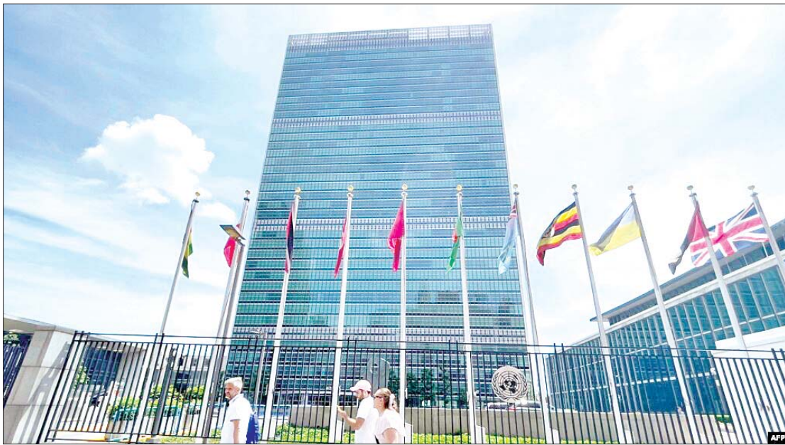
နယူးယောက်မြို့ရှိ ကုလသမဂ္ဂရုံးချုပ်။

ဒီလိုပြောဆိုချက်မျိုးဟာ အဓိပ္ပာယ်ရှိပါရဲ့လား။ မှန်ကန်ပါရဲ့လား။ ပညာရှိသူတွေသာ မှန်မှန်ကန်ကန် ဆုံးဖြတ်ချက်ချနိုင်မှာ မဟုတ်ပါလား။ အငြိမ်းစားယူထားတော့လည်း ရဲဖန်ရံခါ ပျင်းရိထိုင်းမိုင်းနေမှာပေါ့။