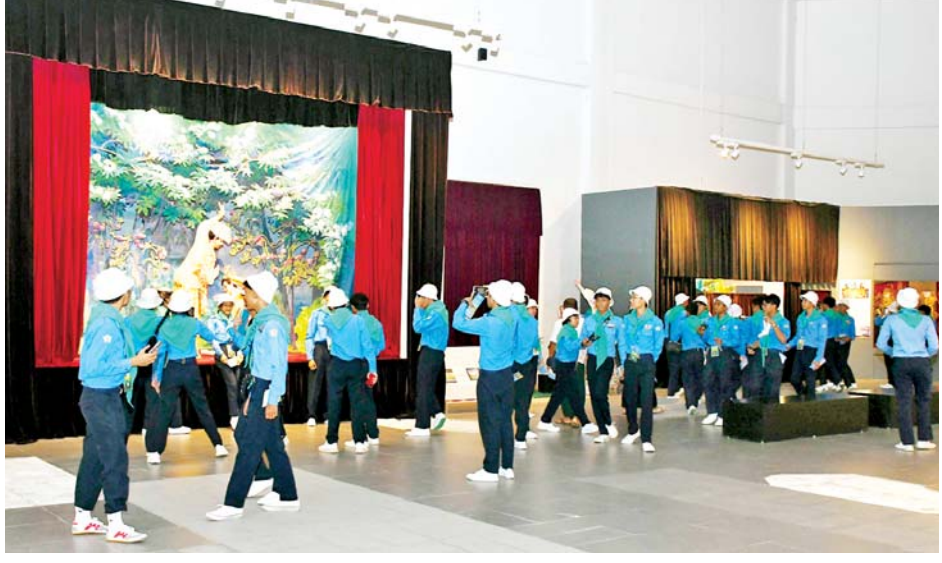
လူရည်ချွန်ကျောင်းသား ကျောင်းသူများ အမျိုးသားပြတိုက်အတွင်း လေ့လာကြည့်ရှုကြစဉ်။