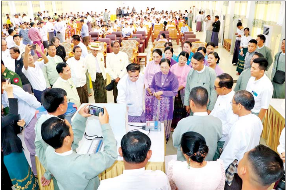
အထွေထွေအုပ်ချုပ်ရေးဦးစီးဌာနမှ အရာထမ်း၊ အမှုထမ်းများ၊ နိုင်ငံရေးပါတီများမှ ခရိုင်နှင့် မြို့နယ် အဆင့် ပါတီဥက္ကဋ္ဌများနှင့် အမှုဆောင်များ၊ အများပြည်သူများက လက်တွေ့စမ်းသပ်မဲပေးခဲ့ကြသည်။

MEVM (Myanmar Electronic Voting Machine) စက်ဖြင့် လက်တွေ့စမ်းသပ်မဲပေးခြင်းလုပ်ငန်းကို မွန်းလွှဲပိုင်းတွင် ပဲခူးမြို့ မြို့တော်ခန်းမ၌ ဆက်လက်ဆောင်ရွက်ခဲ့ရာ ပဲခူးခရိုင်နှင့် ပဲခူးမြို့နယ်အဆင့် ဌာနဆိုင်ရာတာဝန်ရှိသူများ၊ ပဲခူးခရိုင်နှင့် ပဲခူးမြို့နယ်