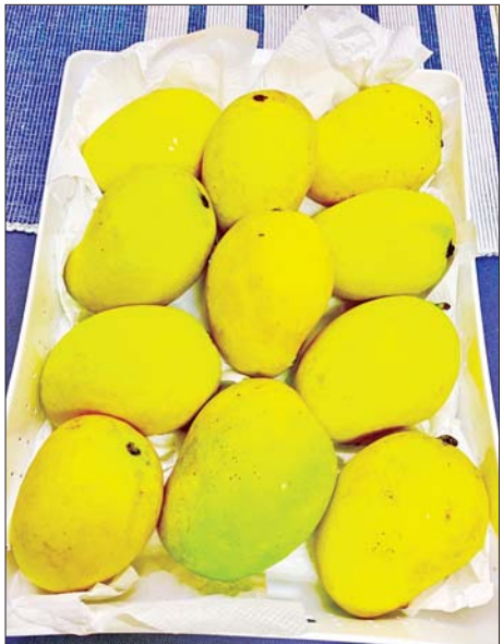
ယခုနှစ်တွင် ဈေးကွက်အတွင်းသို့ ပေါ်ဦးပေါ်ဖျား ဝင်ရောက်လာသည့် စိန်တလုံးသရက်သီး။