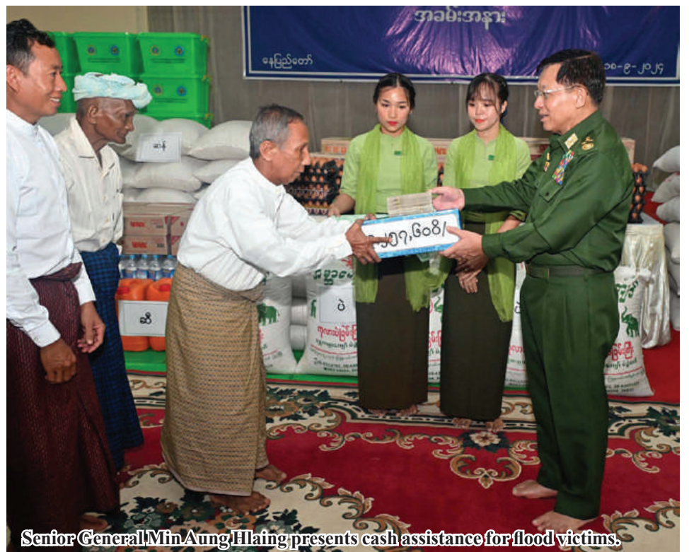
Senior General Min Aung Hlaing presents cash assistance for flood victims.

able to the relevant place. Efforts are being made to reopen schools at the end of this month. Schools that closed due various reasons must open on weekends after Thidingyt (festival of lights). Before the Buddhist lent there will be classes on Sundays. Children might have to attend classes at least on Sundays. Examination questions will be based on the courses the students have learned. We made programs for the schools that were closed to open during the remaining period of the academic year. So, parents should send their children back to the school. Knowledge and education will be much beneficial for