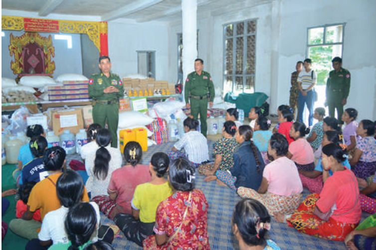
ကာကွယ်ရေးဦးစီးချုပ်ရုံး(ကြည်း)မှ ဒုတိယဗိုလ်ချုပ်ကြီးဖုန်းမြတ် ရေးဘေးသင့်ပြည်သူများကို အားပေးစကားပြောကြားစဉ်။

ယနေ့တွင် တပ်မတော်သားများ၊ မြန်မာနိုင်ငံရဲတပ်ဖွဲ့ဝင်များ၊ မီးသတ်တပ်ဖွဲ့ဝင်များ၊ ကြက်ခြေနီတပ်ဖွဲ့ဝင်များနှင့် လူမှုဝန်ထမ်းကယ်ဆယ်ရေးအဖွဲ့များက ရေများပြန်လည်ကျဆင်းသွားသည့် နေပြည်တော်ကောင်စီနယ်မြေ ဇေယျာသီရိမြို့နယ်၊ ပျဉ်းမနားမြို့နယ်၊ တပ်ကုန်းမြို့နယ်၊ လယ်ဝေးမြို့နယ်၊ ပုဗ္ဗသီရိမြို့နယ်၊ ရှမ်းပြည်နယ်(တောင်ပိုင်း) ရွှေညောင်မြို့နယ်နှင့် ကလေးမြို့နယ်၊ ရှမ်းပြည်နယ်(အရှေ့ပိုင်း) တာချီလိတ်မြို့၊ စစ်ကိုင်းတိုင်းဒေသကြီး ကလေးမြို့၊ မန္တလေးတိုင်းဒေသကြီး ကျောက်ဆည်မြို့၊ မြစ်သားမြို့၊ တံတားဦးမြို့နယ်နှင့် စဉ့်ကိုင်မြို့နယ်၊ ပဲခူးတိုင်းဒေသကြီး တောင်ငူမြို့အပါအဝင် အခြားမြို့နယ်တို့ရှိ ရပ်ကွက်၊ ကျေးရွာများမှ ဘုန်းတော်ကြီးကျောင်းများ၊ စာသင်ကျောင်းများ၊ ဆေးရုံ၊ ဆေးခန်းများ၊ ဌာနဆိုင်ရာအဆောက်အအုံများတွင် လိုအပ်သည့် သန့်ရှင်းရေးလုပ်ငန်းများဆောင်