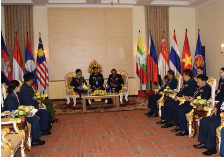
ကာကွယ်ရေးဦးစီးချုပ်(လေ) ဗိုလ်ချုပ်ကြီးထွန်းအောင် ကမ္ဘောဒီးယားလေတပ်ဦးစီးချုပ် General Soeung Samnang နှင့် နှစ်နိုင်ငံလေတပ်ချင်း တွေ့ဆုံဆွေးနွေးစဉ်။

နေပြည်တော် စက်တင်ဘာ ၁၈ ကမ္ဘောဒီးယားနိုင်ငံ၌ ကျင်းပပြုလုပ်မည့် (၂၁)ကြိမ်မြောက် အာဆီယံလေတပ်ဦးစီးချုပ်များအစည်းအဝေး (21 st ASEAN Air Chiefs Conference- 21 st AACC)သို့ တက်ရောက်ရန်အတွက် ကမ္ဘောဒီးယားနိုင်ငံ Siem Reap မြို့သို့ ရောက်ရှိနေသည့် ကာကွယ်ရေးဦးစီးချုပ်(လေ) ဗိုလ်ချုပ်ကြီး ထွန်းအောင် ဦးဆောင်သောကိုယ်စားလှယ်အဖွဲ့သည် စက်တင်ဘာ ၁၅ ရက် နံနက်ပိုင်းတွင် ကမ္ဘောဒီးယားလေတပ်ဦးစီးချုပ် General Soeung Samnang၊ နေ့လယ်ပိုင်းတွင် ထိုင်းဘုရင့်လေတပ်ဦးစီးချုပ် Air Chief Marshal Punnakdee Pattanakul နှင့် လာအိုလေတပ်ဦးစီးချုပ် (ကိုယ်စား) လာအိုလေတပ်ဦးစီးချုပ် Brigadier General Bounma CHANTHAVONGSA တို့နှင့် သီးခြားစီတွေ့ဆုံ၍ နှစ်နိုင်ငံလေတပ်များကြား ပညာရေးနှင့်လေ့ကျင့်ရေးဆိုင်ရာ ပူးပေါင်းဆောင်ရွက်မှုများ ပိုမိုတိုးမြှင့်ဆောင်ရွက်သွားနိုင်ရေး၊ သဘာဝဘေးအန္တရာယ် ကာကွယ်တားဆီးရေးဆိုင်ရာ လေ့ကျင့်ခန်းများပူးပေါင်းဆောင်ရွက်နိုင်ရေး၊ လူသားချင်းစာနာထောက်ထားမှုဆိုင်ရာအကူအညီများနှင့် သဘာဝဘေးအန္တရာယ်ကာကွယ်တားဆီးရေးလုပ်ငန်းများ ပူးပေါင်းဆောင်ရွက်ရေးတို့အတွက် နှစ်နိုင်ငံလေတပ်များကြား ပိုမိုနီးကပ်စွာ