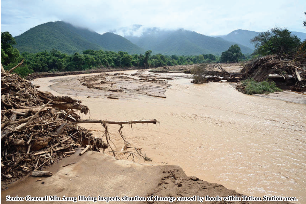
Senior General Min Aung Hlaing inspects situation of damage caused by floods within Tatkon Station area.