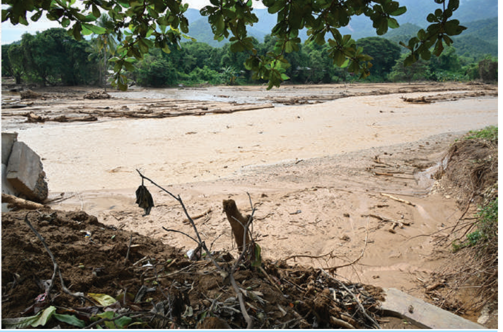
နိုင်ငံတော်စီမံအုပ်ချုပ်ရေးကောင်စီဥက္ကဋ္ဌ တပ်မတော်ကာကွယ်ရေးဦးစီးချုပ် ဗိုလ်ချုပ်မှူးကြီးမင်းအောင်လှိုင် တောင်ကျချောင်းရေများအလုံးအရင်းဖြင့် စီးဆင်းခဲ့မှုကြောင့် ကျိုးကျပျက်စီးခဲ့သည့် မုန်ချောင်းကူး ကွန်ကရစ်တံတားပျက်စီးမှုများကို သွားရောက်ကြည့်ရှုစစ်ဆေးစဉ်။

နေပြည်တော် စက်တင်ဘာ ၁၈ မောင်မောင်အေး၊ ကာကွယ်ရေးဦးစီးချုပ် နယ်အတွင်းရှိ တပ်ဌာနချုပ်များကို သွား ခန်းမ၌ အရာရှိ စစ်သည်၊ မိသားစုများကို ပေးနိုင်ရေးအတွက် လာရောက်ခြင်း နိုင်ငံတော်စီမံအုပ်ချုပ်ရေးကောင်စီ (ရေ) ဒုတိယဗိုလ်ချုပ်ကြီးထိန်ဝင်း၊ ရောက်ကြည့်ရှုစစ်ဆေးပြီး လိုအပ်သည် တွေ့ဆုံ၍ မမျှော်မှန်းနိုင်သောရတ်တရက် ဖြစ်ပေါ်လာသည့် သဘာဝဘေးဒဏ်ကို ကြုံတွေ့ခဲ့ရသည့် အရာရှိစစ်သည်မိသားစု များ၏ အခက်အခဲများအား ဖြည့်ဆည်း ဆောင်ရွက်ပေးနိုင်ရေးနှင့် ပြန်လည် ထူထောင်ရေးလုပ်ငန်းများ ဆောင်ရွက် ဥက္ကဋ္ဌ တပ်မတော်ကာကွယ်ရေးဦးစီးချုပ် ဗိုလ်ချုပ်မှူးကြီး မင်းအောင်လှိုင်သည် ယနေ့နံနက်ပိုင်းတွင် နိုင်ငံတော်စီမံ အုပ်ချုပ်ရေးကောင်စီဝင် ညှိနှိုင်းကွပ်ကဲ ရေးမှူးကြီး (ကြည်း၊ ရေ၊ လေ) ဗိုလ်ချုပ်ကြီး မောင်မောင်အေး၊ ကာကွယ်ရေးဦးစီးချုပ် (ရေ) ဒုတိယဗိုလ်ချုပ်ကြီးထိန်ဝင်း၊ ကာကွယ်ရေးဦးစီးချုပ်ရုံးမှ အဆင့်မြင့် တပ်မတော်အရာရှိကြီးများ၊နေပြည်တော် တိုင်းစစ်ဌာနချုပ် တိုင်းမှူးနှင့် တာဝန်ရှိသူ များလိုက်ပါ၍ ရေကြီးရေလျှံမှုသဘာဝ ဘေးဒဏ်ကြုံတွေ့ခဲ့ရသည့်တပ်ကုန်းတပ် နယ်အတွင်းရှိ တပ်ဌာနချုပ်များကို သွား ခန်းမ၌ အရာရှိ စစ်သည်၊ မိသားစုများကို ပေးနိုင်ရေးအတွက် လာရောက်ခြင်း ဖြစ်ကြောင်း၊ မိုးရွာသွန်းမှုများဖြစ်ပေါ်မည် ဟု ကြိုတင်သတိပေးချက်များရှိခဲ့သော် လည်း ယခုအတိုင်းအတာထိ မိုးသည်း ထန်စွာရွာသွန်းမည်ဟု မှန်းဆမှုမရှိခဲ့ ကြောင်း၊ စာမျက်နှာ ၁၉ ကော်လံ ၁