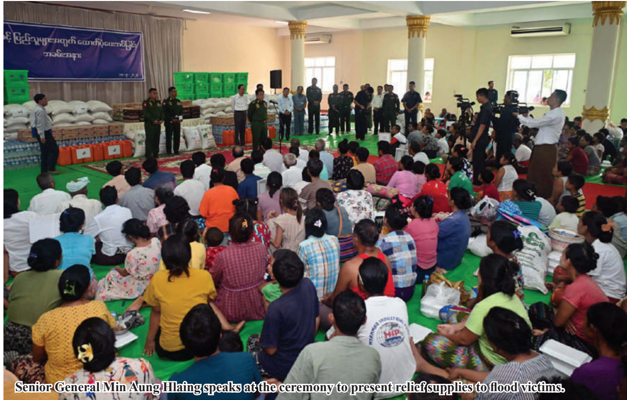
Senior General Min Aung Hlaing speaks at the ceremony to present relief supplies to flood victims.