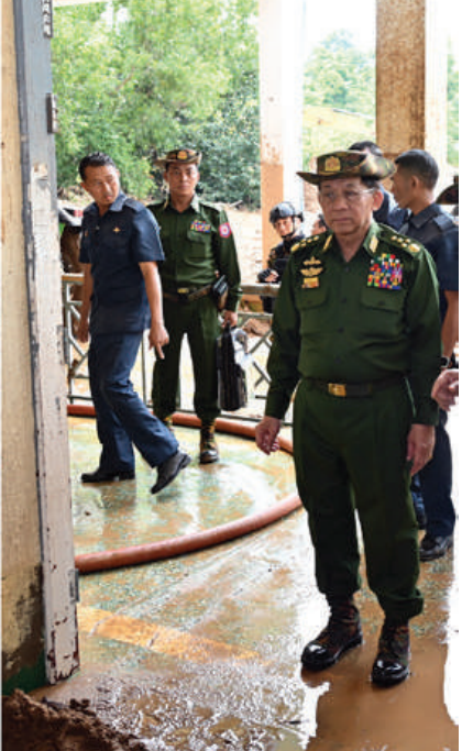
နိုင်ငံတော်စီမံအုပ်ချုပ်ရေးကောင်စီဥက္ကဋ္ဌ တပ်မတော်ကာကွယ်ရေးဦးစီးချုပ် ဗိုလ်ချုပ်မှူးကြီးမင်းအောင်လှိုင် ရေကြီးရေလျှံမှုများကြောင့် ထိခိုက်ပျက်စီးခဲ့ပြီး ရေများ ပြန်လည်ကျဆင်းသွားသည့်အချိန်တွင် နန်းတင်ကျန်ခဲ့သည့် အထက်တန်းကျောင်း၌ နန်းများဖယ်ရှားရှင်းလင်းခြင်းနှင့် သန့်ရှင်းရေးလုပ်ငန်းဆောင်ရွက်နေမှုများကို ကြည့်ရှု စစ်ဆေးစဉ်။