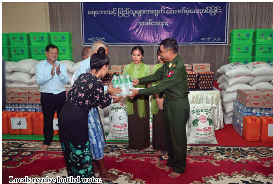
Locals receive bottled water.

summer paddy as a replacement of the lost monsoon paddy fields. This year's heavy rains had filled dams to the brim. So, summer paddy will get enough irrigation water. As farmed animals were also killed, assistance will be provided to the most possible degree to restart farming activities. Systematic farming ensures better benefits.