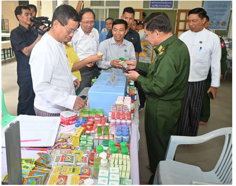
နိုင်ငံတော်စီမံအုပ်ချုပ်ရေးကောင်စီဥက္ကဋ္ဌ တပ်မတော်ကာကွယ်ရေးဦးစီးချုပ် ဗိုလ်ချုပ်မှူးကြီးမင်းအောင်လှိုင် ရေဘေးသင့်ပြည်သူများအတွက် ကျန်းမာရေးဝန်ကြီးဌာနမှ ကျန်းမာရေးစောင့်ရှောက်မှုဆေးခန်းဖွင့်လှစ်၍ ဆောင်ရွက်ပေးထားမှုများကို ကြည့်ရှု စစ်ဆေးစဉ်။