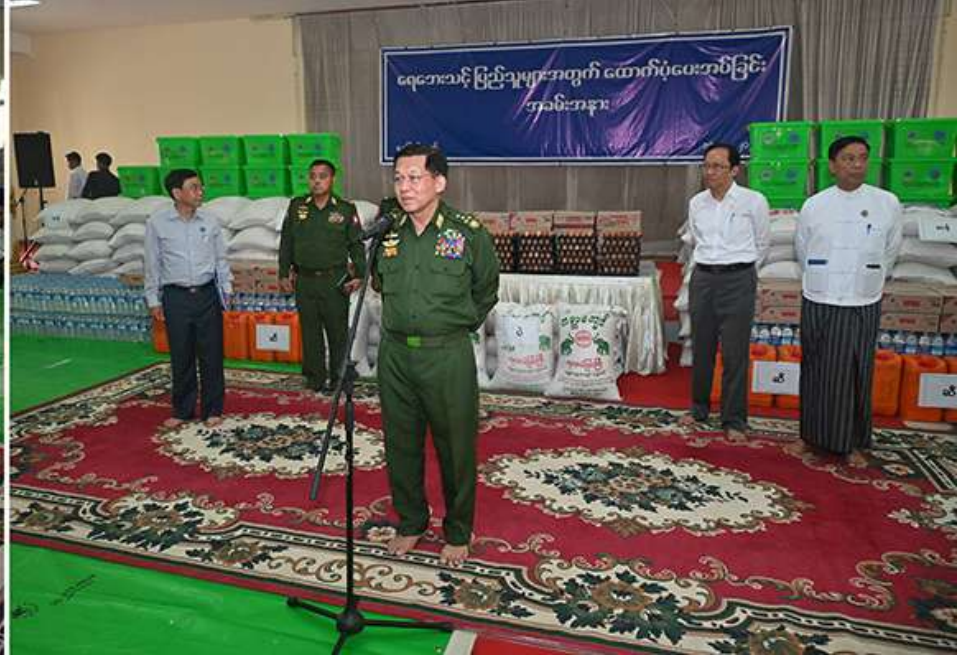
နိုင်ငံတော်စီမံအုပ်ချုပ်ရေးကောင်စီဥက္ကဋ္ဌ တပ်မတော်ကာကွယ်ရေးဦးစီးချုပ် ဗိုလ်ချုပ်မှူးကြီးမင်းအောင်လှိုင် ပျဉ်းမနားမြို့နယ် မင်္ဂလာဗျူဟာသာသနာဗိမာန် ရေဘေးရှောင်ကယ်ဆယ်ရေးစခန်းရှိ ရေဘေးရှောင်ပြည်သူများကို အားပေးစကားပြောကြားစဉ်။