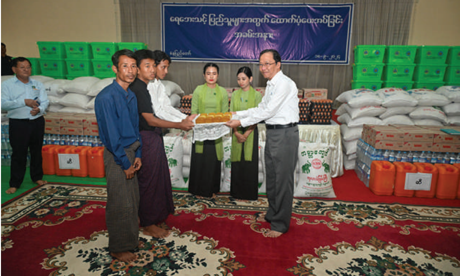
ကျန်းမာရေးဝန်ကြီးဌာန ပြည်ထောင်စုဝန်ကြီး ဒေါက်တာသက်ခိုင်ဝင်း ရေးဘေးသင့်ပြည်သူများ အတွက် ထောက်ပံ့ရေးပစ္စည်းများနှင့် စားသောက်ဖွယ်ရာပစ္စည်းများ ထောက်ပံ့ပေးအပ်စဉ်။

စာမျက်နှာ ၁၇ မှ အဆက် ထိုနည်းတူ သေဆုံးခဲ့ရသူများအတွက် လည်း နိုင်ငံတော်အနေဖြင့် ငွေကြေး ထောက်ပံ့ပေးခြင်းများ၊ တိုင်းဒေသကြီးနှင့် ဒဏ်ရာရရှိသူများကိုလည်း ထိခိုက်မှု အတွက် စာရင်းကောက်ယူခြင်းများ၊ ပြည်နယ်အလိုက်၊ ဝန်ကြီးဌာနအလိုက် ငွေကြေးထောက်ပံ့ပေးခြင်းများ ဆောင် ရွက်ပေးသွားရမည်ဖြစ်ကြောင်း၊ ထိခိုက် ထောက်ပံ့မှုများ ဆောင်ရွက်ပေးနိုင်ရေး အတွက် အနည်းအများအလိုက် ထောက်ပံ့မှုများ ဆောင်ရွက် ပေးသွားရမည်ဖြစ်ကြောင်း၊ ထောက်ပံ့မှုများ ဆောင်ရွက်ပေးနိုင်ရေး အတွက်