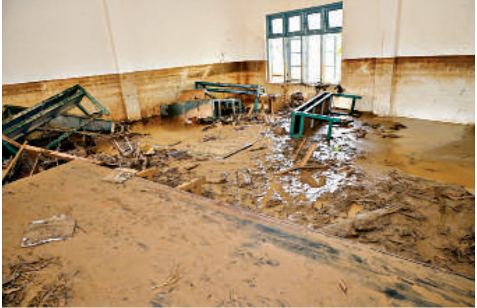
ရေကြီးရေလျှံမှုများကြောင့် ထိခိုက်ပျက်စီးခဲ့ပြီး ရေများပြန်လည်ကျဆင်းသွားသည့်အချိန်တွင် နန်းတင်ကျန်ခဲ့သည့်အထက်တန်းကျောင်း၌ နန်းများတင်ကျန်နေမှုအား ဖယ်ရှားရှင်းလင်းခြင်းနှင့် သန့်ရှင်းရေးလုပ်ငန်းများဆောင်ရွက်နေမှုကို တွေ့ရစဉ်။

စာမျက်နှာ ၁၉ မှအဆက် လိုအပ်သည်များမှာကြားကာ ကူညီကယ်ဆယ်ရေးလုပ်ငန်းဆောင်ရွက်နေမှုများကို ကြည့်ရှုသည်။ ဆက်လက်ပြီး နိုင်ငံတော်စီမံအုပ်ချုပ်ရေးကောင်စီဥက္ကဋ္ဌ တပ်မတော်ကာကွယ်ရေးဦးစီးချုပ်နှင့် အဖွဲ့ဝင်များသည် နယ်မြေခံတပ်ဌာနချုပ် အိမ်ထောင်သည် လိုင်းခန်းများအတွင်း တောင်ကျချောင်းရေ