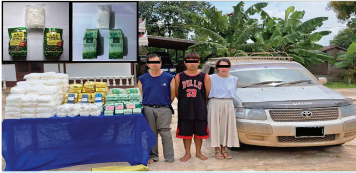
ပြစ်မှုကျူးလွန်သူများကို မော်တော်ယာဉ်၊ မူးယစ်ဆေးဝါးများနှင့်အတူ တွေ့ရစဉ်။