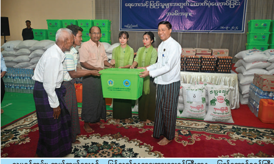
လူမှုဝန်ထမ်း၊ ကယ်ဆယ်ရေးနှင့် ပြန်လည်နေရာချထားရေးဝန်ကြီးဌာန ပြည်ထောင်စုဝန်ကြီး ဒေါက်တာစိုးဝင်း ရေးဘေးသင့်ပြည်သူများအတွက် ထောက်ပံ့ရေးပစ္စည်းများနှင့် စားသောက်ဖွယ်ရာပစ္စည်း များ ထောက်ပံ့ပေးအပ်စဉ်။