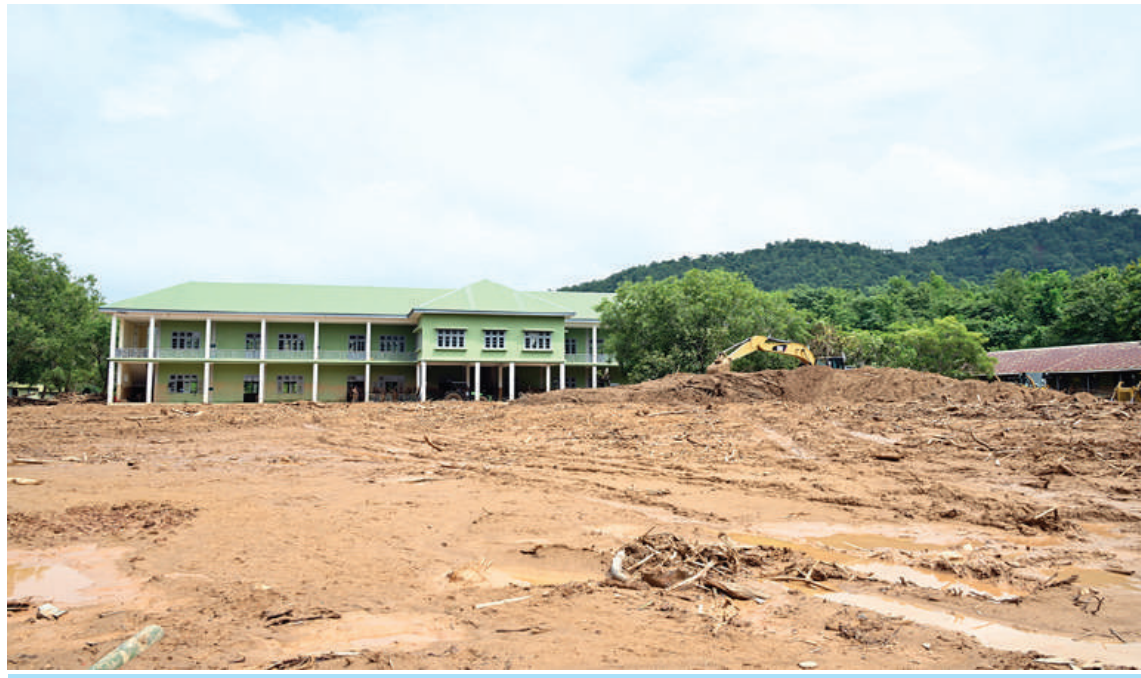
ရေကြီးရေလျှံမှုများကြောင့် ထိခိုက်ပျက်စီးခဲ့သည့် အထက်တန်းကျောင်းကို တွေ့ရစဉ်။

စနစ်တကျသုတေသနပြုလုပ်၍ရွှေ့ပြောင်း ဆောက်လုပ်ခြင်းများ ဆောင်ရွက်ပေး သွားရန်လိုကြောင်းနှင့်အခြားလိုအပ်သည် များကို မှာကြားသည်။ ထို့နောက် နိုင်ငံတော်စီမံအုပ်ချုပ်ရေး ကောင်စီဥက္ကဋ္ဌ တပ်မတော်ကာကွယ်ရေး ဦးစီးချုပ်သည် တက်ရောက်လာကြသည့် စစ်သည်မိသားစုများ၏ရေကြီးရေလျှံမှုကြုံ တွေ့ခဲ့မှုများ၊အခက်အခဲများကို မေးမြန်း ကာ လိုအပ်သည်များ ညှိနှိုင်းဖြည့်ဆည်း ဆောင်ရွက်ပေးသည်။ ယင်းနောက် နိုင်ငံ တော်စီမံအုပ်ချုပ်ရေးကောင်စီ ဥက္ကဋ္ဌ တပ်မတော်ကာကွယ်ရေး ဦးစီးချုပ်က မိသားစုဝင်များအတွက် စားသောက်ဖွယ်ရာ ပစ္စည်းများနှင့် အဝတ်အထည်များကို ထောက်ပံ့ပေးအပ်ရာ စစ်သည်၊ မိသားစု များက လက်ခံရယူကြသည်။