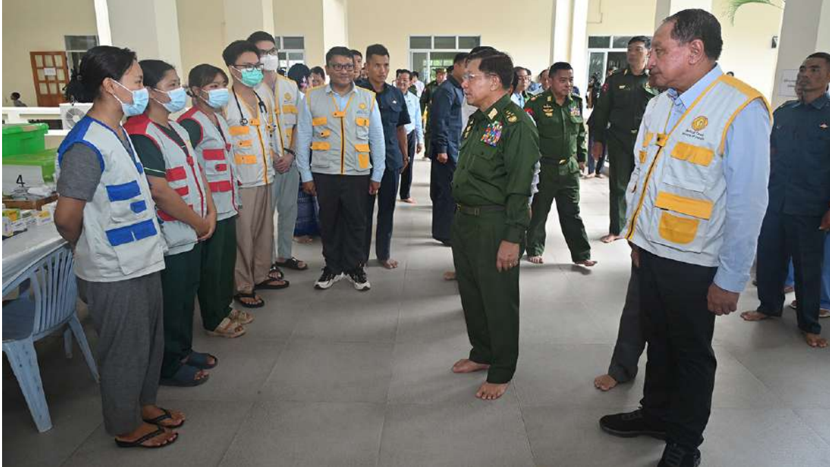
နိုင်ငံတော်စီမံအုပ်ချုပ်ရေးကောင်စီဥက္ကဋ္ဌ တပ်မတော်ကာကွယ်ရေးဦးစီးချုပ် ဗိုလ်ချုပ်မှူးကြီးမင်းအောင်လှိုင် ရေဘေးသင့် ပြည်သူများအတွက် ကျန်းမာရေးဝန်ကြီးဌာနမှ ကျန်းမာရေးစောင့်ရှောက်မှုဆေးခန်းဖွင့်လှစ်၍ ဆောင်ရွက်ပေးထားမှုများကို ကြည့်ရှု စစ်ဆေးစဉ်။