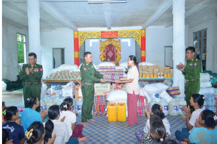
နေပြည်တော်တိုင်းစစ်ဌာနချုပ် တိုင်းမှူး ဗိုလ်ချုပ်စိုးမင်း ရေးဘေးသင့်ပြည်သူများအတွက် စားသောက်ဖွယ်ရာများနှင့် ထောက်ပံ့ရေးပစ္စည်းများ ပေးအပ်စဉ်။

ရွက်ပေးခြင်း၊ လိုအပ်သည်များ ကူညီရွှေ့ပြောင်းပေးခြင်းနှင့် လမ်း၊ တံတားများ၊ ရပ်ကွက်၊ ကျေးရွာများအတွင်း၌ တင်ကျန်ခဲ့သည့် နန်းများ၊ သစ်ပင်သစ်ကိုင်းများ ဖယ်ရှားပေးခြင်းအပါအဝင် အခြား လိုအပ်သည်များကို ဒေသခံပြည်သူများနှင့် ပူးပေါင်း၍ တက်ကြွစွာ ဆောင်ရွက်ပေးလျက်ရှိသည်။ ထို့ပြင် ယာယီရေးဘေးရှောင်စခန်းများ၊ ဘုန်းတော်ကြီးကျောင်းများနှင့် ရပ်ကွက်၊ ကျေးရွာများရှိ ရေးဘေးသင့်ပြည်သူများအား ကျန်းမာရေးအဖွဲ့များက လိုအပ်သည့် ကျန်းမာရေး စောင့်ရှောက်မှုလုပ်ငန်းများ ဆောင်ရွက်ပေးခြင်းများ ဆောင်ရွက်ပေးခြင်းနှင့်လိုအပ်သည့် ကျန်းမာရေး အသိပညာပေး ဟောပြောဆွေးနွေးခြင်း၊ တပ်မတော်(ကြည်း)ရေလေ)မိသားစုများ၊ ရေကြီးမှုကြောင့် ပျက်စီးမှုများဖြစ်ပေါ်