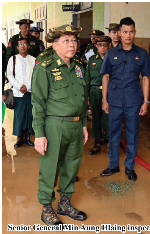
Senior General Min Aung Hlaing inspects situation of damage to a school caused by flooding.

education high school affected by the flash flood. The school in-charge and teachers reported on flash flood measures and progress of clearing debris. After hearing the reports, the Senior