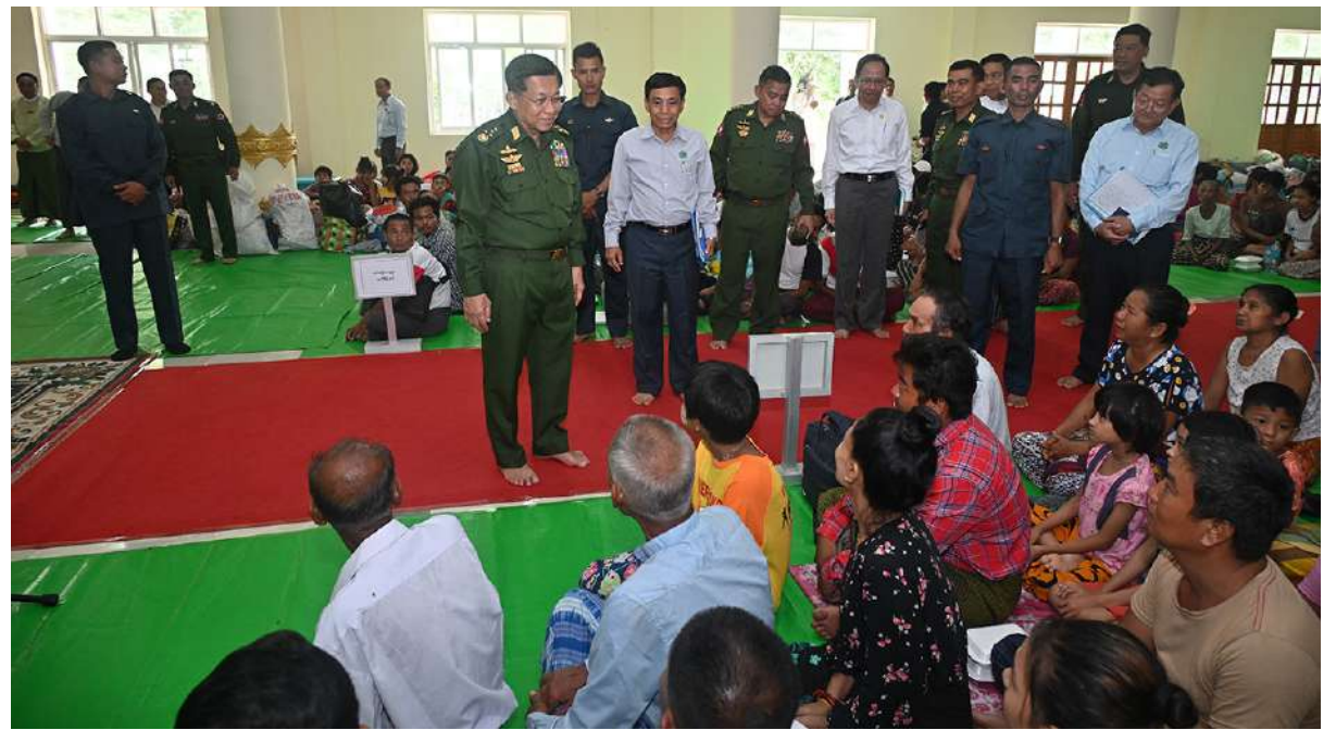
နိုင်ငံတော်စီမံအုပ်ချုပ်ရေးကောင်စီဥက္ကဋ္ဌ တပ်မတော်ကာကွယ်ရေးဦးစီးချုပ် ဗိုလ်ချုပ်မှူးကြီးမင်းအောင်လှိုင် ပျဉ်းမနားမြို့နယ် မင်္ဂလာဗျူဟာသာသနာဗိမာန် ရေဘေးရှောင်ကယ်ဆယ်ရေးစခန်းအတွင်းရှိ ပြည်သူများအား ရင်းရင်းနှီးနှီး လိုက်လံနှုတ်ဆက်အားပေးစဉ်။

ကျွန်တော်တို့ထက်သာအောင်လုပ်ပေးရမယ်။ ကျွန်တော်တို့ခေတ်ထက်သာအောင် လုပ်ပေး ရမယ်။ ဒါတကယ်မိဘာပီသပါတယ်။” ထို့နောက် ရေဘေးသင့်ပြည်သူများအား သဘာဝဘေးအန္တရာယ်ကို ကြိုကြိုခံ ကျော်လွှား၍ ပြန်လည်ထူထောင်ရေးလုပ်ငန်းများ လုပ်ဆောင်သွားမည်ဖြစ်ကြောင်း အားပေးစကားပြောကြားရာတွင် “လက်ရှိ အချိန်အခြေအနေမှာတော့ ဒုက္ခသုက္ခရောက် နေတာကိုတော့ ကိုယ်ချင်းစာပါတယ်။ စိတ်လည်းမကောင်းပါဘူး။ ကျွန်တော်တို့ တတ်နိုင်သလောက် နိုင်ငံတော်ပိုင်းကလည်း လုပ်ပေးပါမယ်။ ကျွန်တော်တို့နိုင်ငံတင် မဟုတ်ပါဘူး။ ကျွန်တော်တို့အာရှတင်ပဲလား ဆိုတော့မဟုတ်ဘူး။ ဟိုဥရောပနိုင်ငံတွေ လည်း ရေကြီးနေကြတာပဲ။ သဘာဝကြီးက ဖြစ်လာတာဖြစ်ပါတယ်။ သဘာဝဘေး အန္တရာယ် တစ်ကမ္ဘာလုံးမှာဖြစ်နေကြတာ ဖြစ်တော့ ဒီအပေါ်မှာကျွန်တော်တို့က ကြိုကြိုခံပြီးတော့မှ လူထုရဲ့ ကြံစည်မှုနဲ့လုံ့လ၊ ဝီရိယနဲ့ အားထုတ်သွားမယ်ဆိုလို့ရှိရင်တော့ ကျွန်တော်တို့ ကျော်လွှားလို့ရမယ်ဆိုတာ လေးပြောချင်ပါတယ်။ ဒီအတွက်မလျော့တဲ့ ဇွဲလုံ့လနဲ့ ဆက်ပြီးလုပ်သွားကြဖို့လည်း အားပေးသွားကြဖို့လည်း ပြောလိုပါတယ်။ ဒီမှာအားပေးသွားကြပါ။ ပြန်ရောက်လို့ရှိရင် လည်း ထိုက်သင့်တဲ့ နေဖို့ထိုင်ဖို့စားဖို့