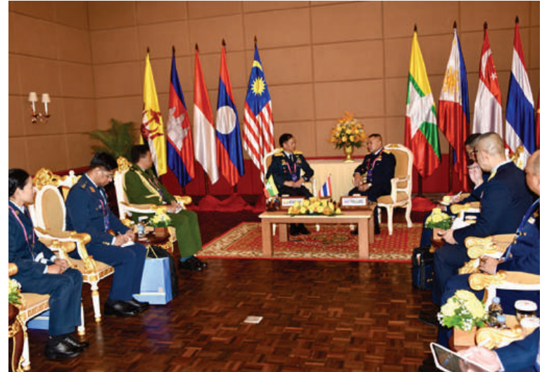
ကာကွယ်ရေးဦးစီးချုပ်(လေ) ဗိုလ်ချုပ်ကြီးထွန်းအောင် ထိုင်းဘုရင့်လေတပ်ဦးစီးချုပ် Air Chief Marshal Punnakdee Pattanakul နှင့် နှစ်နိုင်ငံလေတပ်ချင်း တွေ့ဆုံဆွေးနွေးစဉ်။

ပူးပေါင်းဆောင်ရွက်နိုင်ရေး ကိစ္စရပ်များကို ဆွေးနွေးခဲ့ကြသည်။ ညနေပိုင်းတွင် အာဆီယံလေတပ်ဦးစီးချုပ်များနှင့် ဇနီးများရောက်ရှိခြင်း အထိမ်းအမှတ် ကမ္ဘောဒီးယားလေတပ်ဦးစီးချုပ်နှင့် ဇနီးကတည်းခင်းဧည့်ခံသော Apsara ညစာစားပွဲသို့ တက်ရောက်ခဲ့သည်။ ၎င်းနောက် ကာကွယ်ရေးဦးစီးချုပ်(လေ) ဦးဆောင်သောကိုယ်စားလှယ်အဖွဲ့သည် စက်တင်ဘာ ၁၆ ရက် နံနက်ပိုင်းတွင် Siem Reap မြို့ရှိ Sokha Siem Reap Resorts & Convention Center ၌ ကျင်းပပြုလုပ်သော (၂၁)ကြိမ်မြောက်