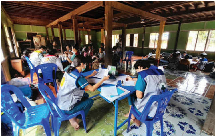
နေပြည်တော်ကောင်စီနယ်မြေ တပ်ကုန်းမြို့နယ် ချောင်းခြားကျေးရွာတွင် အစာအဆိပ်သင့်မှုဖြစ်ပွားခဲ့သည့်လူနာများကို ကျန်းမာရေးဦးစီးဌာနမှ အရေးပေါ်တုံ့ပြန်ရေးအဖွဲ့များက ကွင်းဆင်းဆောင်ရွက်နေမှုကို တွေ့ရစဉ်။ အသိပညာပေးခြင်းများ ဆောင်ရွက် လျက်ရှိသည်။ အဆိုပါလူနာများအနက် တပ်ကုန်း မြို့နယ် ပြည်သူ့ဆေးရုံ(ခုတင်-၁၀၀)တွင် ပြင်ပလူနာဦးရေ ၅၀ နှင့် အတွင်း လူနာအဖြစ် ၅၆ ဦး၊ နေပြည်တော်ပြည်သူ့ဆေးရုံ

နေပြည်တော် စက်တင်ဘာ ၁၈ နေပြည်တော် ကောင်စီနယ်မြေ တပ်ကုန်းမြို့ ကြက်သွန်ခင်းကျေးရွာအုပ်စု ချောင်းခြားကျေးရွာတွင် စက်တင်ဘာ ၁၇ ရက် ညနေပိုင်းတွင် ကျေးရွာသူ၊ ကျေးရွာသား၊ ကလေး၊ လူကြီးအချို့ အစာအဆိပ်သင့်လက္ခဏာများ ဖြစ်ပွားခဲ့ကြောင်း သိရသည်။ အဆိုပါကျေးရွာရှိ ရေဘေးသင့်ပြည်သူများသည် အလှူရှင်များက လာရောက်လှူဒါန်းသည့် ကြက်သားဒိပေါက်၊ ကြက်သားအာလူးဟင်း၊ ဘဲဥခရမ်းချဉ်သီးချက်များကို စားသုံးခဲ့ကြပြီး အစာအဆိပ်သင့်လက္ခဏာများ ဖြစ်ပေါ်ခဲ့ရာ နေပြည်တော်ကျန်းမာရေးဦးစီးဌာနနှင့် တပ်ကုန်းမြို့နယ် ကျန်းမာရေးဦးစီးဌာနမှ အရေးပေါ်တုံ့ပြန်ရေးအဖွဲ့များက အဆိုပါကျေးရွာသို့ရောက်ရှိနေပြီး ကုသခြင်း၊ ဆေးရုံသို့လွှဲပြောင်းခြင်း၊