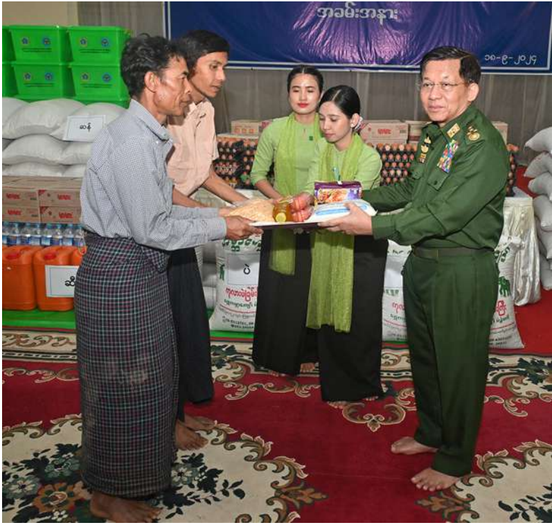
နိုင်ငံတော်စီမံအုပ်ချုပ်ရေးကောင်စီဥက္ကဋ္ဌ တပ်မတော်ကာကွယ်ရေးဦးစီးချုပ် ဗိုလ်ချုပ်မှူးကြီးမင်းအောင်လှိုင် ရေဘေးသင့်ပြည်သူများအတွက် ထောက်ပံ့ငွေနှင့် စားသောက်ဖွယ်ရာပစ္စည်းများ ပေးအပ်စဉ်။

မိမိအနေဖြင့် သဘာဝဘေးအန္တရာယ် ကျရောက်မှုကြောင့် အသက်အိုးအိမ်စည်းစိမ် များပျက်စီးဆုံးရှုံးခဲ့ရမှုအပေါ် များစွာစိတ် မကောင်းဖြစ်ရပါကြောင်း၊ သဘာဝဘေး အန္တရာယ်ဆိုသည်မှာ ရှောင်ရှား၍မရသော် လည်း ကြိုတင်ကာကွယ်မှုကိစ္စရပ်များကို လုပ်ဆောင်နိုင်သကဲ့သို့ သဘာဝဘေး အန္တရာယ်ကျရောက်ပြီးပါက ကယ်ဆယ်ရေး လုပ်ငန်းများဖြင့် မူလအခြေအနေများပြန် ရောက်စေရန်နှင့် ပိုမိုကောင်းမွန်စေရန်