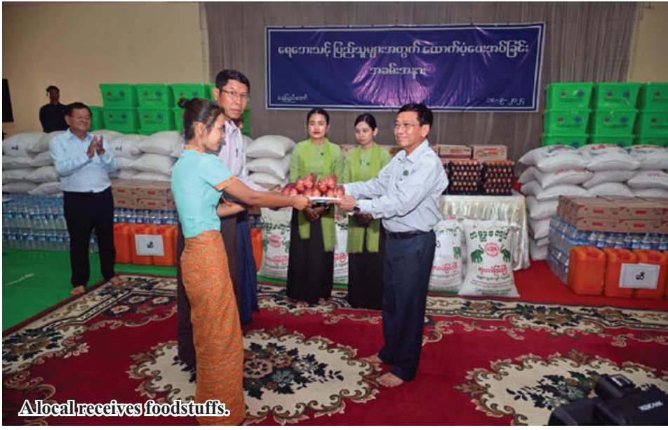
Local receives foodstuffs.