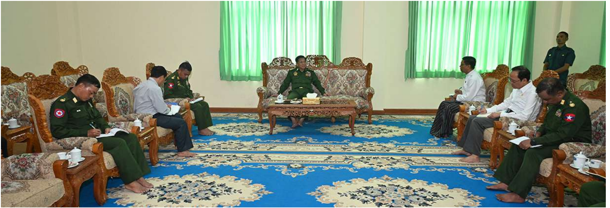
နိုင်ငံတော်စီမံအုပ်ချုပ်ရေးကောင်စီဥက္ကဋ္ဌ တပ်မတော်ကာကွယ်ရေးဦးစီးချုပ် ဗိုလ်ချုပ်မှူးကြီးမင်းအောင်လှိုင် မင်္ဂလာဗျူဟာသာသနာဗိမာန် ဧည့်ခန်းမဆောင်၌ တာဝန်ရှိသူများအား တွေ့ဆုံမှာကြားစဉ်။

ပတ်သက်တာပေါ့။ ဒီလကုန်ထိ ကျောင်းတွေ ဖွင့်ဖို့ကြိုးစားနေပါတယ်။ အကြောင်းကြောင်း ကြောင့် ကျောင်းတွေပိတ်ရတယ်ဆိုရင် လည်း စနောတနင်္ဂနွေမှာအစားထိုးပြန်တက်ဖို့၊ သီတင်းကျွတ်ပြီးသွားရင်တော့ စနောတနင်္ဂနွေဖြစ်မှာပေါ့။ ဝါမကျွတ်ခင်ကတော့ တနင်္ဂနွေပိတ်ရက်ရှိတယ်။ ဒီတနင်္ဂနွေပိတ်ရက်ကိုတော့ ကလေးတွေကျောင်းတက်ကောင်းတက်ရလိမ့်မယ်။ သို့သော်စာမေးပွဲ ဖြေရမယ့်အချိန်မှာ သူသင်ပြီးတဲ့ဘာသာရပ် အတိုင်းပဲ ကျွန်တော်တို့စာမေးပွဲစစ်ပေးပါမယ်။ ကျန်တဲ့အချိန်တွေမှာတော့ ကျောင်းတွေပြန်တက်ရမယ်လို့ သဘာဝဘေးအန္တရာယ်ကြောင့်ပိတ်ထားရတဲ့ကျောင်းတွေကို ဒီလိုစီစဉ်ထားပါတယ်။ ဒါကြောင့် ခင်ဗျားတို့ကျောင်းတွေလည်း ကလေးတွေ ပြန်လွှတ်ပေးဖို့ပြောလိုပါတယ်။ ပြန်လွှတ်ပေးပါ။ စာတတ်လို့ရှိရင် ပညာတတ်လို့ရှိရင် နောင်တစ်ချိန်အတွက် သူတို့ဘဝအတွက် အများကြီး အထောက်အကူရတယ်။ မဟုတ်ဘူးဆိုရင်တော့ တစ်ချိန်မှာအခက်အခဲ ဖြစ်လာနိုင်တယ်။ ခင်ဗျားတို့ ကျွန်တော်တို့ လူကြီးတွေကတော့ ပညာသင်ကြားလို့မရ တော့ဘူး။ ခင်ဗျားတို့ကျွန်တော်တို့ဖြတ်သန်း ခဲ့တဲ့လမ်းကြောင်းအတိုင်းပဲ လက်ရှိအခြေ အနေမှာ ကျွန်တော်တို့ရှိတယ်။ နောင်ကျလို့ ရှိရင် ကျွန်တော်တို့ကလေးတွေက