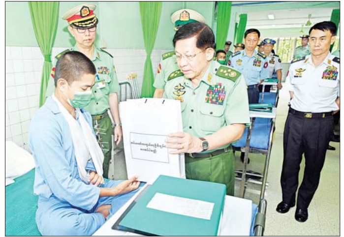
နိုင်ငံတော်စီမံအုပ်ချုပ်ရေးကောင်စီဥက္ကဋ္ဌ တပ်မတော်ကာကွယ်ရေးဦးစီးချုပ် ဗိုလ်ချုပ်မှူးကြီး မင်းအောင်လှိုင် နိုင်ငံတော်ကာကွယ်ရေးနှင့် လုံခြုံရေးတာဝန်များ ထမ်းဆောင်စဉ် ထိခိုက်ဒဏ်ရာ ရရှိခဲ့သူများအား တစ်ဦးချင်းလိုက်လံတွေ့ဆုံ၍ ရင်းနှီးနှေးနှေးစွာ မေးမြန်းပြီး လက်ဆောင်ပစ္စည်းများ ပေးအပ်စဉ်။