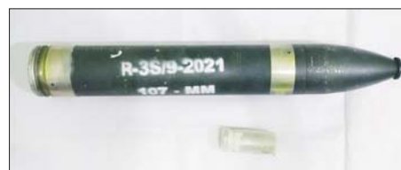
၂၀၂၄ ခုနှစ် ဇွန်လ ၉ ရက်တွင် သိမ်းဆည်းရမိသည့် သန်လျင်တံတား အမှတ်(၃)ဖွင့်ပွဲအား ပစ်ခတ်မည့် ၁၀၇ မမ ရှော့တိုက်ခွဲနှင့် ဆက်စပ် ပစ္စည်းများ။