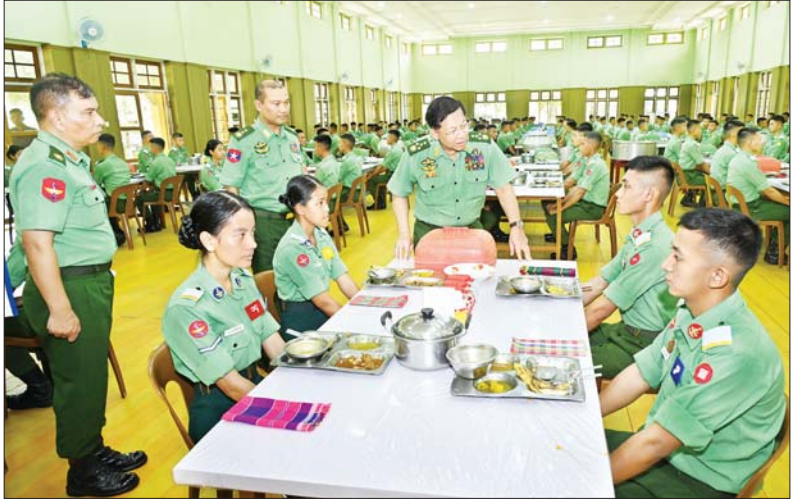
နိုင်ငံတော်စီမံအုပ်ချုပ်ရေးကောင်စီဥက္ကဋ္ဌ တပ်မတော်ကာကွယ်ရေးဦးစီးချုပ် ဗိုလ်ချုပ်မှူးကြီး မင်းအောင်လှိုင် တပ်မတော် ဆေးတက္ကသိုလ်မှ ဗိုလ်လောင်းများအား ရင်းရင်းနှီးနှီး နှုတ်ဆက်အားပေးစကား ပြောကြားစဉ်။