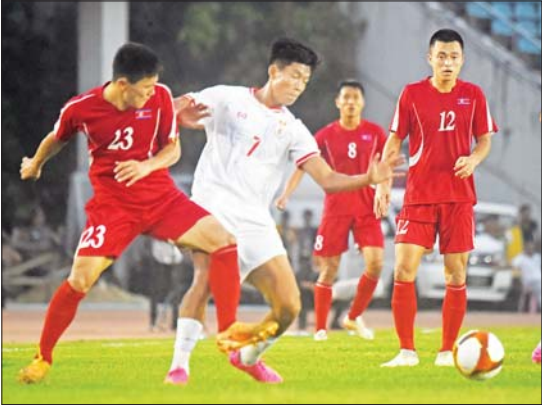
မြန်မာအသင်းနှင့် မြောက်ကိုရီးယားအသင်း ပထမအကျော့ တွေ့ဆုံခဲ့စဉ်။