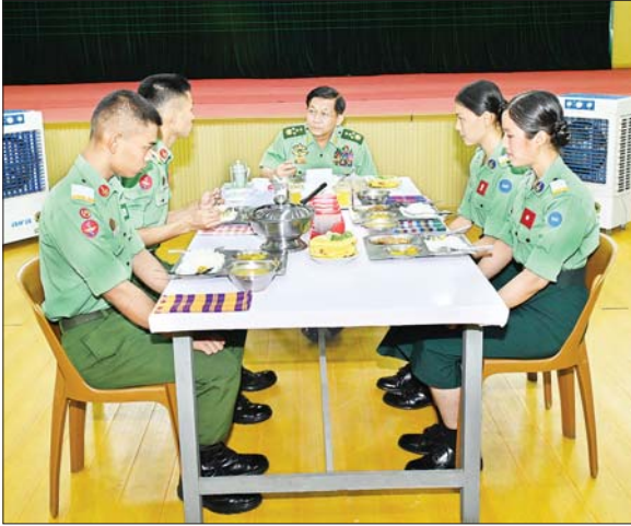
နိုင်ငံတော်စီမံအုပ်ချုပ်ရေးကောင်စီဥက္ကဋ္ဌ တပ်မတော်ကာကွယ်ရေးဦးစီးချုပ် ဗိုလ်ချုပ်မှူးကြီး မင်းအောင်လှိုင် တပ်မတော်ဆေးတက္ကသိုလ်မှ ဗိုလ်လောင်းများနှင့်အတူ နေ့လယ်စာကို အတူတကွ သုံးဆောင်စဉ်။