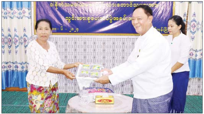
ပြန်လည်ပြောကြားသည်။ ထို့နောက် ပြည်ထောင်စုဝန်ကြီးသည် အသင်းသား တောင်သူများ၏ ဝါစိုက်ပျိုးထားမှုနှင့် ဆီထွက်သီးနှံများ စိုက်ပျိုးထားမှုကိုလည်းကောင်း၊ ဇေယျာသီရိမြို့နယ် ဖြတ်ခွဲကျေးရွာရှိ ကျောက်စိမ်းလယ်ယာနှင့် အထွေထွေစီးပွားရေးသမဝါယမအသင်း၌ ဆီထွက်ရုံ တိုးချဲ့တည်ဆောက်နေမှုကိုလည်းကောင်း၊ ကြည့်ရှုစစ်ဆေးကာ လိုအပ်သည်များ ပေါင်းစပ်ပြည့်ဆည်း ဆောင်ရွက်ပေးခဲ့ကြောင်း သတင်းစဉ် သတင်းစဉ်

လျက်ရှိကြောင်း၊ အထွတ်တိုးမျိုး ပြောင်းလဲစိုက်ပျိုးရေးနှင့် စိုက်ပျိုးရေးဦးစီးဌာန၏ စိုက်နည်းစနစ်၊ ပိုးသတ်ဆေး၊ ပေါင်းသတ်ဆေးအသုံးပြုရန် ညွှန်ကြားမှုများအတိုင်း တိတိကျကျ လိုက်နာဆောင်ရွက်ပြီး ပန်းတိုင်အထွက်နှုန်းရရှိရေးနှင့် အဆင်မီဝါများရရှိအောင် ကြိုးပမ်းဆောင်ရွက်ကြရန်၊ လိုအပ်သည့် နေရာများတွင် ဝါကြိတ်စက်၊ ဝါစေ့ဆိတ်စက်များ ထူထောင်လိုပါက ရင်းနှီးမတည်ပေးနိုင်ရေး ချိတ်ဆက်ဆောင်ရွက်ပေးမည်ဖြစ်ကြောင်း၊ ဝါသီးနှံသမဂ္ဂစပါး၊ မြေပဲ၊ နှမ်း၊ နေကြာ စသည့်ဆီထွက်သီးနှံများ စိုက်ပျိုးမည်ဆိုပါကလည်း လိုအပ်သည့်မျိုးနှင့် သွင်းအားစုများ ပံ့ပိုးပေးသွားမည်ဖြစ်ကြောင်း ပြောကြားသည်။ ဆက်လက်၍ ပြည်ထောင်စုဝန်ကြီးက တံခွန်တိုင်စိုက်ပျိုးရေးနှင့် အထွေထွေစီးပွားရေးသမဝါယမအသင်းမှ အသင်းသားတောင်သူများထံ RAKA-666 ဝါမျိုး၊ ဓာတ်မြေဩဇာများနှင့် သဘာဝမြေဩဇာများ ထောက်ပံ့ပေးအပ်ပြီး (အပေါ်ယာပုံ) အသင်းသား တောင်သူတစ်ဦးက ကျေးဇူးတင်စကား