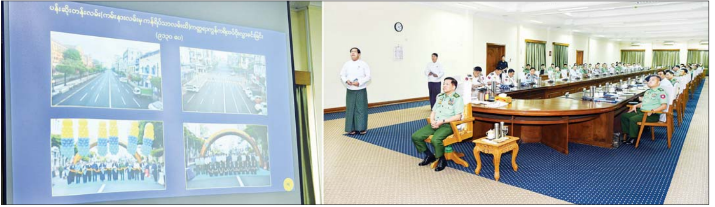
နိုင်ငံတော်စီမံအုပ်ချုပ်ရေးကောင်စီဥက္ကဋ္ဌ နိုင်ငံတော်ဝန်ကြီးချုပ် ဗိုလ်ချုပ်မှူးကြီး မင်းအောင်လှိုင်အား ရန်ကုန်တိုင်းဒေသကြီးဝန်ကြီးချုပ် ဦးစိုးသိန်းက ရှင်းလင်းတင်ပြစဉ်။

စာမျက်နှာ ၈ မှ စိုက်ပျိုးမွေးမြူရေးလုပ်ငန်းများ ဆောင်ရွက်ရန် ခွင့်ပြုပေးထားသည့် မြေများကို စနစ်တကျ အသုံးပြုရန်လိုကြောင်း၊ ရန်ကုန်မြို့တော်အတွင်း သန့်ရှင်းသယာလှပရေး၊ ရေစီးရေလာကောင်းမွန်စေရေး အတွက် သက်ဆိုင်ရာမြို့နယ်များအလိုက် ကြပ်မတ်ဆောင်ရွက်သွားရန် လိုကြောင်း၊ မြို့နယ်အလိုက်၊ ခရိုင်အလိုက် ခြံဝင်းရှိ သည့် အိမ်များအားလုံးတွင် သစ်ပင်များ စိုက်ပျိုးစေရေးနှင့် အန္တရာယ်ရှိသည့် သစ်ပင်သစ်ကိုင်းများကိုလည်း စည်ပင်သာယာဦးစီးဌာနမှ စနစ်တကျ ခုတ်ထွင်ပေးခြင်းများကို ဆောင်ရွက်ပေးရန်လိုကြောင်း၊ သစ်ပင်မရှိသည့် နေရာများတွင် သစ်ပင်များစိုက်ပျိုးစေရေး သစ်ပင်များ စီမံလန်းစိုပြည်နေစေရေးအတွက် ပြည်သူ့လူထုမှသိရှိရန်နှင့် ပြည်သူလူထုမှ ပူးပေါင်းဆောင်ရွက်ရန် လိုကြောင်း၊ ရန်ကုန်တိုင်းဒေသကြီးအတွင်း တည်ငြိမ်အေးချမ်းရေးအတွက် ဝန်းဆောင်ရွက်ကြရန်လိုကြောင်း မှာကြားပြီး အစည်းအဝေးကို ရပ်သိမ်းလိုက်ကြောင်း သတင်းရရှိသည်။