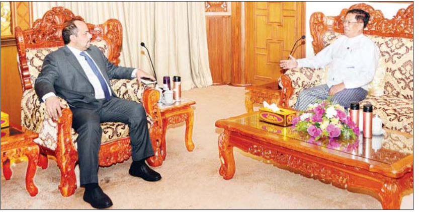
အလားတူ သီရိလင်္ကာ ဒီမိုကရက်တစ် ဆိုရှယ်လစ်သမ္မတနိုင်ငံ သံအမတ်ကြီးနှင့် တွေ့ဆုံစဉ် ပြည်ထောင်စုသမ္မတမြန်မာနိုင်ငံတော်အိုင်ရာ သီရိလင်္ကာသံအမတ်ကြီးအဖြစ် ခန့်အပ်တာဝန်ပေးခြင်းခံရသည့် အတွက် ဂုဏ်ယူဝမ်းမြောက်ကြောင်း ပြောကြားခဲ့ပြီး မြန်မာ-သီရိလင်္ကာနှစ်နိုင်ငံ အကြား ရှိရင်းစွဲချစ်ကြည်ရင်းနှီးသော ဆက်ဆံရေးနှင့် အကျိုးတူပူးပေါင်း ဆောင်ရွက်မှုများ ပိုမိုမြှင့်တင်ရေး၊ မြန်မာနိုင်ငံရောက် သီရိလင်္ကာနိုင်ငံသားများ အတွက် ကောင်စီစီမံအုပ်ချုပ်ရေးအဖွဲ့အစည်း နိုင်ငံရေး ကိစ္စရပ်များအပေါ် ရင်းနှီးပွင့်လင်းစွာ အမြင်ချင်းဖလှယ်ဆွေးနွေးကြသည်။

သီးခြားစီ လက်ခံတွေ့ဆုံသည်။ ပြည်ထောင်စုဝန်ကြီးသည် အာရပ်စော်ဘွားများ ပြည်ထောင်စုနိုင်ငံ (ယူအေအီး) သံအမတ်ကြီးနှင့် တွေ့ဆုံစဉ် သံအမတ်ကြီးအား ပထမဦးဆုံး ပြည်ထောင်စုသမ္မတ မြန်မာနိုင်ငံတော်အိုင်ရာ ဆိုင်ရာ အထူးအာဏာကုန်လွှဲအပ်ခြင်းခံရသော ယူအေအီးနိုင်ငံ သံအမတ်ကြီးအဖြစ် ခန့်အပ်တာဝန်ပေးခြင်းခံရသည့် အတွက် ဂုဏ်ယူဝမ်းမြောက်ကြောင်း ပြောကြားခဲ့ပြီး မြန်မာ-ယူအေအီး နှစ်နိုင်ငံ အကြား ရှိရင်းစွဲချစ်ကြည်ရင်းနှီးမှု ပိုမို ခိုင်မာစေရေး၊ ကုန်သွယ်ရေးနှင့် ရင်းနှီးမြှုပ်နှံမှုကဏ္ဍများအပါအဝင် နှစ်နိုင်ငံ အကျိုးတူ ပူးပေါင်းဆောင်ရွက်မှုများ မြှင့်တင်ရေးနှင့် ဒေသတွင်းနှင့် နိုင်ငံတကာ မျက်နှာစာတွင် ပူးပေါင်းဆောင်ရွက်ရေး ကိစ္စရပ်များနှင့်စပ်လျဉ်း၍ ခင်မင်ရင်းနှီးစွာ အမြင်ချင်းဖလှယ် ဆွေးနွေးကြသည်။ (အပေါ်ယာပုံ)