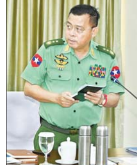
ကောင်စီတွဲဖက် အတွင်းရေးမှူး ဒုတိယဗိုလ်ချုပ်ကြီး ရဲဝင်းဦး ရှင်းလင်းတင်ပြစဉ်။

ထိန်းသိမ်းဆောင်ရွက်ရန် လိုအပ်မှု၊ မူးယစ်ဆေးဝါး တားဆီးနှိမ်နင်းရေး လုပ်ငန်းများကို စနစ်တကျဆောင်ရွက်ရန် လိုအပ်မှု၊ တည်ငြိမ်အေးချမ်းမှု ပျက်ပြားအောင် လှုံ့ဆော်သူများ မရှိစေရေး ထိန်းသိမ်းဆောင်ရွက်ရန် လိုအပ်မှုများနှင့် ပတ်သက်၍ ရှင်းလင်းတင်ပြသည်။