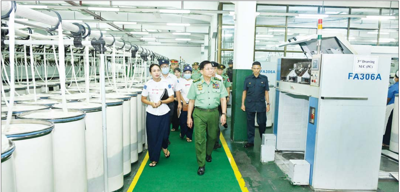
နိုင်ငံတော်စီမံအုပ်ချုပ်ရေးကောင်စီဥက္ကဋ္ဌ တပ်မတော်ကာကွယ်ရေးဦးစီးချုပ် ဗိုလ်ချုပ်မှူးကြီး မင်းအောင်လှိုင်နှင့် အဖွဲ့ဝင်များ တပ်မတော်ချည်မျှင်နှင့်အထည်စက်ရုံ(သမိုင်း)အတွင်း ချည်မျှင်နှင့်အထည်များ အဆင့်ဆင့်ထုတ်လုပ်နေမှုအခြေအနေများကို လှည့်လည်ကြည့်ရှုစစ်ဆေးစဉ်။

နိုင်ငံတော်စီမံအုပ်ချုပ်ရေးကောင်စီဥက္ကဋ္ဌ တပ်မတော်ကာကွယ်ရေးဦးစီးချုပ် ဗိုလ်ချုပ်မှူးကြီး မင်းအောင်လှိုင် တပ်မတော်ချည်မျှင်နှင့် အထည်စက်ရုံ(သမိုင်း)သို့ သွားရောက်ကြည့်ရှုစစ်ဆေး မိမိတို့နိုင်ငံအနေဖြင့် ပြည်ပမှ ချည်မျှင်နှင့် အထည်အလိပ်များကို တင်သွင်းရလျက်ရှိပြီး ပြည်ပသွင်းကုန်များ လျော့ချနိုင်ရန်အတွက် ပြည်တွင်းရှိ ချည်မျှင်နှင့်အထည်စက်ရုံများမှ လုံလောက်စွာ ထုတ်လုပ်နိုင်ရန်လို