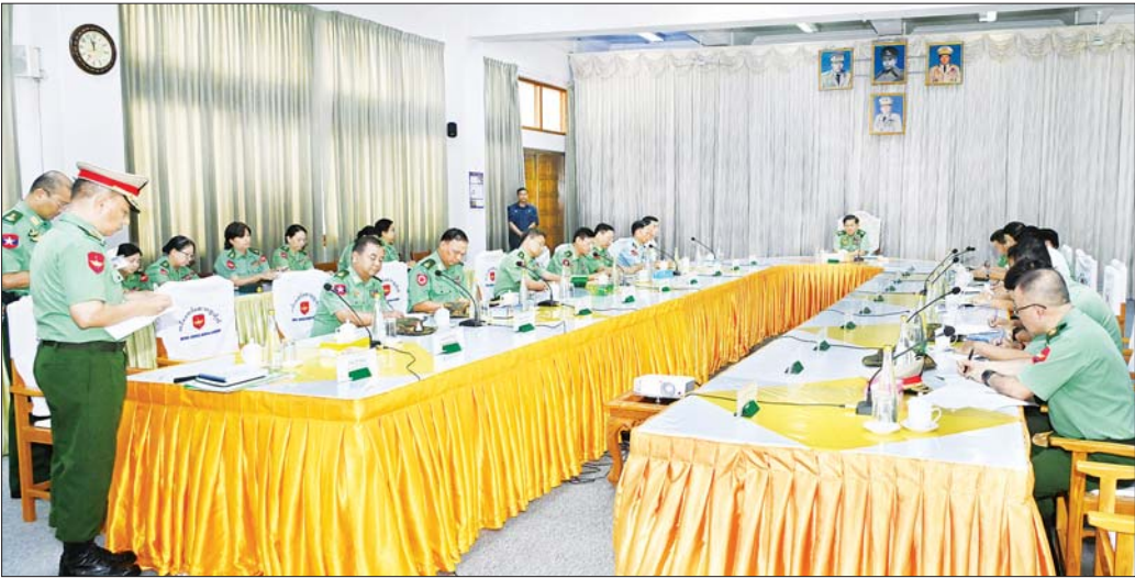
နိုင်ငံတော်စီမံအုပ်ချုပ်ရေးကောင်စီဥက္ကဋ္ဌ တပ်မတော်ကာကွယ်ရေးဦးစီးချုပ် ဗိုလ်ချုပ်မှူးကြီး မင်းအောင်လှိုင်နှင့်အဖွဲ့ဝင်များအား တာဝန်ရှိသူတစ်ဦးက လေ့ကျင့်ရေးပိုင်းဆိုင်ရာ ဆောင်ရွက်နေမှုအခြေအနေများကို ရင်းလင်းတင်ပြစဉ်။

ဆေးဘက်ဆိုင်ရာအရာရှိများအနေဖြင့် အခြေခံ အားဖြင့် ကျန်းမာရေးစောင့်ရှောက်မှုများ ဆောင်ရွက် ပေးနိုင်သူများဖြစ်ပြီး မိမိတို့ သင်ယူတတ်မြောက်ထား သည့် ဆေးပညာရပ်ဆိုင်ရာ ဘာသာရပ်အလိုက် ထူးချွန်ထက်မြက်သူများဖြစ်လာစေရေး ဆက်လက် ကြိုးပမ်းဆောင်ရွက်သွားရမည်ဖြစ်ကြောင်း။