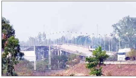
မြန်မာ-ထိုင်း ချစ်ကြည်ရေးတံတားအမှတ်(၂) နှင့် ကုန်တင်ယာဉ်များ သွားလာမှုကိုတွေ့ရစဉ်။