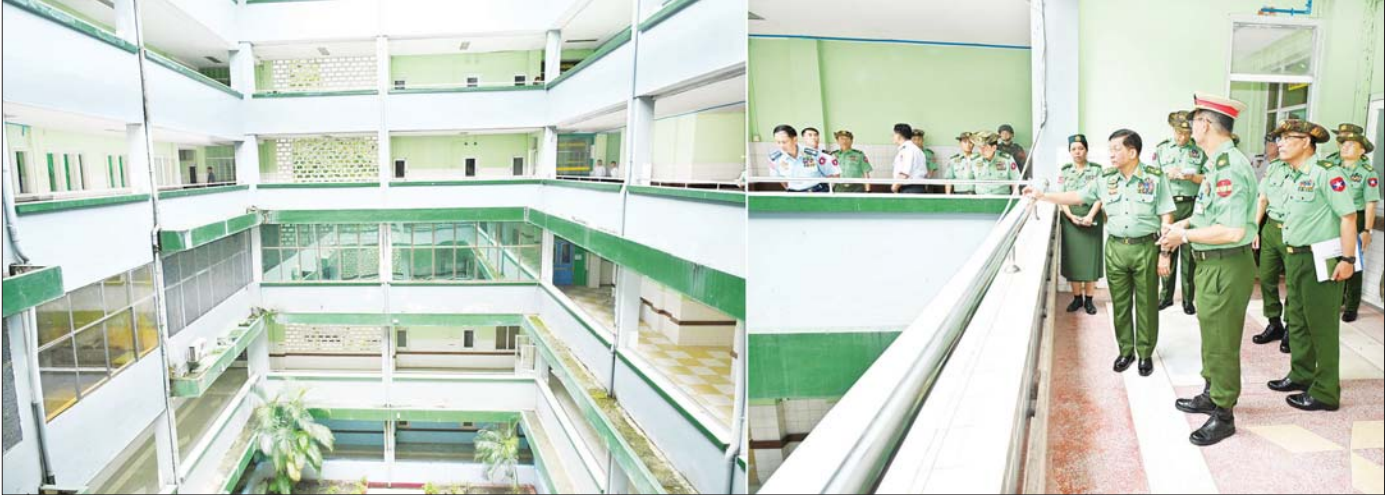
နိုင်ငံတော်စီမံအုပ်ချုပ်ရေးကောင်စီဥက္ကဋ္ဌ တပ်မတော်ကာကွယ်ရေးဦးစီးချုပ် ဗိုလ်ချုပ်မှူးကြီး မင်းအောင်လှိုင်နှင့်အဖွဲ့ဝင်များ တပ်မတော်အရိုးရောဂါ အထူးကုဆေးရုံကြီးအတွင်း လှည့်လည်ကြည့်ရှုစဉ်။