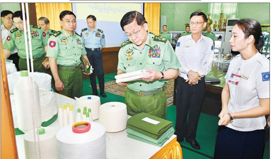
နိုင်ငံတော်စီမံအုပ်ချုပ်ရေးကောင်စီဥက္ကဋ္ဌ တပ်မတော်ကာကွယ်ရေးဦးစီးချုပ် ဗိုလ်ချုပ်မှူးကြီး မင်းအောင်လှိုင် ခင်းကျင်းပြသထားသည့် စက်ရုံထုတ်ပစ္စည်းများကို ကြည့်ရှုစဉ်။

မှာကြားချက်များအပေါ် အကောင်အထည်ဖော် ဆောင်ရွက်လျက်ရှိသည့်အခြေအနေများ၊ စက်ရုံသမိုင်းအကျဉ်းနှင့် လုပ်ငန်းလည်ပတ်ဆောင်ရွက်နေမှုအခြေအနေများ၊ ဝန်ထမ်းများ ခန့်အပ်ထားရှိမှုနှင့် ဝန်ထမ်းများ၏ သက်သာချောင်ချိရေးအတွက်ဆောင်ရွက်ပေးလျက်ရှိသည့် အခြေအနေများနှင့်ပတ်သက်၍ လည်းကောင်းရှင်းလင်းတင်ပြကြသည်။ စံနမူနာပြုဖြစ်အောင်ဆောင်ရွက်ရှင်းလင်းတင်ပြမှုများအပေါ် နိုင်ငံတော် စီမံအုပ်ချုပ်ရေးကောင်စီဥက္ကဋ္ဌ တပ်မတော်ကာကွယ်ရေးဦးစီးချုပ်က ဝါစိုက်ပျိုးရေးလုပ်ငန်းများ အောင်မြင်ဖြစ်ထွန်းပြီး အထွက်နှုန်းကောင်းမွန်စေရေးအတွက် မြေအရည်အသွေး စစ်ဆေးခြင်း သုတေသနလုပ်ငန်းများကို ဦးစွာဆောင်ရွက်ပြီး မြေဆီလွှာအမျိုးအစားအလိုက် စနစ်တကျပြုပြင်ဆောင်ရွက်သွားရန် လိုကြောင်း၊ လိုအပ်သည့် သွင်းအားစုများအပြည့်အဝ ထည့်သွင်းရန်နှင့် စိုက်ပျိုးရေးရရှိအောင် ဆောင်ရွက်ပေးရန်လည်းလိုကြောင်း၊ စိုက်ပျိုးသည့် မြေအမျိုးအစားအလိုက်