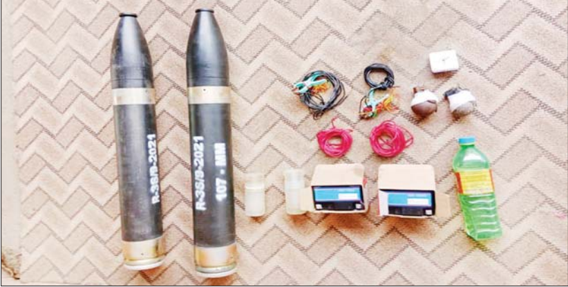
၂၀၂၄ ခုနှစ် ဇွန်လ ၈ ရက်တွင် သိမ်းဆည်းရမိသည့် သန်လျင်တံတားအမှတ်(၃)ပွင့်ပွဲအား ပစ်ခတ်မည့် ၁၀၇ မမ ရှော့တိုက်ခွဲနှင့် ဆက်စပ်ပစ္စည်းများ။

နေပြည်တော် ဇွန် ၁၀ အကြမ်းဖက်အုပ်စုအဖြစ် ကြေညာထားသော CRPH ၊ NUG နှင့် ယင်းတို့၏ လက်အောက်ခံ PDF အမည်ခံ အကြမ်းဖက်အဖွဲ့များ၊ ယင်းတို့နှင့် ဆက်သွယ်နေသော အဖွဲ့အစည်းများနှင့် လူပုဂ္ဂိုလ်များသည် နိုင်ငံတော်တည်ငြိမ်အေးချမ်းရေးကို ပျက်ပြားစေရန်နှင့် ပြည်သူ့လူထုပစ်မှတ်ထား၍ လုပ်ကြံသတ်ဖြတ်ခြင်း၊ အများပြည်သူပိုင် အဆောက်အအုံများ၊ စာမျက်နှာ ၁၅ ကော်လံ ၁ ခု