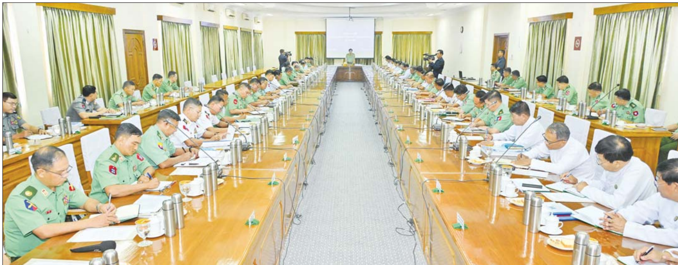
နိုင်ငံတော်စီမံအုပ်ချုပ်ရေးကောင်စီဥက္ကဋ္ဌ နိုင်ငံတော်ဝန်ကြီးချုပ် ဗိုလ်ချုပ်မှူးကြီး မင်းအောင်လှိုင် ရန်ကုန်တိုင်းဒေသကြီး တည်ငြိမ်အေးချမ်းရေးနှင့် ဖွံ့ဖြိုးတိုးတက်ရေးအစည်းအဝေးတွင် အမှာစကားပြောကြားစဉ်။