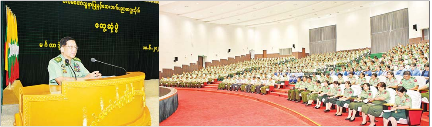
နိုင်ငံတော်စီမံအုပ်ချုပ်ရေးကောင်စီဥက္ကဋ္ဌ တပ်မတော်ကာကွယ်ရေးဦးစီးချုပ် ဗိုလ်ချုပ်မှူးကြီး မင်းအောင်လှိုင် တပ်မတော်သေနာပြုနှင့်ဆေးဘက်ပညာတက္ကသိုလ်မှ ကျောင်းအုပ်ကြီး၊ နည်းပြအရာရှိကြီးများ၊ ကထိကအရာရှိကြီးများ၊ ဆရာ၊ ဆရာမကြီးများ၊ သန္ဓေအရာရှိများနှင့် မဟာဘွဲ့လွန်သင်တန်းသားများ၊ ဗိုလ်လောင်းများ၊ သင်တန်းသား၊ သင်တန်းသူများအား တွေ့ဆုံအမှာစကားပြောကြားစဉ်။