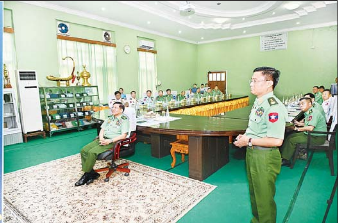
နိုင်ငံတော်စီမံအုပ်ချုပ်ရေးကောင်စီဥက္ကဋ္ဌ တပ်မတော်ကာကွယ်ရေးဦးစီးချုပ် ဗိုလ်ချုပ်မှူးကြီး မင်းအောင်လှိုင်အား တပ်မတော်ချုပ်ချုပ်နှင့်အထည့်စက်ရုံ(သမိုင်း) စက်ရုံအစည်းအဝေးခန်းမ၌ စစ်ထောက်ချုပ် ဒုတိယဗိုလ်ချုပ်ကြီး ကျော်စွာလင်းက ရှင်းလင်းတင်ပြစဉ်။