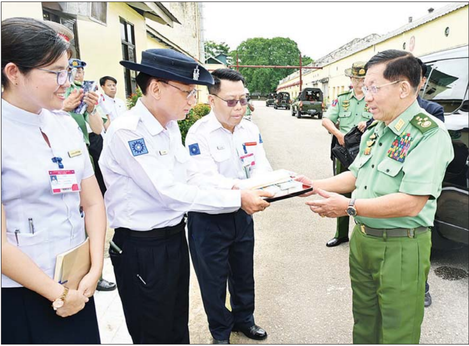
နိုင်ငံတော်စီမံအုပ်ချုပ်ရေးကောင်စီဥက္ကဋ္ဌ တပ်မတော်ကာကွယ်ရေးဦးစီးချုပ် ဗိုလ်ချုပ်မှူးကြီး မင်းအောင်လှိုင် တပ်မတော်ချည်မျှင်နှင့် အထည်စက်ရုံ(သမိုင်း) ဝန်ထမ်းများအတွက် ချီးမြှင့်ငွေများ ပေးအပ်စဉ်။

ပြည့်ဆည်းဆောင်ရွက်ပေးအဆိုပါ တပ်မတော်ချည်မျှင်နှင့် အထည်စက်ရုံ(သမိုင်း)မှ ချည်မျှင်ညှိ၊ တက်ထရက် ပိတ်ညှိ၊ စွပ်ကျယ်ပိတ်ညှိ၊ ပေါပိတ်ညှိ၊ သက်နိုးများ၊ တက်ထရက် ပိတ်ရောင်စုံ၊ စွပ်ကျယ်ပိတ်ရောင်စုံ၊ ပေါရောင်စုံ၊ တီရှပ်မျိုးစုံ၊ စပိုရှပ်မျိုးစုံ၊ နိုင်လွန် တာဖတ်တာများ၊ ဆေးပွမ်းလိပ်များ၊ အိပ်ရာခင်းရောင်စုံတို့အပြင် အဝတ်အထည်နှင့် အသုံးအဆောင်ပစ္စည်းအမျိုးမျိုးတို့ကို အရည်အသွေးပြည့်မီစွာထုတ်လုပ်၍ တပ်မတော်၏ လိုအပ်ချက်နှင့် ပြည်တွင်းဈေးကွက် လိုအပ်ချက်အား ဈေးနှုန်းသက်သာစွာဖြင့် တစ်ဖက်တစ်လမ်းမှ ပြည့်ဆည်းဆောင်ရွက်ပေးလျက်ရှိကြောင်း သတင်းရရှိသည်။ သတင်းစဉ်