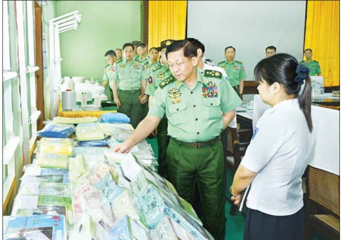
နိုင်ငံတော်စီမံအုပ်ချုပ်ရေးကောင်စီဥက္ကဋ္ဌ တပ်မတော်ကာကွယ်ရေးဦးစီးချုပ် ဗိုလ်ချုပ်မှူးကြီး မင်းအောင်လှိုင် ခင်းကျင်းပြသထားသည့် စက်ရုံထုတ်ပစ္စည်းများကို ကြည့်ရှုစဉ်။

များအား ပြည်တွင်း၌လုံလောက်စွာ ထုတ်လုပ်၍ ဈေးနှုန်းသက်သာစွာဖြင့် ရောင်းချပေးနိုင်ရေး ဆောင်ရွက်ပေးရန်လိုကြောင်း၊ အဝတ်အထည် များအား အရောင်အသွေး စုံလင်စွာဖြင့် ဈေးကွက်အတွင်း လူကြိုက်များသည့် ပုံစံအမျိုးအစားအလိုက် ထုတ်လုပ်ရောင်းချသွားရန် လိုကြောင်း၊ အခြားဈေးကွက် လိုအပ်ချက်ရှိသည့် ဟိုတ်သံသုံးပစ္စည်းများနှင့် ပုဂ္ဂလိကသုံးပစ္စည်းများကိုလည်း အရည်အသွေးပြည့်စုံစွာ ထုတ်လုပ်၍ ဈေးကွက်ရရှိရေး စာမျက်နှာ ၄ သို့