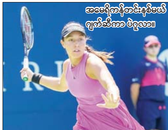
အမေရိကန်တင်းနစ်မယ် ဂျက်ဆီကာ ပဲဂျလာ။

ကနေဒါအိုးပင်းအမျိုးသမီးတစ်ဦးချင်းပြိုင်ပွဲ ဆီမီးဖိုင်နယ်သို့ နာမည်ကြီး အမေရိကန်တင်းနစ်မယ် ပဲဂျလာတက်လှမ်း နာမည်ကြီး အမေရိကန်တင်းနစ်မယ် ယင်းပြိုင်ပွဲတွင် ပဲဂျလာသည် ဂျက်ဆီကာ ပဲဂျလာသည် ကနေဒါအိုးပင်း စတန်းစ်ကို ၆-၄၊ ၇-၅ ရလဒ်ဖြင့် အမျိုးသမီးတစ်ဦးချင်းပြိုင်ပွဲကွာတားဖိုင်နယ် နိုင်ပွဲရရှိကာ နောက်တစ်ဆင့်သို့ တက်လှမ်းအဆင့်တွင် အခြားအမေရိကန်တင်းနစ်မယ် နိုင်ခဲ့ခြင်းဖြစ်သည်။ ၎င်းသည် ကနေဒါပေတန် စတန်းစ်ကို နိုင်ပွဲရရှိကာ ဆီမီးအိုးပင်း အမျိုးသမီးတစ်ဦးချင်းပြိုင်ပွဲ ဖိုင်နယ်သို့ တက်လှမ်းနိုင်ခဲ့ပြီဖြစ်သည်။ စာမျက်နှာ ၈ ကော်လံ ၄ ❖