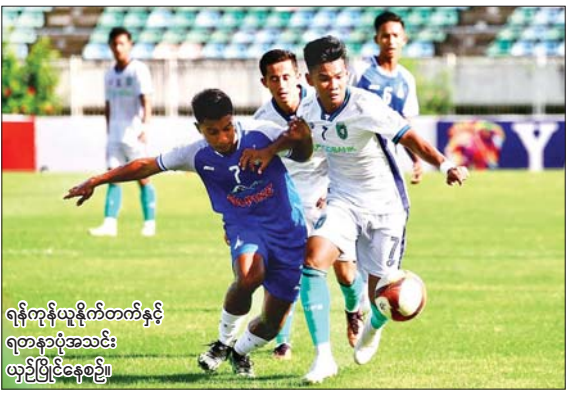
ရန်ကုန်ယူနိုက်တက်နှင့် ရတနာပုံအသင်း ယှဉ်ပြိုင်နေစဉ်။

ရတနာပုံကို နောက်မှလိုက်ကစားပြီး ရန်ကုန်ယူနိုက်တက်အသင်း ဂိုးပြတ်အနိုင်ရရှိ ရန်ကုန် ဩဂုတ် ၁၁ ၂၀၂၄-၂၀၂၅ ရာသီ MNL အမှတ်ပေးပြိုင်ပွဲ ပွဲစဉ် (၆) တတိယနေ့ကို ဩဂုတ် ၁၁ ရက်က ရန်ကုန်မြို့ရှိ သုဝဏ္ဏကွင်း၌ ကျင်းပရာ ရန်ကုန်ယူနိုက်တက်အသင်းက ရတနာပုံအသင်းကို ငါးဂိုး-နှစ်ဂိုးဖြင့် အနိုင်ရခဲ့သည်။ MNL စတင်ကတည်းက ပြိုင်ဘက်များဖြစ်ခဲ့သည့် ရန်ကုန်ယူနိုက်တက်နှင့် ရတနာပုံအသင်းတို့၏ တွေ့ဆုံမှုမှာ ထိပ်တိုက်တွေ့ဆုံသည့်ပွဲတိုင်း ပြိုင်ဆိုင်မှု စာမျက်နှာ ၈ ကော်လံ ၄ ❖