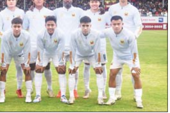
အာဆီယံကလပ်ပြိုင်ပွဲ ယှဉ်ပြိုင်ရမည့် ရှမ်းယူနိုက်တက်အသင်း။

(ထိုင်း)၊ ကွာလာလမ်ပူစီးတီး (မလေးရှား)၊ ဟန့်ဇင်း (ဗီယက်နမ်)၊ ဘော်နီယို (အင်ဒိုနီးရှား)၊ ကာယာ (ဗီယက်ပိုင်)၊ Lion City Sailors (စင်ကာပူ)တို့ ပါဝင်နေသည်။ ပြိုင်ပွဲ ကျင်းပမည့်ပုံစံအရ ရှမ်းယူနိုက် တက်အသင်းသည် အုပ်စု(ခ) အနက် နှစ်ပွဲကို အိမ်ကွင်း၊ သုံးပွဲကို အဝေးကွင်း ကစားရမည်ဖြစ် သည်။ ရှမ်းယူနိုက်တက်အသင်း သည် အုပ်စုပွဲများအဖြစ် ဩဂုတ် ၂၁ ရက်တွင် ဗီယက်နမ်ကလပ် ထန်ဟွာအသင်းနှင့် အဝေးကွင်း၊