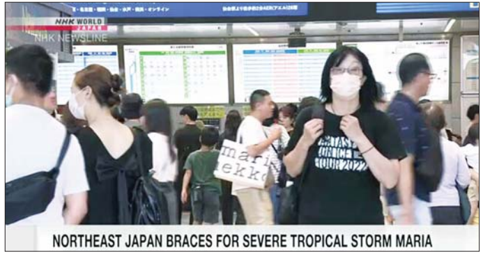
NORTHEAST JAPAN BRACES FOR SEVERE TROPICAL STORM MARIA