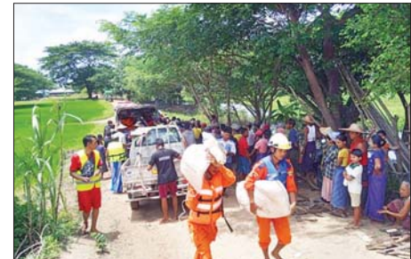
မီးသတ်တပ်ဖွဲ့ဝင်များ၊ ဒေသလုံခြုံမှုညီရေးအသင်းများ၊ ကျေးရွာ အုပ်ချုပ်ရေးမှူးနှင့် အဖွဲ့ဝင်များက ကူညီဆောင်ရွက်ပေးခဲ့ကြောင်း သိရသည်။ ကိုမင်း(ပြန်/ဆက်)

မိုးညို ဩဂုတ် ၁၁ ပဲခူးတိုင်းဒေသကြီး မိုးညိုမြို့နယ်အတွင်းရှိ ရေကြီးနစ်မြုပ်ခဲ့သည့် ကျေးရွာများရှိ ရေဘေးသင့်ပြည်သူများစားသောက်ရေးအဆင်ပြေစေ ရန်အတွက် ဒေါပုံမြို့နယ် အဖြူရောင်မေတ္တာပရဟိတ အသင်းသား အသင်းသူများက နေအိမ်များသို့ သွားရောက်၍ ယမန်နေ့က ထောက်ပံ့ လှူဒါန်းခဲ့ကြောင်း သိရသည်။ အဆိုပါ ထောက်ပံ့လှူဒါန်းရာတွင် ဒေါပုံမြို့နယ် အဖြူရောင်မေတ္တာ ပရဟိတအသင်းမှ မိုးညိုမြို့နယ် ထန်းပင်ကုန်းကျေးရွာအုပ်စုအတွင်း ရှိ ထန်းပင်ကုန်းကျေးရွာ၊ ဥပြတန်းကျေးရွာနှင့် ပေတန်းကျေးရွာတို့ရှိ ရေဘေးသင့်အိမ်ထောင်စု ၂၅၀ အတွက် အိမ်ထောင်တစ်စုလျှင် ဆန် တစ်ပြည်၊ ဆီ ၁၀ သား၊ ကြက်သွန်နီ ၄၀ သား၊ ဆား ၂၀ သား၊ အချိုမှုန့် တစ်ထုပ်၊ ခေါက်ဆွဲခြောက် တစ်ထုပ်၊ ငါးသေတ္တာ တစ်ဘူးနှင့် ရေသန့် ၁လီတာ သုံးဘူးတို့ကို နေအိမ်များအရောက် ထောက်ပံ့လှူဒါန်းခဲ့ရာ မိုးညိုမြို့နယ်ဘေးအန္တရာယ်ဆိုင်ရာစီမံခန့်ခွဲမှုဦးစီးဌာနမှ ဝန်ထမ်းများ၊