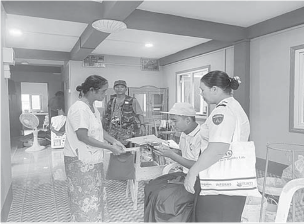
ပဲခူးတိုင်းဒေသကြီးအတွင်းရှိ မြို့နယ်များ၌ ၂၀၂၄ ခုနှစ် လူဦးရေနှင့် အိမ်အကြောင်းအရာ သန်းခေါင်စာရင်းကောက်ယူစဉ်။