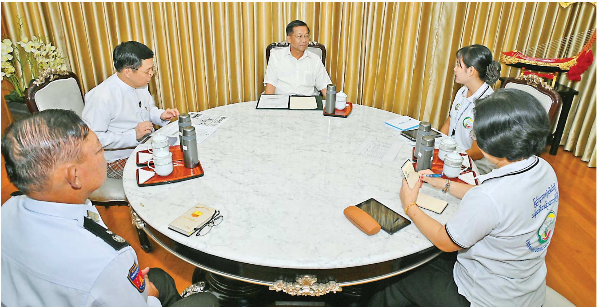
An enumeration team conducts population and housing census at the residence of Senior General Min Aung Hlaing.