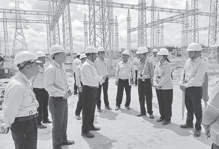
နေပြည်တော် အောက်တိုဘာ ၁ လျှပ်စစ်စွမ်းအားဝန်ကြီးဌာနပြည်ထောင်စု ဝန်ကြီး ဦးညွှန်ထွန်းသည် တာဝန်ရှိသူ များနှင့်အတူ ယမန်နေ့နံနက်ပိုင်းက