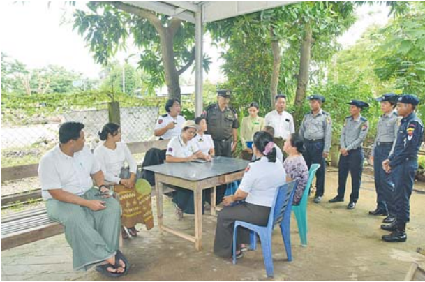
ဥတ္တရသီရိမြို့နယ်၌ ၂၀၂၄ ခုနှစ် လူဦးရေနှင့်အိမ်အကြောင်းအရာ သန်းခေါင်စာရင်းကောက်ယူစဉ်။