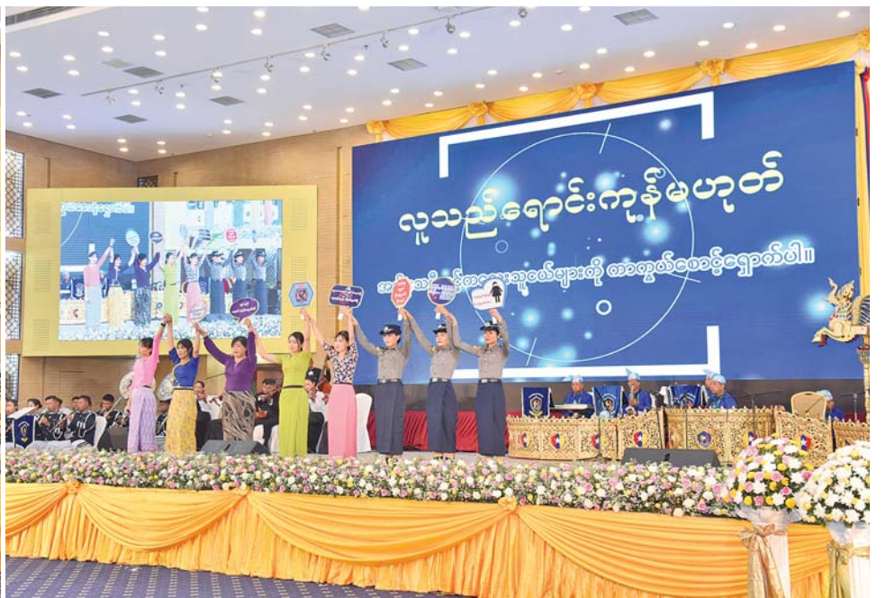
နှစ်(၆၀)ပြည့် မြန်မာနိုင်ငံရဲတပ်ဖွဲ့နေ့အထိမ်းအမှတ်ဂုဏ်ပြုညစာစားပွဲအခမ်းအနားတွင် အနုပညာရှင်များက သီဆိုကပြပျော်ဖြေစဉ်။