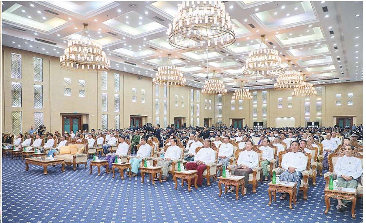
နိုင်ငံတော်စီမံအုပ်ချုပ်ရေးကောင်စီဥက္ကဋ္ဌ နိုင်ငံတော်ဝန်ကြီးချုပ် ဗိုလ်ချုပ်မှူးကြီးမင်းအောင်လှိုင် နှစ်(၆၀)ပြည့် မြန်မာနိုင်ငံရဲတပ်ဖွဲ့နေ့အခမ်းအနားတွင် မိန့်ခွန်းပြောကြားစဉ်။