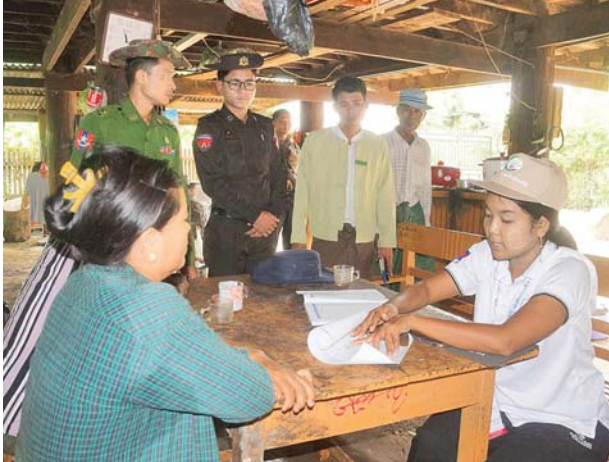
တောင်တွင်းကြီးမြို့နယ်၌ ၂၀၂၄ ခုနှစ် လူဦးရေနှင့် အိမ်အကြောင်းအရာ သန်းခေါင်စာရင်းကောက်ယူစဉ်။