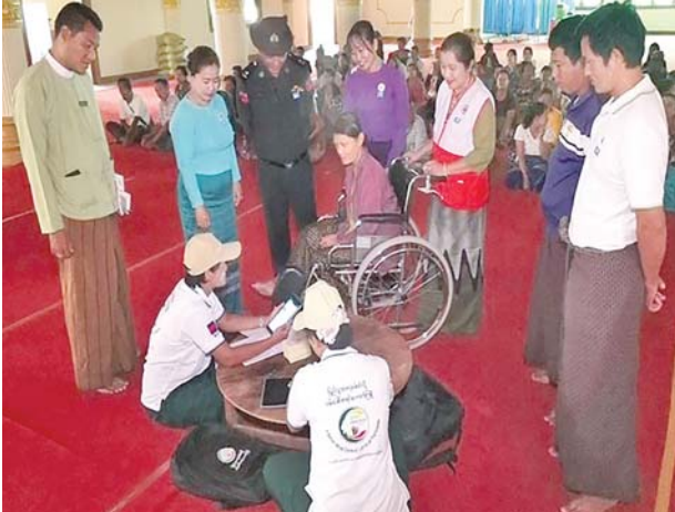
လွိုင်ကော်မြို့နယ်၌ ၂၀၂၄ ခုနှစ် လူဦးရေနှင့်အိမ်အကြောင်းအရာ သန်းခေါင်စာရင်းကောက်ယူစဉ်။