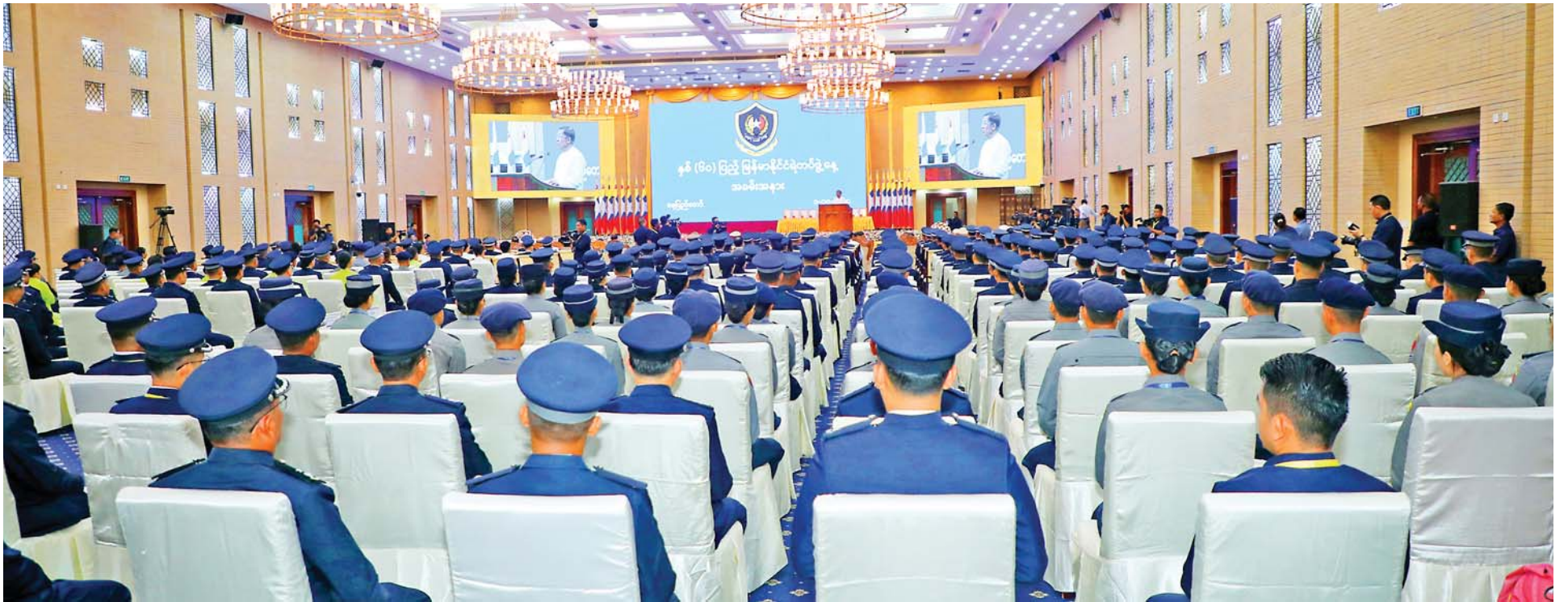
Senior General Min Aung Hlaing addresses the 60 th Anniversary of MPF.