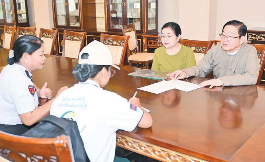
ပြည်သူ့လွှတ်တော်ဥက္ကဋ္ဌ ဦးတီခွန်မြတ်၏ မိသားစုက သန်းခေါင်စာရင်းကောက်ယူရေးအဖွဲ့၏ မေးခွန်း များကို ဖြေကြားစဉ်။