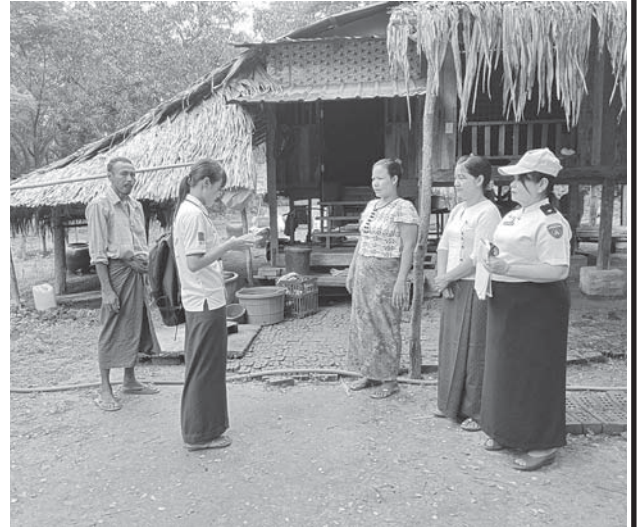
လှည်းကူးမြို့နယ်၌ ၂၀၂၄ ခုနှစ် လူဦးရေနှင့်အိမ်အကြောင်းအရာ သန်းခေါင်စာရင်းကောက်ယူစဉ်။