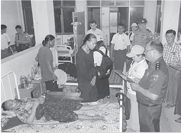
မြောင်းမြမြို့နယ်၌ ၂၀၂၄ ခုနှစ် လူဦးရေနှင့်အိမ်အကြောင်းအရာ သန်းခေါင်စာရင်းကောက်ယူစဉ်။