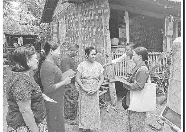
မန္တလေးတိုင်းဒေသကြီးအတွင်းရှိ မြို့နယ်များ၌ ၂၀၂၄ ခုနှစ် လူဦးရေနှင့်အိမ်အကြောင်းအရာ သန်းခေါင်စာရင်းကောက်ယူစဉ်။