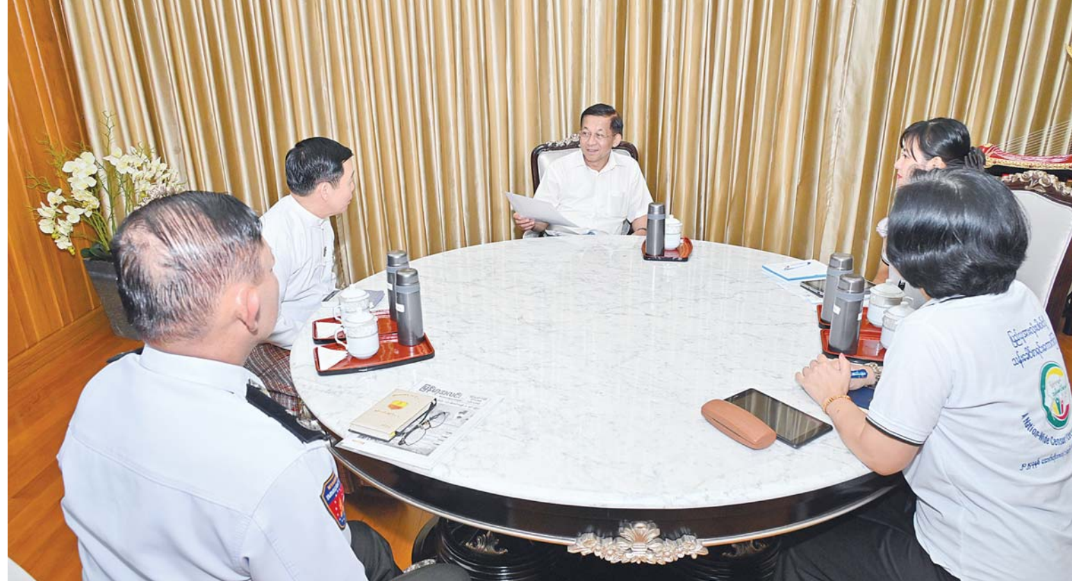
နိုင်ငံတော်စီမံအုပ်ချုပ်ရေးကောင်စီဥက္ကဋ္ဌ နိုင်ငံတော်ဝန်ကြီးချုပ် ဗိုလ်ချုပ်မှူးကြီးမင်းအောင်လှိုင် သန်းခေါင်စာရင်းကောက်ယူရေးအဖွဲ့၏ သန်းခေါင်စာရင်းမေးခွန်းများကို ပြည့်ပြည့်စုံစုံဖြေကြားစဉ်။

နေပြည်တော် အောက်တိုဘာ ၁ ယနေ့မှစတင်၍ နိုင်ငံတစ်ဝန်း၌ လူဦးရေနှင့် အိမ်အကြောင်းအရာ သန်းခေါင်စာရင်း ကောက်ယူခြင်းလုပ်ငန်းများကိုဆောင်ရွက်လျက်ရှိပြီး အောက်တိုဘာလ ၁၅ ရက်အထိ ၁၅ ရက်ကြာ ကောက်ယူဆောင်ရွက်သွားမည်ဖြစ်သည်။ ယနေ့မှစတင်၍ နိုင်ငံတော်စီမံအုပ်ချုပ်ရေးကောင်စီဥက္ကဋ္ဌ နိုင်ငံတော်ဝန်ကြီးချုပ် ဗိုလ်ချုပ်မှူးကြီးမင်းအောင်လှိုင်၏မိသားစု လူဦးရေနှင့်အိမ်အကြောင်းအရာသန်းခေါင်စာရင်းအား လူဝင်မှုကြီးကြပ်ရေးနှင့် ပြည်သူ့အင်အားဝန်ကြီးဌာန ပြည်ထောင်စုဝန်ကြီး ဦးမြင့်ကြိုင် ဦးဆောင်သည့်သန်းခေါင်စာရင်းကောက်ယူရေးအဖွဲ့က ကာကွယ်ရေးဦးစီးချုပ်ရုံး (ကြည်း)ဝင်းအတွင်းရှိ တပ်မတော်ဧည့်ရိပ်သာသို့လာရောက်၍ သန်းခေါင်စာရင်းကောက်ယူကြသည်။ သန်းခေါင်စာရင်းကောက်ယူရေးအဖွဲ့က သန်းခေါင်စာရင်းမေးခွန်းများကို မေးမြန်း စာမျက်နှာ ၅ ကော်လံ ၁*