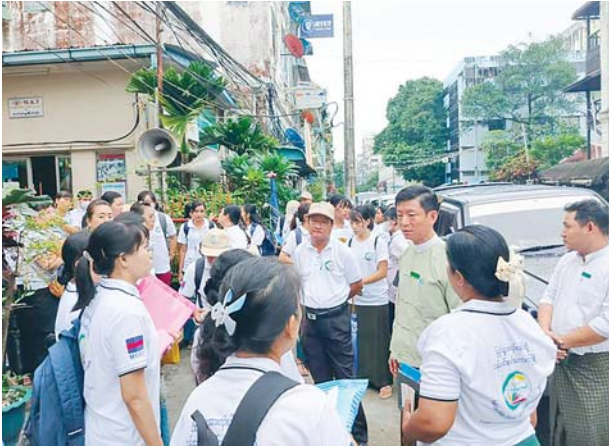
ဗိုလ်တထောင်မြို့နယ်၌ ၂၀၂၄ ခုနှစ် လူဦးရေနှင့်အိမ်အကြောင်းအရာ သန်းခေါင်စာရင်းကောက်ယူစဉ်။