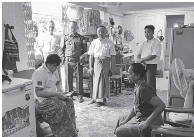
မရမ်းကုန်းမြို့နယ်၌ ၂၀၂၄ ခုနှစ် လူဦးရေနှင့်အိမ်အကြောင်းအရာ သန်းခေါင်စာရင်းကောက်ယူစဉ်။