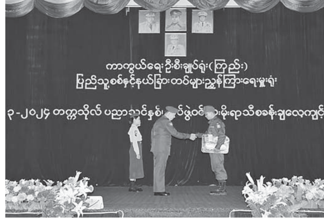
တောင်ပိုင်းတိုင်း စစ်ဌာနချုပ်တိုင်းမှူး ဗိုလ်ချုပ်ကြည်သိုက် တက္ကသိုလ်လေ့ကျင့် ရေးတပ်ဖွဲ့ဝင် သင်တန်းသား၊ သင်တန်းသူများ အတွက် အားကစား ပစ္စည်းများ ထောက်ပံ့ပေးအပ်စဉ်။

နေပြည်တော် အောက်တိုဘာ ၁ တက္ကသိုလ်များတွင် ပညာသင်ကြား လျက်ရှိသော ကျောင်းသား၊ ကျောင်းသူ များကို အခြေခံစစ်ပညာနှင့် တန်းမြင့် စစ်ပညာသင်တန်းများ သင်ကြားလေ့ကျင့် ပေးခြင်းဖြင့် နိုင်ငံတော်ကာကွယ်ရေးဆိုင်ရာ အသိအမြင်များရရှိ၍ အနာဂတ်နိုင်ငံတော် ၏ တာဝန်များထမ်းဆောင်သည့်အခါတွင် အထောက်အကူရရှိကာ နိုင်ငံချစ်စိတ်၊ မျိုးချစ်စိတ်များ ပိုမိုရင့်သန်လာစေရန်နှင့် ယုံကြည်ချက်၊ ခံယူချက်မြင့်မားပြီး အရည် အချင်းပြည့်ဝစေရန် ရည်ရွယ်ချက်ဖြင့် ကိုယ်တိုင် ဆန္ဒပြုသည့် တက္ကသိုလ် လေ့ကျင့်ရေး တပ်ဖွဲ့ဝင် ဆရာ၊ ဆရာမများ၊ ကျောင်းသား၊ ကျောင်းသူများကို ကာကွယ် ရေးဦးစီးချုပ်ရုံး(ကြည်း)၊ ပြည်သူ့စစ် နှင့် နယ်ခြားတပ်များ ညွှန်ကြားရေးမှူးရုံး ၏ တက္ကသိုလ်လေ့ကျင့်ရေးတပ်များမှ လေ့ကျင့်ရေးသင်တန်းများဖွင့်လှစ်သင်ကြား ပေးလျက်ရှိသည်။