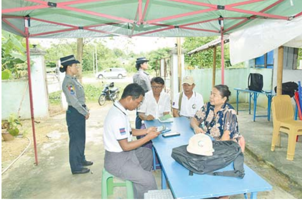
ပုဗ္ဗသီရိမြို့နယ်၌ ၂၀၂၄ ခုနှစ် လူဦးရေနှင့်အိမ်အကြောင်းအရာ သန်းခေါင်စာရင်းကောက်ယူစဉ်။