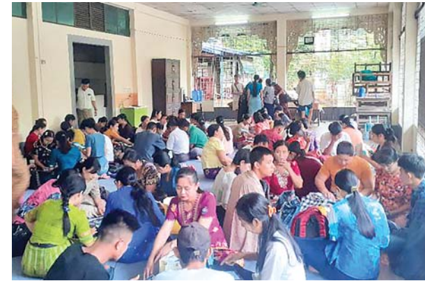
မရမ်းကုန်းမြို့နယ်၌ ၂၀၂၄ ခုနှစ် လူဦးရေနှင့်အိမ်အကြောင်းအရာ သန်းခေါင်စာရင်းကောက်ယူစဉ်။