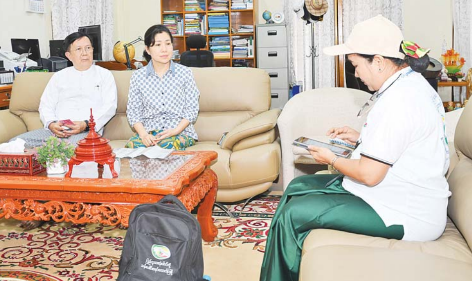
နိုင်ငံတော်စီမံအုပ်ချုပ်ရေးကောင်စီအတွင်းရေးမှူး ဗိုလ်ချုပ်ကြီးအောင်လင်းဒွေး၏မိသားစုက သန်းခေါင် စာရင်းကောက်ယူရေးအဖွဲ့၏ မေးခွန်းများကို ဖြေကြားစဉ်။

ကောင်စီဝင် ဗိုလ်ချုပ်ကြီးမောင်မောင်အေး ၏မိသားစု လူဦးရေနှင့်အိမ်အကြောင်း အရာသန်းခေါင်စာရင်းတို့ကိုလည်း ၎င်း တို့၏နေအိမ်နေရာများသို့ သွားရောက်၍ စာရင်းကောက်ယူခဲ့ကြသည်။ နိုင်ငံတစ်နိုင်ငံသည် သန်းခေါင်စာရင်း ကောက်ယူခြင်းမှရရှိသော လူဦးရေဆိုင်ရာ ကိန်းဂဏန်းအချက်အလက်များအပေါ် အခြေခံ၍ နိုင်ငံ၏လူမှုရေး၊ စီးပွားရေး၊ စီမံ ခန့်ခွဲရေးဆိုင်ရာကိစ္စရပ်များကို ကဏ္ဍ