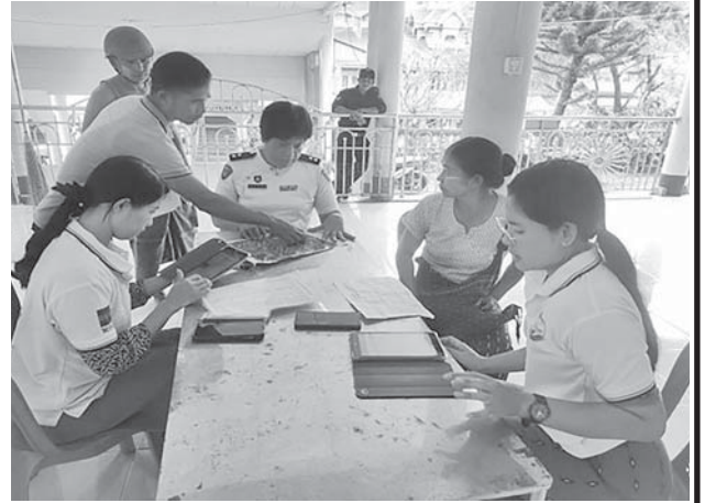
မြိတ်မြို့နယ်၌ ၂၀၂၄ ခုနှစ်လူဦးရေနှင့်အိမ်အကြောင်းအရာ သန်းခေါင် စာရင်းကောက်ယူစဉ်။