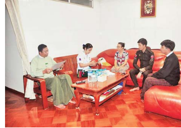
လမ်းမတော်မြို့နယ်၌ ၂၀၂၄ ခုနှစ် လူဦးရေနှင့်အိမ်အကြောင်းအရာ သန်းခေါင်စာရင်းကောက်ယူစဉ်။