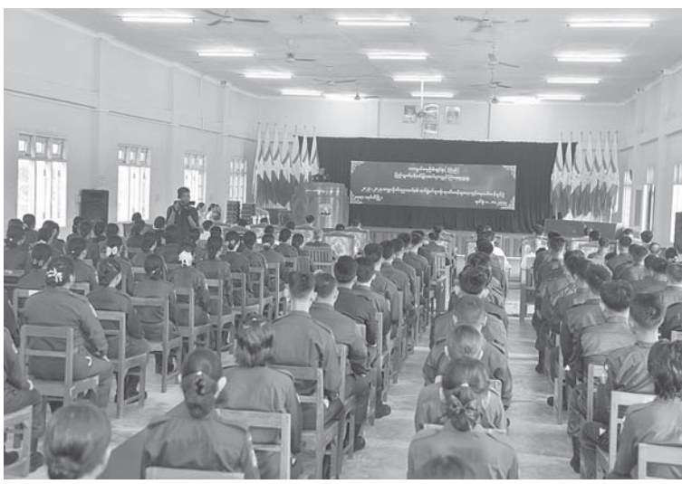
ရန်ကုန်တိုင်းဒေသကြီး၌ ၂၀၂၃-၂၀၂၄ ပညာသင်နှစ် တက္ကသိုလ်လေ့ကျင့်ရေး တပ်ဖွဲ့ဝင်များ မိုးရာသီစခန်းချလေ့ကျင့်ရေးသင်တန်းဖွင့်ပွဲကျင်းပစဉ်။