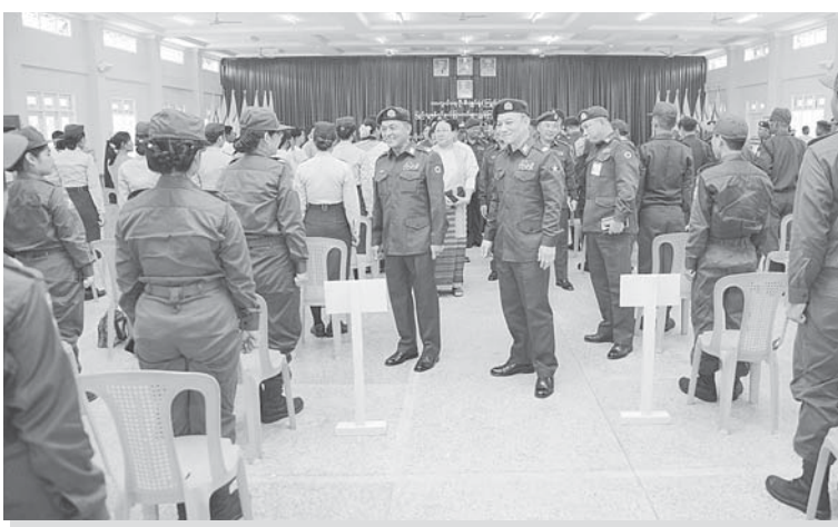
နေပြည်တော်တိုင်းစစ်ဌာနချုပ် တိုင်းမှူး ဗိုလ်ချုပ်စိုးမင်း တက္ကသိုလ်လေ့ကျင့်ရေး တပ်ဖွဲ့ဝင်သင်တန်းသား၊ သင်တန်းသူများအား ရင်းရင်းနှီးနှီးနှုတ်ဆက်စဉ်။

ထို့နောက် တက္ကသိုလ်လေ့ကျင့်ရေး တပ်ဖွဲ့ဝင်ဆရာ၊ ဆရာမများ၊ ကျောင်းသား၊ ကျောင်းသူများအတွက် သက်ဆိုင်ရာ တိုင်းဒေသကြီးဝန်ကြီးချုပ်များ၊ တိုင်းမှူး များနှင့် တာဝန်ရှိသူများက ဂုဏ်ပြုချီးမြှင့် ငွေများ၊ စားသောက်ဖွယ်ရာများနှင့် အားကစားပစ္စည်းများပေးအပ်ရာ တာဝန် ရှိသူများက အသီးသီးလက်ခံရယူသည်။ ယခုဖွင့်လှစ်သော သင်တန်းများအနေဖြင့် ပထမနှစ်အခြေခံစစ်ပညာသင်တန်း၊ ဒုတိယ နှစ်အခြေခံစစ်ပညာသင်တန်းနှင့် ပထမ နှစ်တန်းမြင့်စစ်ပညာသင်တန်းတို့ကို အသီးသီးဖွင့်လှစ်ခဲ့ပြီး သာမန်သင်တန်း ချိန်နှင့် စခန်းချလေ့ကျင့်ချိန်အလိုက် သင်ကြားပေးသွားမည်ဖြစ်ကြောင်း သတင်း ရရှိသည်။ (၁၀၀)