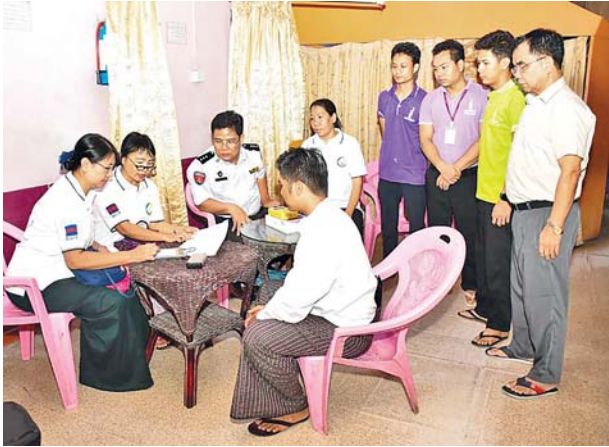
ဗဟန်းမြို့နယ်၌ ၂၀၂၄ ခုနှစ် လူဦးရေနှင့်အိမ်အကြောင်းအရာ သန်းခေါင်စာရင်းကောက်ယူစဉ်။