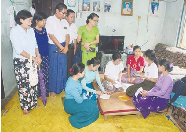
ရန်ကင်းမြို့နယ်၌ ၂၀၂၄ ခုနှစ် လူဦးရေနှင့်အိမ်အကြောင်းအရာ သန်းခေါင်စာရင်းကောက်ယူစဉ်။