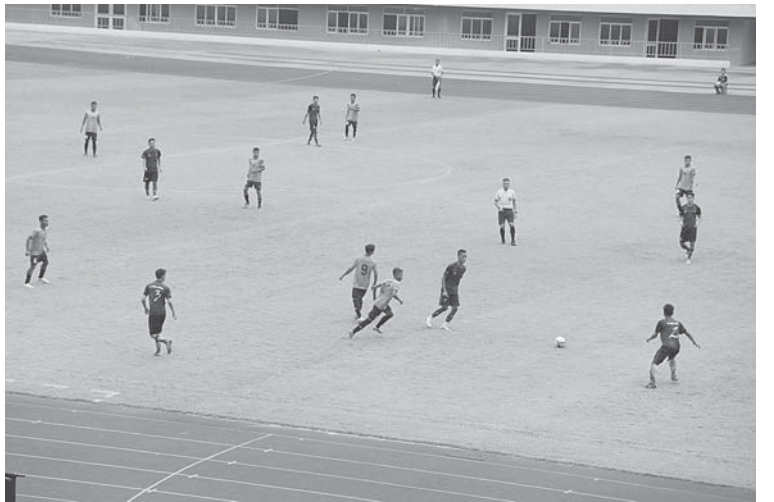
တပ်မတော်(ကြည်း၊ ရေ၊ လေ)အားကစားပြိုင်ပွဲတွင် တပ်မတော်ကာကွယ်ရေးဦးစီးချုပ်ဖလား ဘောလုံးပြိုင်ပွဲ ဒုတိယအဆင့်အုပ်စုပတ်လည်နေ့ကစားပွဲစဉ်အဖြစ် ရန်ကုန်တိုင်းစစ်ဌာနချုပ်ကိုယ်စားပြုအသင်းနှင့် အလယ်ပိုင်းတိုင်းစစ်ဌာနချုပ်ကိုယ်စားပြုအသင်းတို့ ယှဉ်ပြိုင်ကစားနေမှုကိုတွေ့ရစဉ်။

လက်ဝှေ့ကော်မတီမှ တာဝန်ရှိသူများက ဆုများအသီးသီးပေးအပ်ချီးမြှင့်ကြသည်။ တပ်မတော် ကာကွယ်ရေးဦးစီးချုပ်ဖလားဘောလုံးပြိုင်ပွဲအဖြစ် ညနေပိုင်းတွင် လေ့ကျင့်ရေးကွင်း(၁)၌ ဒုတိယအဆင့်အုပ်စုပတ်လည်နေ့ကစားပွဲစဉ်အဖြစ် အနောက်တောင်တိုင်းစစ်ဌာနချုပ်ကိုယ်စားပြုအသင်းနှင့် ကာကွယ်ရေးဦးစီးချုပ်(ရေ)ကိုယ်စားပြုအသင်းတို့ ယှဉ်ပြိုင်ကစားခဲ့ရာ ၂ ဂိုးစီသာရရှိခဲ့ပြီးလည်းကောင်း၊ ဧည့်သည်တော်အားကစားကွင်း၌ ဒုတိယအဆင့်အုပ်စုပတ်လည် နောက်ဆုံးပွဲစဉ်