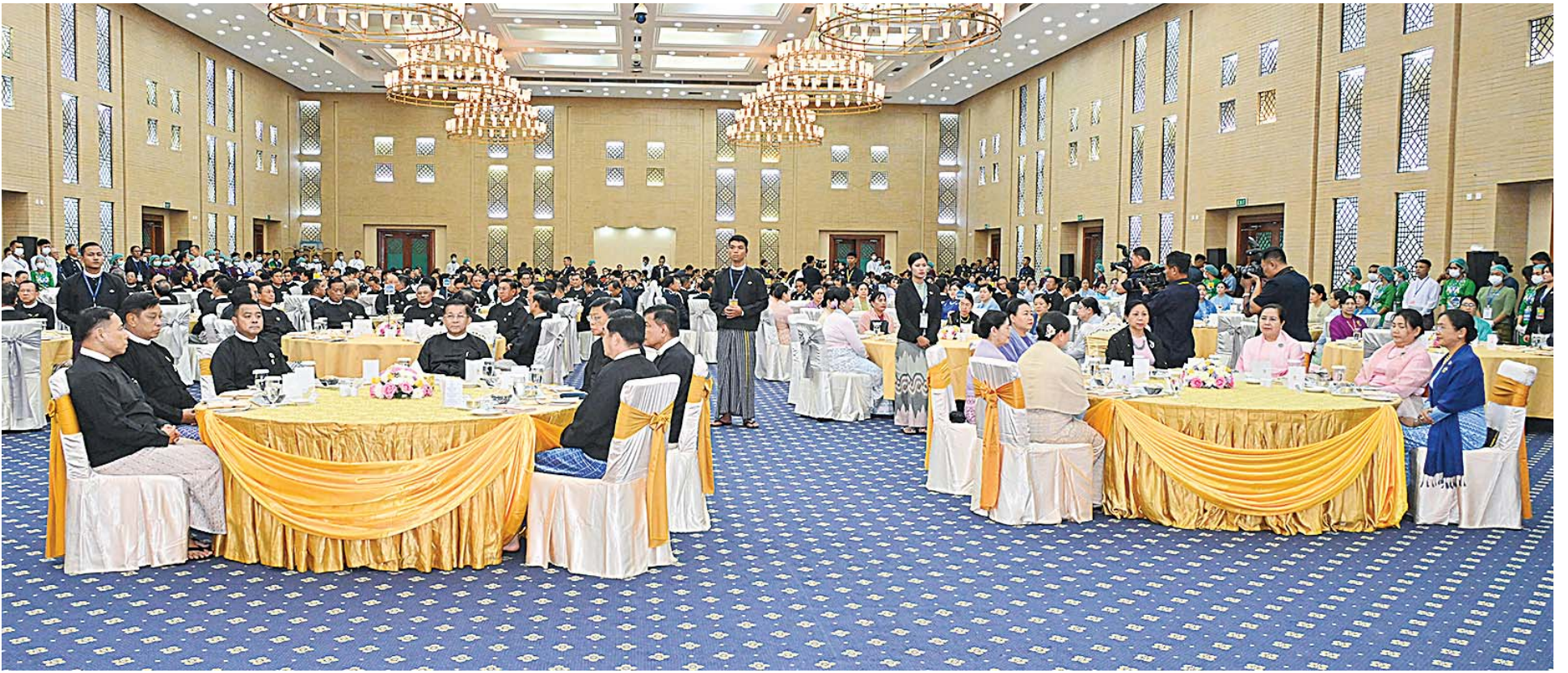
နိုင်ငံတော်စီမံအုပ်ချုပ်ရေးကောင်စီဥက္ကဋ္ဌ နိုင်ငံတော်ဝန်ကြီးချုပ် ဗိုလ်ချုပ်မှူးကြီးမင်းအောင်လှိုင်နှင့်ဇနီး ဒေါ်ကြူကြူလှ၊ အခမ်းအနားသို့တက်ရောက်လာကြသူများက နှစ်(၆၀)ပြည့် မြန်မာနိုင်ငံရဲတပ်ဖွဲ့နေ့အထိမ်းအမှတ် ဂုဏ်ပြုညစာစားပွဲအခမ်းအနားတွင် အနုပညာရှင်များ၏ သီဆိုကပြပျော်ဖြေနေမှုကိုကြည့်ရှုအားပေးစဉ်။