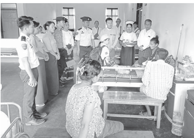
မော်ဘီမြို့နယ်၌ ၂၀၂၄ ခုနှစ် လူဦးရေနှင့်အိမ်အကြောင်းအရာ သန်းခေါင်စာရင်းကောက်ယူစဉ်။