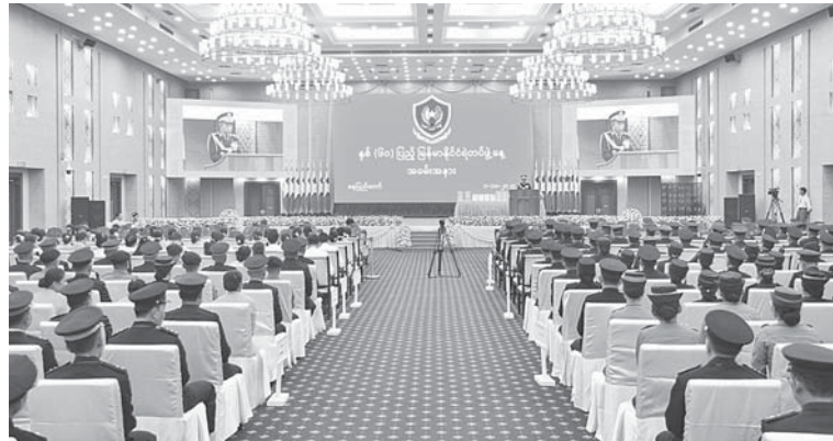
နှစ်(၆၀)ပြည့် မြန်မာနိုင်ငံရဲတပ်ဖွဲ့နေ့အခမ်းအနားတွင် ပြည်ထဲရေးဝန်ကြီးဌာန၊ မြန်မာနိုင်ငံရဲတပ်ဖွဲ့ရဲချုပ် ဒုတိယရဲဗိုလ်ချုပ်ကြီးဝင်းဇော်မိုး မိန့်ခွန်းပြောကြားစဉ်။

နေပြည်တော် အောက်တိုဘာ ၁ နှစ်(၆၀)ပြည့် မြန်မာနိုင်ငံရဲတပ်ဖွဲ့နေ့ အခမ်းအနားကို ယနေ့နံနက်ပိုင်းတွင် နေပြည်တော်ရှိ မြန်မာအပြည်ပြည်ဆိုင်ရာ ကွန်ဗင်းရှင်းဗဟိုဌာန-၂ (MICC-2) ၌ ကျင်းပ ခဲ့ရာ ပြည်ထဲရေးဝန်ကြီးဌာန၊ မြန်မာနိုင်ငံ ရဲတပ်ဖွဲ့ရဲချုပ်ဒုတိယရဲဗိုလ်ချုပ်ကြီးဝင်းဇော်မိုး တက်ရောက်မိန့်ခွန်းပြောကြားခဲ့သည်။ အခမ်းအနားသို့ မြန်မာနိုင်ငံရဲတပ်ဖွဲ့ ဒုတိယရဲချုပ်များ၊ ရဲအရာရှိကြီးများ၊ အနုပညာရှင်များ၊ ဆရာရှိသူများနှင့် ဖိတ်ကြား ထားသောဧည့်သည်တော်များ တက်ရောက် ခဲ့ကြသည်။ အခမ်းအနားတွင် မြန်မာနိုင်ငံရဲတပ်ဖွဲ့ရဲချုပ် ဒုတိယရဲဗိုလ်ချုပ်ကြီးဝင်းဇော်မိုးက မိန့်ခွန်း ပြောကြားပြီး စံပြုရဲအဆင့်တိုးဆုရရှိသူ အရာရှိ(၂)ဦး၊ အခြားအဆင့်(၃)ဦးနှင့် စွမ်းရည် သတ္တိအတွက် ရာထူးအဆင့်တိုးဆုရရှိသူ အရာရှိ(၃)ဦး၊ စွမ်းဆောင်မှုအတွက် ရာထူး အဆင့်တိုးဆုရရှိသူ အရာရှိ (၂)ဦးတို့အား ဂုဏ်ပြုဆုတံဆိပ်များပေးအပ်ချီးမြှင့်ခဲ့ပြီး အနုပညာရှင်ကိုယ်စားလှယ်တစ်ဦးအား