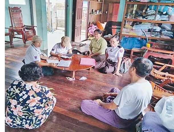
မော်လမြိုင်မြို့နယ်၌ ၂၀၂၄ ခုနှစ် လူဦးရေနှင့်အိမ်အကြောင်းအရာ သန်းခေါင်စာရင်းကောက်ယူစဉ်။