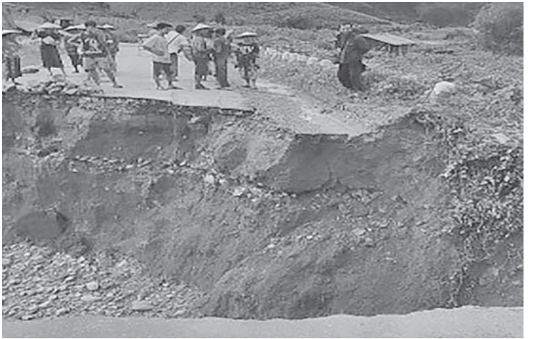
မိုင်းကိုင်-နမ့်လန်သွားလမ်းပေါ်ရှိ တံတားအမှတ်(၃/၉၁)သံကူကွန်ကရစ်တံတားရေတိုက်စားမှုကြောင့် ပြိုကျပျက်စီးမှုကိုတွေ့ရစဉ်။

လမ်းပျက်စီးခဲ့သည့် သံကူကွန်ကရစ် တံတားဦးစီးဌာနမှ ဝန်ထမ်းများနှင့် တာဝန် သွားလာနိုင်ရေးအတွက် အမြန်ဆုံးပြုပြင် ရရှိသည်။ အဆိုပါ ရေတိုက်စားမှုကြောင့် ချဉ်းကပ် တံတားအား မိုင်းကိုင်မြို့နယ်၊ လမ်း/ ရှိသူများက အများပြည်သူများ ဖြတ်သန်း ဆောင်ရွက်လျက်ရှိကြောင်း သတင်း (၁၀၀)