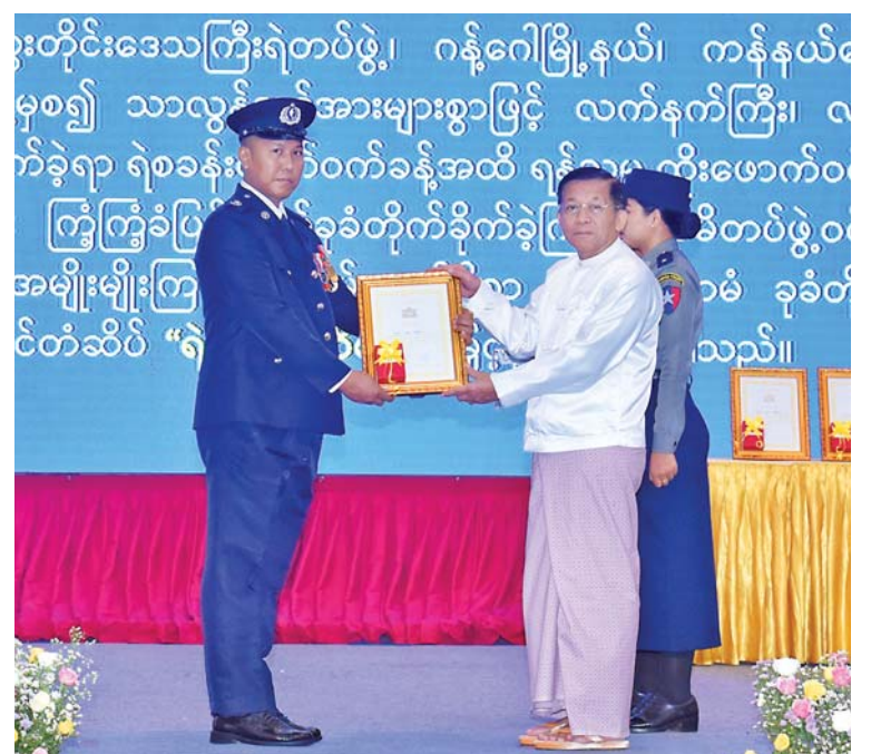
Senior General Min Aung Hlaing presents medal of excellent performance and courage to police major Nyein Chan.

First, the Senior General and attendees saluted the flag of the national flag of the Republic of the Union of Myanmar