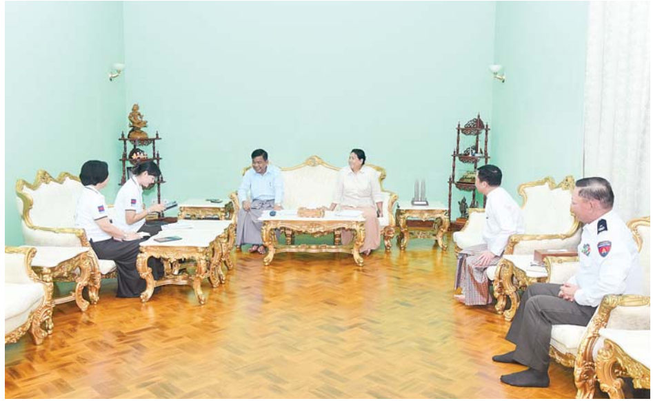
နိုင်ငံတော်စီမံအုပ်ချုပ်ရေးကောင်စီဝင် ဗိုလ်ချုပ်ကြီးမောင်မောင်အေး၏မိသားစုက သန်းခေါင်စာရင်းကောက်ယူရေးအဖွဲ့၏ မေးခွန်းများကို ဖြေကြားစဉ်။