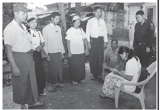
ဒလမြို့နယ်၌ ၂၀၂၄ ခုနှစ် လူဦးရေနှင့် အိမ်အကြောင်းအရာ သန်းခေါင် စာရင်းကောက်ယူစဉ်။