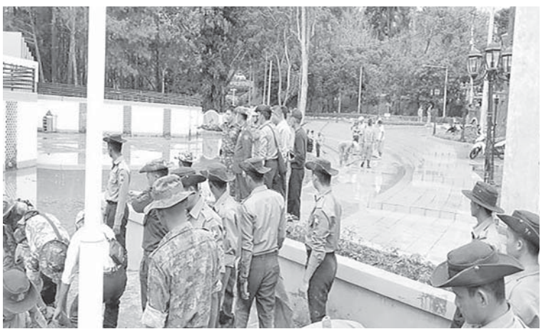
တပ်မတော်သားများ၊ မြန်မာနိုင်ငံရဲတပ်ဖွဲ့ဝင်များ၊ မီးသတ်တပ်ဖွဲ့ဝင်များ၊ ကြက်ခြေနီတပ်ဖွဲ့ဝင်များ၊ လူမှုဝန်ထမ်းကယ်ဆယ်ရေးအဖွဲ့များက ကလေးမြို့ မောမြေဦးပန်းခြံ၌ ရေကျဆင်းသွားသဖြင့် တင်ကျန်ခဲ့သော နန်းမြေများ၊ အမှိုက်သရိုက်များအား ဖယ်ရှားရှင်းလင်းပေးစဉ်။

များနှင့်ပူးပေါင်း၍ တက်ကြွစွာဆောင်ရွက်ပေးလျက်ရှိသည်။ ထို့ပြင် ယာယီရေဘေးရှောင်စခန်းများတွင် ရေဘေးသင့်ပြည်သူများအား ကျန်းမာရေးအဖွဲ့များက လိုအပ်သည့်ကျန်းမာရေးစောင့်ရှောက်မှုလုပ်ငန်းများနှင့် ကျန်းမာရေးအသိပညာပေး ဟောပြောဆွေးနွေးခြင်းများ ဆောင်ရွက်ပေးပြီး ထောက်ပံ့ပစ္စည်းများ၊ အဝတ်အထည်များ၊ အသုံးအဆောင်ပစ္စည်းများ၊ စားသောက်ဖွယ်ရာများနှင့် အလှူငွေများကို အားတက်သရောပေးအပ်လှူဒါန်းလျက်ရှိသည်။ ထိုသို့ဆောင်ရွက်နေမှုများကို နေပြည်တော်ကောင်စီဥက္ကဋ္ဌ၊ သက်ဆိုင်ရာတိုင်းဒေသကြီးနှင့် ပြည်နယ်ဝန်ကြီးချုပ်များနှင့်တာဝန်ရှိသူများက သွားရောက်ကြည့်ရှုအားပေးပြီး လိုအပ်သည်များ ပေါင်းစပ်ညှိနှိုင်းဆောင်ရွက်ပေးကာ စားသောက်ဖွယ်ရာများ၊ ထောက်ပံ့ရေးပစ္စည်းများ ပေးအပ်သည်။ ၎င်းအပြင် ရေကြီးမှုကြောင့် ပျက်စီးမှုများဖြစ်ပေါ်ခဲ့သည့် လမ်း/တံတားများကိုလည်း လမ်းပန်းဆက်သွယ်ရေးအမြန်ပြန်လည်ကောင်းမွန်စေရန်အတွက်ကြိုးပမ်းဆောင်ရွက်လျက်ရှိရာ ပျက်စီးခဲ့သည့် လမ်း/တံတားများကိုလည်း ယာယီသံပေါင်ဘောလီတံတားများအစားထိုး၍ အမြန်ဆုံးပြန်လည်ပြင်ဆင် ဆောင်ရွက်ပေးလျက်ရှိ