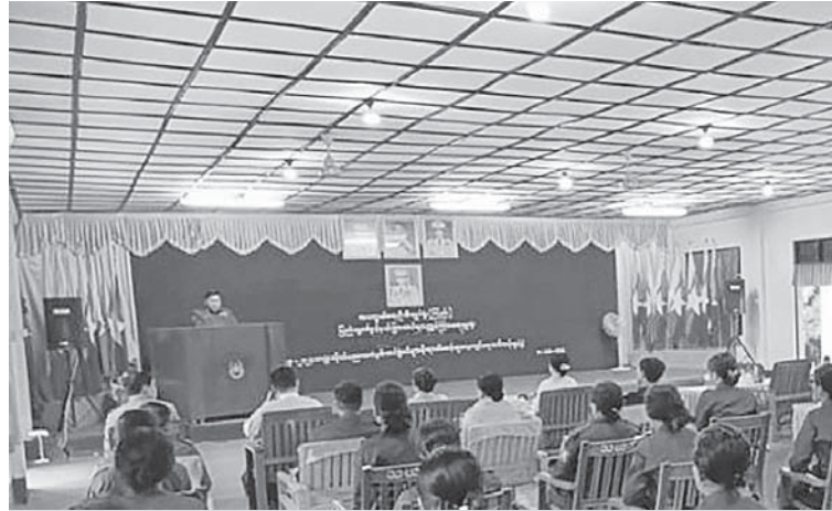
မန္တလေးတိုင်းဒေသကြီး၌ ၂၀၂၃-၂၀၂၄ ပညာသင်နှစ် တက္ကသိုလ်လေ့ကျင့်ရေး တပ်ဖွဲ့ဝင်များ မိုးရာသီစခန်းချလေ့ကျင့်ရေးသင်တန်းဖွင့်ပွဲကျင်းပစဉ်။