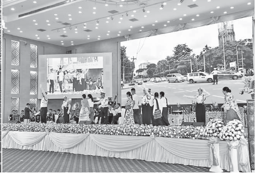
Senior General Min Aung Hlaing watches performances at the 60 th anniversary of Myanmar Police Force Day.