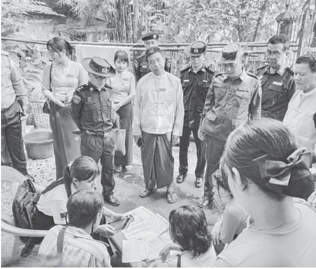
တွံတေးမြို့နယ်၌ ၂၀၂၄ ခုနှစ် လူဦးရေနှင့်အိမ်အကြောင်းအရာ သန်းခေါင်စာရင်းကောက်ယူစဉ်။