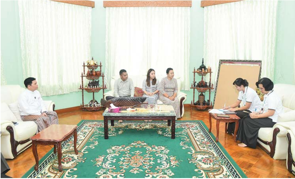
နိုင်ငံတော်စီမံအုပ်ချုပ်ရေးကောင်စီတွဲဖက်အတွင်းရေးမှူး ဗိုလ်ချုပ်ကြီးရဲဝင်းဦး၏မိသားစုက သန်းခေါင်စာရင်းကောက်ယူရေးအဖွဲ့၏ မေးခွန်းများကို ဖြေကြားစဉ်။