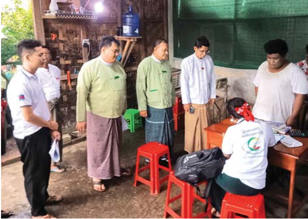
ချောင်းဆုံမြို့နယ်၌ ၂၀၂၄ ခုနှစ် လူဦးရေနှင့်အိမ်အကြောင်းအရာ သန်းခေါင်စာရင်းကောက်ယူစဉ်။