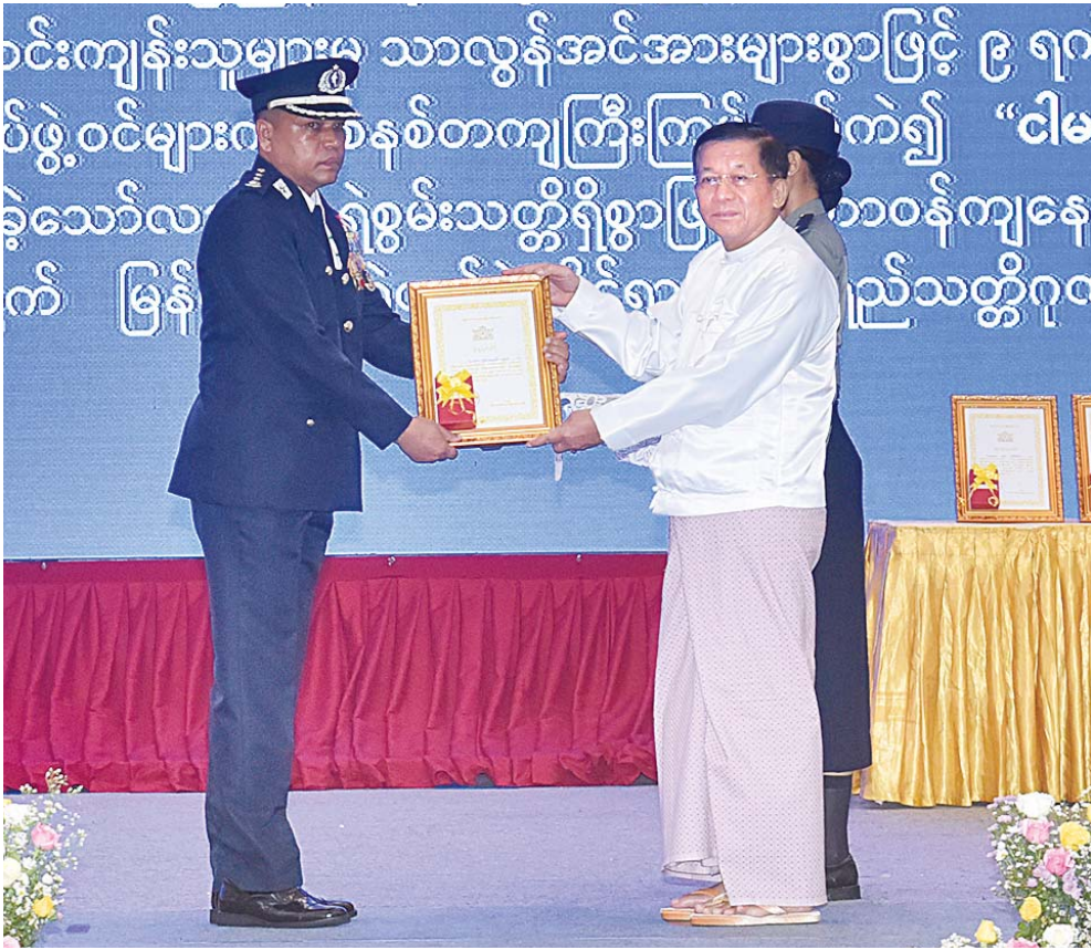
နိုင်ငံတော်စီမံအုပ်ချုပ်ရေးကောင်စီဥက္ကဋ္ဌ နိုင်ငံတော်ဝန်ကြီးချုပ် ဗိုလ်ချုပ်မှူးကြီးမင်းအောင်လှိုင်က စွမ်းရည် သတ္တိဂုဏ်ထူးဆောင်တံဆိပ်ရရှိသူတစ်ဦးအား ဆုပေးအပ်ချီးမြှင့်စဉ်။