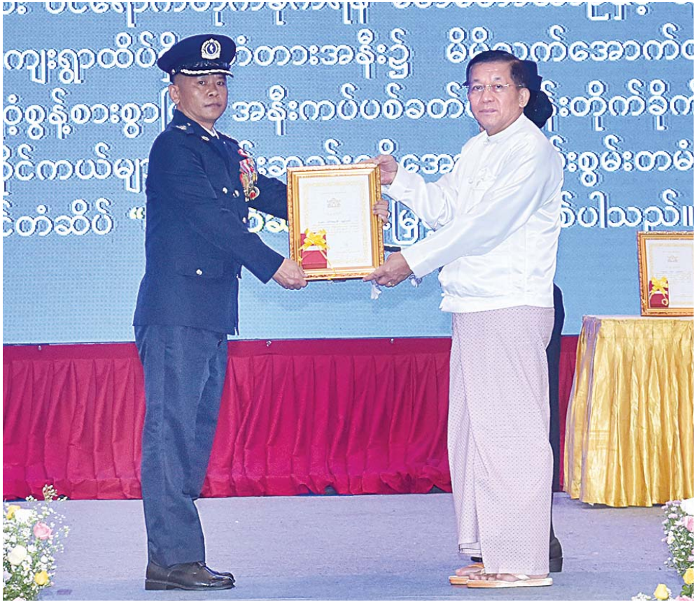
နိုင်ငံတော်စီမံအုပ်ချုပ်ရေးကောင်စီဥက္ကဋ္ဌ နိုင်ငံတော်ဝန်ကြီးချုပ် ဗိုလ်ချုပ်မှူးကြီးမင်းအောင်လှိုင်က စွမ်းရည် သတ္တိဂုဏ်ထူးဆောင်တံဆိပ်ရရှိသူတစ်ဦးအား ဆုပေးအပ်ချီးမြှင့်စဉ်။