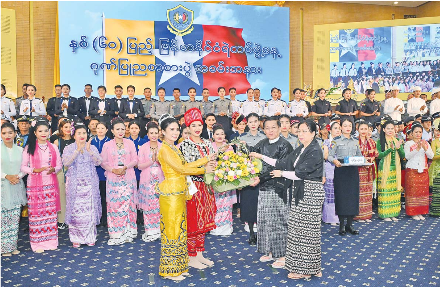
နိုင်ငံတော်စီမံအုပ်ချုပ်ရေးကောင်စီဥက္ကဋ္ဌ နိုင်ငံတော်ဝန်ကြီးချုပ် ဗိုလ်ချုပ်မှူးကြီးမင်းအောင်လှိုင်နှင့်ဇနီး ဒေါ်ကြူကြူလှတို့က သီဆိုတီးမှုတ်ဖျော်ဖြေခဲ့ကြသည့် မြန်မာနိုင်ငံရဲတပ်ဖွဲ့၊ ရဲတီးဝိုင်းနှင့်ဖျော်ဖြေရေးဌာနခွဲအား ဂုဏ်ပြုပန်းခြင်းနှင့်ဂုဏ်ပြုဆုများပေးအပ်စဉ်။

ဇနီးနှင့်အခမ်းအနားတက်ရောက်လာကြသူများသည် ဂုဏ်ပြုညစာကို အတူတကွ သုံးဆောင်ကြသည်။