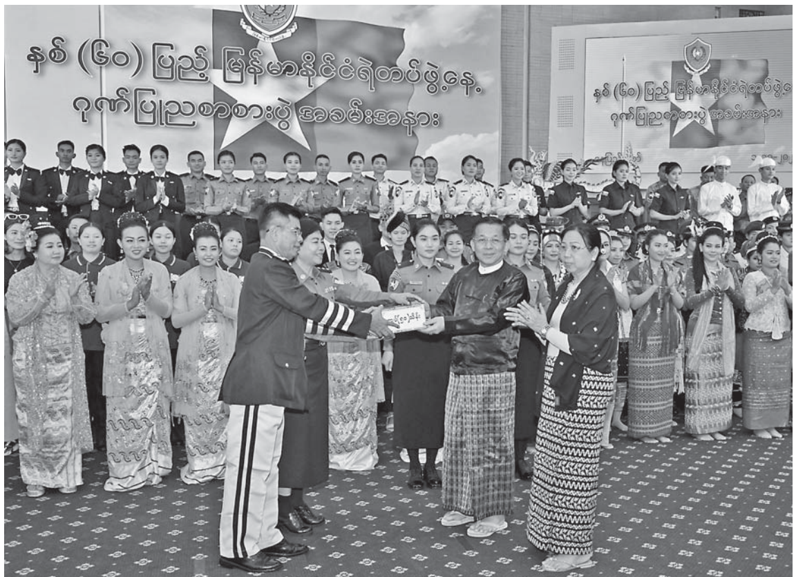
Senior General Min Aung Hlaing presents cash reward to the performers of Myanmar Police Force band.

After the dinner, Senior General Min Aung Hlaing and his