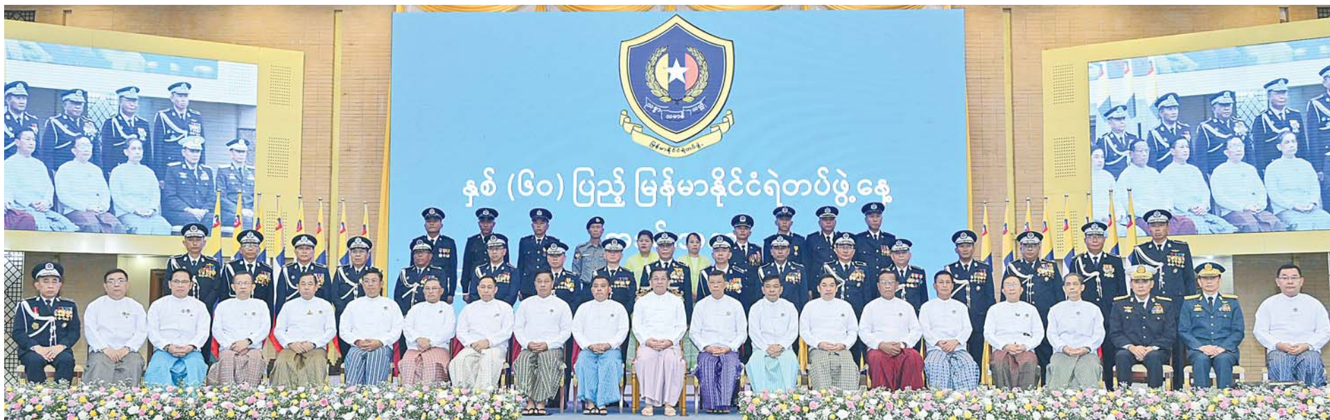
နိုင်ငံတော်စီမံအုပ်ချုပ်ရေးကောင်စီဥက္ကဋ္ဌ နိုင်ငံတော်ဝန်ကြီးချုပ် ဗိုလ်ချုပ်မှူးကြီးမင်းအောင်လှိုင် အခမ်းအနားတက်ရောက်လာကြသူများနှင့်အတူ စုပေါင်းမှတ်တမ်းတင်ဓာတ်ပုံရိုက်စဉ်။