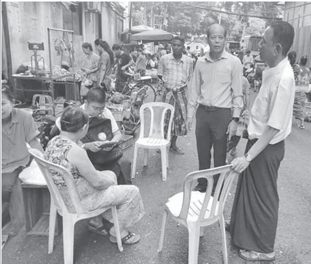
လသာမြို့နယ်၌ ၂၀၂၄ ခုနှစ် လူဦးရေနှင့်အိမ်အကြောင်းအရာ သန်းခေါင်စာရင်းကောက်ယူစဉ်။