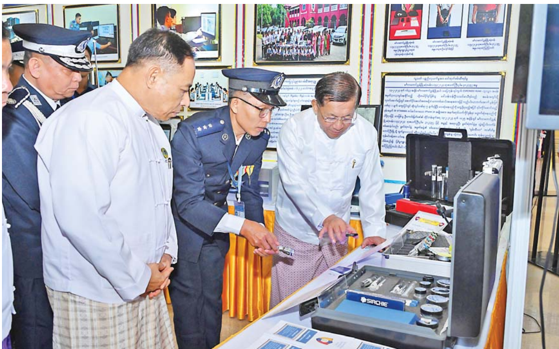
Senior General Min Aung Hlaing checks equipment at a commemorative booth.

Min Aung Hlaing delivered an address at the ceremony.