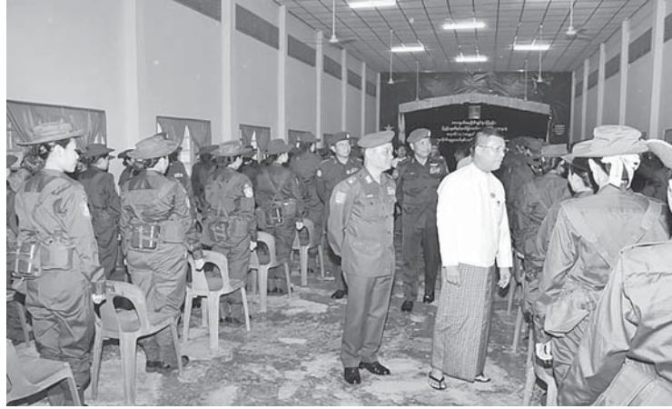
ဧရာဝတီတိုင်း ဒေသကြီးဝန်ကြီးချုပ် ဦးတင်မောင်ဝင်းနှင့် အနောက်တောင်တိုင်း စစ်ဌာနချုပ်တိုင်းမှူး ဗိုလ်ချုပ်ဝေလင်းတို့က တက္ကသိုလ်လေ့ကျင့်ရေး တပ်ဖွဲ့ဝင် သင်တန်းသား၊ သင်တန်းသူများအား ရင်းရင်းနှီးနှီးနှုတ်ဆက်စဉ်။