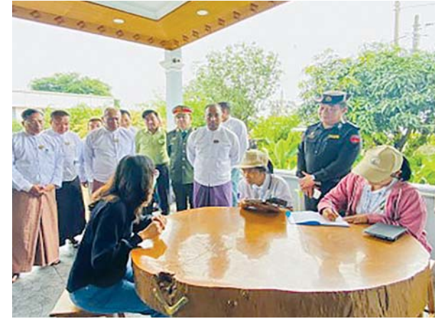
တောင်ကြီးမြို့နယ်၌ ၂၀၂၄ ခုနှစ် လူဦးရေနှင့်အိမ်အကြောင်းအရာ သန်းခေါင်စာရင်းကောက်ယူစဉ်။