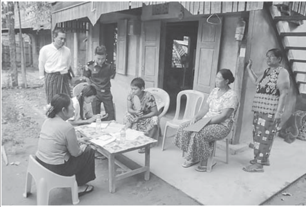
မြစ်ကြီးနားမြို့နယ်၌ ၂၀၂၄ ခုနှစ် လူဦးရေနှင့် အိမ်အကြောင်းအရာ သန်းခေါင်စာရင်းကောက်ယူစဉ်။