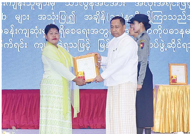
နိုင်ငံတော်စီမံအုပ်ချုပ်ရေးကောင်စီဝင် ပြည်ထဲရေးဝန်ကြီးဌာန ပြည်ထောင်စုဝန်ကြီး ဒုတိယဗိုလ်ချုပ်ကြီးရာပြည့်က စွမ်းရည်သတ္တိဂုဏ်ထူးဆောင်တံဆိပ်ရရှိသူတစ်ဦး၏ မိသားစုဝင်အား ဂုဏ်ထူးဆောင်ဆုပေးအပ်ချီးမြှင့်စဉ်။

ကျောပုံးမှအဆက် သံတမန်များ၊ အပြည်ပြည်ဆိုင်ရာ အဖွဲ့အစည်း များမှ ဖိတ်ကြားထားသော ဧည့်သည်တော် များ၊ ဌာနဆိုင်ရာအကြီးအကဲများ၊ အမျိုးသမီး ရေးရာနှင့်ဆက်စပ်အဖွဲ့အစည်းများ၊ မြန်မာ နိုင်ငံရဲတပ်ဖွဲ့ရဲချုပ်နှင့် ရဲတပ်ဖွဲ့ဝင်များ၊ အငြိမ်းစားရဲအရာရှိကြီးများနှင့် တာဝန်ရှိ သူများ တက်ရောက်ကြသည်။ ဦးစွာ နိုင်ငံတော်စီမံအုပ်ချုပ်ရေးကောင်စီ