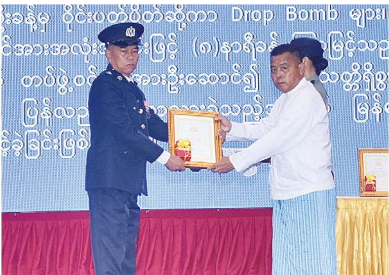
နိုင်ငံတော်စီမံအုပ်ချုပ်ရေးကောင်စီတွဲဖက်အတွင်းရေးမှူး ဗိုလ်ချုပ်ကြီးရဲဝင်းဦးက စွမ်းရည်သတ္တိဂုဏ်ထူးဆောင်တံဆိပ်ရရှိသူတစ်ဦးအား ဂုဏ်ထူးဆောင်ဆုပေးအပ် ချီးမြှင့်စဉ်။

စီးပွားဘဝလုံခြုံရေးအတွက် ပြည်ထောင်စု တစ်ဝန်းလုံး တည်ငြိမ်အေးချမ်းရေးနှင့် တရားဥပဒေစိုးမိုးရေး အပြည့်အဝရရှိစေရေး တို့ကို အလေးထားဆက်လက် ဆောင်ရွက် သွားကြရမည်ဖြစ်ကြောင်း၊ မြန်မာနိုင်ငံ ရဲတပ်ဖွဲ့သည် တပ်မတော်နှင့်အတူ အကြမ်း ဖက်မှုချေမှုန်းရေးကိုလည်း ပြည်သူနှင့်အတူ လက်တွဲပြီး ဆောင်ရွက်ရန်အလေးထား မှာကြားလိုကြောင်း။ ထို့ပြင် ပြည်တွင်းလုံခြုံရေးနှင့် ရပ်ရွာ အေးချမ်းသာယာရေး၊ တရားဥပဒေစိုးမိုးရေး၊ မူးယစ်ဆေးဝါးအန္တရာယ် ကာကွယ်တားဆီး ရေးနှင့် ပြည်သူ့အကျိုးပြုလုပ်ငန်းဆောင် ရွက်ရေးဆိုသည့် မြန်မာနိုင်ငံရဲတပ်ဖွဲ့၏ ရည်မှန်းချက်တာဝန်(၄)ရပ်နှင့် ပြစ်မှုများ မဖြစ်ပွားအောင် ကြိုတင်ကာကွယ်ရေး၊ ဖြစ်ပွားပြီးပြစ်မှုများ စုံစမ်းဖော်ထုတ် တရား စွဲတင်ရေး၊ နိုင်ငံတော်အတွင်း စည်းကမ်း သေဝပ်တည်ငြိမ်ရေး၊ ပြည်သူ့လူထုလိုခြံရေး၊ မူးယစ်ဆေးဝါးနဲ့ စိတ်ကိုပြောင်းလဲစေတတ် သော ဆေးဝါးများအန္တရာယ်ကို တားဆီး နှိမ်နင်းရေး၊ ပြည်သူ့အကျိုးပြုလုပ်ငန်းများ ဆောင်ရွက်ရေးဆိုသည့် လုပ်ငန်းတာဝန် (၆)ရပ်ကိုလည်း အောင်မြင်အောင် အကောင် အထည်ဖော် ဆောင်ရွက်သွားရမည်ဖြစ် ကြောင်း။