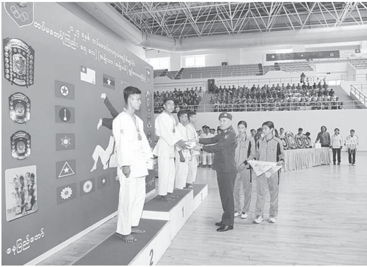
တပ်မတော်ကာကွယ်ရေးဦးစီးချုပ်ခိုင်း၊ တပ်မတော်(ကြည်း၊ ရေ၊ လေ)ဂျူဒိုပြိုင်ပွဲတွင် တာဝန်ရှိသူတစ်ဦးက ဆုရရှိသူအား ဆုပေးအပ်ချီးမြှင့်စဉ်။

အလားတူ တပ်မတော်(ကြည်း၊ ရေ၊ လေ)အမျိုးသား/အမျိုးသမီးဘော်လီဘော