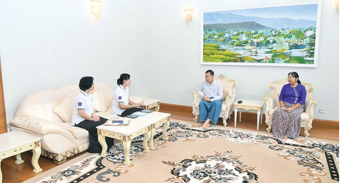
နိုင်ငံတော်စီမံအုပ်ချုပ်ရေးကောင်စီဒုတိယဥက္ကဋ္ဌ ဒုတိယဝန်ကြီးချုပ် ဒုတိယဗိုလ်ချုပ်မှူးကြီးစိုးဝင်း၏မိသားစုက သန်းခေါင်စာရင်း ကောက်ယူရေးအဖွဲ့၏ မေးခွန်းများကို ဖြေကြားစဉ်။

အလိုက် အချိုးညီညီဖွံ့ဖြိုးတိုးတက်စေရန် မူဝါဒများချမှတ်ခြင်း၊ စီမံကိန်းများရေးဆွဲ ဆောင်ရွက်ခြင်း စသည့်လုပ်ငန်းများကို အကောင်အထည်ဖော်ဆောင်ရွက်ရခြင်း ဖြစ်သဖြင့် လူဦးရေသန်းခေါင်စာရင်း ကောက်ယူခြင်းလုပ်ငန်းကို နိုင်ငံအလိုက် ၁၀ နှစ်လျှင် တစ်ကြိမ်ဆောင်ရွက်လျက်ရှိ သည်။ သန်းခေါင်စာရင်းမှရရှိသော အချက် အလက်များသည် နိုင်ငံတော်အစိုးရအပါ အဝင်ဝန်ကြီးဌာနများနှင့်သာသက်ဆိုင်ခြင်း မဟုတ်ဘဲ နိုင်ငံအတွင်းရှိပြည်သူ့အားလုံး နှင့်သက်ဆိုင်ပြီး လူတစ်ဦးချင်းစီမှ အဖွဲ့ အစည်းအလိုက် တစ်နိုင်လုံးအတိုင်း အတာဖြင့် နိုင်ငံရေး၊ စီးပွားရေး၊ လူမှုရေး၊ ကာကွယ်ရေးနှင့် ပြည်သူ့ရေးရာစီမံခန့်ခွဲ ရေးကိစ္စရပ်များ၏ ဘက်စုံ ကဏ္ဍစုံအတွက် မဖြစ်မနေအခြေခံအသုံးပြုရသည့် အချက်