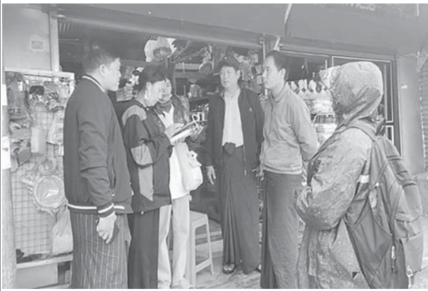
အနောက်မြောက်တိုင်းစစ်ဌာနချုပ်နယ်မြေအတွင်းရှိ မြို့နယ်များ၌ ၂၀၂၄ ခုနှစ် လူဦးရေနှင့် အိမ်အကြောင်းအရာသန်းခေါင်စာရင်း ကောက်ယူစဉ်။